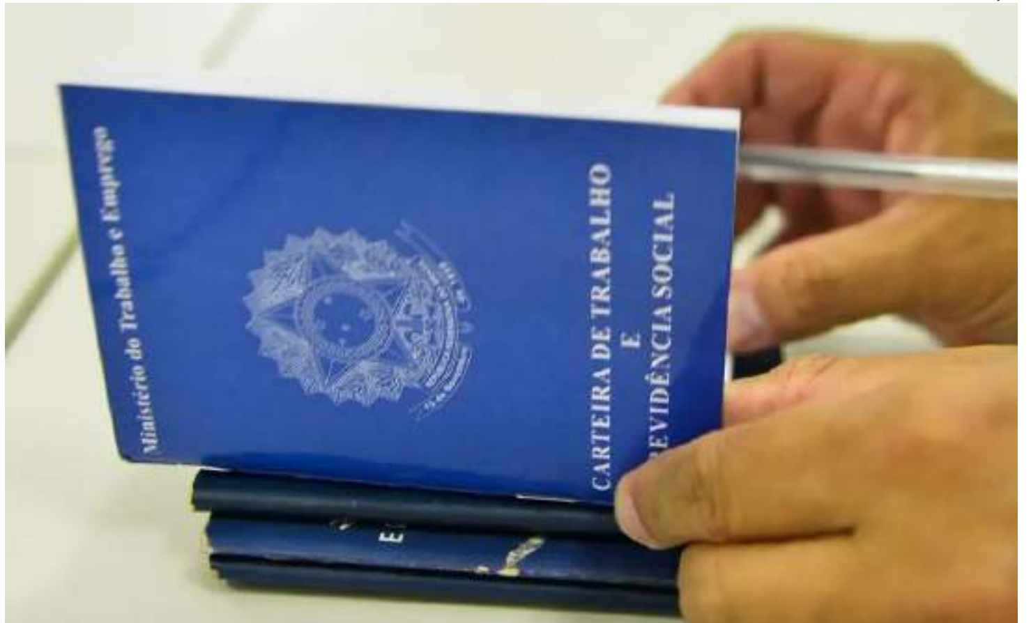
Número atingiu 37,995 milhões no trimestre encerrado em fevereiro

Como a população ocupada cresceu 2,2% na comparação anual, a taxa de informalidade de fevereiro deste ano também é inferior à registrada em fevereiro do ano passado (38,9%), mesmo que tenha tido um número absoluto de trabalhadores informais su-