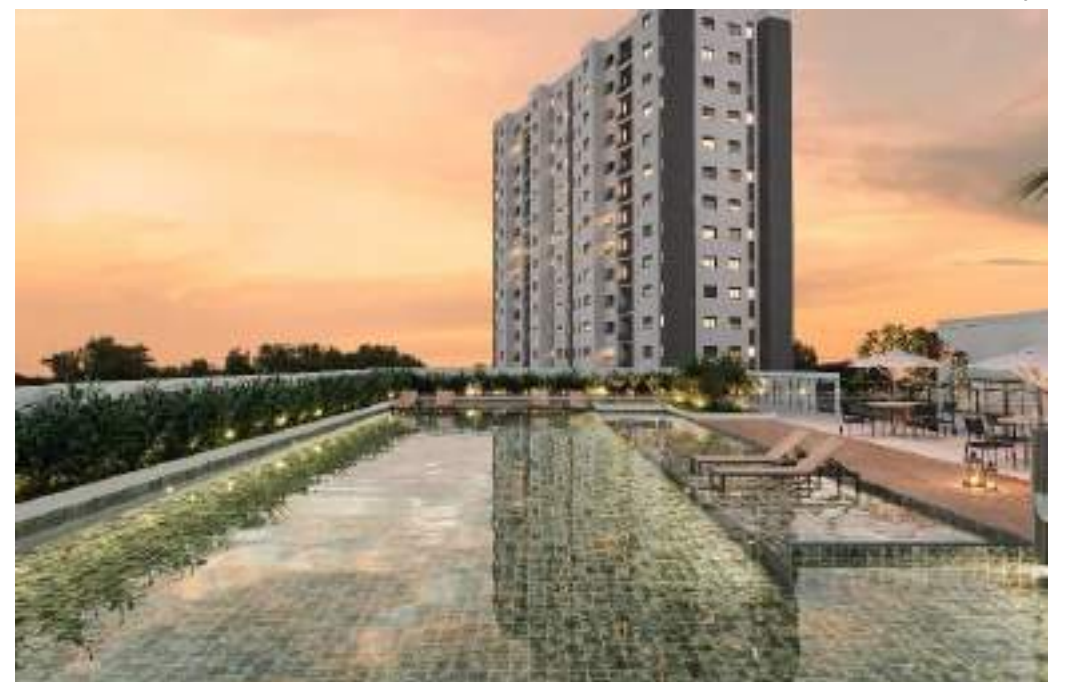
Mercado imobiliário de médio e alto padrão apresenta crescimento

"Os clientes que assinarem contrato de compra de uma unidade Sensia participante da ação nas próximas semanas receberão desconto equivalente a 50% do valor dado como sinal. Esse desconto é limitado à quantia de R$ 30 mil reais. Ou seja, se um