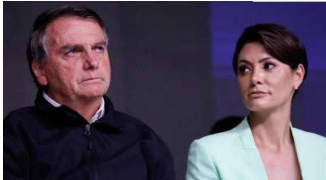
Michelle vem a Manaus junto com o ex-presidente Jair Bolsonaro