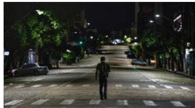
Aumenta a proporção de pessoas que dizem se sentir 'muito inseguras'