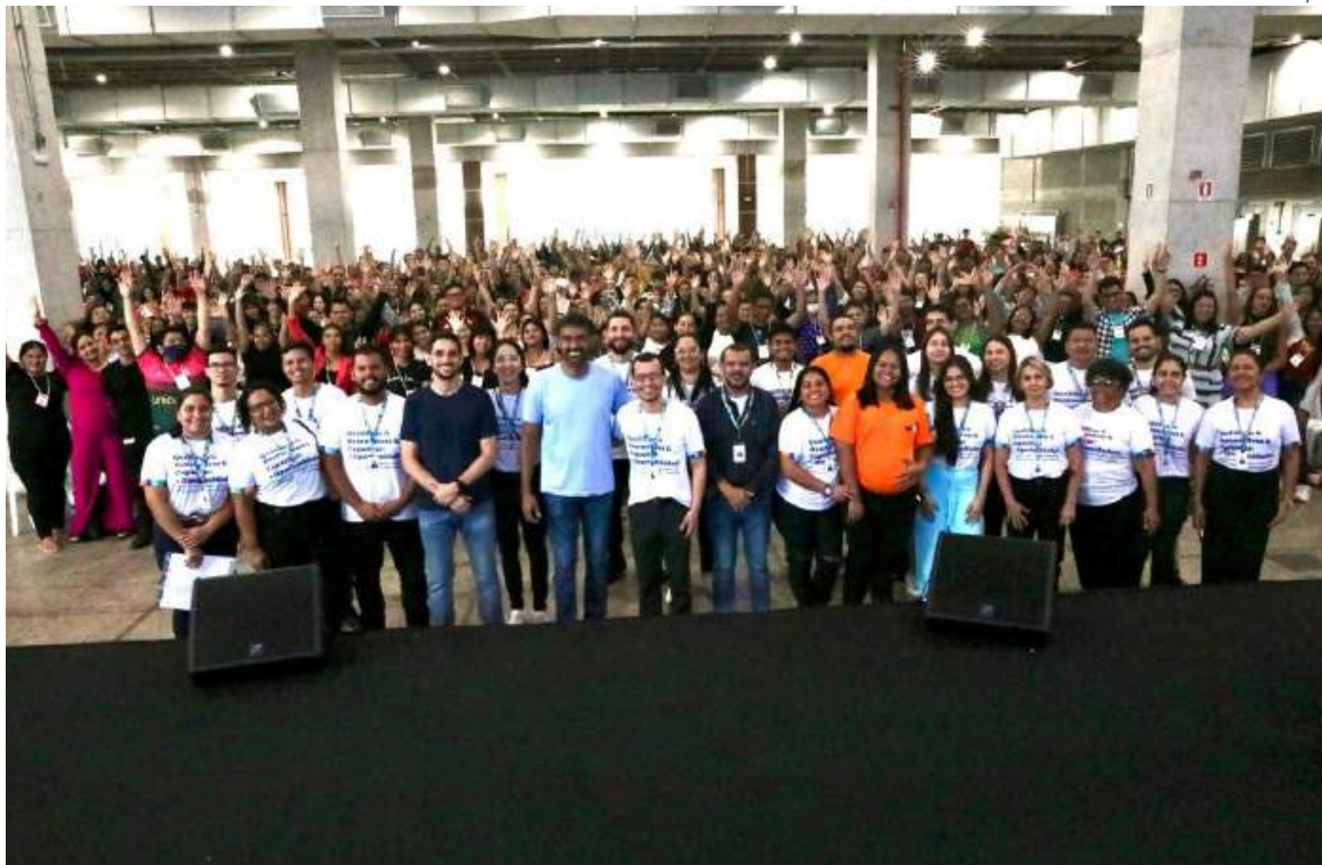
Ação da prefeitura certifica mais de 800 alunos do curso de TBO e encaminha mais de 200 pessoas para o mercado de trabalho

"A experiência com esse público foi maravilhosa. O TBO é um curso superimportante para a nossa cidade, que possui um Polo Industrial pungente. Trouxemos também os serviços do Sine Manaus, possibilitando que os alunos possam ser encaminhados para uma vaga de emprego. Essa ação foi tão positiva que precisa se repe-