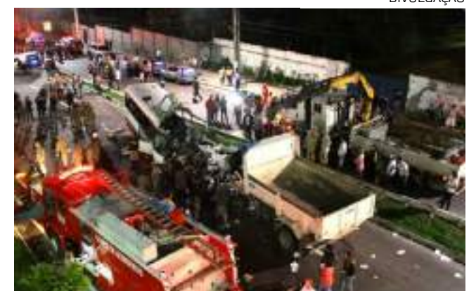
Vítimas da colisão entre caçamba e micro-ônibus chegou a 16

A Prefeitura de Manaus inaugurou, em 2018, um mural em homenagem às vítimas do acidente no viaduto Ayrton Senna, local da colisão.