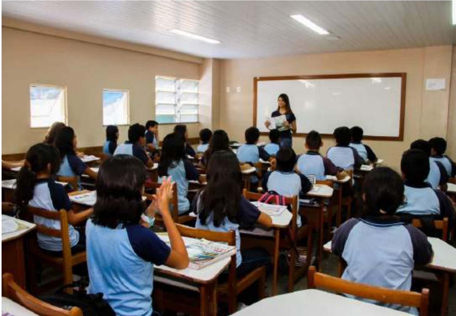
Professores aprovados no PSS 2024 deverão ser convocados pelo Governo do Amazonas a partir de 1º de agosto