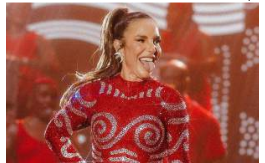
Ivete fará show exclusivo na abertura da turnê 'A Festa', em Manaus