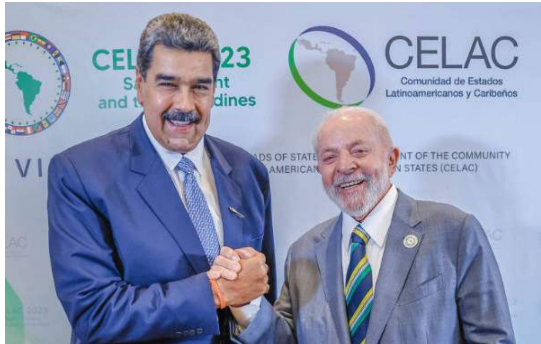
Presidente Lula com Nicolás Maduro durante conferência da Celac, em março

"Eu disse ao Maduro, garanta que [a eleição] seja mais democrática, porque é importante