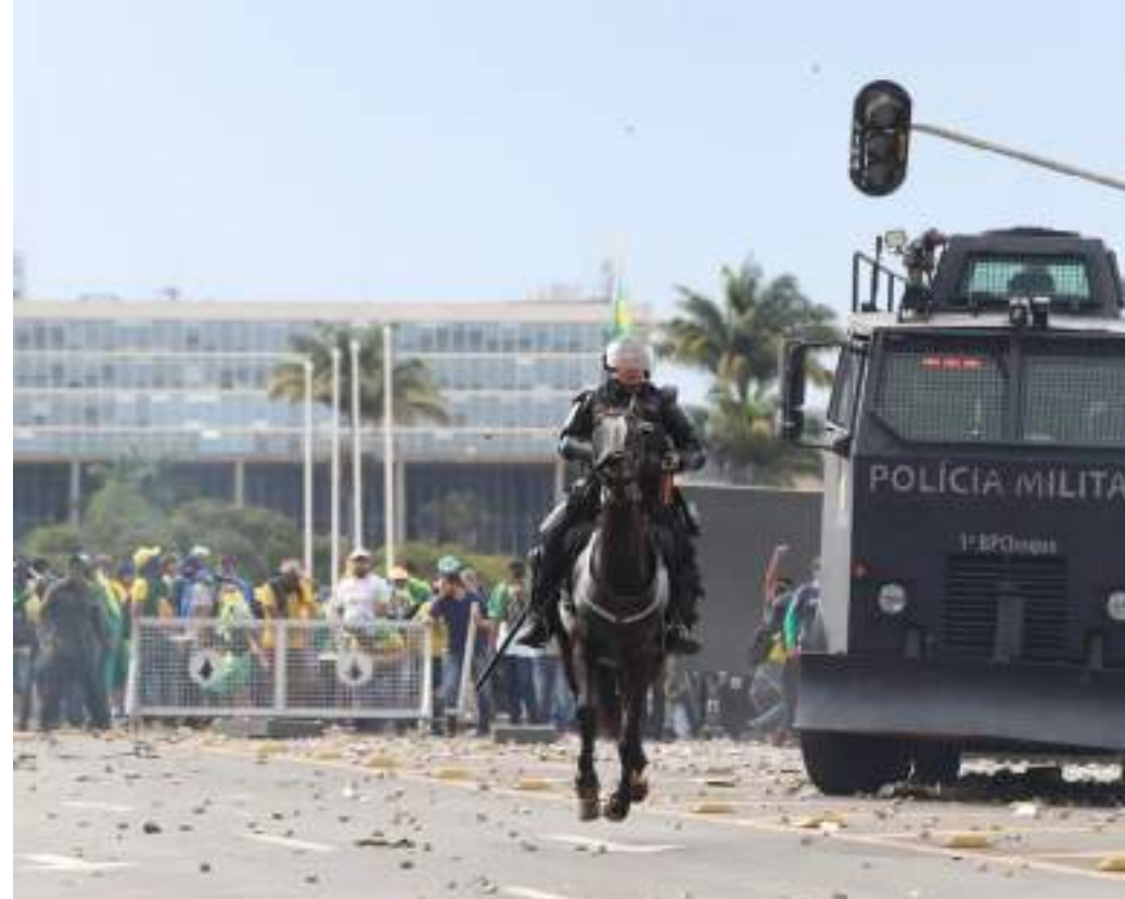
Policiais da Cavalaria da PMDF na dispersão de apoiadores do ex-presidente Jair Bolsonaro

Foi ele quem designou o major Flávio Silvestre para comandar a tropa de choque em campo. Segundo a PGR, ele tinha a incumbência, com o 1º CPR de "impedir" o acesso de pessoas e veículos à Praça dos Três Poderes", sendo a