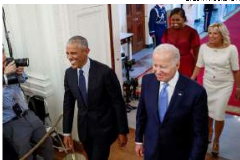
Presidente dos EUA, Joe Biden, e ex-presidente Barack Obama em 2022

A maior adesão de Obama ao esforço de reeleição de Biden acontece nesta quinta-feira, em um evento de arrecadação de fundos repleto de estrelas em Manhattan, com Biden, Obama e o ex-presidente Bill Clinton. Os três presidentes terão uma rara conversa, moderada por Stephen Colbert.