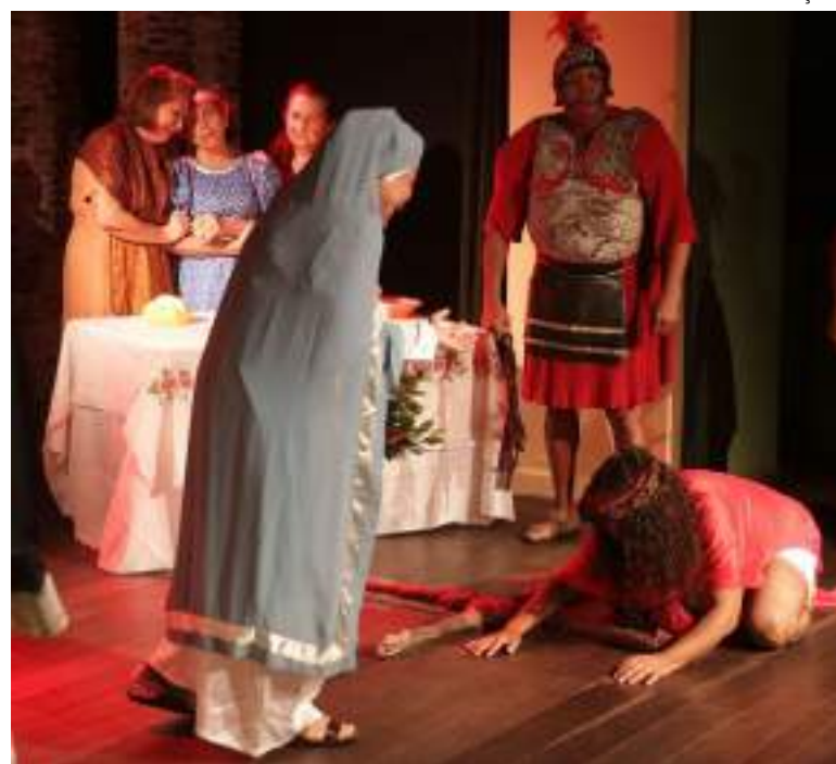
Grupo de pessoas idosas apresentam 'Paixão de Cristo'

O grupo integra a prorrogação de Extensão da FUnATI, com apresentação teatral e musical, envolvendo cerca de 30 artistas, sendo a maioria, pessoas com mais de 60 anos de idade. Já realizaram apresentações em outros estados e municípios do Amazonas, além de palcos como o Teatro Amazonas, Manauara Shopping e outros.