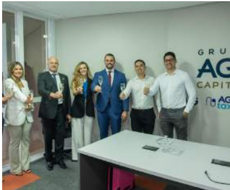
Grupo AG Capital abre "Casa AG Manaus", com foco em expansão comercial