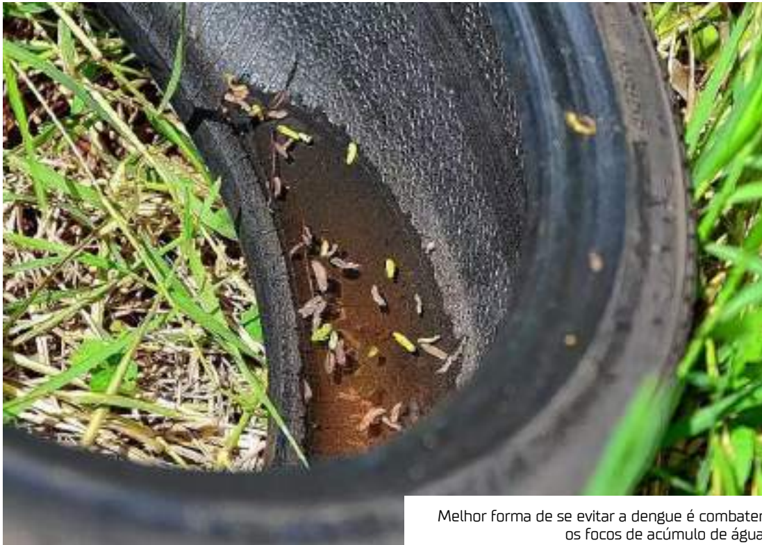
Melhor forma de se evitar a dengue é combater os focos de acúmulo de água

Questionado se não seria o caso de declarar emergência em saúde pública de interesse internacional, como aconteceu com o vírus Zika em 2016, Jarbas explicou que se tratam de cenários bastante distintos. Em 2016,