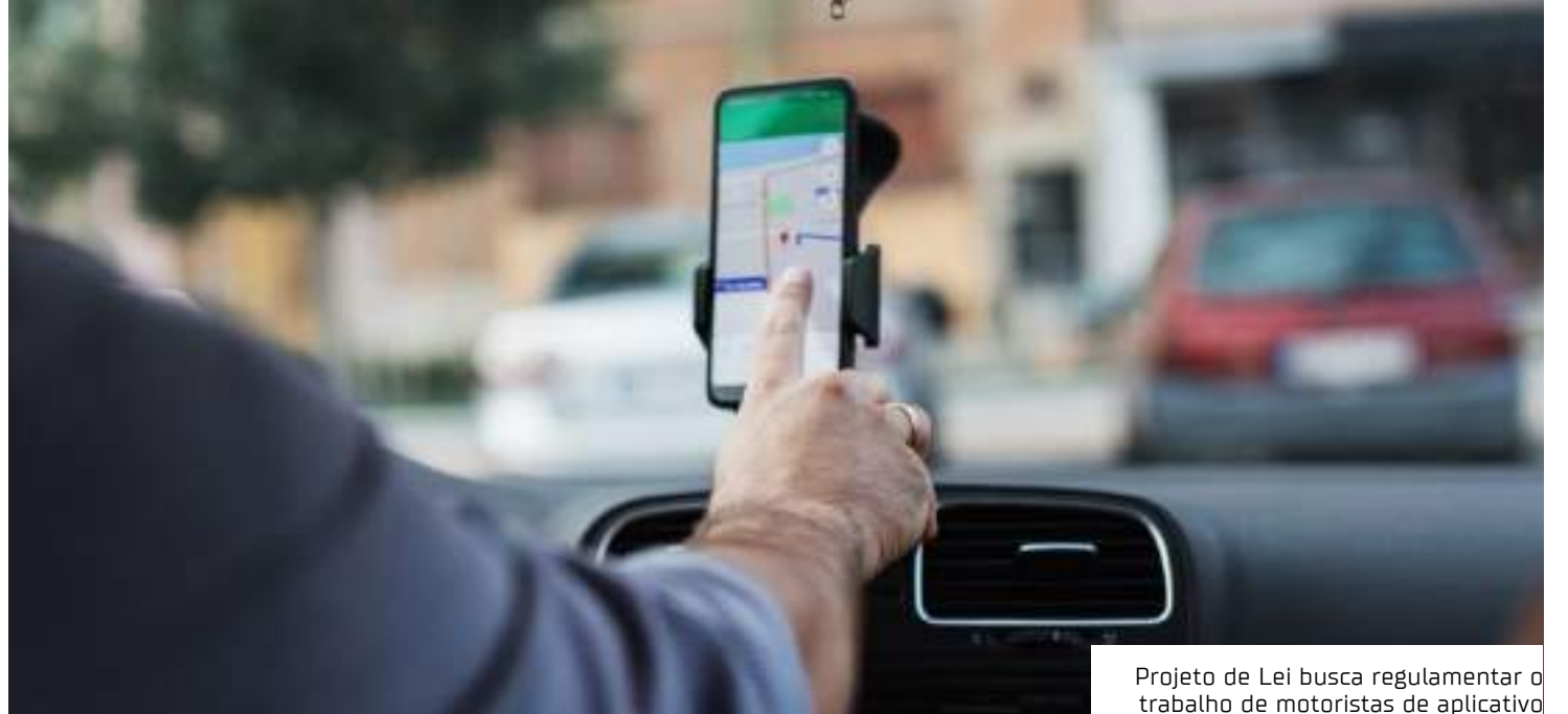
Projeto de Lei busca regulamentar o trabalho de motoristas de aplicativo

Outra polêmica é que o Governo Federal quer que os motoristas recolham o INSS pagando uma alíquota de 27,50% (7,5% pago pelos motoristas e 20% recolhido pelas operadoras). Já a Federação Brasileira de Motoristas de Aplicativos (Fembraapp) entende que a contribuição deve ser de modo simplificado, como microempreendedores individuais (MEI) ou como contribuintes individuais, o que diminuiria a burocracia e simplifica a cobrança.