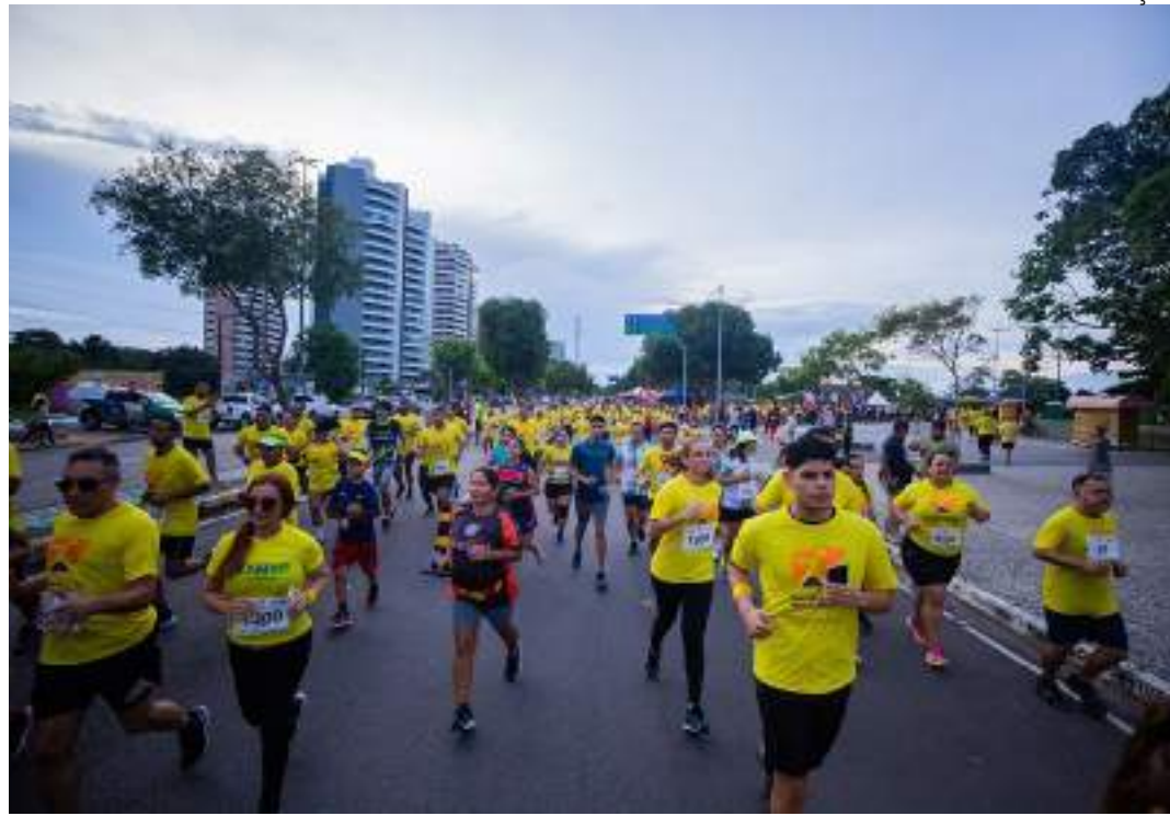
Primeira edição da corrida de rua, realizada em setembro de 2022, reuniu mais de 5 mil corredores

Serão contemplados com troféus os três primeiros colocados nas provas de 5km e 10km, nas catego-