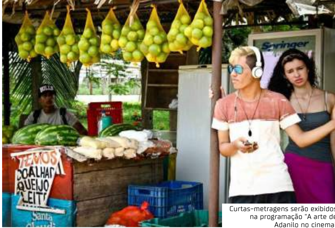
Curtas-metragens serão exibidos na programação "A arte de Adanilo no cinema"

Também será exibida a obra "521 Anos - Siia Ara" (2021), uma videoperformance com atuação, roteiro e direção de Ada-