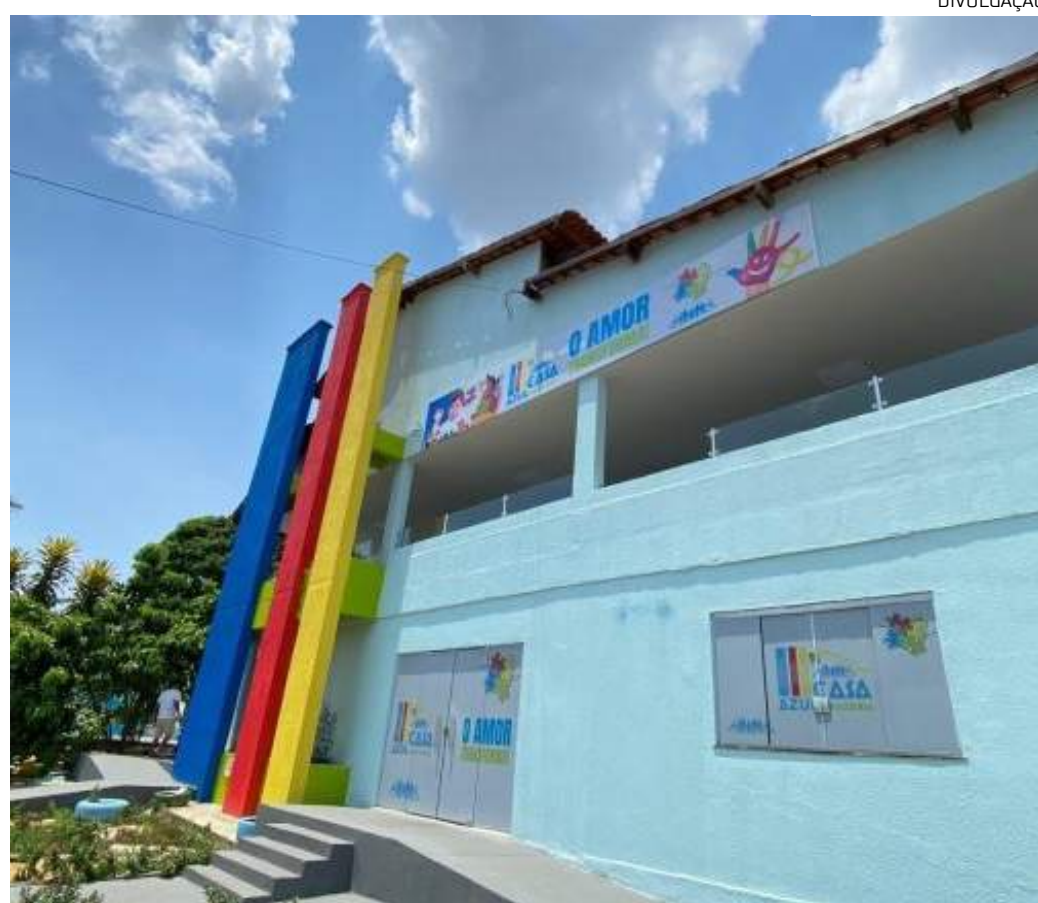
Casa Azul Amazônia atende, hoje, mais de 400 crianças em vulnerabilidade social

"O trote já é uma tradição nos cursos de Medicina. Mas, na FST, optamos