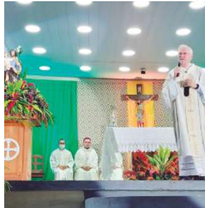
Novena de encerramento e celebração da missa, acontecerá às 19h

"A motivação bíblica ocorre, porque sabemos que São José não diz uma única palavra nos textos bíblicos e tudo aquilo que Deus lhe revela foi pelos sonhos. Os sonhos fazem parte da experiência de José com Deus na sua interioridade. Então, o sonho é um tema tipicamente josefino. Segundo elemento, porque somos