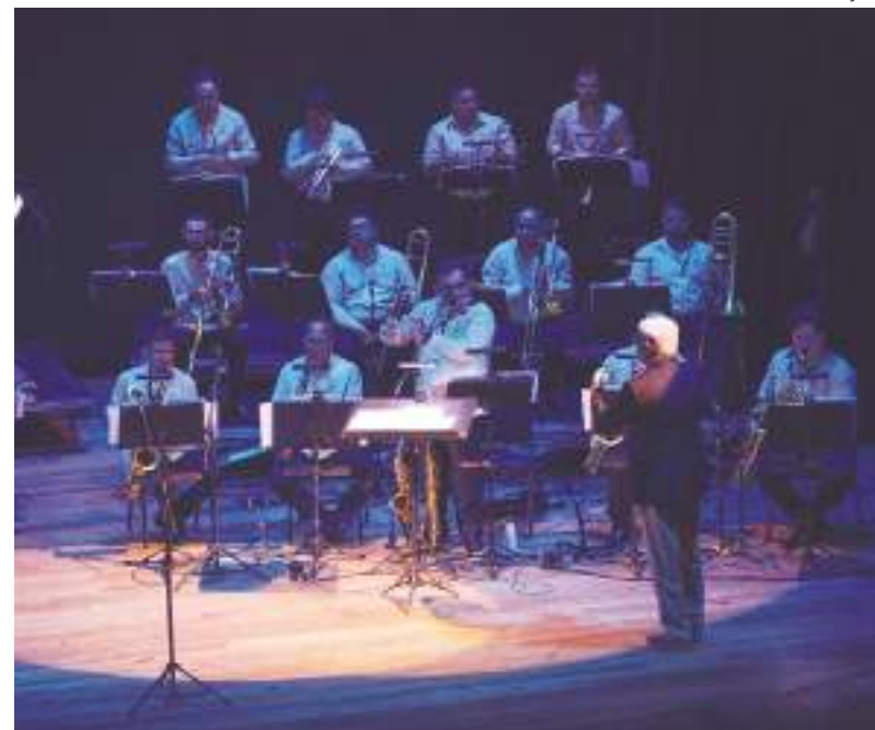
Amazonas Band celebra a música afro-americana