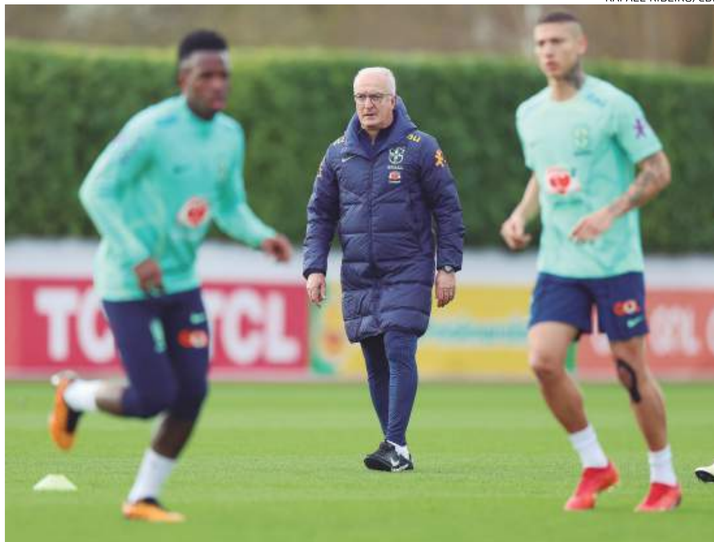
Primeiro treino de Dorival Jr., ex-São Paulo, como treinador da Seleção Brasileira aconteceu no CT do Arsenal, aos arredores de Londres

Apenas dois jogadores não participaram do treinamento. O goleiro Léo Jardim, do Vasco, e Bremer, da Juventus. Léo Jardim chegou à capital da Inglaterra no final da tarde. Já Bremer substituirá Gabriel Magalhães, cortado nesta segunda com inflama-