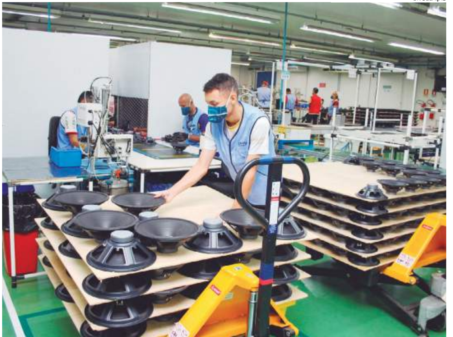
Setor da indústria foi o que mais cresceu nominalmente no Amazonas

O Setor de Serviços totalizou R$ 19,5 bilhões no 4º trimestre de 2023, com um crescimento de 5,83% em relação ao 4º trimestre de 2022. Segundo a Pesquisa Mensal do Serviço (PMS)