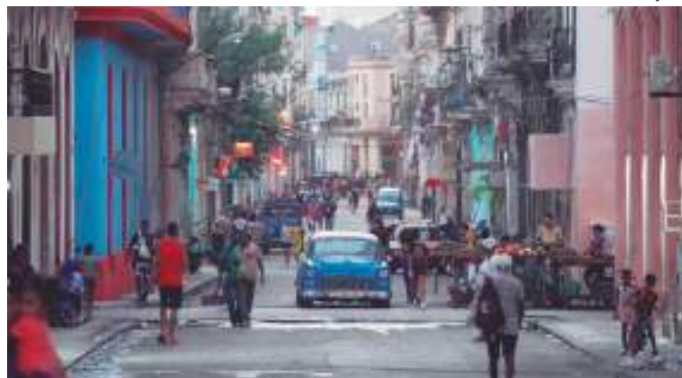
Cubanos protestam por falta de alimentos e cortes de energia