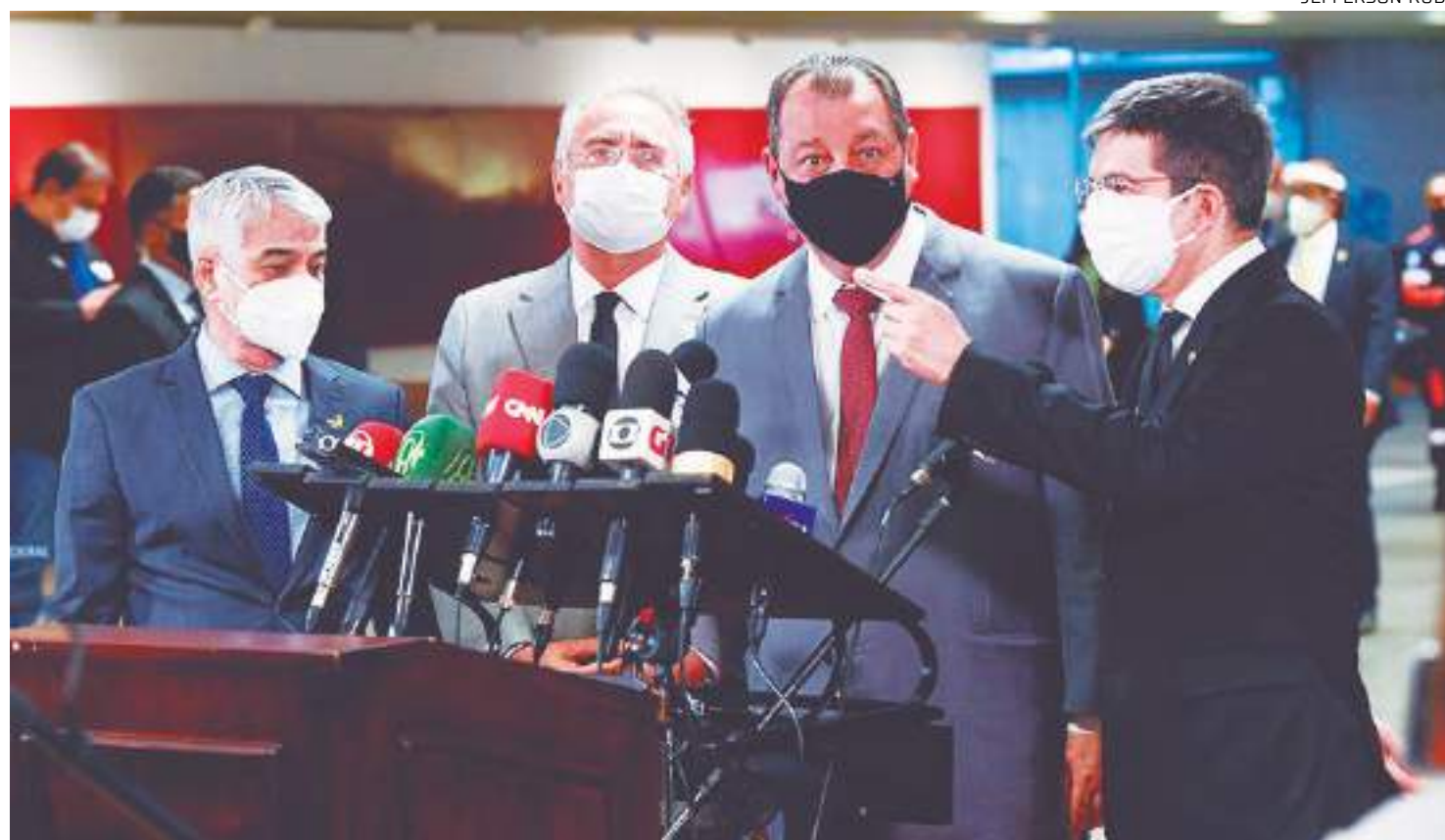
Senador Omar e Membros da CPI da Pandemia vão pedir reabertura de investigações contra Bolsonaro

Os membros da CPI da Pandemia do Senado se preparam para uma reunião com o recém-empossado Procurador-Geral da União, Paulo Gonet, nesta terça-feira (19), para tratar da possibilidade de reabertura do inquérito conduzido pela comissão. O relatório produzido pela Comissão Parlamentar de Inquérito busca responsabilizar o ex-presidente Jair Bolsonaro e diversos membros da cúpula do Governo Federal à época por uma série de crimes, incluindo charlatanismo e sua atuação durante a crise sanitária da Covid-19. As denúncias contra Bolsonaro estagnaram sob a gestão do ex-procurador Augusto Aras, que não avançou com as investigações. A expectativa