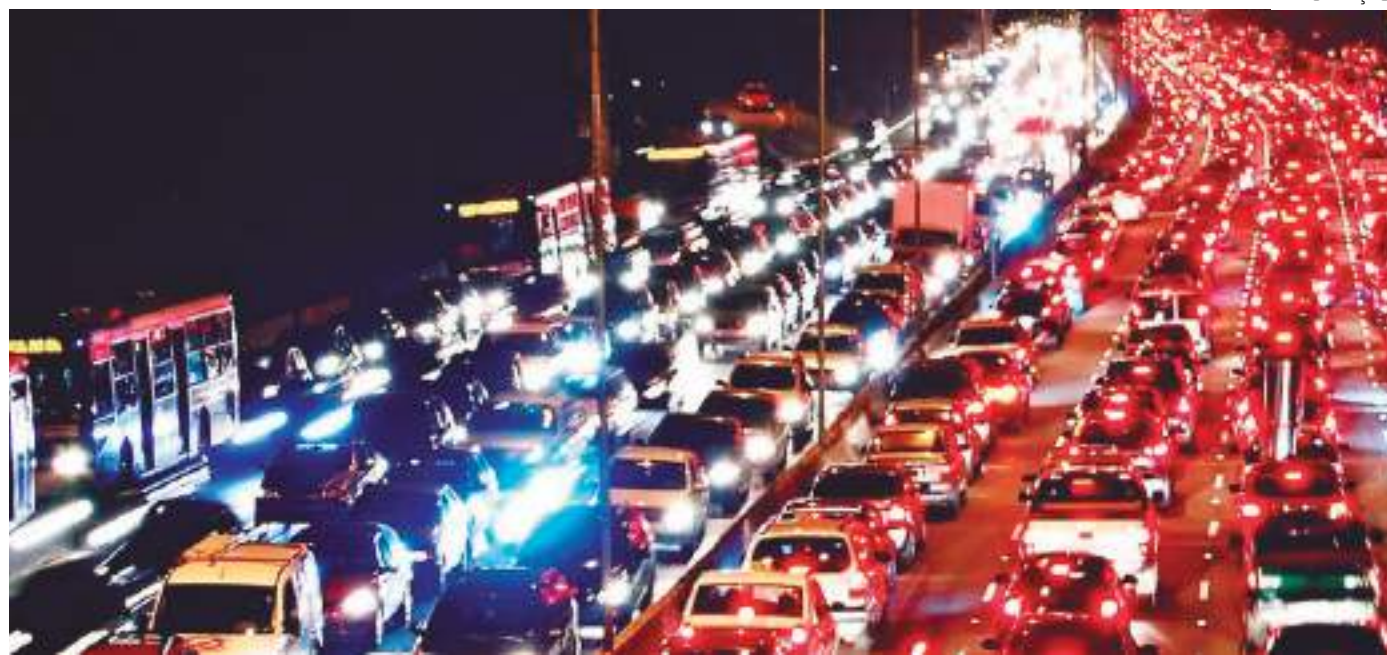
Projeto em análise busca conter emissão de dióxido de carbono proveniente de combustíveis fósseis

Segundo Ciro Nogueira, outros países estão tomando decisões semelhantes. O Reino Unido e a França querem proibir a venda de veículos movidos a combustíveis fósseis a partir de 2040; a Índia, a partir de 2030; e a Noruega, já em 2025. O senador afirma que esse tipo de veículo é responsável por um sexto das emissões de dióxido de carbono na atmosfera, gás proveniente da queima de combustíveis fósseis e importados de agente causador do efeito