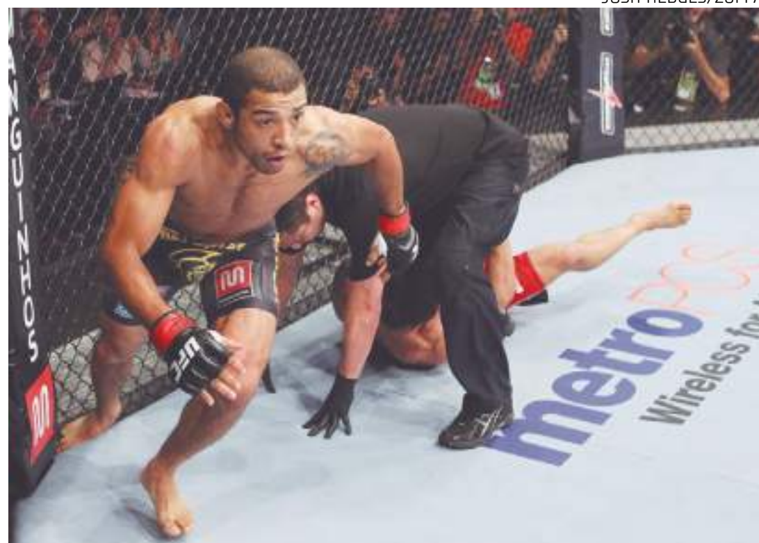
Em janeiro de 2012, Aldo venceu Chad Mendes no Rio de Janeiro, no segundo evento da organização na cidade

Pouco mais de dois anos após o primeiro confronto, José Aldo e Chad Mendes se reencontraram em uma edição do Ultimate no Rio de Janeiro. Para delírio dos fãs e do público presente, os protagonistas do UFC 179 entregaram 25 minutos de uma verdadeira guerra e o "Campeão do Povo" saiu vitorioso na decisão unânime dos juizes.