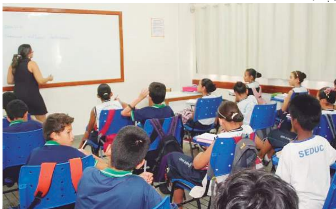
Projeto busca incluir conteúdo no plano curricular das escolas

"O PL pretende desenvolver e implementar projetos educativos-sanitários de defesa agropecuária para incentivar a responsabilidade individual e coletiva dos estudantes em relação aos benefícios e manter os padrões de sanidade, inocuidade e qualidade dos