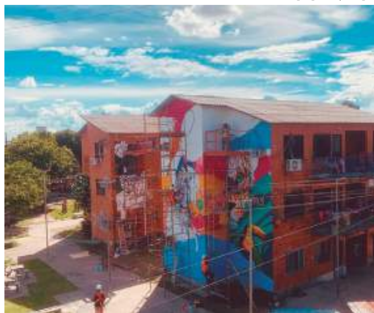
Grafiteiros realizam artes no Prosamim Gilberto Mestrinho