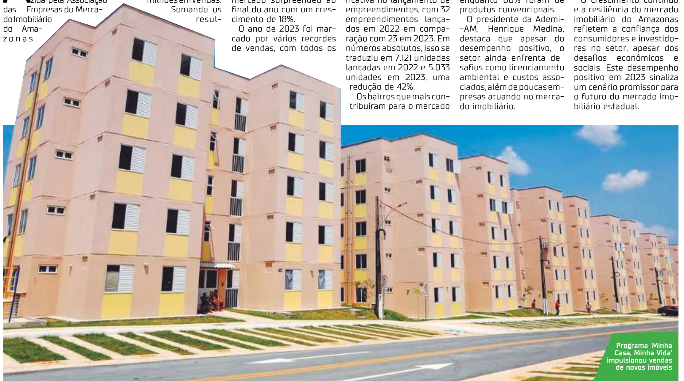
Programa 'Minha Casa, Minha Vida' impulsionou vendas de novos imóveis

O crescimento contínuo e a resiliência do mercado imobiliário do Amazonas refletem a confiança dos consumidores e investidores no setor, apesar dos desafios econômicos e sociais. Este desempenho positivo em 2023 sinaliza um cenário promissor para o futuro do mercado imobiliário estadual.