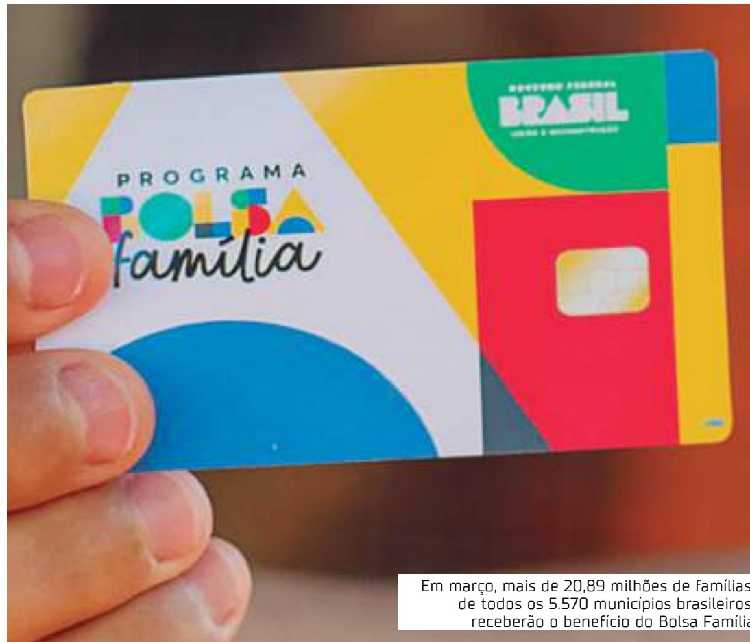
Em março, mais de 20,89 milhões de famílias, de todos os 5.570 municípios brasileiros, receberão o benefício do Bolsa Família

De acordo com o escalonamento habitual, os primeiros a ter acesso ao benefício serão os inscritos com Número de Identificação Social