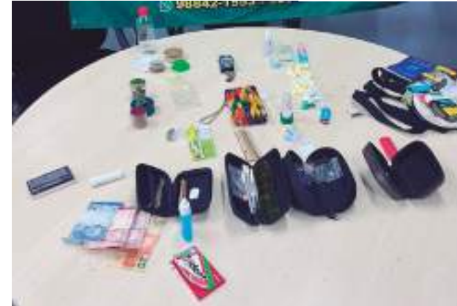
Prisões foram efetuadas pelos policiais militares do BPA