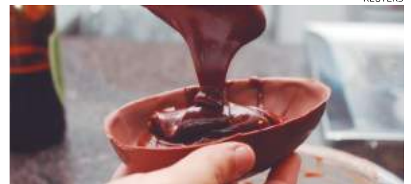
Empreendedores oferecerão chocolates e doces, entre outros produtos