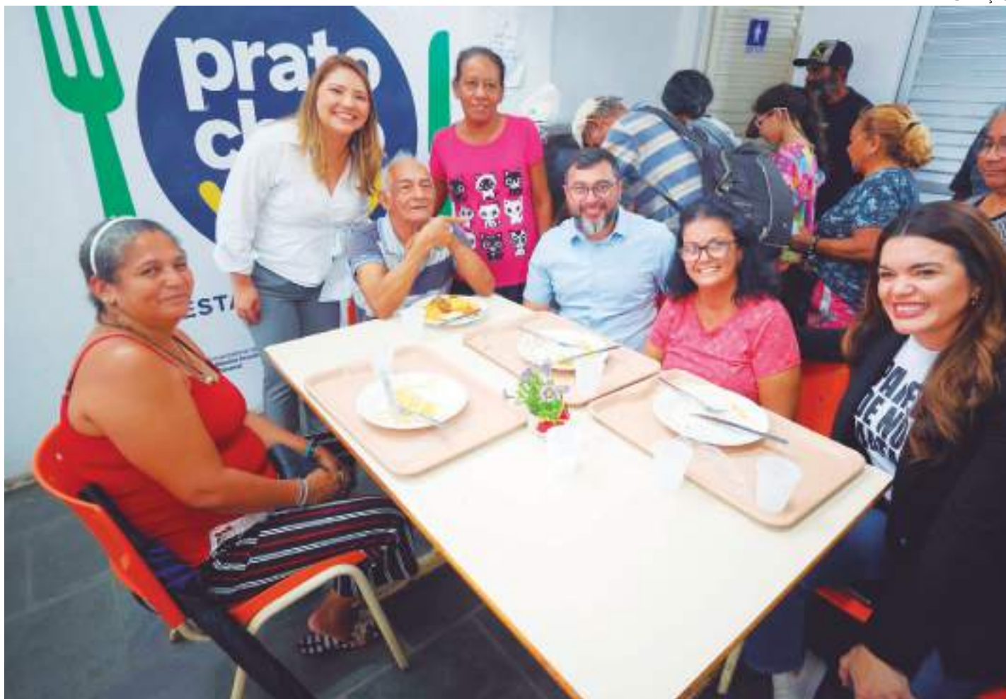
Prato Cheio é gerido pela Secretaria de Estado da Assistência Social (Seas) e tem 18 unidades localizadas na capital e 26 no interior do Estado

Só a unidade do Alvorada, inaugurada em 2022, já serviu mais de 177 mil refeições desde então. "Uma maravilha almoçar com o governador e ter uma comida boa dessa a R$ 1. Como eu disse a ele, agradeço primeiro a Deus e segundo a ele e sua equipe