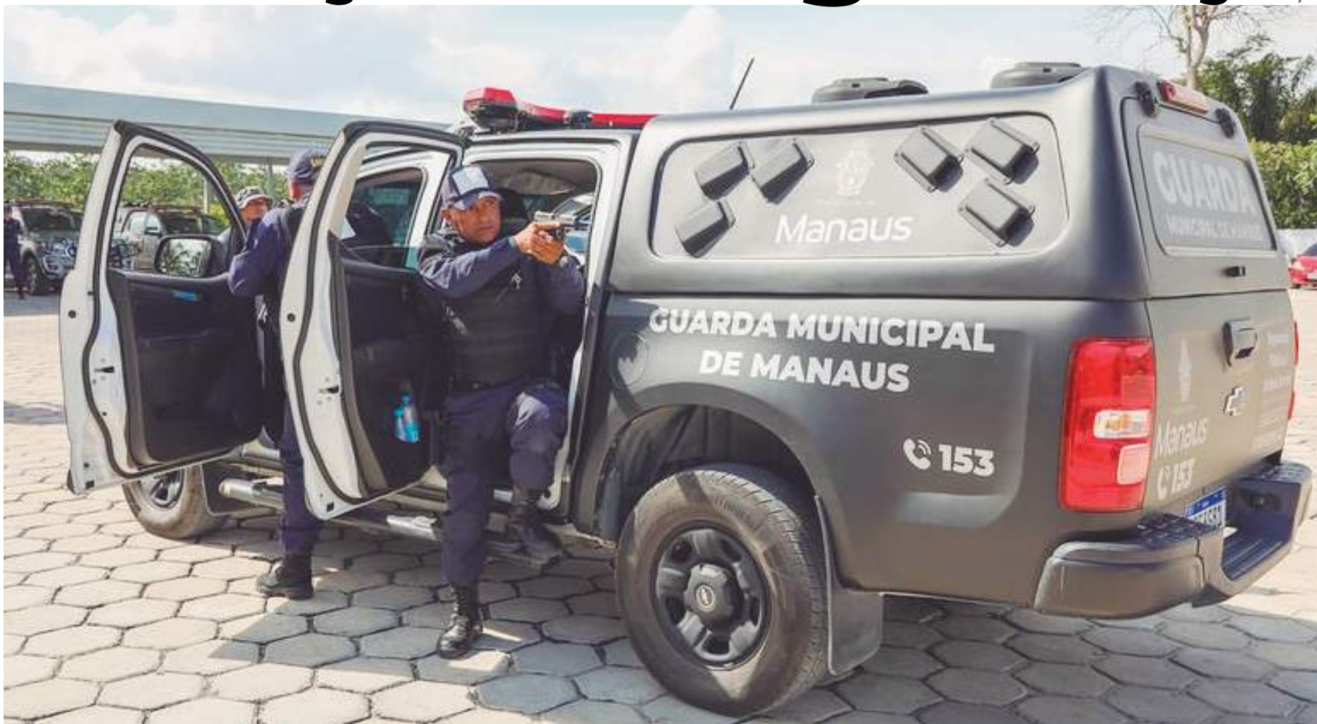
Guardas municipais passaram por etapas do curso de formação para integrarem a Romu

Ela tem experiência em operações de estágio, in-