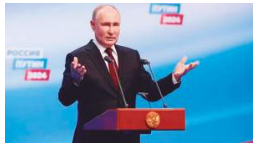
Putin inicia seu quinto mandato como presidente russo