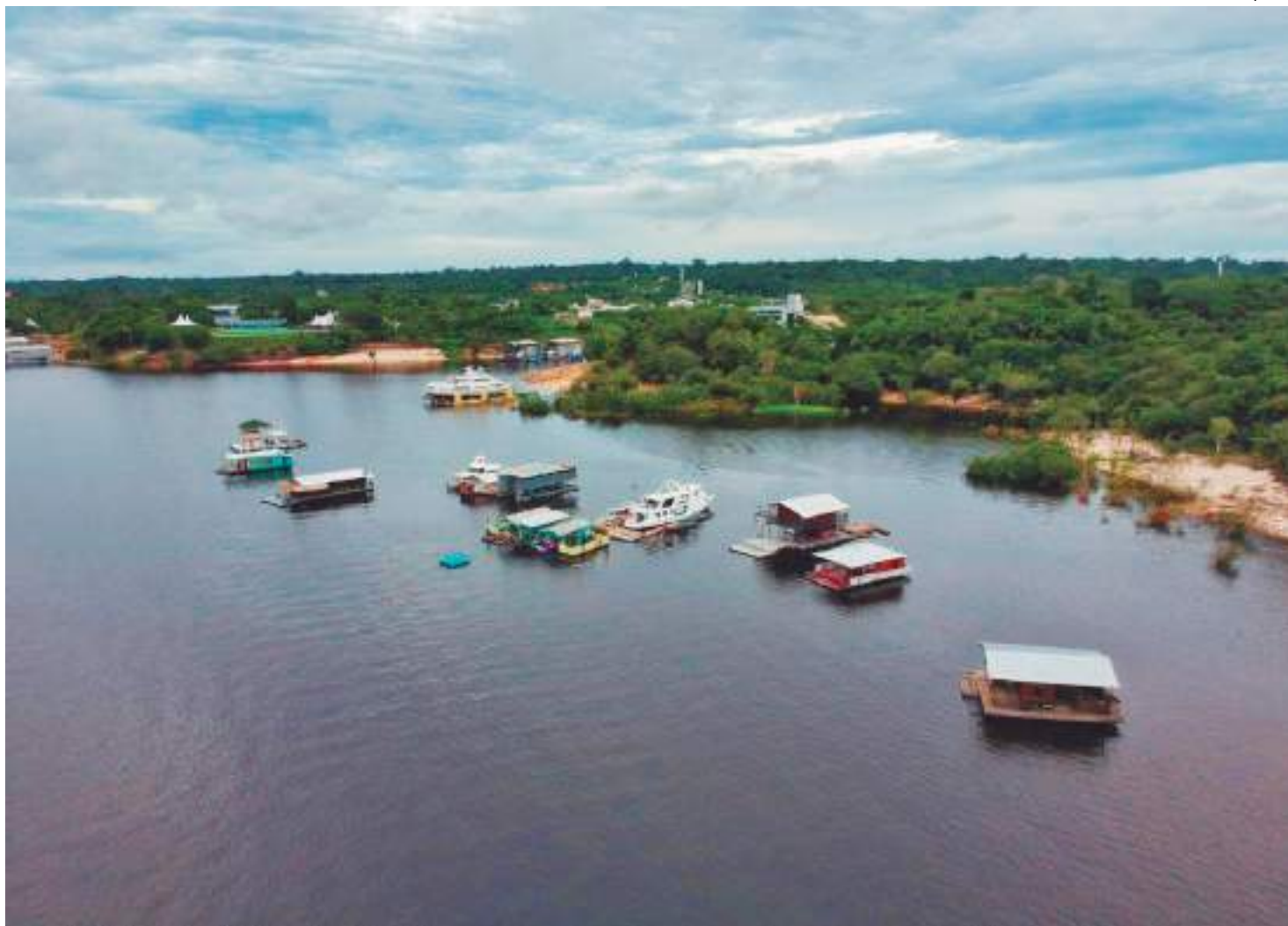
Juiz afirmou não existir qualquer elemento fático ou probatório capaz de justificar a concessão do pedido de tutela de urgência formulado

O governador do Amazonas, Wilson Lima (UB), de-