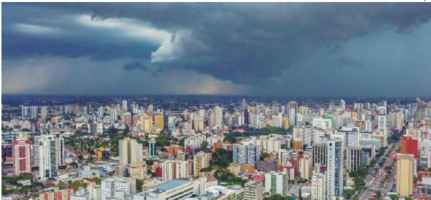
Chuvas intensas têm afetado várias regiões do Brasil no mês de março

Na região Norte, são previstas pancadas de chuvas, com valores que podem superar os 100 milímetros, principalmente