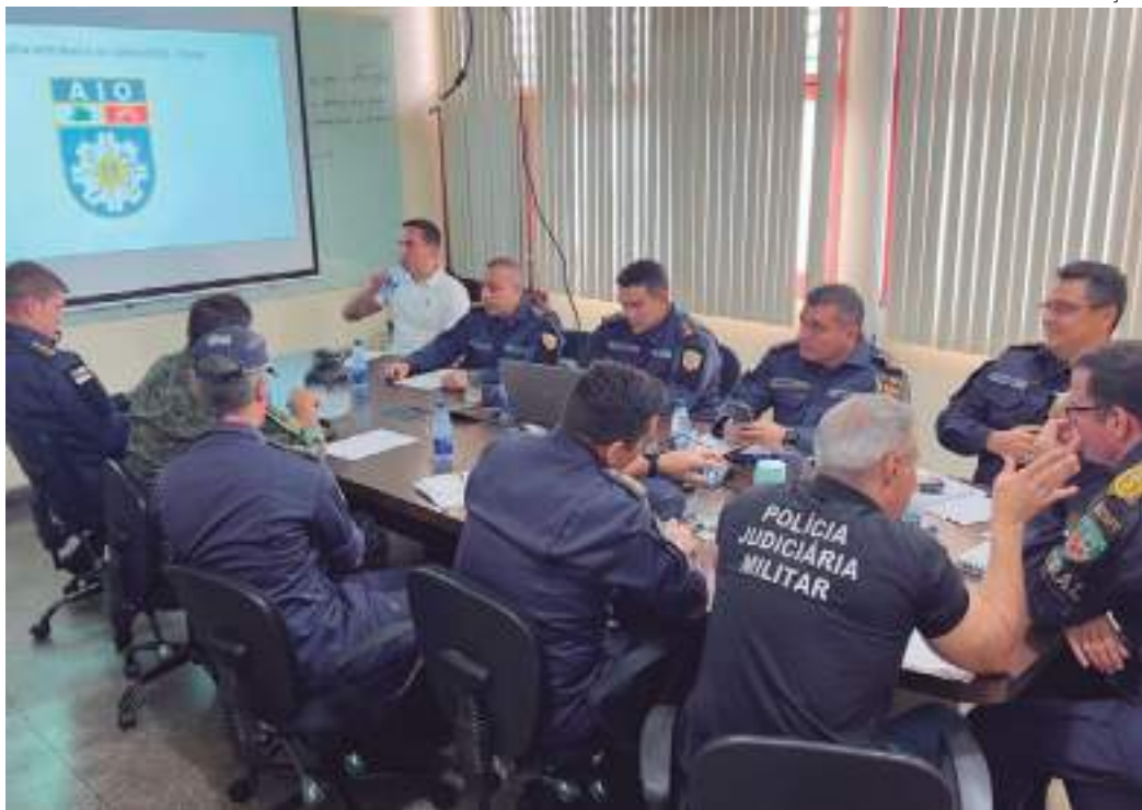
Objetivo é manter a qualidade das ações e garantir a segurança dos moradores e visitantes