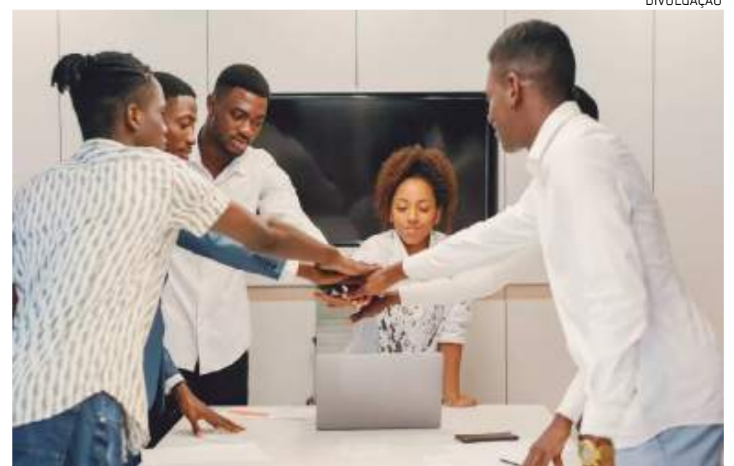
Programa tem o objetivo de treinar, capacitar e investir em novos negócios no Amazonas

ria, cada equipe será acompanhada individualmente por especialistas que orientarão a transformação de ideias em negócios viáveis, com potencial para atrair investidores e prosperar no mercado", ressalta Mantovanelli.