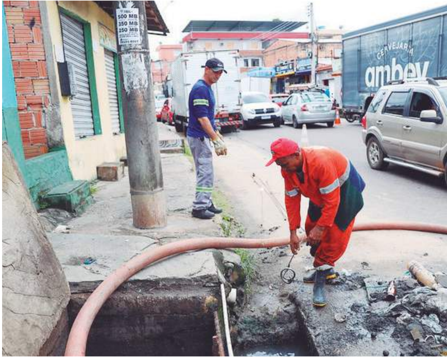
Prefeitura intensifica serviços de limpeza e desobstrução de bueiros no Centro, Betânia e Morro da Liberdade

"Estamos atentos em todas as zonas da cidade, dando assistência por meio dos nossos Distritos de Obras nas ocorrências das chuvas. A área do Centro é uma área que sofre bastante, principalmente nas ruas próximas às feiras. São muitos bueiros e, infelizmente, lixos são descartados de forma irregular. Realizamos