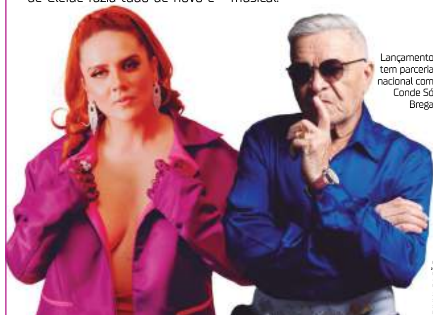
Lançamento tem parceria nacional com Conde Só Brega