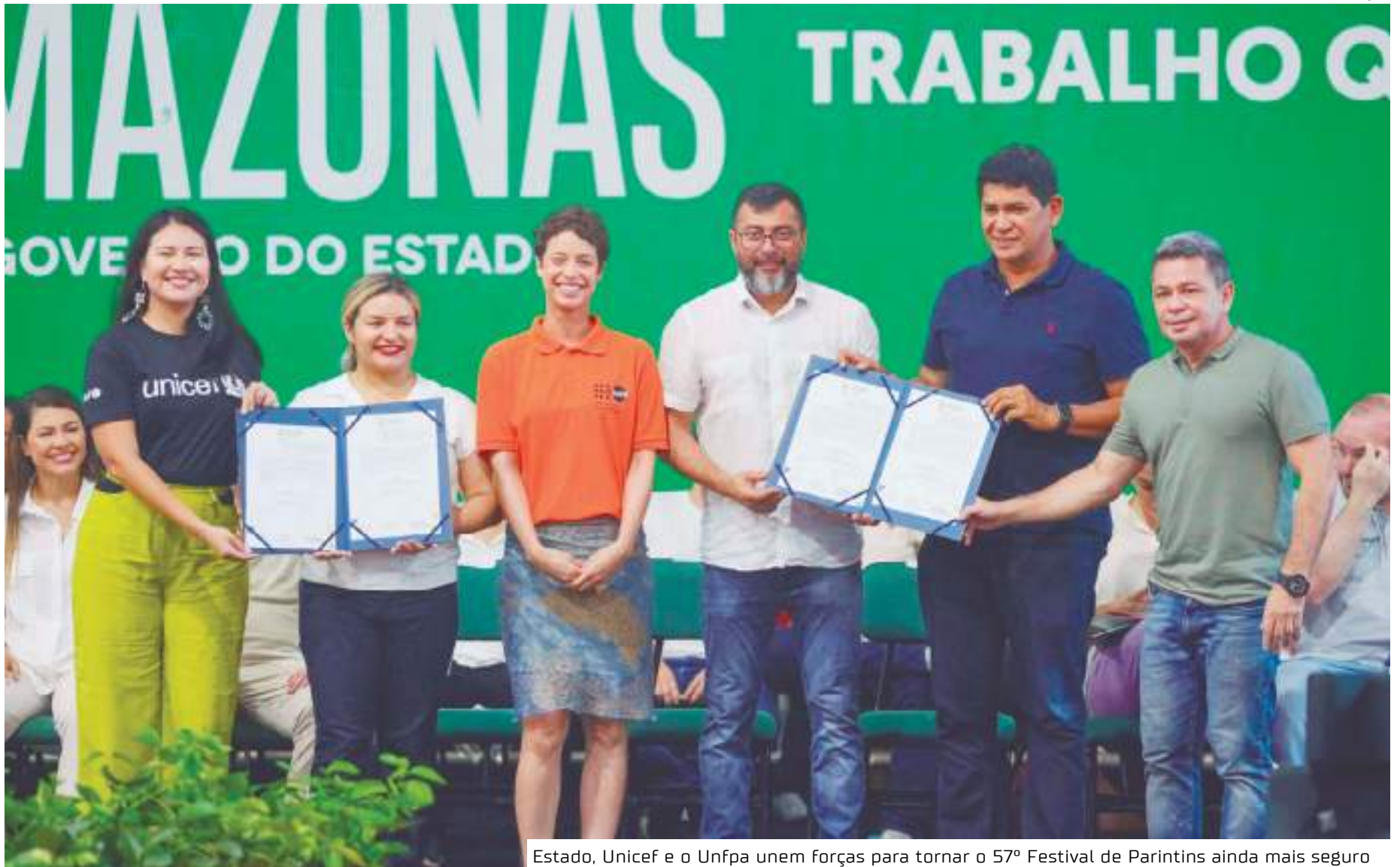
Estado, Unicef e o Unfpa unem forças para tornar o 57º Festival de Parintins ainda mais seguro

Este é o segundo ano consecutivo em que as medidas são fortalecidas no município, durante o festival. Em 2023, o Unicef treinou conselheiros tutelares de Parintins e capacitou os servidores do executivo estadual que