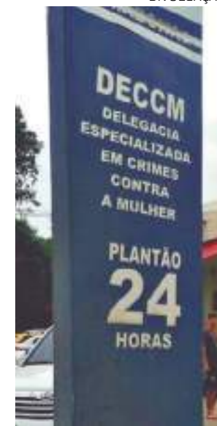
Ambos foram encaminhados para a Delegacia da Mulher