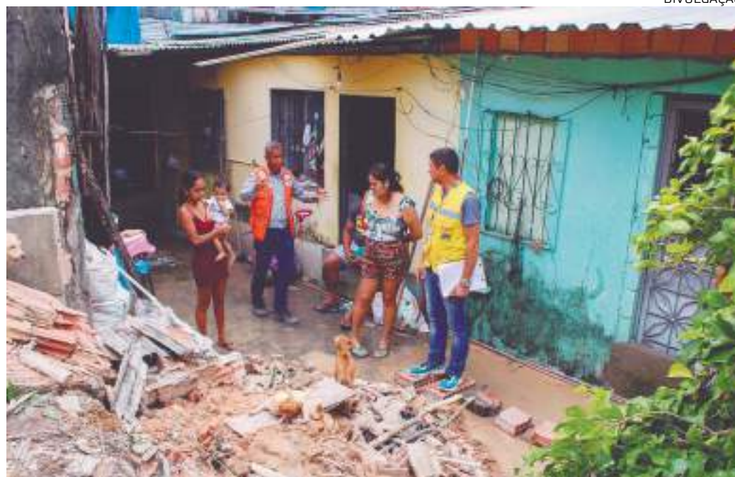
Servidores da Semasc e Defesa Civil realizando atendimento em duas residências afetadas pela forte chuva

"Nossas equipes estão em campos desde o início das chuvas, na manhã de ontem, e agora acompanhamos a Semasc no atendimento às famílias afetadas. No decorrer do seu atendimento socioassistencial da população, a Defesa Civil continuará trabalhando nas avaliações estruturais das residências