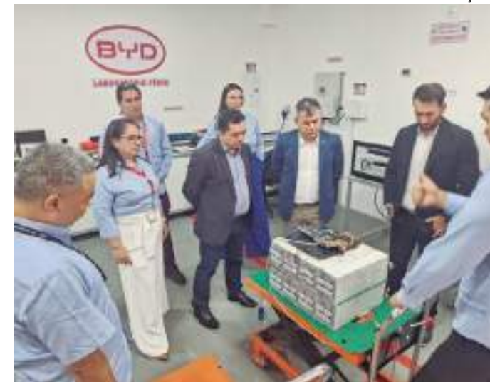
Suframa faz visita à BYD Indústria de Baterias Ltda

O principal componente é Fosfato Ferro Lítio (LiFePO4)