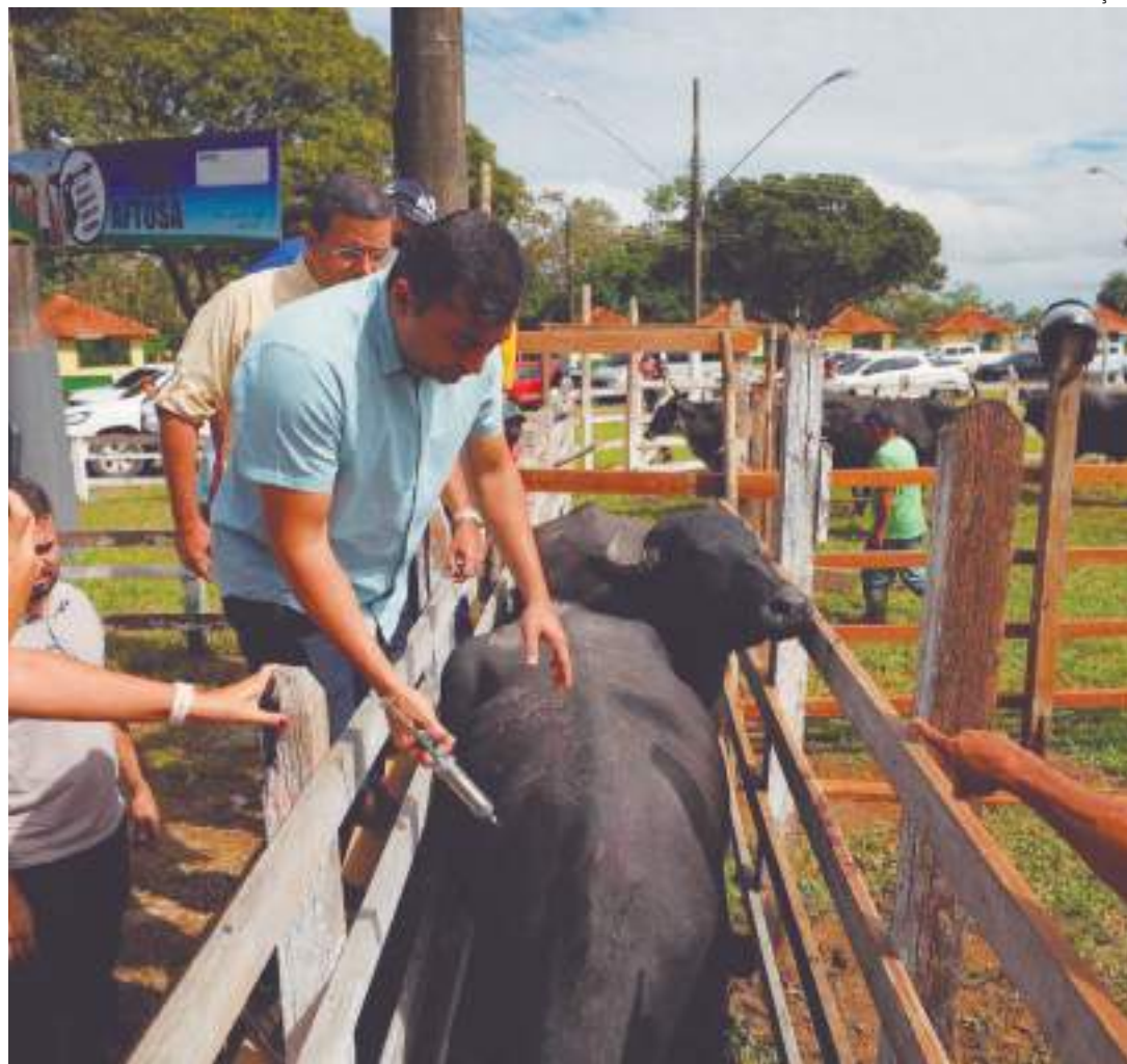
Próximo passo será o reconhecimento internacional, por parte da Organização Mundial de Saúde Animal (Omsa)