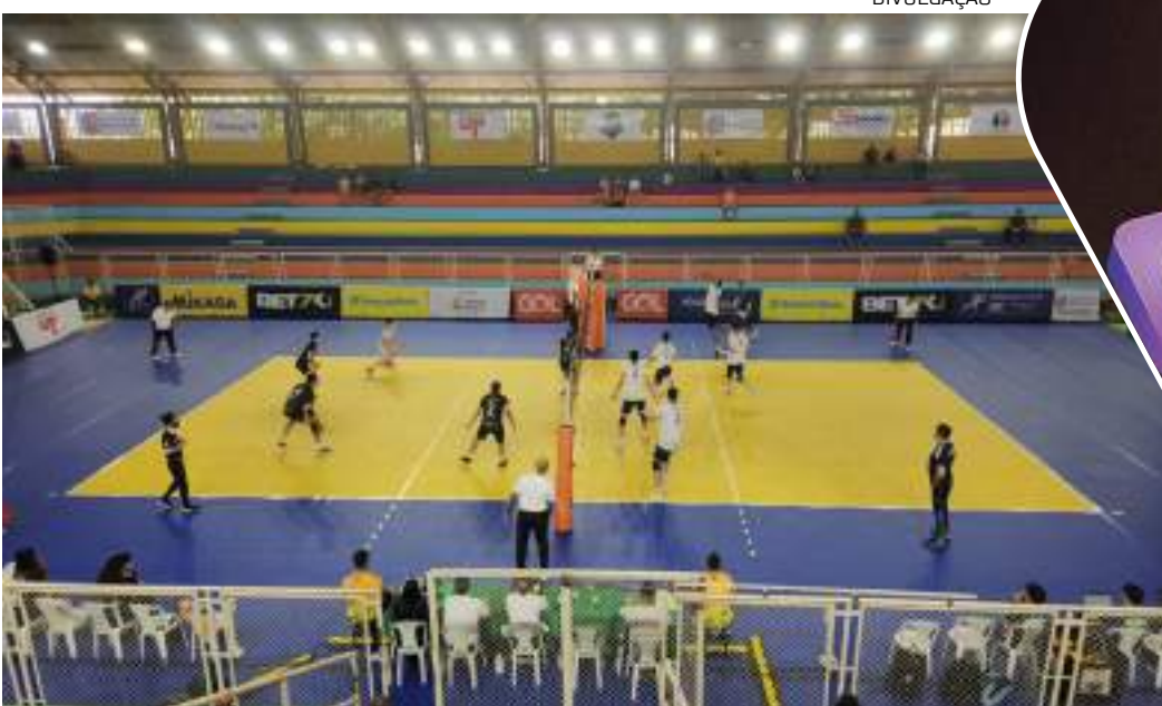
Time amazonense Manaus Vôlei durante partida com o time Sada Cruzeiro-MG, no Ninimberg Guerra

O time que conta com o apoio da Prefeitura de Manaus, por meio da Fundação Manaus Esporte (FME), se recuperou das sete derrotas iniciais e superou o Sada Cruzeiro-MG por parciais de 25 a 22, 22 a 25, 25 a 22, 23 a 25 e 15 a 9. A partida começou na noite de sábado (2), e foi adiada, ainda no primeiro set, em consenso entre equipes e organização por conta da umidade que tomou conta da quadra. Retornado na