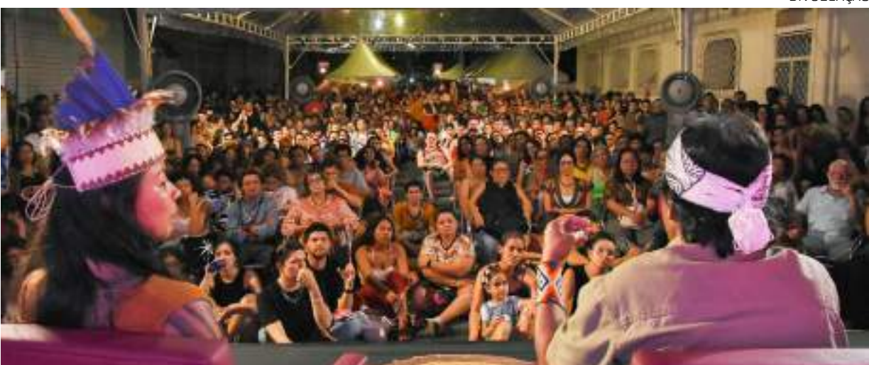
Casarão de Ideias realiza ações culturais no Centro de Manaus