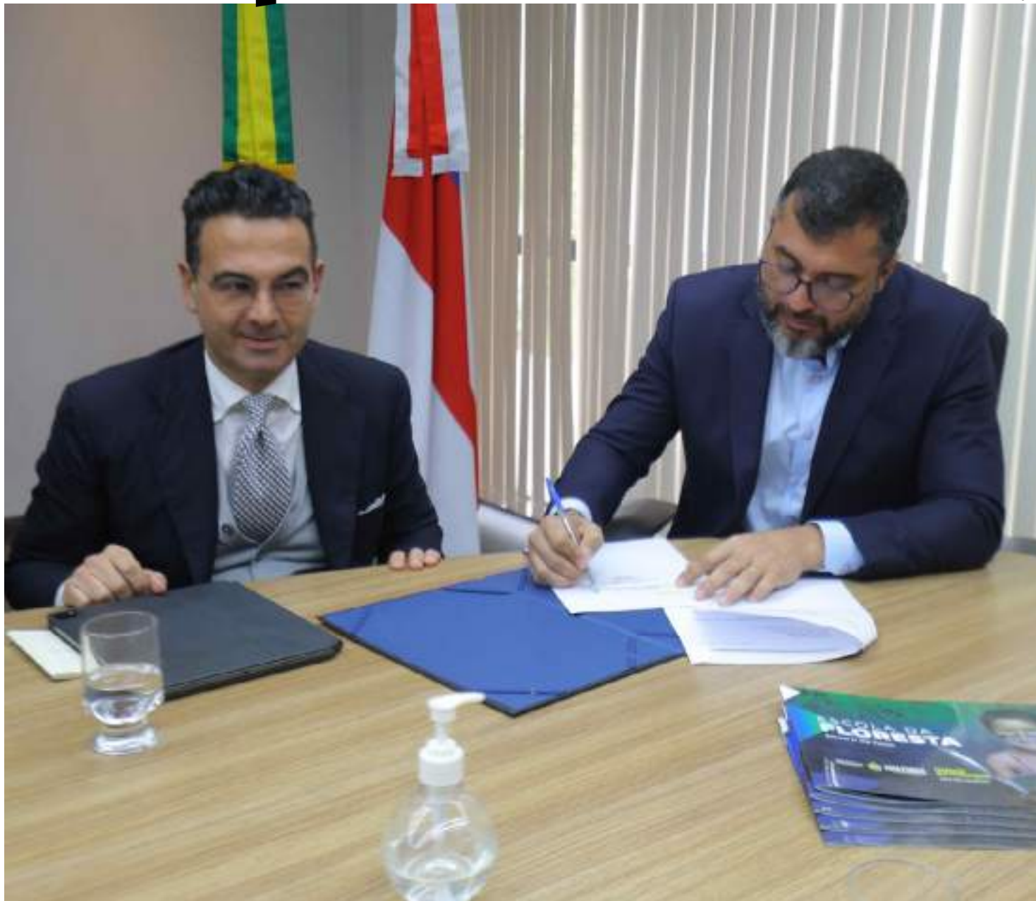
Uma carta de intenções foi assinada com a iniciativa privada para construção de mais uma unidade do projeto que visa promover educação socioambiental

A Escola da Floresta integra o Programa Educa+Amazonas, lançado em 2021 pelo governador Wil-