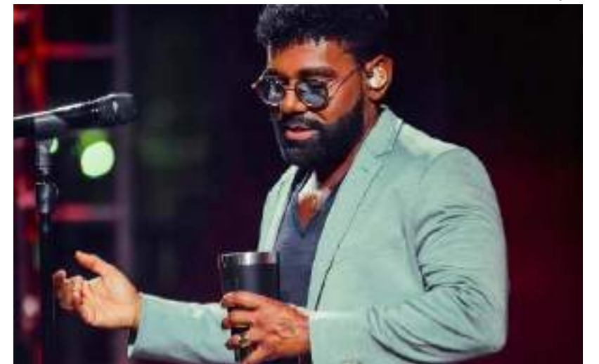
Show de Pablo ocorrerá no próximo sábado (9), na Arena da Amazônia