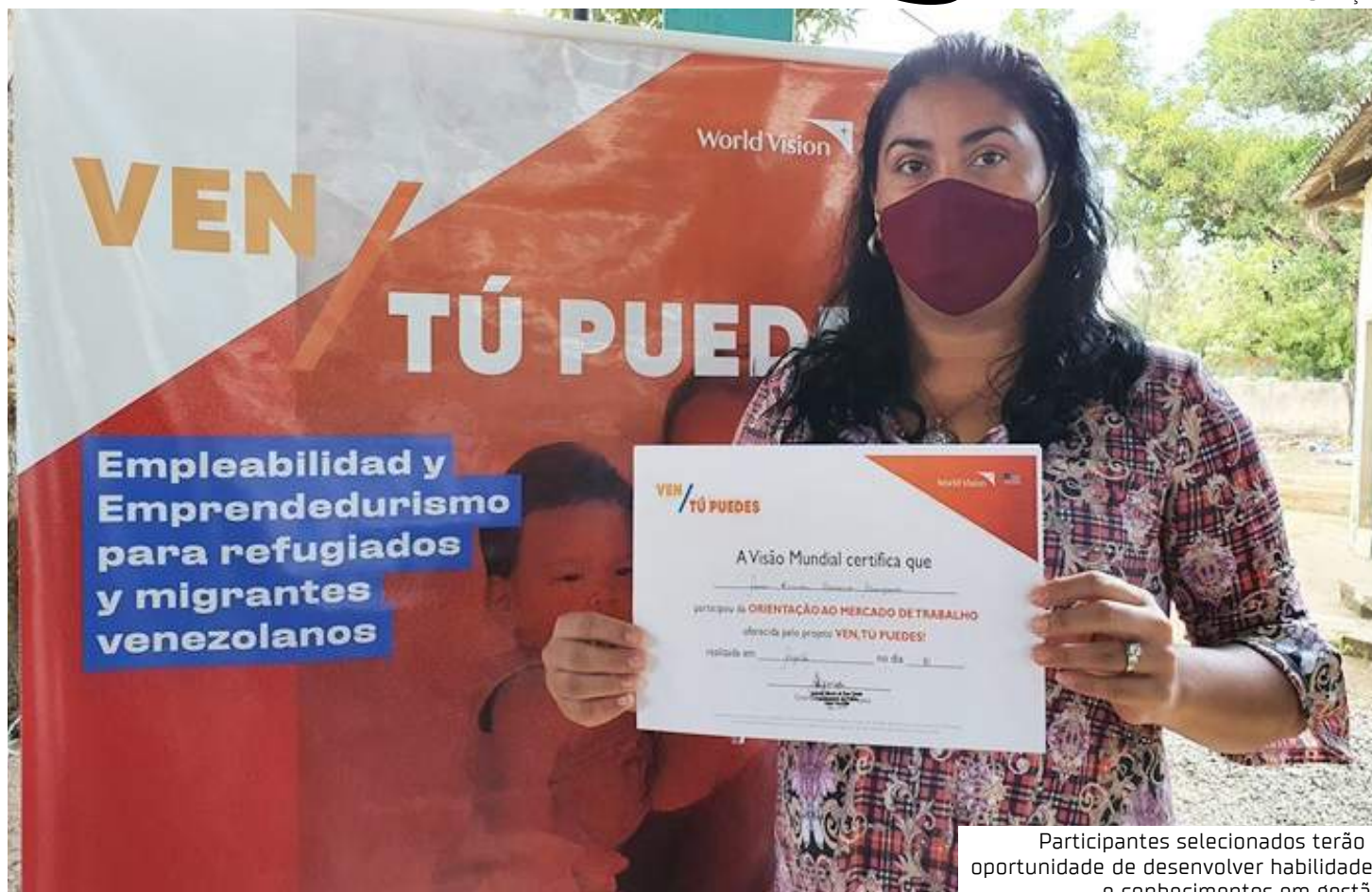
Participantes selecionados terão a oportunidade de desenvolver habilidades e conhecimentos em gestão

Para mais informações, entre em contato com a Ponto Focal de Empreendedorismo de cada território. Em Manaus, contate pelo telefone (92) 99239-1853. Para São Paulo, entre em contato pelo telefone (11) 99426-7439.