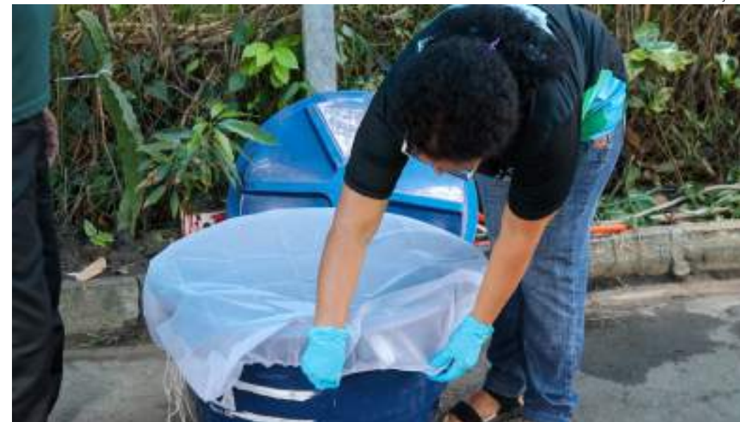
O mosquito Aedes aegypti, transmissor da dengue, vive e se reproduz dentro e ao redor das nossas casas

uso ou de uso eventual devem ser tampados e ter a água renovada semanalmente; - Plantas, como bambu, bananeiras, bromélias, gravatás, babosa, espada de São Jorge e outras semelhantes podem acumular água. A orientação é esvaziar a água semanalmente, virando a planta ou jogando água corrente para renovar a