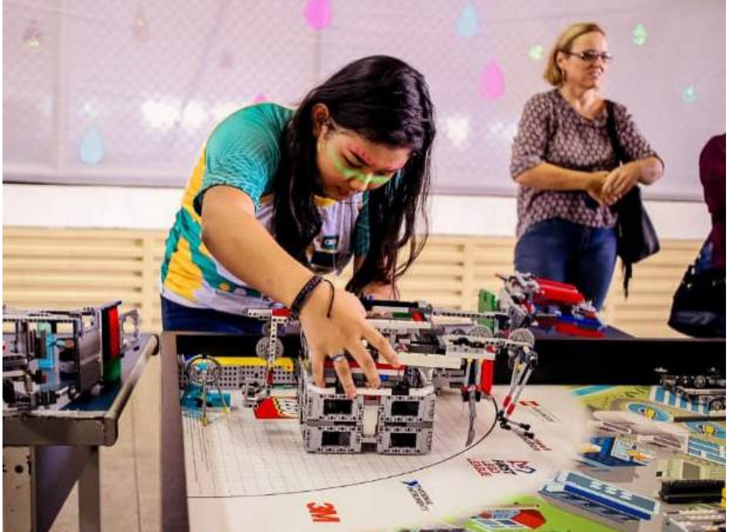
Escola de educação tecnológica Manaós Tech for Kids oferece matrículas gratuitas para meninas entrarem no mercado