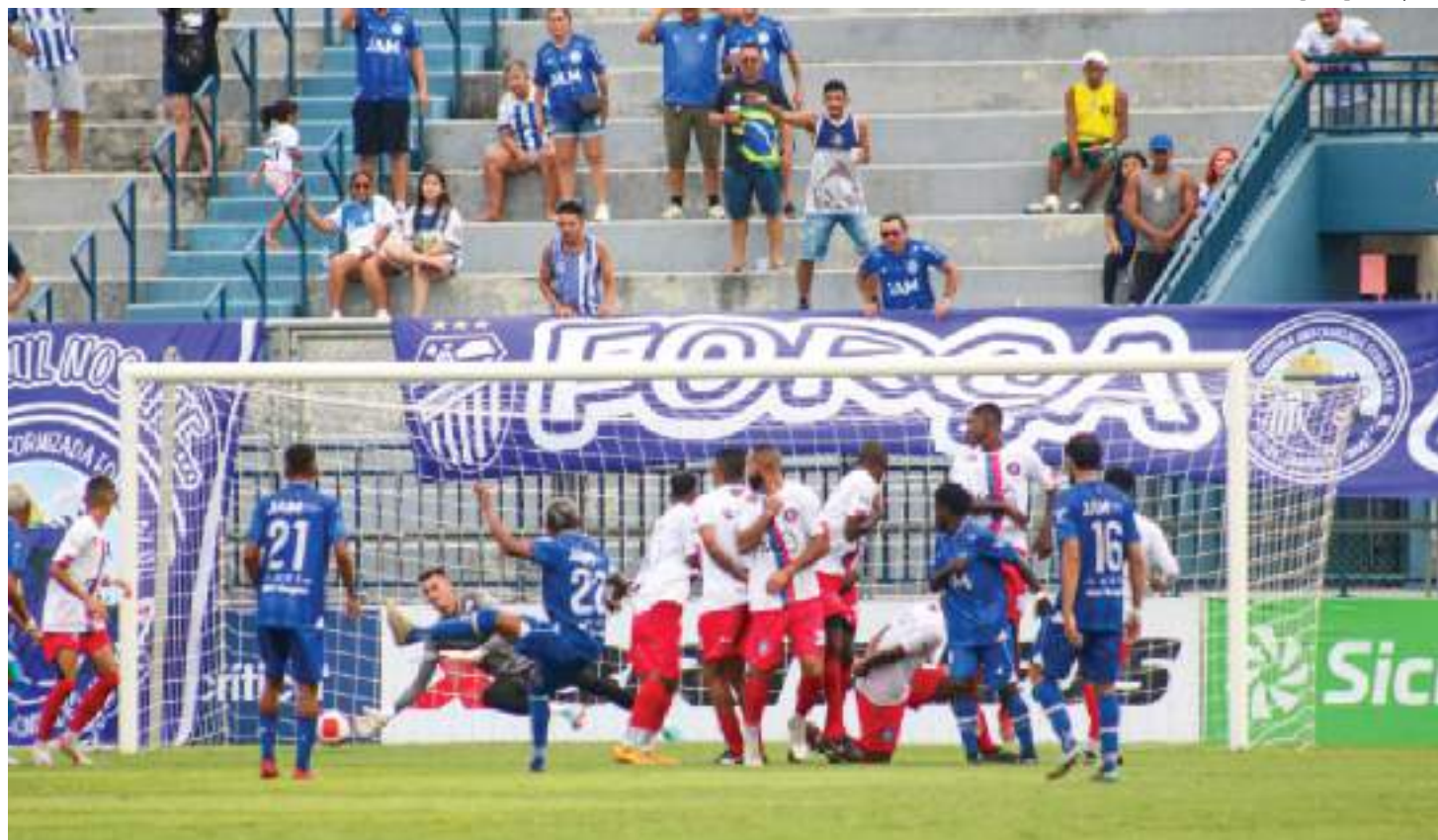
Grupo de torcedores do São Raimundo atacou um ônibus com torcedores do RPE Parintins, após a partida entre as equipes, e feriu uma mu-