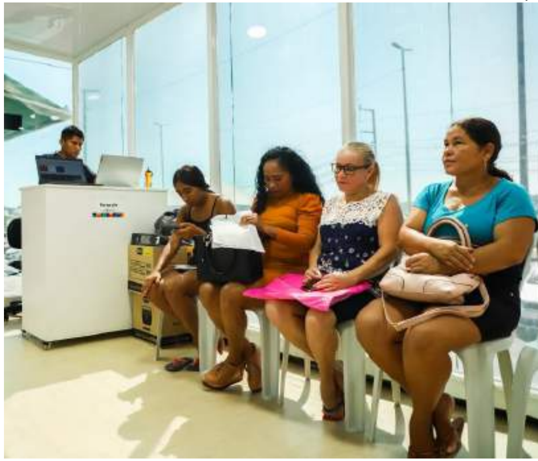
Ações nas unidades incluem ainda a oferta de consultas médicas e de enfermagem para exame da mama

"Queremos reforçar o papel do autocuidado em saúde, enfatizando a importância do diagnóstico precoce do câncer do colo do útero, que é prevenível em 99% dos casos. Se você identifica no início, consegue evitar um agravo mais sério ou até um óbito mais à frente", aponta.