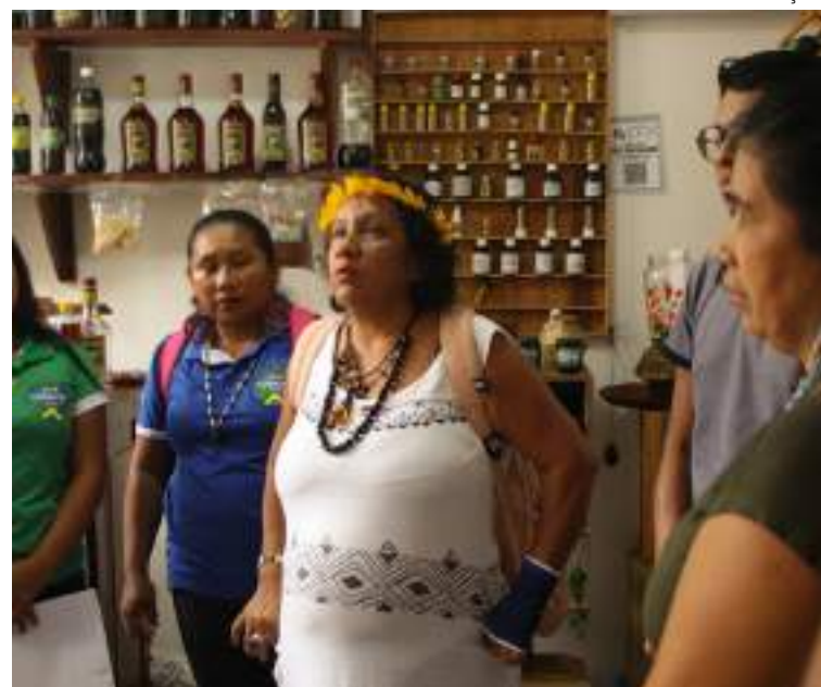
Iniciativa da FAS visa a valorização da economia indígena na Amazônia