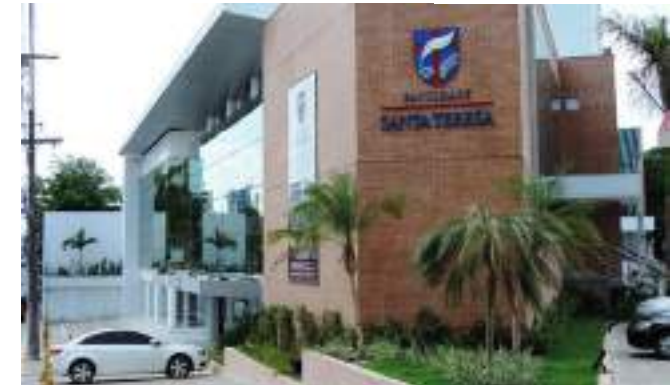
Grupo terá participação dos alunos de Psicologia da instituição