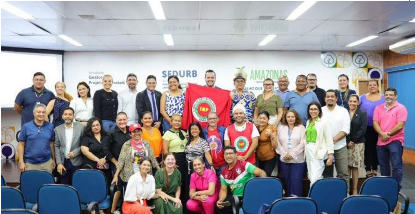
Comissão vai organizar todo o processo da 6ª Conferência das Cidades etapa Manaus, de modo a dirimir dúvidas