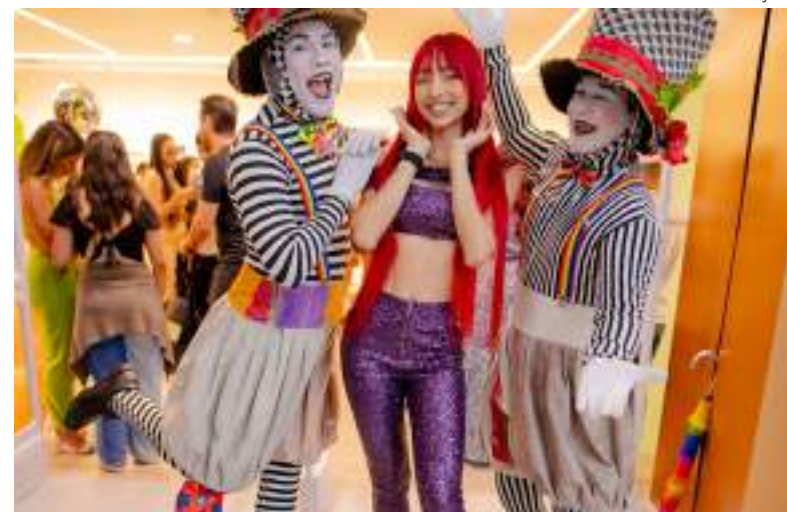
"Ruivinha de Marte" alegrou evento no Shopping Sumaúma