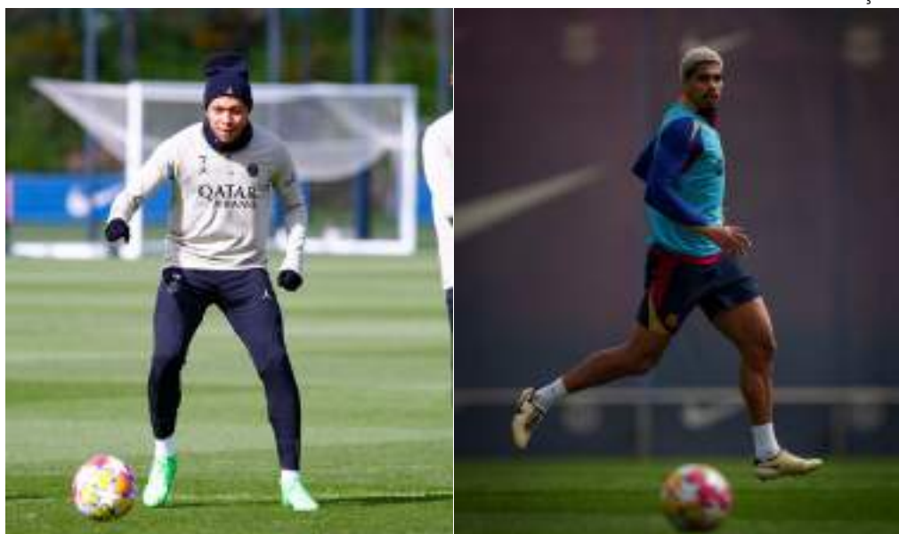
Mbappé vive últimas dias como jogador do PSG e o zagueiro Ronald Araújo quer parar o francês