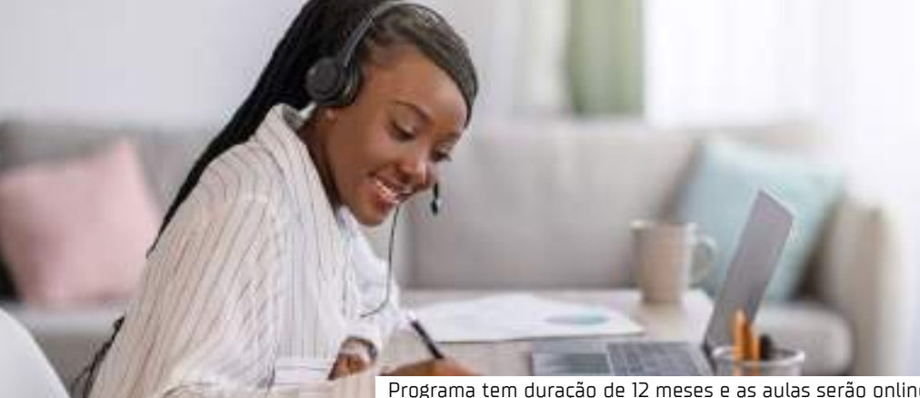
Programa tem duração de 12 meses e as aulas serão online

"O curso atua como uma ponte entre sonhos e realidade, oferecendo um caminho para que pessoas que antes viam a carreira em TI como algo distante possam agora trilhar um percurso concreto em direção ao sucesso", afirma Guedes, que nesta edição conta com o apoio da Méliuz, iFood e Instituto Localiza.