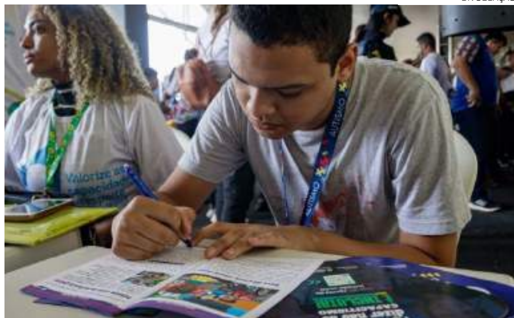
Carteira para pessoas com TEA é um direito no Amazonas, previsto na Lei Estadual nº 5.403/21