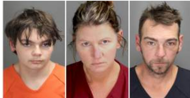
Júri considerou casal culpado por ter dado arma de Natal ao adolescente