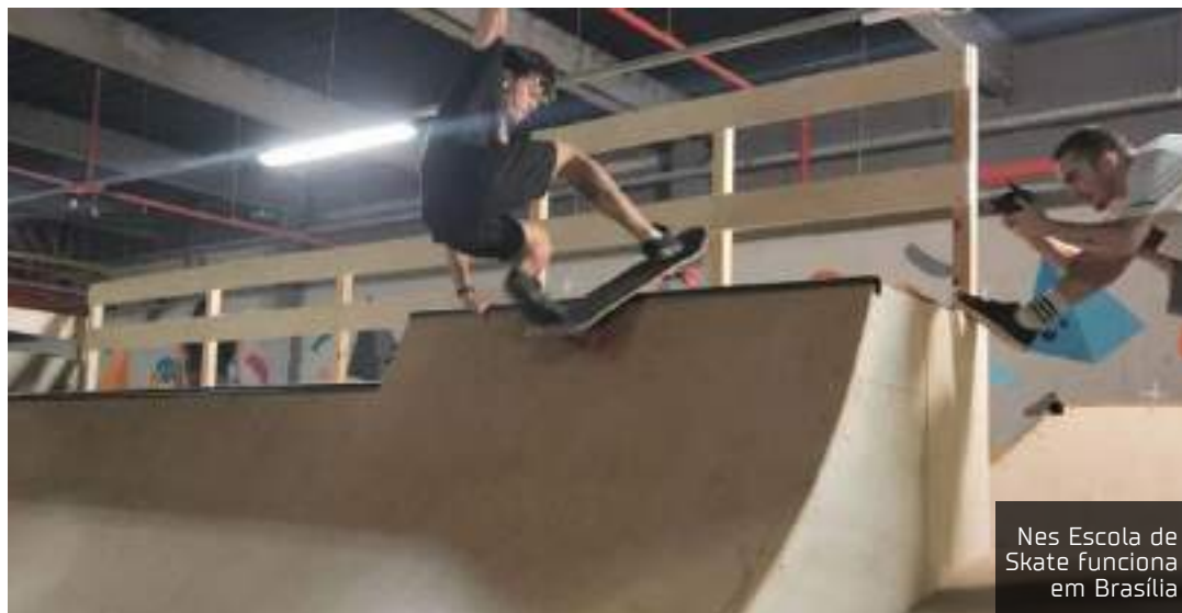
Nes Escola de Skate funciona em Brasília

"Nas últimas olimpíadas, tivemos uma procura imensa e muitas matrículas. Aproveitamos para realizar eventos de rua, sendo um deles para meninas no Parque da Cidade. Penso que foi um momento de virada de chave até para as pessoas olharem o skate de uma maneira mais positiva. Estar nas Olimpíadas é uma chance a prática, inclusive como uma oportunidade de profissionalização e carreira", pontuou.