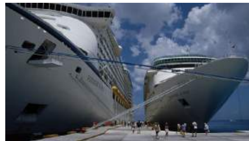
Esforço para atrair investimentos no setor de turismo