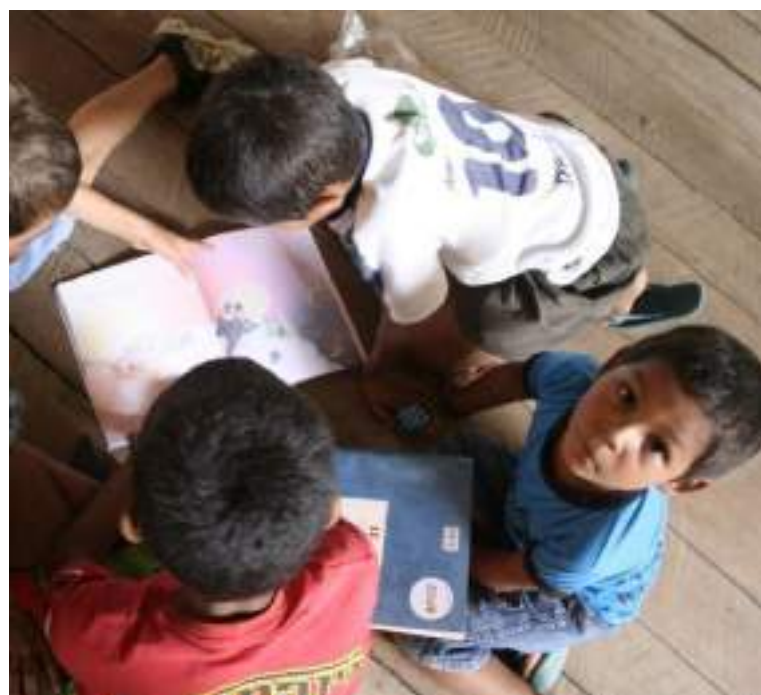
Bemol e Vaga Lume atuam em esforço conjunto para apoiar crianças