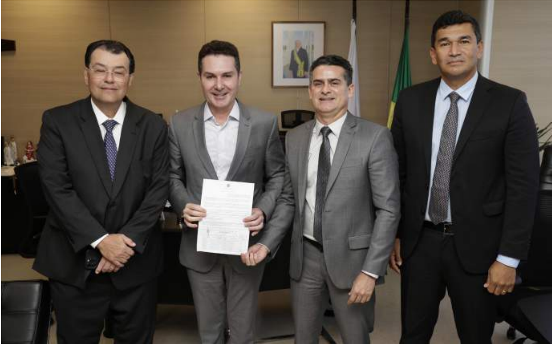
Prefeito David Almeida assinou convênio com Governo Federal na presença do ministro de Cidades, Jader Filho, em Brasília (DF)

As 1.056 unidades habitacionais fomentam a implantação do maior programa habitacional da capital amazonense realizado por