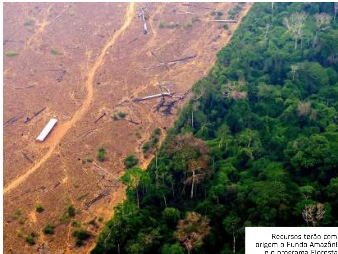
Recursos terão como origem o Fundo Amazônia e o programa Floresta+

Presente no lançamento do programa, o ministro das Relações Institucionais, Alexandre