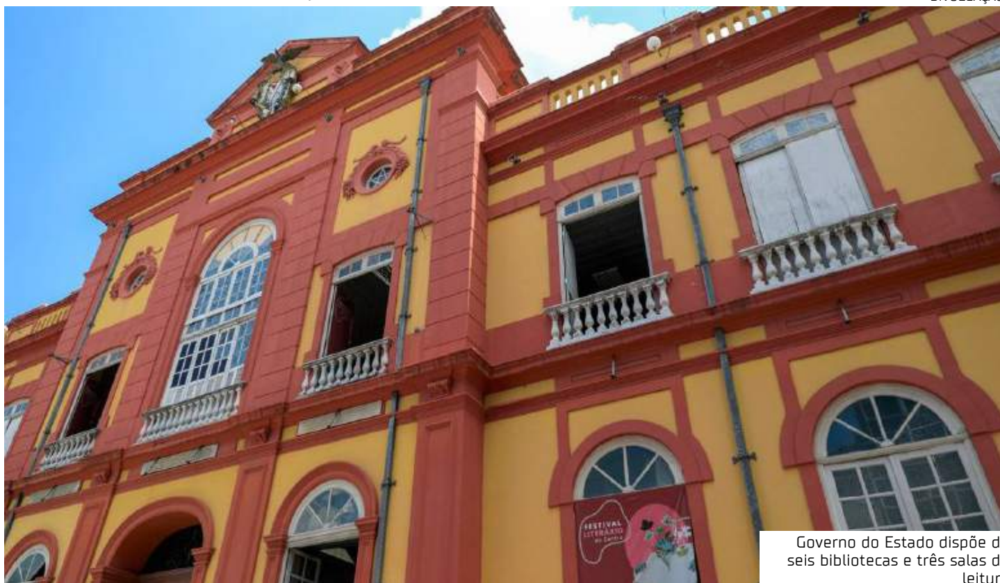
GOVERNO DO ESTADO Governo do Estado dispõe de seis bibliotecas e três salas de leitura

A Biblioteca Genesino Braga está localizada no Centro Cultural Anibal Beça, na avenida Autaz Mirim, 9018 - Novo Aleixo, zona norte. Já a Biblioteca Thalia Phedra Borges dos Santos está instalada no Palácio Rio Branco, na avenida Sete de Setembro, s/n - Praça D. Pedro II, zona sul. Ambas funcionam de segunda a sexta, das 9h às 15h.