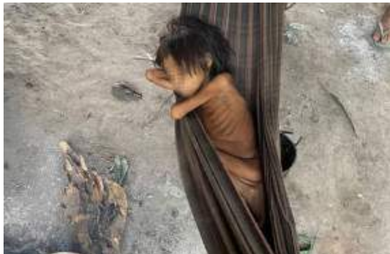
Criança Yanomami com desnutrição e malária, na aldeia Maimasi