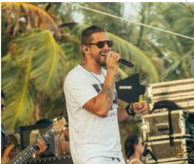
Show exclusivo da Banda Eva será, nesta quarta-feira (10), no Armazém XV