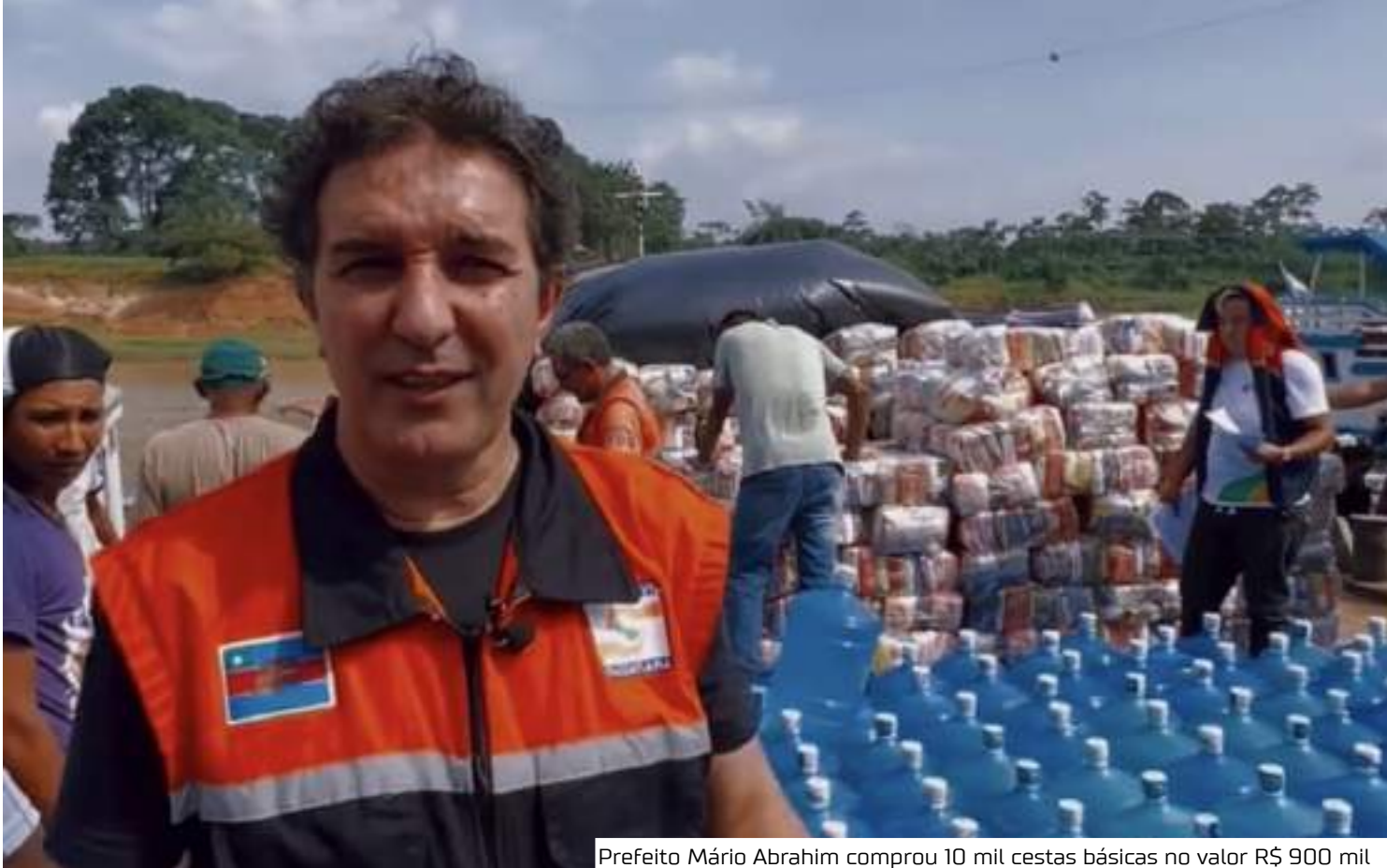
Prefeito Mário Abraham comprou 10 mil cestas básicas no valor R$ 900 mil

"Eu estive no mesmo estabelecimento comprando todos os mesmos itens com valor de varejo, não foi nem preço de atacado que saiu muito mais barato. Está aqui a notinha meus amigos paguei apenas R$ 197,55 nos mesmos itens. Dá uma diferença de mais de R$ 900 mil. Com esse valor a gente poderia