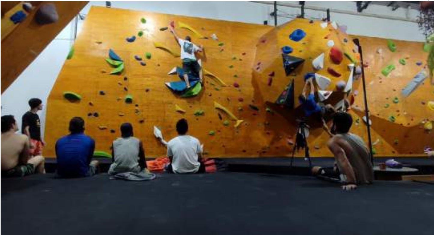
República dos Macacos, academia de escalada em São Paulo

Ela acrescenta que a escalada chama atenção principalmente de um público mais jovem, que possui mais flexibilidade e menos medo de encarar paredes de 4 a 5 metros de altura, sem auxílio de cordas, característica do bouldering. Já o público mais adulto, ela conta, gosta de participar de competições entre