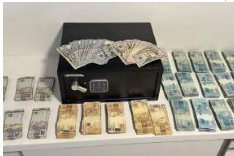
Entre os presos estão três vereadores de municípios paulistas