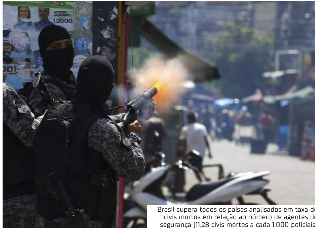
Brasil supera todos os países analisados em taxa de civis mortos em relação ao número de agentes de segurança (11,28 civis mortos a cada 1.000 policiais)

Para realizar o levantamento, os pesquisadores utilizaram dois tipos de fontes, bancos de dados públicos oficiais e números produzidos a partir de veículos da imprensa. Nem todos os países possuem dados de ambas as fontes. No