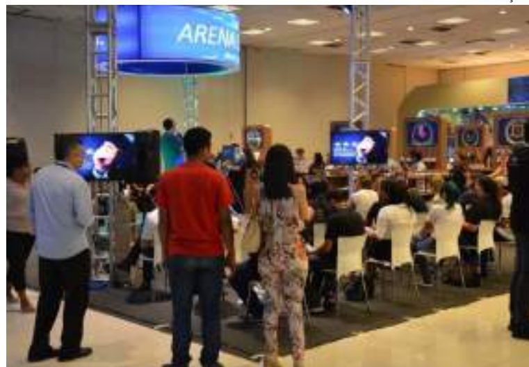
Evento gratuito promovido pelo Sebrae-AM em Manaus