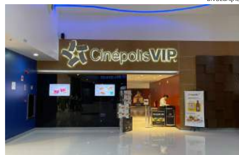
“Quarta Cinépolis” começa hoje (17) no Shopping Ponta Negra