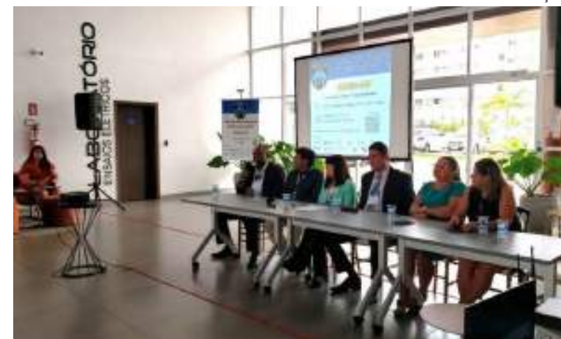
Encontro discute desenvolvimento de energias renováveis na região