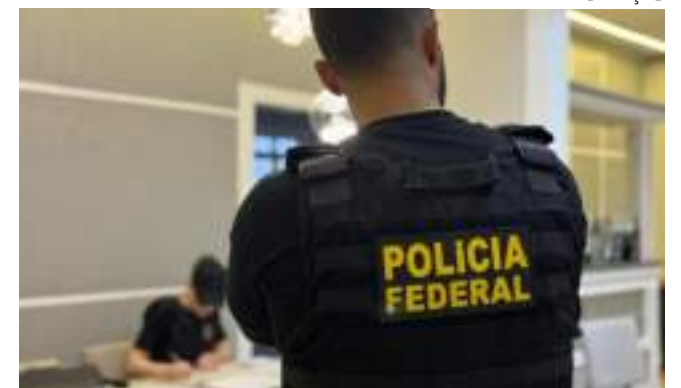
Penas dos crimes de tráfico de drogas podem ultrapassar 30 anos