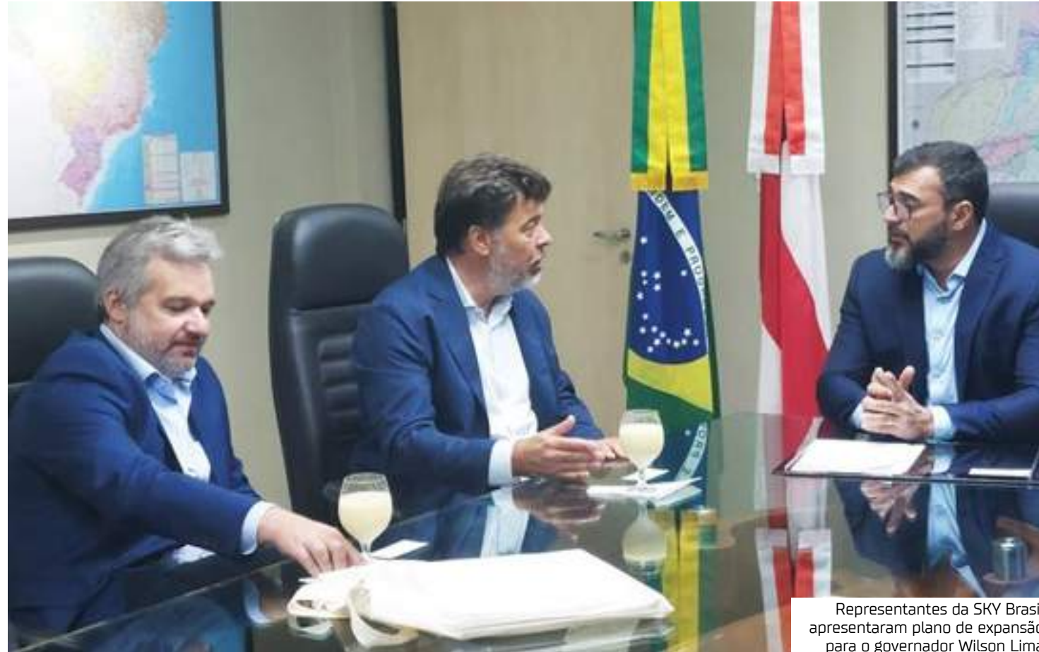
Representantes da SKY Brasil apresentaram plano de expansão para o governador Wilson Lima

"Há muitos Brasis dentro do Brasil e a SKY conhece muito bem isso porque está presente em 99% dos municípios deste país de dimensões