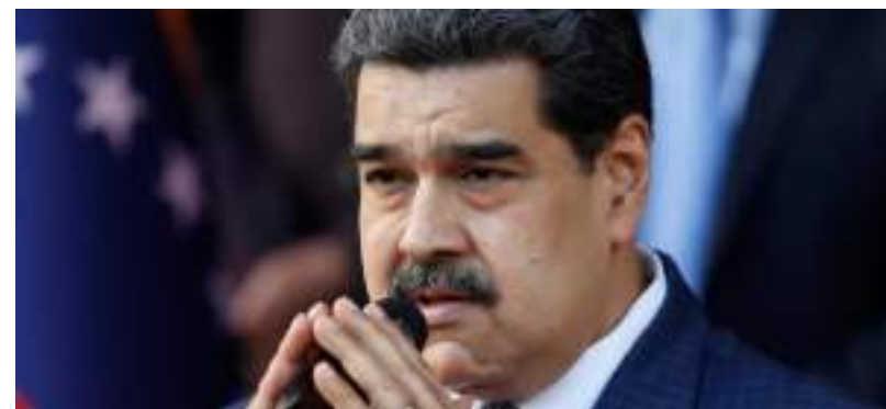
Asilo político do ex-vice-presidente do Equador deve ser reconhecido