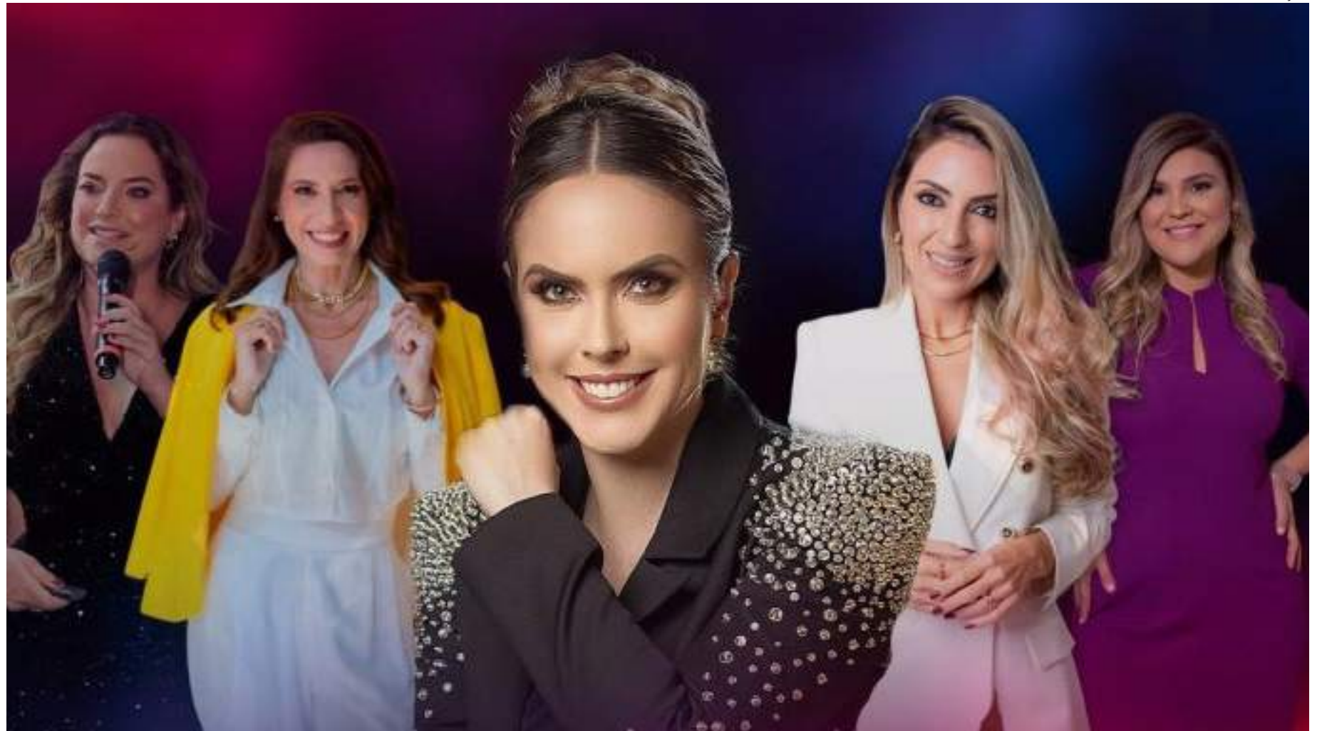
Evento ocorrerá na cobertura do Tropical Executive Hotel e reunirá profissionais de diversas áreas