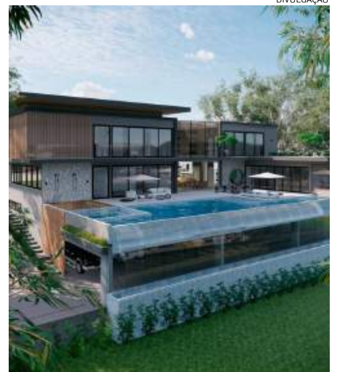
Amazonas sai na frente dos outros do Norte com a oferta de imóveis

O Quintas de São José do Rio Negro caminha para ser o maior condomínio do país em cidades com até 2 milhões de habitantes. Com apenas 180 lotes, em tamanhos a partir de 1.500 metros quadrados, os proprietários desfrutarão de uma área verde preservada, garantindo uma verdadeira floresta particular em seu entorno, próximo à área urbana. O empreendimento também conta com energia subterrânea e vias com piso intertravado, representando uma inovação na construção civil do Estado.