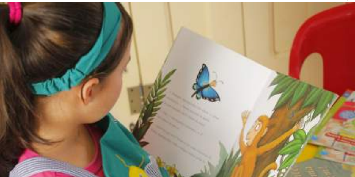
Incentivo à literatura infantil na biblioteca municipal João Bosco Pantoja