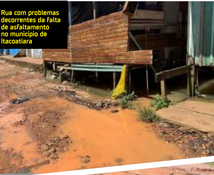
Rua com problemas decorrentes da falta de asfaltamento no município de Itacoatiara

do alagamento, que também se junta à água contaminada aos dejetos humanos.