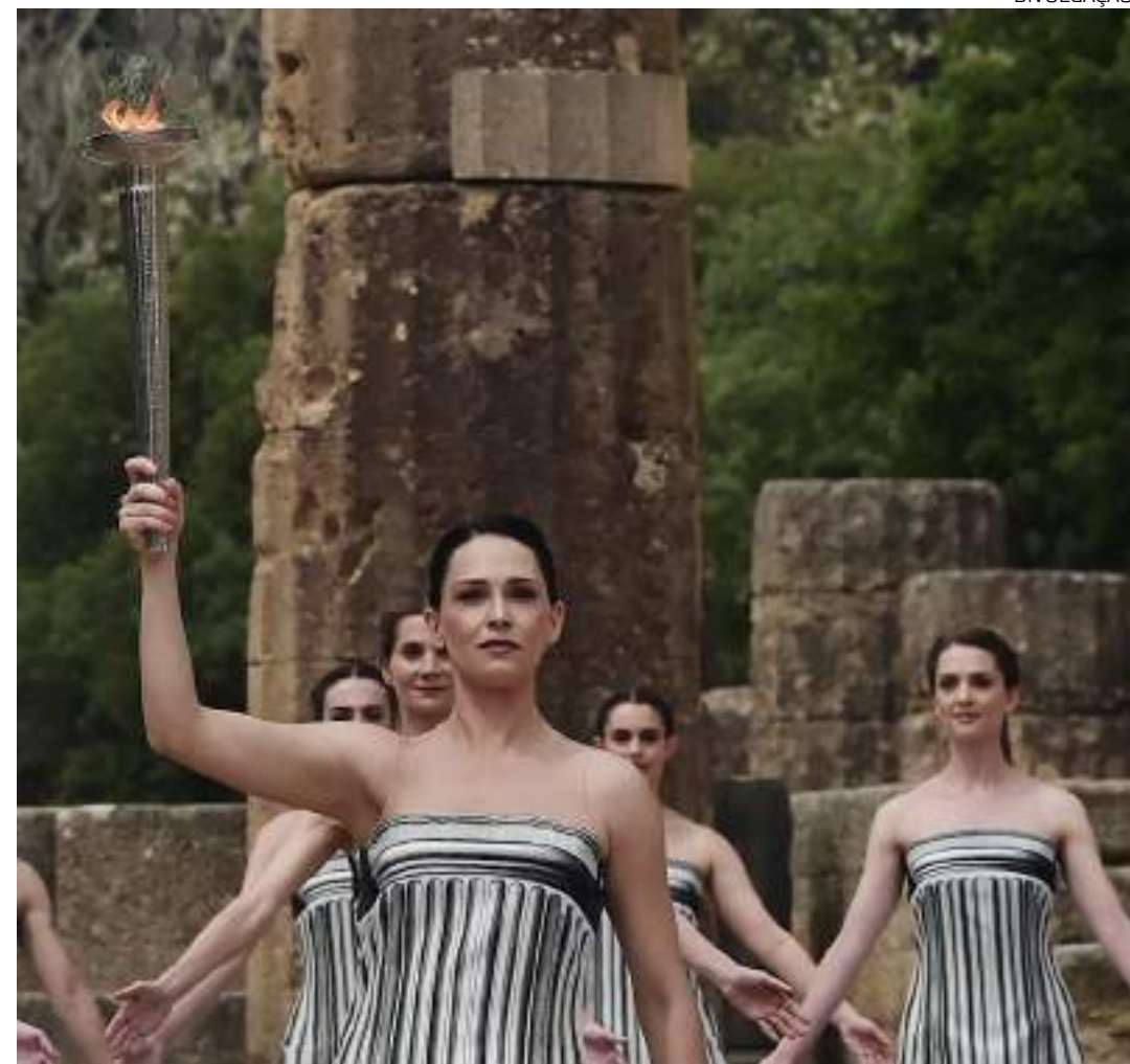
Acendimento inspira e reforça a iniciativa do Governo com o Projeto Amazonas nas Olimpíadas de Paris 2024