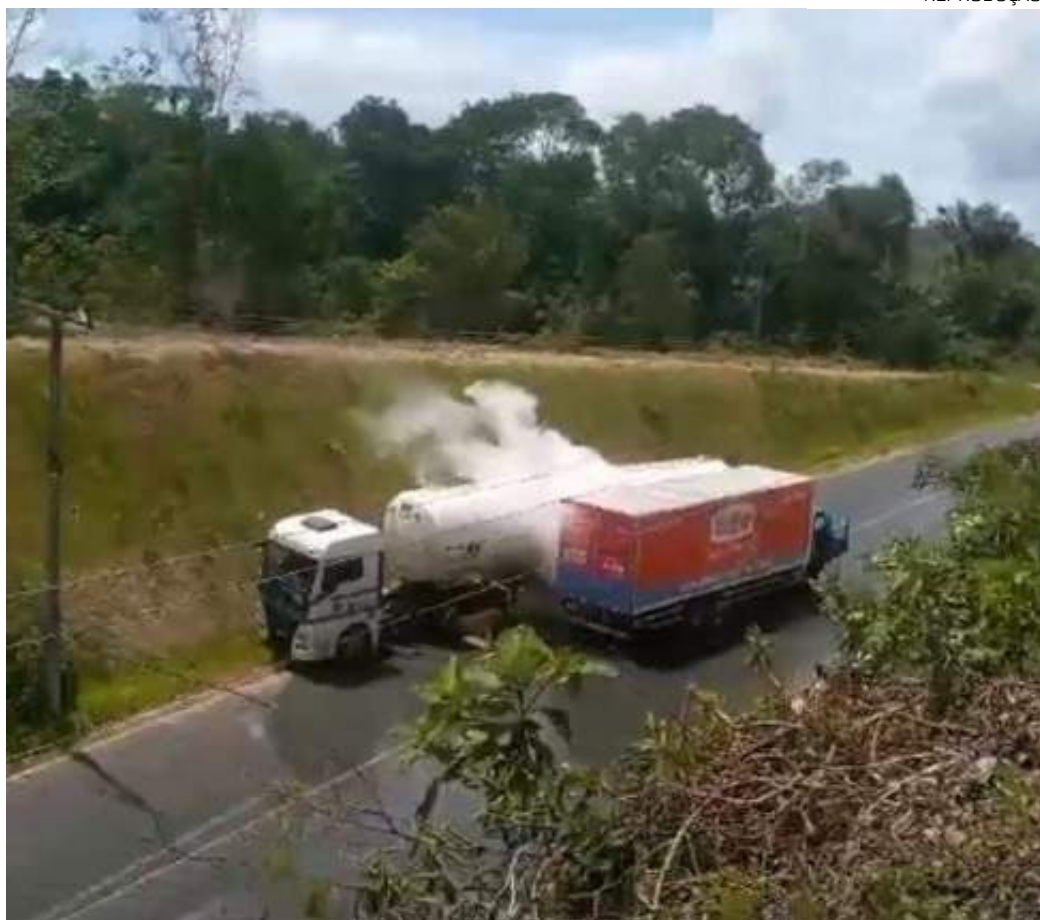
Acidente ocorreu no KM 125 e, após a colisão, um vazamento de gás tomou conta do local