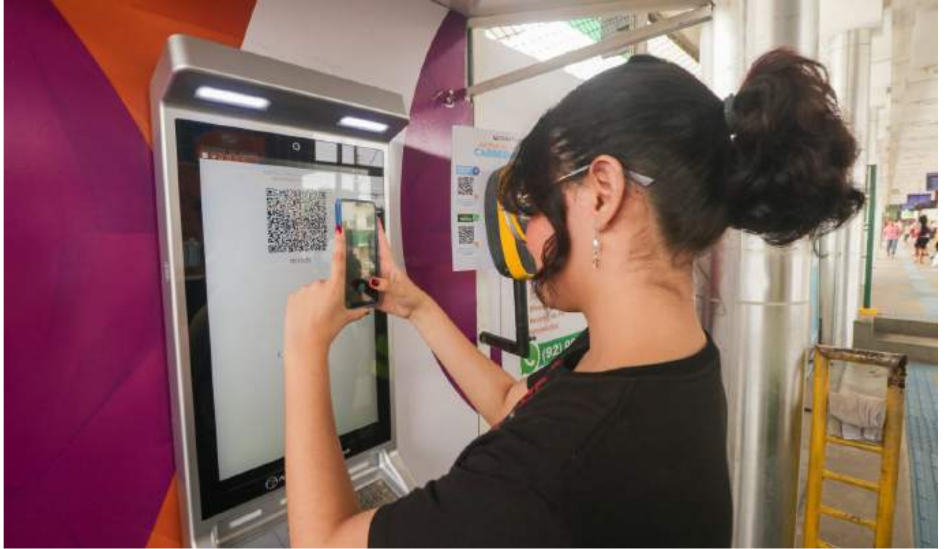
Prefeitura de Manaus tem investido constantemente em tecnologias para tornar o sistema de bilhetagem eletrônica uma ferramenta acessível, ágil e que facilite o dia a dia da população

No primeiro momento, duas máquinas de autoatendimento (ATM) foram instaladas nos Terminais de