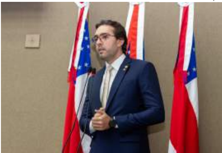
Proposta de Thiago Abraham beneficia bons condutores

"O nosso projeto de Lei foi elaborado no ano passado com muito carinho, por entendermos que o bom condutor merece um incentivo para continuar mantendo a boa educação no trânsito e evitar, por tanto, o envolvimento em acidentes. Na época, apesar do nosso projeto ter sido aprovado por unanimidade na Aleam, não foi sancionado pelo governador, por entender que se