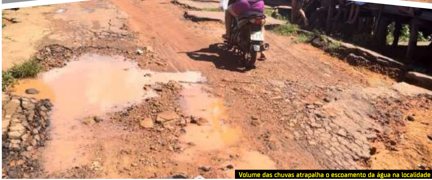
Volume das chuvas atrapalha o escoamento da água na localidade

do alagamento, que também se junta à água contaminada aos dejetos humanos.