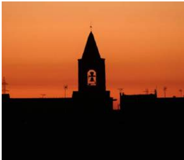
Vista da torre de uma igreja no norte de Barcelona, na Espanha