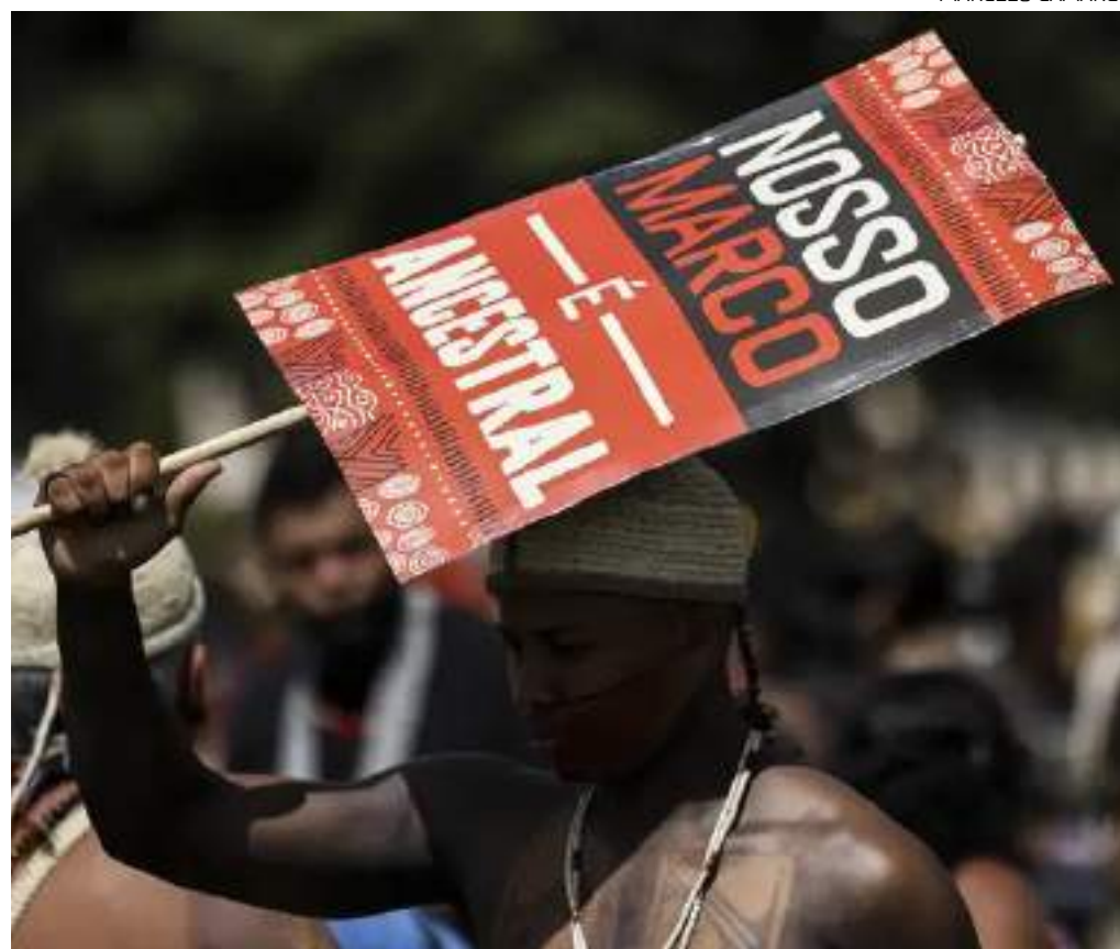
Medida foi determinada pelo ministro do STF Gilmar Mendes

Na decisão desta segunda-feira, o ministro Gilmar Mendes argumenta que, ao analisar preliminarmente a Lei 14.701, verificou que, aparentemente, diversos aspectos da lei "podem ser lidos em sentido contrário ao entendimento" inicial do Plenário do STF.