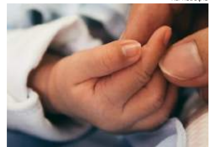
Inquérito foi instaurado e o caso é investigado pela PC-AM