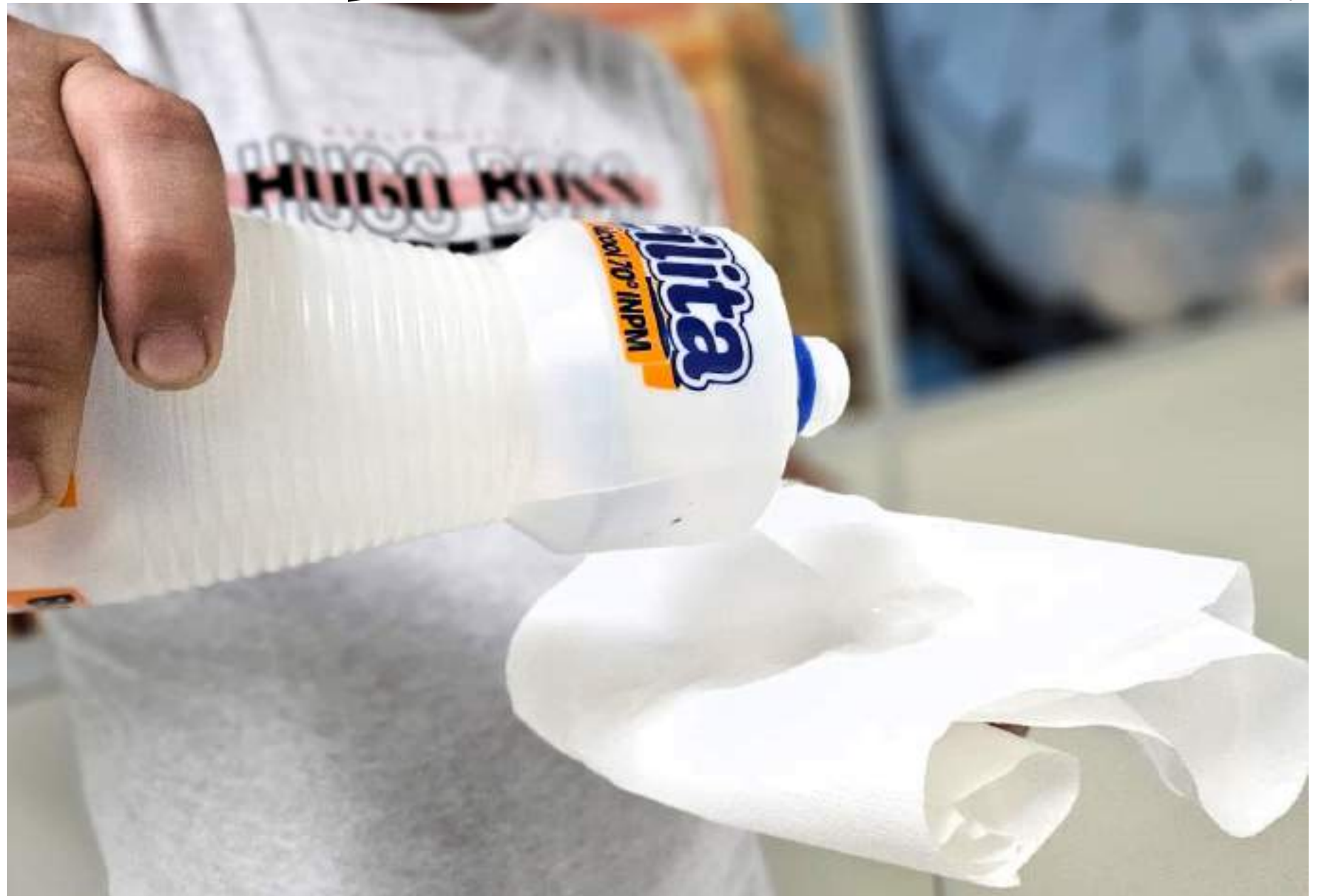
Até dia 30 de abril, estabelecimentos comerciais que ainda tiverem o produto podem vender e, assim, esgotá-los, de forma que atendam à legislação sanitária

A restrição se limita ao produto na forma líquida e, mesmo após o dia 30 de abril, a população continuará