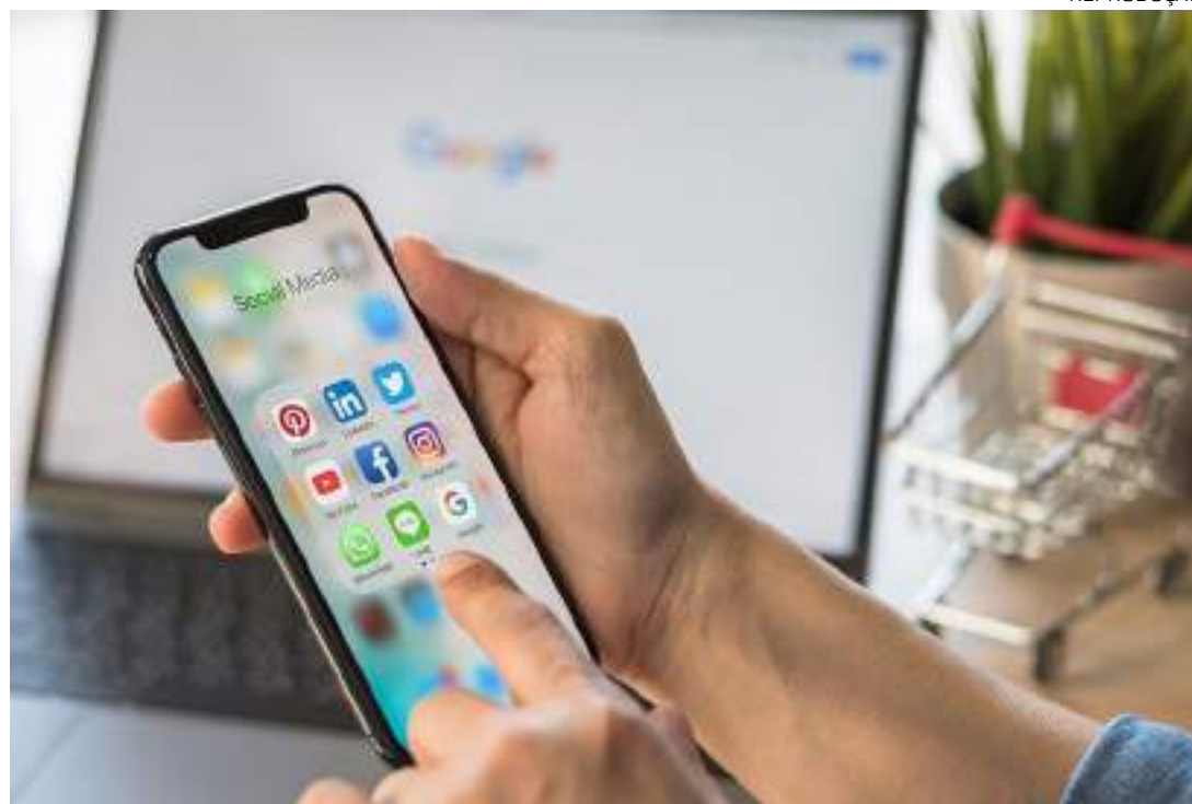
Escritórios de advocacia vêm recebendo cada vez mais casos de queixas relacionadas aos bloqueios

Com o aumento do uso dessas plataformas, os escritórios de advocacia vêm recebendo cada vez mais casos de queixas como estas, como é o caso do Escritório Guerra Pelo Consumidor, que recebe