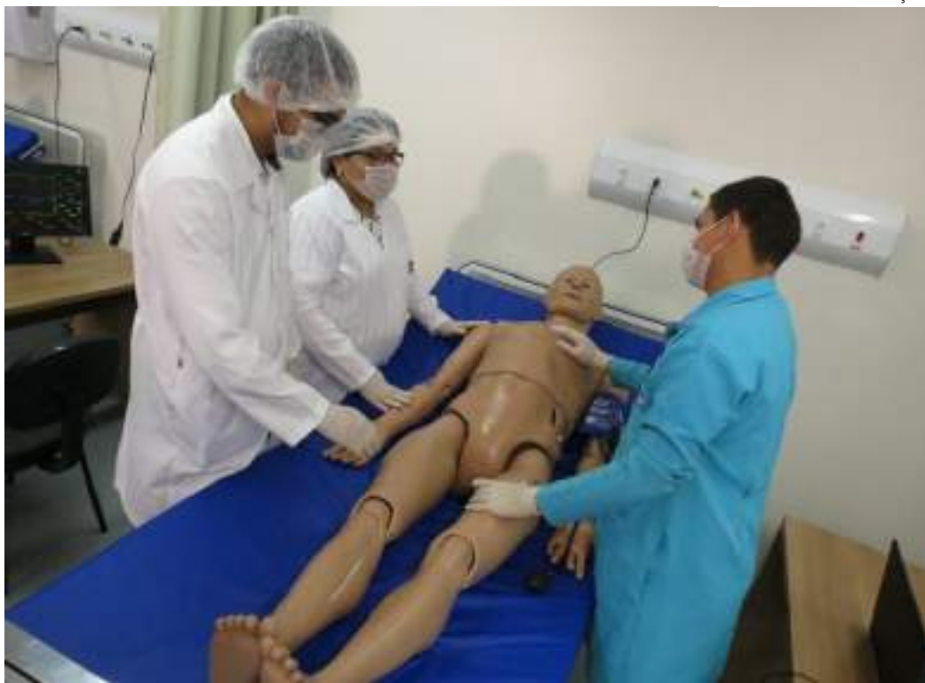
Entre os dias 17 a 19 de abril, avaliadores do MEC estiveram na instituição para uma análise