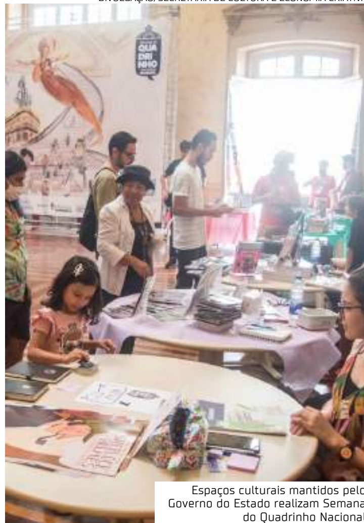
Espacos culturais mantidos pelo Governo do Estado realizam Semana do Quadrinho Nacional