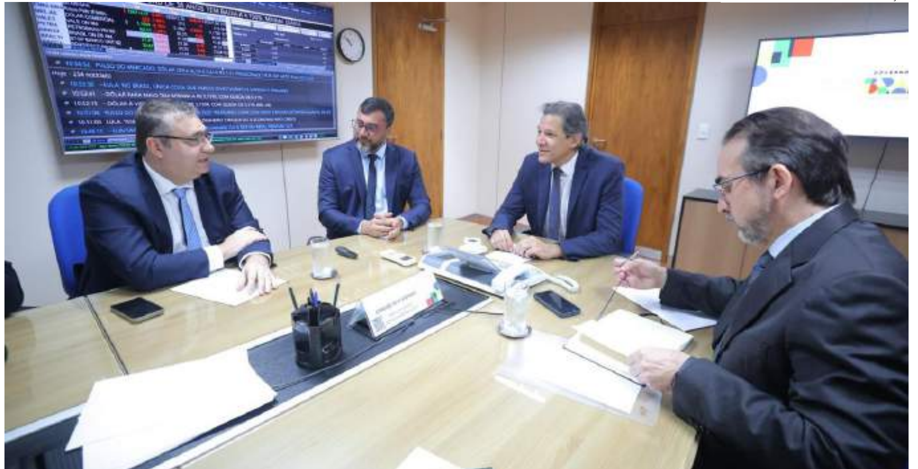
Governador reforçou a Fernando Haddad a importância da segurança jurídica do modelo que emprega mais de 120 mil pessoas

"A gente veio tratar especificamente da parte que diz respeito à Zona Franca de Manaus e esses ajustes. Há o compromisso de que eles sejam efetivamente concretizados", destacou Wilson Lima. "Estamos trabalhando para que tanto os trabalhadores da Zona Franca quanto os investidores fiquem tranquilos com relação às Leis Complementares e à regulamentação da nova reforma tributária", completou o governador.