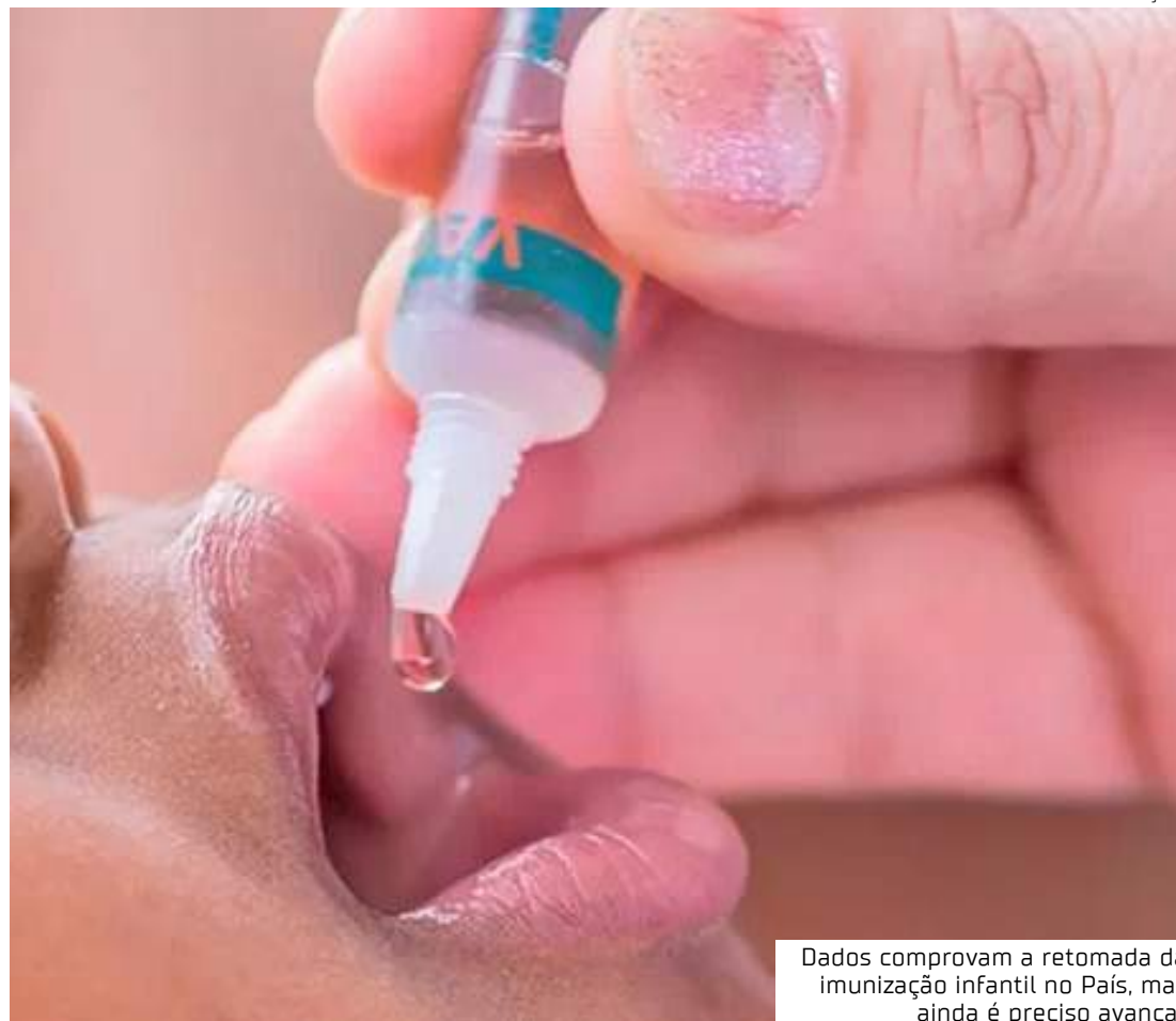
Dados comprovam a retomada da imunização infantil no País, mas ainda é preciso avançar

Para contribuir com esse esforço nacional, o Unicef no