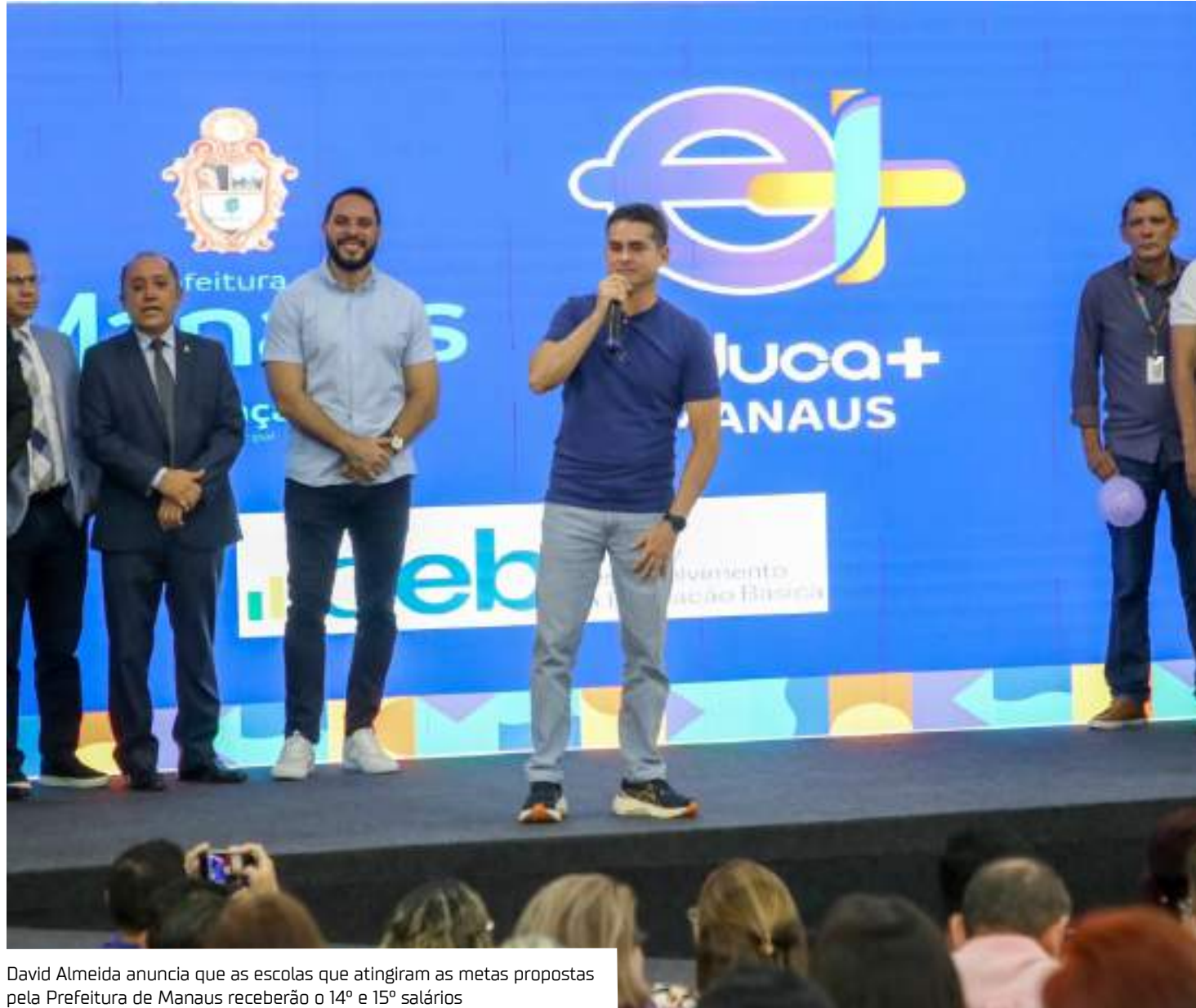
David Almeida anuncia que as escolas que atingiram as metas propostas pela Prefeitura de Manaus receberão o 14º e 15º salários

No último Ideb, em 2021, a rede municipal de educação ficou com 5,5 nos anos iniciais e 4,8 nos finais. Para buscar o crescimento no índice, a Semed criou o "Educa+Manaus", um programa revolucionário, que