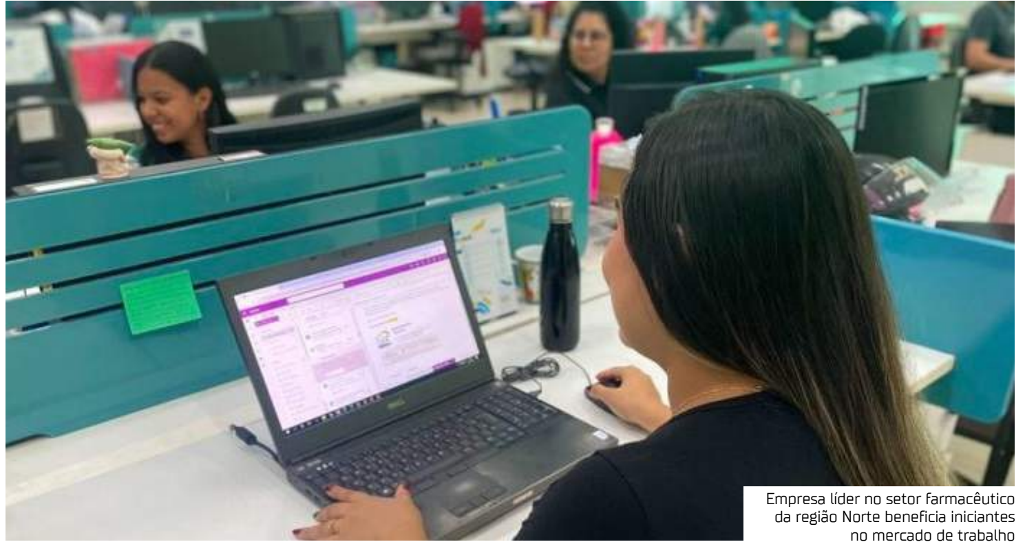
Empresa líder no setor farmacêutico da região Norte beneficia iniciantes no mercado de trabalho

"Quando fui contratada, tive um sentimento muito grande de gratidão, de muita felicidade pelo reconhecimento do trabalho que realizei como jovem aprendiz. Hoje, eu atuo na função de compradora e tenho uma rotina dinâmica, que inclui desde reuniões de estratégia e negociações até acompanhamento de pedidos e entregas", destaca.