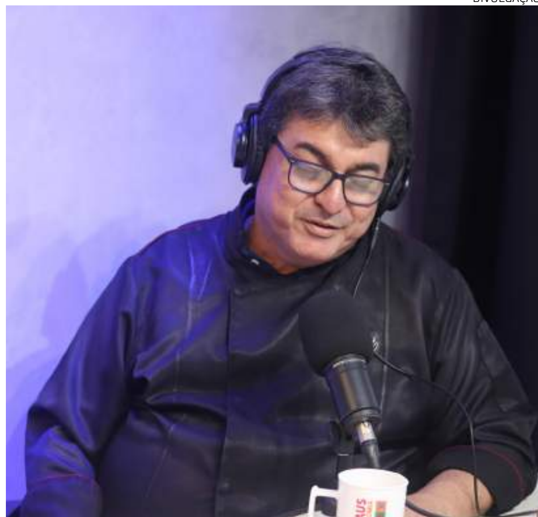
Radialista lançou seu podcast com entrevistas exclusivas de profissionais da gastronomia