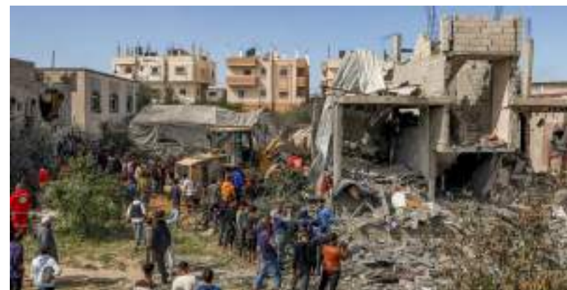
Hamas fez vítimas e sequestrou reféns de diferentes nacionalidades