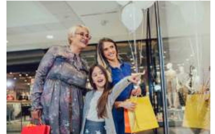
Consumidores de Manaus pretendem comprar presentes

O Cartão de Crédito é a opção mais escolhida pelos consumidores na hora de realizar o pagamento, totalizando 46% das respostas. Em segundo lugar, aparece a modalidade à vista (dinheiro/pix) com 31% da preferência. Em 2023, o pagamento à vista aparecia na terceira posição com 21%. Ocupando o terceiro e quarto lugares, estão as opções crediário/carnê/cartão da própria loja (13%) e cartão de débito (10%).