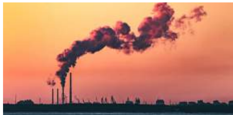
Simon Stiell cobrou ações de governos, líderes empresariais e bancos