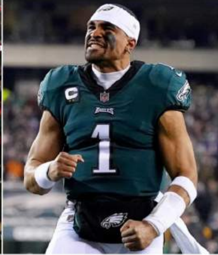
Jordan Love, quarterback do Green Bay Packers, e Jalen Hurts, quarterback do Philadelphia Eagles, são as estrelas das duas equipes