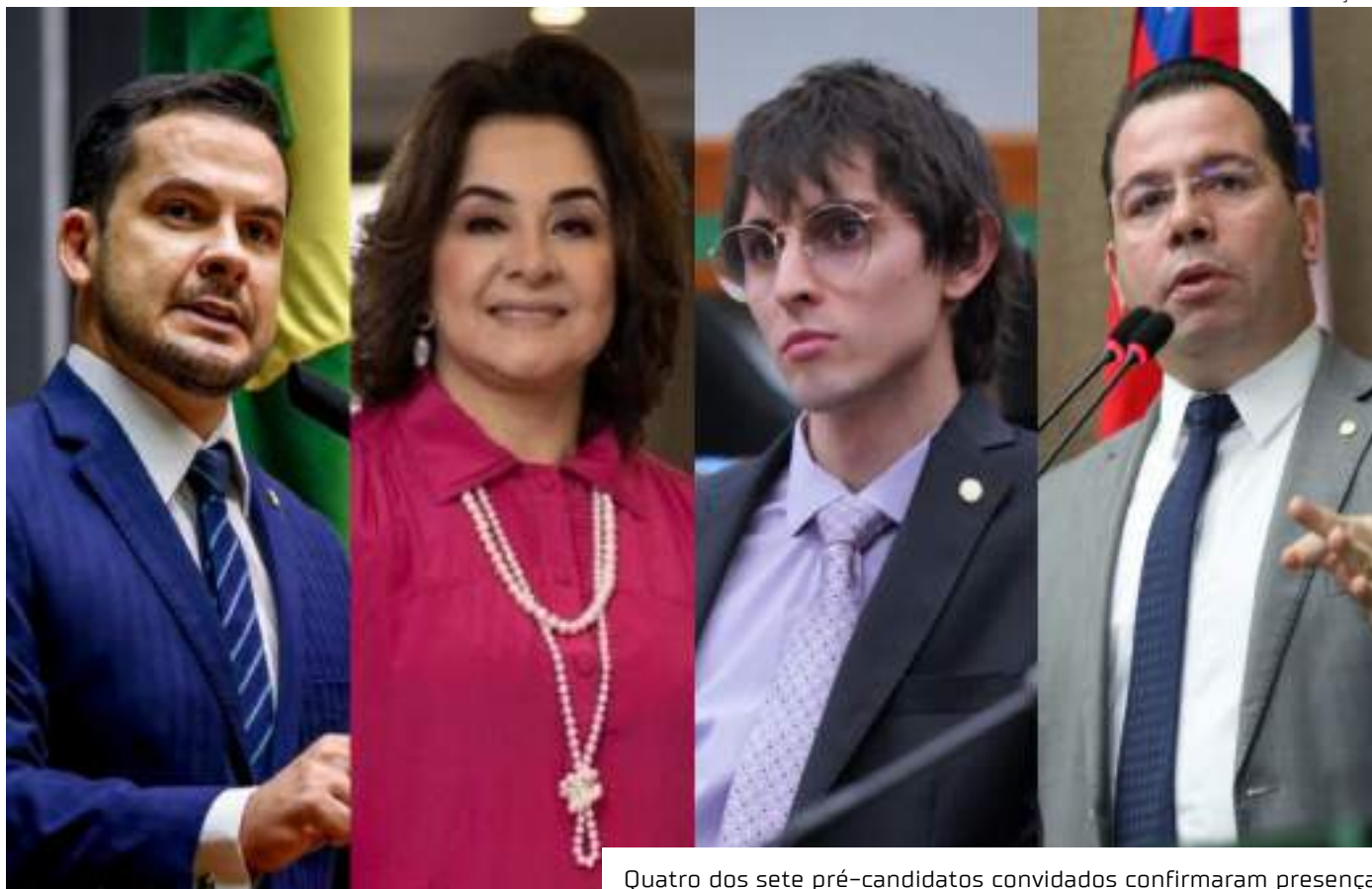
Quatro dos sete pré-candidatos convidados confirmaram presença