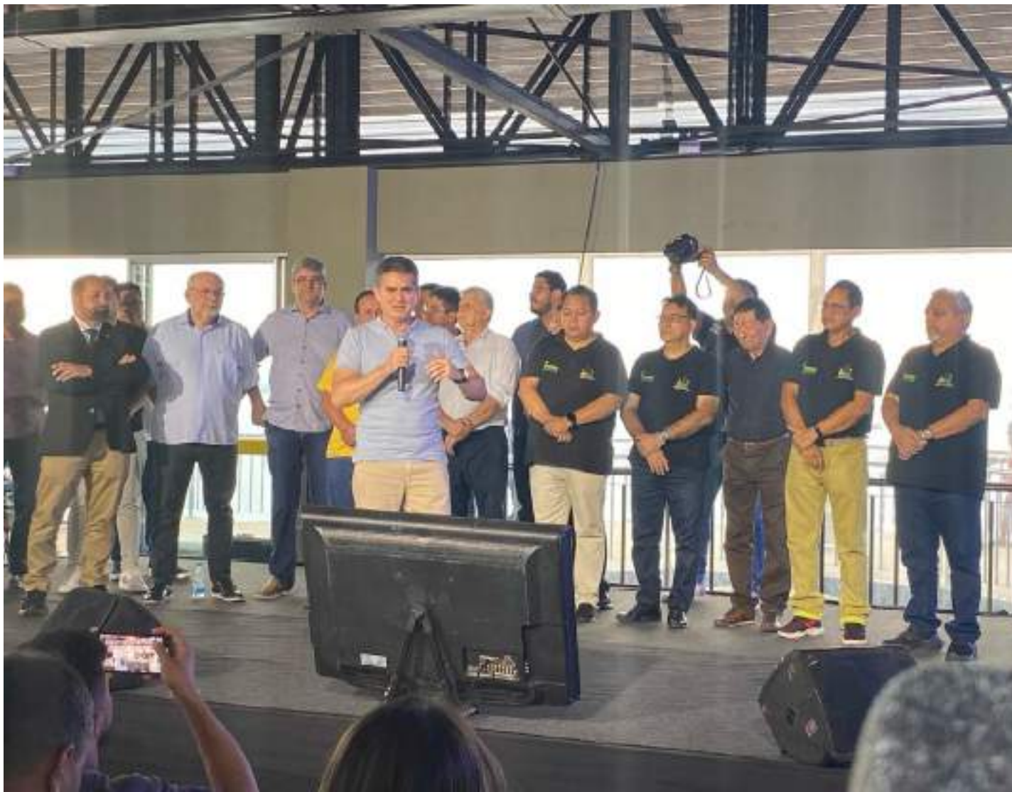
De acordo com o prefeito, o contrato da participação de Taya no evento evangélico será firmado nos próximos dias

"Nos próximos dias estaremos fechando contrato, junto aos patrocinadores. Iremos realizar o maior evento musical gospel desta cidade", salientou o prefeito da capital amazonense no evento de anúncio.