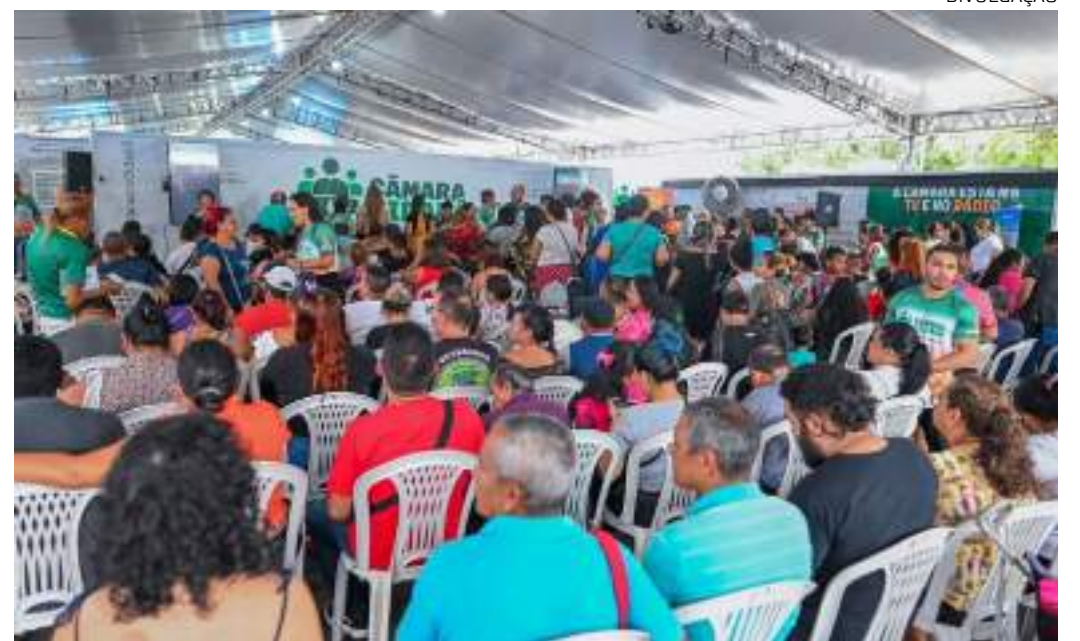
Mais de 50 parceiros estão confirmados na 4ª edição do projeto, nesta quinta (11) e sexta-feira (12)

Órgãos do Governo Federal, Governo do Estado, Prefeitura de Manaus, empresas, associações, universidades e institutos