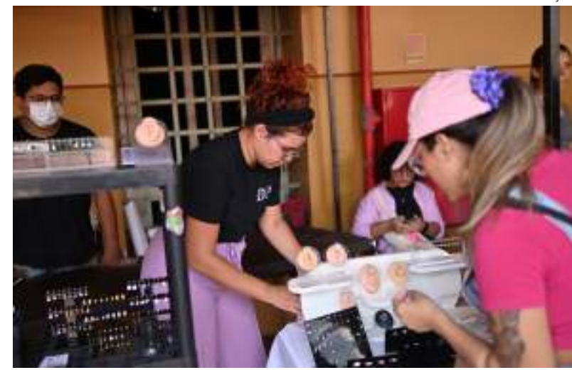
Programação inclui exposições, brechós e ações empreendedoras