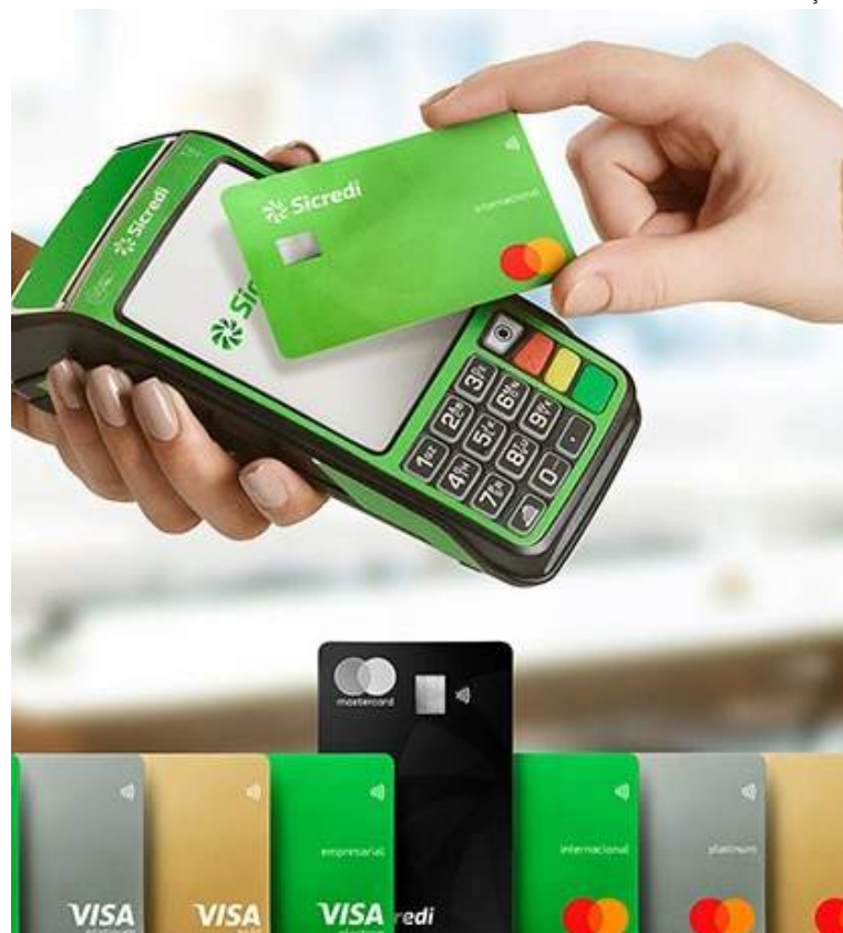
Cooperativa realiza campanha promocional em todas as agências