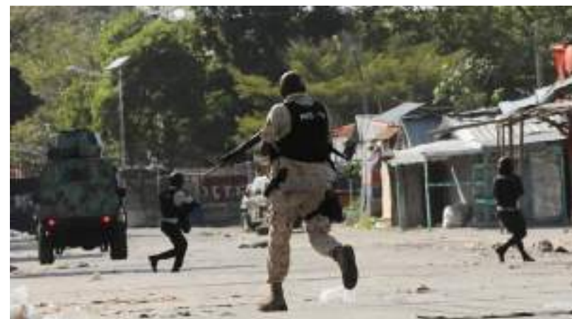
Policiais confrontam gangue durante protesto contra governo