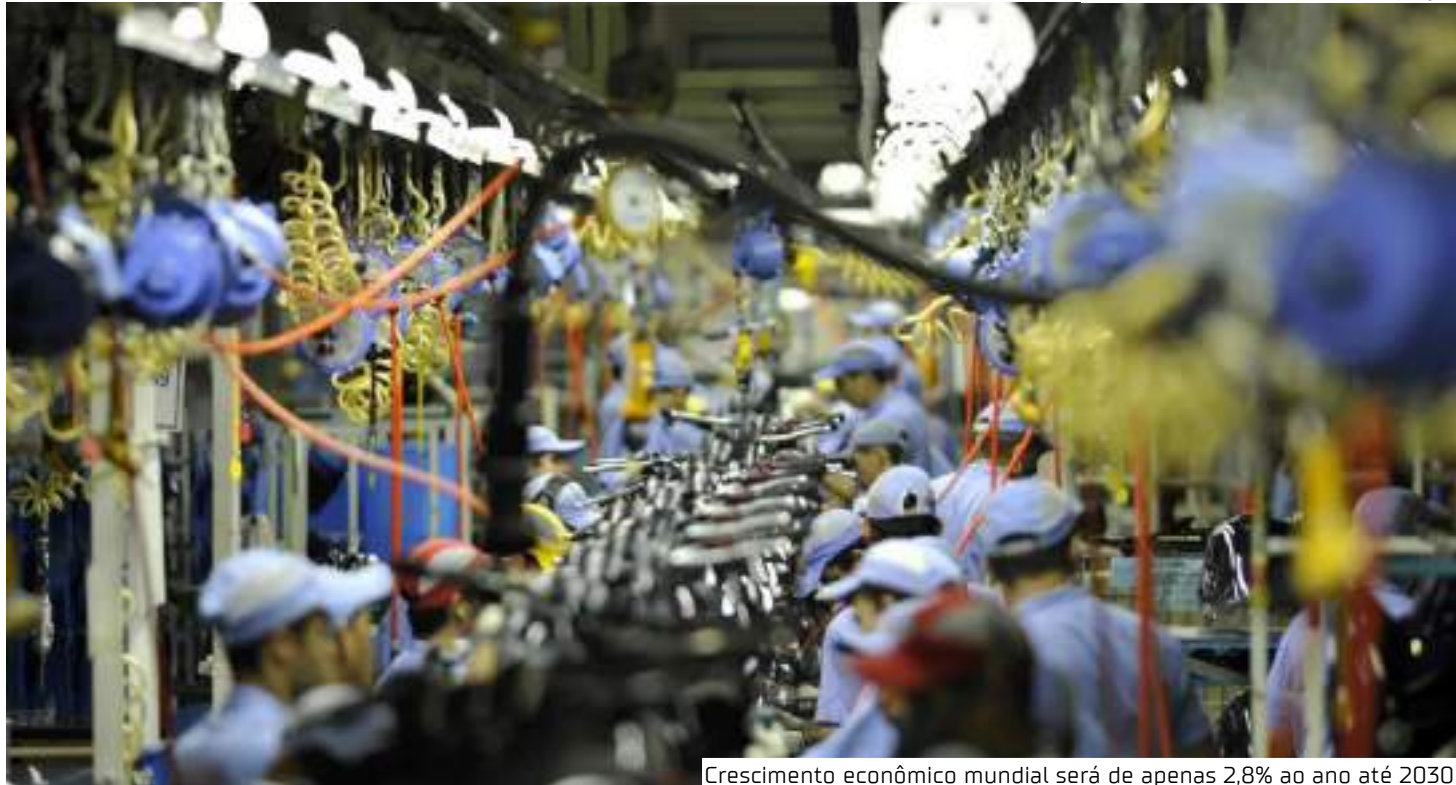
Crescimento econômico mundial será de apenas 2,8% ao ano até 2030

Em 2022, a região foi a única do mundo a aumentar seu IED, segundo o relatório. "Embora tenha beneficiado a maioria dos países da região, esse aumento foi mais notável no Brasil, que consolidou