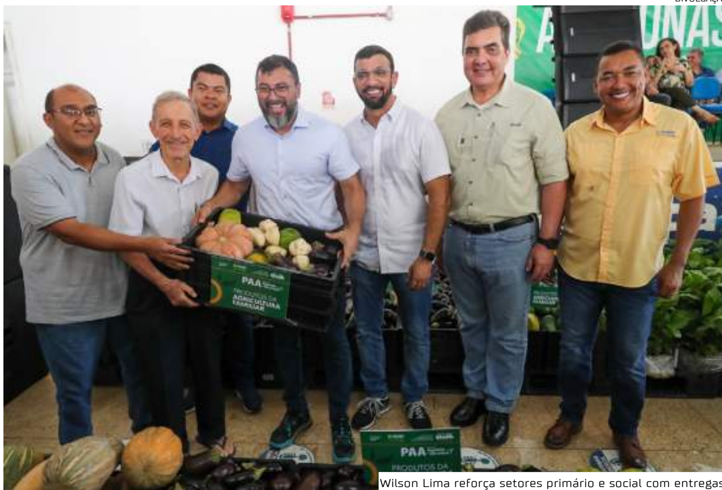
Wilson Lima reforça setores primário e social com entregas