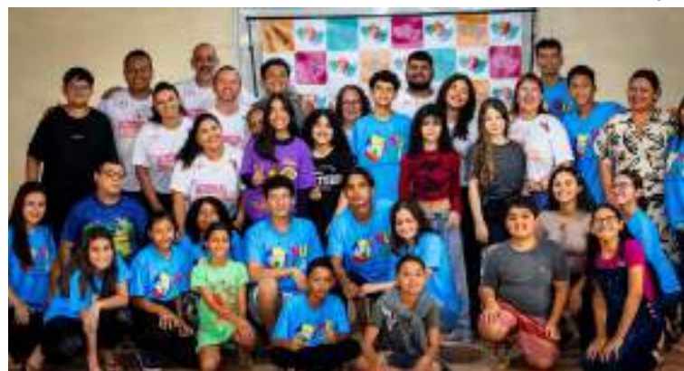
Oficina de iniciação teatral aconteceu em Presidente Figueiredo