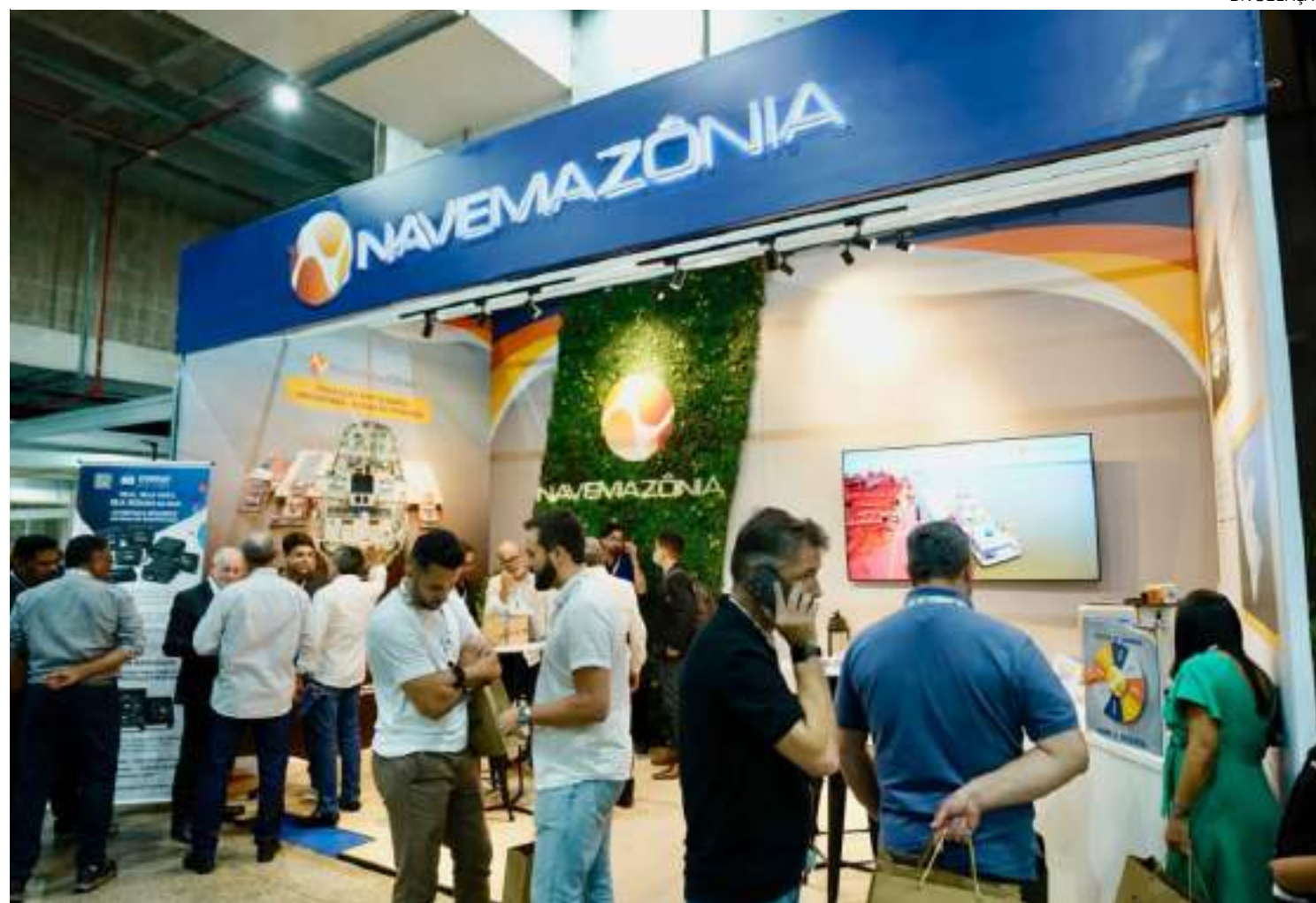
Navemazônia destaca desafios da navegação no Amazonas em primeira edição da feira Navegestic Navalshore

Referência no setor de logística aquaviária, a Navemazônia é responsável