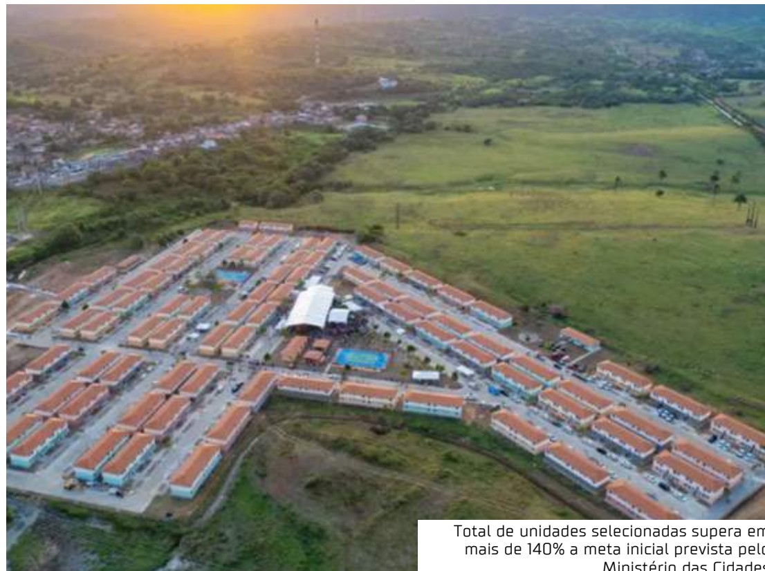
Total de unidades selecionadas supera em mais de 140% a meta inicial prevista pelo Ministério das Cidades

"Pude constatar em cada uma das inaugurações do MCMV Entidades que as casas são maiores, os equipamentos são