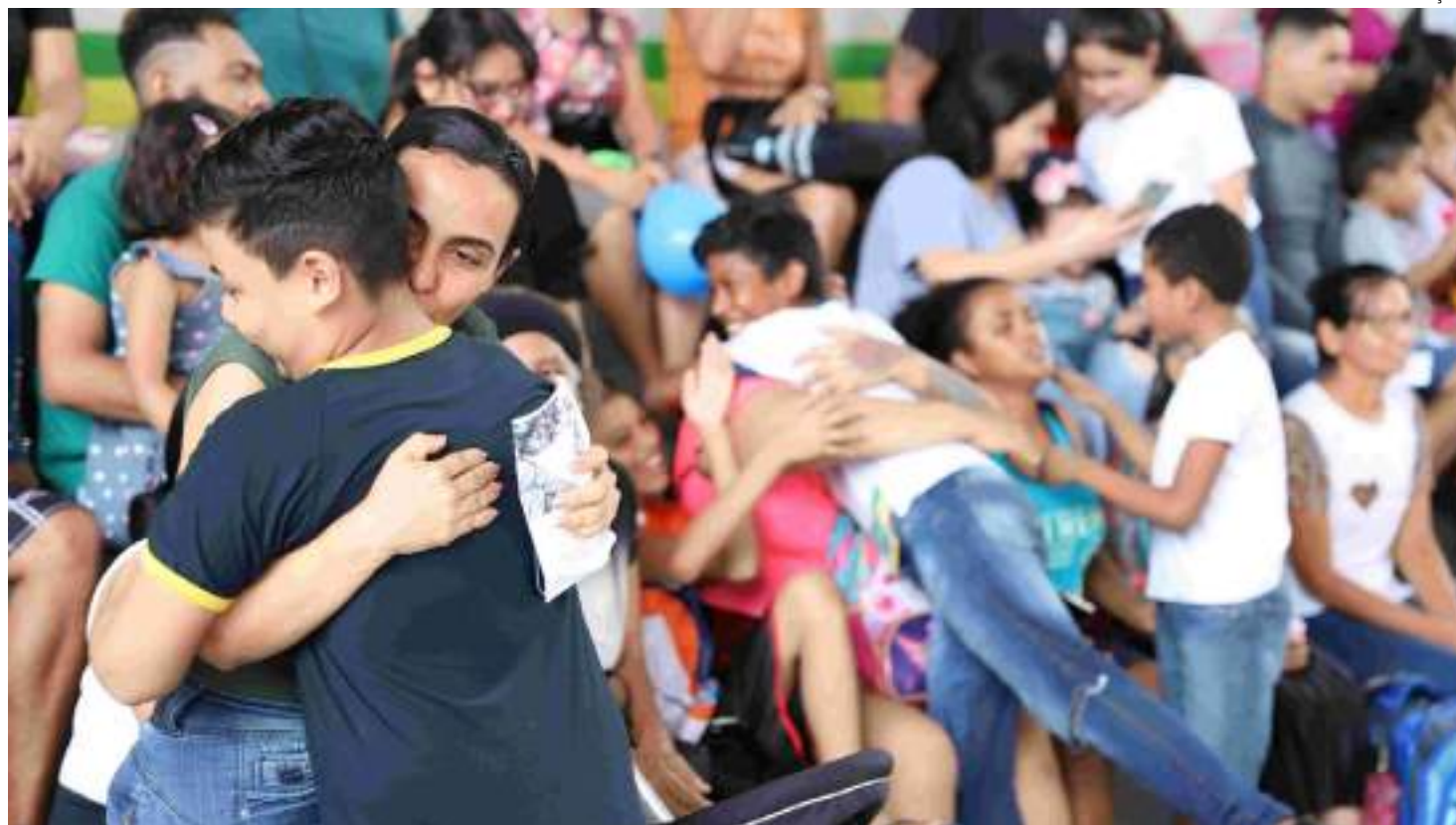
Aproximação da família com a rede estadual é imprescindível, conforme destacou a diretora do Degesc

"O aplicativo simplifica o acesso às informações educa-