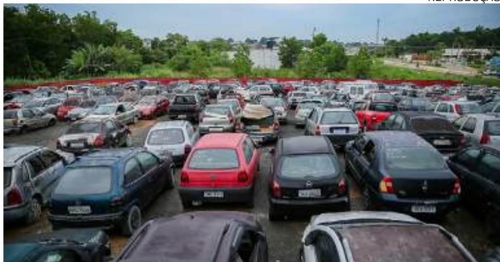
Leilão, que segue sendo feito exclusivamente de forma on-line, ocorrerá no dia 16 de abril