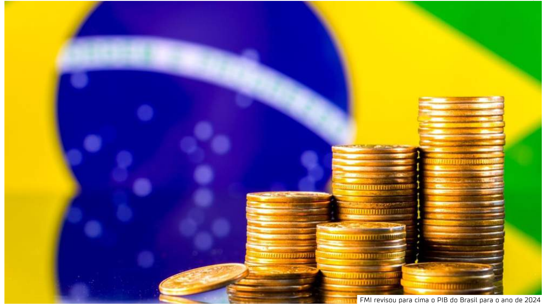
FMI revisou para cima o PIB do Brasil para o ano de 2024

nomias do mundo em 2024, segundo as projeções do FMI: Estados Unidos: US$ 28,78 trilhões; China: US$ 18,53 trilhões; Alemanha: US$ 4,59 trilhões; Japão: US$ 4,11 trilhões; Índia: US$ 3,94 trilhões; Reino Unido: US$ 3,5 trilhões; França: US$ 3,13 trilhões; Brasil: US$ 2,33 trilhões; Itália: US$ 2,33 trilhões; e Canadá: US$ 2,24 trilhões.