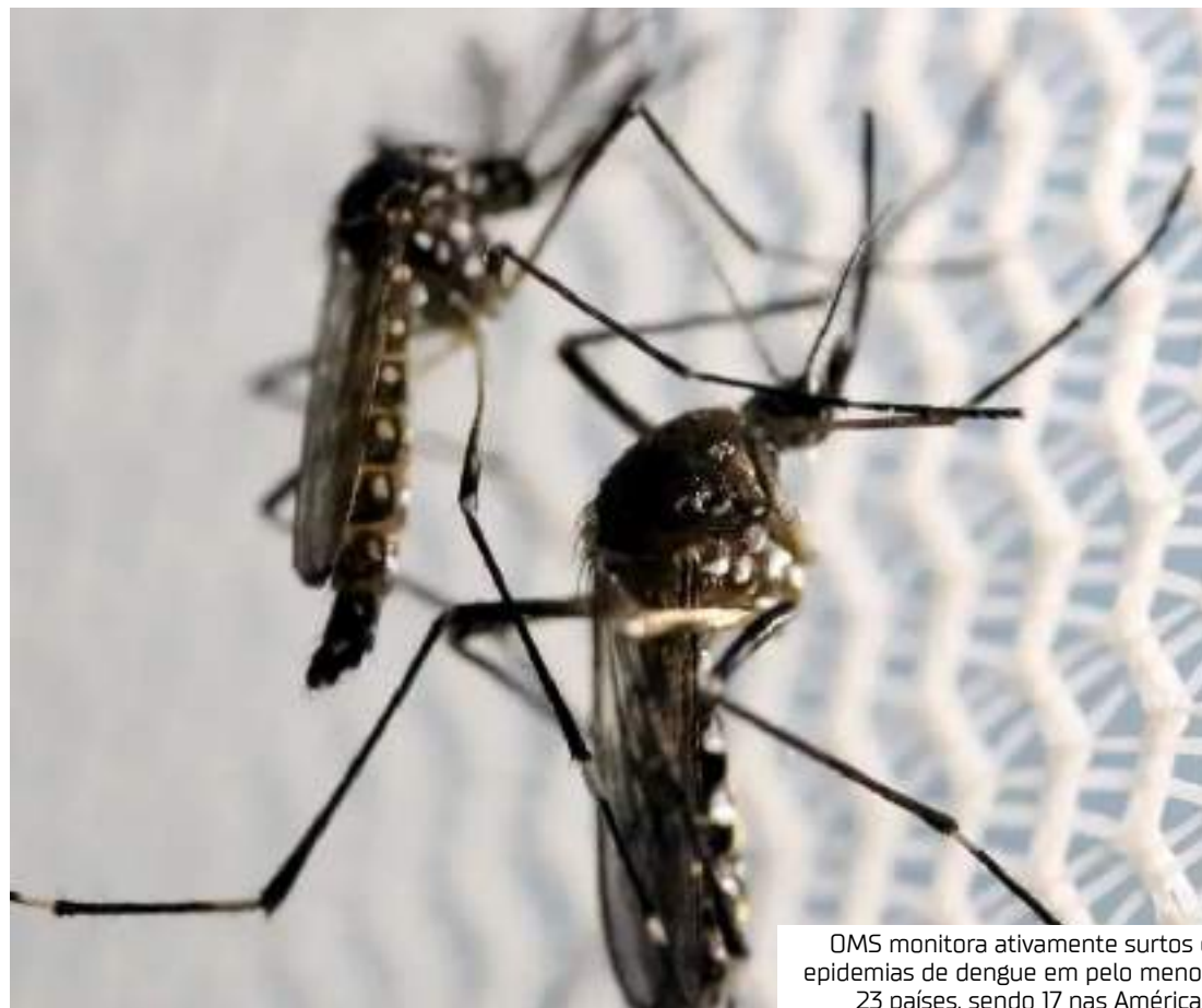
PAULO WHITAKER OMS monitora ativamente surtos e epidemias de dengue em pelo menos 23 países, sendo 17 nas Américas

Uma das complicações mais conhecidas da chikungunya é a artralgia crônica. Após a resolução dos outros sintomas, persistem as dores articulares, inflamação e rigidez nas arti-