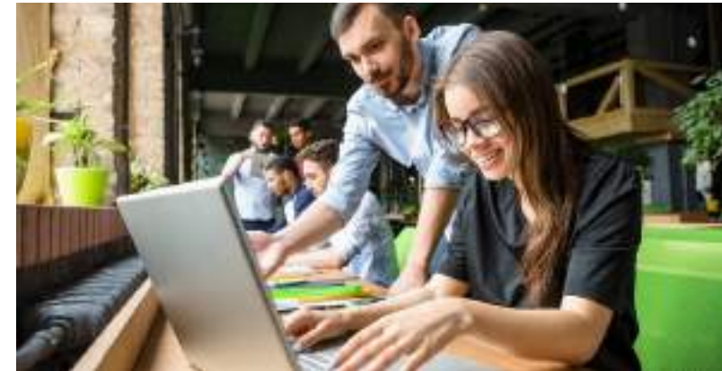
Vagas de estágio são para atuação na capital e nos municípios de Coari e Tabatinga