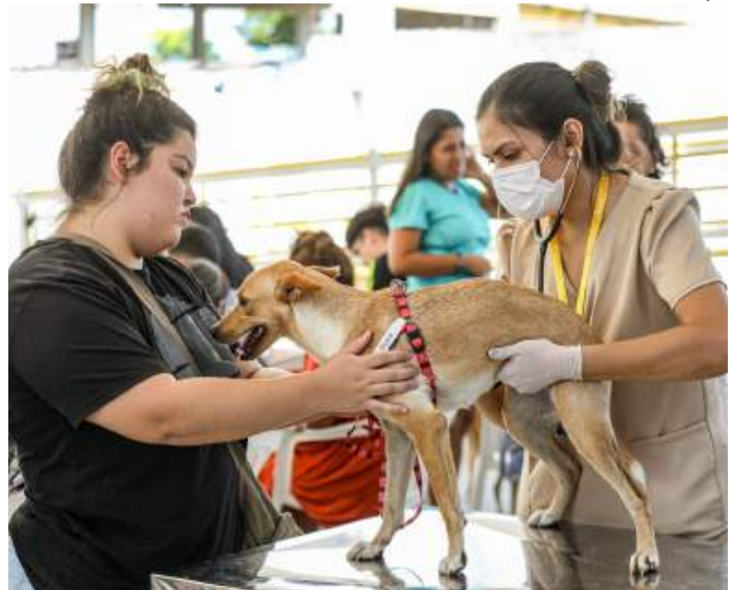
Para saber se o animal atende aos requisitos da castração, acesse a cartilha orientativa no site da Sema