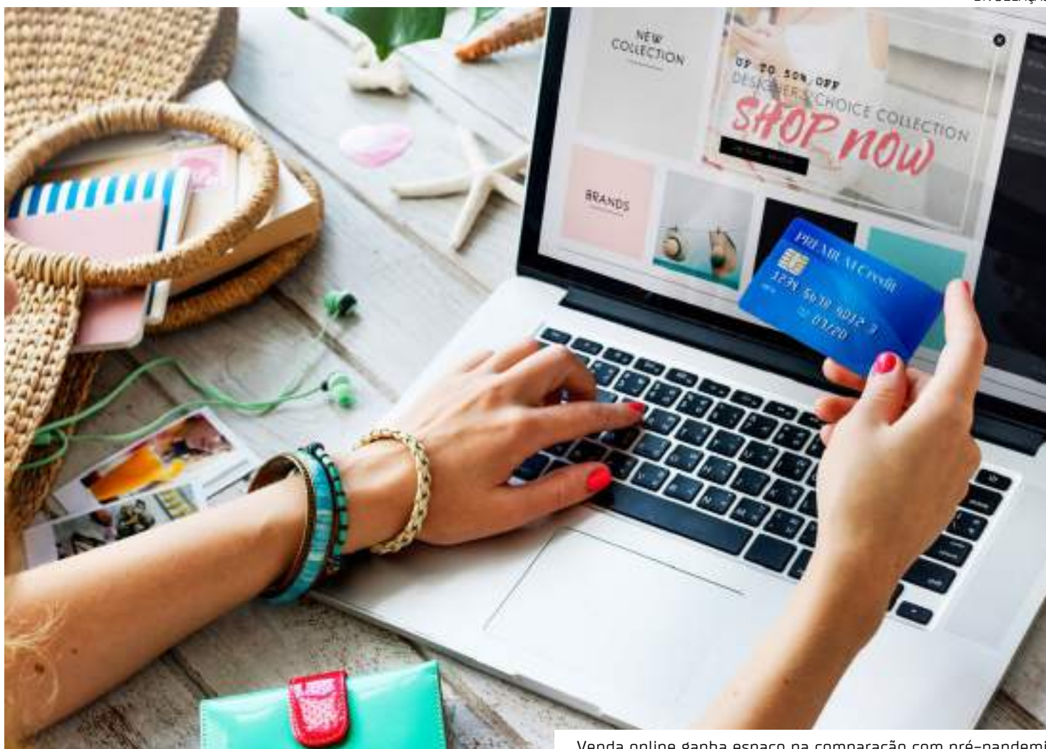
Venda online ganha espaço na comparação com pré-pandemia

A alta pode estar associada à movimentação turística do