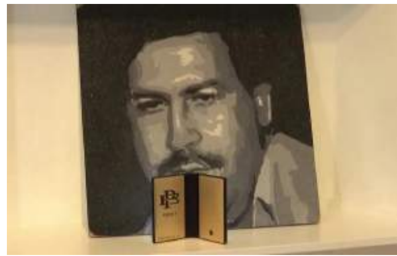
Irmão de falecido traficante tentou reivindicar marca Escobar Inc.