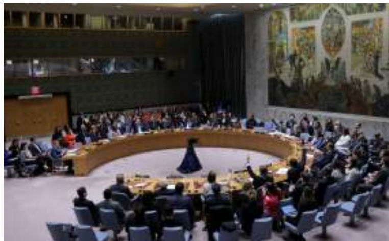
Conselho de Segurança da ONU em Nova York