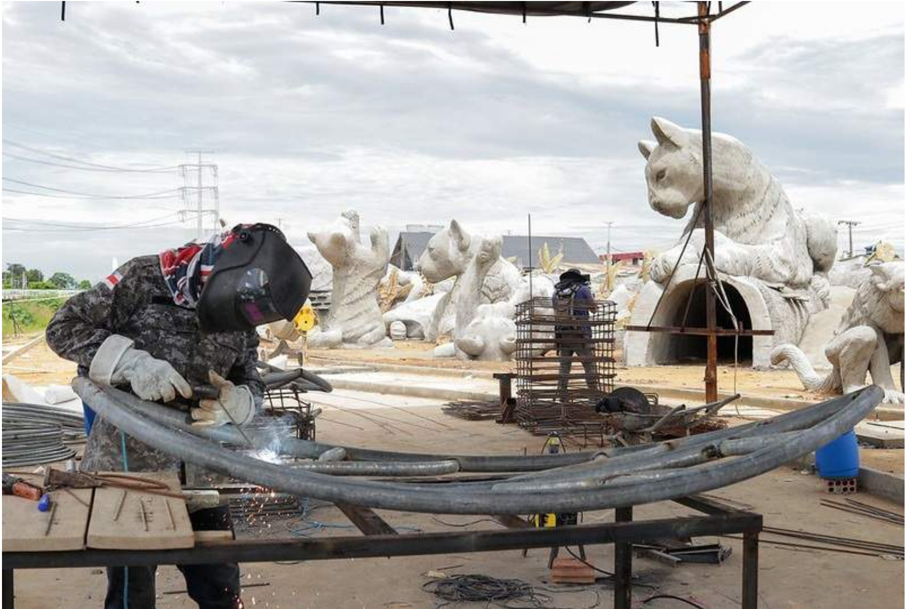
Prefeito ainda destacou que o Gigantes da Floresta tem o intuito de resgatar a primeira infância, um espaço para encantar as crianças, pais e responsáveis

O prefeito ainda destacou que o Gigantes da Floresta tem o intuito de resgatar a primeira infância, um espaço para encantar as crianças, pais e responsáveis, para que reduza a interação apenas por meios eletrônicos. A meta é que a atração se torne um ponto turístico para que a