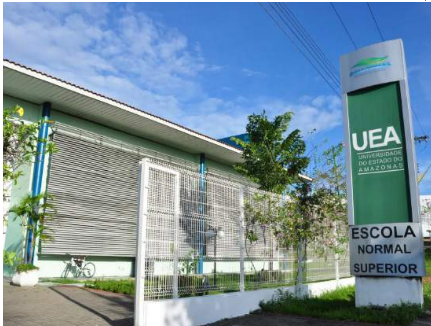
Curso pré-vestibular é voltado a estudantes matriculados na 3ª série do ensino médio ou portadores de certificado de conclusão de ensino médio