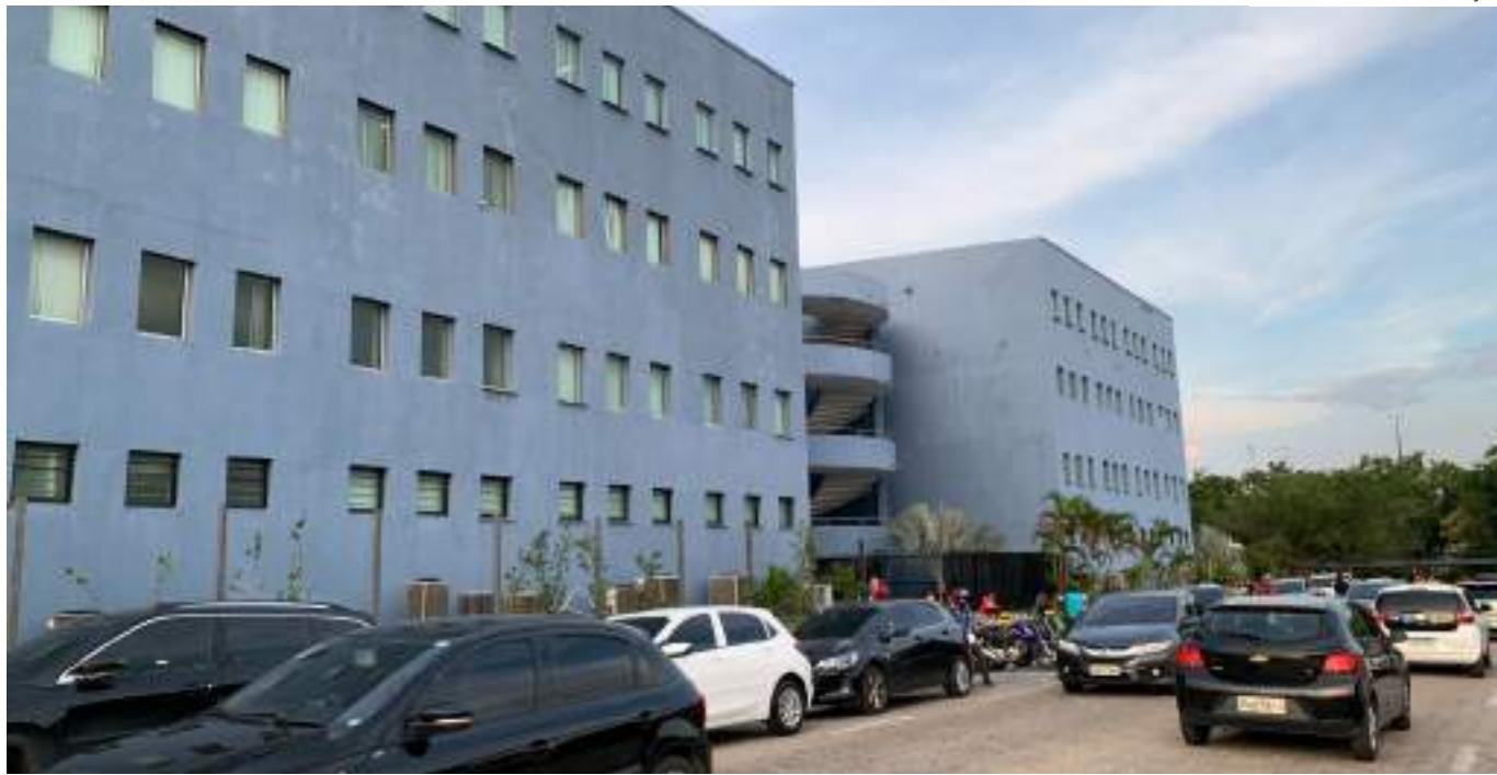
Provas serão realizadas no campus da instituição, no bairro Parque das Laranjeiras, Zona Centro-Sul de Manaus, no dia 3 de maio