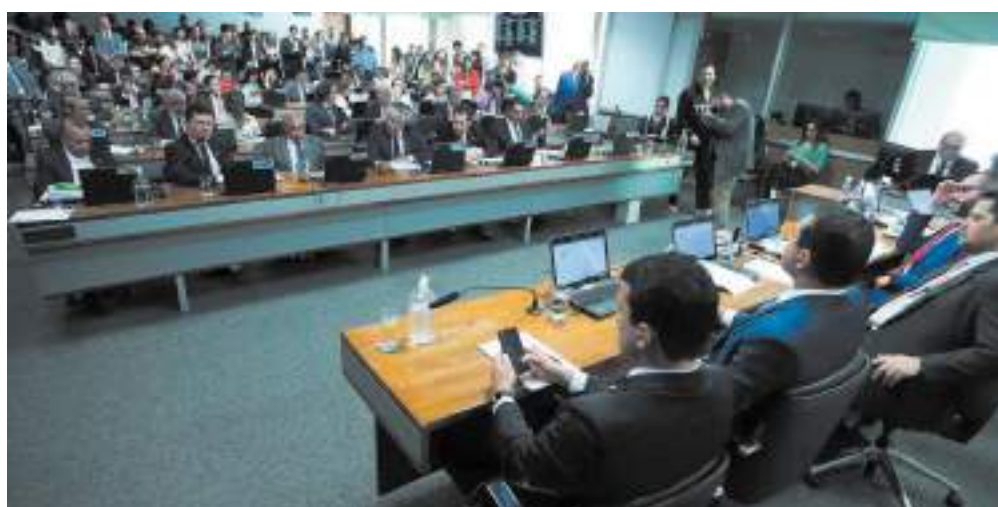
Proposta ainda passará por nova votação na comissão