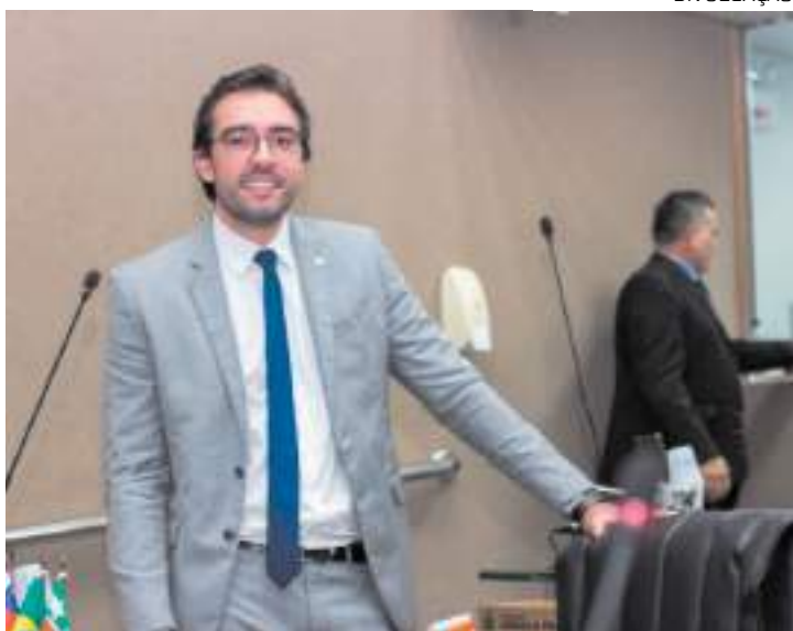
Deputado apresentou na Aleam sobre políticas contra o etarismo

propositura, a Política Estadual contra o Etarismo será implementada em colaboração com a sociedade civil.