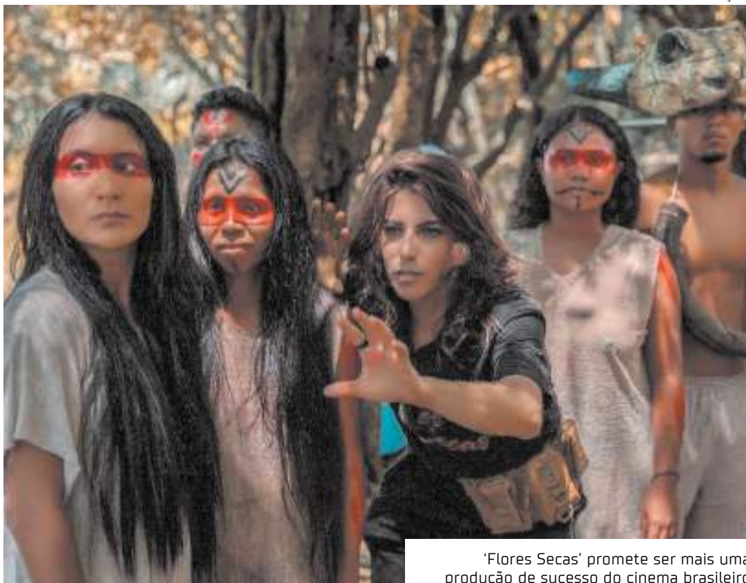
'Flores Secas' promete ser mais uma produção de sucesso do cinema brasileiro

Marepe'í é levada por Dador, dando início ao plano