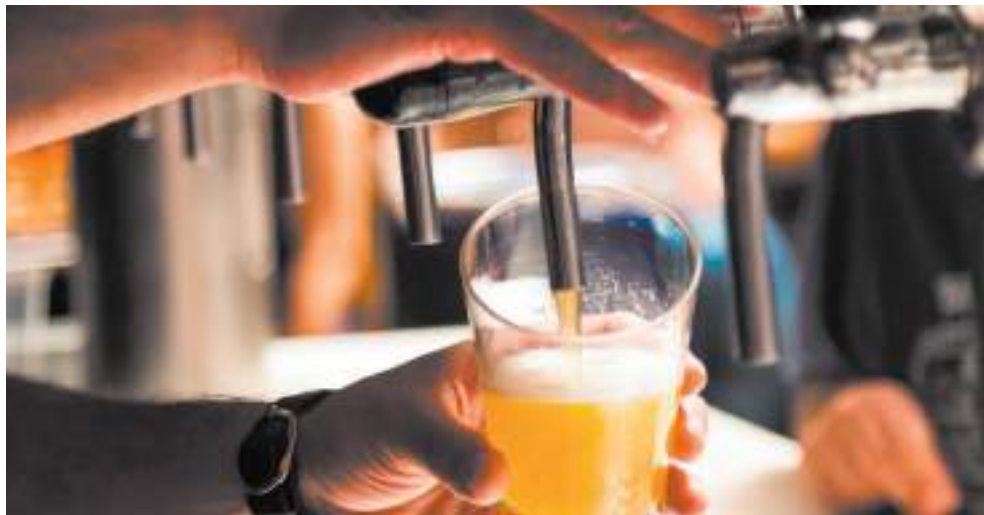
Bar promove fim de semana com atrações musicais