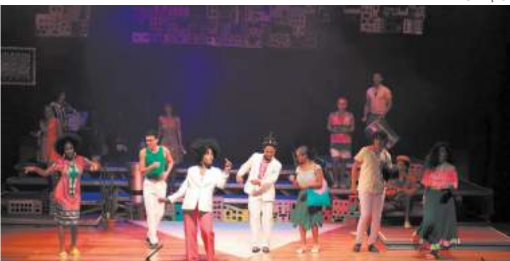
Inscrições gratuitas para curso técnico de teatro em Manaus