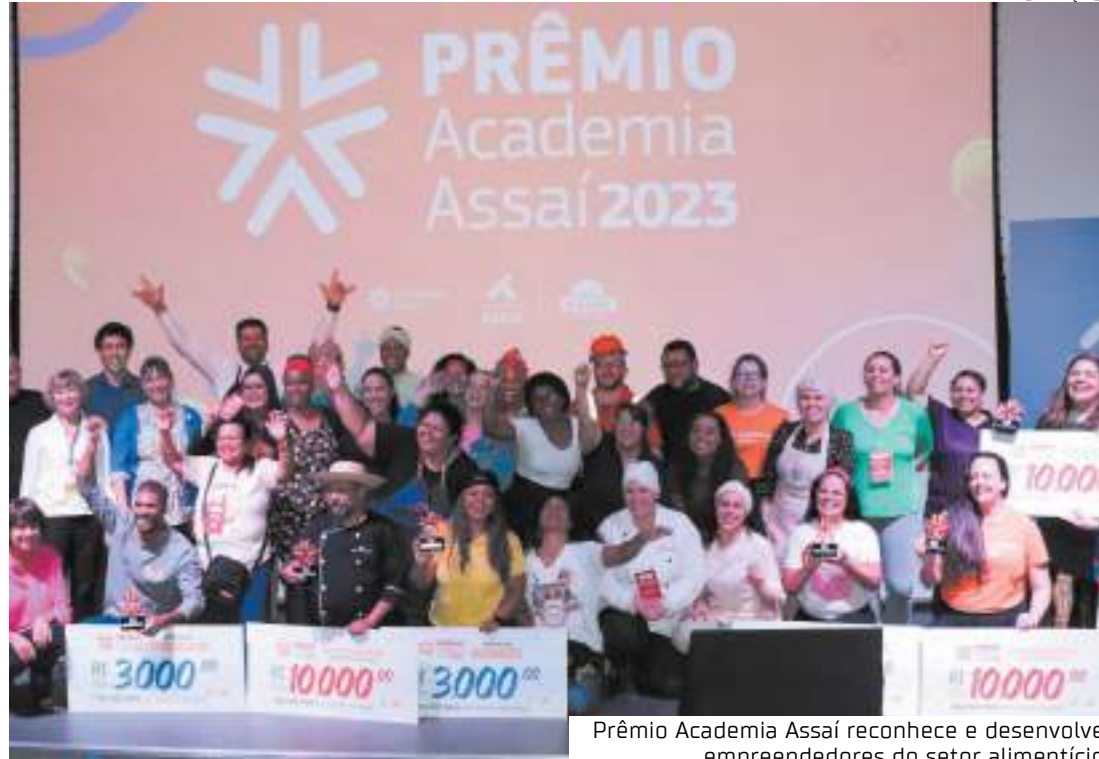
Prêmio Academia Assaí reconhece e desenvolve empreendedores do setor alimentício

Para reforçar o olhar regional do Assaí nas praças em que atua, a iniciativa se divide em duas etapas: o Prêmio Regional,