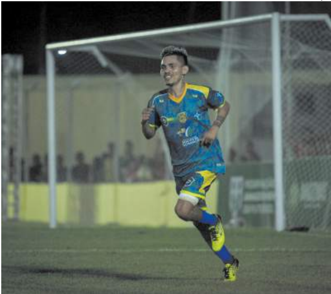
Equipe do município de Boa Vista do Ramos deve ser o adversário do time da casa