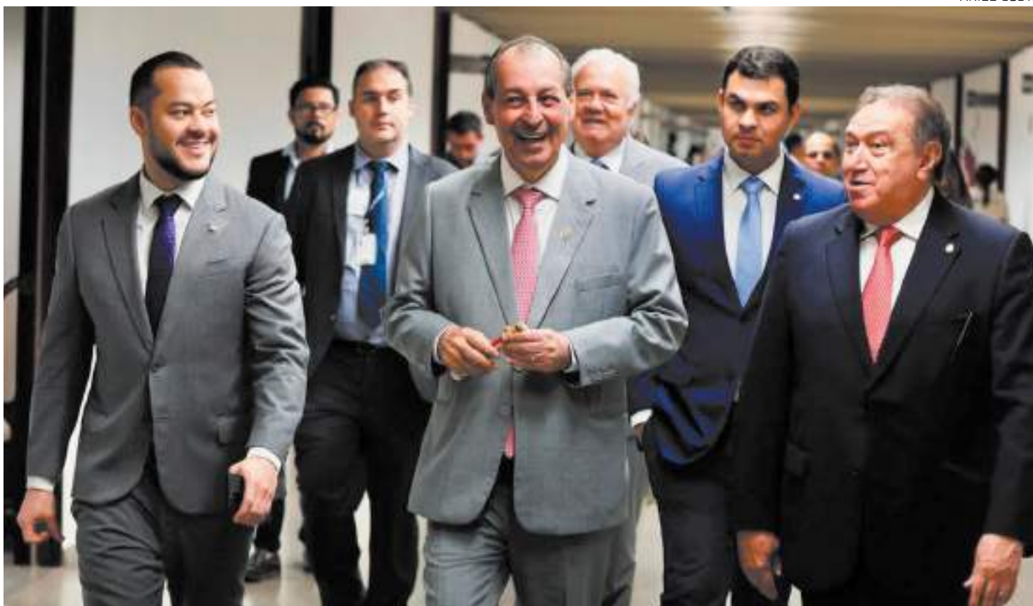
Omar expressou preocupação com as implicações das mudanças na reforma tributária

"A PEC nos garante a competitividade que a Zona Franca sempre teve. Agora, as leis complementares que estão sendo encaminhadas, ainda não temos o inteiro teor,