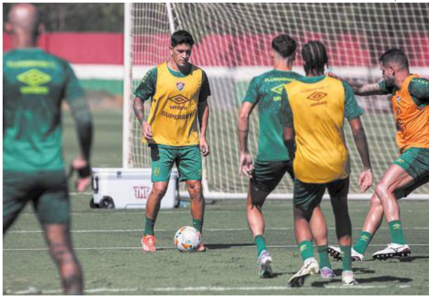
Gérmán Cano será titular na partida de logo mais, mas não terá substituto imediato porque John Kennedy foi afastado por indisciplina

Fluminense e Cerro Porteño se enfrentaram seis vezes na história, sendo cinco vitórias