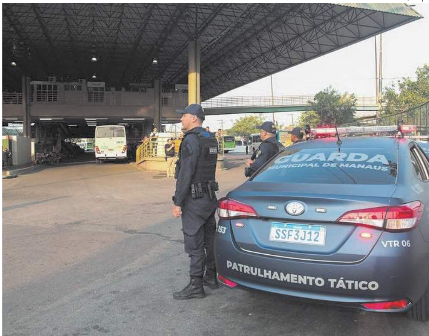
Guardas municipais em patrulhamento em terminal de integração da cidade