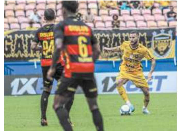
Onça-pintada estreou com derrota na Série B, contra o Sport-PE