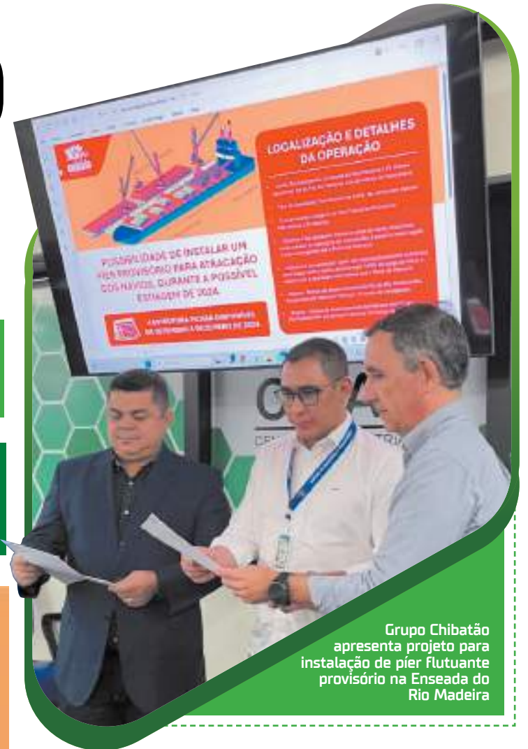
Grupo Chibatão apresenta projeto para instalação de pier flutuante provisório na Enseada do Rio Madeira

inovadora para minimizar impactos da estiagem