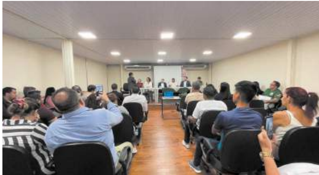
Encontro aconteceu na terça-feira (23), no Centro de Monitoramento Ambiental e de Áreas Protegidas (CMAAP)

Essas fontes poluidoras são divididas por segmen-