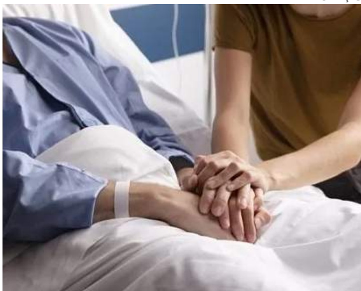
Acompanhante deve ser solicitado pela beneficiária

"Essa lei chega para garantir mais proteção à mulher, uma vez que inibe violências física, emocional e psicológica. Infelizmente, não é incomum recebermos relatos de mulheres que sofreram violência