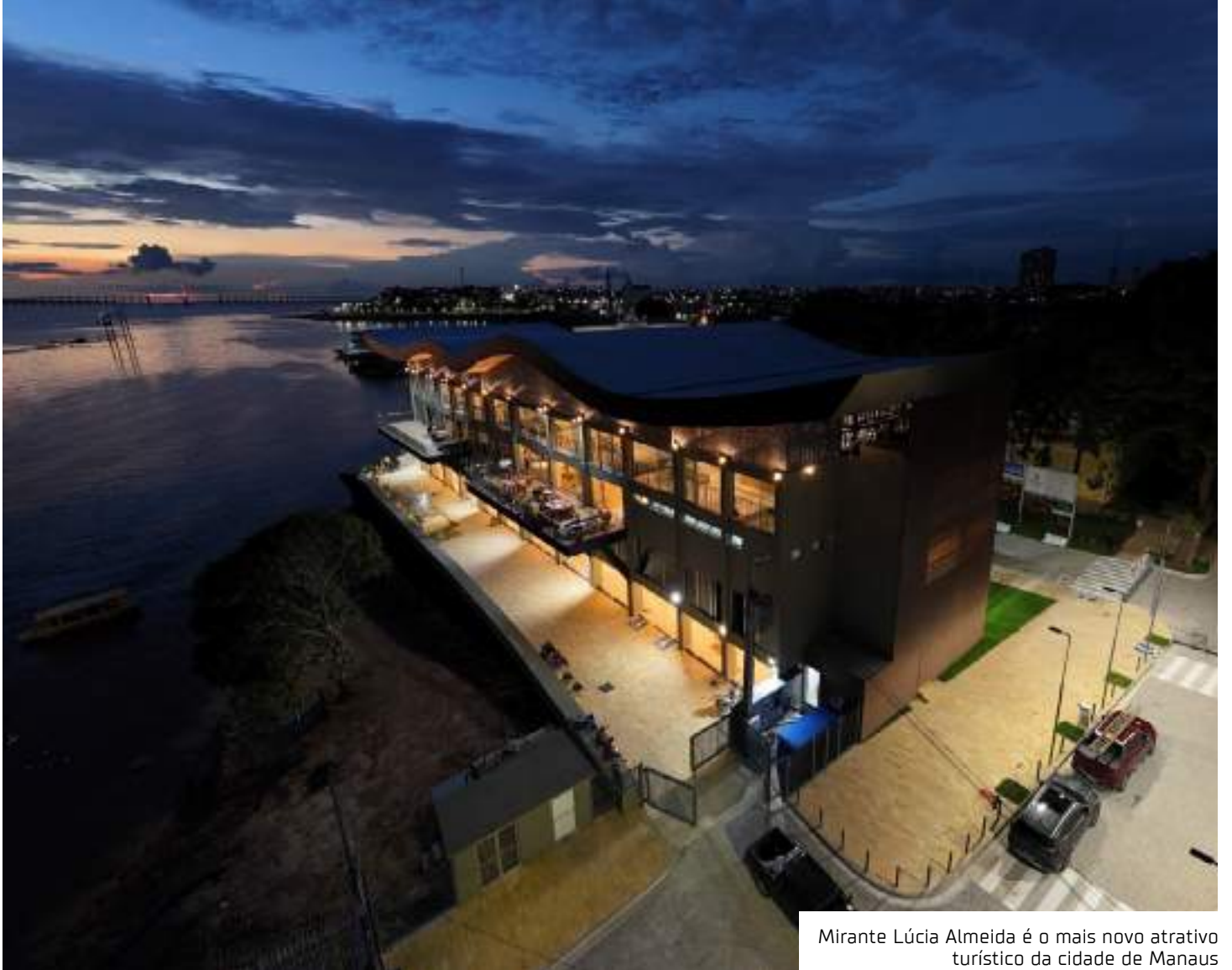
Mirante Lúcia Almeida é o mais novo atrativo turístico da cidade de Manaus

A partir das 17h, a população terá acesso a um mi-