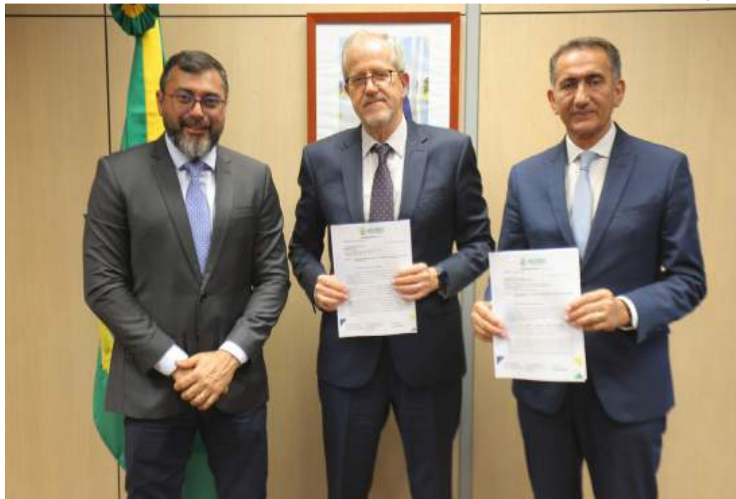
Governador pediu apoio do Governo Federal para antecipar ações que minimizem impactos da estiagem

Ao Ministério de Portos e Aeroportos, o governador