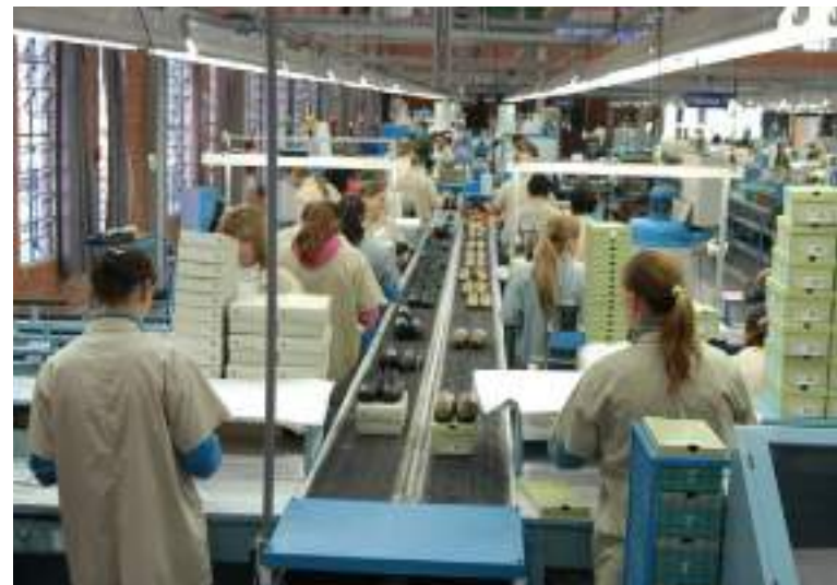
Norte teve o maior crescimento percentual em firmas vendendo para o exterior