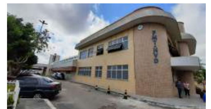
Fundação de Medicina Tropical completou 50 anos de atuação

“Celebrar os 50 anos da Fundação dessa forma, atendendo à população, é uma satisfação.”