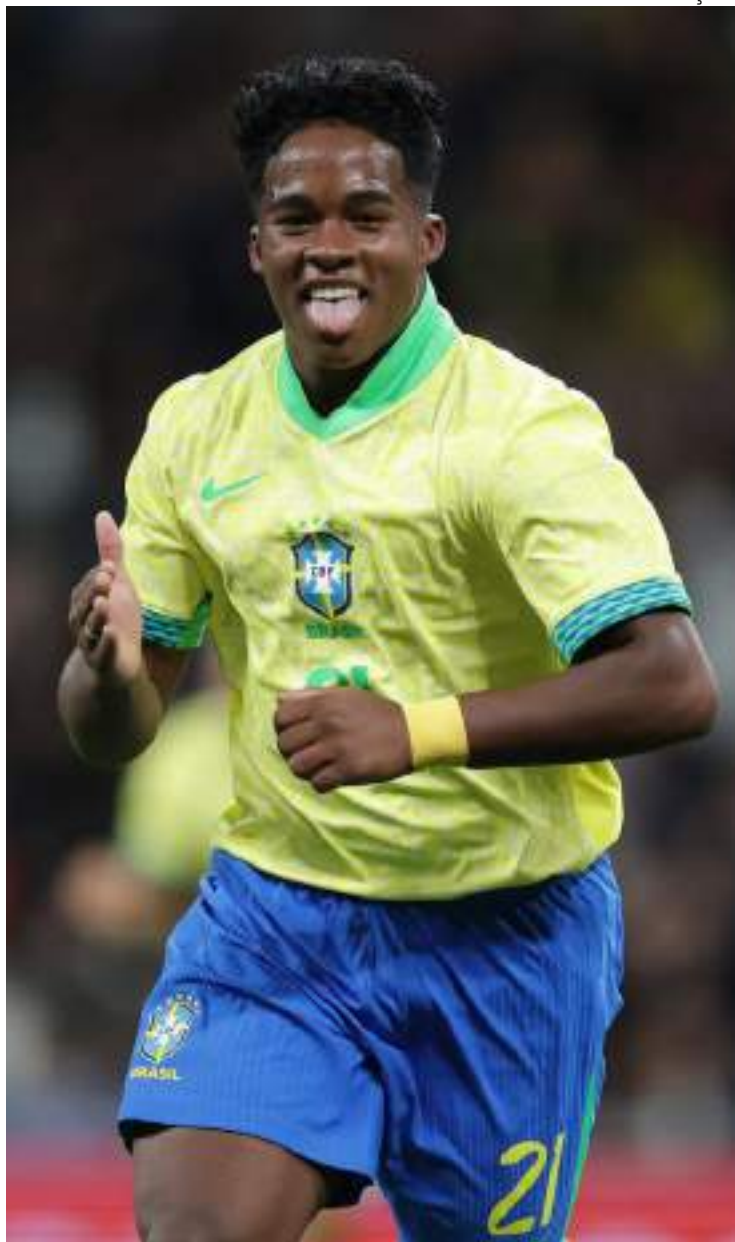
Endrick ganhou um moral ao estreiar pela Seleção do Brasil e fazer gol