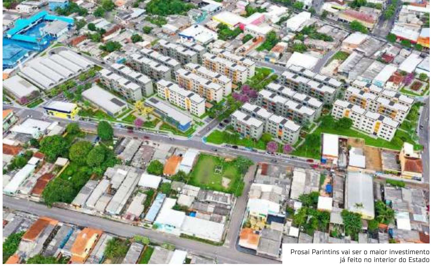
Prosai Parintins vai ser o maior investimento já feito no interior do Estado

mou, ainda, que o processo está agora na Procuradoria Geral da Fazenda Nacional (PGFN) para análise. "A PGFN vai emitir seu parecer, juntar com a minuta do empréstimo e enviar para o Gabinete Civil da Presidência da República que, por sua vez, solicitará ao Senado Federal autorização para a contratação da operação de crédito e contragarantia", detalhou.