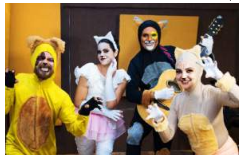
Musical apresenta canções autorais com texto inédito de espetáculo