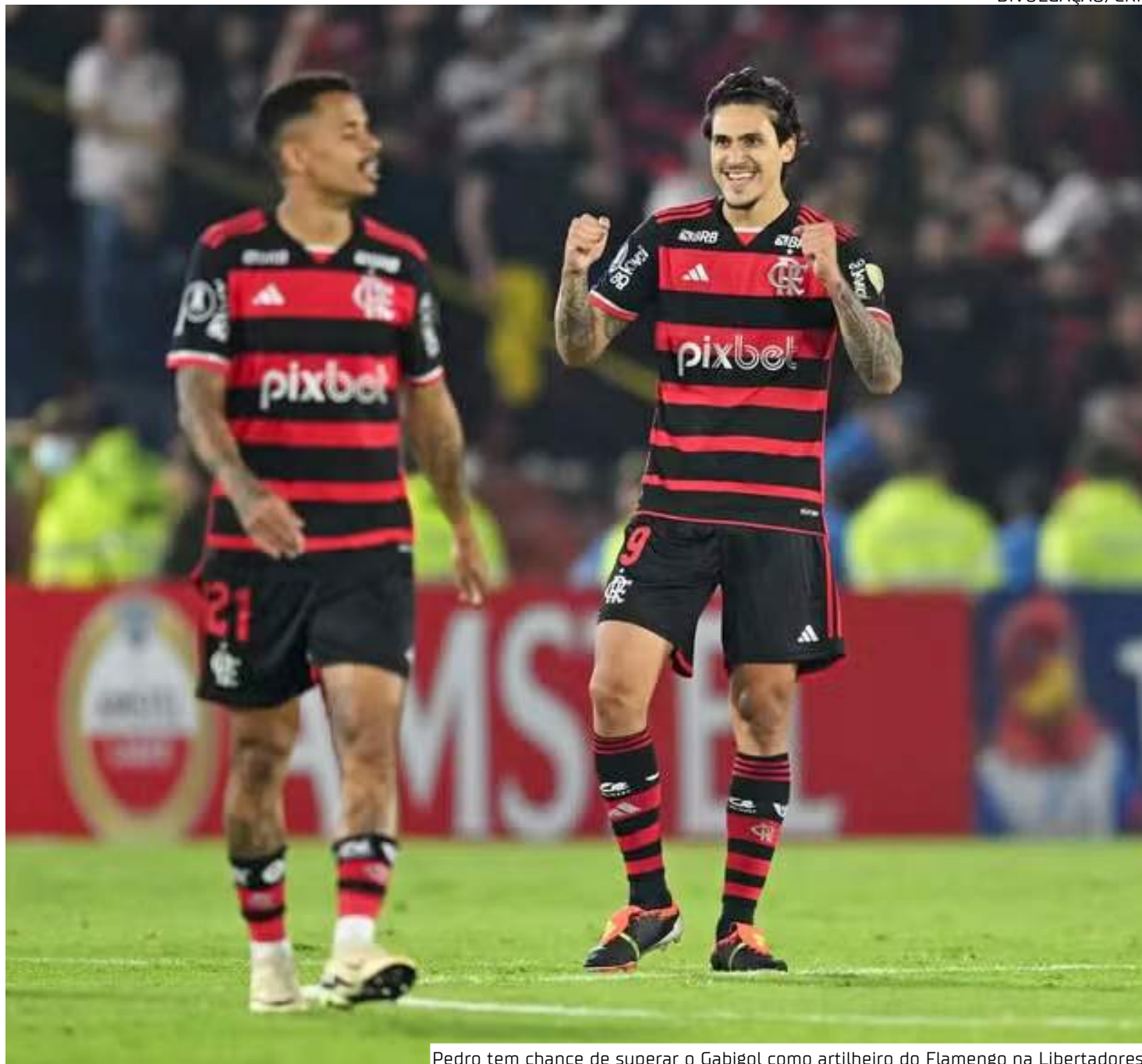
Pedro tem chance de superar o Gabigol como artilheiro do Flamengo na Libertadores