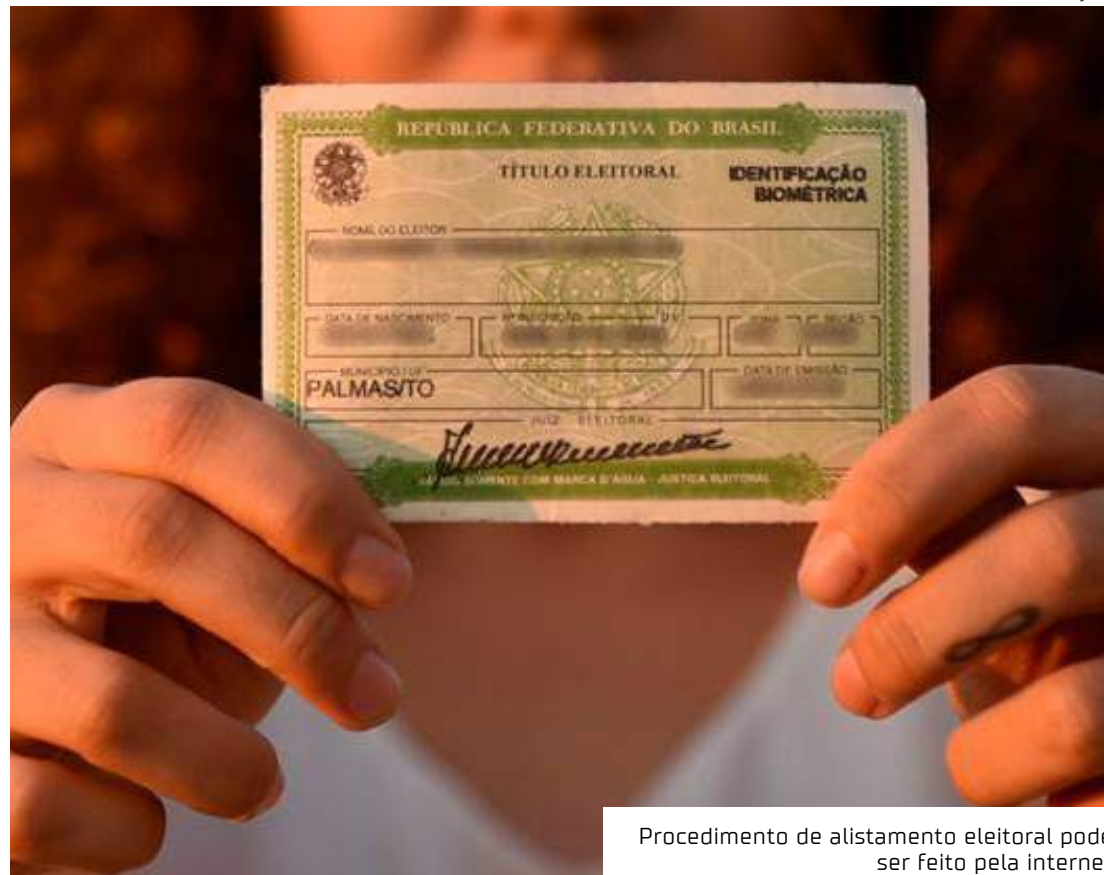
Procedimento de alistamento eleitoral pode ser feito pela internet

Após a solicitação pelo Autoatendimento Eleitoral, o futuro eleitor tem até 30 dias para fazer