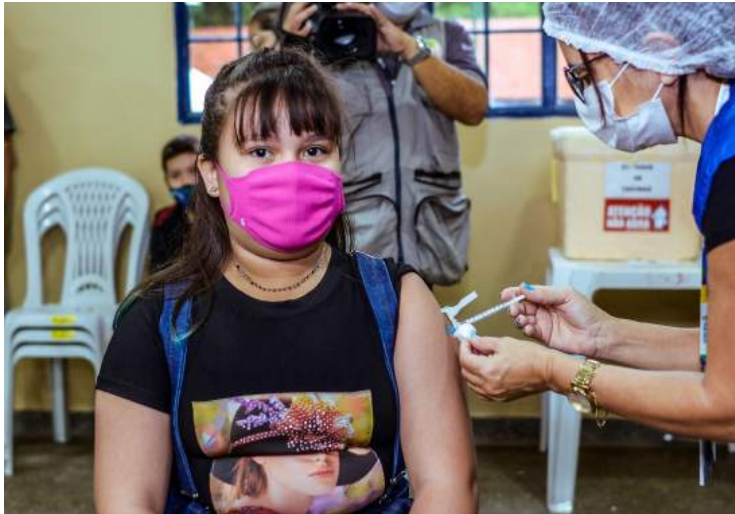
Prefeitura passa a ofertar, a partir desta semana, a vacina contra o papilomavírus humano em esquema de dose única

Shádia assinala que a vacina continua sendo ofertada em 171 salas de vacina da rede pública municipal e também