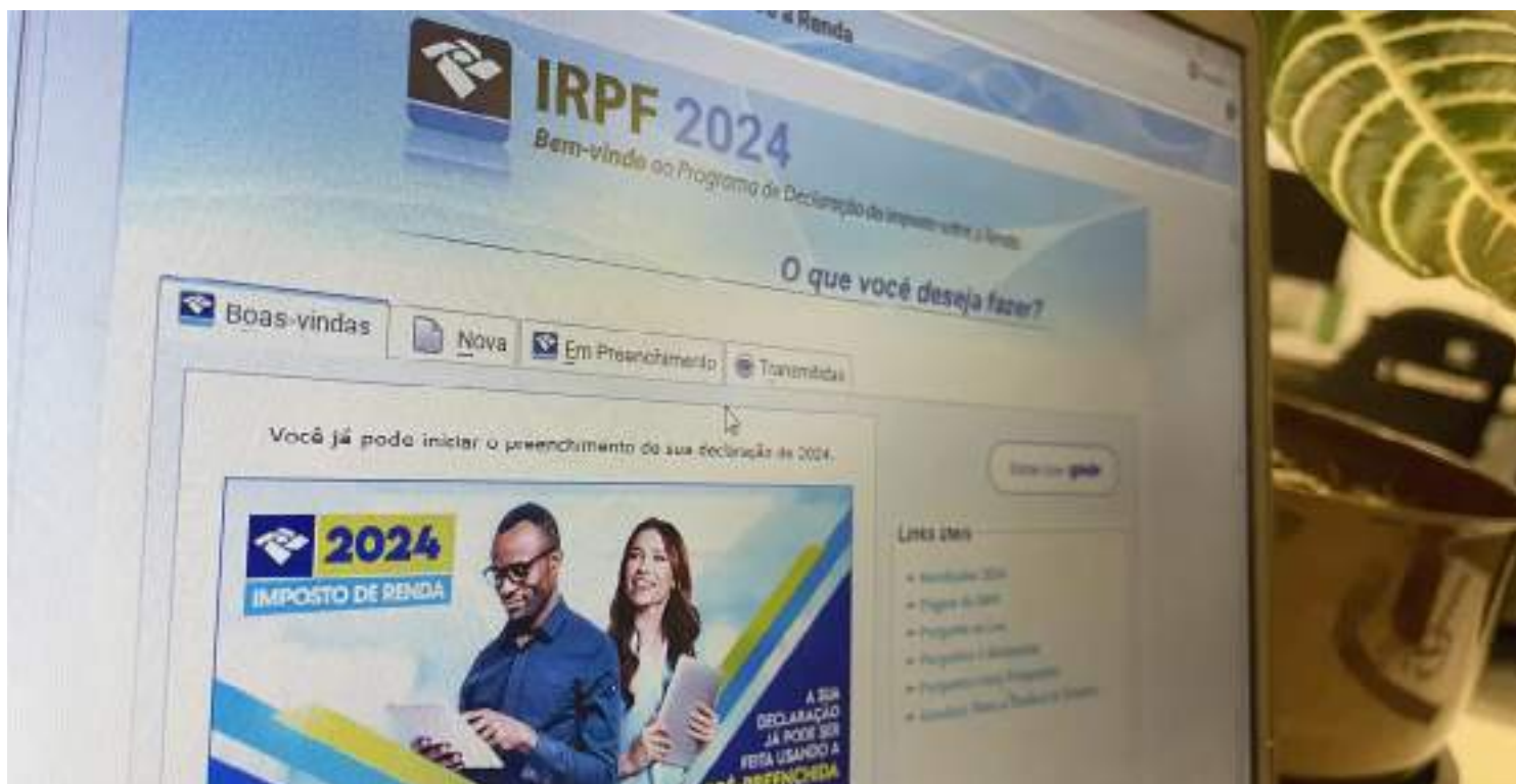
Mais de 10 milhões de declarações do Imposto de Renda foi apresentado a Receita Federal neste ano

Segundo a Receita Federal, 81,1% das declarações entregues até agora terão direito a receber restituição, enquanto 10,8% terão que pagar Imposto de Renda e 8,1% não têm im-