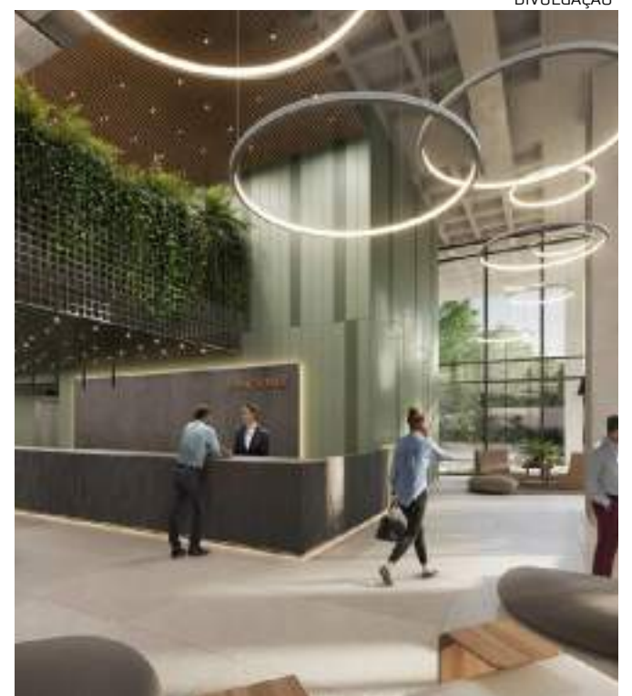
Botânica Office em construção na avenida Darcy Vargas