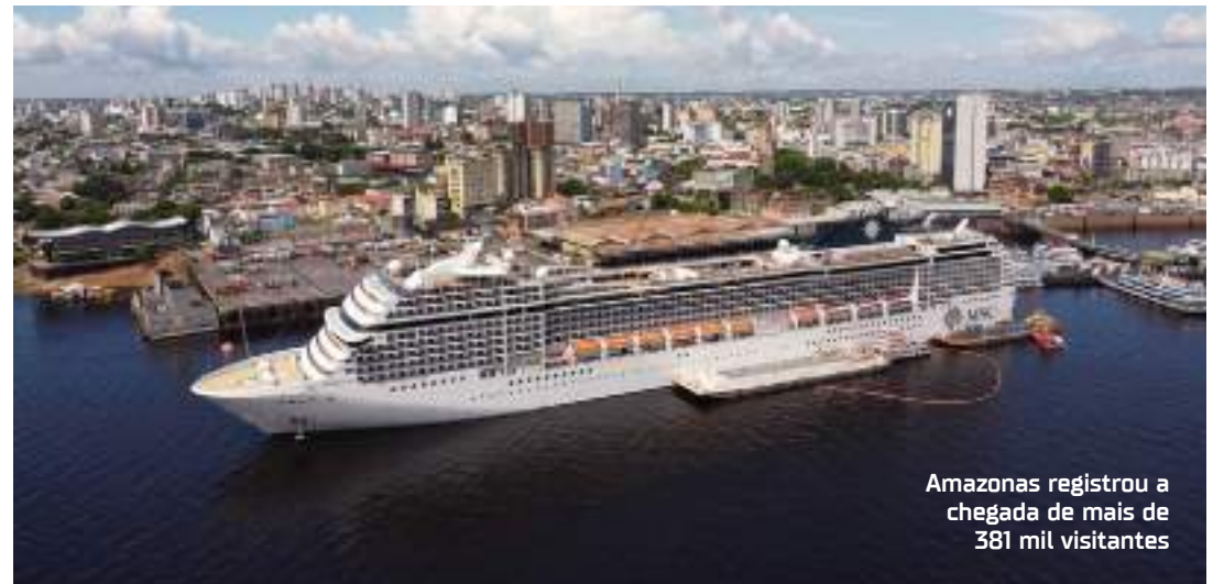
Amazonas registrou a chegada de mais de 381 mil visitantes

populares foram trabalho e negócios (42,33%), gastronomia típica (33,21%), visitar amigos e familiares (31,48%), passeios (28,97%) e eventos como feiras, congressos, exposições, conferências representaram 21,31% do público de turistas em 2023.