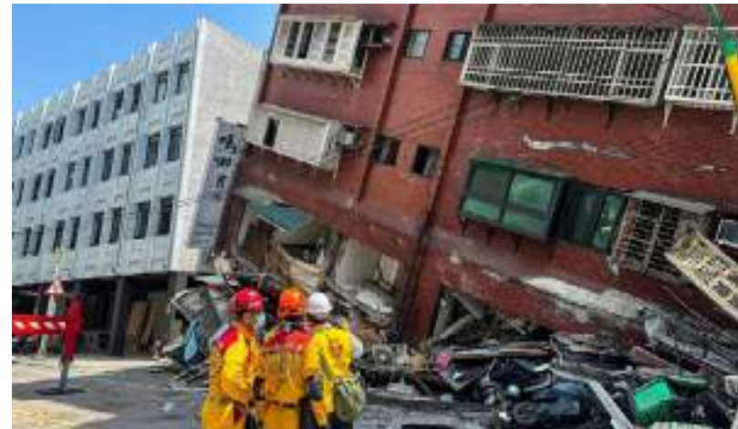
Abalo sísmico atingiu magnitude 7,7 na escala Richter