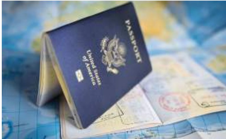
Documento será exigido em fronteiras terrestres, portos e aeroportos