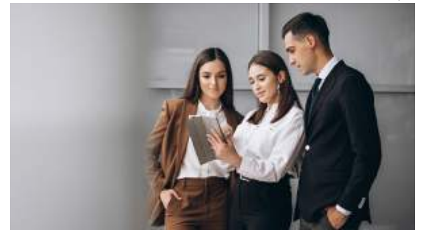
Candidatos devem ter cadastro no site do IEL Amazonas