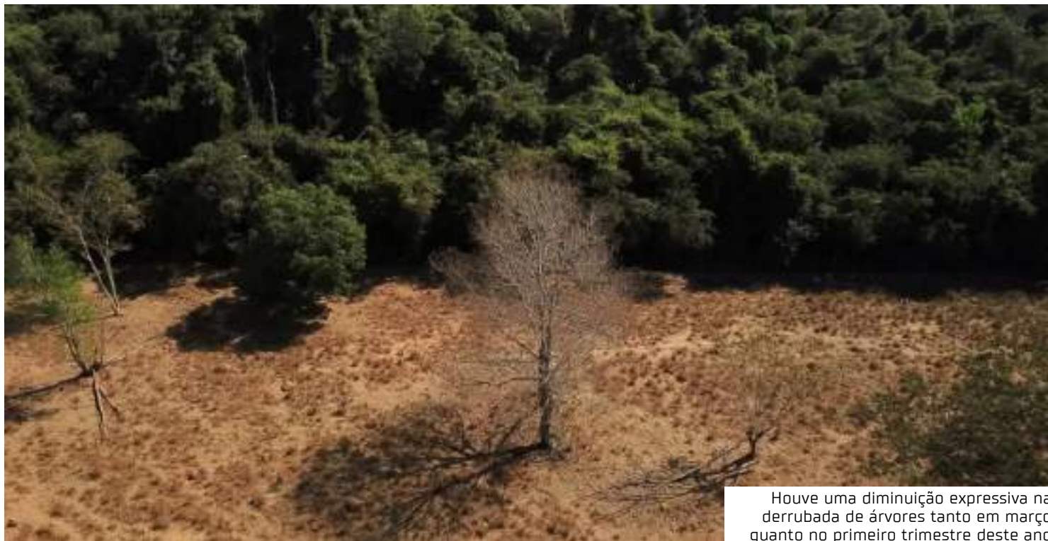
Houve uma diminuição expressiva na derrubada de árvores tanto em março quanto no primeiro trimestre deste ano

O Sistema Deter monitora em tempo real e emite alertas sobre locais onde ocorre desmatamento, auxiliando as equipes de fiscalização no combate a essa prática