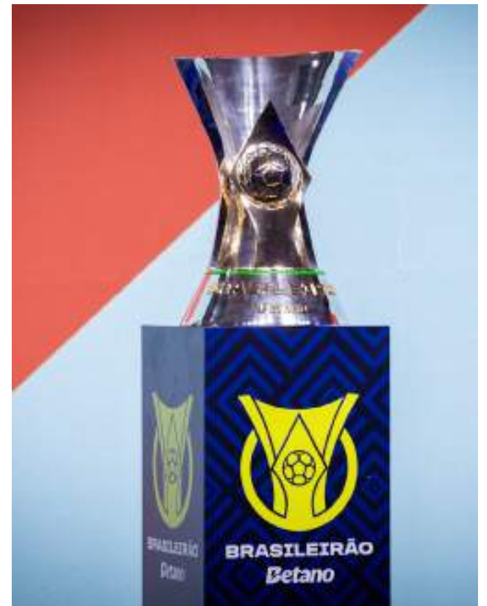
Série A passa a se chamar Brasileirão Betano após novo acordo