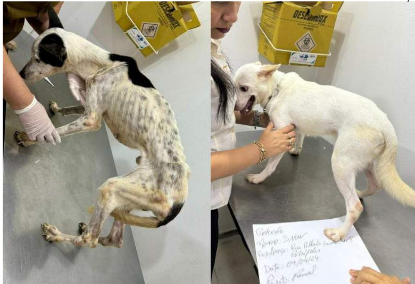
Indicadores revelam um crescimento exponencial quanto à conscientização das pessoas em denunciar esse crime

"Essa pena aumentou no ano de 2020, a qual cabe flagrante e não comporta fiança. Isso fez com que as pessoas se motivem a denunciar mais. Dentre os crimes que podem levar à