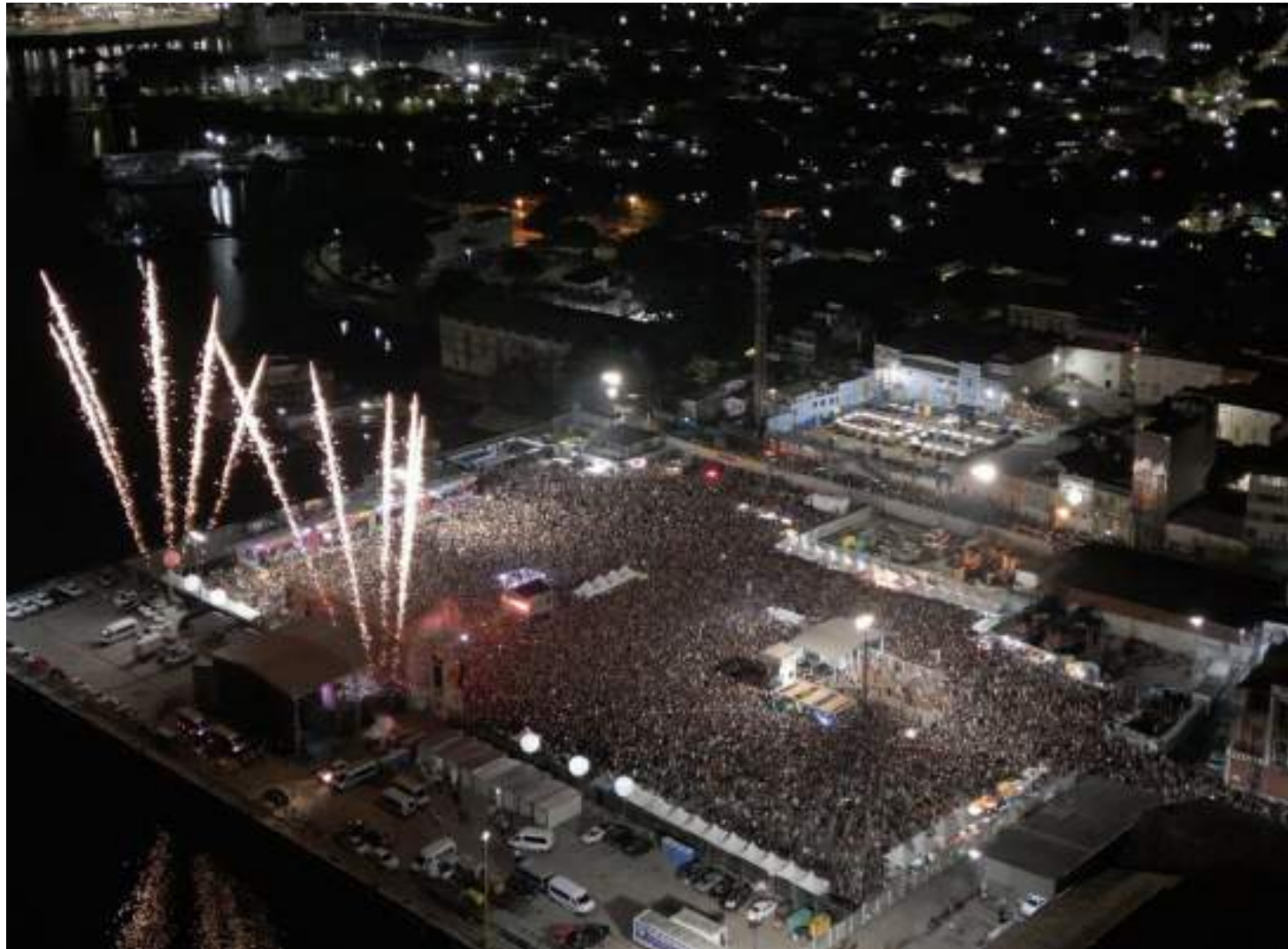
#SouManaus 2024 vai contar com nove espaços e muitas outras intervenções artísticas espalhadas pelo Centro Histórico de Manaus

"De orçamento, nós temos R$ 13 milhões. Muito provavelmente, neste ano, o