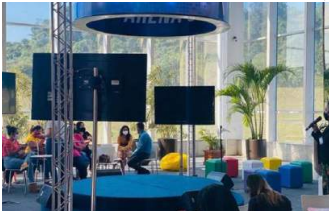
Sebrae realizará Semana do MEI com atividades gratuitas

Promovido pelo Serviço Brasileiro de Apoio às Micro e Pequenas Empresas (Sebrae) em todo o País, a 15ª Edição da Semana do MEI 2024 promete novidades e atividades simultâneas para os microempreendedores em todas as unidades. No Amazonas, o evento ocorrerá de 13 a 17 de maio e contará com mentorias, oficinas, palestras, workshops e consultorias gratuitas.