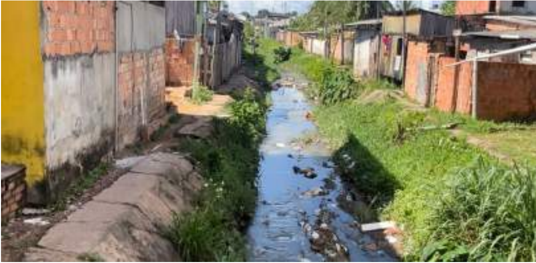
Rip-rap concentra grande quantidade de lixo e entulho, objetos que invadem residências durante chuvas

O Jornal Amazonas Em Tempo entrou em contato com a assessoria da Prefeitura de Manacapuru, mas não obteve retorno até a publicação desta edição.