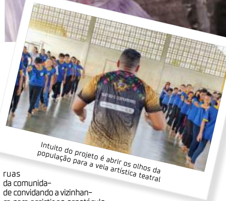
Intuito do projeto é abrir os olhos da população para a veia artística teatral

Principal espetáculo do grupo, "O Mala da Arte", dramaturgia de Júnior Santos, do Rio Grande do Norte, conta a história de Pedro Malazarte, um anti-herói brasileiro que engana seu "amigo" Foquito, que por sua vez, com a ajuda de dois demônios, sua consciência - Espírito do Cão e Suspiro do Diabo, tentam enganar Pedro Malazarte para recuperar o seu dinheiro que Pedro tinha lhe enganado. Foquito veste-se de mulher - Bia Burra. Entre erros e acertos, Pedro descobre e acaba com a farsa. Um espetáculo cheio de altos e baixos, risos e alegria marca a tragicomédia desses personagens.