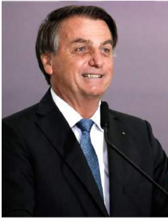
Presidente Lula e Bolsonaro já indicaram apoio a pré-candidatos à Prefeitura de Manaus

No cenário envolvendo o apoio de Bolsonaro, 40,8% indicaram que não votariam em um candidato indicado por ele, 25,4% disseram que poderiam votar dependendo do candidato e 33,1% confirmaram que votariam em um candidato indicado pelo ex-presidente.