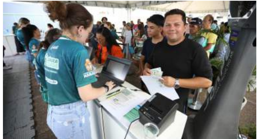
Câmara Cidadã já realizou 38.502 atendimentos, somadas as três edições anteriores

Além destes, também estiveram entre os principais serviços cadastro no Sine Manaus, encaminhamento para oportunidades de emprego, emissão de Passa Fácil, emissão de Carteira de Identificação da Pessoa com Deficiência (CIPcD), emissão da carteira intermunicipal - Passe Legal, serviços de