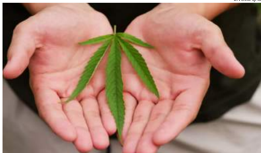
Cannabis e a ketamina aparecem como opções promissoras para tratar pacientes oncológicos