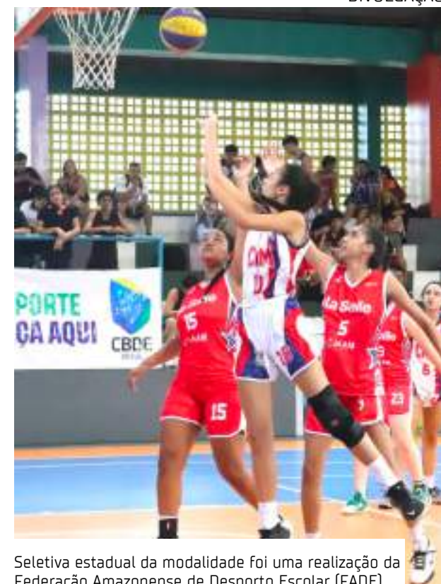
Seletiva estadual da modalidade foi uma realização da Federação Amazonense de Desporto Escolar (FADE)

Com 86 inscritos, a seletiva estadual da modalidade foi uma realização da Federação Amazonense de Desporto Escolar (FADE), por meio do Programa de Apoio às Federações (PAF), em parceria com a Federação de Basquete do Amazonas (FEBAM). Os JEB's do basquete 3x3 acontece entre os dias 15 e 20 de junho, em Palmas (TO), sede também do vôlei de praia.