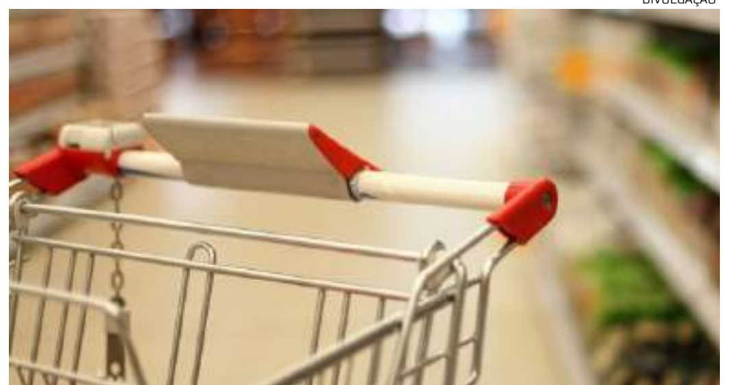
Carrinho de compras vazio em supermercado

No acumulado de 12 meses, a dinâmica se inverte. As famílias de renda muito baixa observam um aumen-