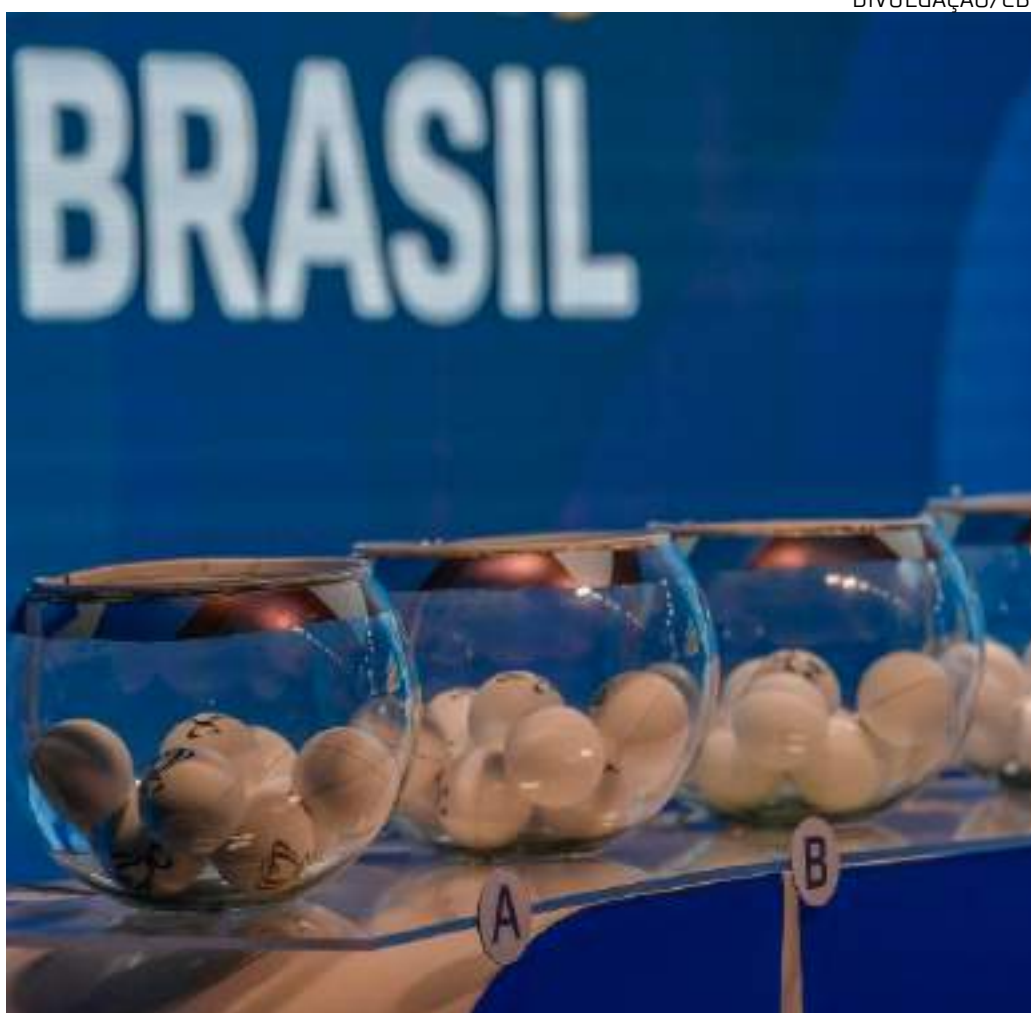
Confrontos serão definidos em jogos de ida e volta

O sorteio será transmitido pelo canal da CBF, no YouTube da entidade.