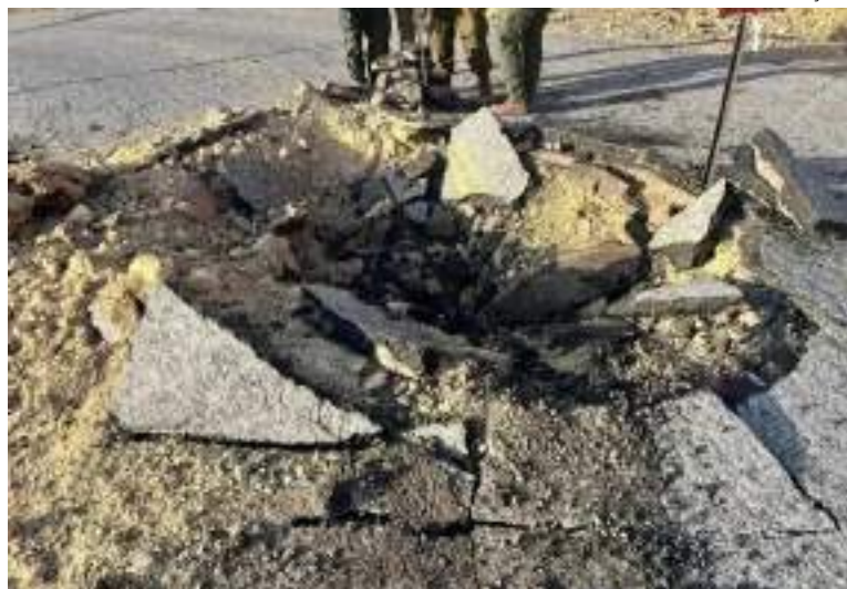
Crateras foram abertas após artilharia iraniana atingir o solo em ataque