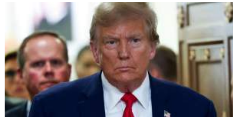
Ex-presidente enfrenta acusações relacionadas a pagamentos de suborno