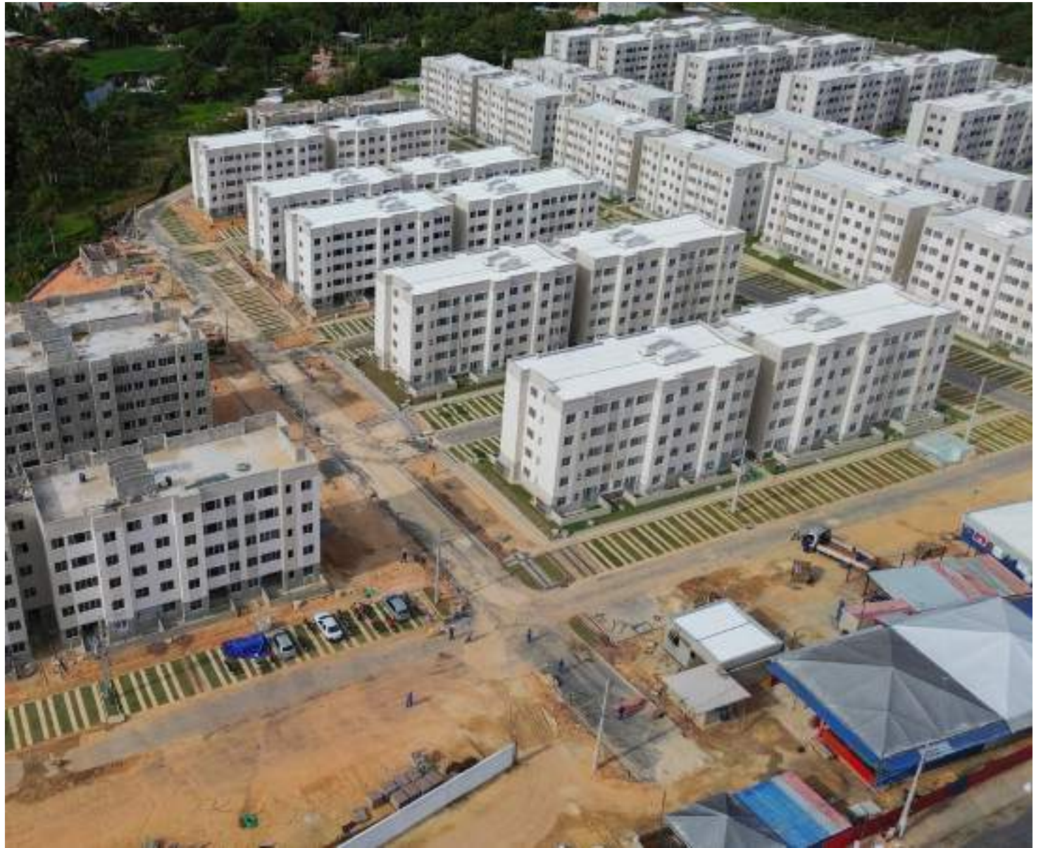
Programa Minha Casa Minha Vida fica abaixo das metas traçadas nos estados da região Norte

Com as novas regras, o Governo Federal está ampliando os valores dos descontos concedidos para as famílias das faixas 1 e 2, com renda até R$ 4,4 mil. A medida resultará na redução ou supressão do pagamento da entrada exigida nas operações de crédito ou na redução das prestações devidas. A expectativa é que isso contribua para alavancar as contratações nas grandes e nas pequenas