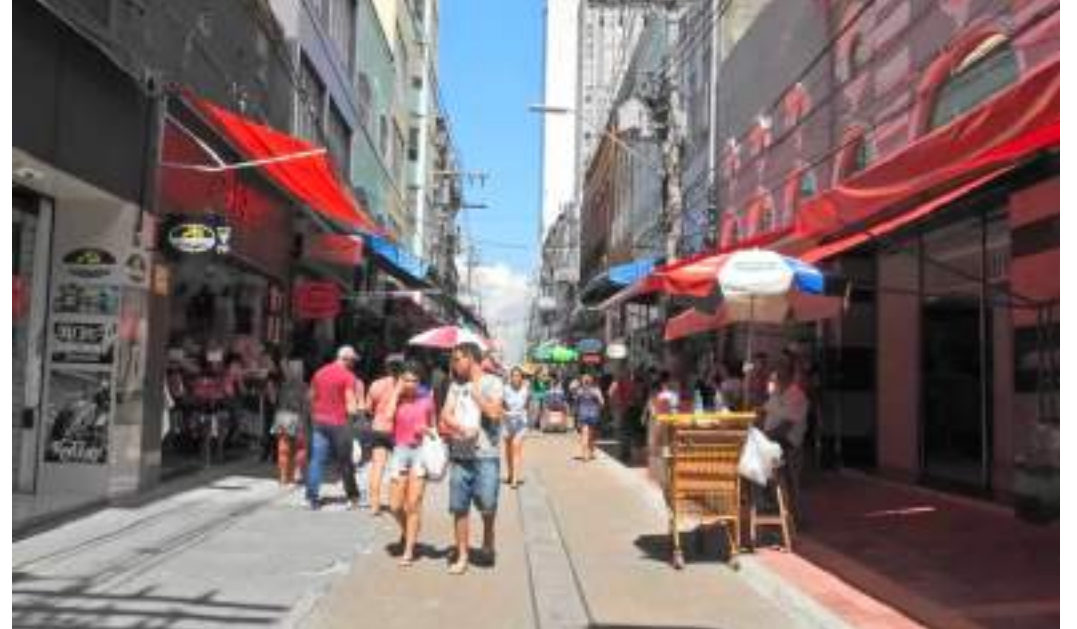
Estabelecimentos do Centro da capital amazonense sofreram com os impactos da falta de energia elétrica

No documento, entregue na sede da concessionária, no bairro Flores, na Zona Centro-Sul de Manaus, o Procon solicita diversas informações dentre as quais o total de consumidores afetados; esclarecimentos sobre o que provocou o desligamento do serviço; as medidas que foram tomadas para minimizar os impactos sofridos pela população e a reparação de possíveis perdas, oca-