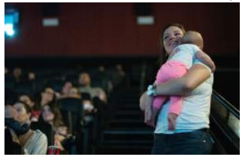
Cinema vai oferecer o "Combo Quarta Cinépolis"