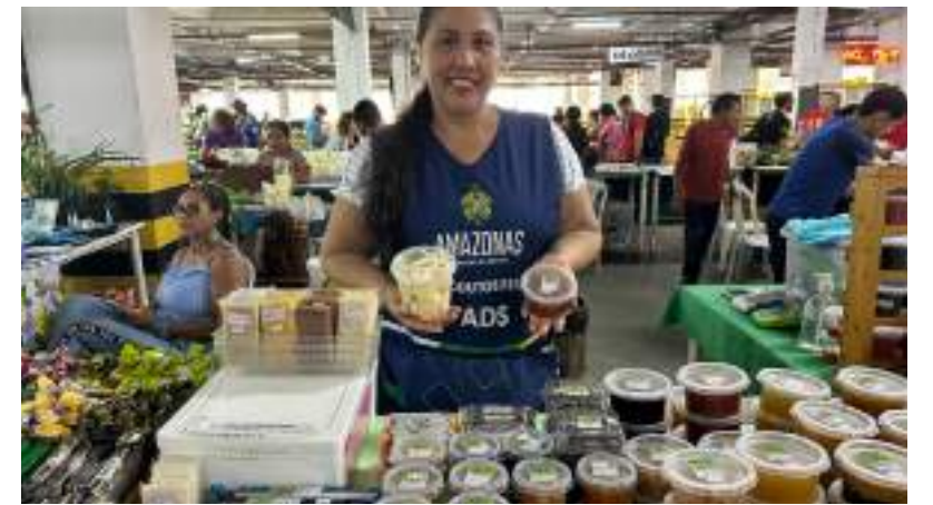
Produtos derivados da polpa da fruta se destacam nas feiras