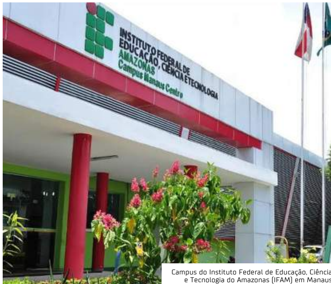
Campus do Instituto Federal de Educação, Ciência e Tecnologia do Amazonas (IFAM) em Manaus

Em nota, o Ministério da Gestão informou que, além de formalizar a proposta apresentada na última quinta-feira, também foi assumido o compromisso de abrir, até o mês de julho, todas as mesas de negociação específicas de carreiras solicitadas para dar tratamento às demandas e produzir acordos que sejam positivos aos servidores.