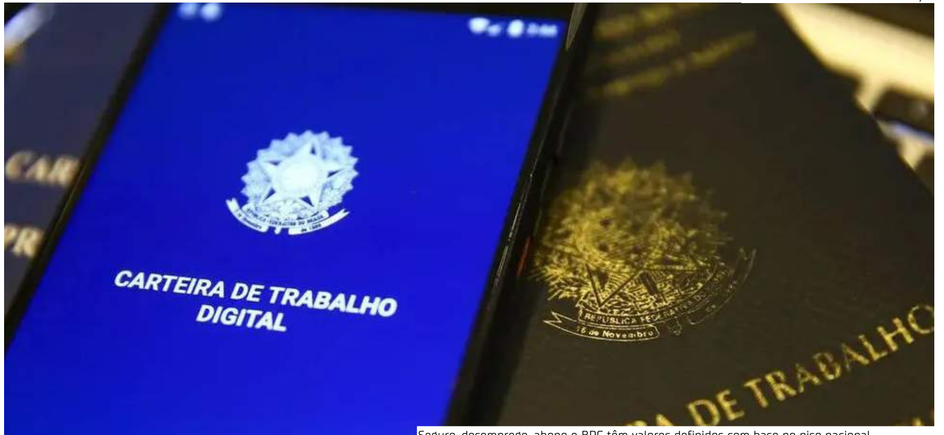
Seguro-desemprego, abono e BPC têm valores definidos com base no piso nacional

Em relação aos anos seguintes, o governo prevê um piso