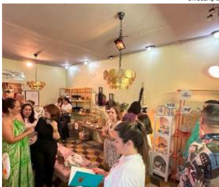
Com entrada gratuita, no conjunto Vieirals, na Zona Centro-Sul