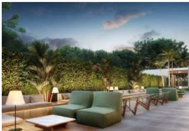
Residencial Salvador 550 é um exemplo emblemático do conceito de luxo