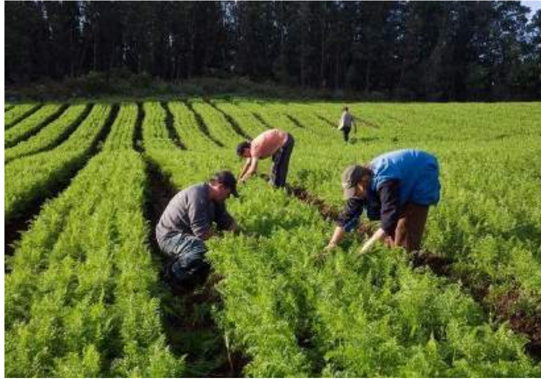
Lula diz que programa é "uma forma nova da gente enfrentar um velho problema"

O programa Terra da Gente foi apresentado com 10