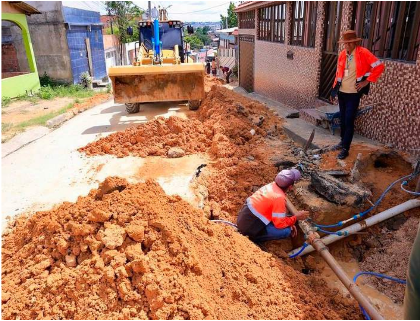
Equipe de 15 trabalhadores atuou com o apoio de uma retroescavadeira e caçamba

A equipe de 15 trabalhadores atuou com o apoio de uma retroescavadeira e caçamba e após implantar