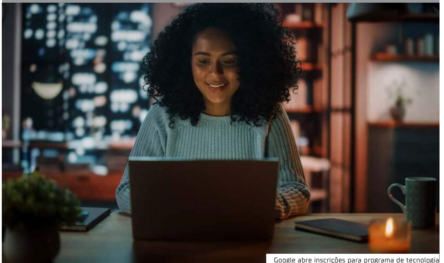
Google abre inscrições para programa de tecnologia