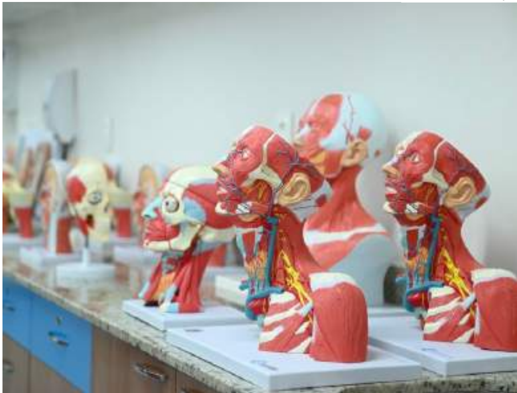
Medicina da Fametro destaca-se como o único na Região Norte a alcançar a nota máxima (5) no MEC