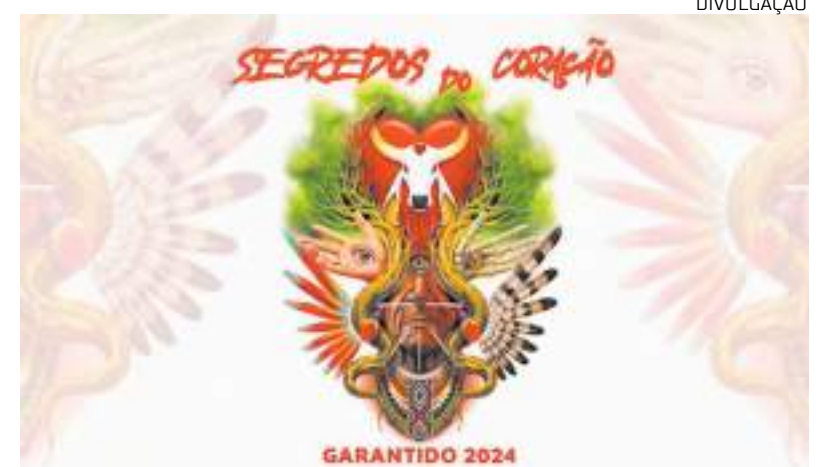
Toada 'Parintina Rainha' foi retirada de álbum do boi Garantido