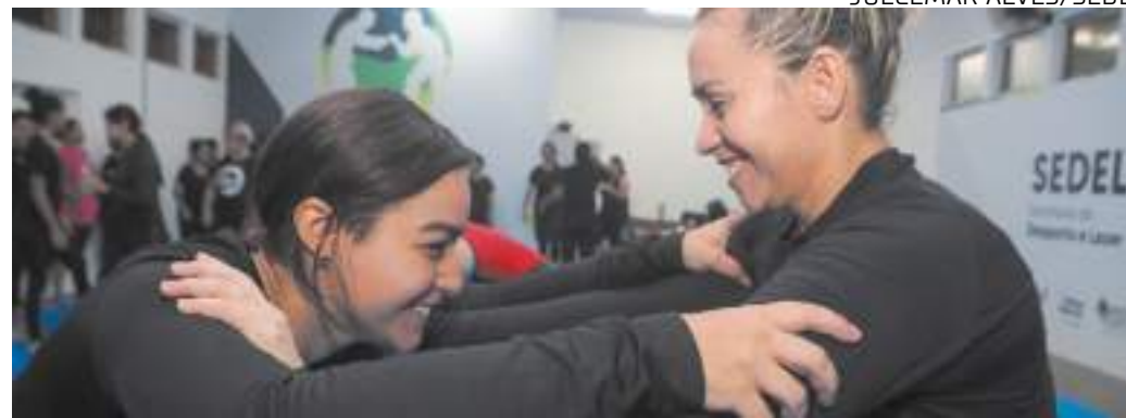
Curso de Defesa Pessoal Feminina já alcançou mais de 500 mulheres na capital e no interior do estado

"O curso de Defesa Pessoal Feminina, além de ser uma ferramenta de auto-