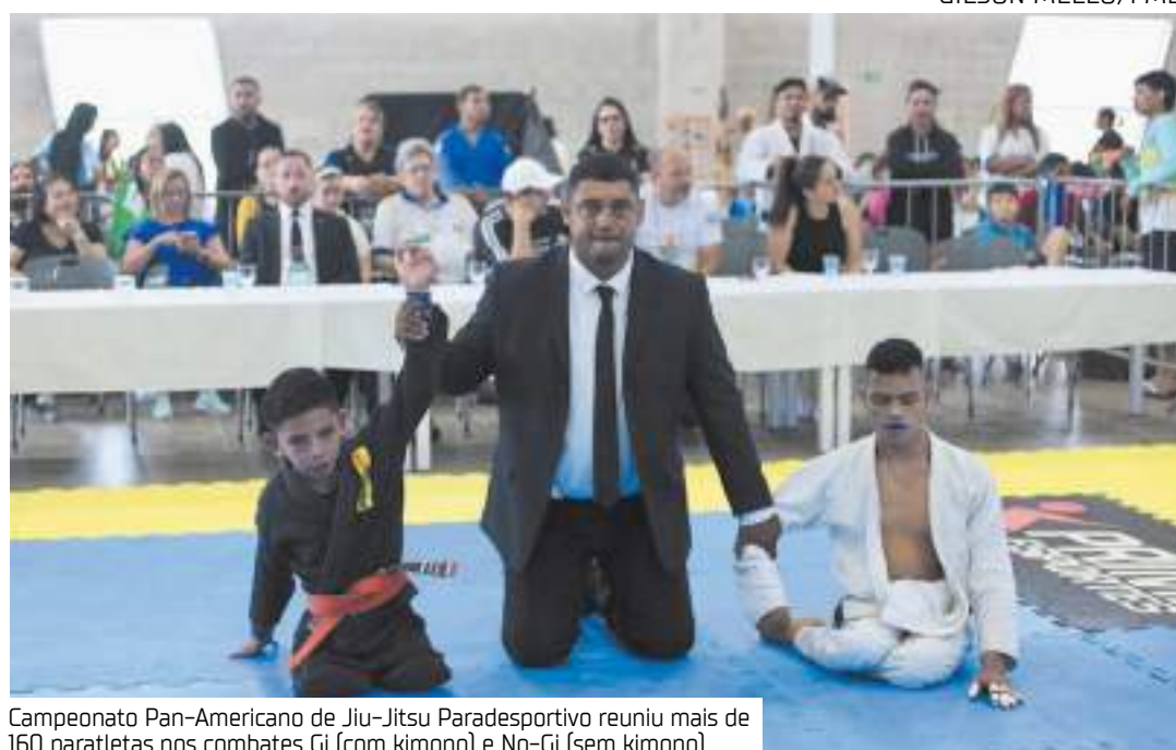
Campeonato Pan-Americano de Jiu-Jitsu Paradesportivo reuniu mais de 160 paratletas nos combates Gi (com kimono) e No-Gi (sem kimono)