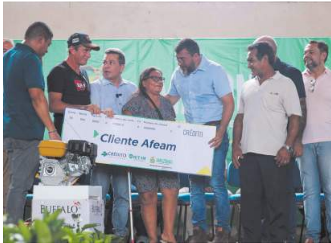
Governador do Amazonas pontuou que os investimentos vão potencializar a produção rural

O governador também inaugurou a iluminação de LED na comunidade, que recebeu 701 novos pontos de