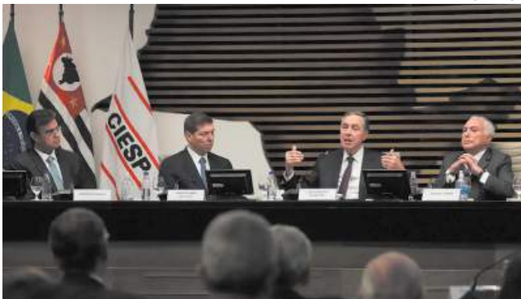
Em palestra, ministro também falou de aborto e união homoafetiva

um jovem for pego com 40 gramas de maconha na zona sul do Rio de Janeiro, por exemplo, é considerado um portador para consumo próprio; porém se o outro jovem, geralmente negro, for pego com a mesma quantidade na periferia do Rio de Janeiro, é preso como traficante.