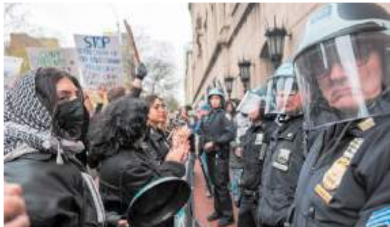
Estudantes e ativistas pró-Palestina protestam em frente a policiais