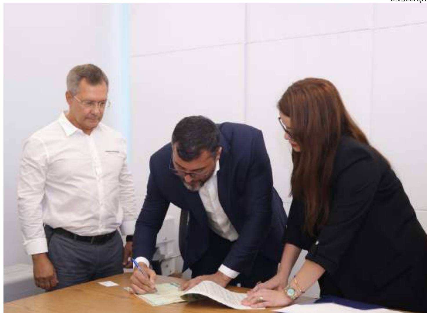
Wilson assina termos de Concessão de Direito Real de Uso de áreas de exploração de gás e petróleo

"Essa medida é de total interesse do nosso governo. A gente conseguiu quebrar o monopólio do gás natural