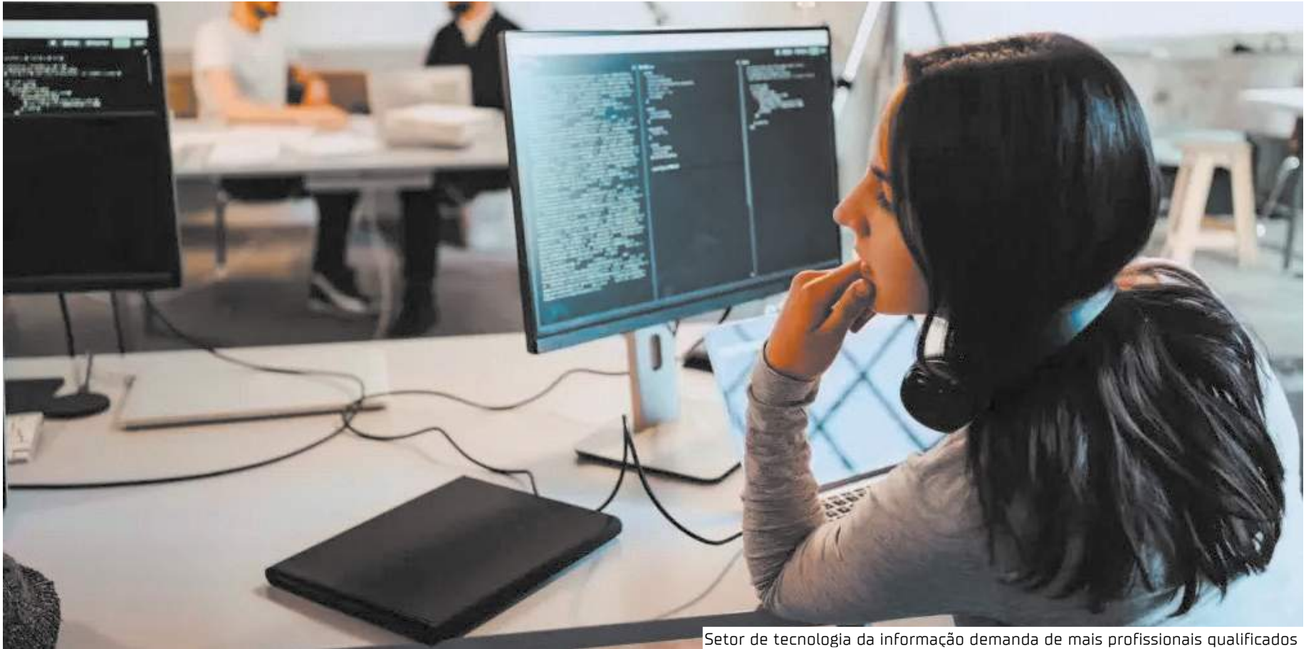
Setor de tecnologia da informação demanda de mais profissionais qualificados

“O crescimento exponencial da demanda por profissionais qualificados na área de tecnologia da informação e análise de dados reflete a urgente necessidade de uma resposta estratégica por parte das empresas e instituições de ensino. O dado