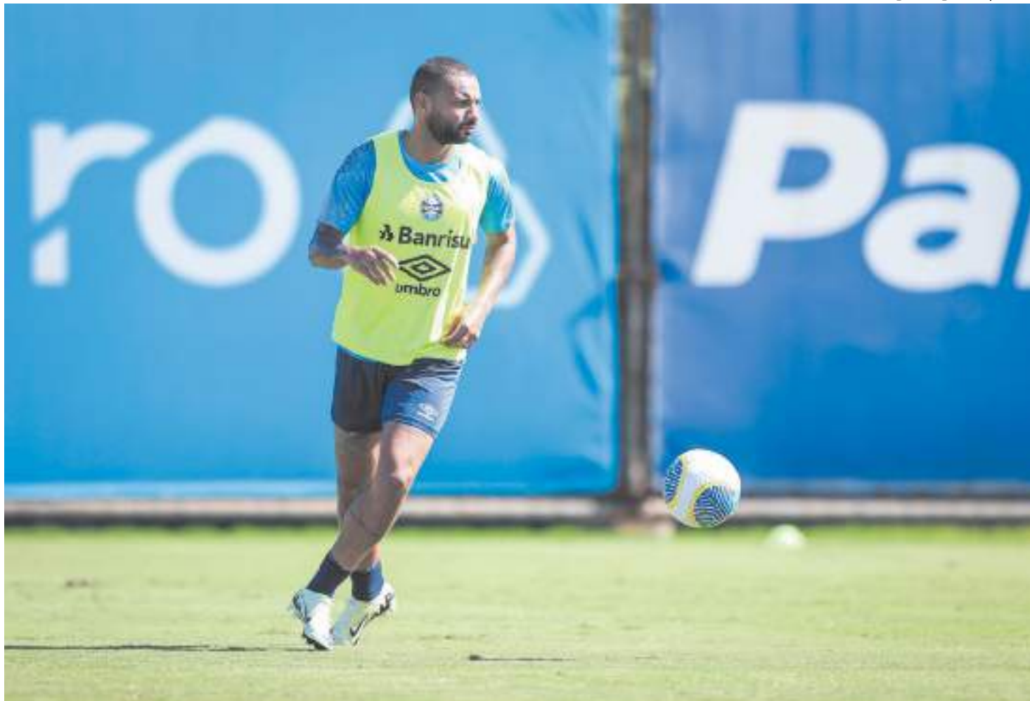
Diego Costa não viajou com a delegação, segue como desfalque e João Pedro Galvão deve ganhar sequência no comando do ataque

Os donos da casa vêm de uma sequência de cinco vitórias consecutivas, contando jogos da Libertadores e da Copa da Liga Argentina, enquanto o Grêmio ainda