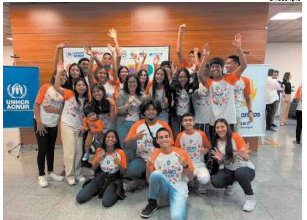
Projeto capacita jovens migrantes e refugiados venezuelanos

A Organização tem como principal objetivo promover iniciativas de acolhimento, atividades culturais, empreendedorismo e a melhoria da qualidade de vida de pessoas refugiadas e migrantes venezuelanas em Manaus, por meio da inserção no mercado local de trabalho e a promoção da dignidade. Saiba mais sobre a instituição, como apoiar e seus projetos no site: www.hermanitos.org.br .