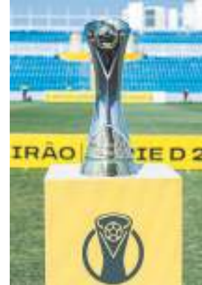
Troféu de campeão da Série D