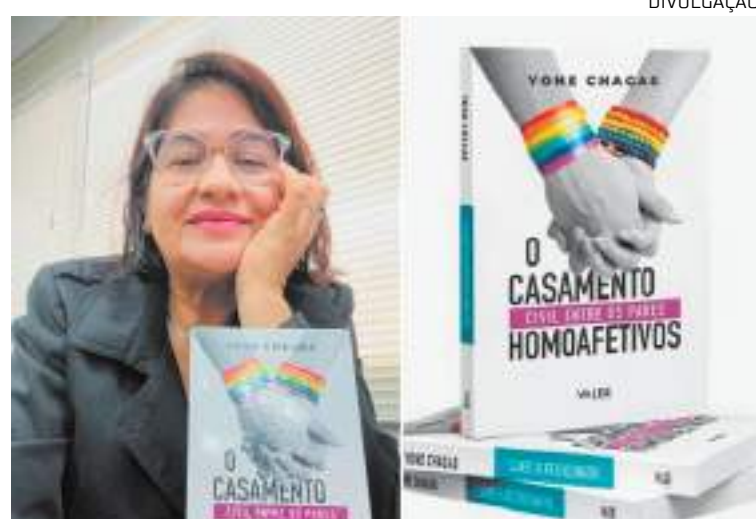
Livro será lançado na Biblioteca do ICBEU, na avenida Joaquim Nabuco, Centro