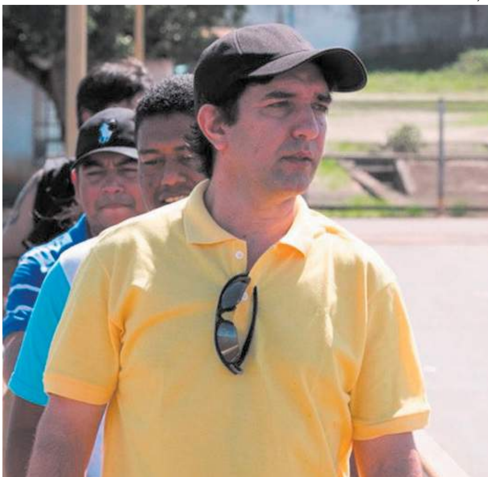
Prefeito de Itacoatiara foi multado pelo Tribunal de Contas do Amazonas