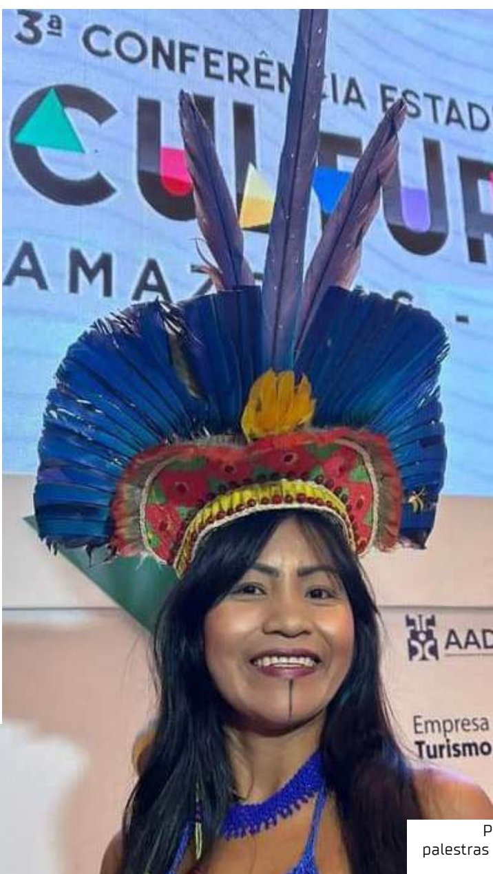
Projeto Aldeia Manaó levará oficinas, palestras e saberes dos povos indígenas para escola de Manaus

"Penso que a forma como os corpos amazônidas são construídos é diferente dos corpos do sudeste, a forma como nos movemos é peculiar, então não ter uma dança Tukano dentro das universidades? Sendo ensinada nas instituições, sendo ensinada nos cursos de formação. Então esse é um projeto feito também para nós refletirmos sobre esse lugar enquanto pesquisadores, professores e educadores de dança, de arte", complementa.