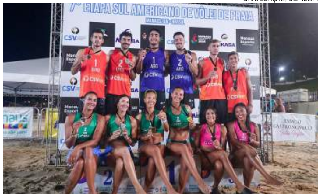
Competição contou com atletas de oito países do continente, com duplas masculinas e femininas

"Acho que todas as expectativas criadas pela Confederação Sul-Americana foram atendidas, caderno de encargos do evento todos cumpridos e, graças a Deus, Manaus entra de fato em um cenário de eventos internacionais pela capacidade que tem, também por questão ecológica, uma arena montada ao lado do maior rio do planeta. Então ficamos muito contentes, felizes de poder estar retribuindo a confiança que nos foi dada, entregando um evento genial", afirmou. Satisfeito com a condu-