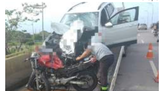
Acidente aconteceu em viaduto localizado no bairro Flores