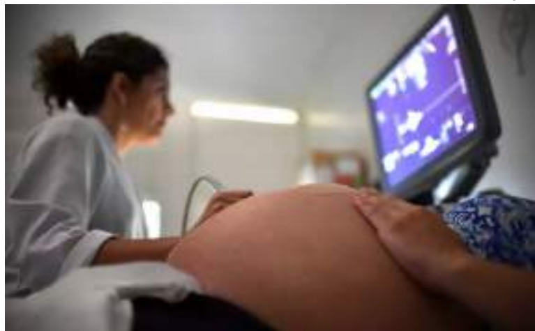
Especialista pondera que norma ignora o direito reprodutivo das mulheres