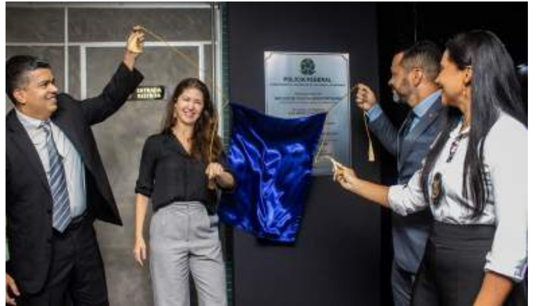
Na área de bagagens, scanners e sensores auxiliam na varredura de malas e mochilas antes do embarque

Na área de bagagens, scanners e sensores auxiliam na varredura de malas e mochilas antes do embarque. Sistemas de inteligência são usados para identificação de foragidos e pessoas desparecidas. Para a prevenção do tráfico, um bodyscan é empregado em casos sus-