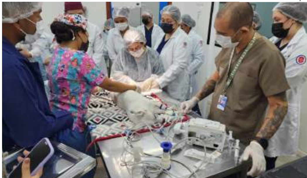
Integração entre academia e prática clínica proporciona aos futuros profissionais uma experiência valiosa