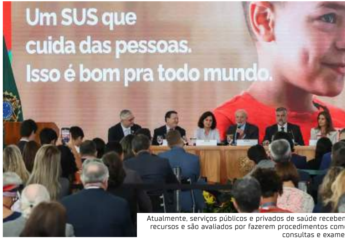
Atualmente, serviços públicos e privados de saúde recebem recursos e são avaliados por fazerem procedimentos como consultas e exames

Em março, o ministério abriu chamada pública para o SUS Digital. Em um mês, todos os