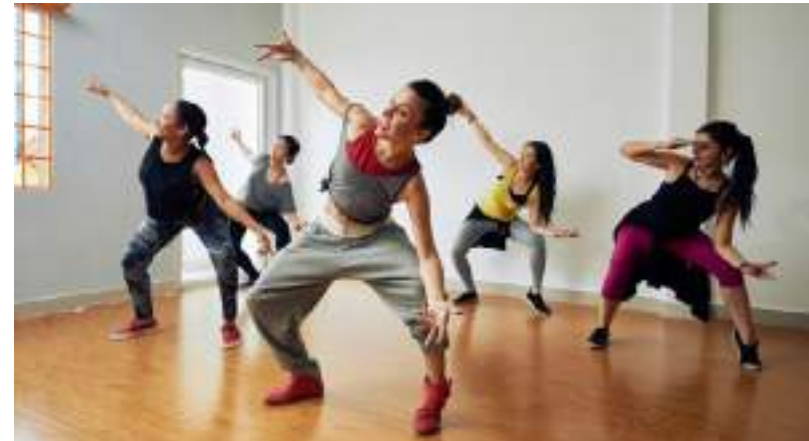
Proibição significará que músicas de estilos musicais como pop serão banidas