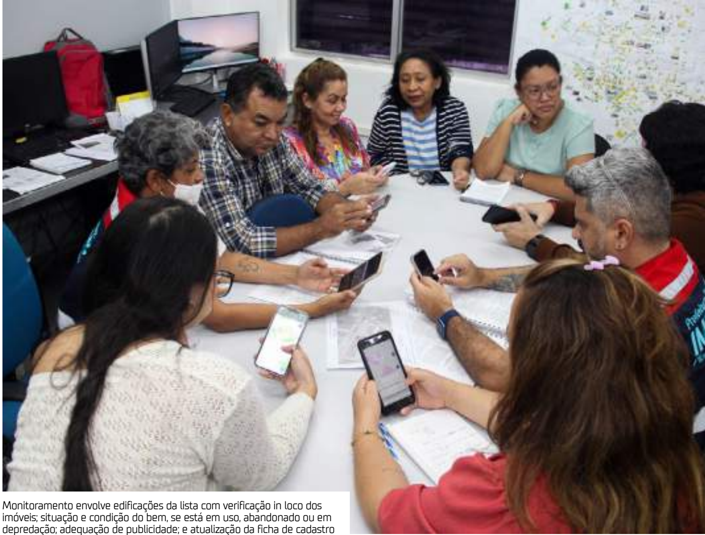
Monitoramento envolve edificações da lista com verificação in loco dos imóveis; situação e condição do bem, se está em uso, abandonado ou em depreciação; adequação de publicidade; e atualização da ficha de cadastro

O que antes envolvia todo um processo de fichas para serem preenchidas em papel, de forma manual, em campo, e depois digitalizadas no Instituto Municipal de Planejamento Urbano (Implurb), pela equipe da Gerência de Patrimônio Histórico (GPH), agora será feito pelo aplicativo, já diretamente dos pontos, casas, prédios e edifícios. O conjunto está listado no decreto que estabelece o setor especial das unidades de interesse de preservação no centro histórico.