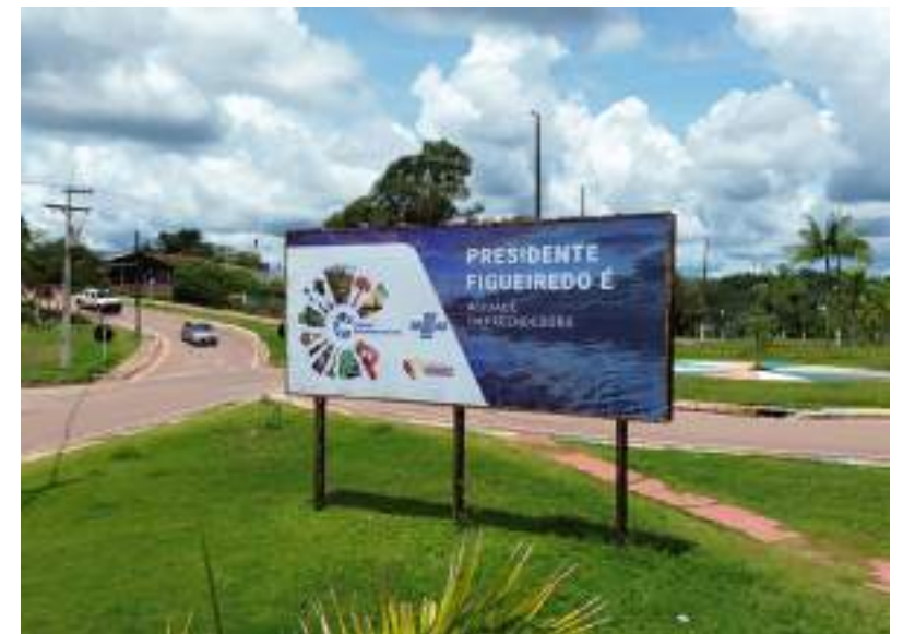
Encontro promovido pelo Sebrae-AM vai conectar líderes de iniciativas