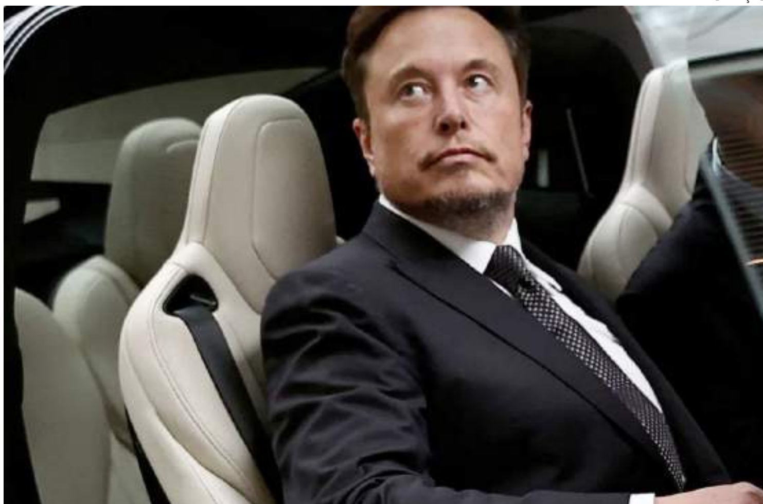
Elon Musk acredita que até 2026 a IA seja "superior" que os seres humanos

"Se você definir AGI (inteligência artificial geral) como mais inteligente do que o ser humano mais inteligente, eu acredito que provavelmente será