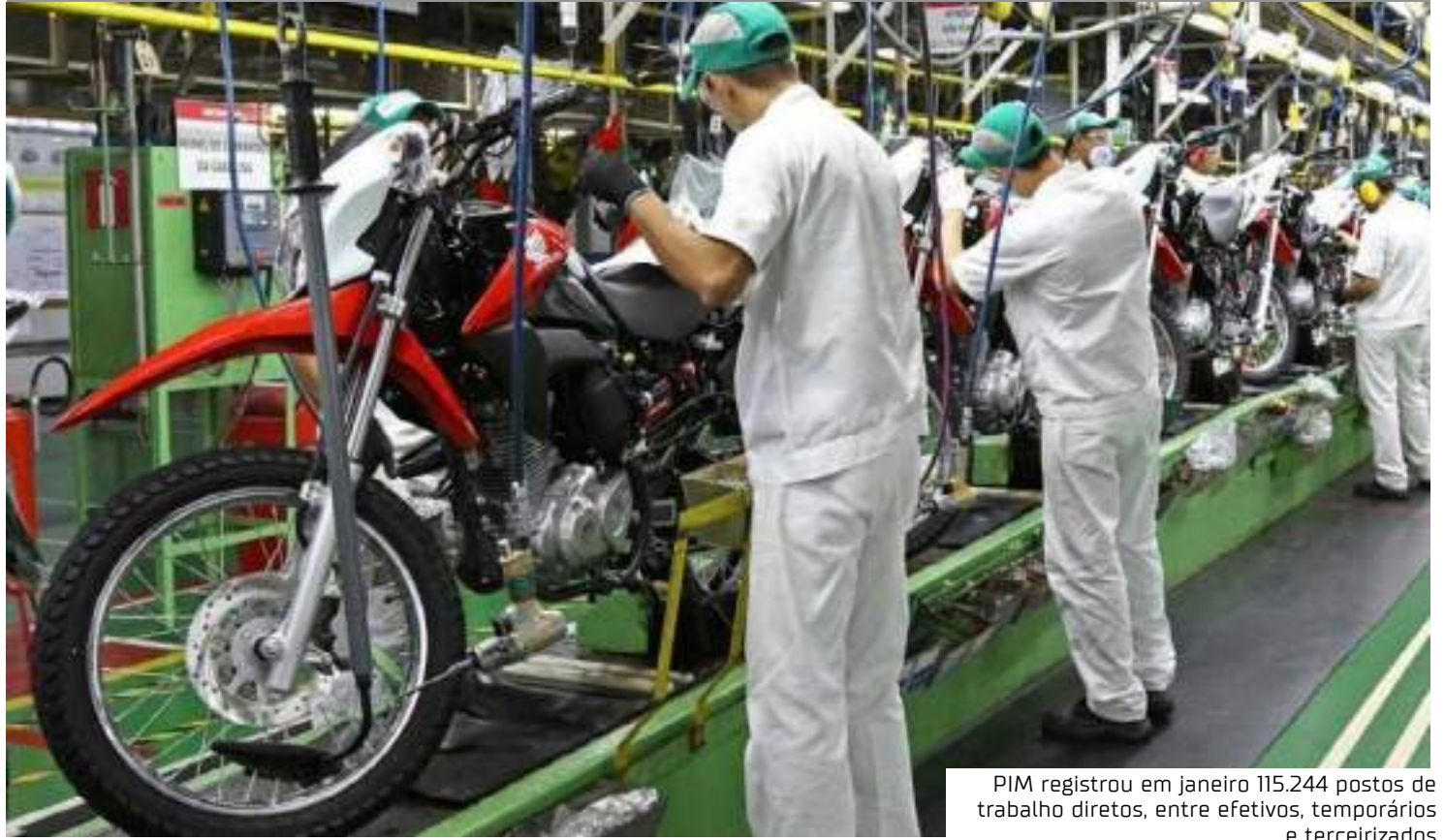
PIM registrou em janeiro 115.244 postos de trabalho diretos, entre efetivos, temporários e terceirizados

Entre os principais produtos fabricados pelo PIM, os maiores destaques, no mês de janeiro, ficam por conta da produção de receptores de sinal de televisão, com 663 mil unidades e crescimento de 179,41%; condicionadores de ar do tipo split system, com 522.539 unidades e aumento de 36,84%; condicionador de ar do tipo janela ou de parede, com 57.718 unidades e aumento de 1.474,41%; rádios aparelhos reprodutores e gravadores de áudio (não portáteis), inclusive, toca discos digitais a laser, com 64.402 unidades e aumento de 365,9%; monitores com tela de LCD (para uso em informática), com 245.398 unidades e aumento de 65,04%; fornos microondas, com 426.590 unidades e aumento de 54,83%; motocicletas, motonetas e ciclomotos, com 148.327 unidades e aumento de 14,77%; televisores com tela de LCD e OLED, com 1.169.900 unidades e aumento de 14,27%; microcomputadores portáteis, com 46.534 unidades e aumento de 327,03%.