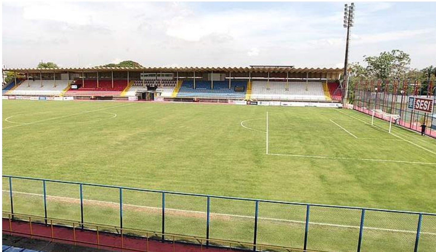
Última vez que o estádio do Sesi, recebeu uma final de Barezão foi em 2014, quando o Nacional foi campeão sobre o Princesa do Solimões