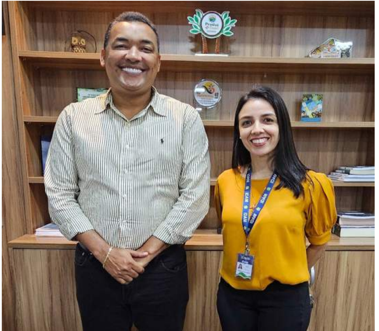
Engenheira florestal passou por setores do instituto, como a Gerência de Apoio à Produção Florestal Não-Madeireira (GPNM)