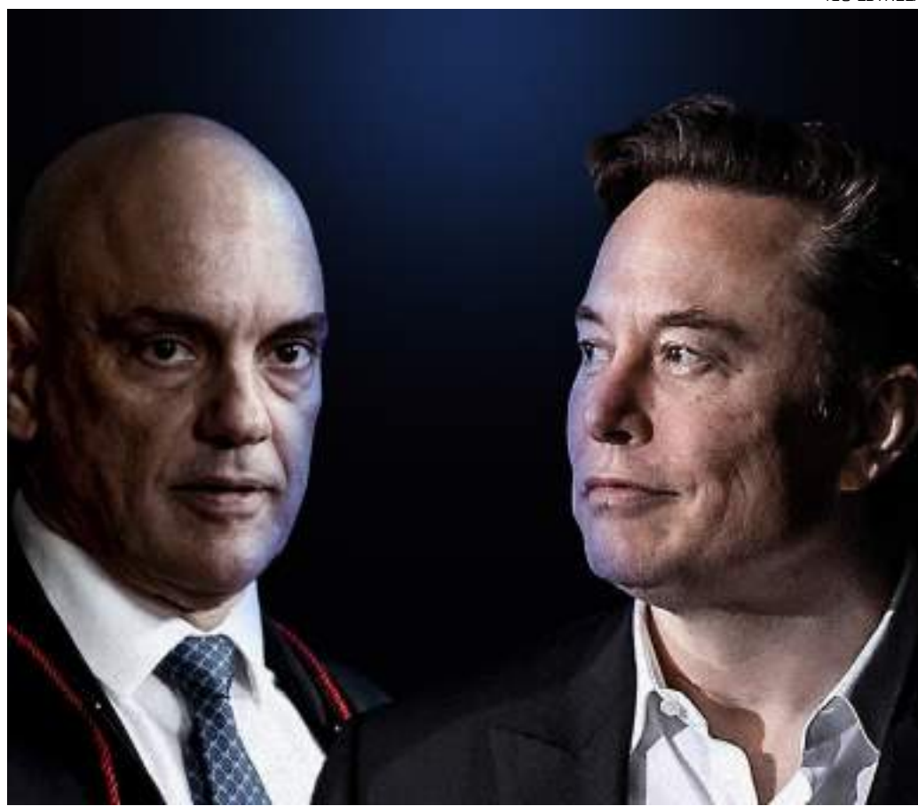
Ministro do STF, Alexandre de Moraes, e o multimilionário Elon Musk

Em outra postagem, ainda no sábado, Musk prometeu "levantar" [desobedecer] todas as restrições judiciais, alegando que Moraes ameaçou prender funcionários do X no Brasil. Já ontem (7), no início da tarde, pouco antes de o ministro divulgar sua decisão, Musk acusou Moraes de traír "descarada e repetidamente a Consti-