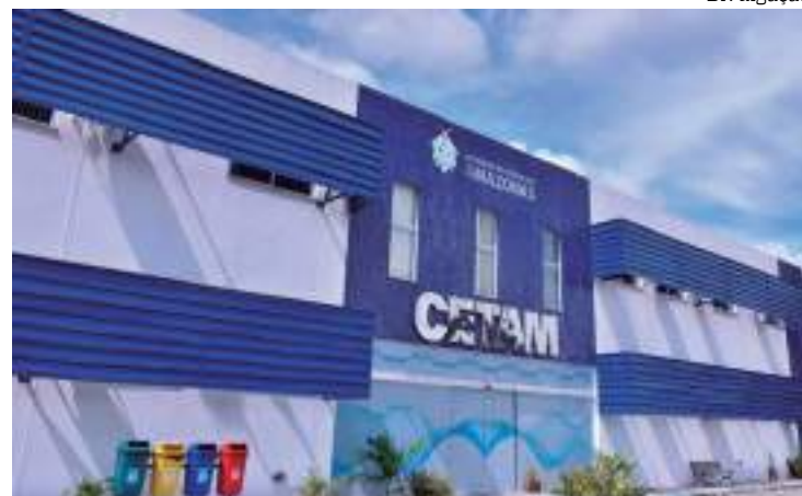
Cetam lança cursos para qualificação online

mento ao público, informática avançada, informática básica, inglês para atendimento ao público, noções de controle da qualidade, logística empresarial, marketing pessoal e profissional, noções básicas de libras para atendimento ao público, orientações financeiras para pequenos negócios, redação oficial, saberes docentes na educação profissional e tecnológica (EPT), técnicas de atendimento ao cliente.