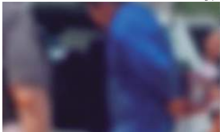
Indígena é suspeito de abusar das meninas por anos

Um indígena, de 40 anos, foi preso suspeito de estupro de filha e a enteada, no Amazonas. A prisão do homem aconteceu na terça-feira (21).