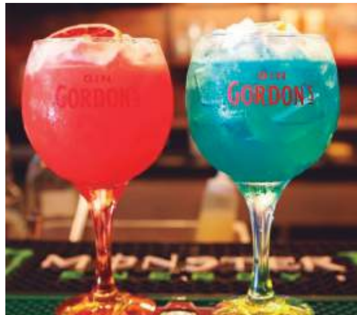
"Sangue Azul" em homenagem ao Caprichoso e "Encarnado" no Garantido

A iniciativa pioneira das casas de oferecer um cardápio especial para pets