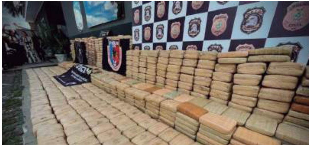
Carga de maconha do tipo skunk foi apreendida em área de mata

“Estamos mostrando a eficácia e o engajamento de todos os policiais civis e militares no enfrentamen-