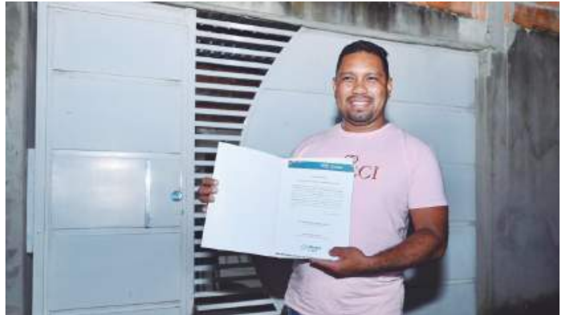
'Manaus Legal' promete beneficiar aproximadamente cinco mil famílias da capital amazonense

O acesso ao programa é viabilizado por meio da adesão à Lei do Reurb (Regularização Fundiária Urbana), que delinea as diretrizes e os procedimentos