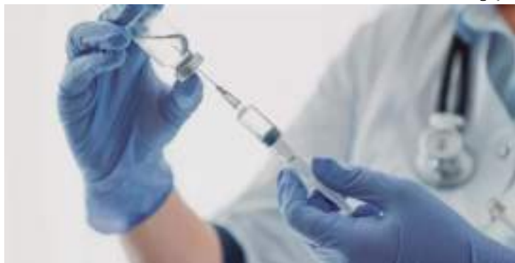
Proposta se aplica aos condenados reincidentes de crimes sexuais

A Comissão de Constituição e Justiça (CCJ) aprovou, na quarta-feira (22), o Projeto de Lei (PL) 3127/2019, que autoriza a castração química voluntária para condenados reincidentes por crimes sexuais. A matéria foi aprovada pelo colegiado, em fase terminativa – quando não passa pelo Plenário do Senado – por 17 votos favoráveis e três contrários. Agora, o tex-