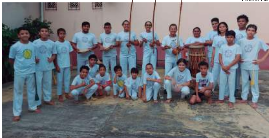
Projeto Educando com Ginga atende jovens e crianças de Manaus