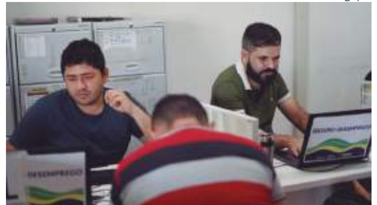
Interessados devem comparecer na sede do Sine Amazonas

O Sine Amazonas funciona em outros postos, e o cidadão pode comparecer a um deles caso não consiga ir até o posto central, são eles: PAC Studio 5, PAC Alvorada, PAC Via Norte e PAC Shopping Cidade Leste, para concorrer às vagas ofertadas.