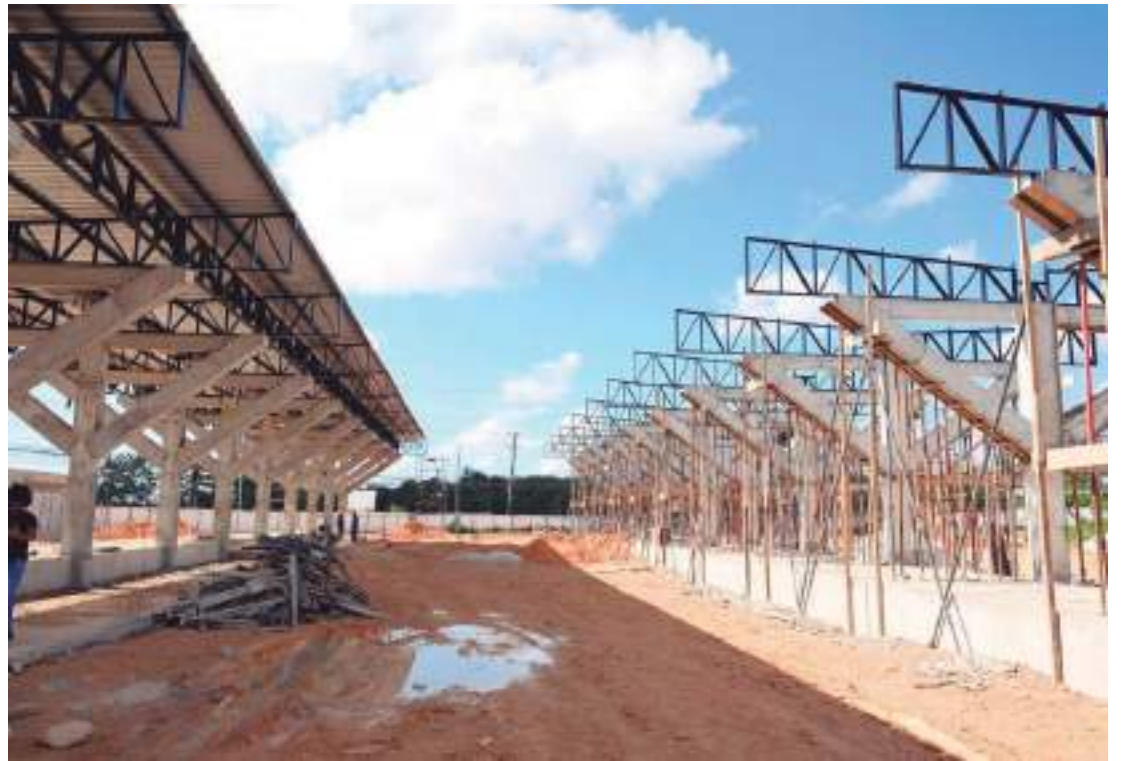
Novo terminal da cidade terá quatro mil metros quadrados de área construída e deve inaugurar em junho

O projeto também inclui guarita, sala dos motoristas, sanitários feminino, masculino e para Pessoas com Deficiência (PcDs), salas da Secretaria Municipal de Limpeza Urbana (Semulsp), do Sindicato das Empresas de Trans-