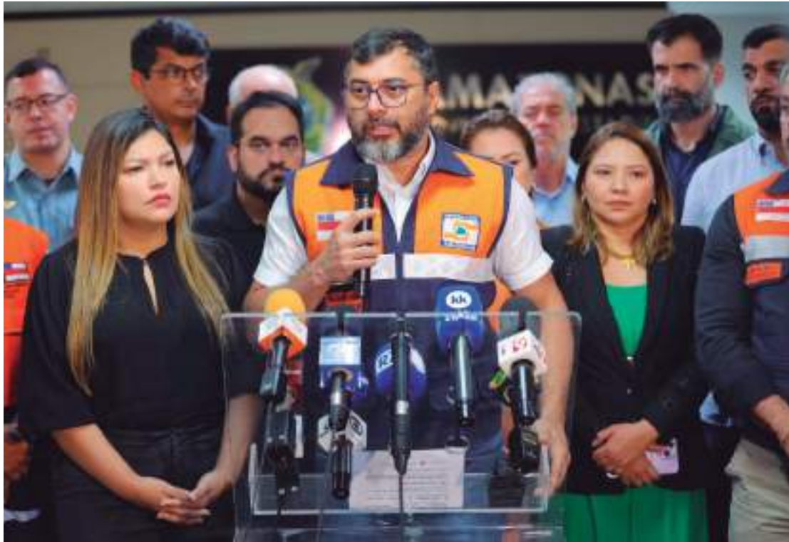
Governador tem coordenado o planejamento de ações e ido a Brasília em busca de apoio do Governo Federal

Nesta semana, em Brasília, Wilson Lima também se reuniu com representantes da Eletrobrás para tratar sobre a segurança energética, especialmente