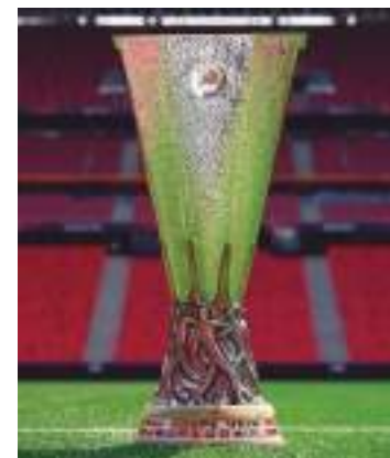
Final acontece no dia 22 de maio

Na etapa complementar, o lateral Ruggeri e o atacante El Bilal Touré garantiram a classificação dos italianos para a grande decisão Liga Europa.