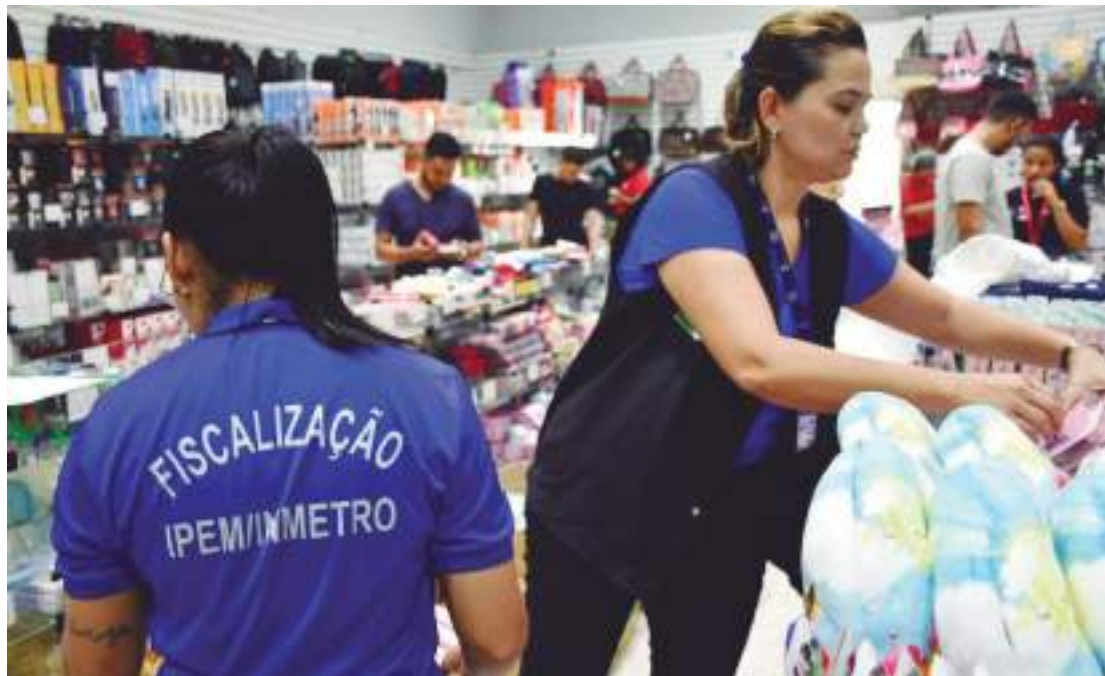
Material retirado do mercado não tinha certificação do Instituto Nacional de Metrologia, Qualidade e Tecnologia

O estabelecimento em que foram constatadas as irregularidades terá um prazo de dez dias para apresentar defesa junto ao IpeM-AM, sob pena de multas que variam de R$ 1 mil a R$ 1,5 milhão.