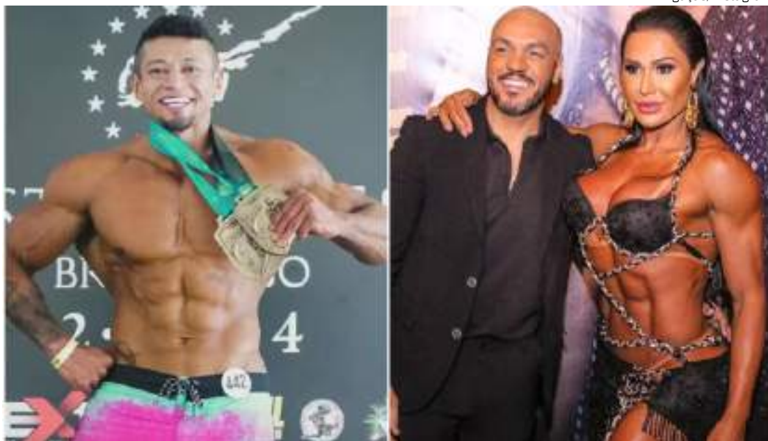
Após a separação do casal, vieram à tona rumores de um affair entre a musa fitness e um personal

Gracyanne Barbosa voltou a falar sobre o término com o cantor Belo após 16 anos de casamento e disse que não considera o affair que viveu uma traição.