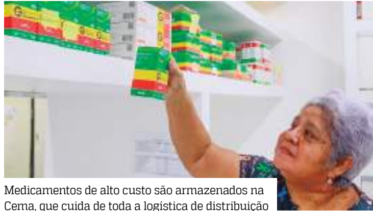
Medicamentos de alto custo são armazenados na Cema, que cuida de toda a logística de distribuição

“Esses medicamentos são desenvolvidos para tratar doenças graves e crônicas,