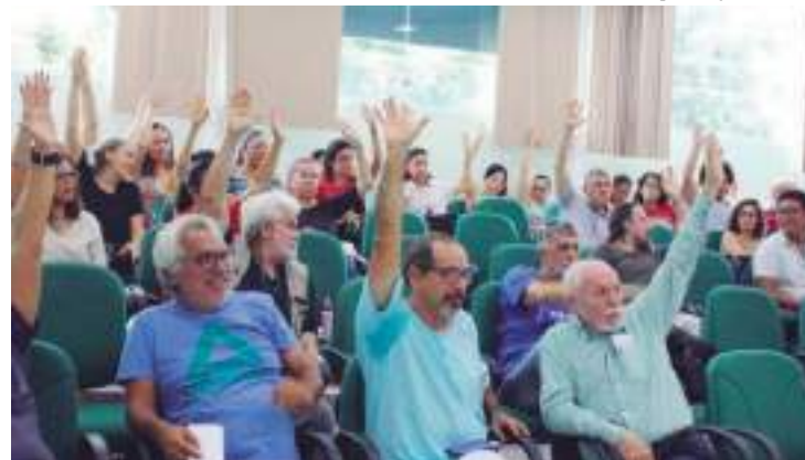
Até o momento, 47 instituições federais já aderiram à greve

Nas redes sociais, estudantes da instituição recebem a decisão dos docentes da Ufam de maneira positiva.