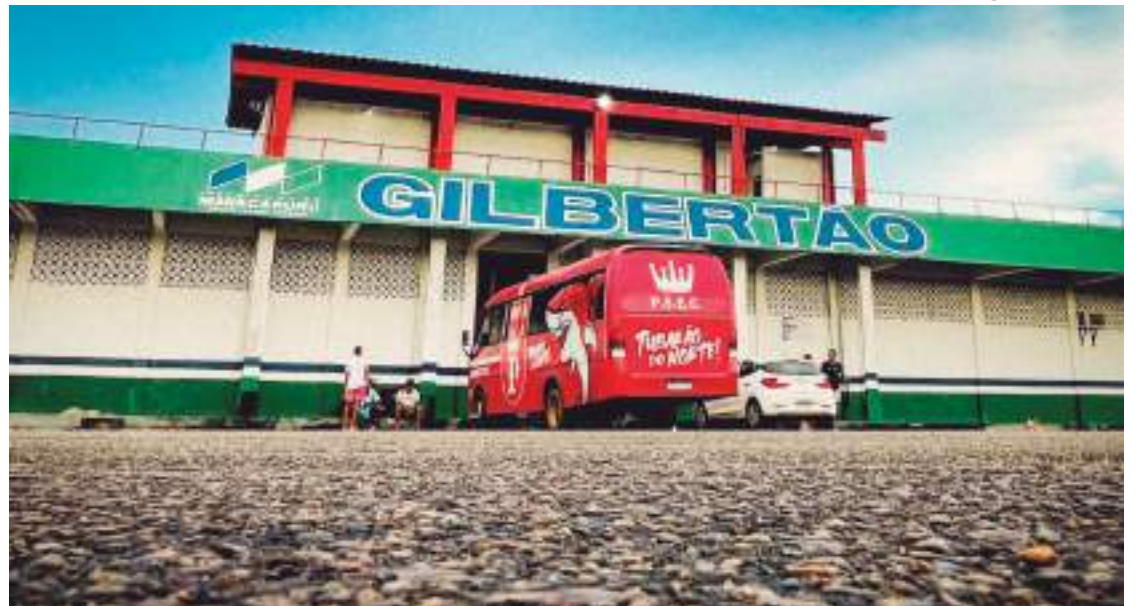
Estádio Gilbertão se torna o principal ponto de doações para os desabrigados do RS em Manacapuru

O Estádio Gilbertão se torna o principal ponto de doações para os desabrigados do Rio