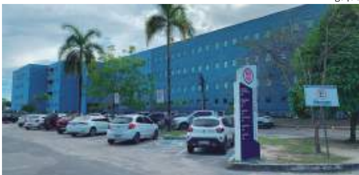
Previsão é enviar donativos ainda neste final de semana para o Sul

O Grupo Nilton Lins está realizando uma campanha de arrecadação de ração e alimentos para os pets e animais vítimas da enchente no Rio Grande do Sul.