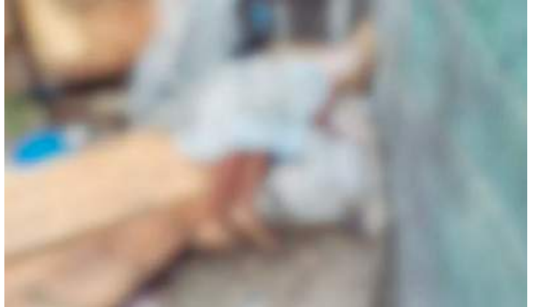
Corpo de morador de rua foi encontrado em terreno baldio

“As primeiras informações que tivemos foi de que o autor esteve no terreno baldio onde o corpo