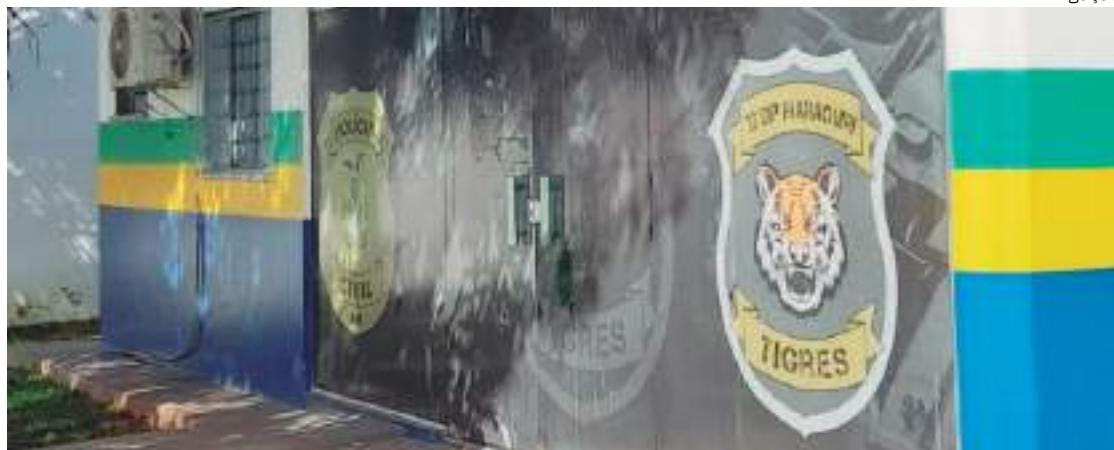
Pastor foi preso suspeito de estupro em Manaquiri

Um pastor, de idade não identificada, foi preso na quarta-feira (8), suspeito de estuprar a própria enteada, de 17 anos, em Manaquiri, no interior do Amazonas.