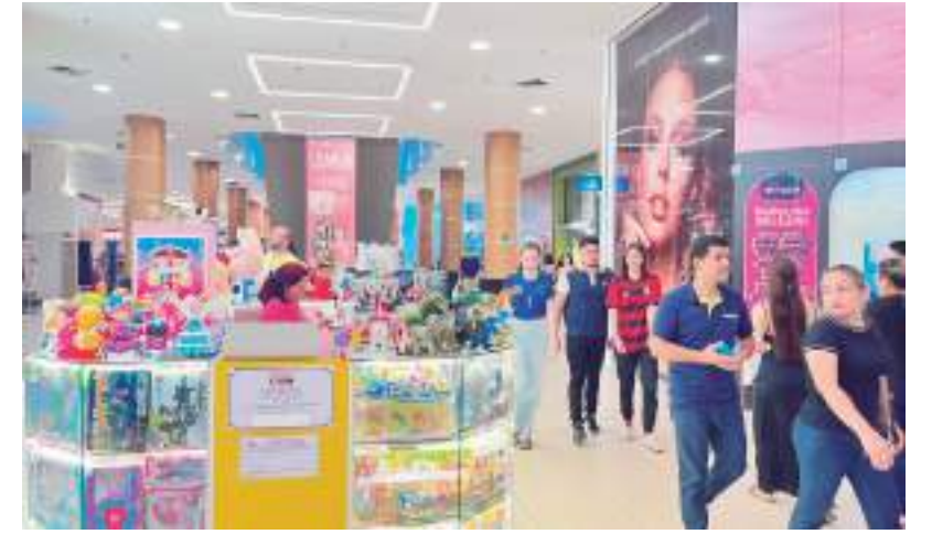
Shopping de Manaus oferta presentes para o Dia dos Namorados