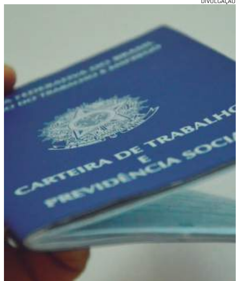
Empresas demitem jovens após 30 dias do início do trabalho

membros da Geração Z apreciam o retorno imediato sobre seu trabalho e valorizam a comunicação aberta com seus gestores. Portanto, promover uma cultura de feedback construtivo pode fortalecer a relação entre os colaboradores e a empresa, incentivando a permanência e o engajamento dos jovens profissionais.