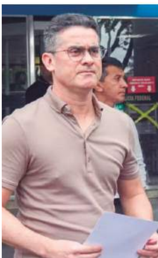
Ataques tinham como objetivo diminuir o alcance da rede social dos pré-candidatos