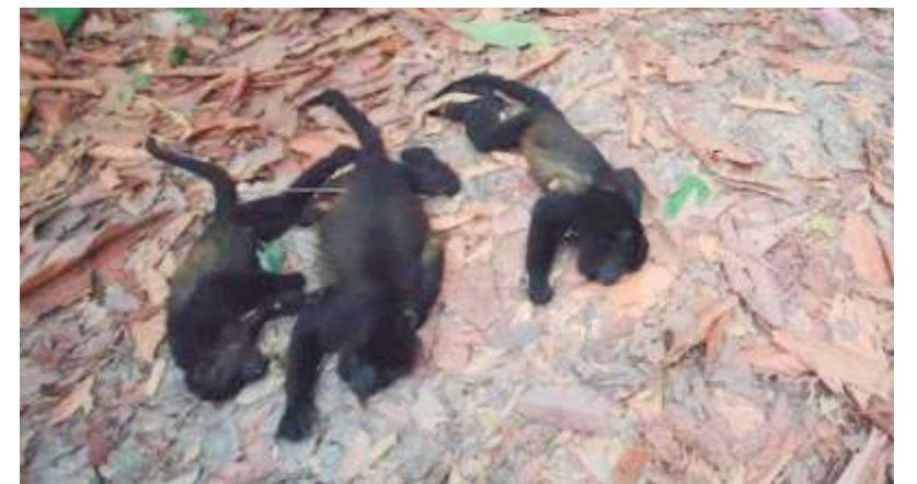
Biólogos mexicanos trabalham para resgatar macacos bugios na floresta