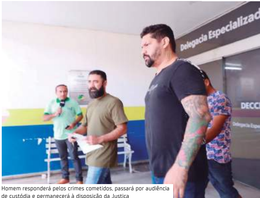
Homem responderá pelos crimes cometidos, passará por audiência de custódia e permanecerá à disposição da Justiça