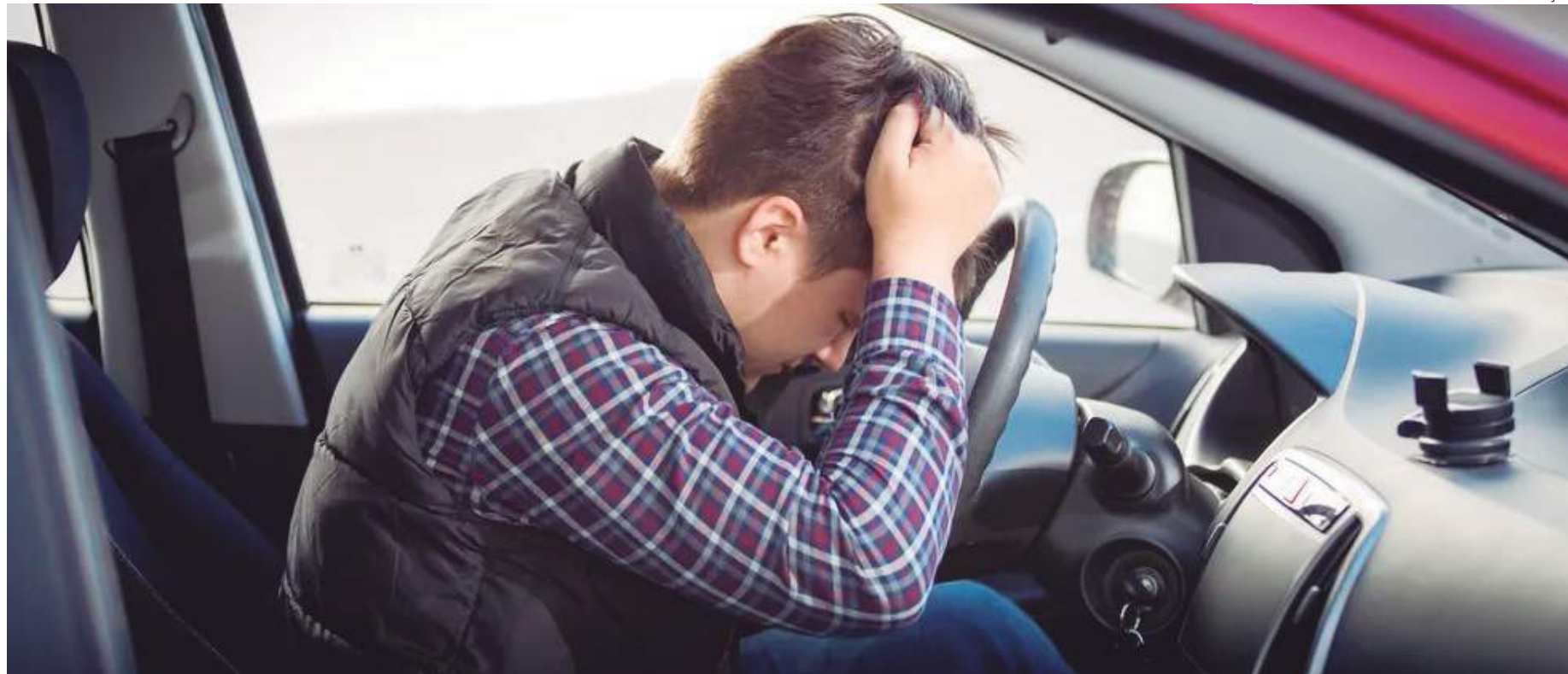
Motoristas de aplicativos estão trabalhando mais e ganhando menos

Os dados estão no estudo "Plataformização e Precariza-