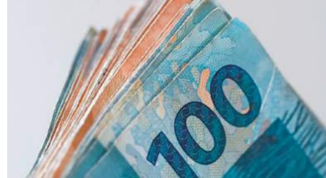
Inteligência artificial poderia contribuir para crescimento da economia

Mas há uma parte positiva: a revolução da IA também pode apresentar uma oportunidade para diminuir as diferenças de gênero na América Latina. Mais de 60% das mulheres na América Latina frequentam a universidade, em comparação com menos de 50% dos homens, deixando-as preparadas com as habilidades necessárias para prosperar na revolução da IA. A criação de novos empregos poderia apresentar uma oportunidade importante para as mulheres aumentarem, de 10 a 20%, seus