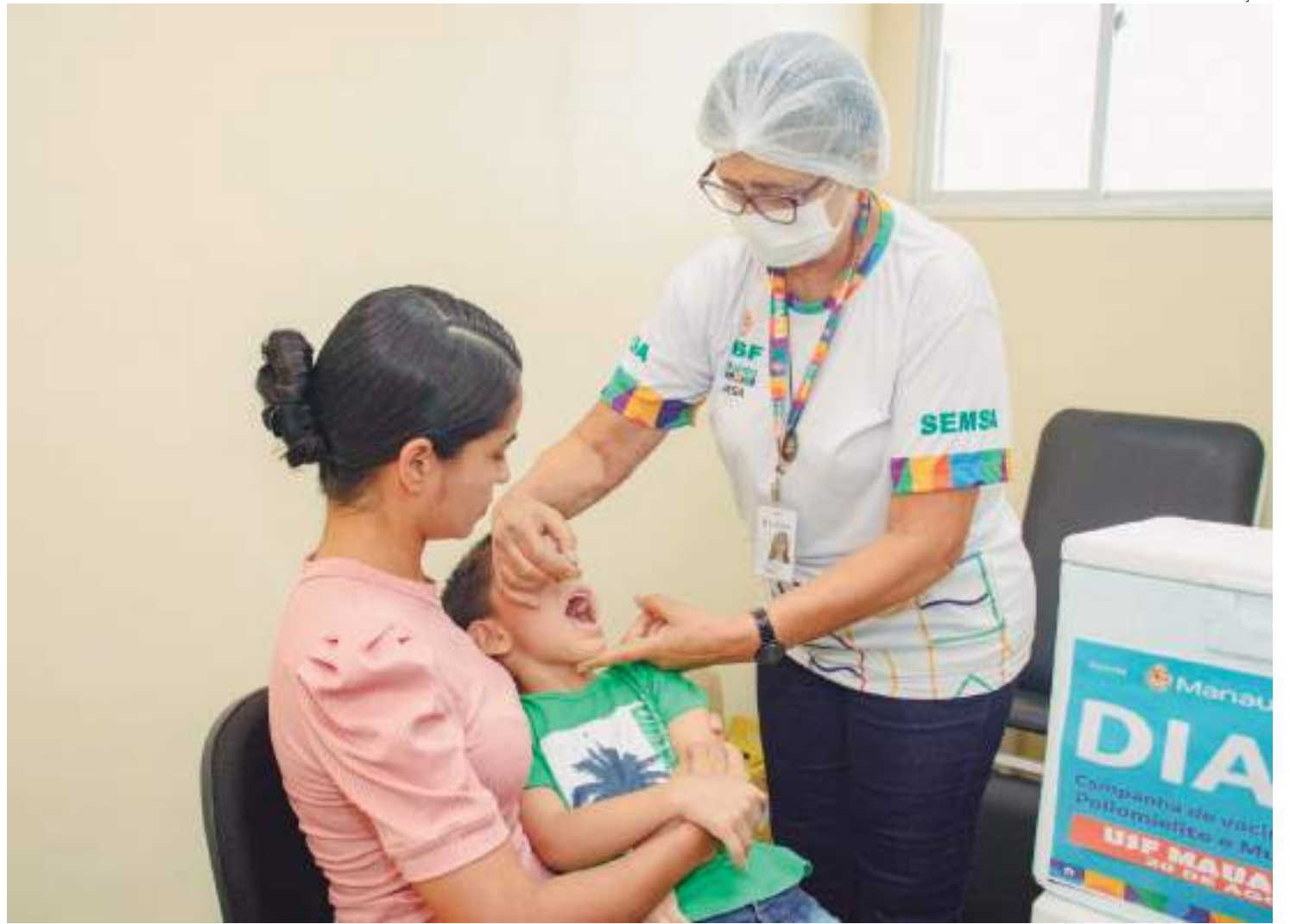
Servidora da Sems dando gotinha para menino no colo da sua mãe em unidade de saúde