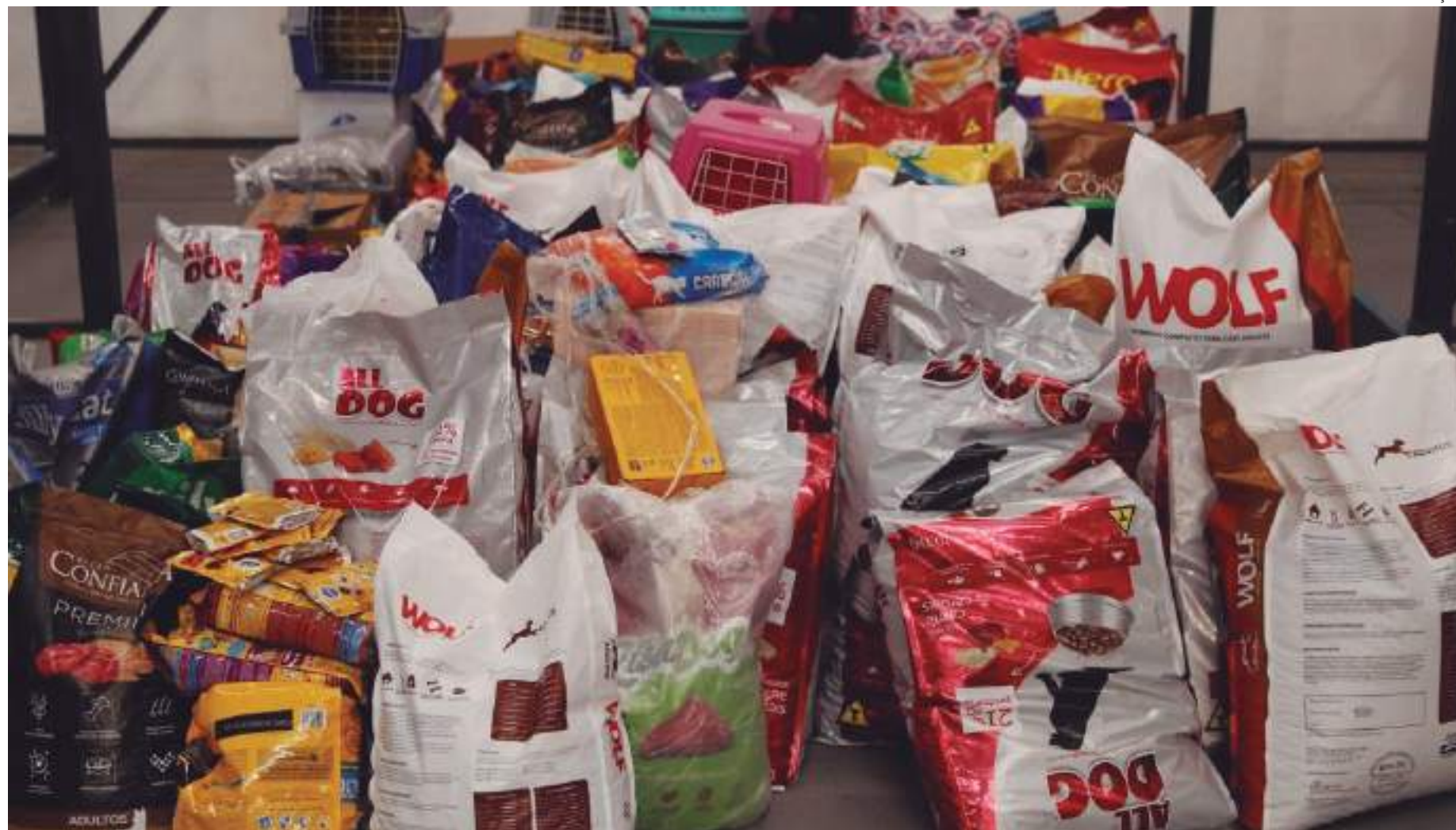
Entre os itens arrecadados pela Defesa Civil estão alimentos de primeira necessidade, água potável e insumos veterinários

A campanha contou com 16 postos de arrecadação, sendo um deles para recebimento exclusivo de itens veterinários. As doações foram feitas por pessoas físicas, entidades pri-