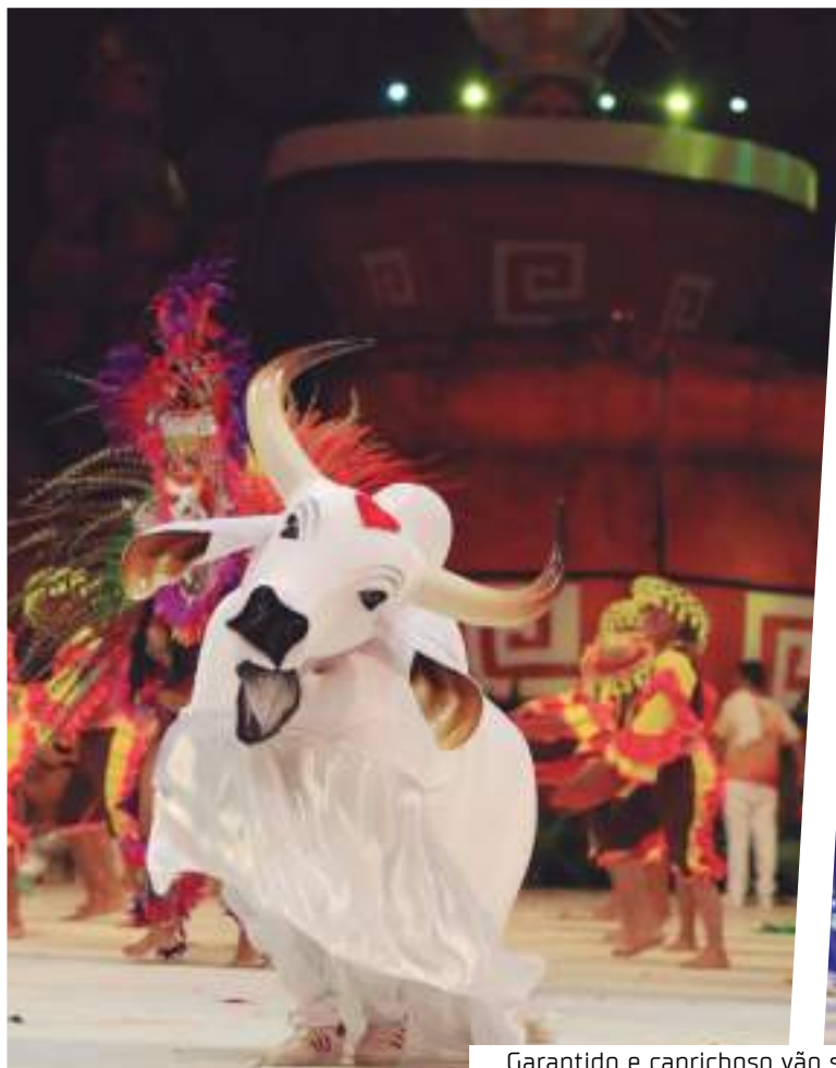
Garantido e caprichoso vão se apresentar no Maranhão

Popularmente conhecido por reunir música, manifestações culturais e dança, o São João da Thay também promove a