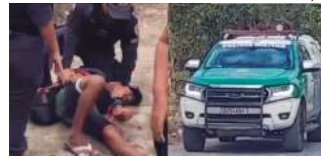
Equipe do EM TEMPO ainda não teve retorno da PMAM