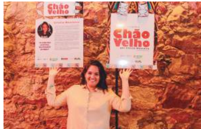
Prefeitura apresenta exposição fotográfica que conecta passado e presente