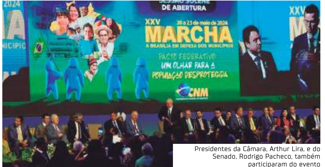
Presidentes da Câmara, Arthur Lira, e do Senado, Rodrigo Pacheco, também participaram do evento

O valor das dívidas de 4,2 mil prefeituras com a Previdência Social é de R$ 248 bi-