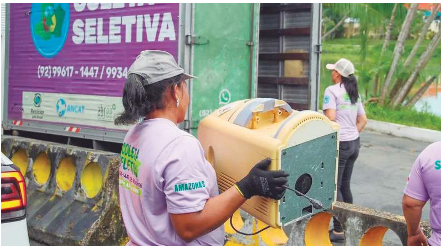
Abree realiza ação neste sábado (25), das 10h às 17h, no Passeio do Mindú, Zona Centro-Sul da capital amazonense