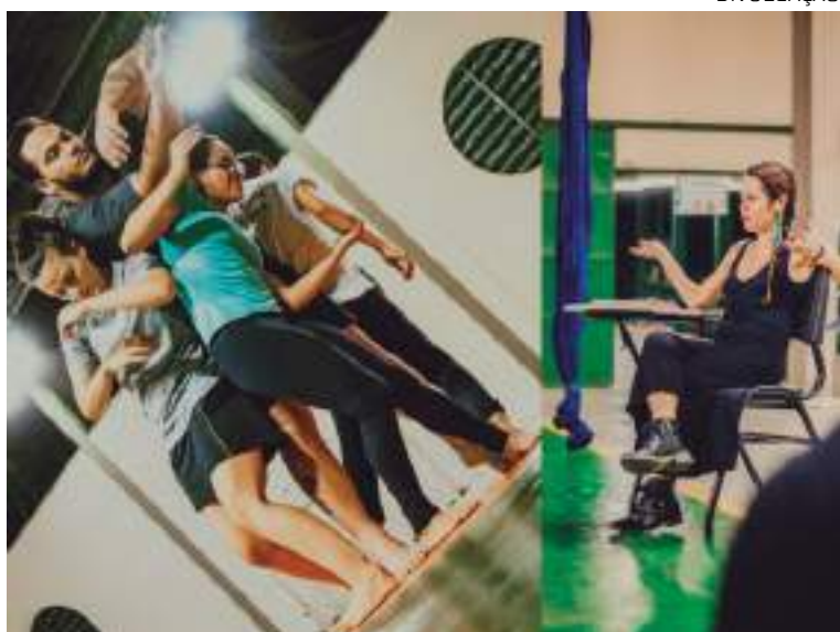
Espectáculo circense contemporâneo 'Ybatinga' estreia nesta quarta-feira [22]