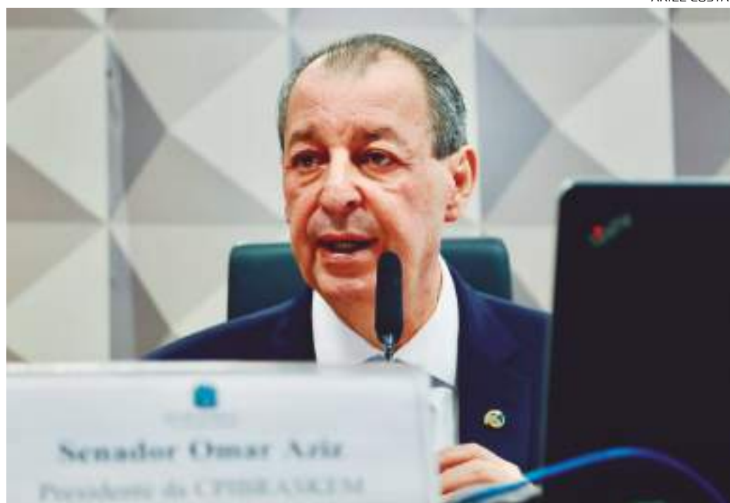
Parlamentar do Amazonas afirma que acordos não trouxeram justiça para as famílias afetadas

O caso da Braskem em Maceió remonta a anos de exploração de sal-gema na região. Desde o início das operações da empresa, na década de 1970, comunidades locais já expressavam preocupação com os possíveis impactos socioambientais da atividade minerária. Somente nos últimos anos a gravidade do problema veio à tona, culminando na identificação do afundamento do solo como resultado direto da exploração de sal-gema em uma área de 3,6 km 2 , na região da laguna Mundaú. A