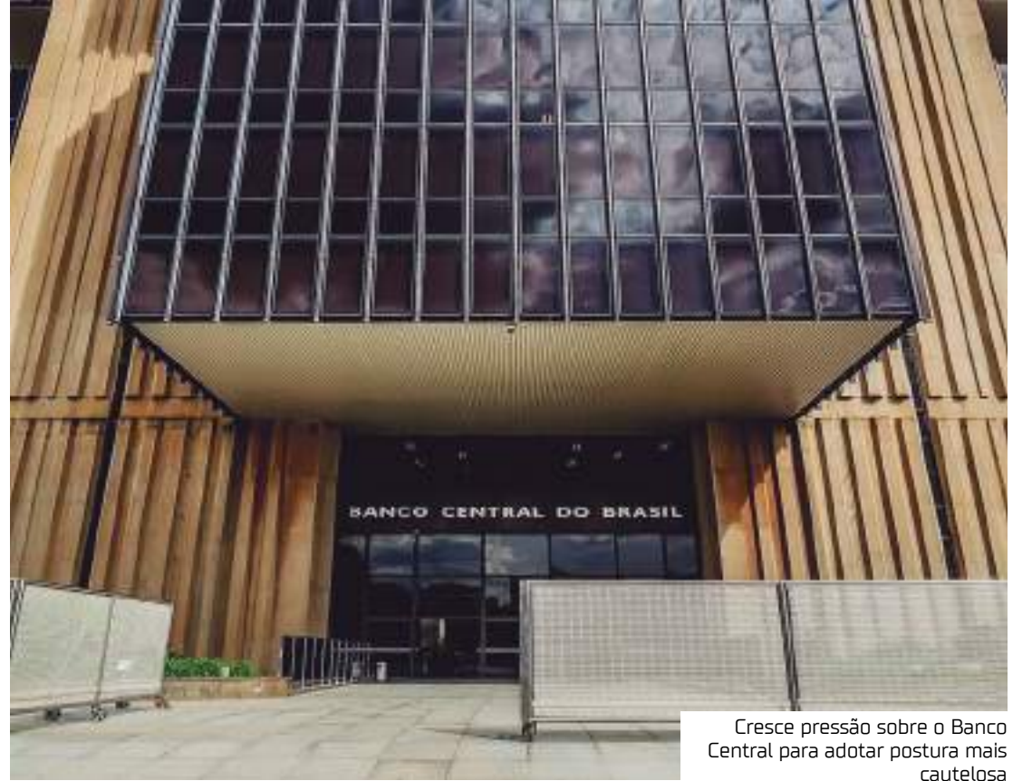
Cresce pressão sobre o Banco Central para adotar postura mais cautelosa

"Entendemos que esta elevação das expectativas para 2024 e 2025 tem a ver com a desvalorização cambial e incertezas na formação de preços de alguns itens alimentícios — na esteira das intempéries climáticas que assolam o Sul", comenta. A consultoria elevou sua estimativa para a alimentação no domicílio em 2024 de 3,9% para 4,5%, mas manteve a de 2025 em 4,9%.