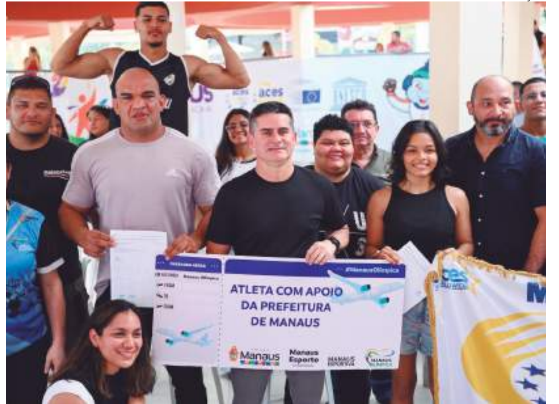
Programa tem o intuito de captar e receber os destaques do projeto 'Manaus Esportiva' para que sejam apoiados

"Hoje é um dia muito feliz na minha vida e na minha carreira de atleta, pois estou realizando um grande sonho, que é fazer parte do maior evento de MMA fe-