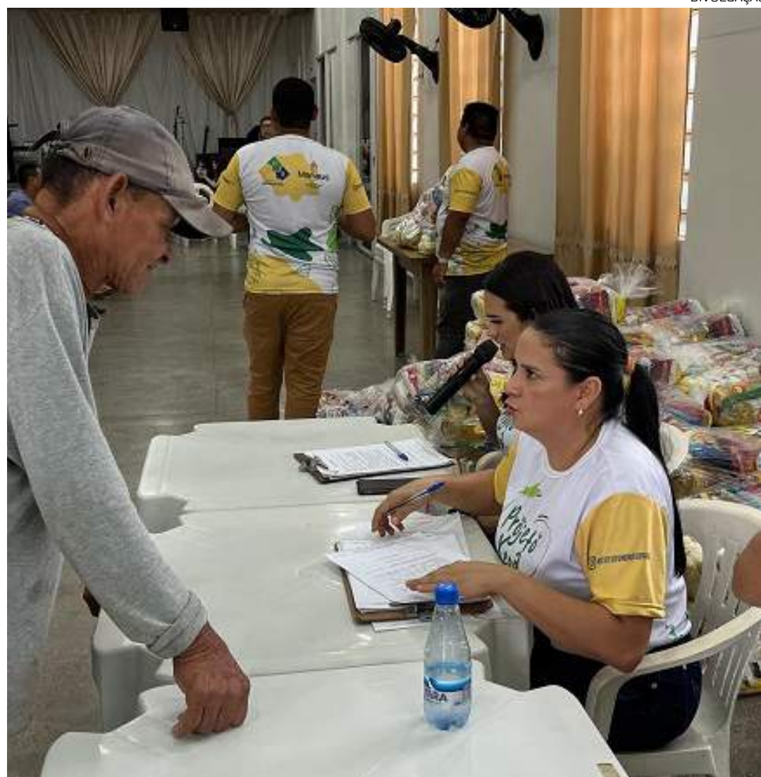
Projeto promove ações socioassistenciais para moradores

O INB, fundado em 2019 por amigos comprometidos com a ajuda a pessoas em vulnerabilidade social, tem como objetivo promover a proteção básica, valorizando a dignidade humana e a qualidade de vida.