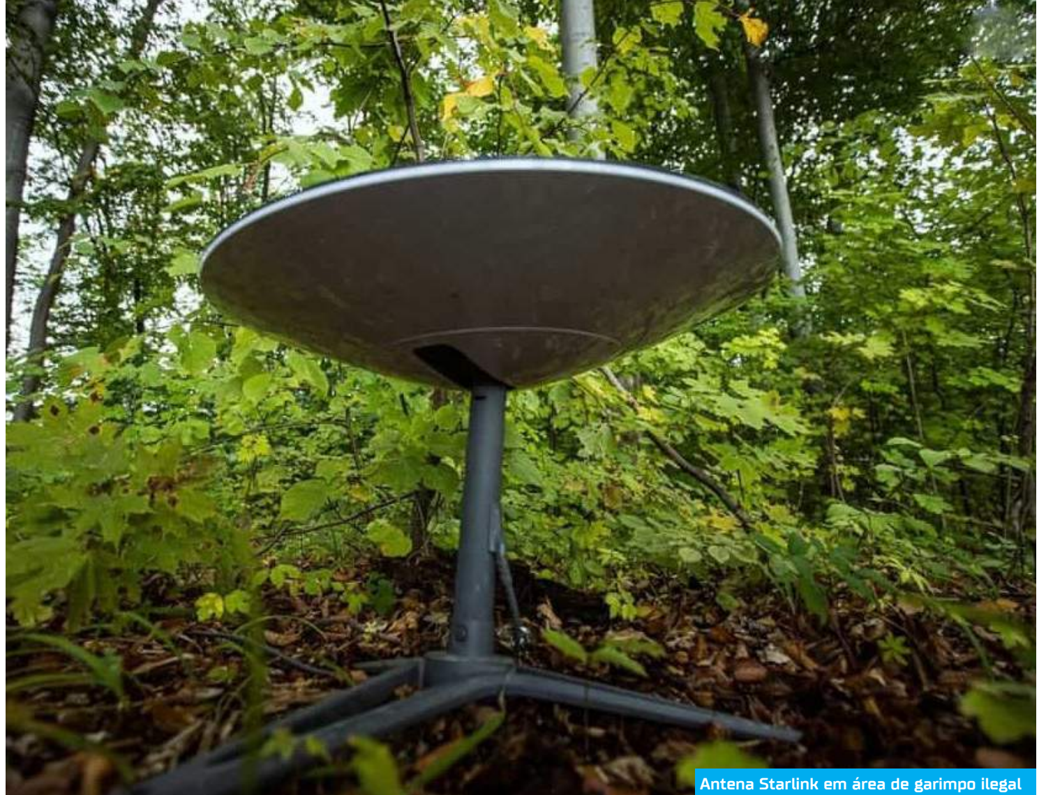
Antena Starlink em área de garimpo ilegal