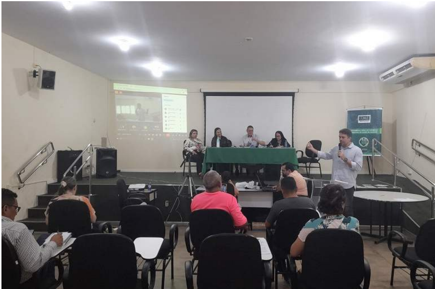
Projeto Farmácia Viva foi apresentado para conselheiros municipais de saúde