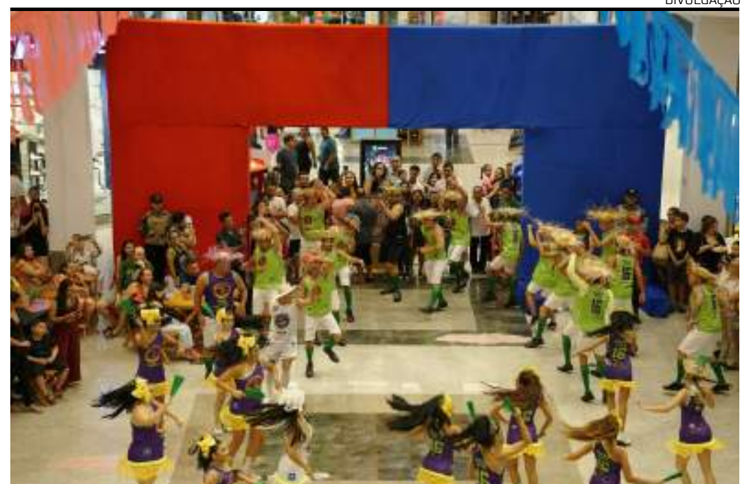
Arraial do Amazonas Shopping inicia nesta sexta-feira (31) e vai até 9 de junho

O Arraial do Amazonas Shopping segue durante toda a semana. Na segunda-feira (03) às 19h se apresenta Monaliza Ranielly. Terça-feira (4) no mesmo horário terá show de Leonardo Castelo