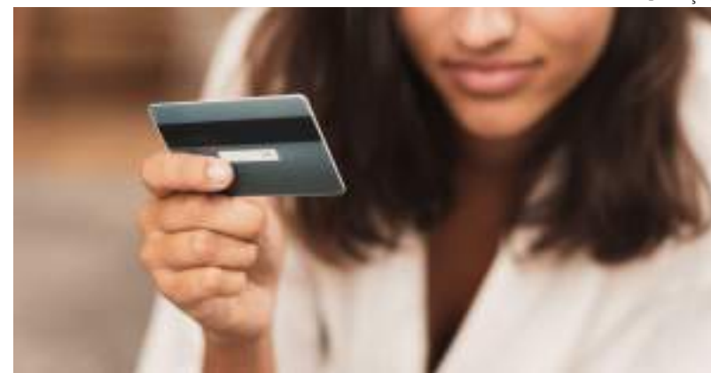
Manual visa alertar para risco do endividamento com cartão de crédito