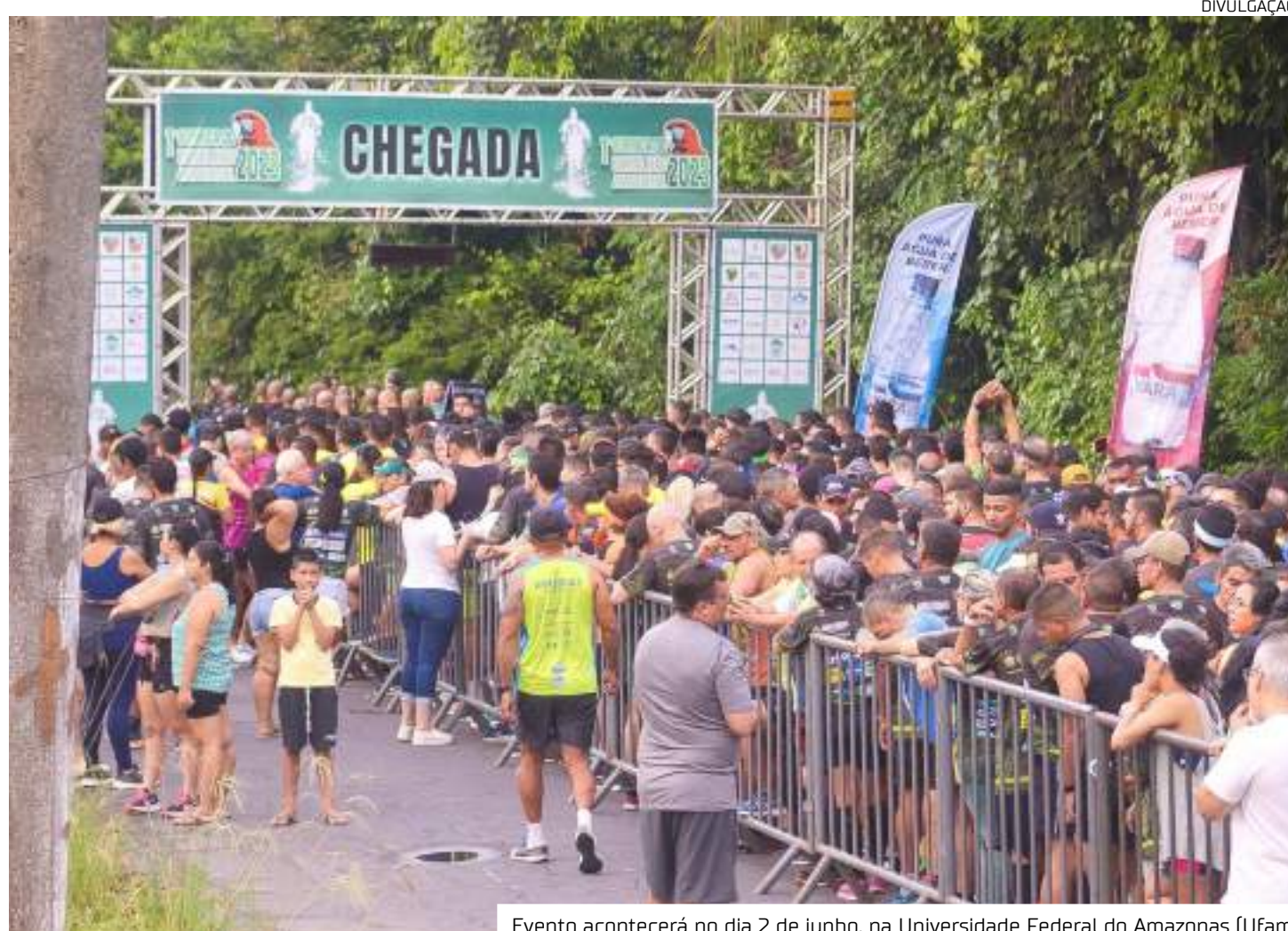
Evento acontecerá no dia 2 de junho, na Universidade Federal do Amazonas (Ufam)

O horário de largada da corrida será às 6h (horário de Manaus), no pátio de largada/chegada que fica