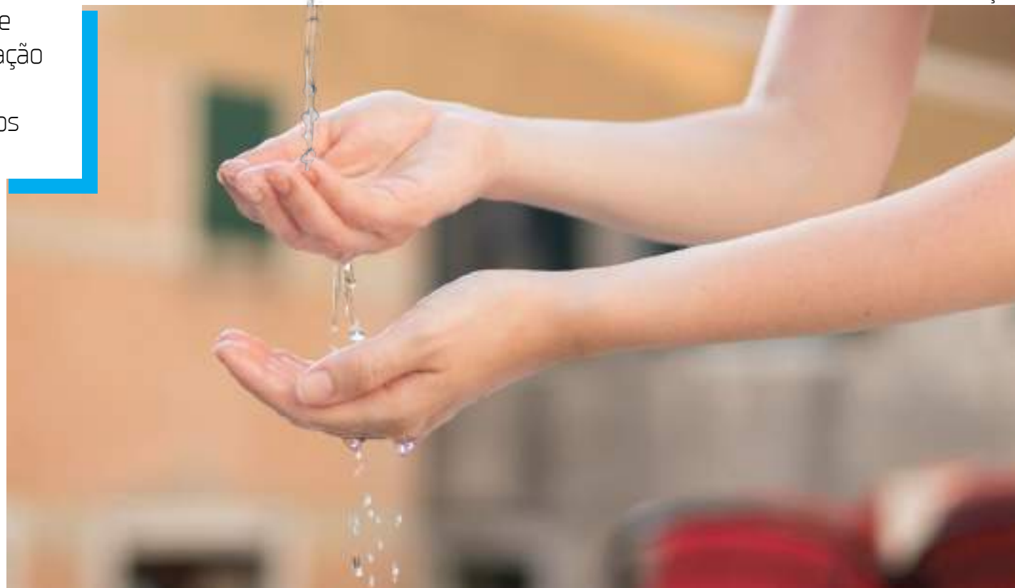
Habitat Brasil promove Missão pelo direito à água e ao saneamento em Manaus

Diversas organizações estarão envolvidas na missão, incluindo a OSEA, FIC/UFAM/FAMDDI, Associação de Moradia Ana Oliveira (AMAO), MNLM/Cooperativa COOPOA, Instituto Sumaúma/Vida e Cidadania, Remada Ambiental/CBHTA, AMB/AMA – Articulação de Mulheres do Amazonas, Central de Movimentos Populares – CMP/AM, Movimento das Associações do Igarapé do Gigante, IFCHS/UFAM/COLAR, SARES, Fórum das Águas do AM, FIC/