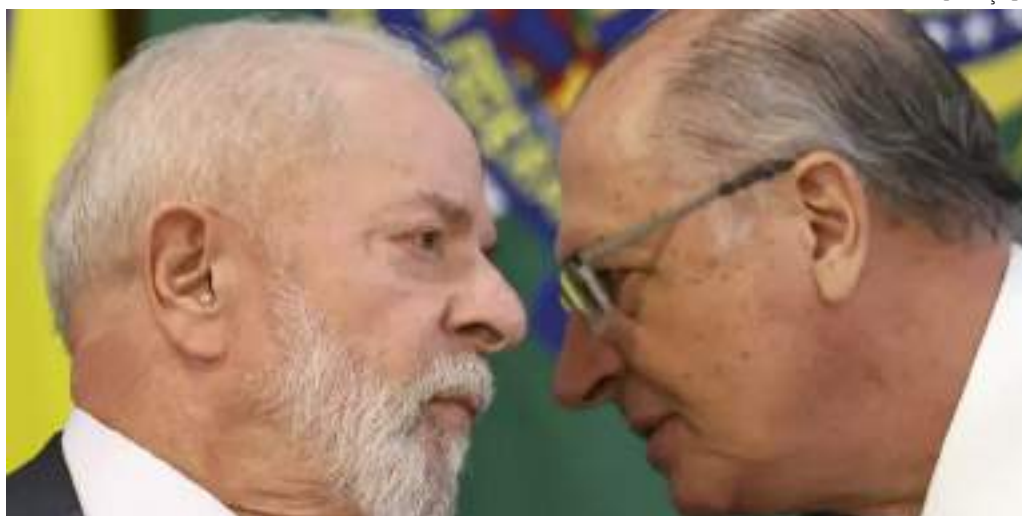
Lula e Aickmin conversam durante reunião sobre ajuda ao RS