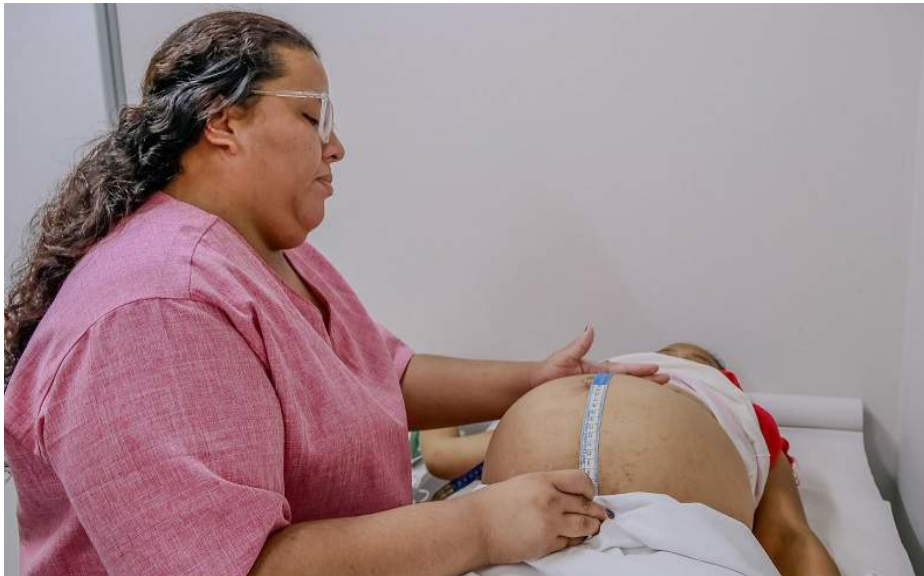
Grávidas de alto risco recebem atendimento pré-natal de forma diferenciada

A secretária de Estado de Saúde, Nayara Maksoud, destacou que no setor de Pré-Natal Alto Risco da Policlínica Codajás as grávidas são acompanhadas por equipe multidisciplinar, que executam os trabalhos em conjunto com os obstetras que acompanham mãe e o bebê.