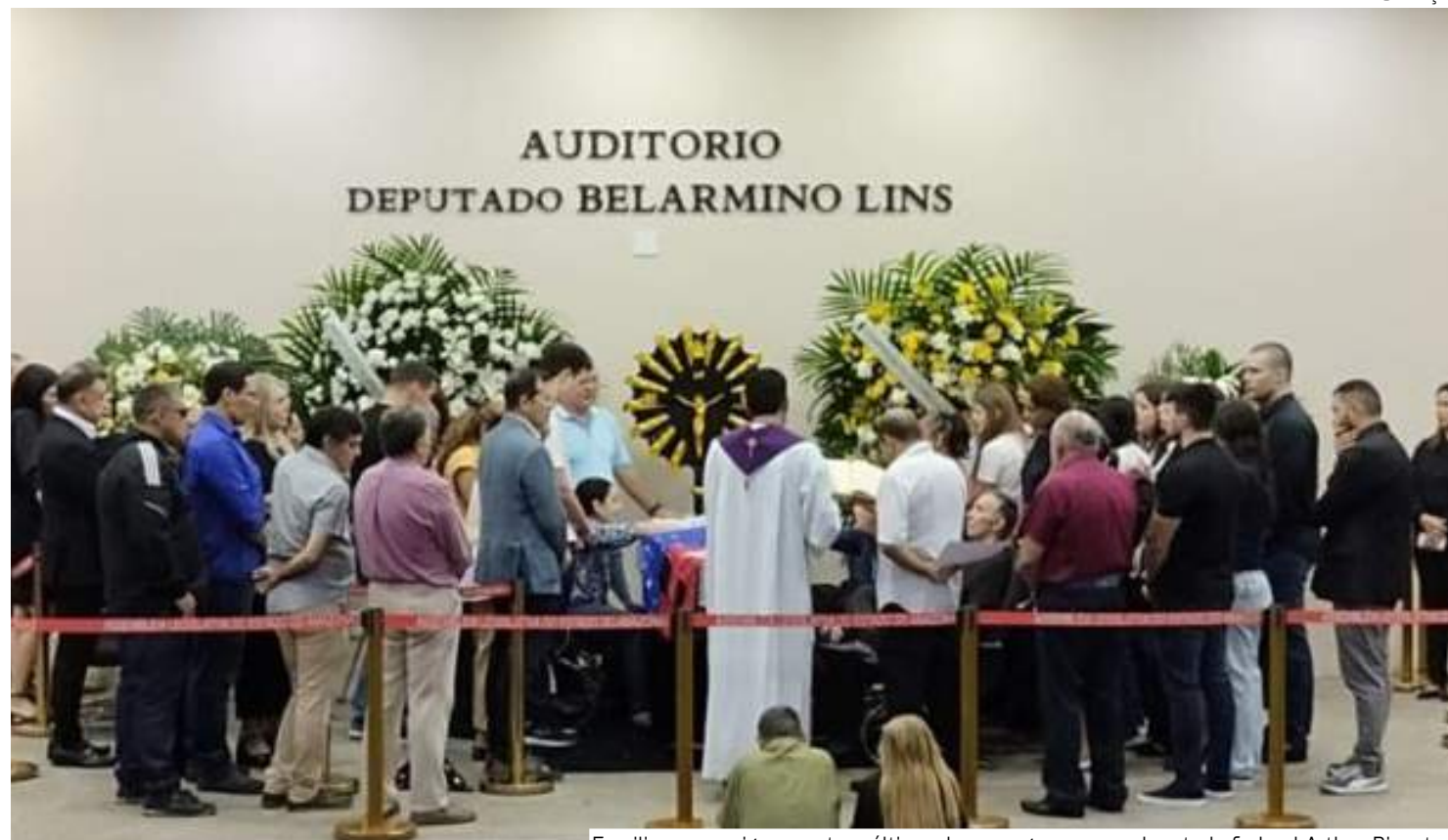
Familiares e amigos prestam últimas homenagens ao ex-deputado federal Arthur Bisneto

Wilson frisou que Bisneto contribuiu muito para o Amazonas e teve um papel relevante na política do Estado. "Vim aqui prestar minhas homenagens para alguém que teve um papel relevante na política do estado do Amazonas, foi vere-