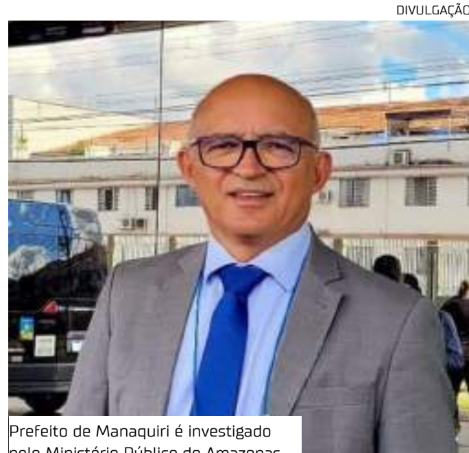
Prefeito de Manaquiri é investigado pelo Ministério Público do Amazonas

A equipe do EM TEMPO entrou em contato com a Prefeitura de Manaquiri solicitando esclarecimentos sobre as supostas denúncias investigadas pelo Ministério Público, mas até a publicação desta edição, não obteve resposta.