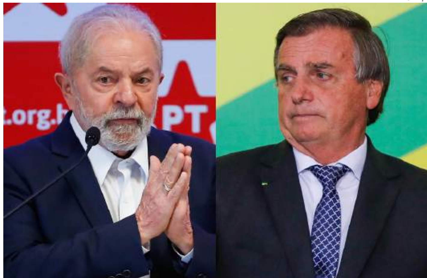
Mais eleitores dizem que Lula é pior do que o de Jair Bolsonaro

Segundo o levantamento, entre os eleitores que consideram que o governo Lula está melhor que o de Bolsonaro, as taxas são mais altas entre jovens de 16 a 24 anos (51%) e pessoas que completaram o ensino fundamental (44%). Já entre os que consideram que a gestão petista está pior que a anterior, os percentuais são mais altos entre os adultos de 25 a 44 anos (51%) e pessoas que completaram o ensino médio (49%).