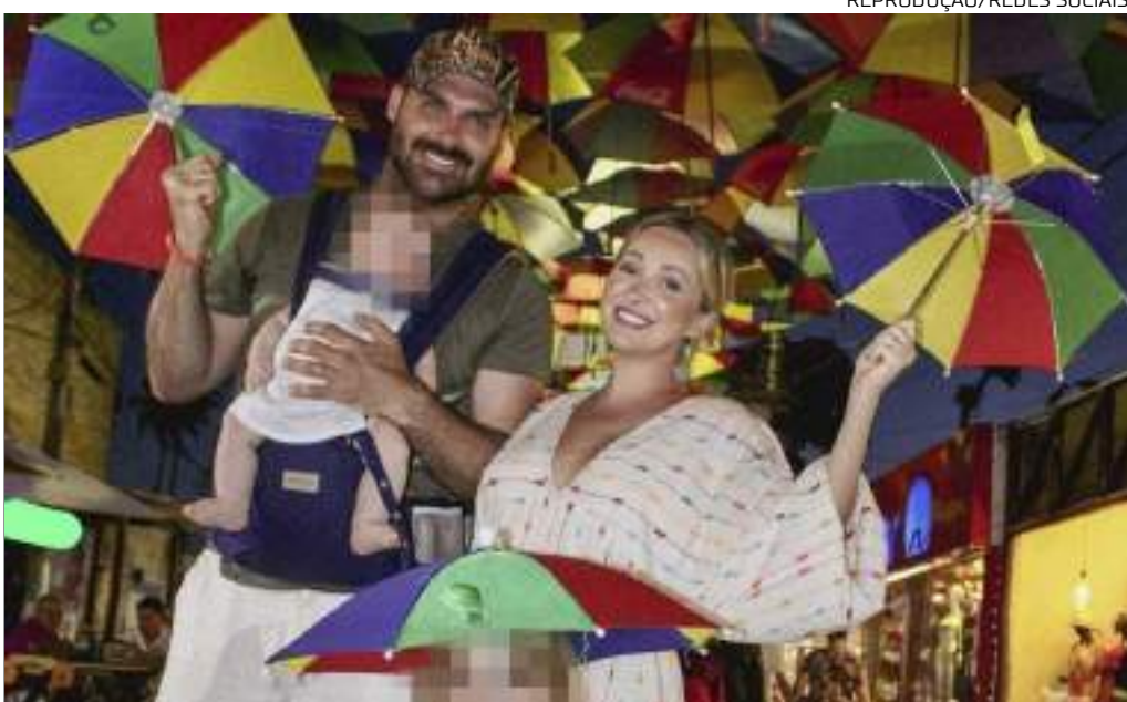
Eduardo Bolsonaro durante férias com a família em Pernambuco