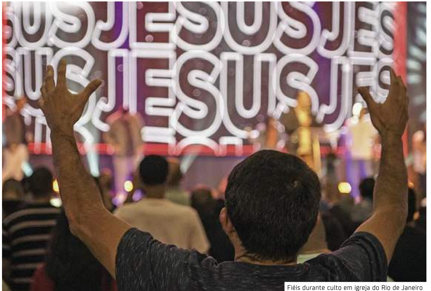
Fiéis durante culto em igreja do Rio de Janeiro

Os fiéis já têm força política para decidir por determinados candidatos. Conforme dados do Censo 2022 divulgados, neste ano, pelo Instituto Brasileiro de Geografia e Estatística (IBGE), o Amazonas tem mais estabelecimentos religiosos do que o total somado de instituições de ensino