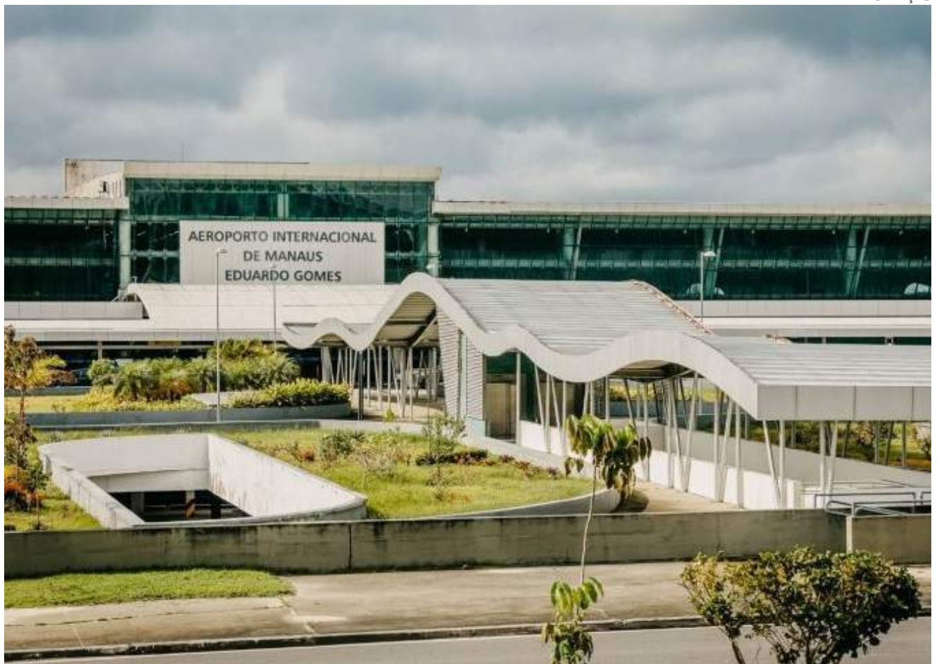
Aeroporto de Manaus terá, a partir de junho, voo comercial direto para Miami

"Hoje, conectamos a capital amazonense a 29 destinos domésticos no país, contra 21 em 2019. Esses números traduzem a mobilidade positiva da rede VINCI Airports, buscando conectar mais destinos e pessoas, gerando mais desenvolvimento nas cidades onde opera", declarou.