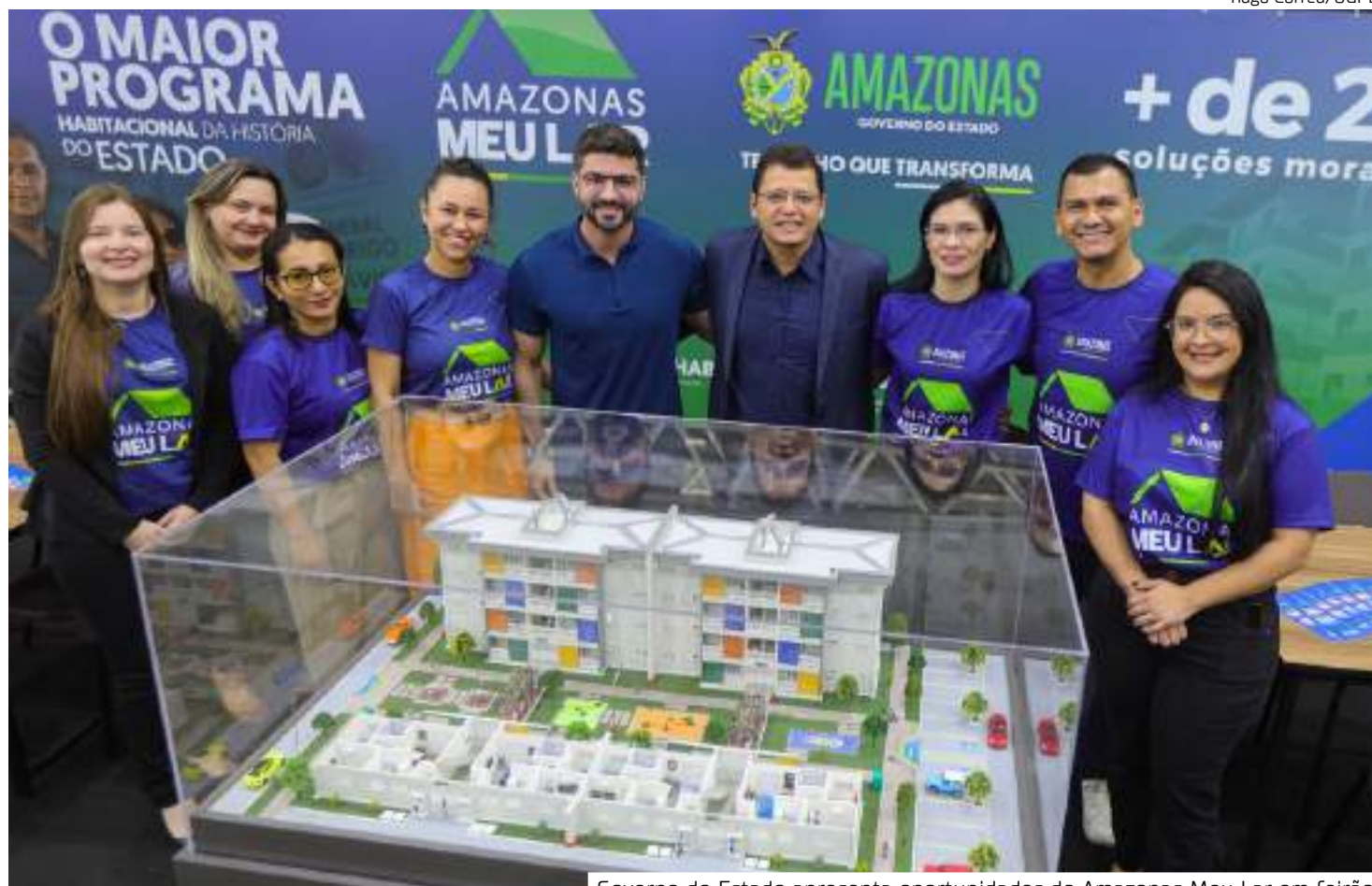
Governo do Estado apresenta oportunidades do Amazonas Meu Lar em feirão