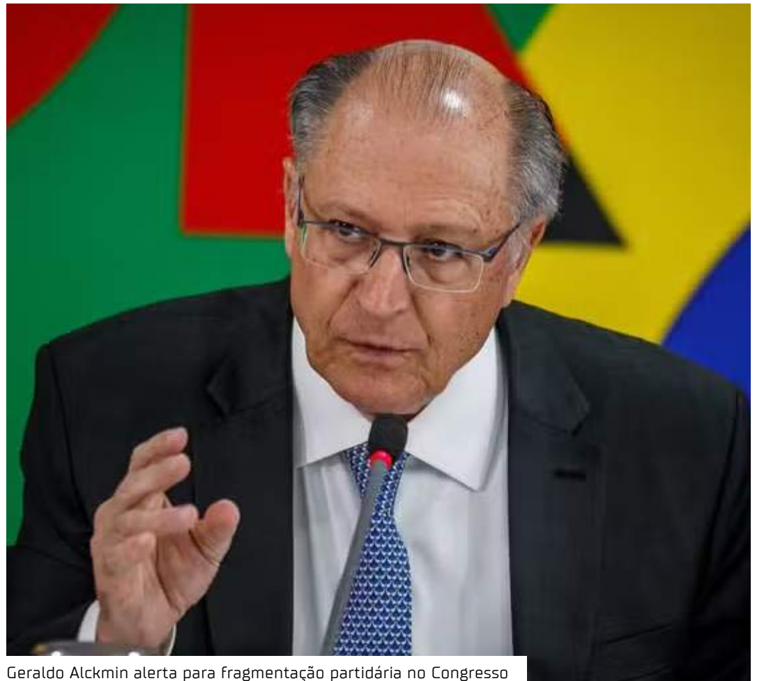
Geraldo Alckmin alerta para fragmentação partidária no Congresso