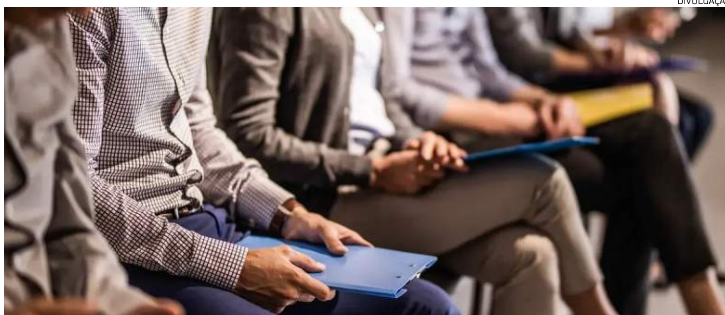
Homens representam 70% da força de trabalho na área de tecnologia

Desistência, demora ou falta de resposta são dificuldades