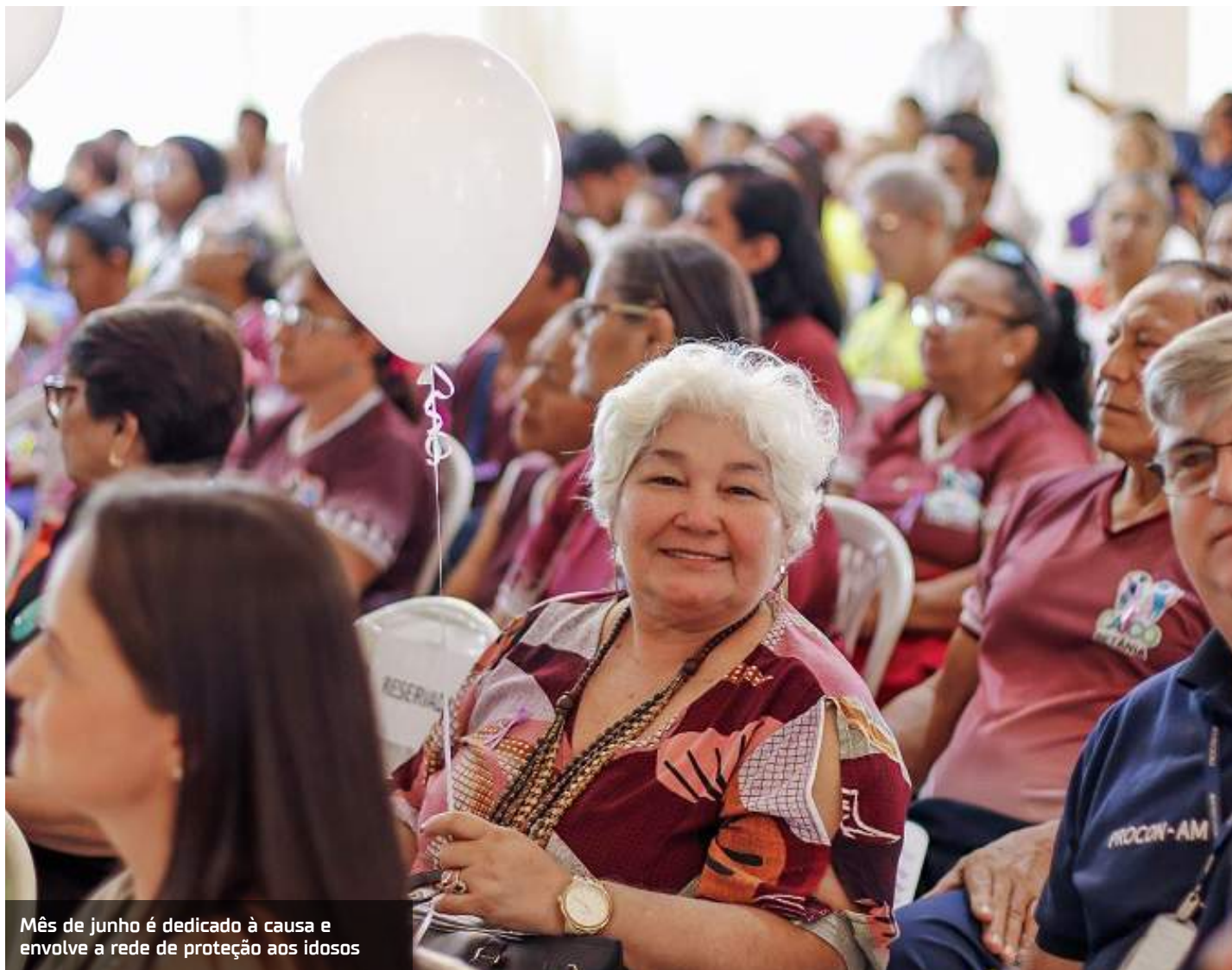
Mês de junho é dedicado à causa e envolve a rede de proteção aos idosos