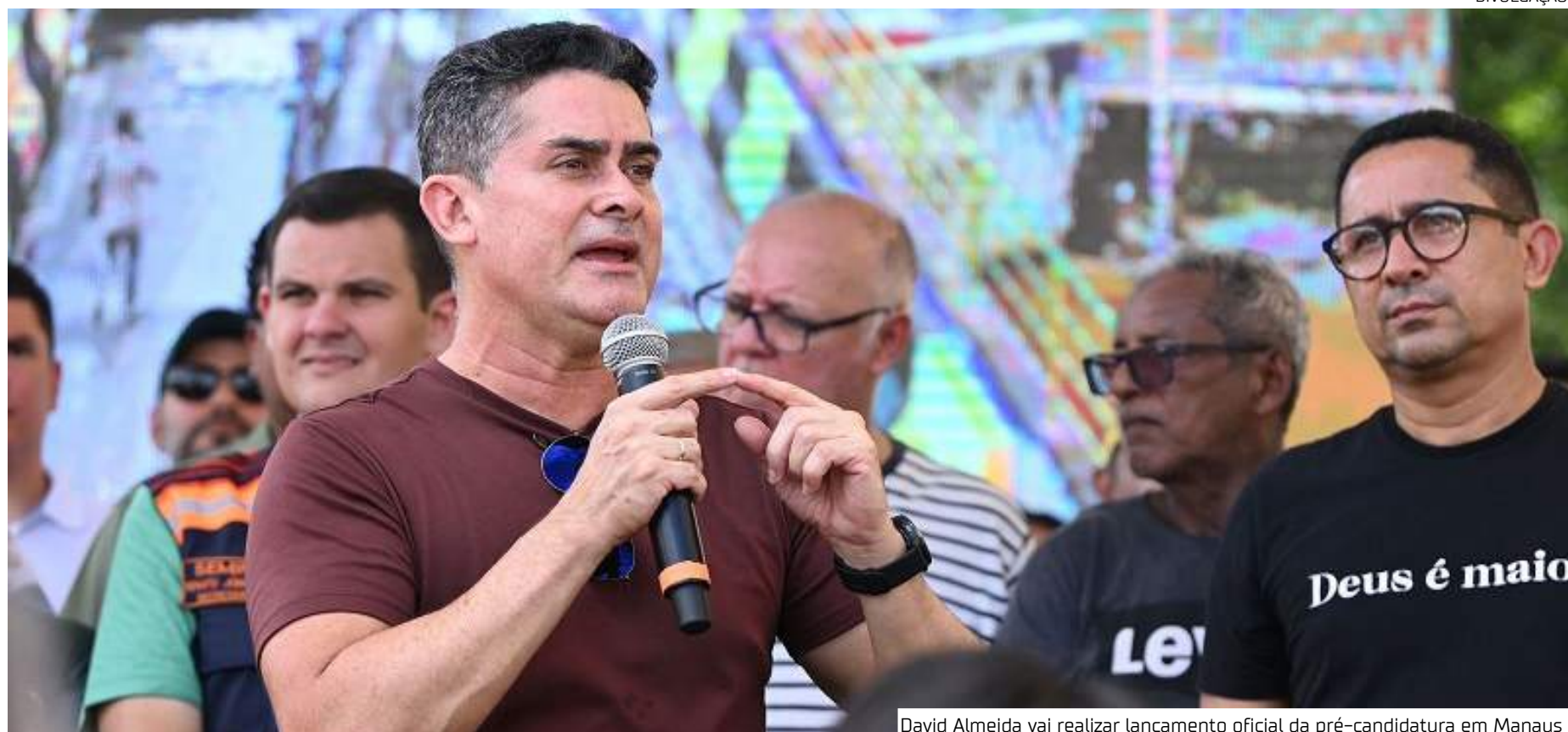
David Almeida vai realizar lançamento oficial da pré-candidatura em Manaus