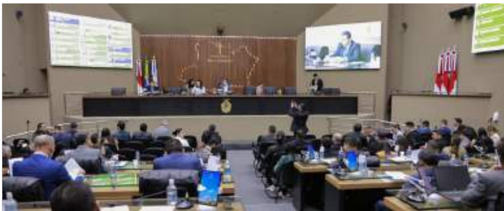
Assembleia Legislativa do Amazonas (Aleam) se une no combate ao preconceito