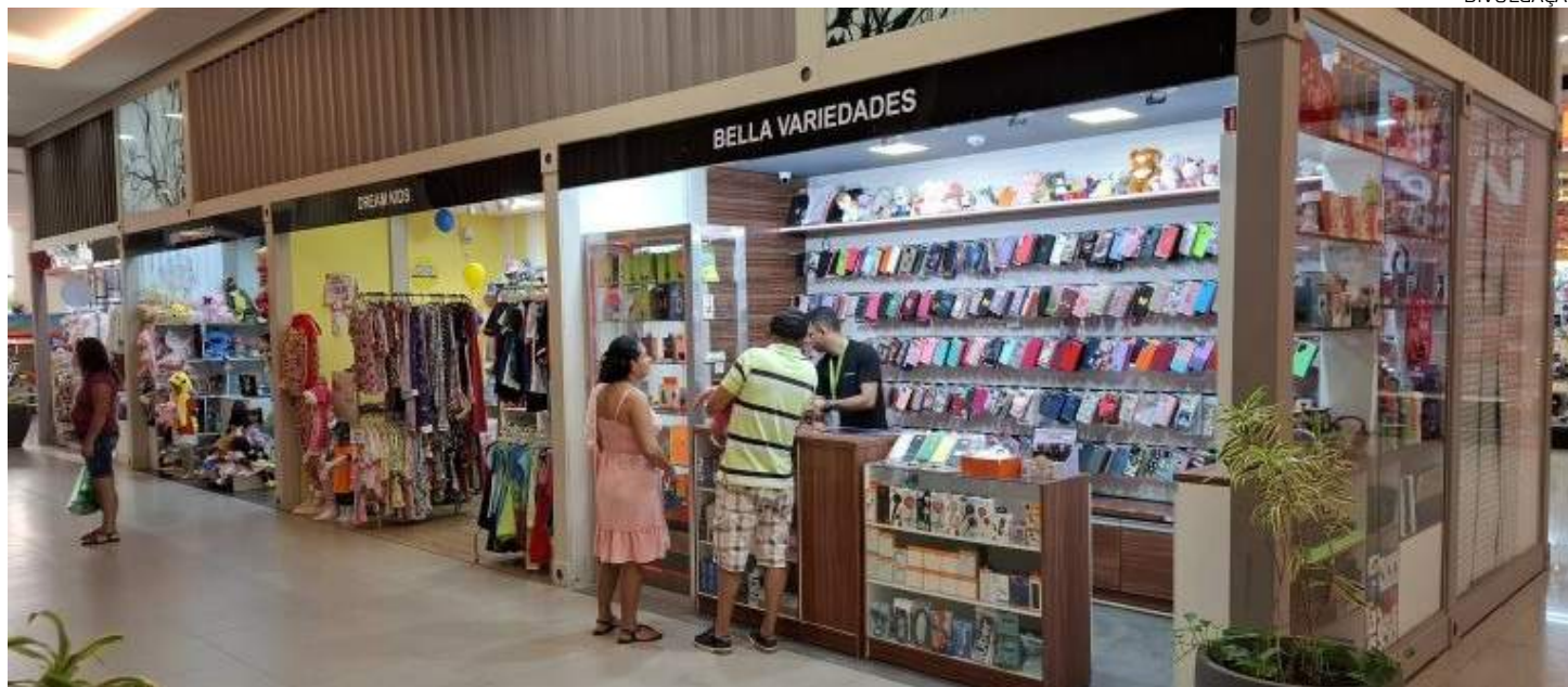
Projeto "Pocket Mall" conta com 31 espaços físicos em uma área de 317,82m²

Já o "Pocket Food" conta com sete espaços, em uma área de 115,86m². Posicionado