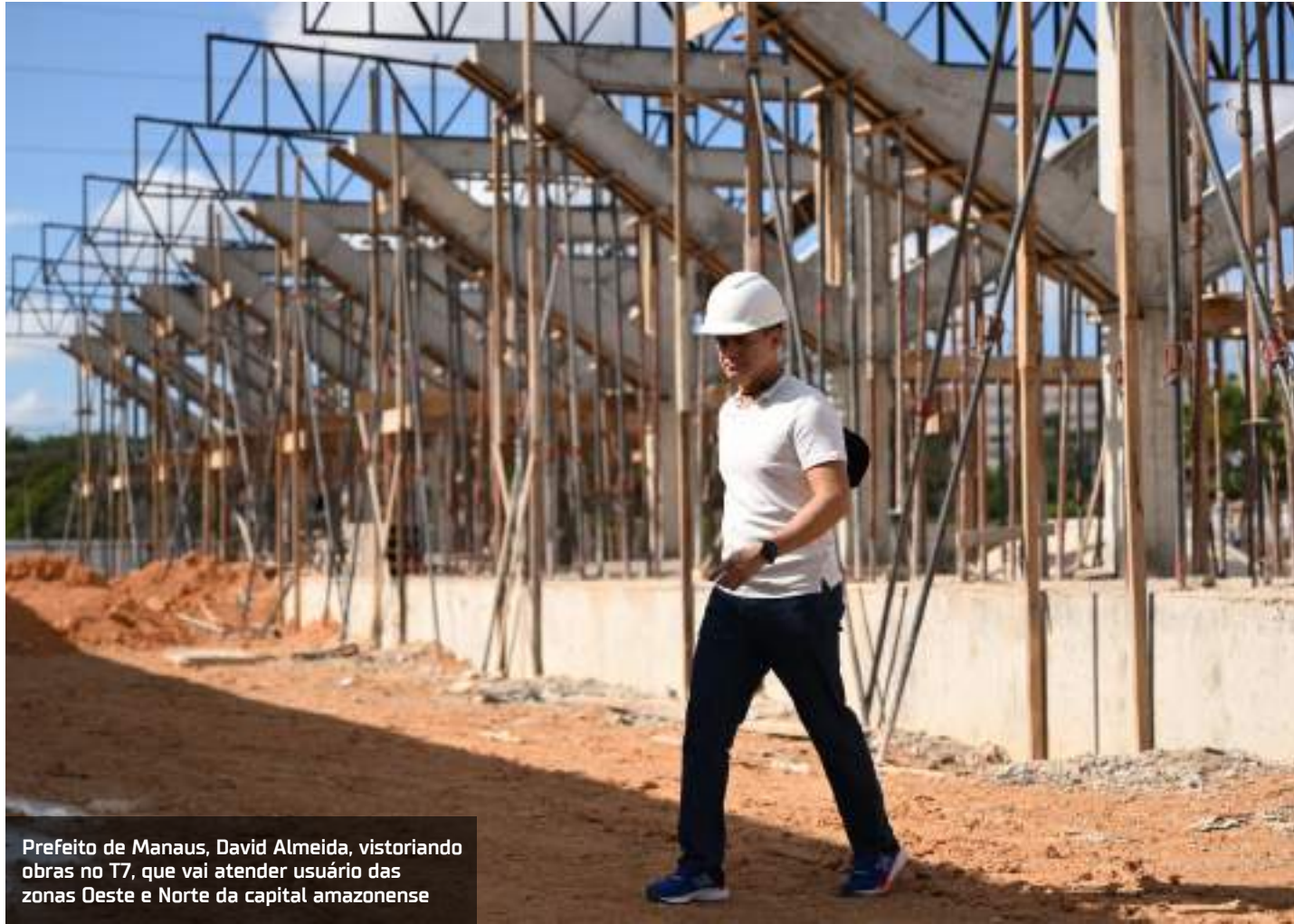
Prefeito de Manaus, David Almeida, visitando obras no T7, que vai atender usuário das zonas Oeste e Norte da capital amazonense

O novo terminal será composto por duas plataformas, sendo uma para articulado e convencional e uma apenas para veículos convencionais, que irão realizar viagens dos bairros ao terminal (as chamadas linhas alimentadoras) e do bairro em direção ao centro da cidade (as linhas troncais). O terminal irá