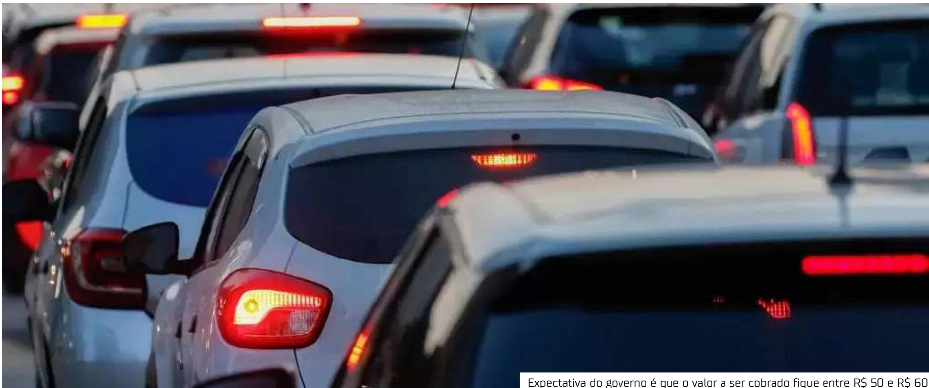
Expectativa do governo é que o valor a ser cobrado fique entre R$ 50 e R$ 60

A Caixa Econômica Federal será a administradora do fundo desses recursos. A expectativa do governo é que o valor a ser