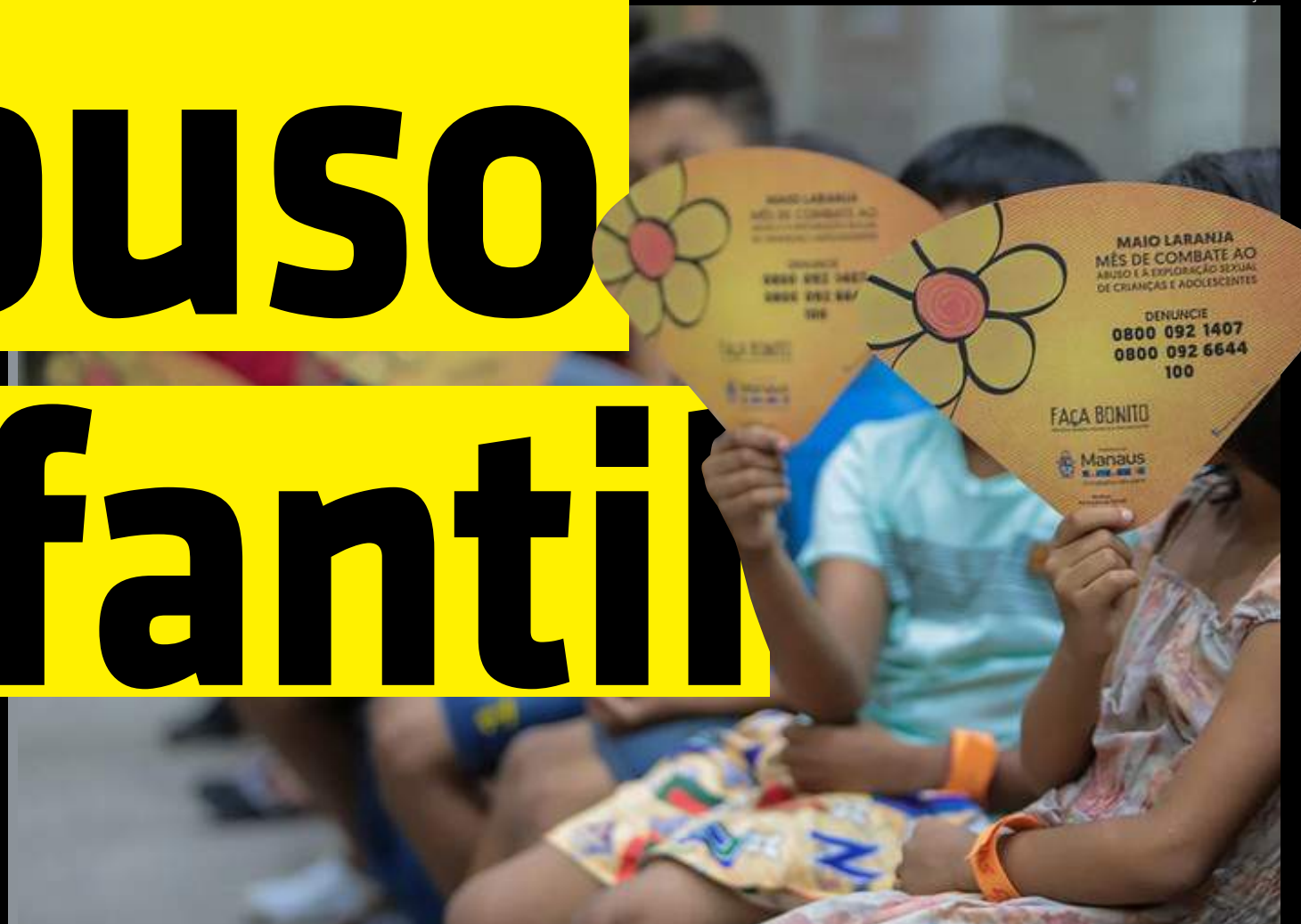
Campanha "Maio Laranja" sensibiliza sociedade para o enfrentamento ao abuso e à exploração sexual de crianças e adolescentes

Para que o trabalho de combate seja efetivado, é necessário também que existam Leis que protejam o bem-estar das crianças e adolescentes. Uma delas é de autoria da Deputada Estadual Mayra Dias (Avante), que por meio da Lei n.º 6.555/2023, estabeleceu prioridade nas investigações para apuração de crimes de abuso e/ou exploração sexual que tenham como vítimas crianças e/ou adolescentes no Amazonas.