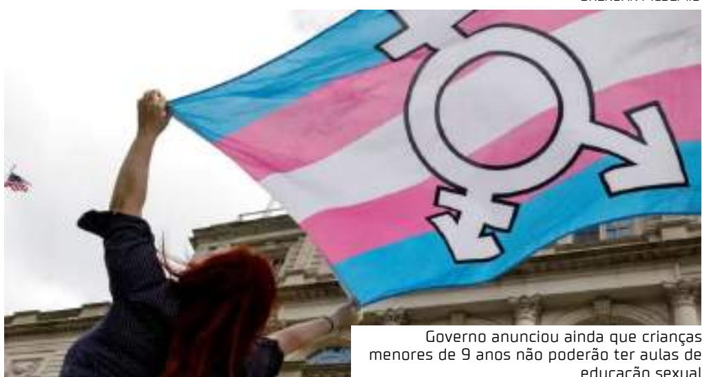
Governo anunciou ainda que crianças menores de 9 anos não poderão ter aulas de educação sexual