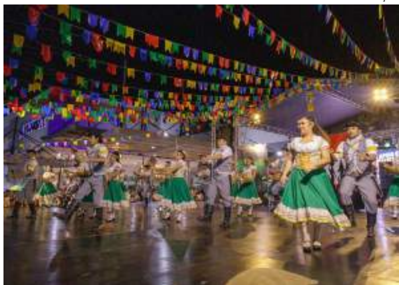
Arraial da Alegria inicia no dia 31 de maio no Vianorte