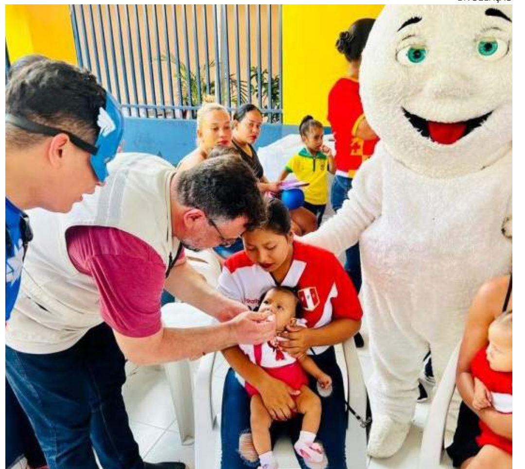
Dia “D” de divulgação e mobilização nacional está agendado para o dia 8 de junho

A poliomielite é uma doença contagiosa aguda, causada pelo poliovírus, que pode infectar crianças e adultos através do contato direto com fezes e secreções. Os sintomas incluem febre, mal-estar, dores no corpo, vômitos, diarreia e, em casos graves, paralisias musculares, principalmente, nos membros inferiores. Não há cura para a poliomielite, tornando a vacinação a única forma eficaz de prevenção.