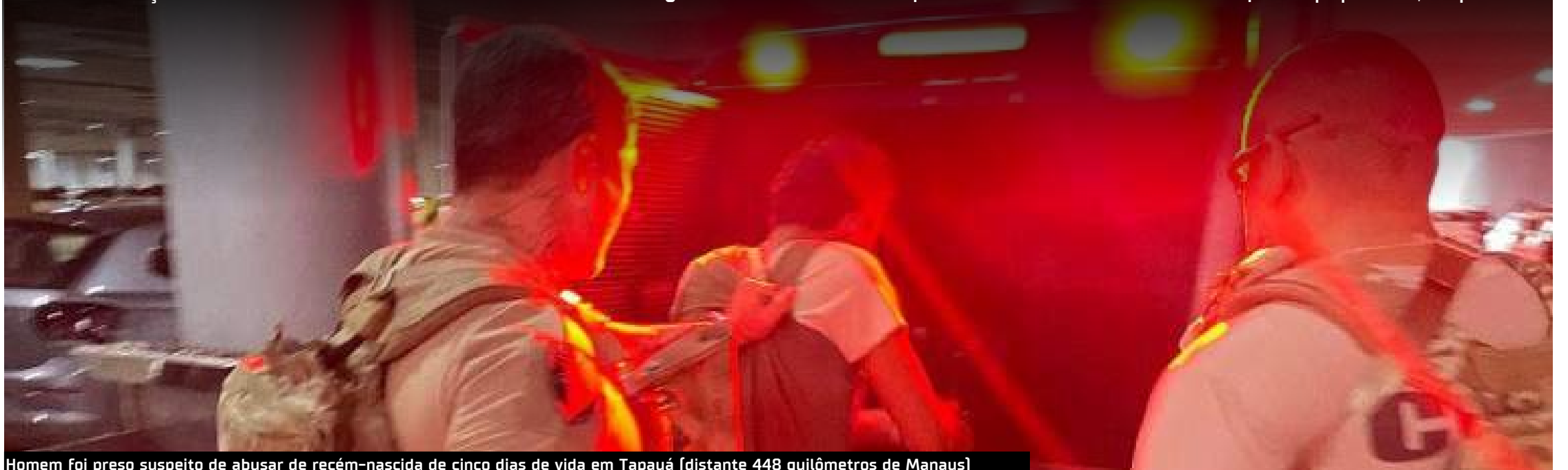
Homem foi preso suspeito de abusar de recém-nascida de cinco dias de vida em Tapauá (distante 448 quilômetros de Manaus)

"O homem negou que teria cometido o crime nas vezes em que foi questionando, contudo, no momento de sua prisão, ele admitiu verbalmente ser autor do crime contra sua própria filha", completou.