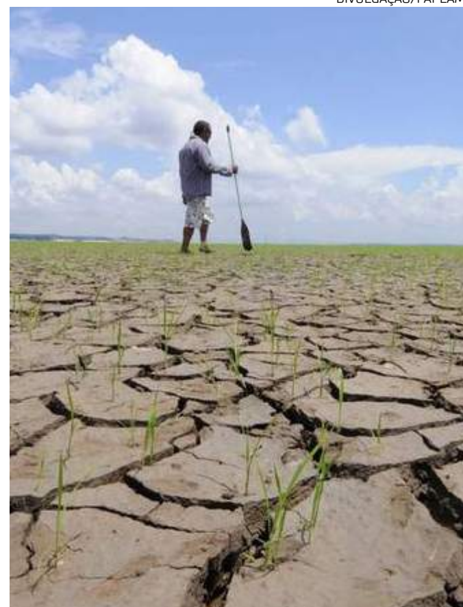
Seca histórica na Amazônia foi registrada no ano de 2023

Embora a média global de redução dos rendimentos seja 19%, Estados Unidos e Europa sentirão um baque menor (cerca de 11%). Os países da África e do sul da Ásia estão entre os mais afetados, despencando 22%. No Brasil, a baixa será de 21%. Caso não haja mudança no cenário atual, as projeções advertem para perdas de mais de 60% dos rendimentos até o próximo século.