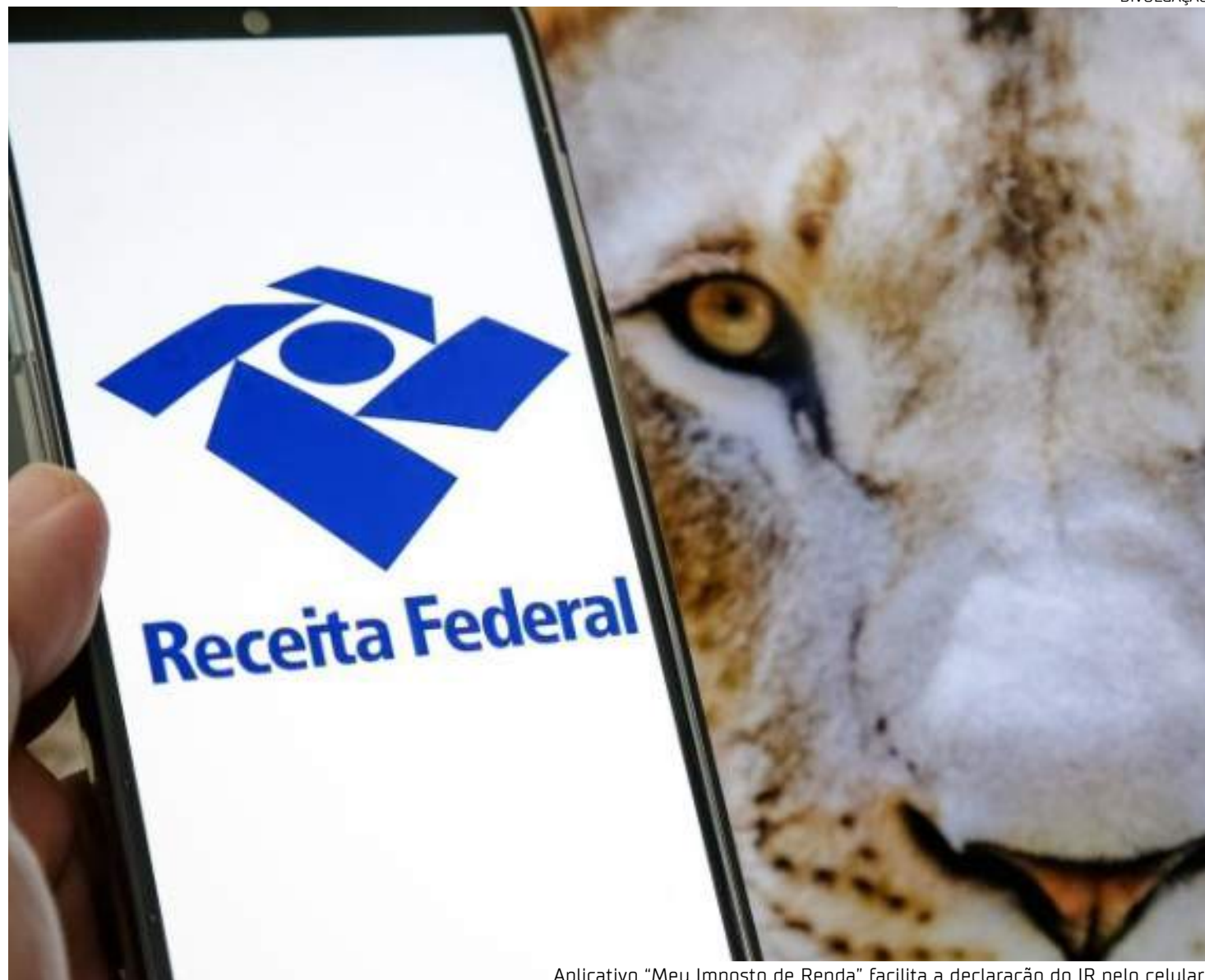
Aplicativo "Meu Imposto de Renda" facilita a declaração do IR pelo celular

"Você deve declarar o rendimento na ficha 'Rendimentos Isentos e Não Tributáveis' da declaração, selecionando o tipo de rendimento 'Pensão Alimentícia'. Se este não estiver disponí-