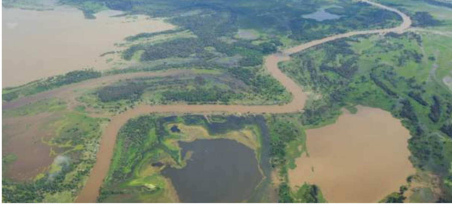
Dados apontam a possibilidade de uma seca tão ou mais severa do que a ocorrida em 2023

De acordo com o monitoramento realizado pelo Estado, os dados apontam a possibilidade de uma seca tão ou mais severa do que a ocorrida em 2023. Por conta da previsão, o governador Wilson Lima de-