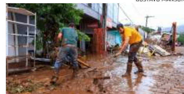
Moradores limpam rua tomada por lama no RS