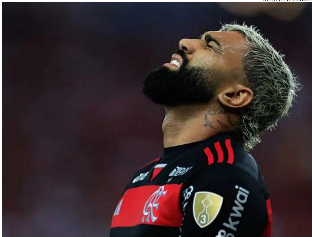
Gabigol começou a vestir a camisa 10 do Flamengo em 2023, após a aposentadoria de Diego na virada do ano

Na noite de quinta-feira (16), a assessoria afirmou que a foto de Gabigol com