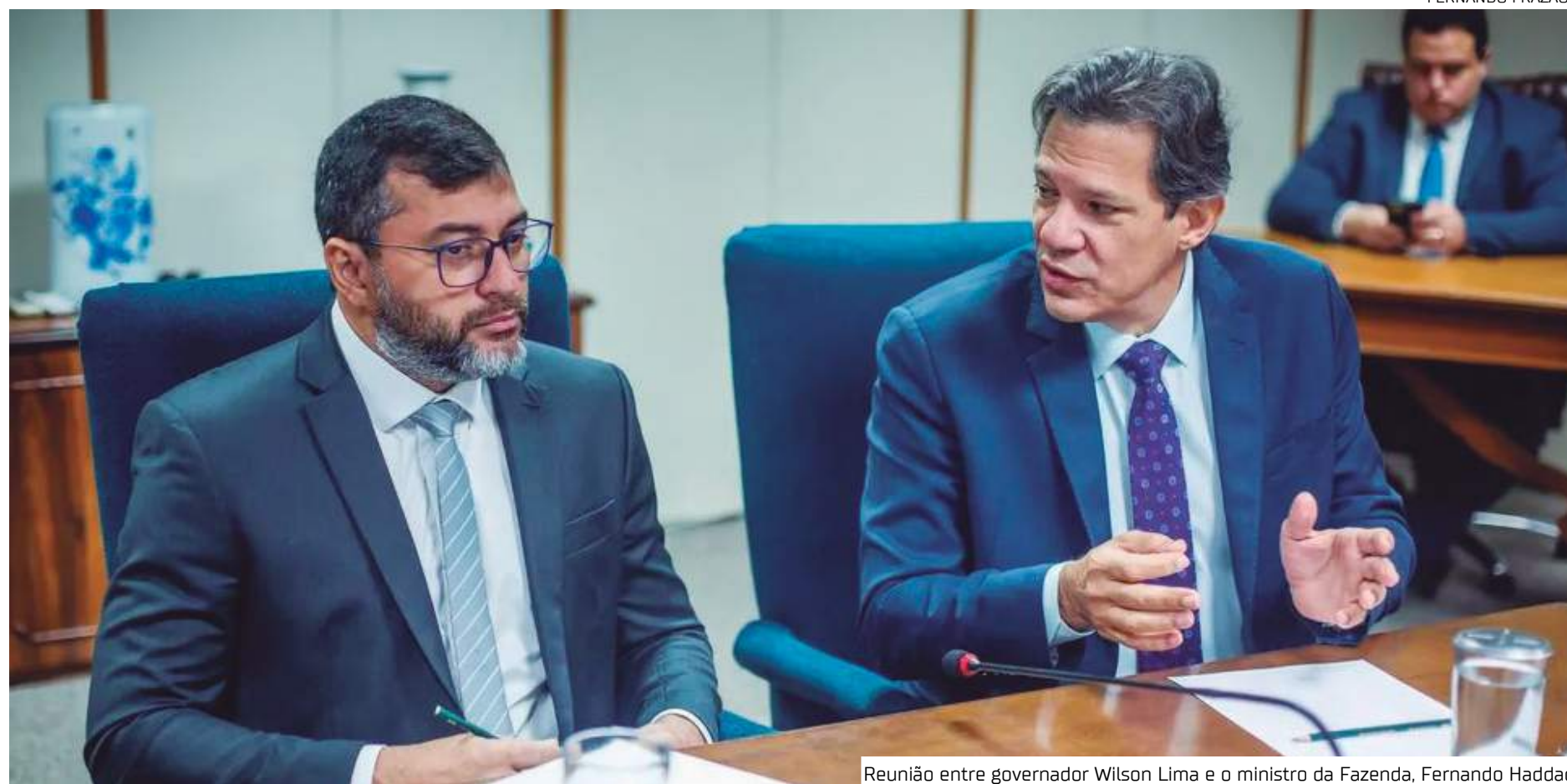
Reunião entre governador Wilson Lima e o ministro da Fazenda, Fernando Haddad

Com os dois projetos sancionados, a Lei Estadual n.º 6.604/2023 autorizou o Esta-