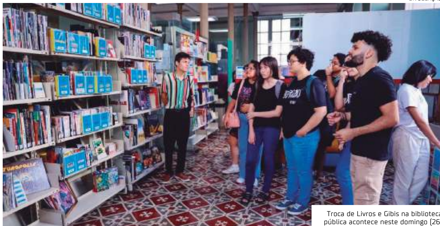
Troca de Livros e Gibis na biblioteca pública acontece neste domingo (26)