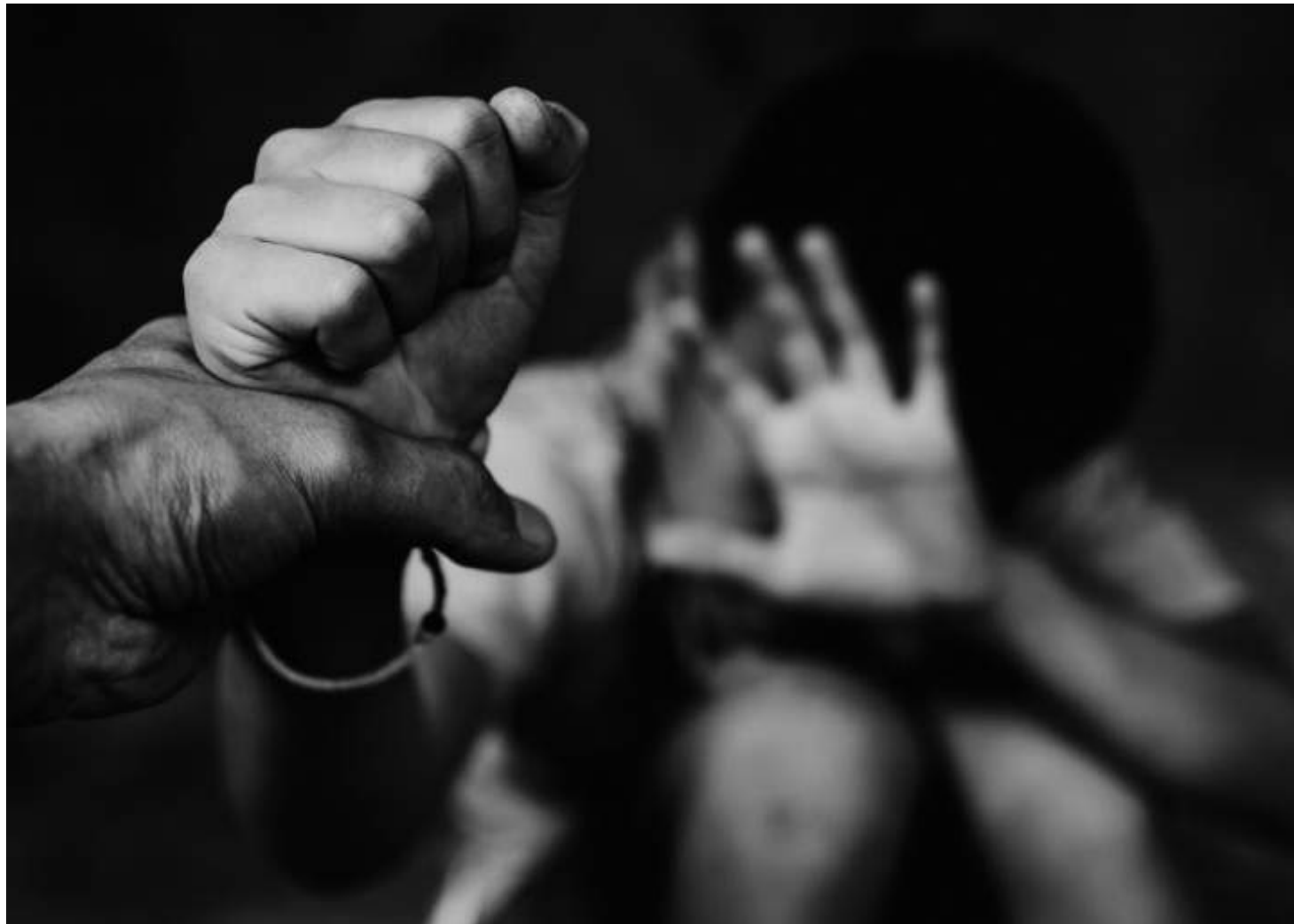
Ao ampliar o recorte para três formas de violência – sexual, física e psicológica – o relatório mostra que mãe e pai estão entre os principais agressores

O lançamento da campanha Defenda-se é parte da mobilização que acontece durante o mês de maio, conhecido como Maio Laranja, e em especial no dia 18, Dia Nacional de Combate ao Abuso e à Exploração Sexual de Crianças e Adolescentes, de acordo com a Lei nº 9.970/00. Nesta data, diversas instituições, organizações e ativistas pelos direitos das infâncias e adolescências se mobilizam para sensibilizar, conscientizar e informar toda a sociedade. O Conselho Nacional dos Direitos da Criança e do Adolescente, por meio da resolução nº 236/2023, indica também a campanha "Faça Bonito. Proteja nossas Crianças e Adolescentes" e a flor amarela e laranja como símbolos oficiais do enfrentamento ao abuso e à exploração sexual