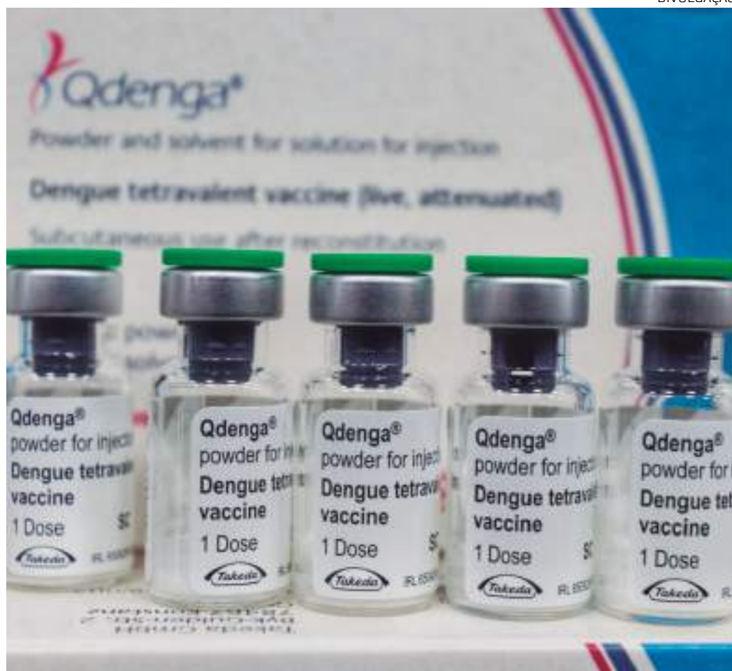
Imunizantes estão disponíveis nos postos de saúde

Avacinação contra a dengue é uma das estratégias de prevenção à dengue que soma à importância de outras formas preventivas, como evitar que o mosquito Aedes aegypti , vetor da doença, se reproduza. A eliminação de criadouros inclui evitar água parada em pneus velhos, vasos de plantas, garrafas vazias e recipientes plásticos. Manter quintais e áreas ao redor das casas limpas e livres de entulho também é estratégico para reduzir os locais de reprodução do mosquito.