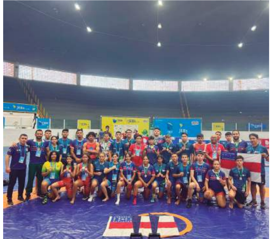
No total, 120 estudantes de escolas públicas e privadas representaram o Amazonas na categoria Sub-18