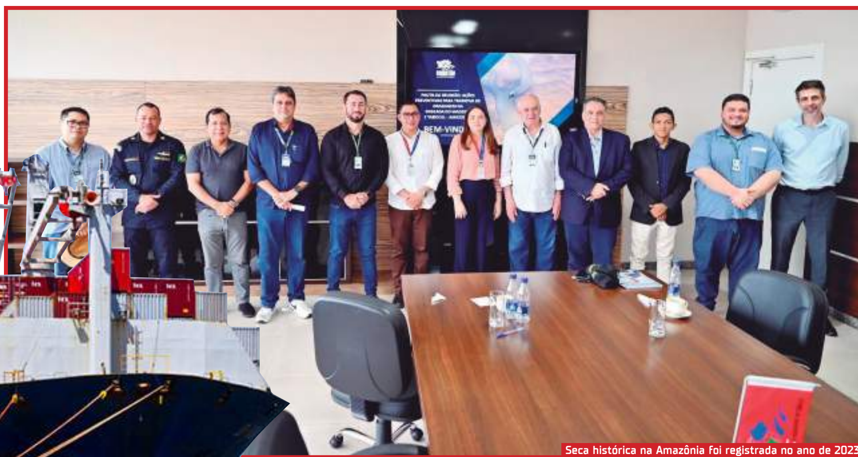
Seca histórica na Amazônia foi registrada no ano de 2023

ram um relatório ao DNIT, em Brasília, sinalizando que a seca prevista para 2024 poderia ser ainda superior à do ano anterior. Ele explicou que a instalação do píer provisório oferece uma alternativa viável e segura, que se complementa à ação de dragagem planejada para as regiões do Tabocal e Enseada do Madeira.