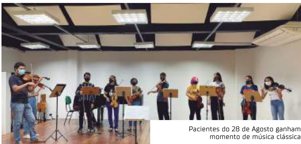
Pacientes do 28 de Agosto ganham momento de música clássica