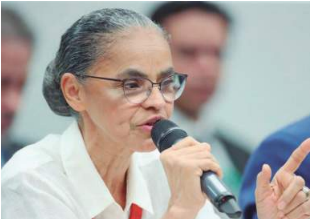
Ministra Marina Silva quer aumentar exigências para licenciamento da rodovia