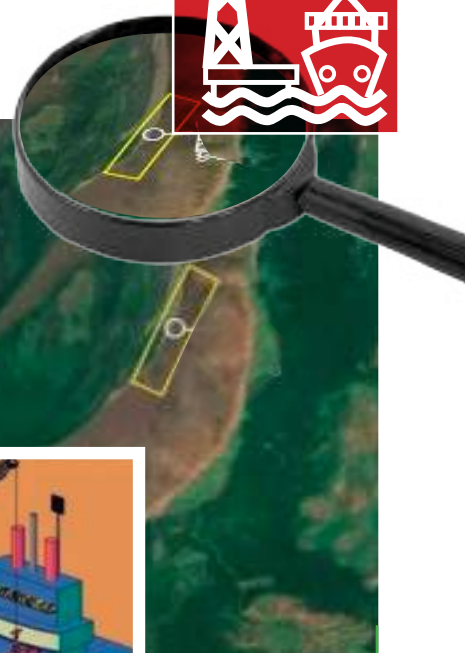
Píer provisório para minimizar impactos da estiagem na Amazônia