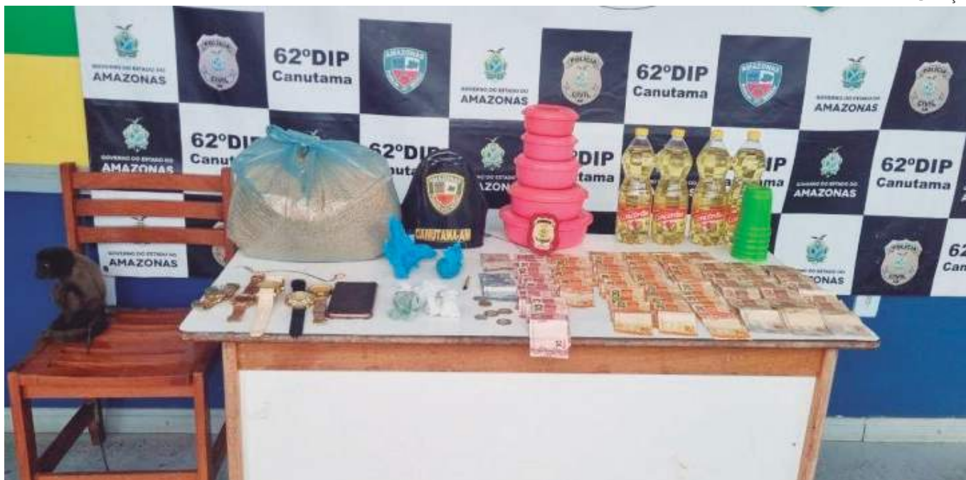
Na residência do autor, foram encontrados drogas e um macaco em situação de maus tratos