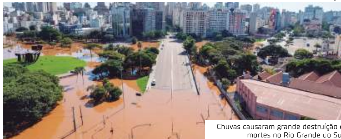
Chuvas causaram grande destruição e mortes no Rio Grande do Sul

Segundo a Meteorologia, as chuvas acima da média no Norte devem favorecer a terceira safra de feijão e milho, enquanto que as menores precipitações no Sul devem dessecar o solo.