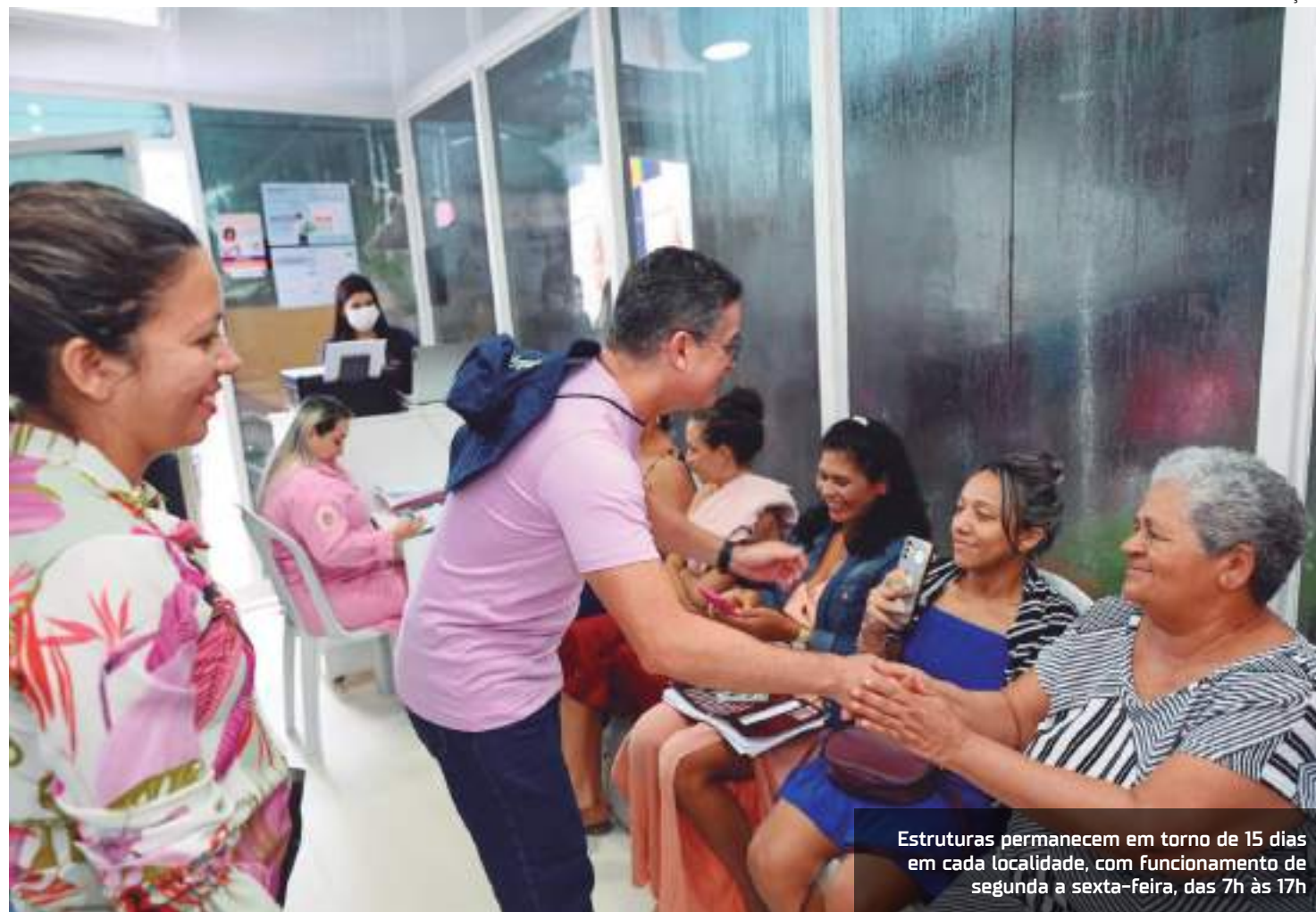
Estruturas permanecem em torno de 15 dias em cada localidade, com funcionamento de segunda a sexta-feira, das 7h às 17h