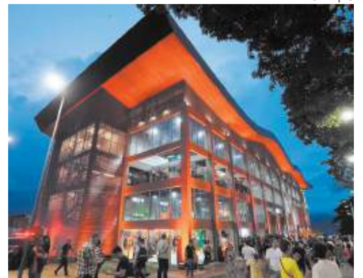
Prefeitura promove ocupação artística, cultural e pública do mirante

mais de 3,5 mil metros quadrados, uma área construída do zero, com piso acessível e calçadas em pedra São Thomé. No Largo ainda tem um espaço exclusivo para os animais de estimação, um playpet, em área sombreada e debaixo de árvores para momentos de lazer