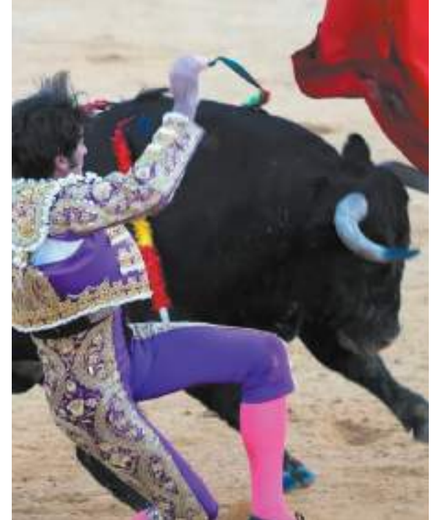
Touradas são para os defensores uma tradição cultural