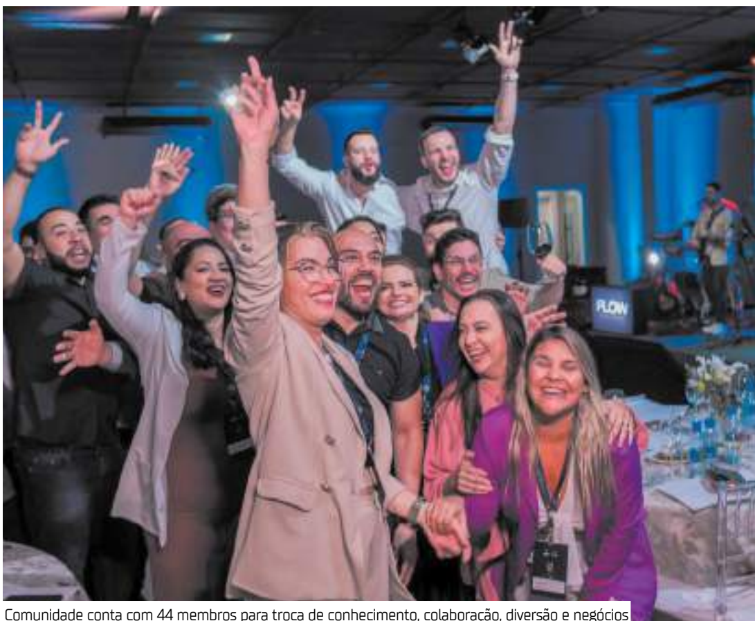
Comunidade conta com 44 membros para troca de conhecimento, colaboração, diversão e negócios