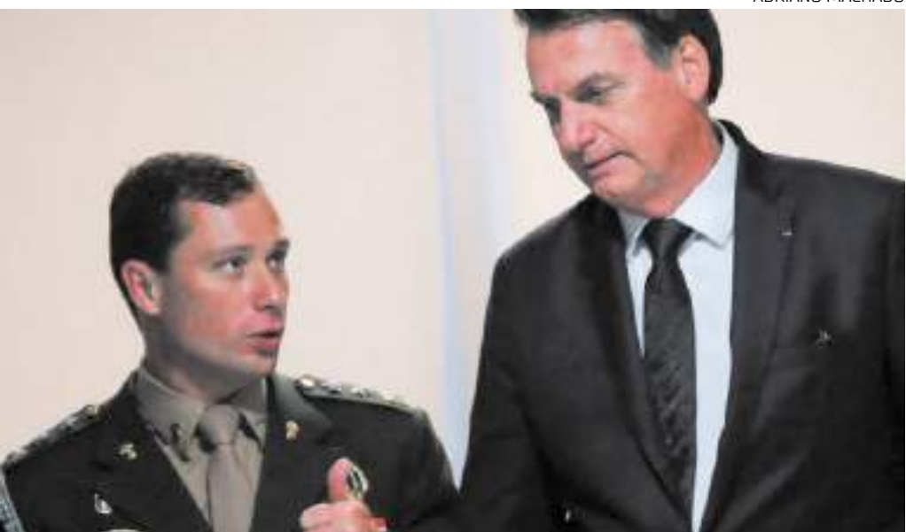
Ministro manteve integralmente acordo de colaboração da PF com o tenente-coronel