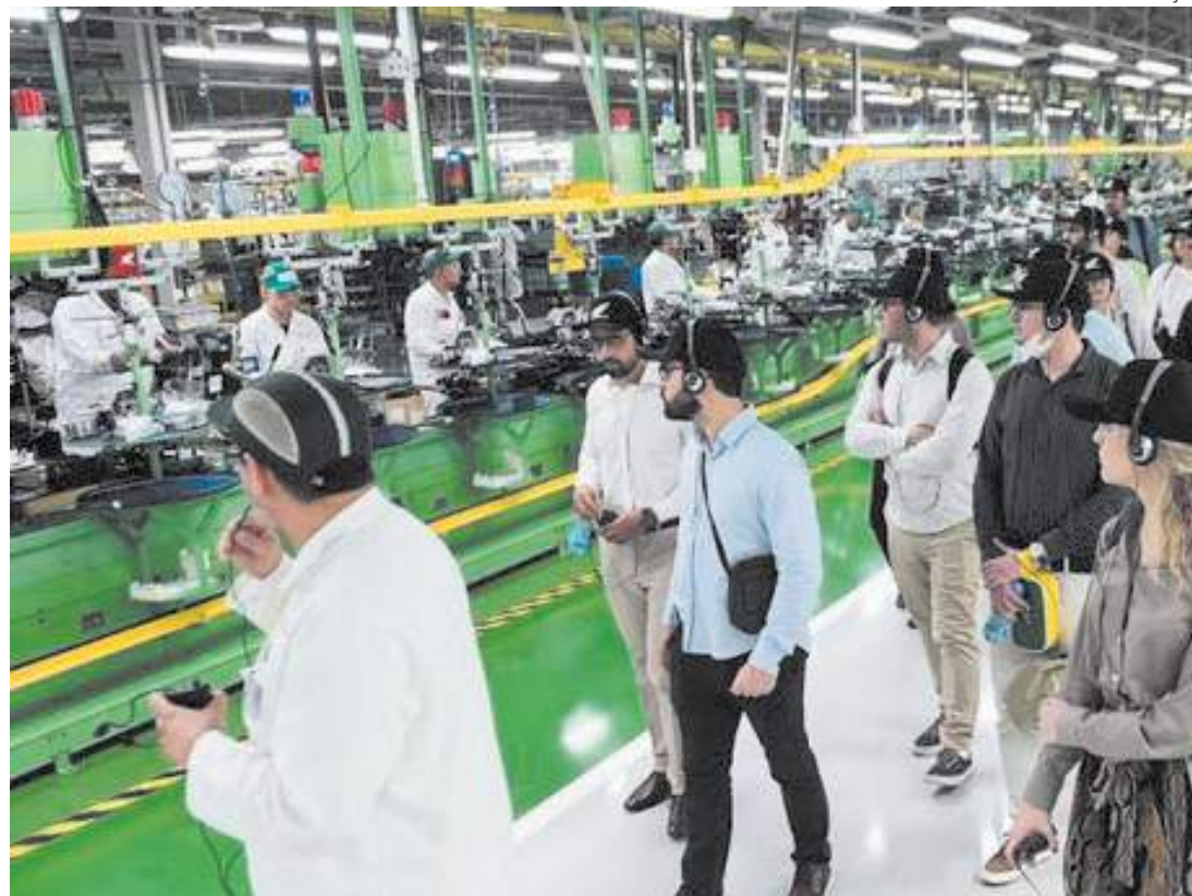
Grupo de 61 jovens diplomatas teve a oportunidade de conhecer a Moto Honda da Amazônia

Composta por 53 alunos brasileiros e oito estrangeiros provenientes do Equador, Peru, Moçambique, Angola, Guiné Bissau, Gui-