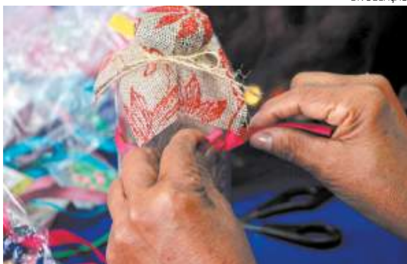
Oficina de artesanato arteterapia faz confecção de lembranças