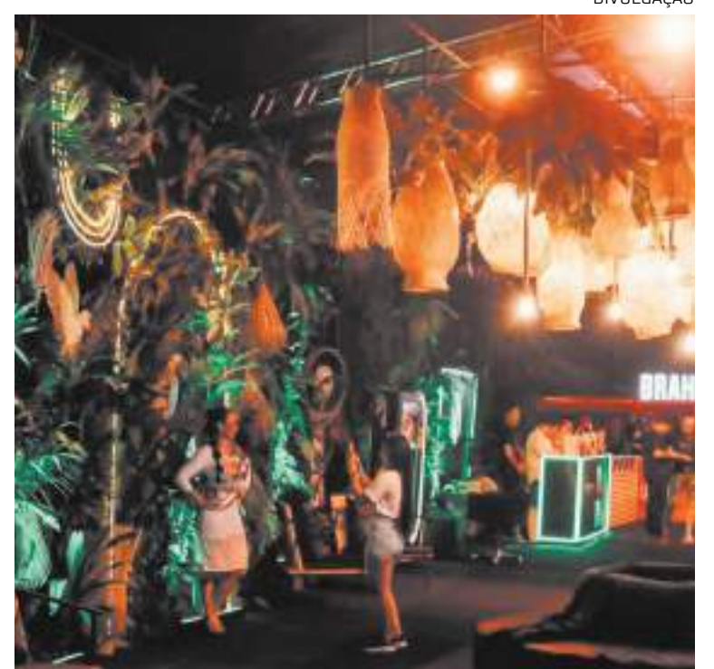
Evento contará com um espaço projetado pelas renomadas arquitetas

As vendas também serão realizadas na sede da Amazon Best, localizada na rua Nova Prata, nº 225, Vieiralves.