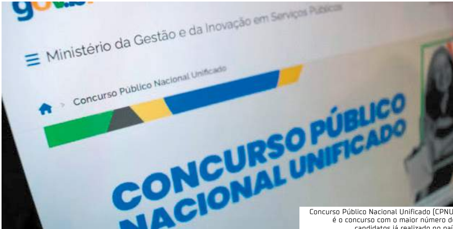
Concurso Público Nacional Unificado (CPNU) é o concurso com o maior número de candidatos já realizado no país