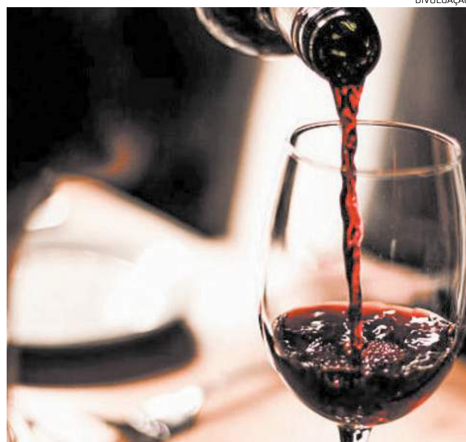
Estado é o segundo maior consumidor da região Norte

Os produzidos em outros países da América do Sul, como Argentina e Chile, também estão entre as preferências do brasileiro. Mas, eles também não dispensam os europeus, como os espanhóis, portugueses, italianos e franceses.