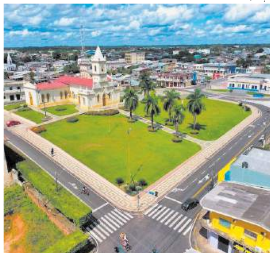
Prefeitura de Coari, município do interior do Amazonas

O Instituto Pontual Pesquisas realizou estudo eleitoral no município de Coari (a 333 quilômetros de Manaus) entre os dias 25 e 27 de abril. A pesquisa eleitoral teve registro no Tribunal Superior Eleitoral (TSE) sob o número AM-08366/2024, obedecendo assim a legislação vigente e cumprindo o rigor metodológico necessário para atender às resoluções específicas.