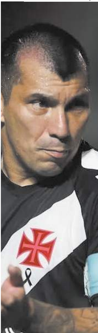
Medel será um dos reforços do Vasco para duelo diante do Atlético-PR