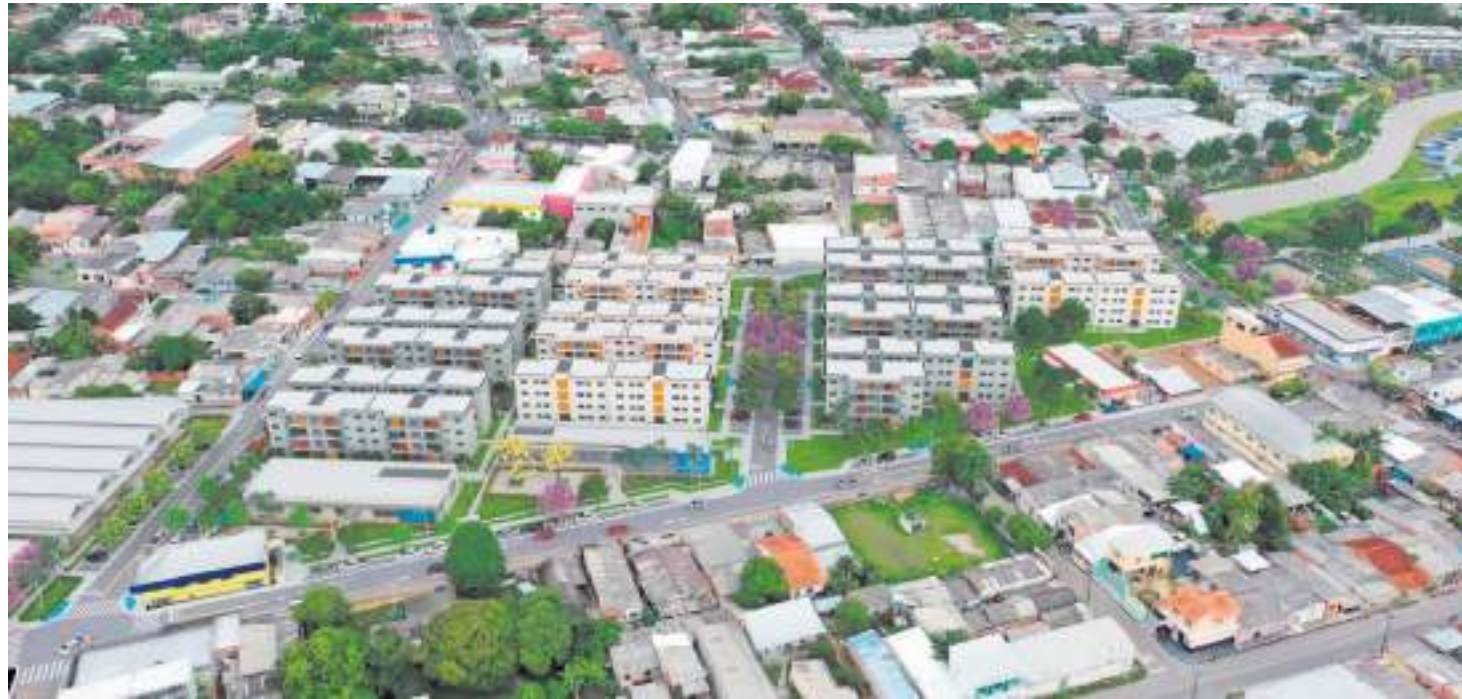
Prosai Parintins vai urbanizar uma área de risco de alagação na região conhecida como Lagoa da Francesa

O pedido de financiamento de US$ 70 milhões, junto ao Banco Interamericano de Desenvolvimento (BID), passará também pela aprovação do Senado Federal, antes da assinatura do