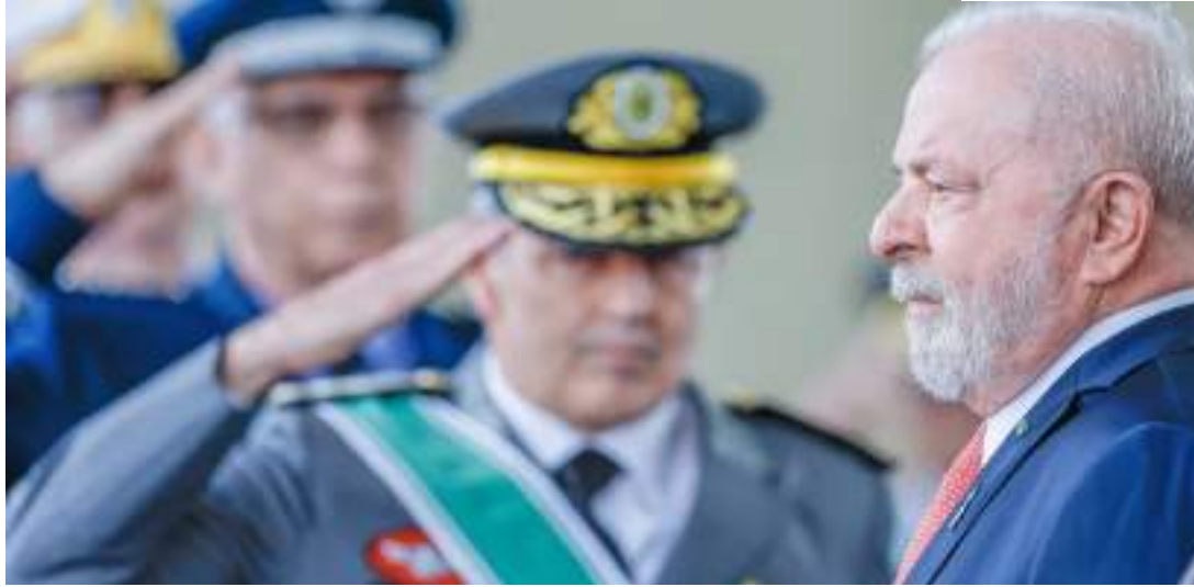
Presidente Lula autorizou o Exército a comprar veículos blindados de Israel

Após o anúncio do resultado, Lula, segundo fontes militares e do governo, avalizou a compra, a despeito da oposição de setores do PT e do governo a ela. Na conversa, o presidente teria sido alertado de que o processo licitatório foi rigoroso e que venceu a que ofereceu melhores condições, preços e tecnologia. O presidente teria pedido apenas para que a Lei fosse seguida.