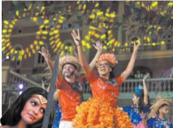
Arraial, evento Nerd entre outras atividades completam o "Agendão Cultural" do fim de semana

Com o apoio do Governo do Amazonas, por meio da Secretaria de Cultura e Economia Criativa, o Largo São Sebastião reunirá o público apre-