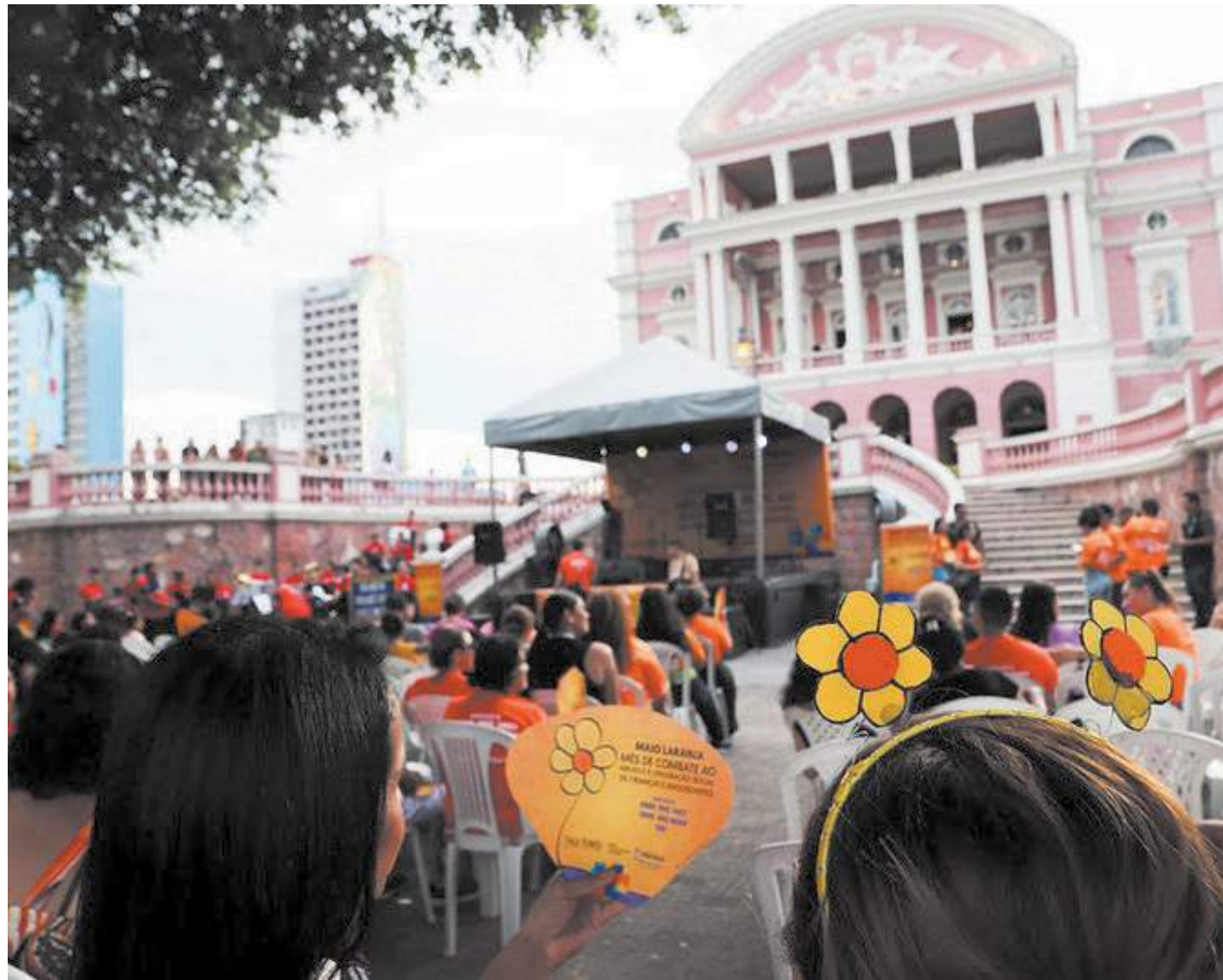
Prefeitura de Manaus abre a campanha "Maio Laranja", no Centro da cidade

Departamento de Proteção Social Especial (DPSE), destacou a importância das parcerias de órgãos e Organizações da Sociedade Civil (OSC) no atendimento de crianças e adolescentes.