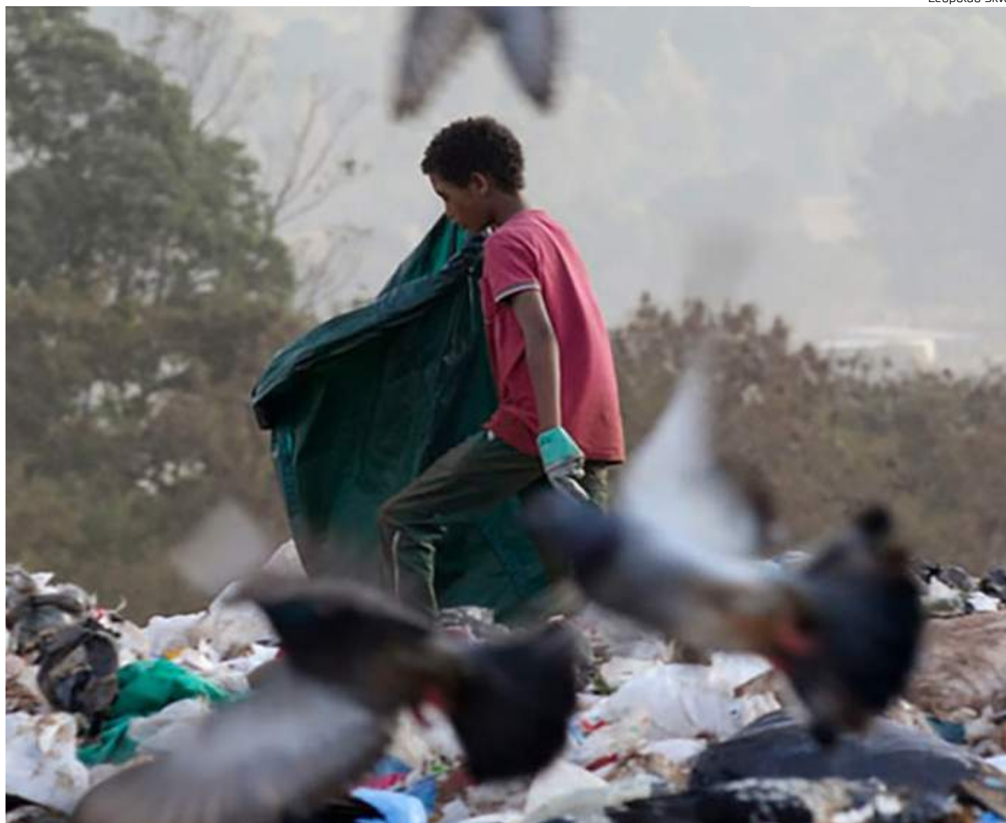
Pandemia contribuiu para o aumento do trabalho de crianças e adolescentes

"No Brasil não pode haver trabalho ordinário, produtivo, para menores de 16 anos. Entre 14 e 16 apenas como aprendiz, sendo um contrato de trabalho voltado para a profissionalização, não para a produção, não para o lucro. Já para o adolescente, ou seja, até 18 anos incompletos, a legislação não permite trabalhos insalubres, penosos, perigosos, prejudiciais à formação. Há claramente um sistema de proteção da criança e do adolescente que se reconhece a partir do Estatuto da Criança e do Adolescente, da própria Constituição da República e da consolidação das Leis do trabalho, diplomas que devem ser aplicados de modo a dialogarem entre si para esta proteção."