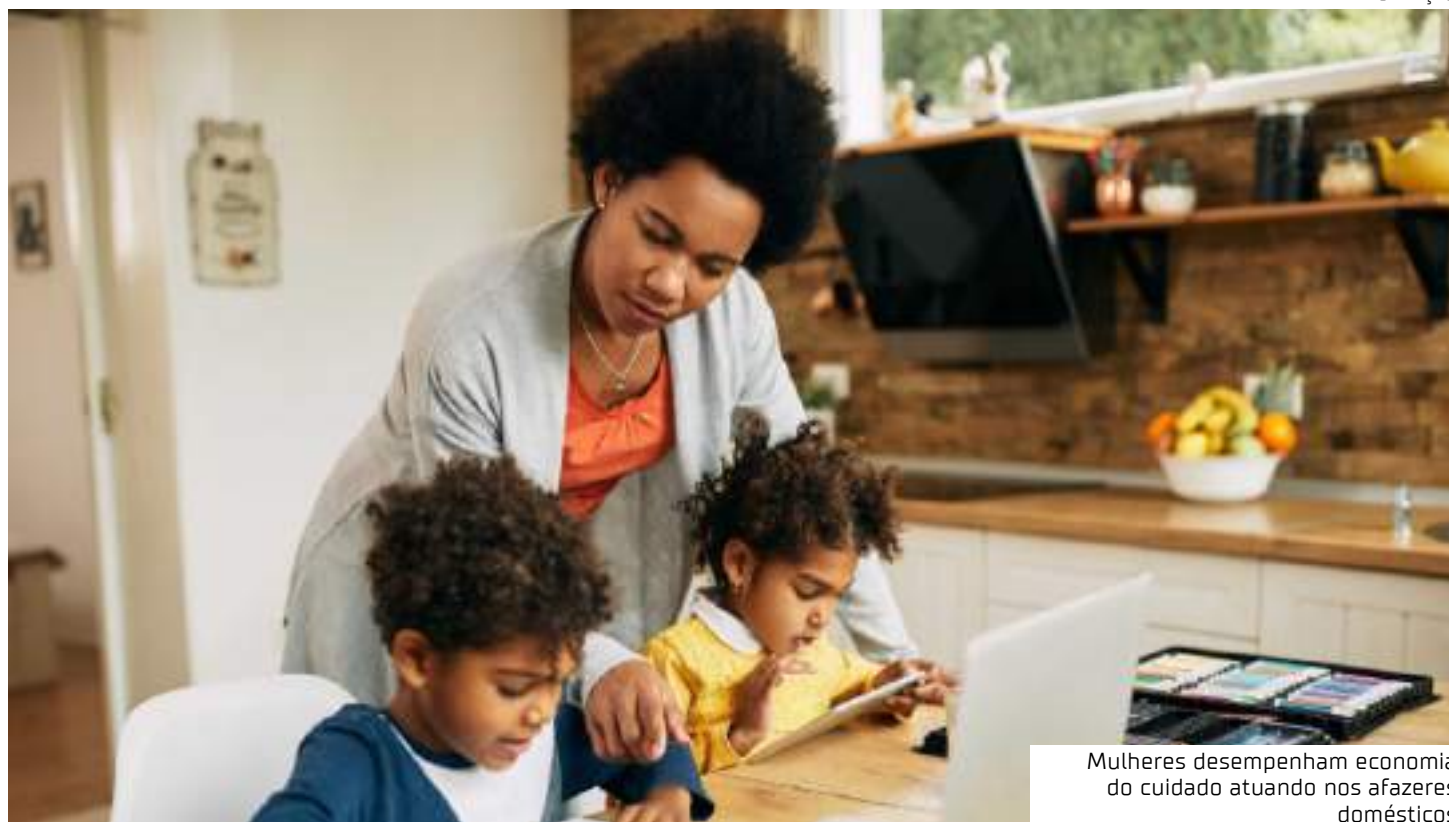
Mulheres desempenham economia do cuidado atuando nos afazeres domésticos

Outro apontamento da ganhadora do Nobel é a questão