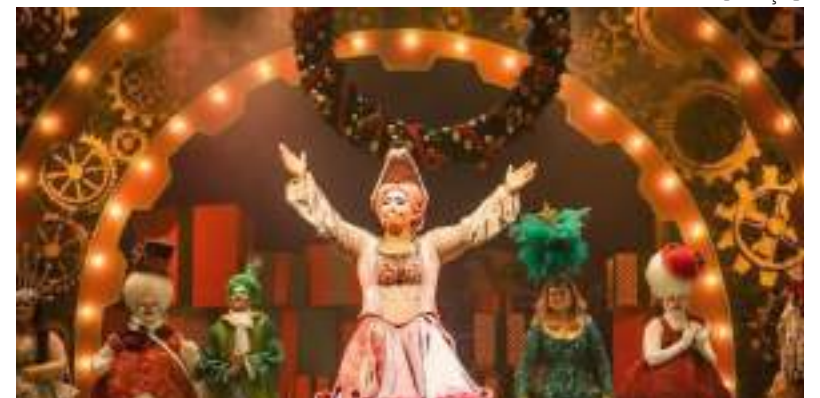
Projeto visa fortalecer os laços com a cultura comunitários