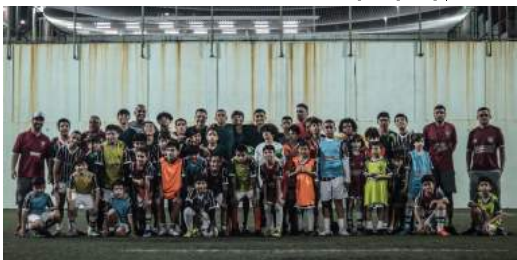
Atletas que atuam no Rio de Janeiro e os alunos da escola de futebol em Manaus trocaram experiências