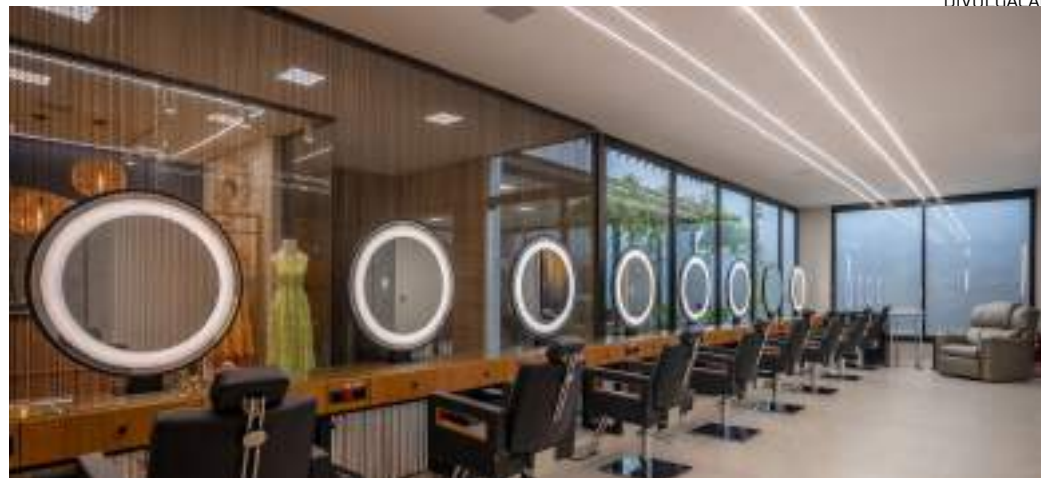
Studio de Manaus apresenta opções durante a semana das mães

Não apenas oferecendo serviços excepcionais, o Studio Vip Concept apresenta as mães, como no combo "Make Me Eternal", que oferece Nutrição Semi di Lino e escova por R$ 259 e, como brinde exclusivo, ao adquirir este combo as mães ganham