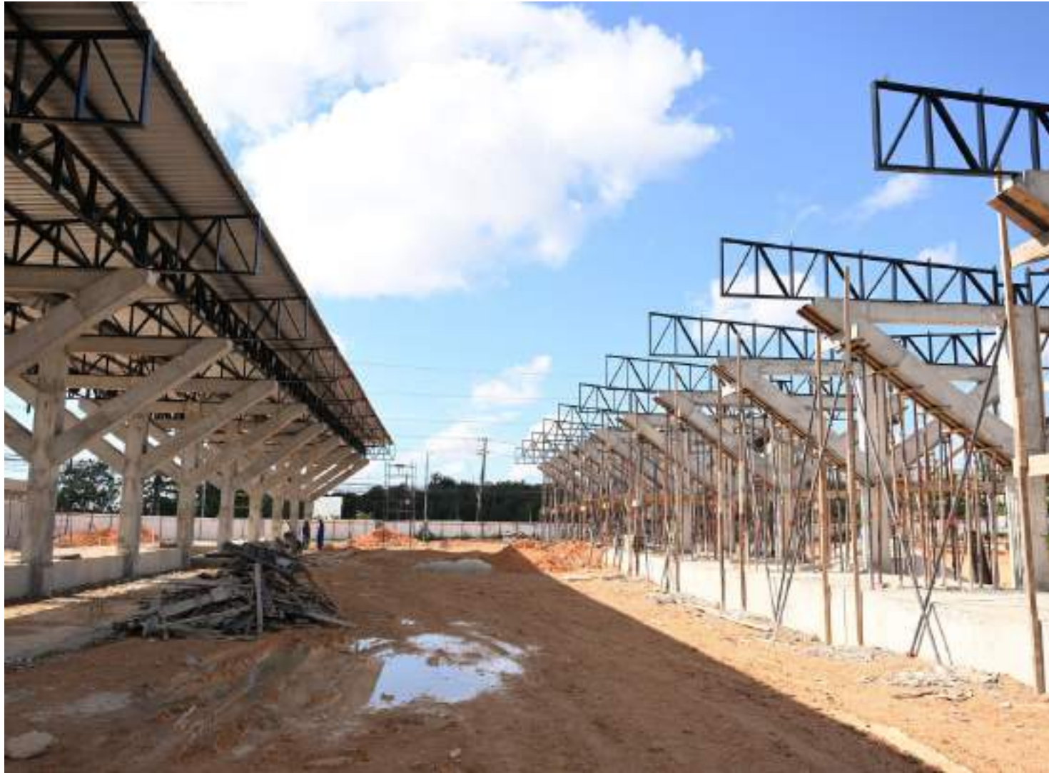
Terminal irá conectar diretamente os moradores do bairro às estações de transbordo do corredor viário da Torquato Tapajós e da Constantino Nery

A partir do Terminal 7, as viagens serão mais rápidas pelo corredor viário, proporcionando maior agilidade aos usuários do transporte coletivo local. O terminal irá conectar di-