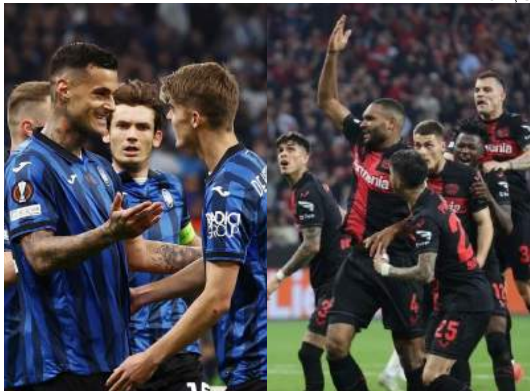
Atalanta venceu o Olympique de Marselha e o Bayer Leverkusen empatou com a Roma para garantirem vagas na final