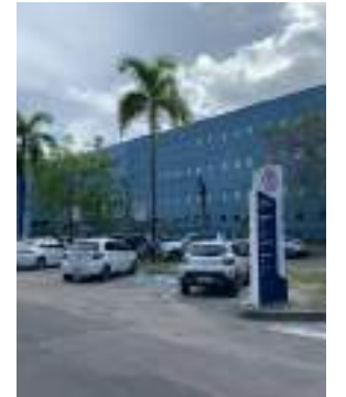
Unidade da Nilton Lins