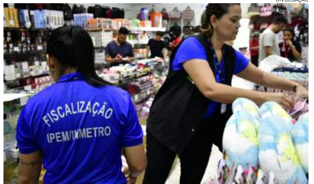
Realizada no período de 6 a 9 de maio, a operação especial Dia das Mães fiscalizou 6.338 produtos

Além dos eletrônicos de baixa tensão, foram apreendidos estojos escolares; ventiladores da marca Bruno; mini gammas; tomadas; extensão elétrica; lâmpadas LED e fitas de LED; e toucas de cabelo. Todo esse material não apresentava o selo Inmetro. Em relação às to-