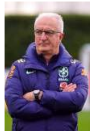
Técnico disputa primeira competição pela Seleção