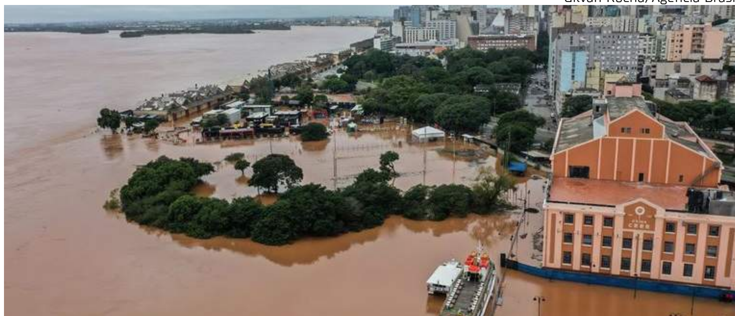
Rio Guaíba após chuvas intensas na região da Usina do Gasômetro, cartão-postal de Porto Alegre

"Estamos lançando essa campanha de arrecadação para atender essas vítimas e a prioridade neste momento é água potável e