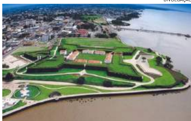
Suframa realiza Jornada de Integração Regional no Amapá

O Pitch Day voltado a Bionegócios, organizado pelo Programa Prioritário de Bioeconomia (PP-Bio), ocorrerá das 14h às 17h.