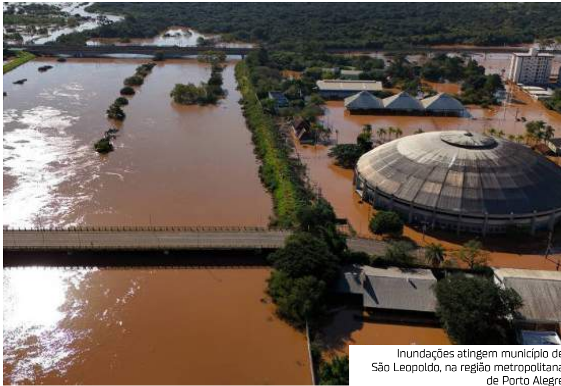
Inundações atingem município de São Leopoldo, na região metropolitana de Porto Alegre

Nesta quarta-feira (8), o ministro da Casa Civil, Rui Costa, havia dado algumas linhas gerais sobre a ajuda financeira para o Rio Grande do Sul, afirmando que o governo iria subsidiar as taxas de juros para pequenos empresários e pequenos produtores do Rio Grande do Sul contratarem