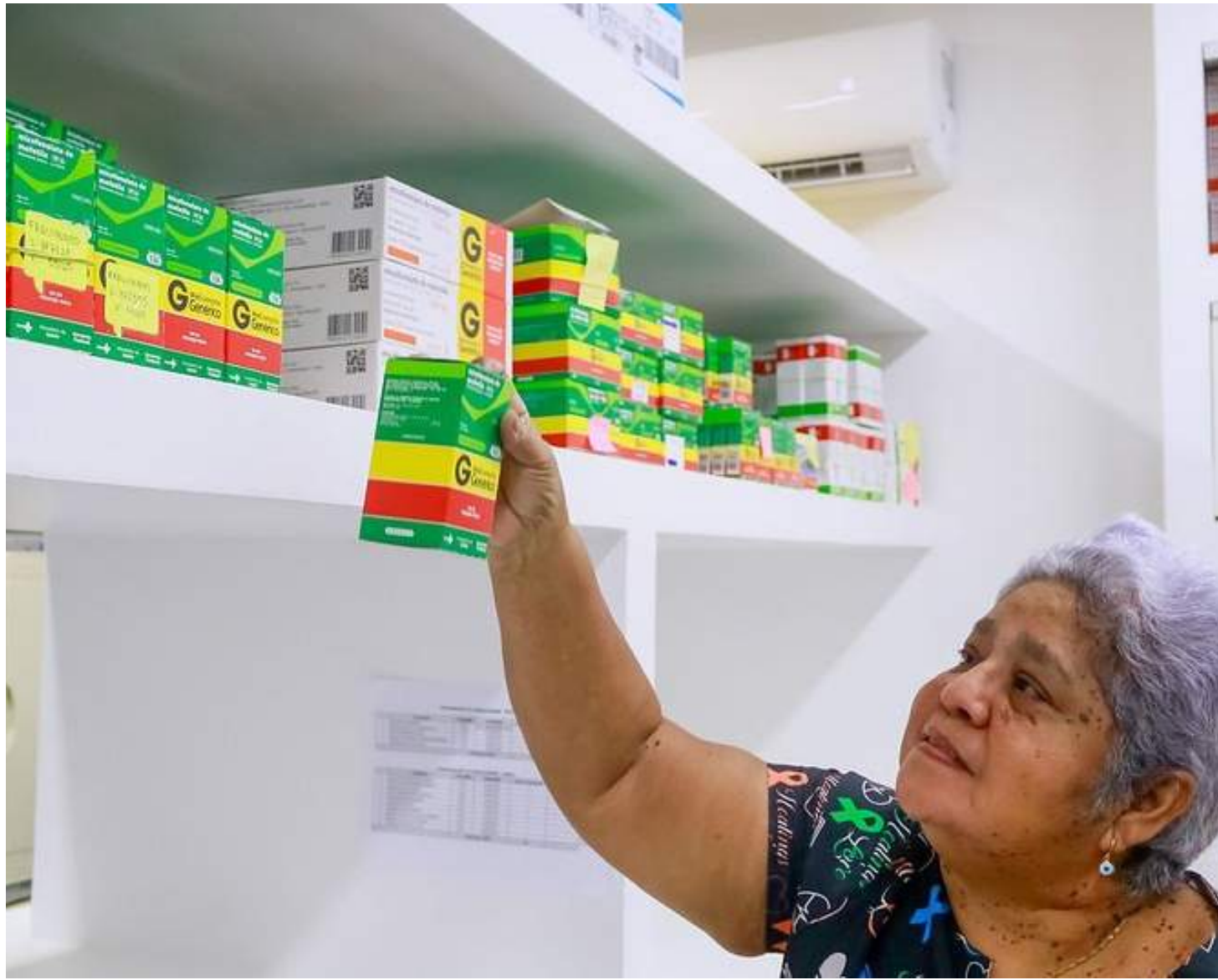
Medicamentos de alto custo são armazenados na Cema, que cuida de toda a logística de distribuição às farmácias descentralizadas

O Ceaf funciona, hoje, com aporte financeiro do Governo Federal, via do Ministério da Saúde (MS), e do Governo do Amazonas, pela SES-AM. Esse suporte é fundamental, por exemplo, para pacientes em tratamento de doenças crônico-degenerativas e para enfermidades consideradas raras. A logística e distribuição dos medicamentos para as farmácias descentralizadas é feita pela Cema.