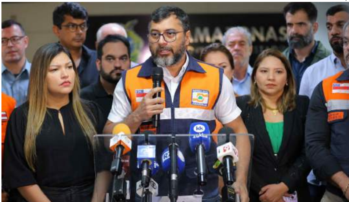
Wilson Lima anuncia a emissão de licenças ambientais para a dragagem de rios

O trabalho de dragagem será feito pelo Governo Federal, por meio do Departamento Nacional de Infraestrutura de Transportes (Dnit), com previsão de início imediato a partir da emissão das licenças. A dragagem atende um pleito do governador que desde o início do ano vem se reunindo com ministros de Estado, a exemplo dos ministérios de Portos e Aeroportos, de Integração e Desenvolvimento Regional e de Meio Ambiente e Mudança do Clima, solici-