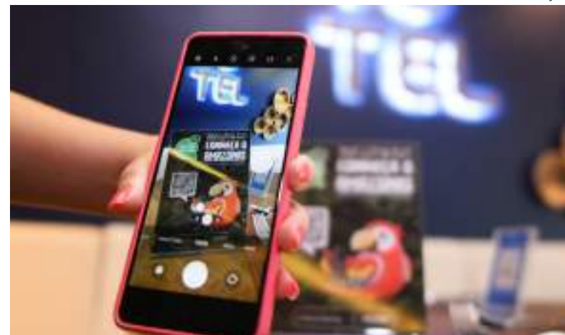
Ferramenta auxilia turistas com informações relevantes sobre o Estado