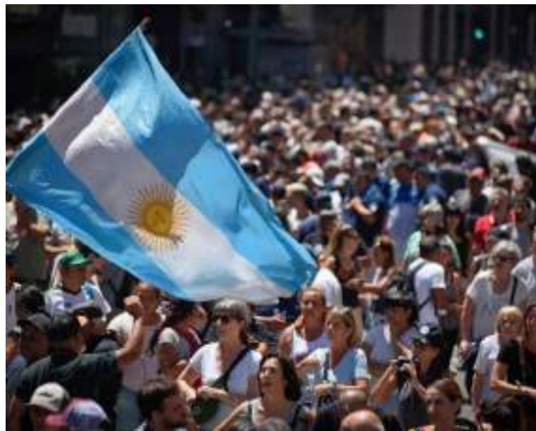
Pessoas protestam em frente ao Congresso durante greve geral