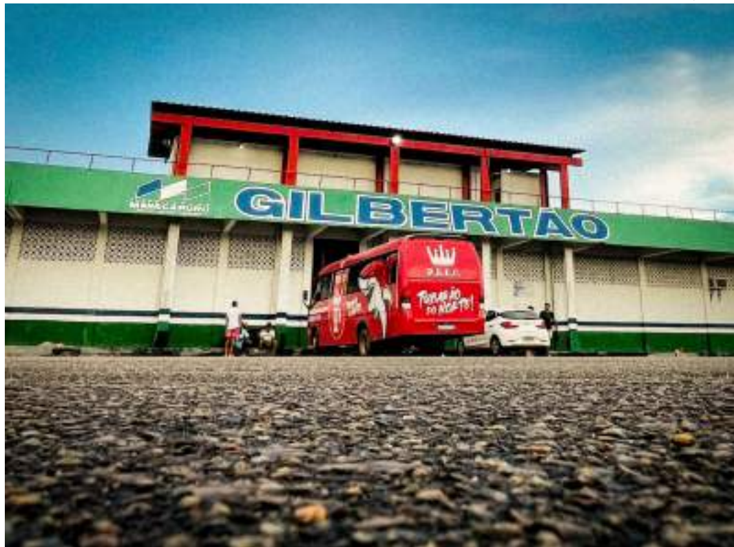
Estádio Gilbertão vai receber doações de 9h às 18h, inclusive no sábado (11), dia do jogo contra o Manaus FC

"O futebol tem um papel social muito importante, de inclusão, e não seria diferente agora. Temos acompanhado o quanto tem sido a luta do povo do Rio Grande do Sul, mas também temos visto a mobilização do futebol para tentar ajudá-los. Por isso, convoco a torcida maravilhosa que nós temos, e não somen-