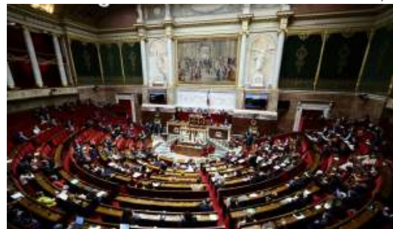
Assembleia Nacional abre comissão para investigar crimes sexuais no cinema