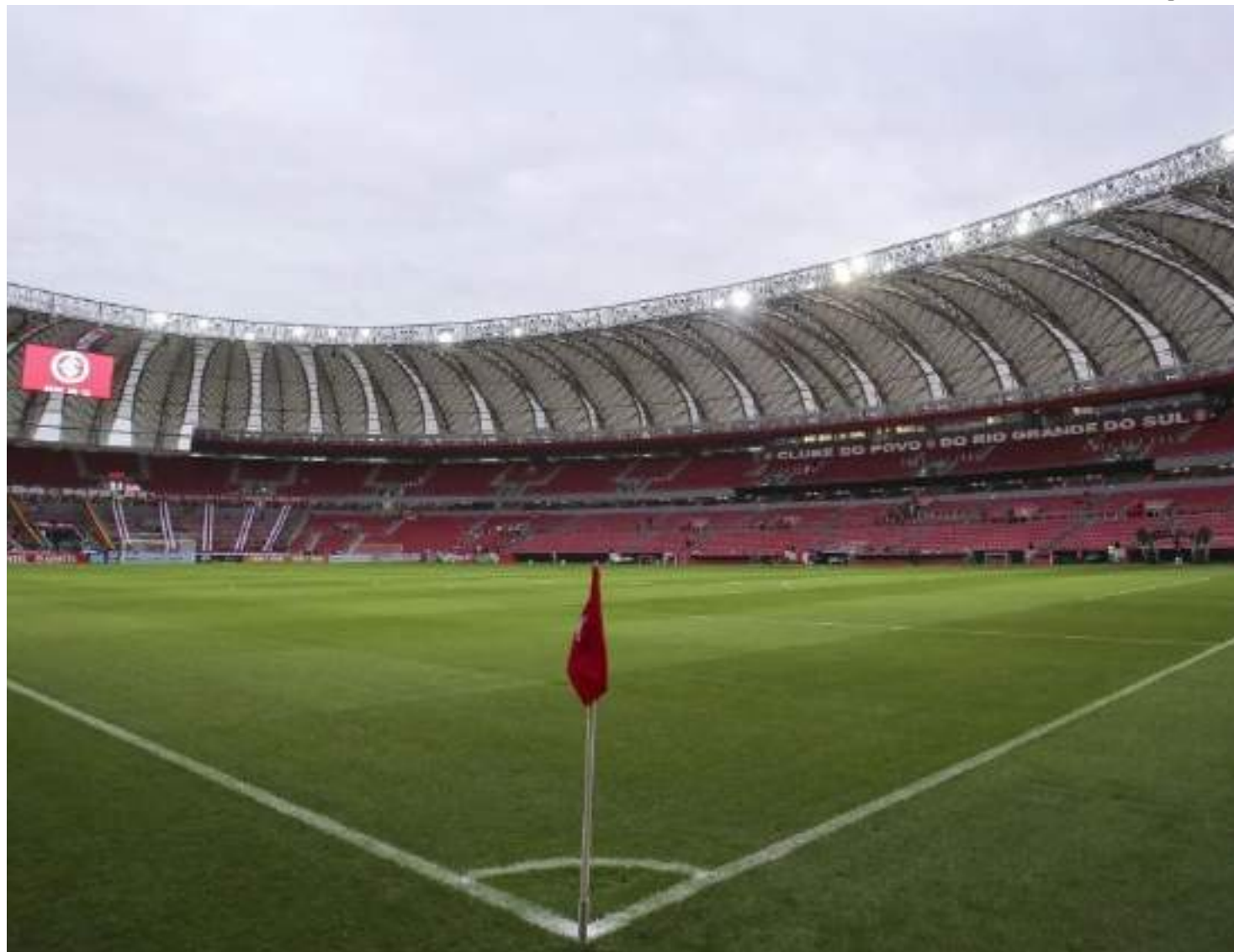
Partida entre Internacional e Juventude, pela Copa do Brasil, que aconteceria no Beira-Rio, foi a primeira a ser adiada

O governador do Rio Grande do Sul, Eduardo Leite (PSDB), decretou estado de calamidade pública na