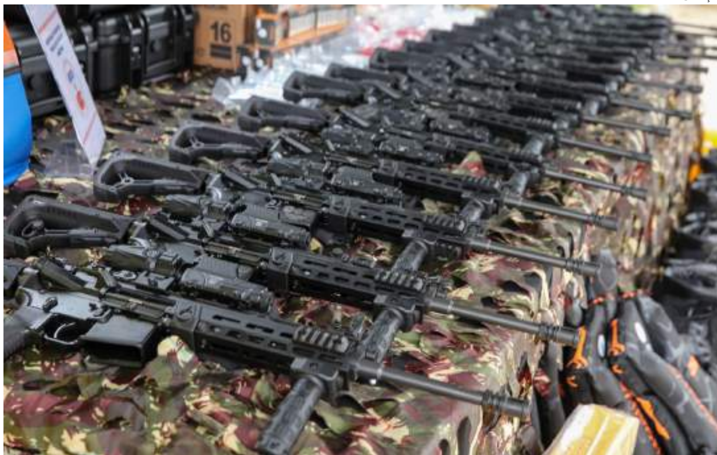
Polícias Civil, Militar, CBMAM e a SSP-AM receberam novos armamentos, munições letais e não letais

Todo o material foi adquirido pela SSP-AM por meio de recursos próprios, doações e convênios com o Governo Federal. Ao falar à tropa e demais autoridades presentes, o vice-governador destacou que os investimentos resultam do esforço da gestão Wilson Lima em melhorar as condições de trabalho das forças de segurança, refle-