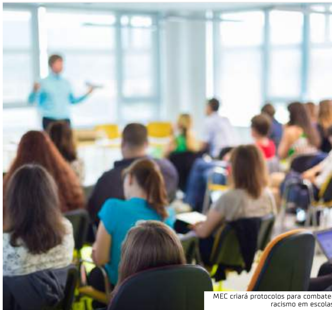
MEC criará protocolos para combater racismo em escolas

Esse programa avalia e disponibiliza obras didáticas, pedagógicas e literárias, entre outros materiais de apoio à prática educativa, de forma sistematizada, regular e gratuita, às escolas públicas de educação básica das redes federal, estaduais, municipais e distrital e também às instituições de educação infantil comunitárias, confessionais ou filantrópicas sem fins lucrativos