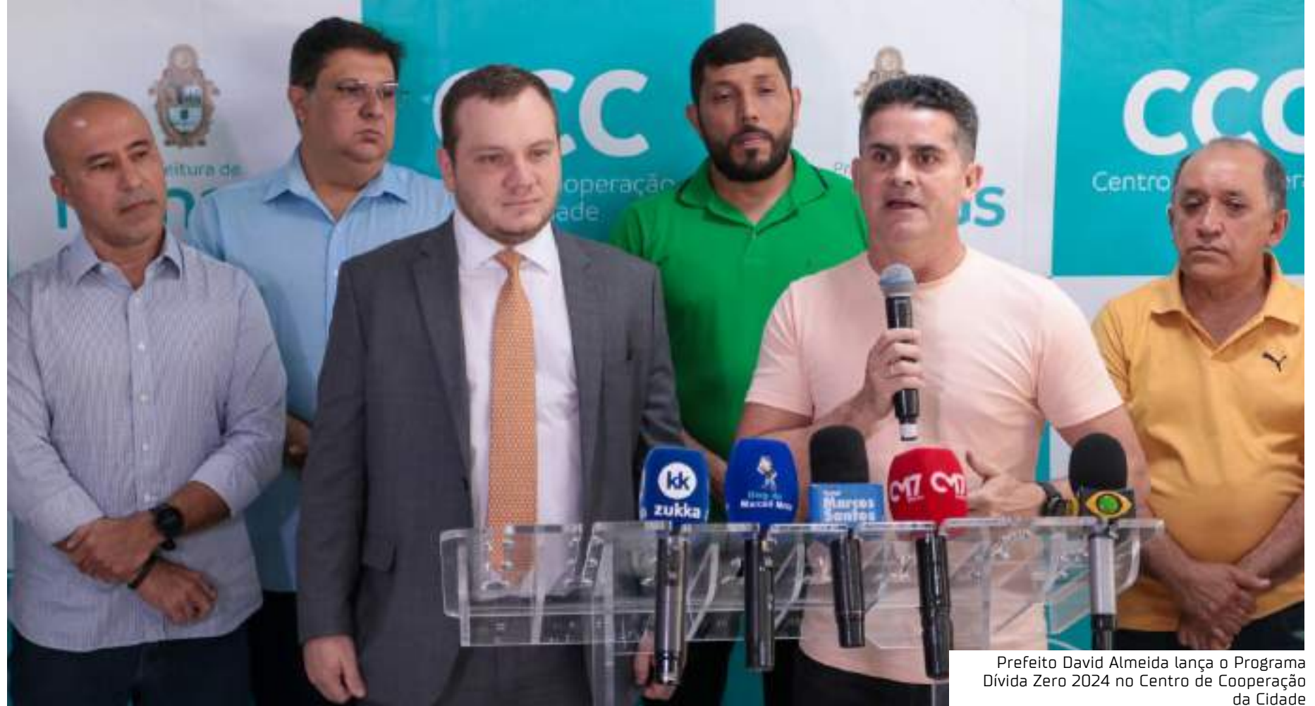
Prefeito David Almeida lança o Programa Dívida Zero 2024 no Centro de Cooperação da Cidade

"A transação tributária substitui o refis, geralmente o refis era feito sempre no final de cada ano. Agora nós abrimos a transação tributária, nós vamos ter um período de 60 dias, provavelmente prorrogável por mais 30 dias, então vamos ter 90 dias. Nos próximos 90 dias, aqueles devedores de ISS, de IPTU, de Alvará, poderão