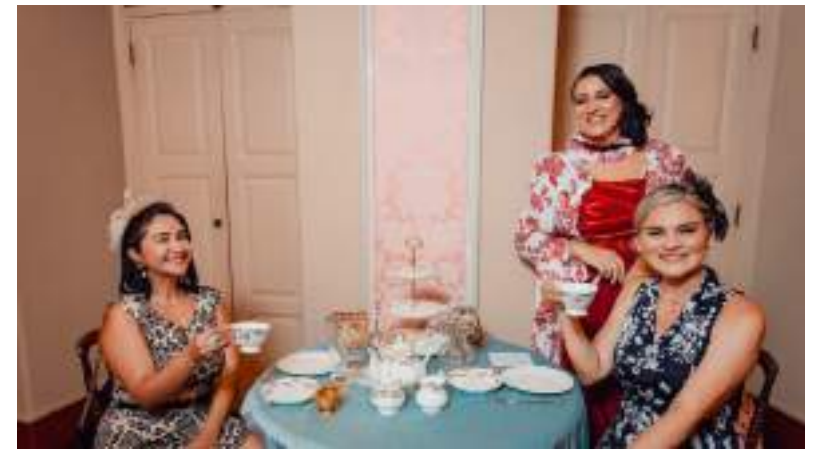
Evento mistura modernidade e tradição cultural gastronômica