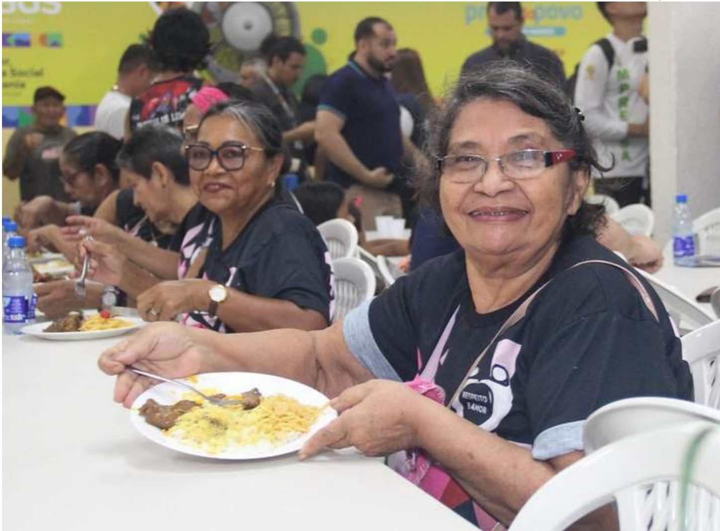
Programa "Manaus Sem Fome" foi lançado, em 2023, e visa garantir a distribuição de mais de 3,5 milhões de refeições por ano na capital