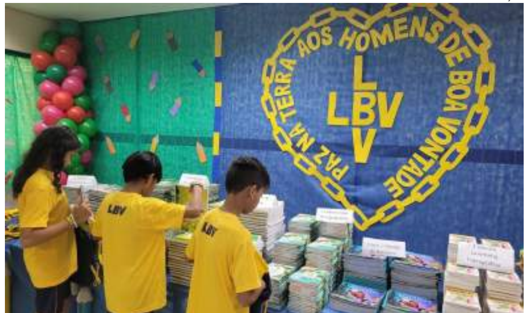
Mais de 626 mil pessoas foram impactadas pelos serviços e programas socioeducacionais da Instituição

A LBV iniciou, em 2024, uma das maiores mobilizações sociais no Brasil para contribuir para a educação de crianças e adolescentes em vulnerabilidade social. A Instituição lançou a campanha 'Educação: Futuro no Presente', com o intuito de amenizar as desigualdades sociais provenientes do aumento dos níveis de pobreza e da fome no país.