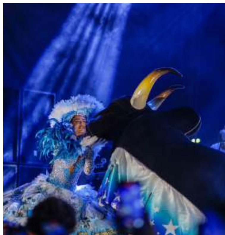
Festa vai contar com itens oficiais do Boi Caprichoso -