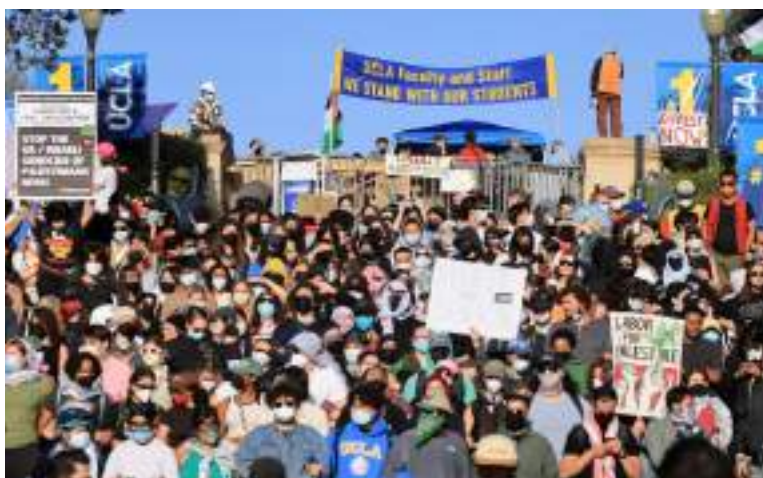
Protesto pró-palestino na Universidade da Califórnia em Los Angeles