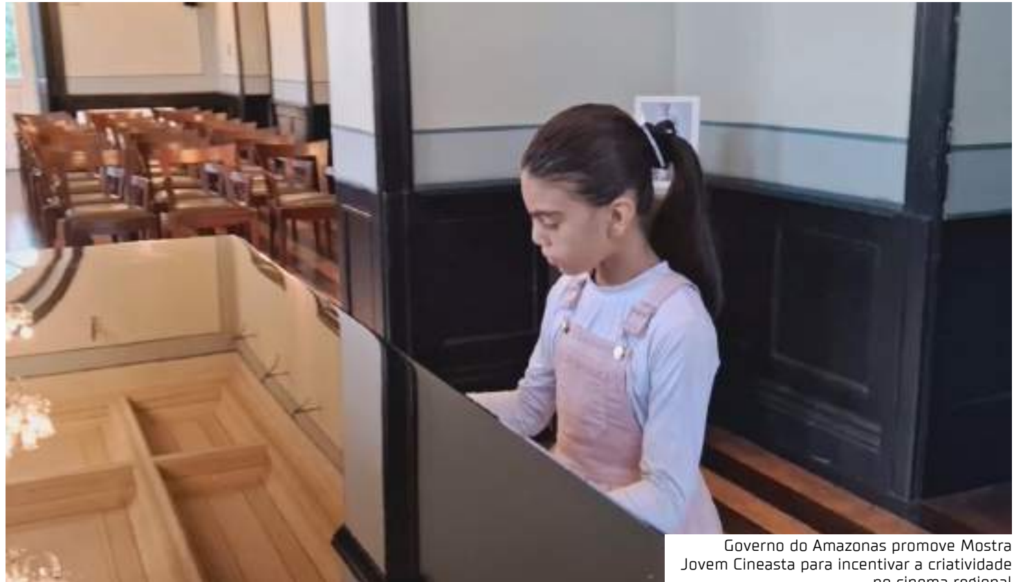
Governo do Amazonas promove Mostra Jovem Cineasta para incentivar a criatividade no cinema regional