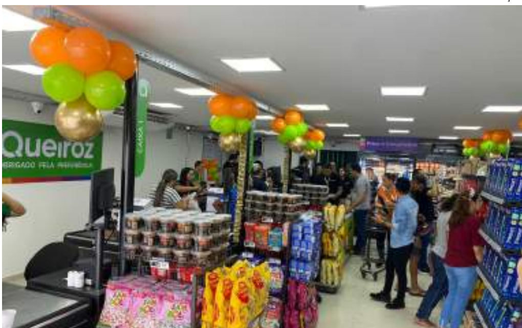
Empresa de Manaus espera um crescimento de 30% nas vendas