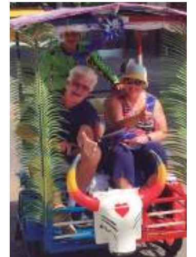
Visitantes gastam, em média, R$ 1,5 mil durante festival

Pelos cálculos dos organizadores, os visitantes devem gastar, em média, R$ 1,5 mil nos três dias de festa com alimentação, transporte, compras e hospedagens. Durante a disputa dos bumbás no ano passado, os gastos de turistas somaram R$ 146 milhões.