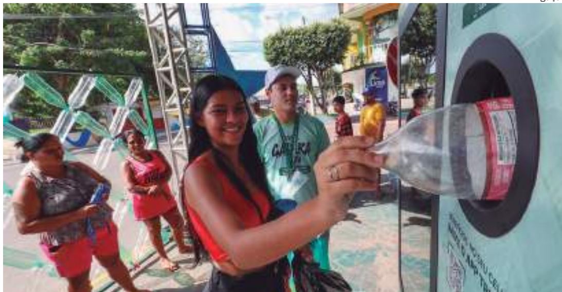
Espaço 'Recicla, Galera' se firma como centro de sustentabilidade da festa

Nos equipamentos, podem ser destinadas latinhas ou garrafas PET. O descarte de cinco ou 15 resíduos, de uma única vez, é recompensado com brindes exclusivos: cinco resíduos podem ser trocados por uma bebida do