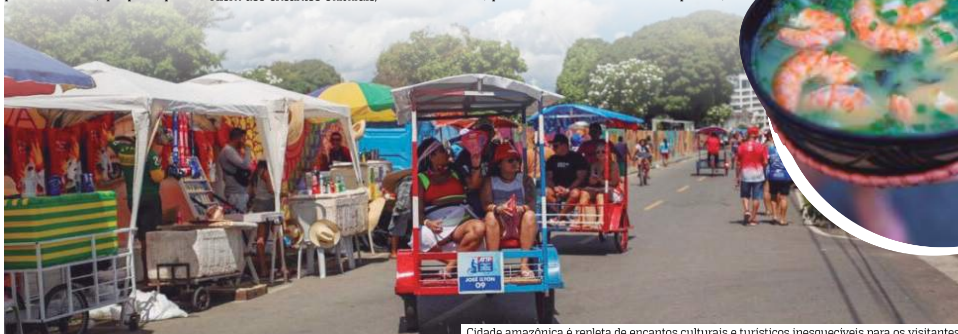
Cidade amazônica é repleta de encantos culturais e turísticos inesquecíveis para os visitantes