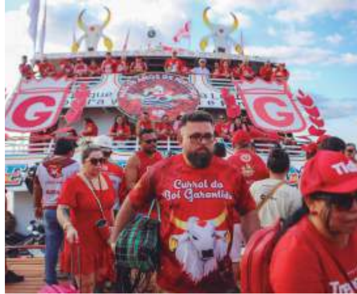
Caravanas dos bumbás chegaram a bordo de barcos organizados

Já os torcedores encarnados chegaram no pier da