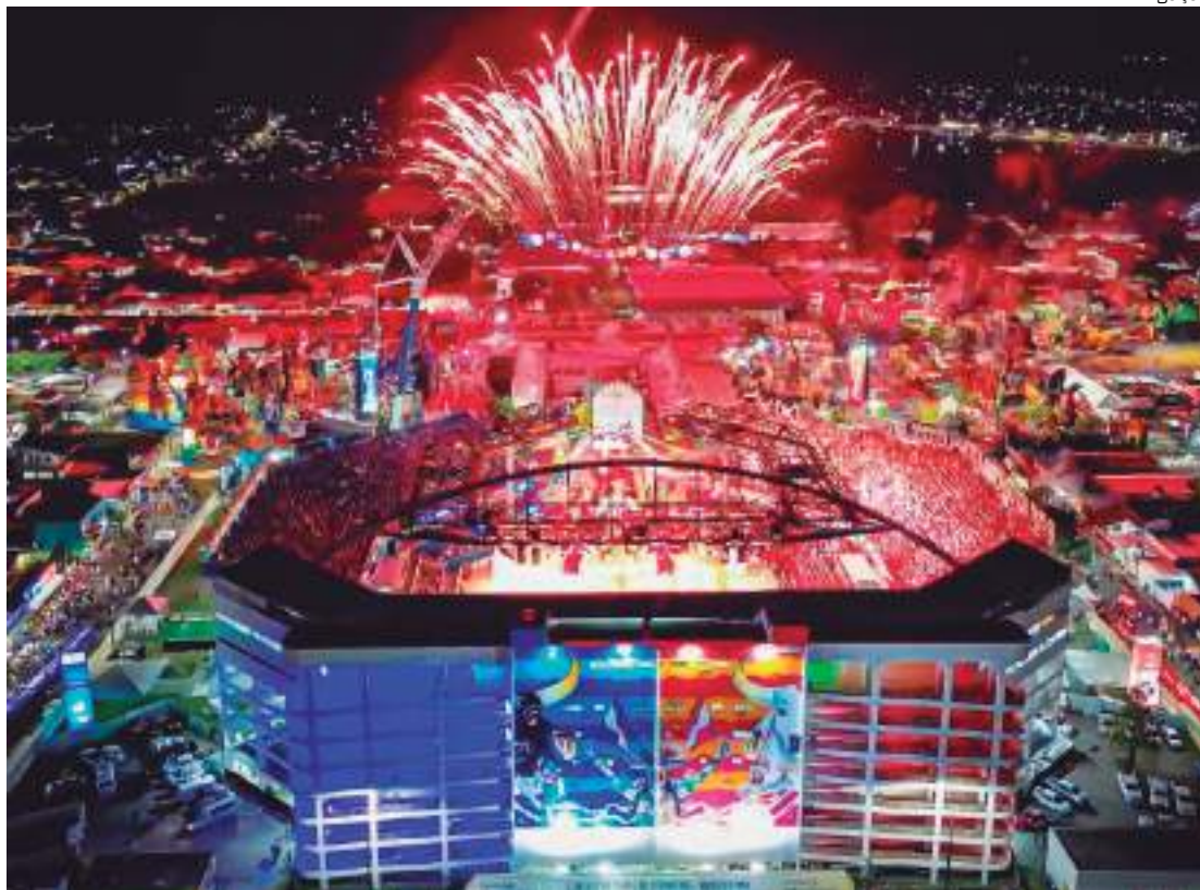
Cidade recebe visitantes de todos os cantos do planeta para assistir o duelo entre os bumbás