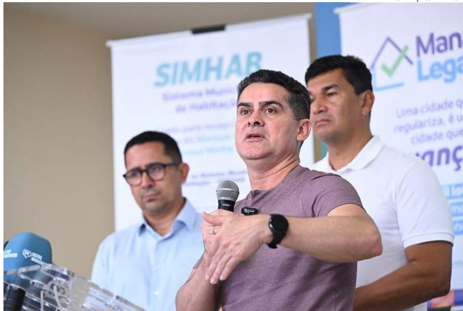
Prefeito de Manaus, David Almeida, no lançamento do programa "Manaus, Minha Terra"

"Nossa gestão tem uma preocupação muito grande com o problema que é o déficit habitacional. Em razão disso, além dos outros programas que já vínhamos executando, teremos agora, esse que, depois de 50 anos, será o primeiro bairro totalmente