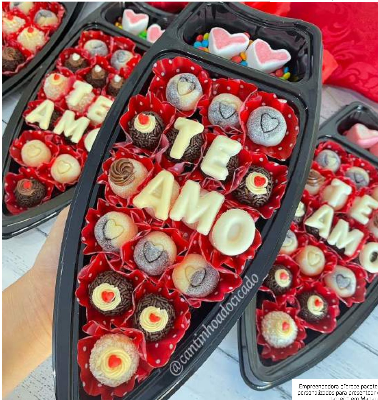
Empreendedora oferece pacotes personalizados para presentear o parceiro em Manaus

Divulgando seu trabalho por meio do Instagram, a empreendedora oferece pacotes personalizados para presentear o parceiro, o que chama a atenção de clientes que procuram uma alternativa mais barata, sem abrir mão da qualidade.