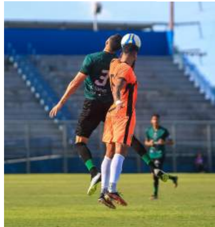
Esmeraldino enfrenta o Rio Branco-AC fora e Robô recebe o Trem-AP