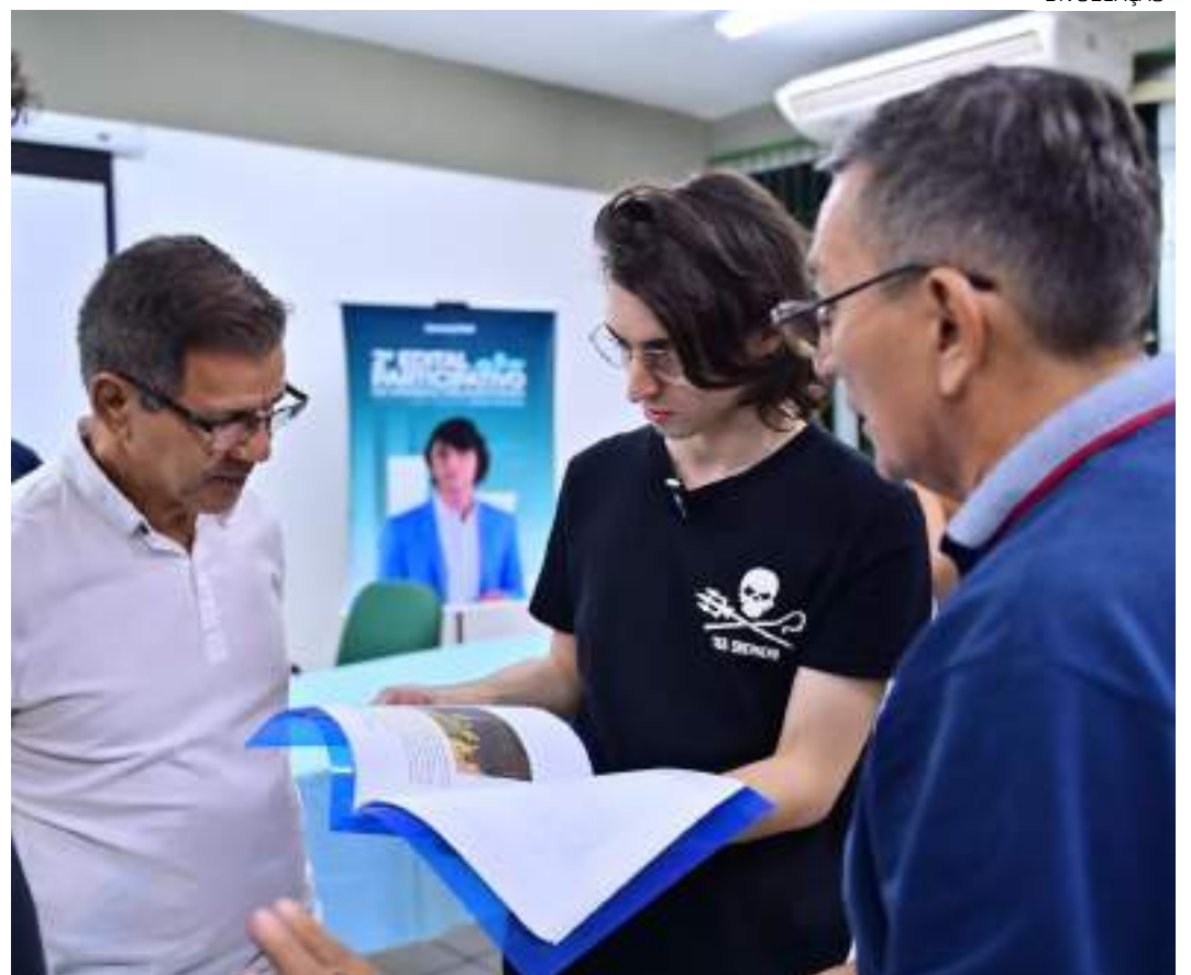
Amom Mandel apresenta propostas contempladas pelo edital participativo

Segundo o edital, poderão participar organizações do terceiro setor aptas a receber recursos de emendas parlamentares, secretarias, prefeituras, hospitais e instituições de ensino superior públicas no Amazonas. O resultado da seleção está previsto para ser divulgado em agosto deste ano, com execução orçamentária prevista para 2025. O parlamentar destacou que as instituições poderão participar, desde que passem por todas as etapas descritas no edital, especialmente a votação popular. “Aqui, neste mandato, quem decide para onde vão os recursos é a população”, enfatizou Amom.