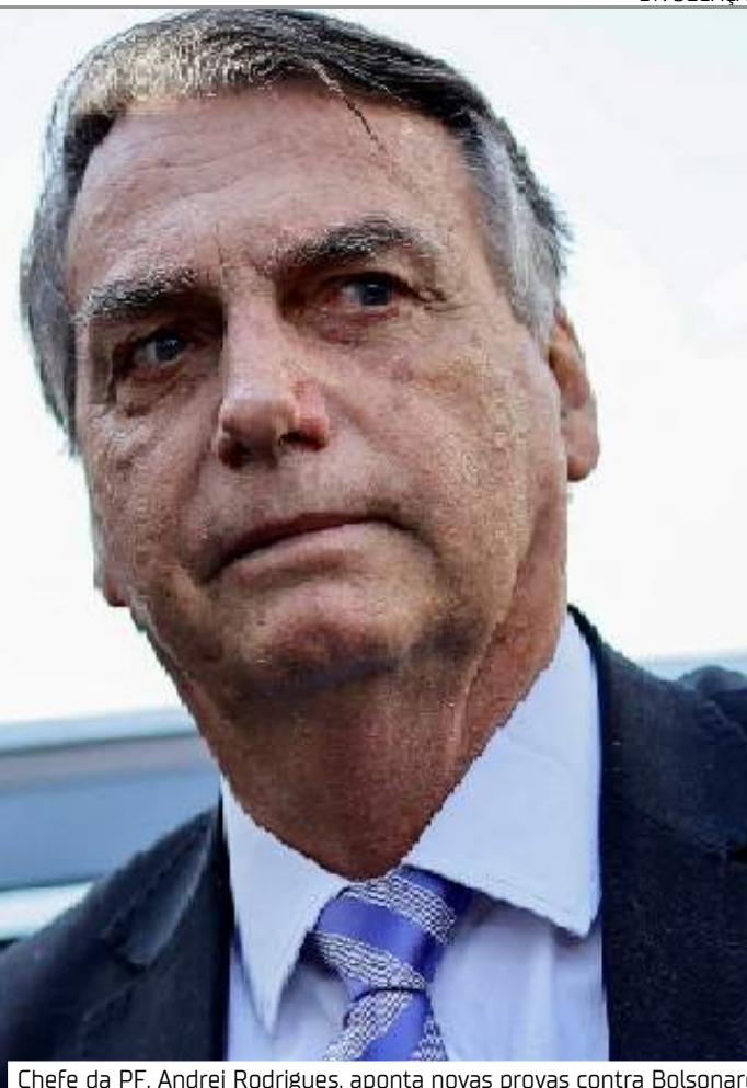
Chefe da PF, Andrei Rodrigues, aponta novas provas contra Bolsonaro

não estava no foco da investigação. Houve um encontro de um novo bem vendido no exterior e isso talvez tenha sido um dos fatores para atrasar a conclusão do inquérito. Esse encontro robustece a investigação que se iniciou desde a apreensão no aeroporto", explicou Rodrigues.