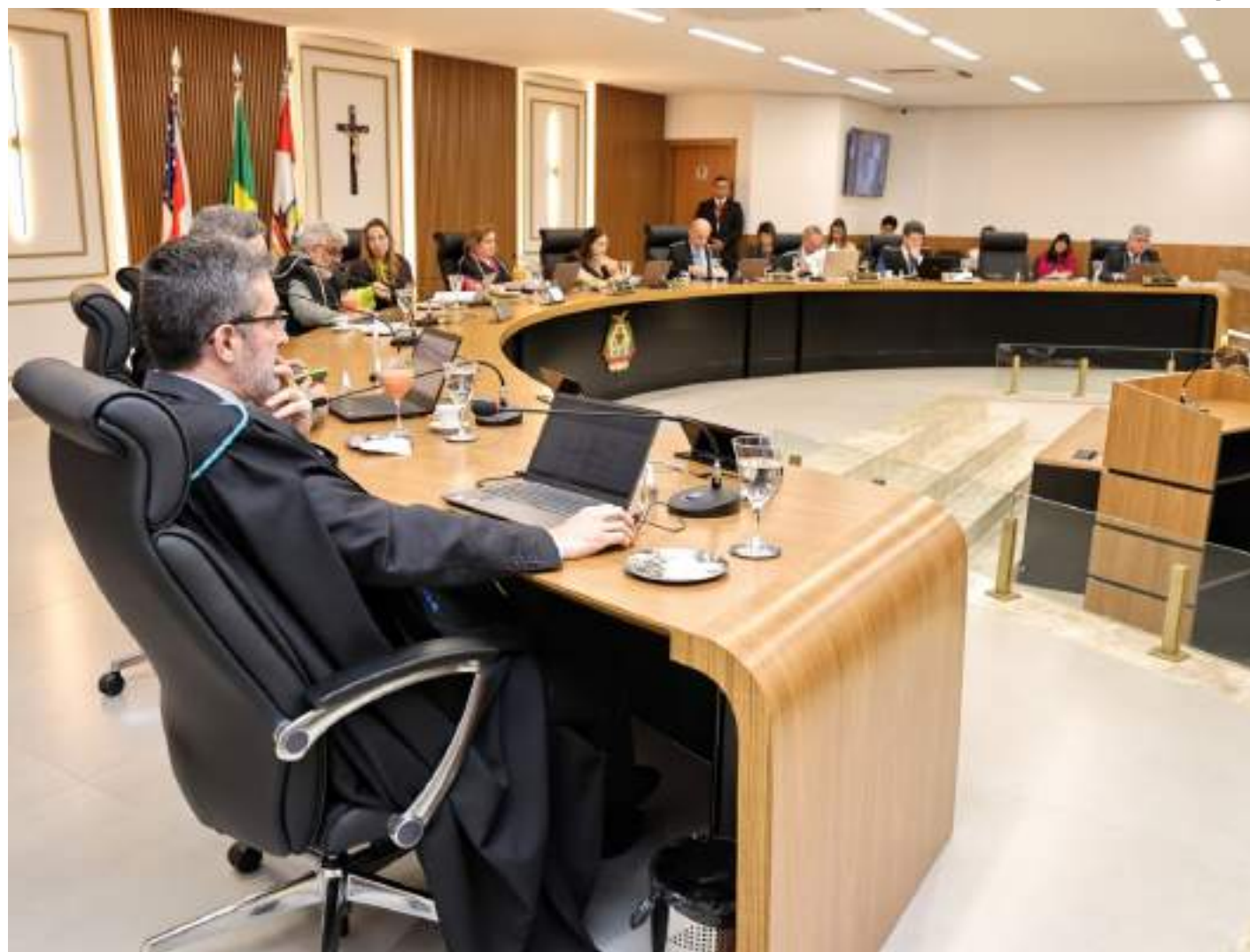
Conselheiros do TCE-AM desaprovaram as contas do exercício de 2020 do SAAE de Manacapuru