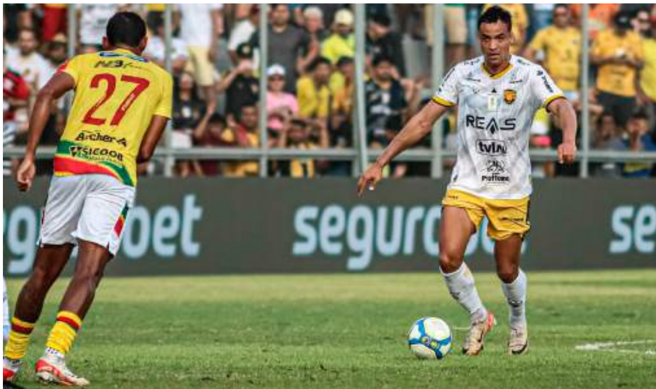
Onça-pintada estreou no estádio, na Série B do Campeonato Brasileiro, com vitória sobre o Brusque-SC por 2 a 1, no sábado (8)