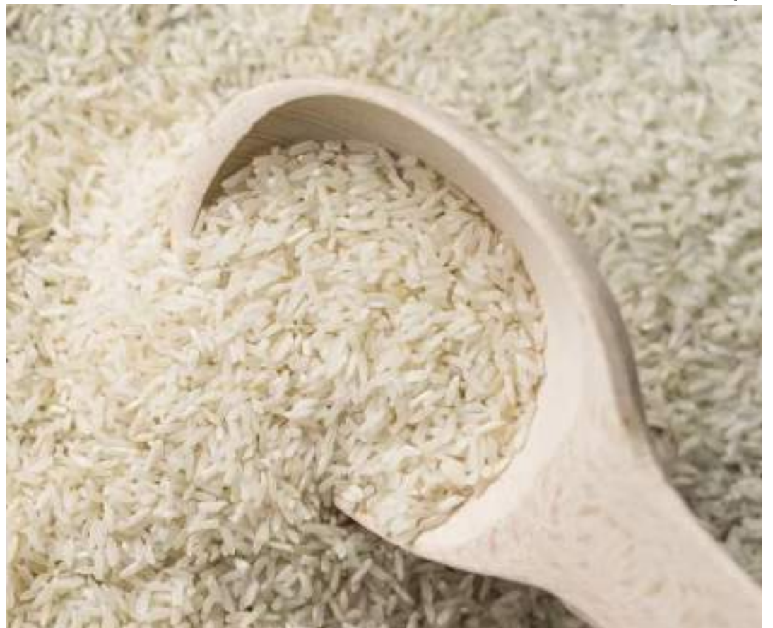
Rio Grande do Sul é responsável por cerca de 70% do arroz consumido no país

O objetivo da importação do arroz é garantir o abastecimento e estabilizar os preços do produto no mercado interno, que tiveram uma alta média de 14%, chegando em alguns lugares a 100%, após as inundações no Rio Grande do Sul em abril e maio deste ano.