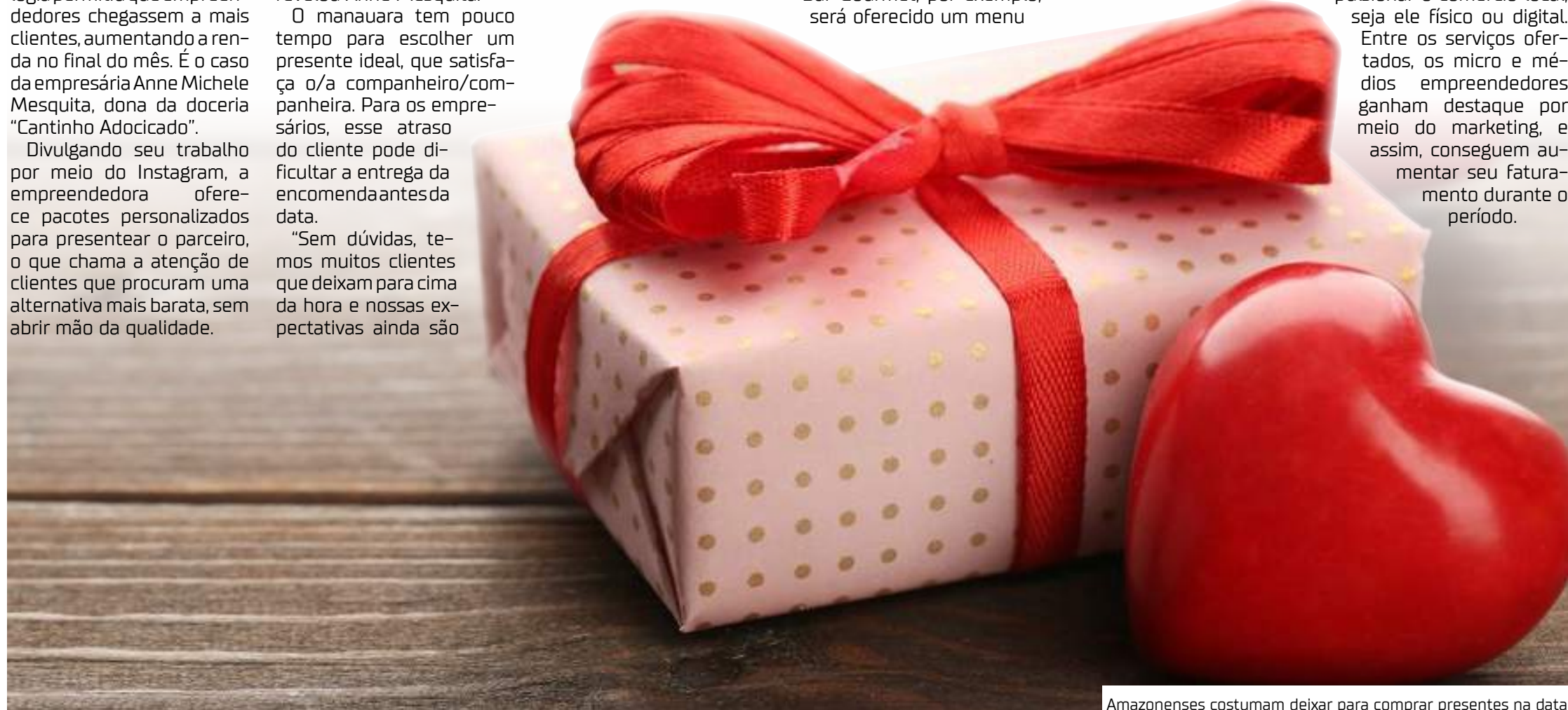
Amazonenses costumam deixar para comprar presentes na data

O Dia dos Namorados é uma data para celebrar o amor, mas também para impulsionar o comércio local, seja ele físico ou digital. Entre os serviços ofertados, os micro e médios empreendedores ganham destaque por meio do marketing, e assim, conseguem aumentar seu faturamento durante o período.