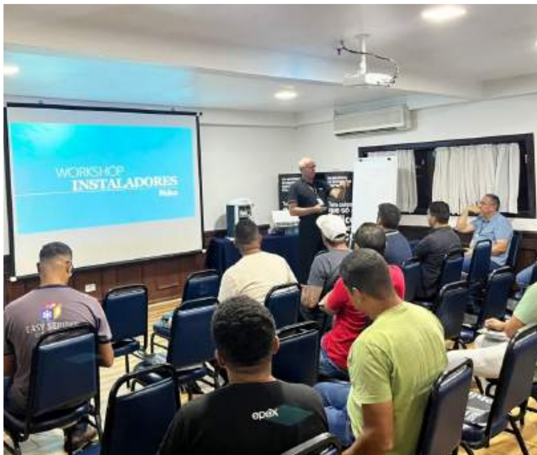
Programa da Philco oferta treinamento para instaladores de ar-condicionados

Para participar é necessário realizar uma inscrição gratuitamente pelo link: https://cursos.philco.com.br/workshops/ . Os workshops presenciais do programa "Seja um instalador Philco" possuem limite de 100 vagas, já os workshops online não possuem limite. As capacitações que vão acontecer remotamente terão temas específicos com transmissão para todo o país nos dias 27 de junho, 21 de agosto e 19 de setembro. O período de inscrições do treinamento online já está disponível no site do curso.