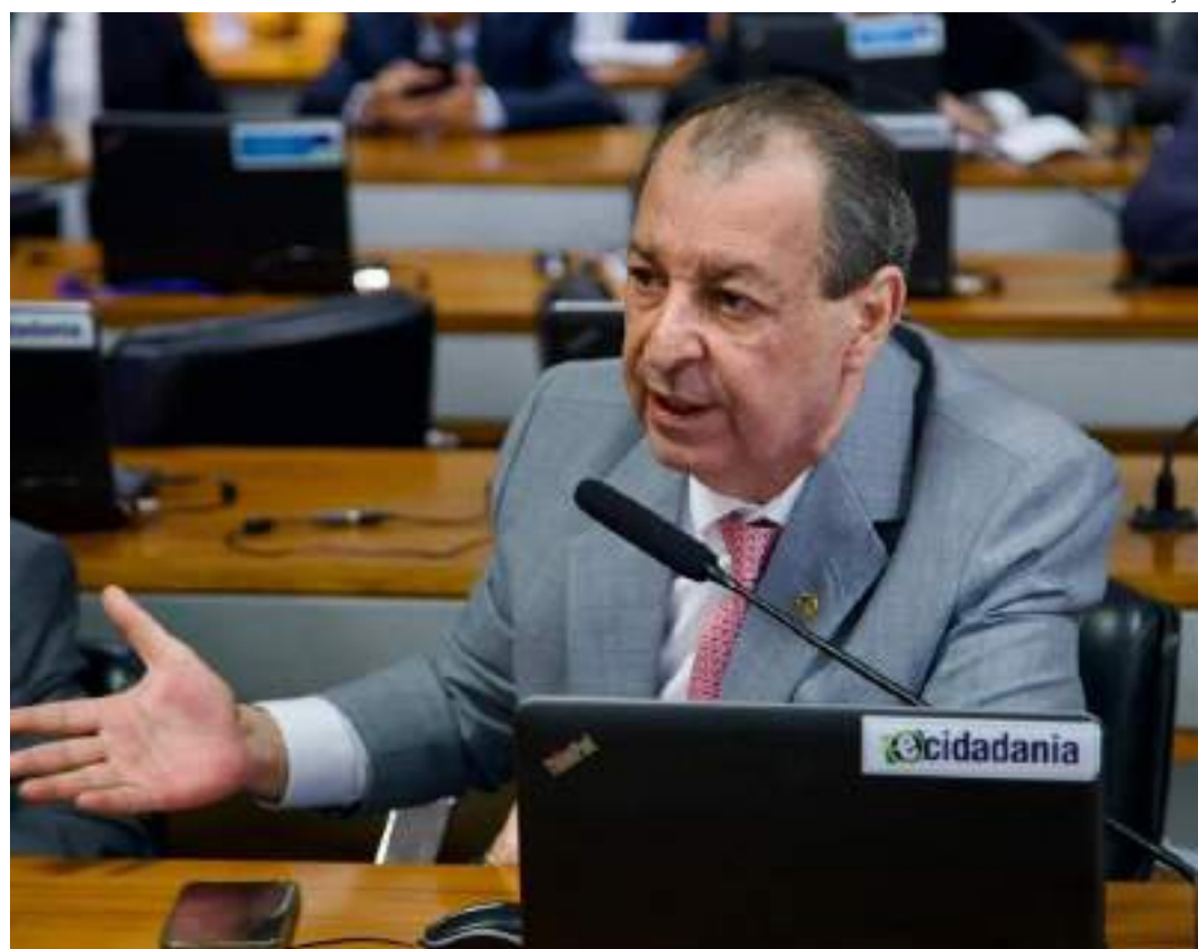
Senador Omar defende suspensão de pagamentos de empréstimos para afetados em calamidade

"A gente passa uma vida toda para construir uma casa e às vezes em minutos você perde tudo. Imagine o sofrimento dessas pessoas ali. Vindo de uma região que sofre com cheias e com secas, a gente imagina a situação pela qual hoje os gaúchos estão passando. Por isso que voto a favor do projeto. Eu vejo o Governo Federal, através do Presidente Lula, muito preocupado e eu acho que o Senado Federal e o Congresso Nacional têm que fazer a parte deles. E esse projeto de lei significa que o Congresso está fazendo a sua parte", reforçou Omar.