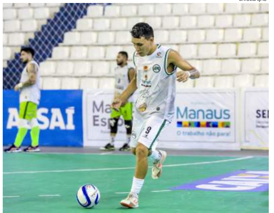
Estrela do Norte/Manaus Futsal-AM se prepara para jogo contra Passo Fundo-RS

No dia do jogo, a bilheteria da Arena Amadeu Teixeira abrirá às 9h. O valor do ingresso será R$ 20 (inteira) e R$ 10 (estudante). As gratuidades para crianças até 12 anos, idosos acima de 65 anos e Pessoas com Deficiência devem ser retirados antecipadamente na sede do Estrela do Norte ou na bilheteria da Arena Amadeu Teixeira no dia do jogo.