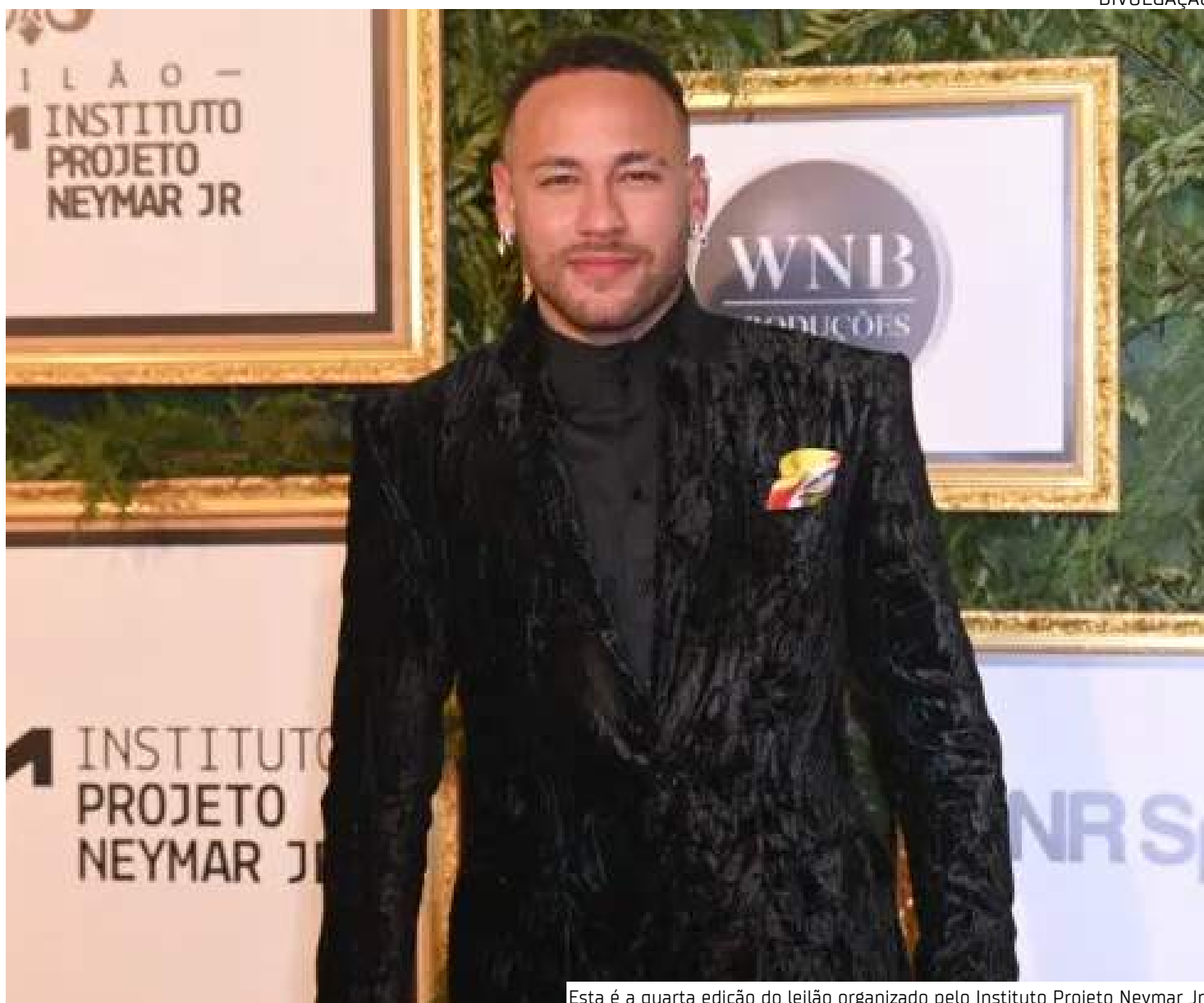
Esta é a quarta edição do leilão organizado pelo Instituto Projeto Neymar Jr.

Entre os boleiros, os ex-atacantes da Seleção Brasileira Careca, ídolo do Guarani e do São Paulo, e Denilson, atual comentarista na Band, marcaram presença.