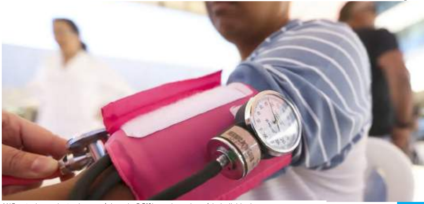
ANS autoriza reajuste de no máximo de 6,91% no plano de saúde individual

Para chegar à variação máxima permitida, a ANS aplica, desde 2019, uma metodologia que leva em conta duas variáveis: o Índice de Valor das Despesas Assistenciais (IVDA) e o Índice Nacional de Preços ao Consumidor Amplo (IPCA), considerado a inflação oficial do país, já descontado o