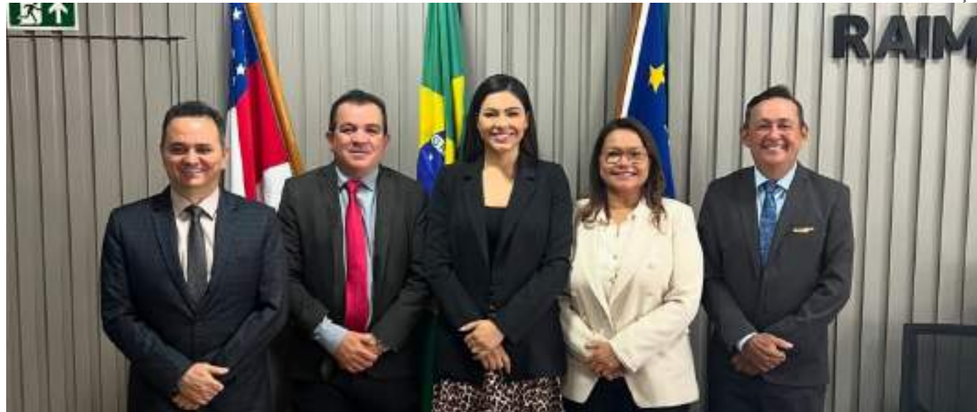
Documento para criação de CPI em Parintins foi assinado por cinco de 13 vereadores

O parlamentar municipal complementou que a CPI também tem como cunho a averiguação dos fatores que levaram o prefeito de Parintins, Frank Bi Garcia, a declarar situação de emergência somente no mês de maio passado, quando tinha conhecimento da problemática há quase 20 anos. Além disso, Bi Garcia participou de reuniões com órgãos estaduais e federais onde teve acesso a laudos que comprovavam a contaminação da