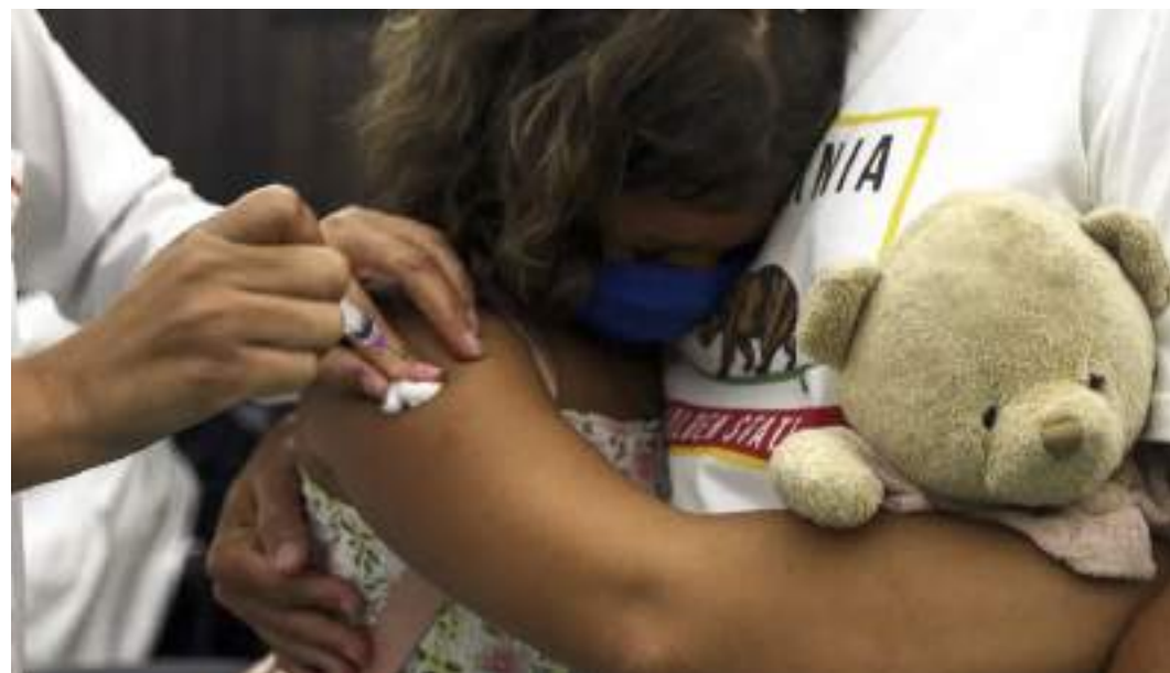
Doença tende a se alastrar em tempos de clima ameno ou frio e a vacinação é obrigatória

No Brasil, o último pico epidêmico de coqueluche ocorreu em 2014, quando foram