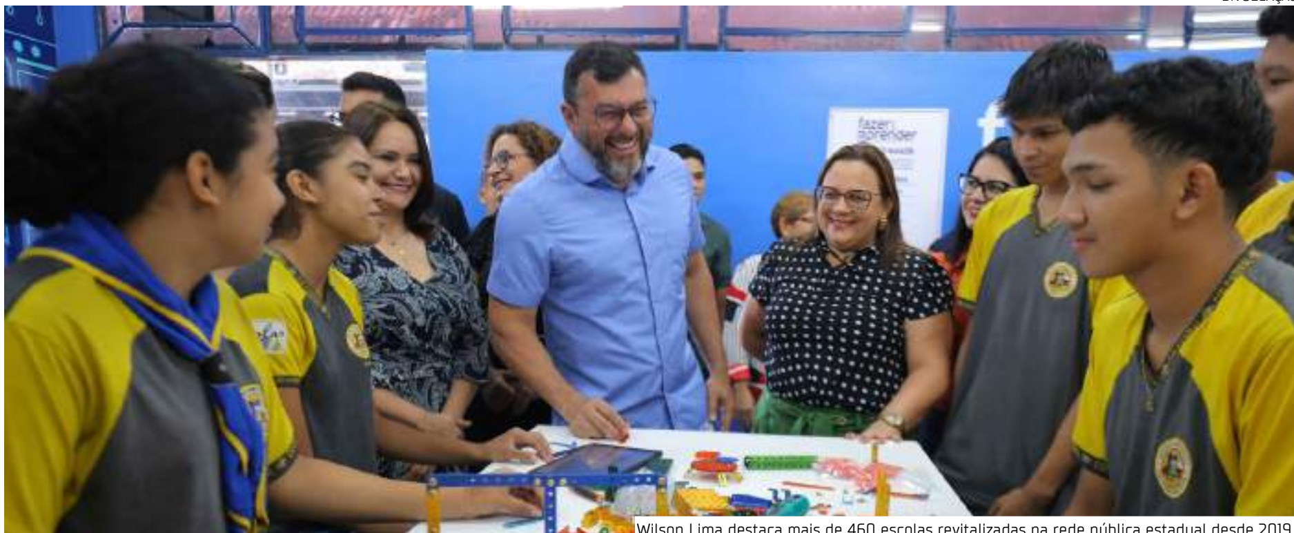
Wilson Lima destaca mais de 460 escolas revitalizadas na rede pública estadual desde 2019

Segundo o governador, o investimento na revitalização das 463 unidades na atual gestão soma R$ 150 milhões. Ele destacou, ainda, que educação é uma das prioridades da gestão dele e isso passa por melhorias em infraestrutura, equipamentos e materiais que sejam aliados no proces-