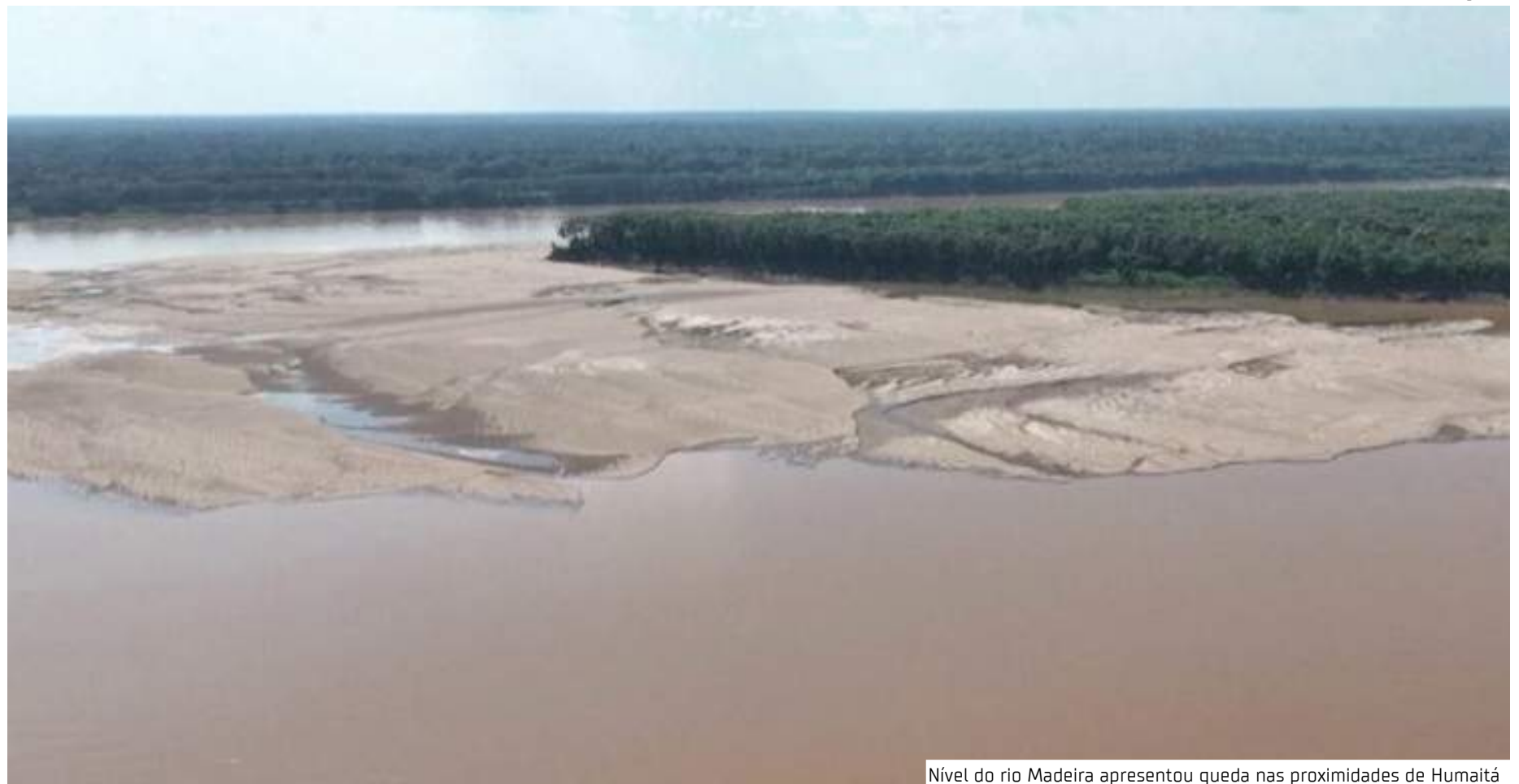
Nível do rio Madeira apresentou queda nas proximidades de Humaitá