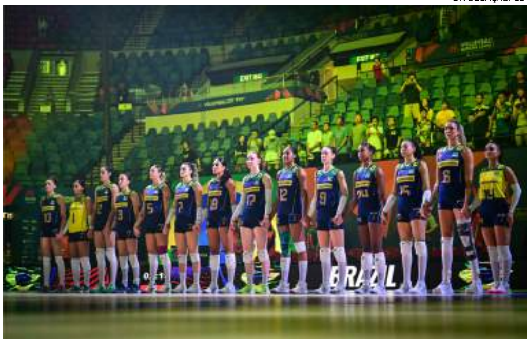
Seleção venceu a Polônia e o Japão recentemente na fase classificatória da Liga das Nações