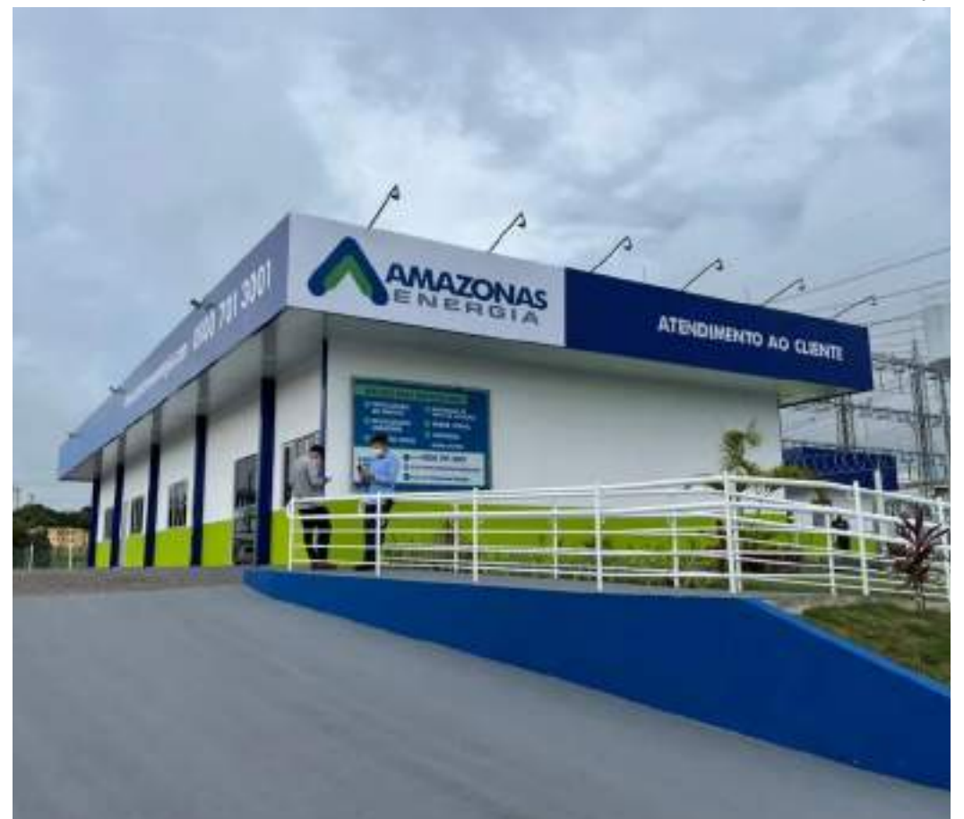
Amazonas Energia é a responsável pela distribuição de energia no Estado

Segundo Silveira, outros grupos também estavam estudando a Amazonas Energia e as térmicas da Eletrobras, como a Equatorial Energia e o banco BTG. "A transação privada pouco nos interessa com quem foi".