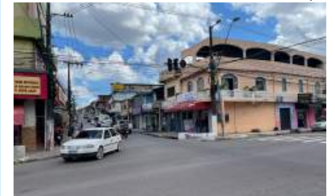
Foi o segundo furto de cabos em menos de dois dias