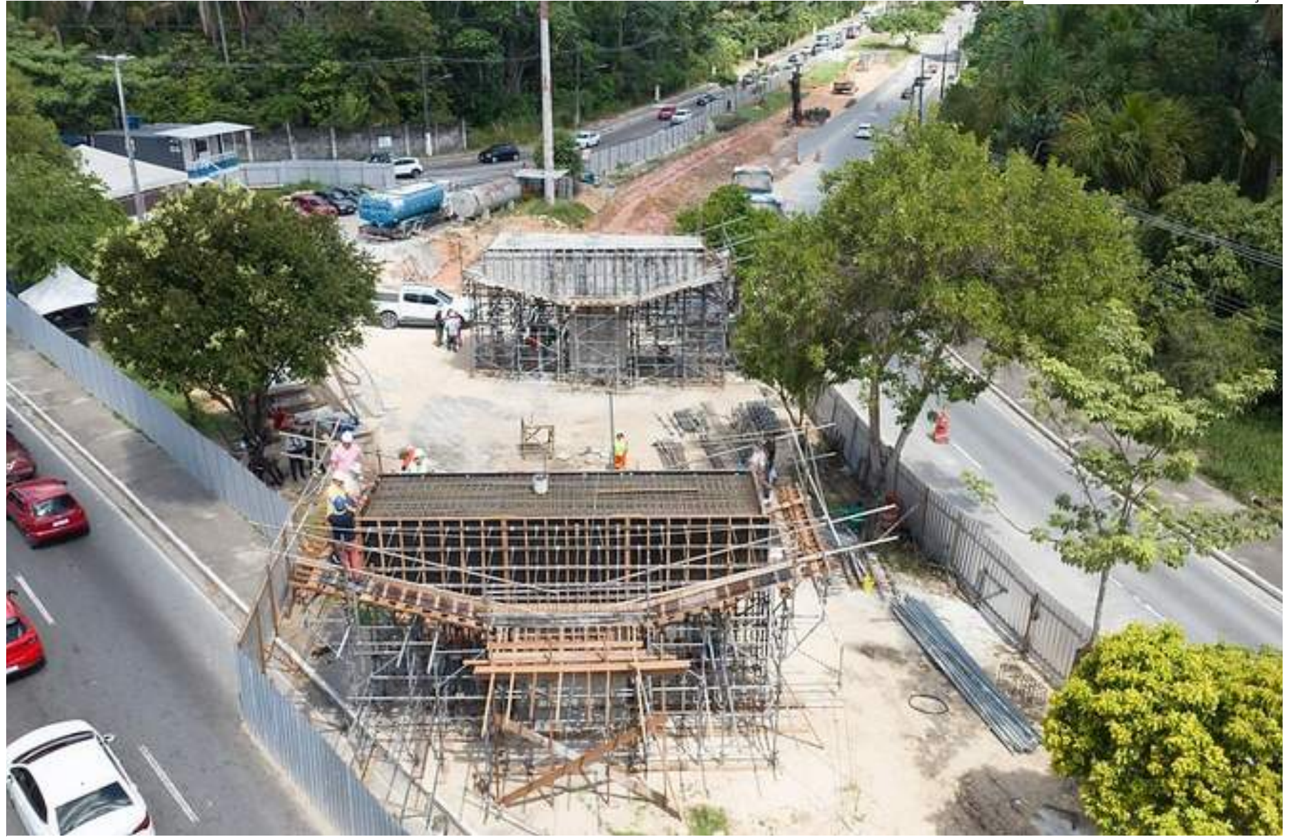
Dos seis pilares que vão dar sustentação em pontos estratégicos do viaduto, quatro blocos foram concretados

O secretário explicou que, embora grandes projetos envolvam complexidade técnica, a gestão tem se empenhado em antecipar o cronograma. "Qualidade técnica a gente tem. É por isso que a gestão se garante em trabalhar de forma célere, até porque, neste trecho, há muitos anos, os condutores enfrentam retenção