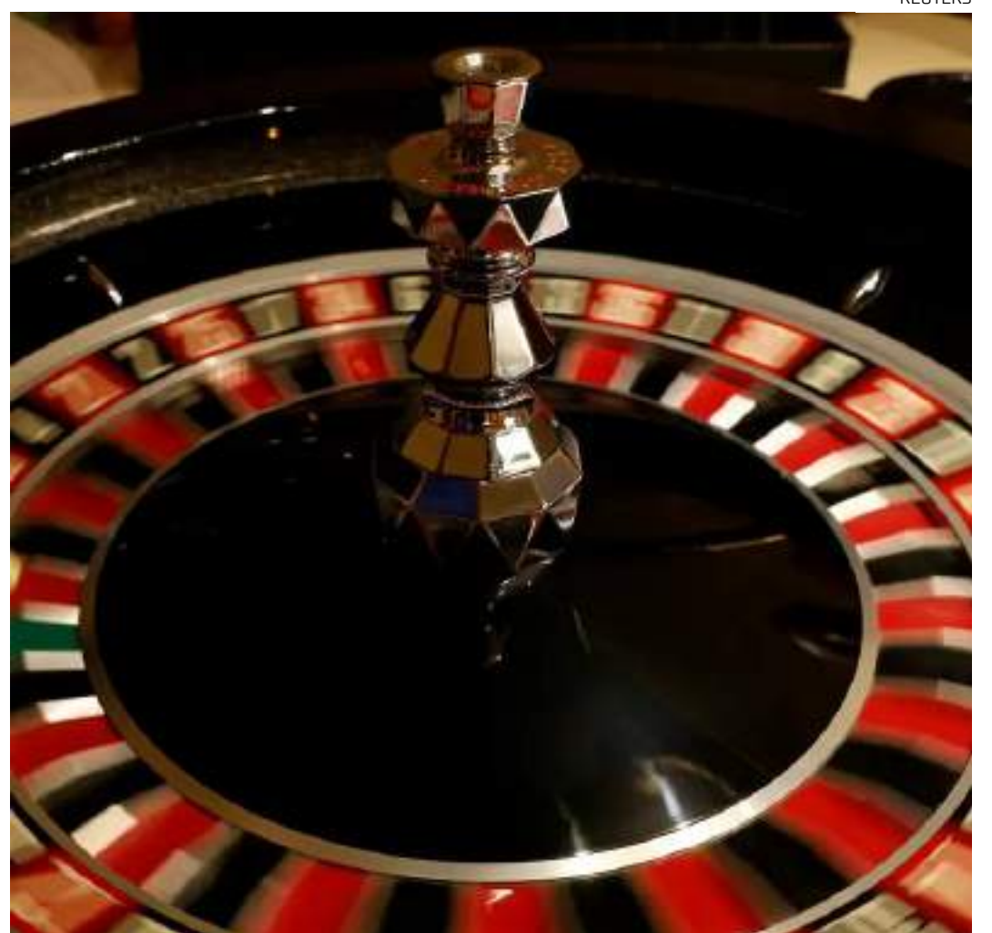
Exploração de jogos de azar no Brasil é proibida desde 1946

Segundo o relator do projeto, senador Irajá (PSD-TO), a estimativa é que os cassinos podem gerar 700 mil empregos diretos e 600 mil indiretos, além de incrementar o turismo.