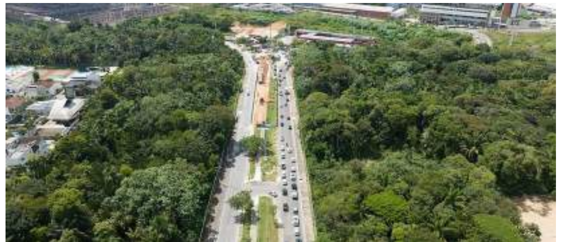
Condutor sairá ao lado do posto de gasolina Equador, na avenida Governador José Lindoso

Pelo projeto, quem vier pela rua Rio Preto vai seguir em uma curva à esquerda acima da área de mata verde. O condutor sairá ao lado do posto de gasolina Equador, na avenida Governador José Lindoso, sentido bairro.