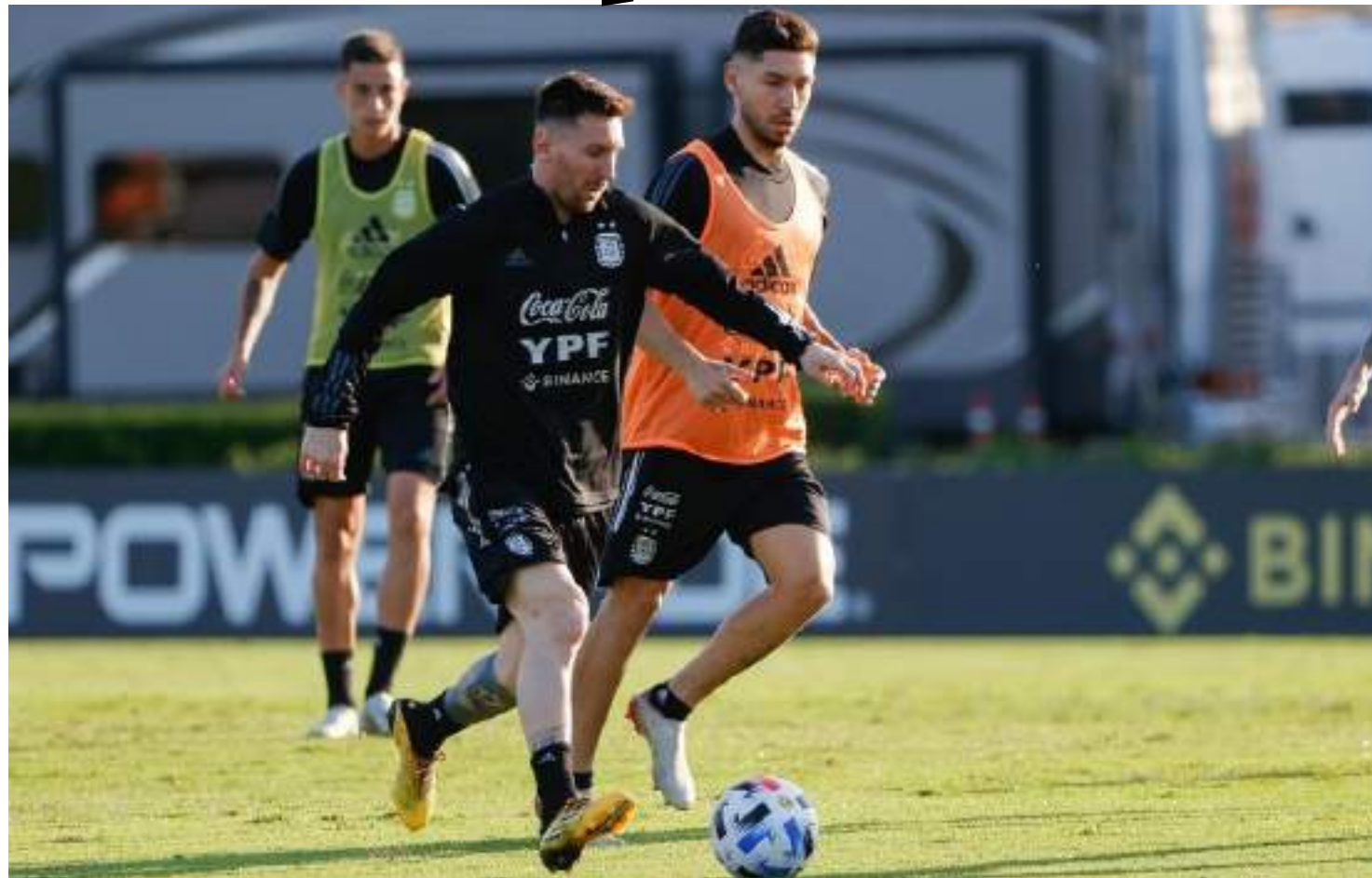
Equipe liderada por Lionel Messi chega à Copa América nos Estados Unidos com uma série de 20 jogos sem perder

Além de atuais campeões do mundo, após vencerem a França nos pênaltis, no Catar, os argentinos também detêm o título da última edição da Copa América, em 2021. Naquele ano, os 'hermanos' venceram a Seleção Brasileira em pleno Maracanã, por 1 a 0, com gol de Di María. A conquista marcou o primeiro título de Messi vestindo a camisa alviceleste.