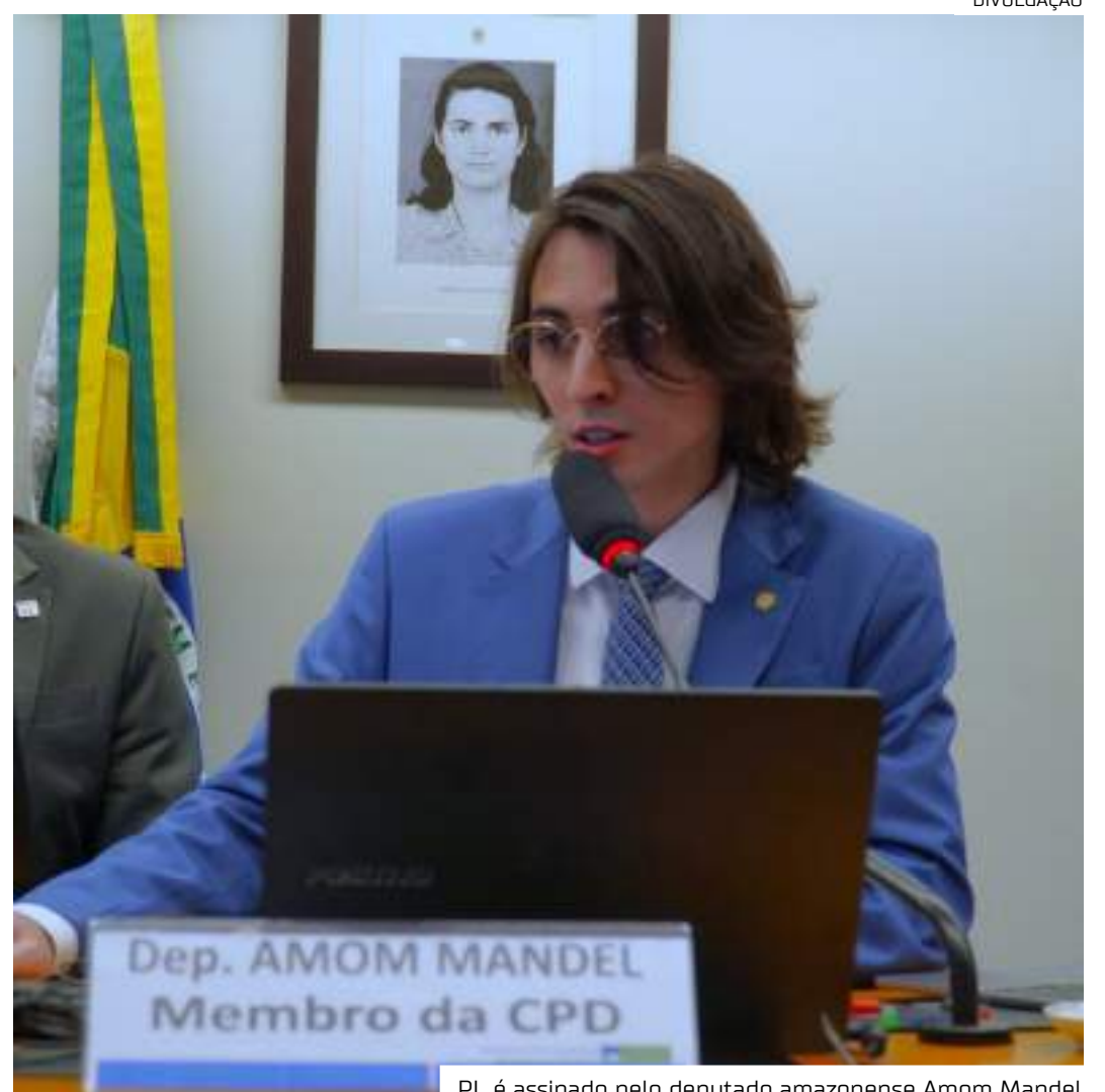
PL é assinado pelo deputado amazonense Amom Mandel

O texto ainda torna mais rígidas as normas para interrupções de forma unilateral dos planos de saúde coletivos. Isso só poderá ocorrer se houver fraudes ou inadimplência superior a 60 dias consecutivos, ou após 12 meses da data da assinatura, por meio de justificativa submetida à Agência Nacio-