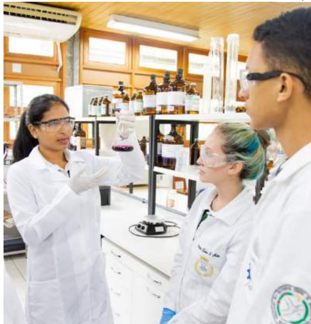
Estado manteve o 1º lugar na formação de recursos humanos altamente qualificados

No total, foram 1.049 cotas de bolsas concedidas pela Fapeam, além de auxílio-financeiro, para cinco instituições de ensino e pesquisa do Amazonas, por meio do Posgrad. Desse número, 739 em nível de mestrado e 310 para doutorado. Já o Posgfe apoiou 20 projetos distribuídos em DR e MS.