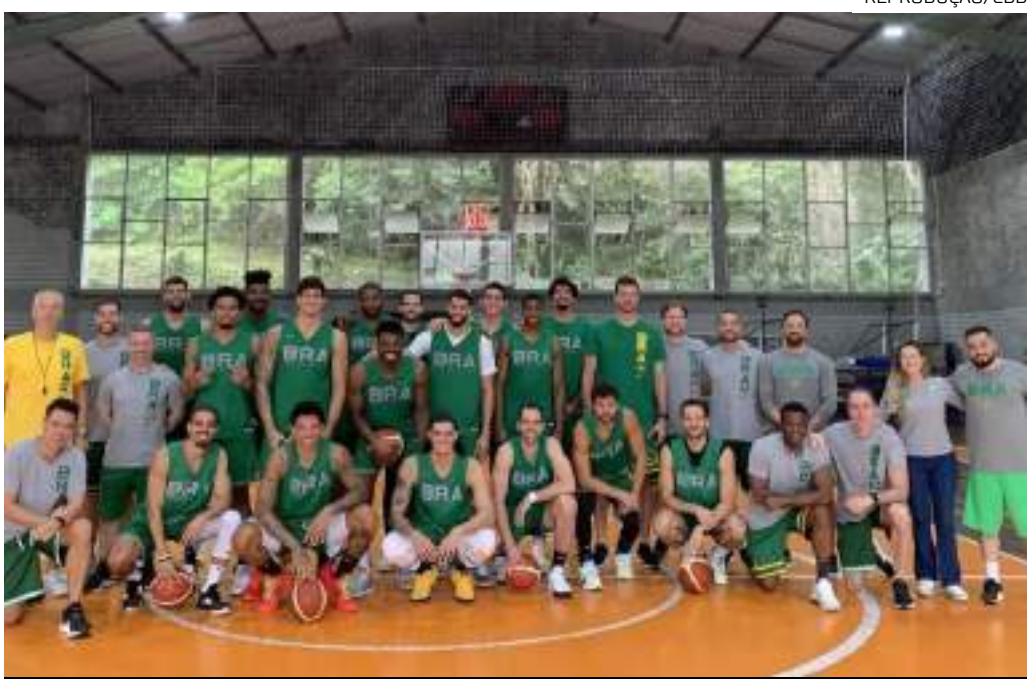
Time composto por 14 atletas realiza três amistosos antes da disputa por uma vaga em Paris 2024