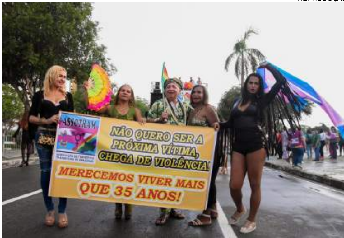
Assotram atua na preservação dos direitos humanos e inserção da pessoa assistida no mercado de trabalho

Para a presidente da Associação de Travestis, Transexuais e Transgê-