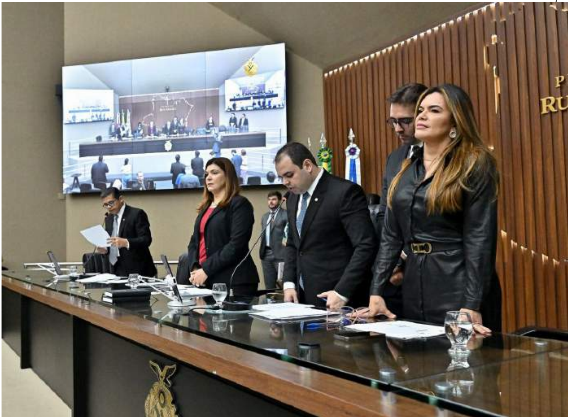
Texto foi aprovado com cinco emendas coletivas apresentadas pelos deputados

A LDO estabelece as metas e prioridades da administração pública estadual e orienta a elaboração da