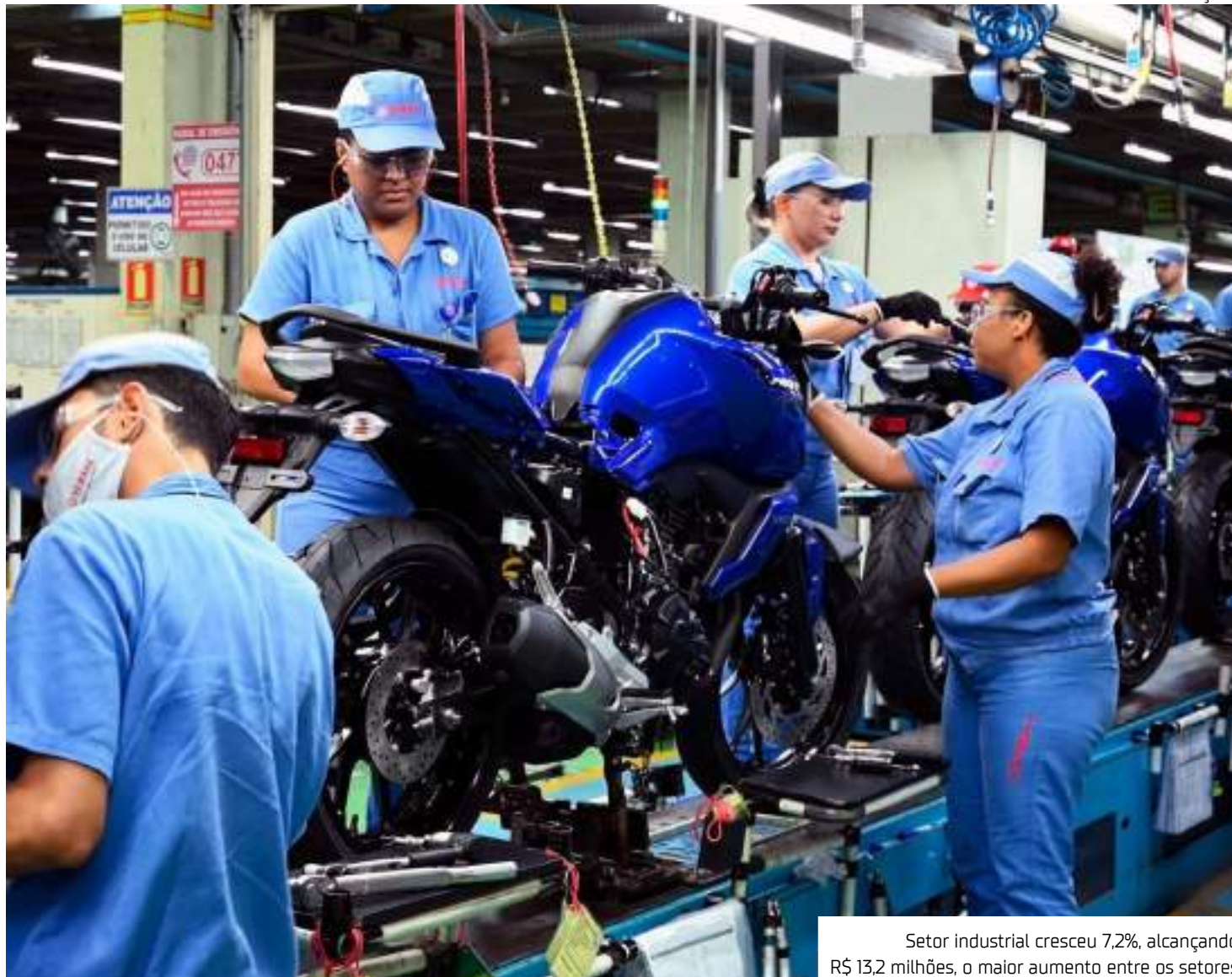
Setor industrial cresceu 7,2%, alcançando R$ 13,2 milhões, o maior aumento entre os setores

"Isso mostra que nossa economia continua crescendo, apesar da grande