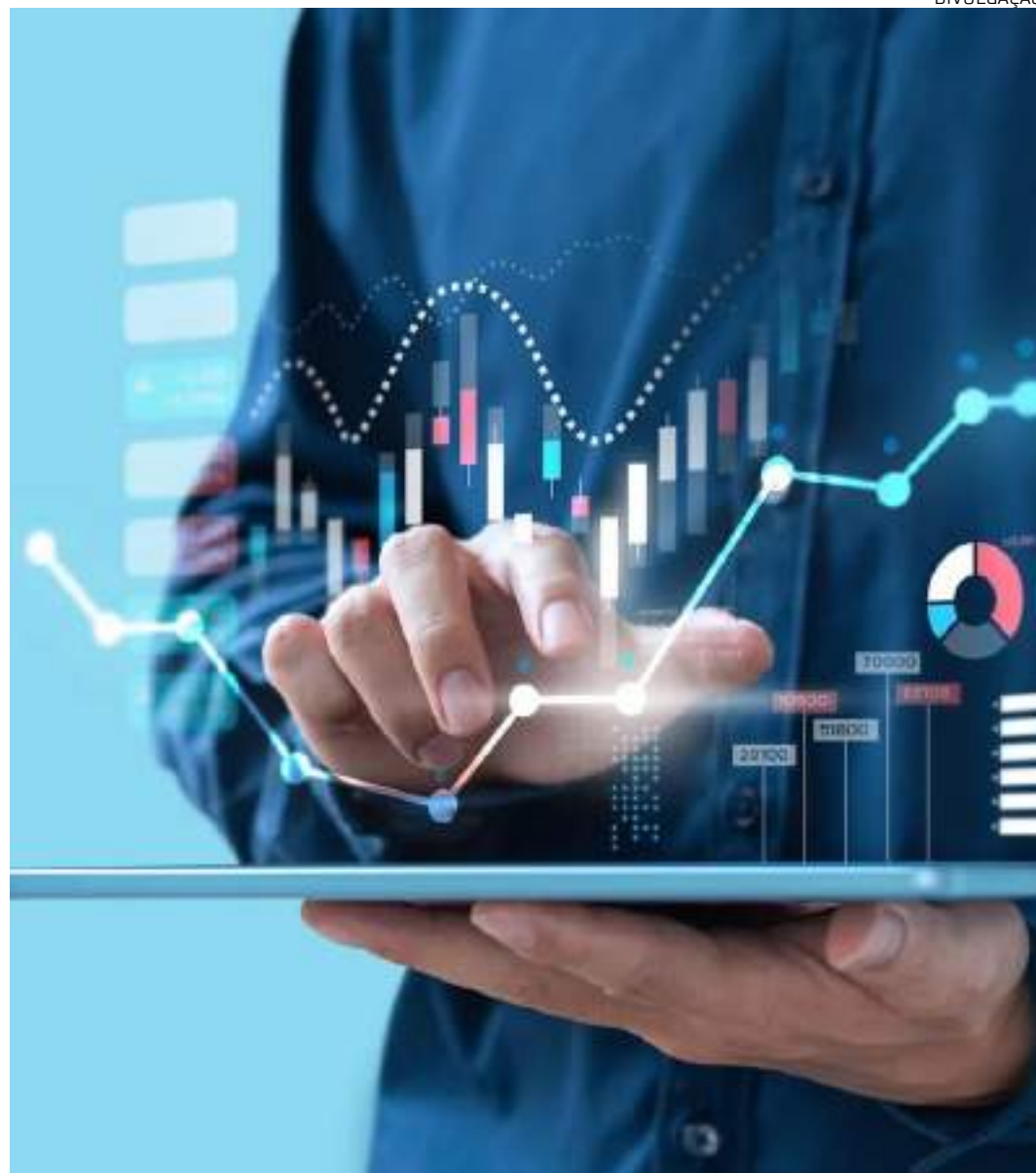
Líderes de instituições financeiras investem no uso da inteligência artificial