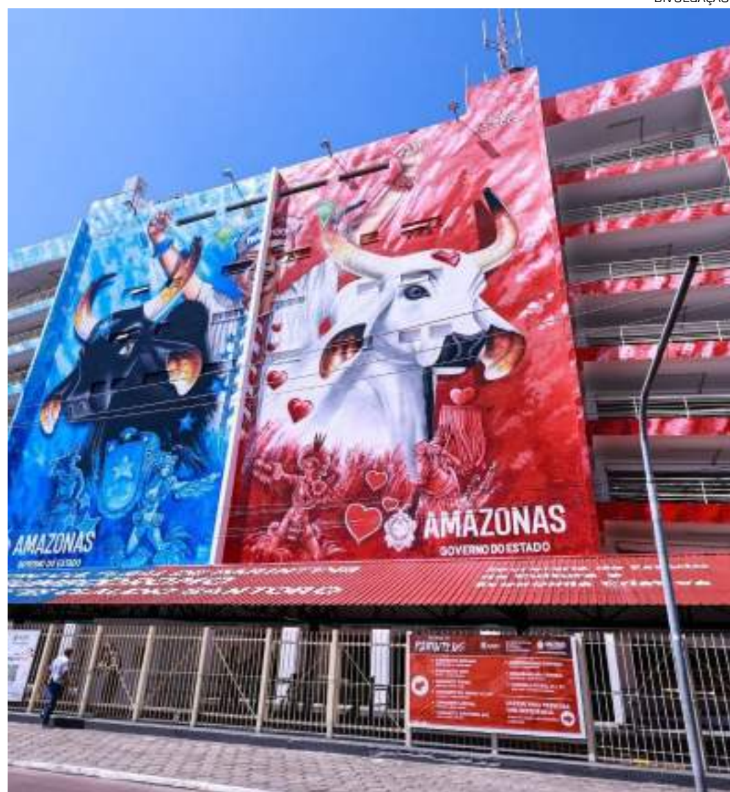
Iniciativa segue as diretrizes da portaria que regulamenta vigilância em saúde para eventos de massa

Atendimento: Em caso de dúvidas, buscar informações com equipes volantes da vigilância em saúde ou nos serviços de saúde locais. Com essas medidas, a FVS-RCP busca incentivar que o Festival de Parintins, além de um grande evento cultural, seja um ambiente seguro e saudável para todos os participantes sem causar impacto na saúde coletiva e individual. Apesar disso, postos de saúde estarão à disposição de todos no dia do Festival.