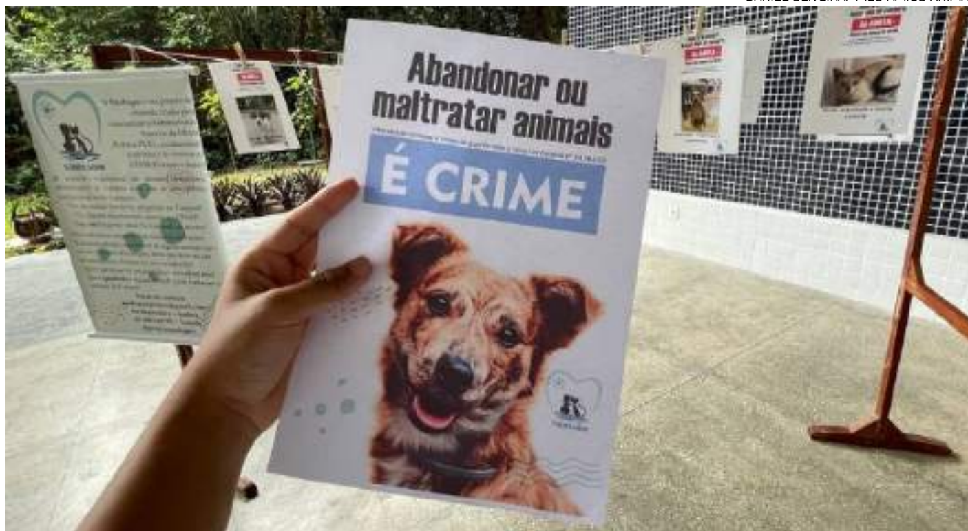
Universidade Federal do Amazonas apresenta aumento no número de abandono de animais

De acordo com o PL, a realização dos abrigos tem como objetivos principais oferecer moradia temporária aos animais, garantindo a eles alimentação, água, cuidados