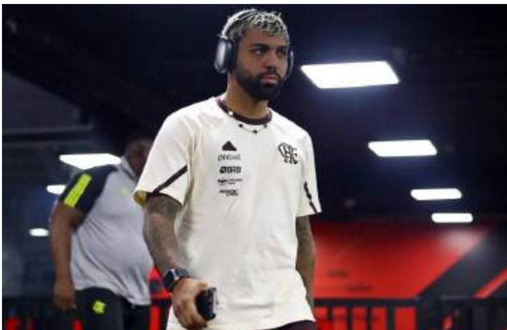
Atacante tem contrato com o Rubro-Negro até o fim do ano e pode assinar pré-contrato em julho