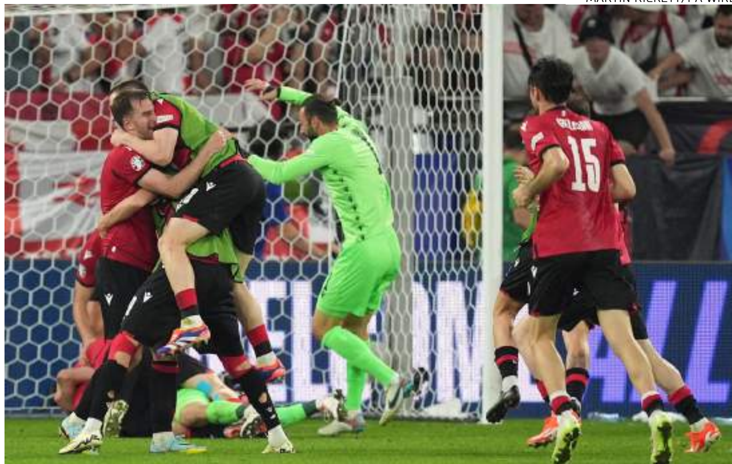
A Geórgia venceu Portugal por 2 a 0 e foi a última classificada para as oitavas de final da Eurocopa

No Grupo A, Alemanha (1º) e Suíça (2º) avançaram sem grandes sustos. Já no Grupo B, a invicta Espanha passou em primeiro, enquanto a Itália ficou com o segundo lugar, deixando a Croácia e a Albânia do