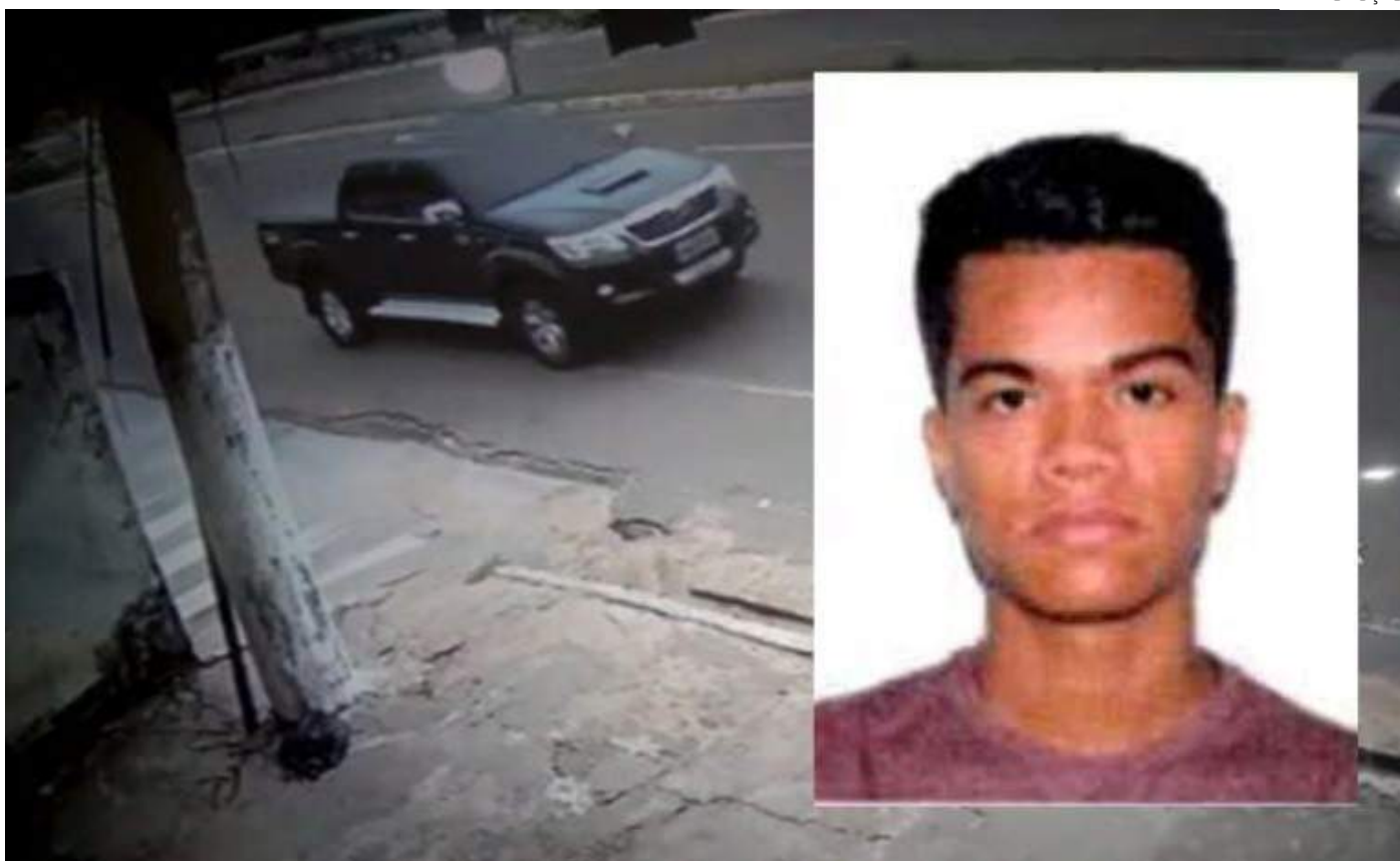
Pedido foi feito dois dias após o acidente, mas ficou travado na Justiça do Amazonas por um ano e meio