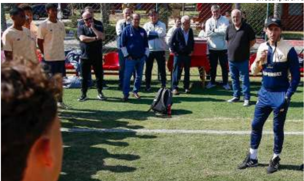
Técnico Zubeldía vem de duas derrotas consecutivas e viu aumentar os questionamentos