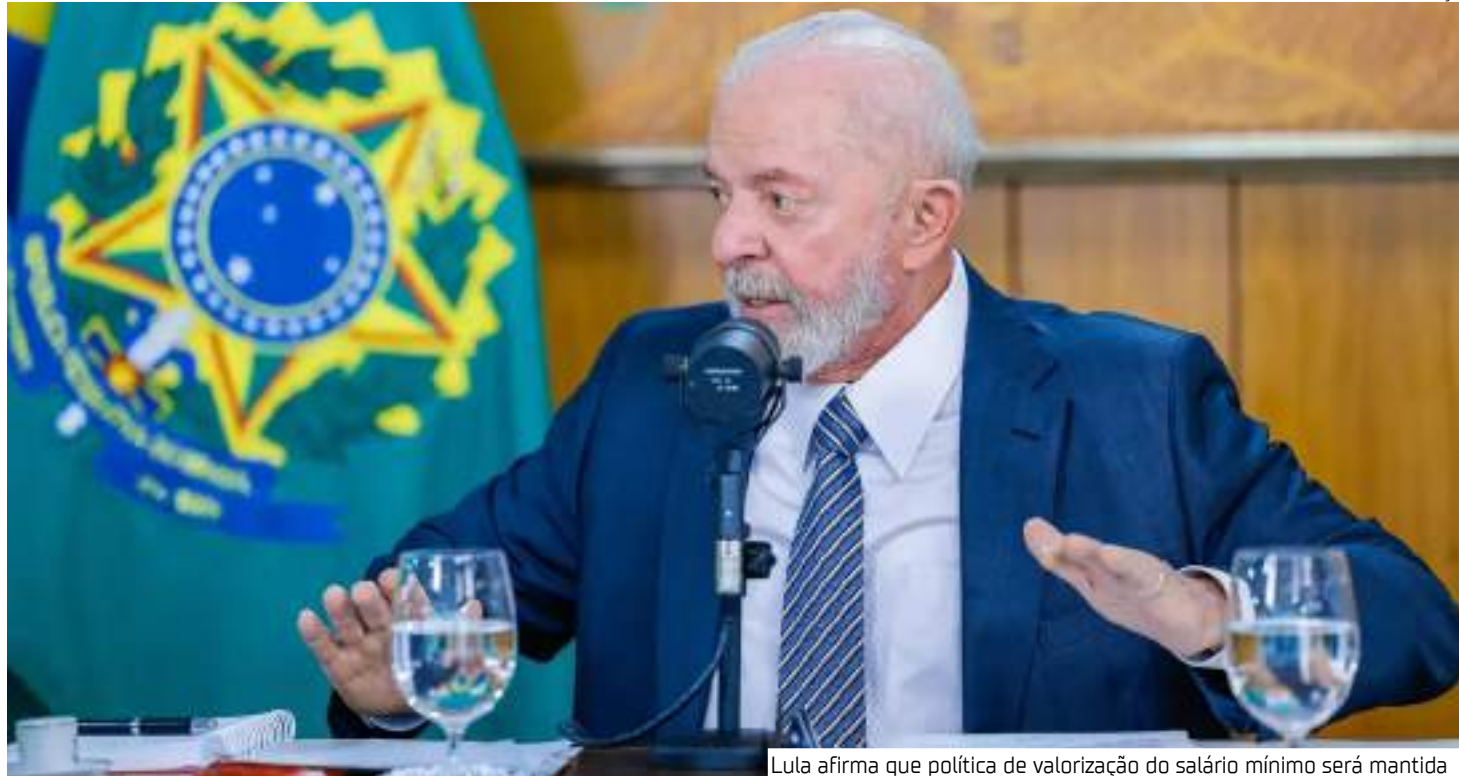
Lula afirma que política de valorização do salário mínimo será mantida

"Preciso garantir que todas as pessoas tenham condições de viver dignamente. Por isso, nós temos que tentar repartir o pão de cada dia em igualdade de condições. Você acha que eu quero que empresário dê prejuízo? Eu não sou doido! Porque, se ele der prejuízo, eu vou perder meu emprego. Eu quero que o empresário tenha lucro, mas eu quero que ele tenha a cabeça, como teve o Henry Ford, quando disse: 'eu quero que meus trabalhadores ganhem bem para eles