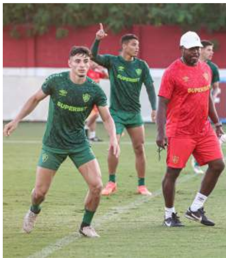
Marcão preparou o time com mudanças para o desafio contra o Rubro-Negro, que vive melhor momento com o técnico Thiago Carpinini

O Fluminense entra em campo em um momento turbulento neste que é o pior início de campanha do clube no Brasileirão, na era dos pontos corridos. Após a dura derrota para o Flamengo no último domingo (23) a situação só piorou. Com a saída de Fernando Diniz, este será o primeiro