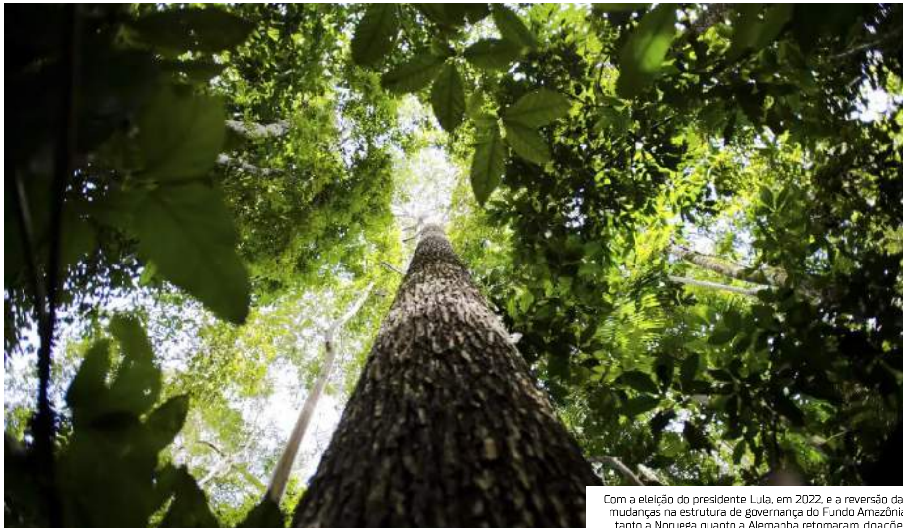
Com a eleição do presidente Lula, em 2022, e a reversão das mudanças na estrutura de governança do Fundo Amazônia, tanto a Noruega quanto a Alemanha retomaram doações

O Fundo Amazônia tem como objetivo viabilizar o apoio nacional e internacional a projetos para a conservação e o uso sustentável das florestas na Amazônia Legal, região que engloba nove estados: Acre, Amapá, Amazonas, Mato Grosso, Pará, Rondônia, Roraima e Tocantins e parte do Maranhão. Ele foi criado em 2008 por meio do Decreto 6.527, assinado pelo presidente Luiz Inácio Lula da Silva, na época no segundo mandato. O BNDES é responsável pela