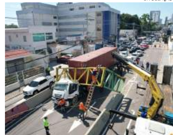
Motorista ficou preso nas ferragens da estrutura