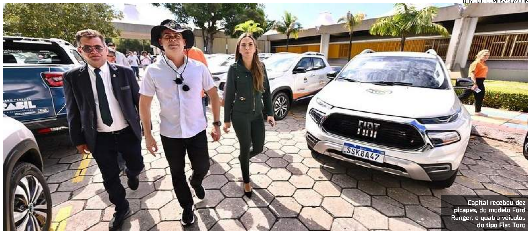
Capital recebeu dez picapes, do modelo Ford Ranger, e quatro veículos do tipo Fiat Toro

O prefeito agradeceu a parceria com a bancada federal do Amazonas, principalmente do senador Eduardo Braga,