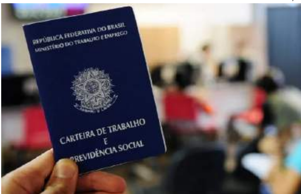
Número de brasileiros ocupados e massa salarial atingiram recordes