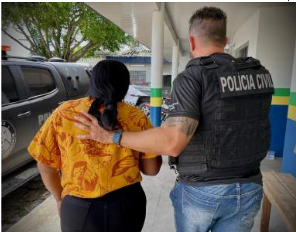
Mais de 30 vítimas registraram Boletins de Ocorrência (BOs) na delegacia de Parintins