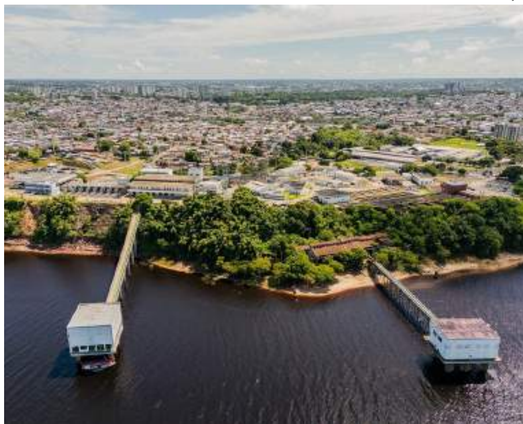
Sistema abastecido pelo Complexo precisará ser desligado para receber pacote de melhorias