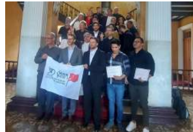
Há mais de 12 anos, os músicos não tinham representatividade no AM