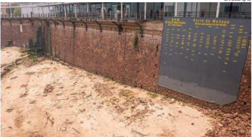
Nível do Rio Negro, em Manaus, durante a seca do ano passado