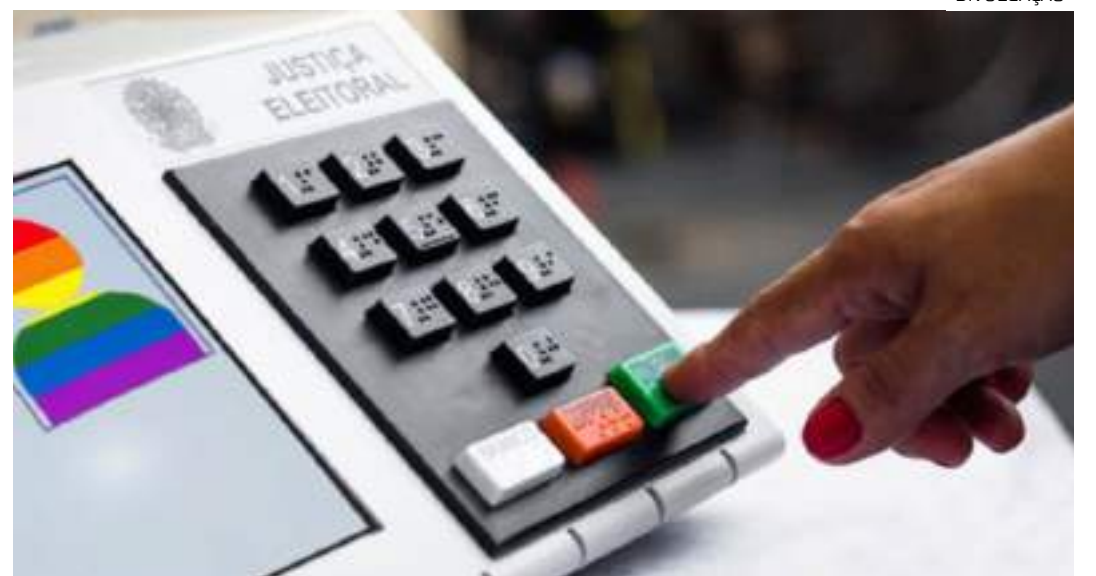
Programa Voto com Orgulho diz que candidatos aliados à causa somam 34

letim informa que 198 pessoas têm curso superior completo; 69, superior incompleto; 47, ensino médio completo; 13, ensino médio incompleto; uma, ensino fundamental completo; e cinco, ensino fundamental incompleto. Das pessoas cadastradas com curso superior, 62 têm especialização, 33, mestrado e oito, doutorado.