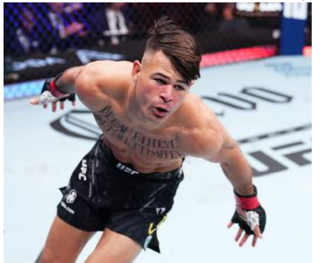
Lutador amazonense aceitou fazer a luta na categoria dos leves após o estadunidense não bater o peso