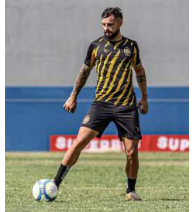
Onça treinou no Carlos Zamith, na sexta-feira (28), antes de viajar