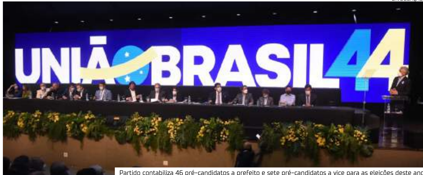
Partido contabiliza 46 pré-candidatos a prefeito e sete pré-candidatos a vice para as eleições deste ano

Segundo o artigo 95 do Estatuto do União Brasil, a campanha eleitoral para candidatos