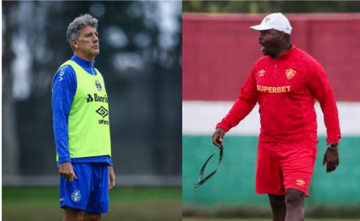
Renato Gaúcho lamentou desfalques no último duelo, contra o Atlético-GO; Marcão, por sua vez, assumiu o Flu após a saída de Fernando Diniz