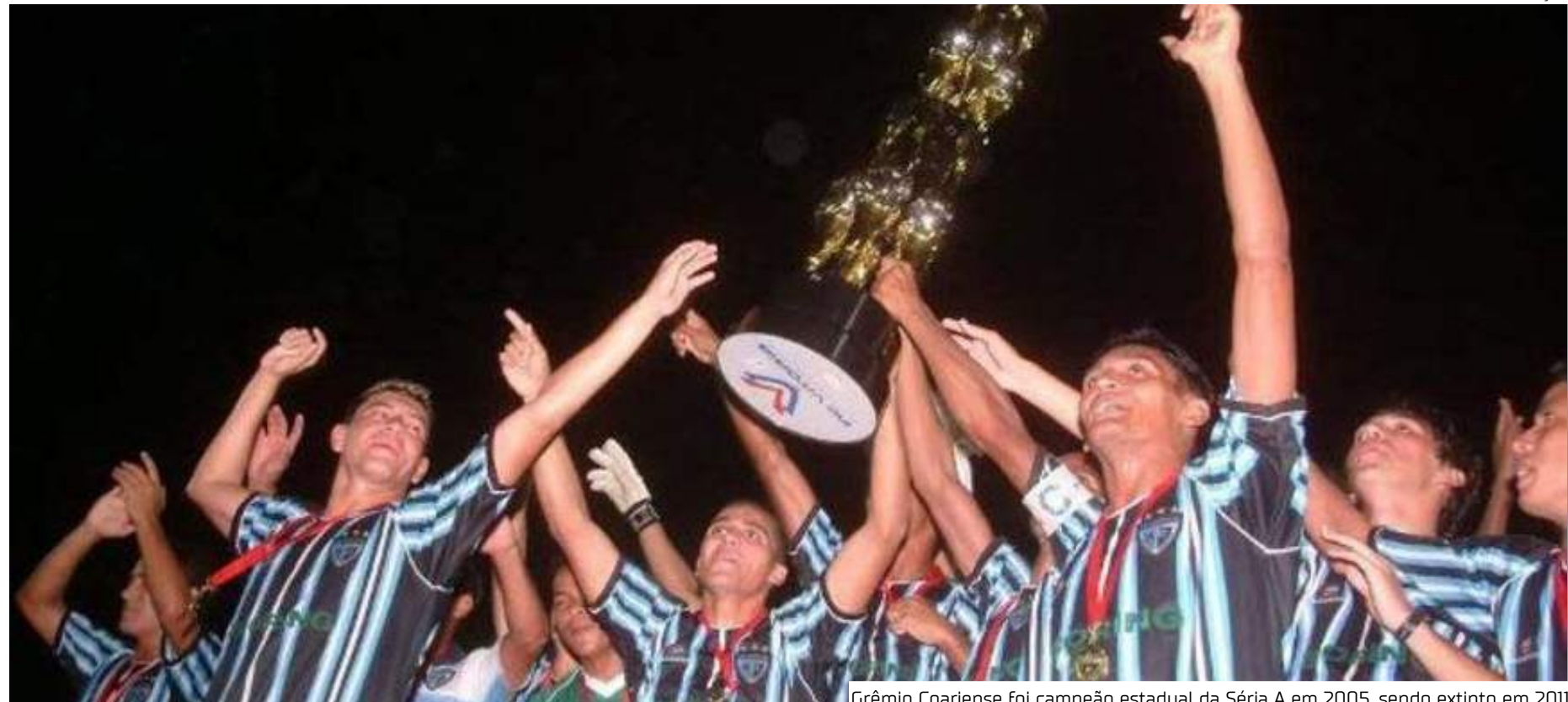
Grêmio Coariense foi campeão estadual da Série A em 2005, sendo extinto em 2011

Segundo a prefeitura, o saldo do valor já repassado pela Caixa ao município, o equivalente a R$ 1.740.145,77, permanece em uma conta-corrente do convê-