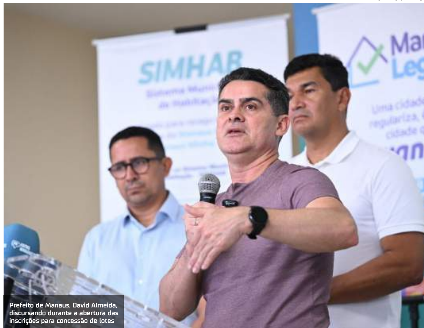
Prefeito de Manaus, David Almeida, discursando durante a abertura das inscrições para concessão de lotes

Na atual gestão, foi lançado o maior programa habitacional da história de Manaus, com meta de entregar 17 mil moradias construídas ou re-