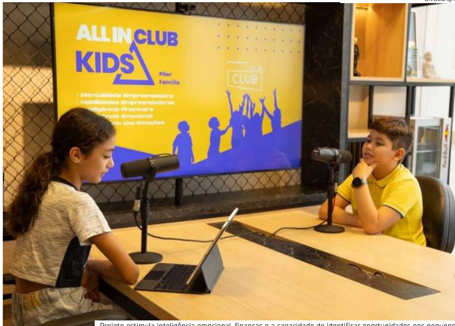
Projeto estimula inteligência emocional, finanças e a capacidade de identificar oportunidades nos pequenos

Com apoio de psicopedagoga, psicólogas e professoras de educação infantil, o “All In Club Kids” conta com uma programação dividida por faixas etárias. Destinada a crianças de cinco a nove anos, a oficina de emoções auxilia os