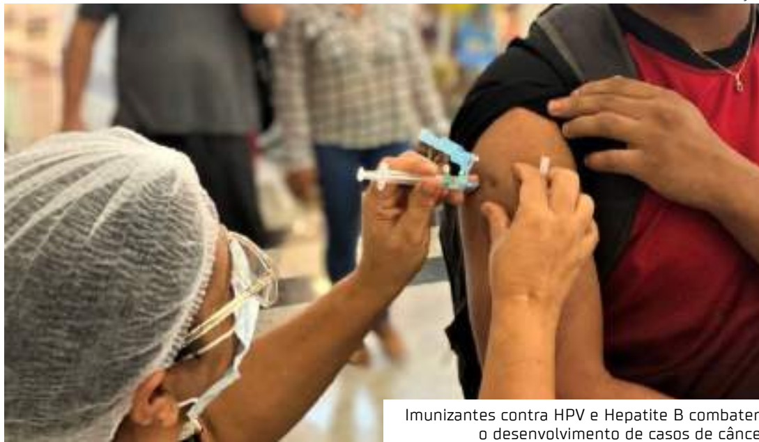
Imunizantes contra HPV e Hepatite B combatem o desenvolvimento de casos de câncer