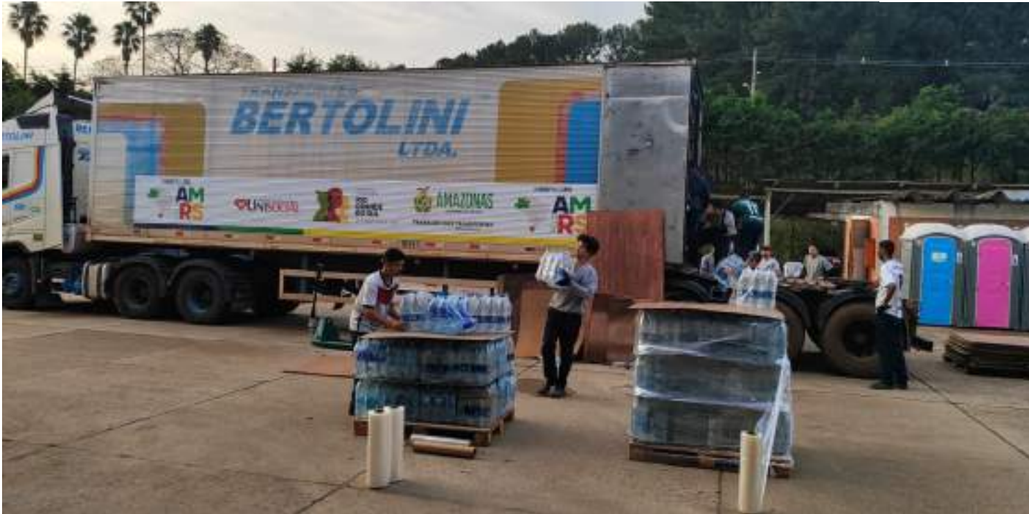
Foram arrecadadas 115 toneladas de doações, incluindo água, alimentos e insumos veterinários

Ao todo, o Governo do Amazonas arrecadou aproximadamente 115 toneladas de doações, sendo, 98 mil litros de água, 15 toneladas de alimentos e 1,4 tonelada de insumos veterinários. Além disso, sob