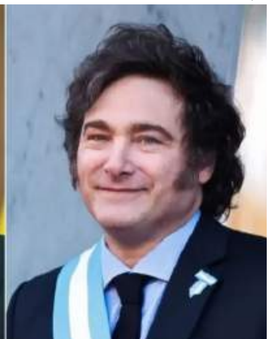
Luiz Inácio Lula da Silva (PT) e Javier Milei participarão de cúpula

são em 13 de junho dedicada ao conflito de seu país com a Rússia.