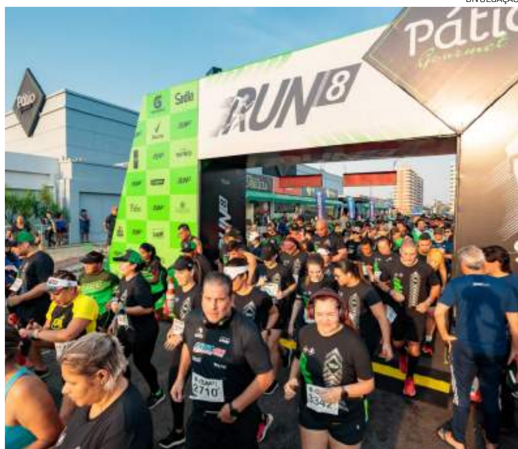
Em 2023, mais de 5 mil pessoas participaram do evento que teve percursos de 5km e 10km

Os atletas participantes receberão um kit contendo número de peito, camiseta, squeeze, boné e sacola. Todos os participantes que concluírem a prova receberão medalhas.