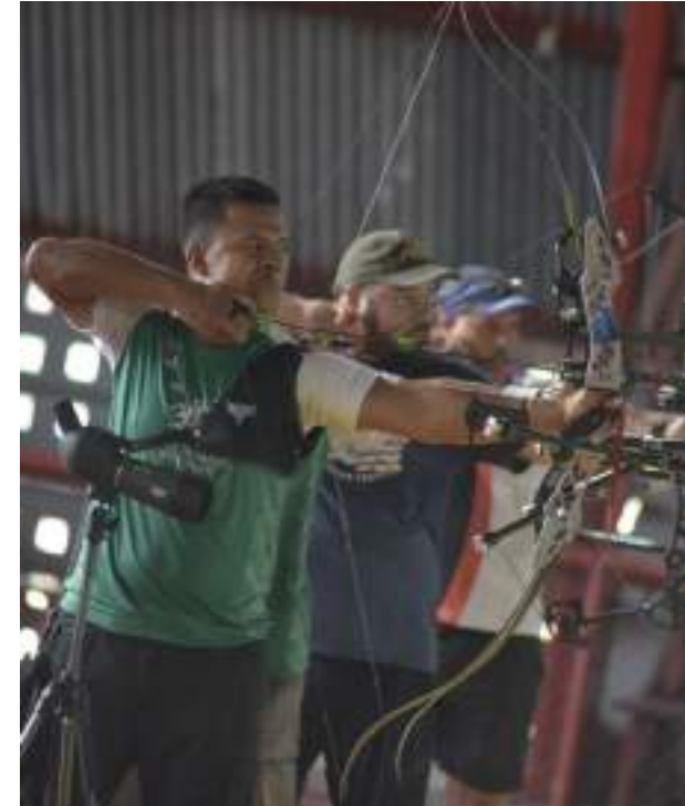
Competição visa qualificar atletas para campeonatos nacionais