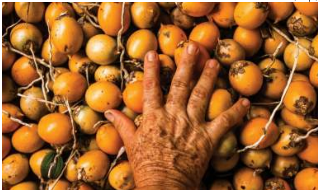
Tucumã-do-Amazonas é uma espécie de palmeira de grande importância na flora amazônica