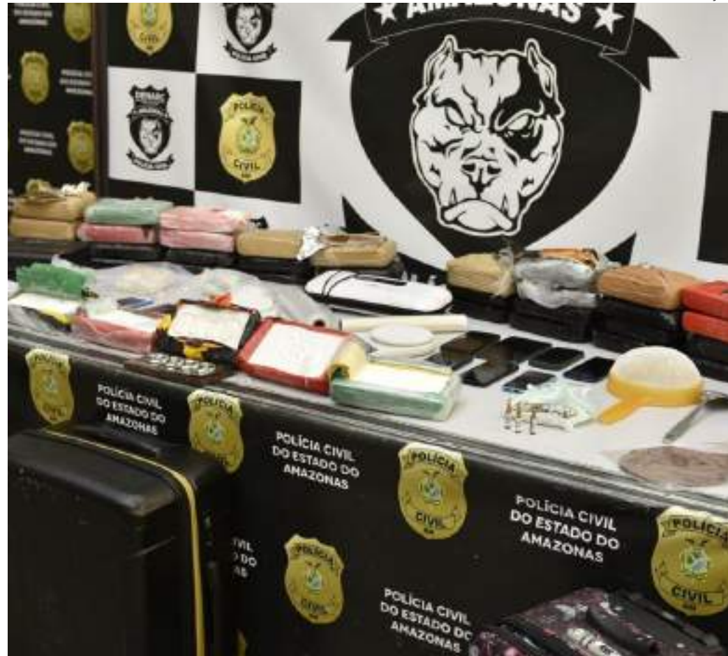
Presos facilitavam o comércio de tráfico de drogas na cidade e eram responsáveis por um laboratório

Segundo a autoridade policial, o grupo provavelmente atuava há muito tempo, pela estrutura de onde eram armazenadas as drogas. Além disso, um policial militar também fazia parte do grupo, sendo ele quem realizava o transporte dos entorpecentes. No momento da prisão, foi encontrada com ele uma quantidade de 5 quilos de drogas.