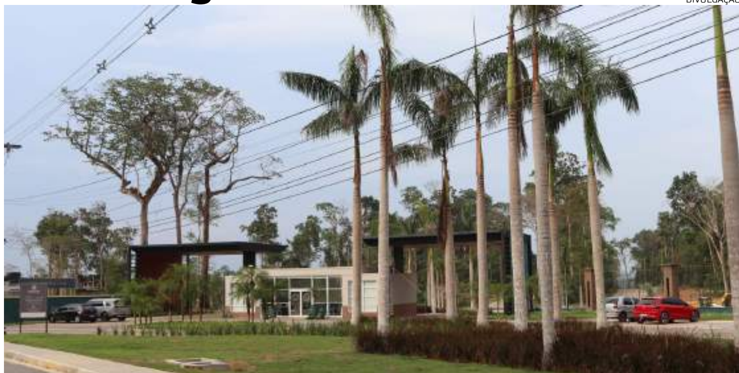
Quintas de São José do Rio Negro preserva 50% área verde na construção