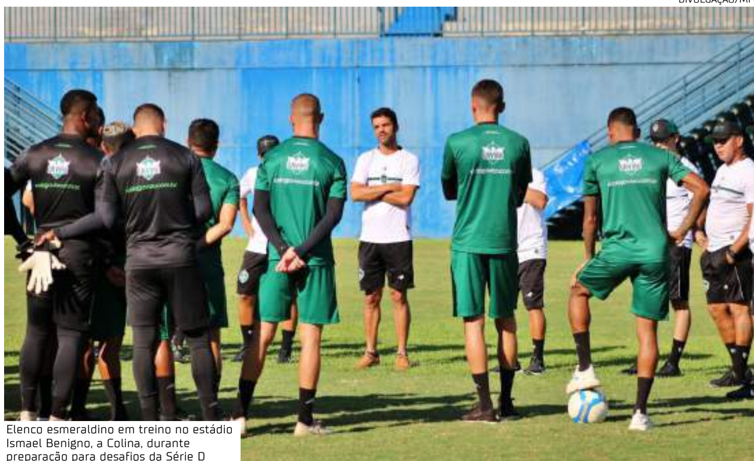
Elenco esmeraldino em treino no estádio Ismael Benigno, a Colina, durante preparação para desafios da Série D

Manaus FC ainda não venceu no estádio Ismael Benigno, a Colina, pela Série D deste ano