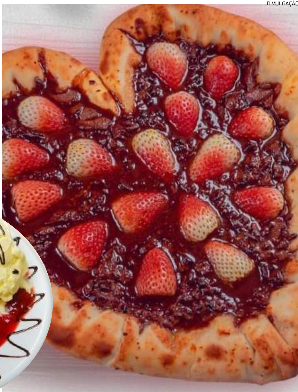
Pizza em formato de coração já faz parte do calendário comemorativo do Loppiano Pizza