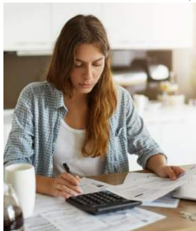
Maioria dos contribuintes com direito à restituição receberão até R$ 1.000

Pelo menos 44% dos entrevistados consideram que o IR "desempenha papel significativo na distribuição de renda do país", mas 40% "discordam do processo de declaração e arrecadação do Imposto de Renda"