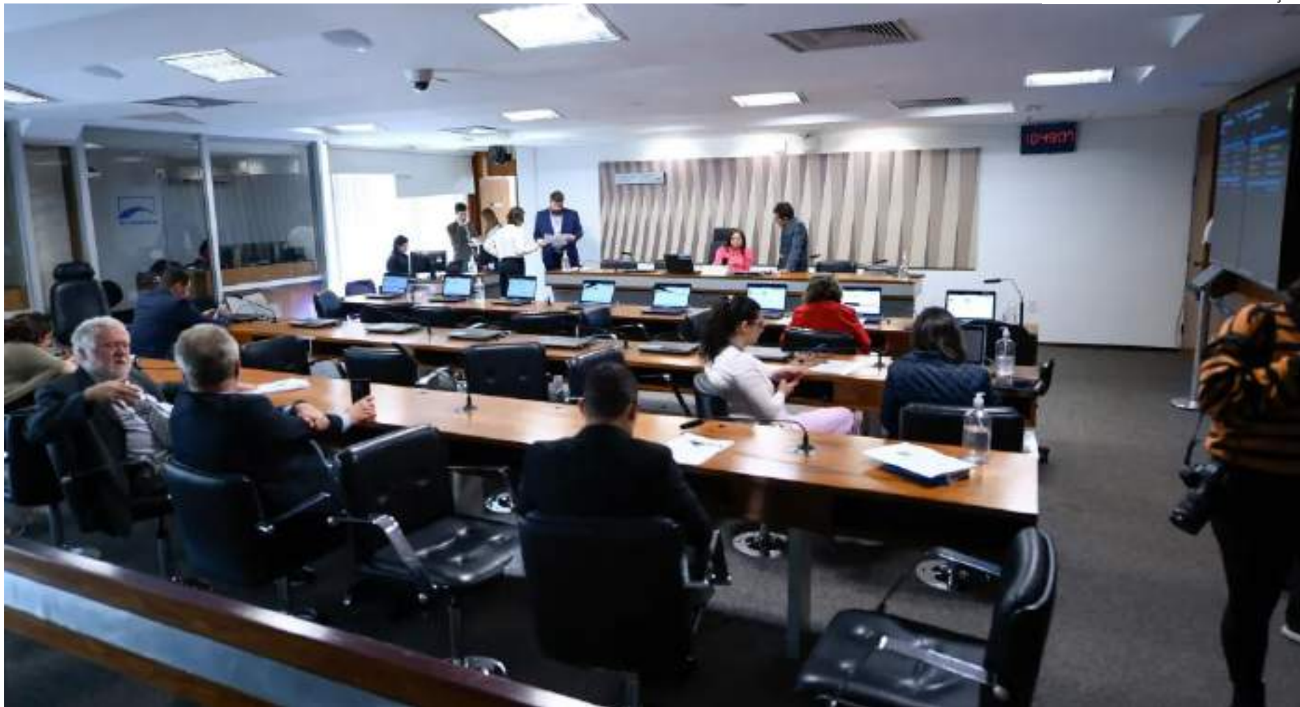
Comissão do Senado analisou a questão nesta quinta-feira (6)

"Com o aumento da polarização política no Brasil, observamos o surgimento de discursos de ódio, violentos e defendem o retorno da ditadura militar no país, assim como celebram figuras ligadas a atos de tortura durante aquele período sombrio da nação", diz o relatório de Teresa Leitão. "Essas manifestações, indubitavelmente, acabam estimulando o cres-