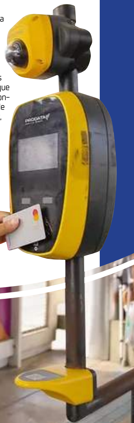
Usuários podem pagar a passagem de ônibus com cartões de crédito ou débito

A recarga do cartão PassaFácil pode ser realizada em mais de 150 postos espalhados pela cidade, além dos 10 postos do Sindicato das Empresas de Transportes de Passageiros do Amazonas (Sinetrans).