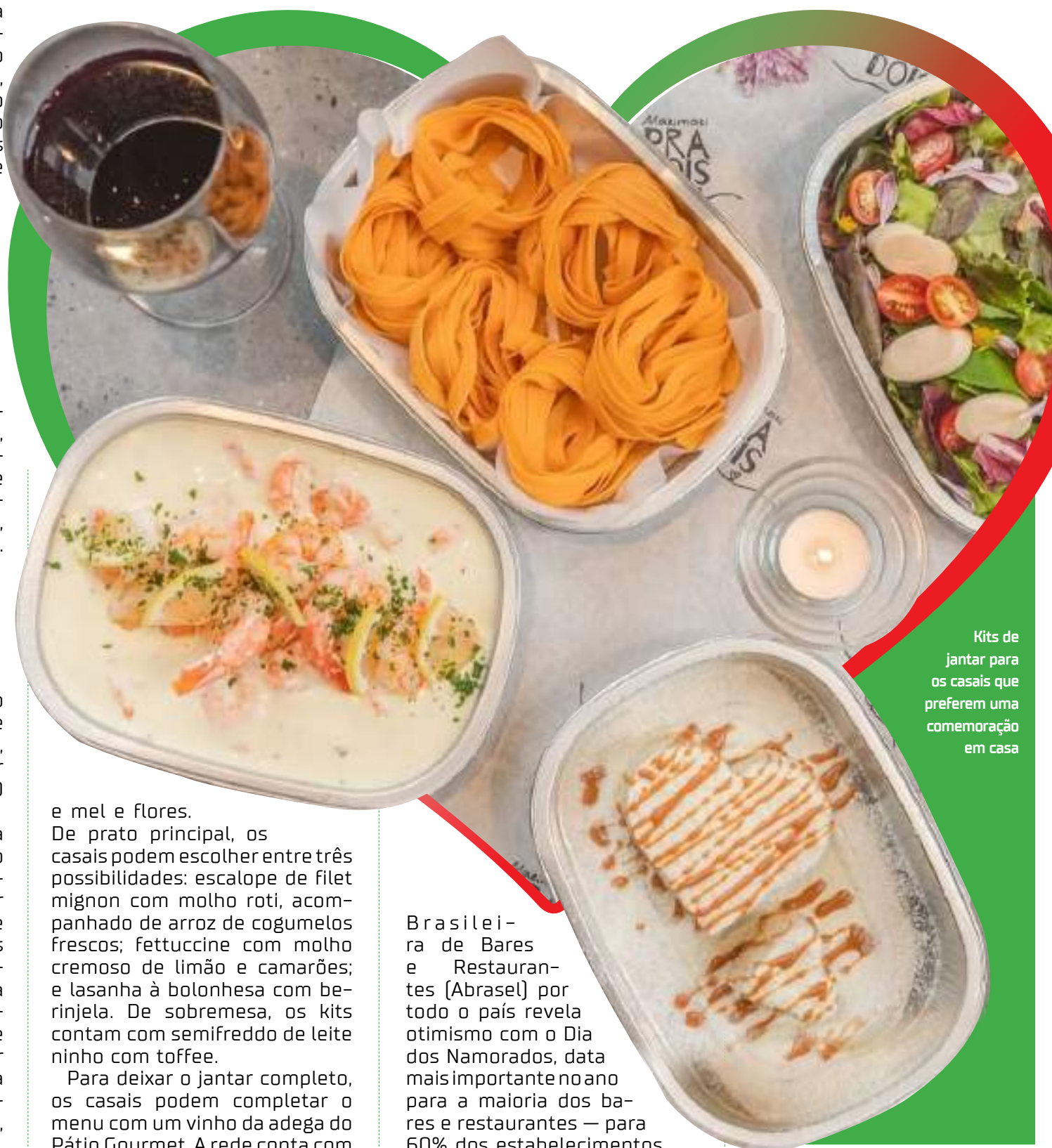
Kits de jantar para os casais que preferem uma comemoração em casa

Os pedidos dos kits podem ser feitos até terça-feira (11), pelo número (92) 98411-8674. Em todas as opções, a entrada é com mix de folhas com tomatinho grape, palmito, cebola roxa, molho de mostarda