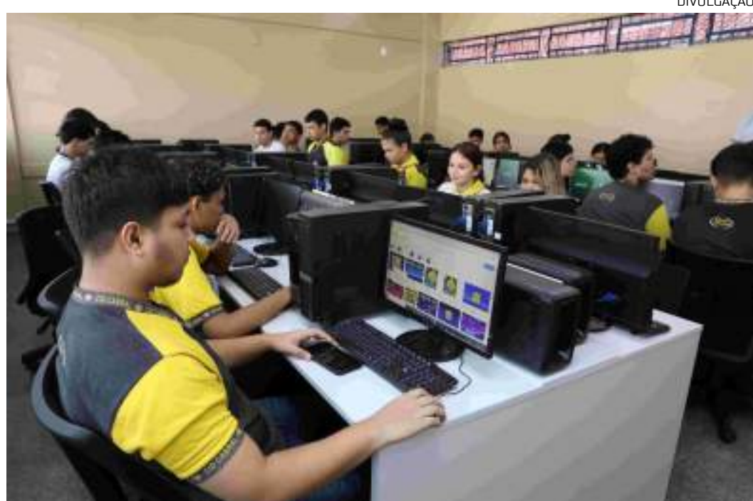
Estudantes contam com apoio da escola para realizar o processo de inscrição

Após preencher essas etapas, é preciso indicar o estado e o município onde deseja realizar as provas. Em seguida, o aluno deve escolher se deseja que as cinco questões