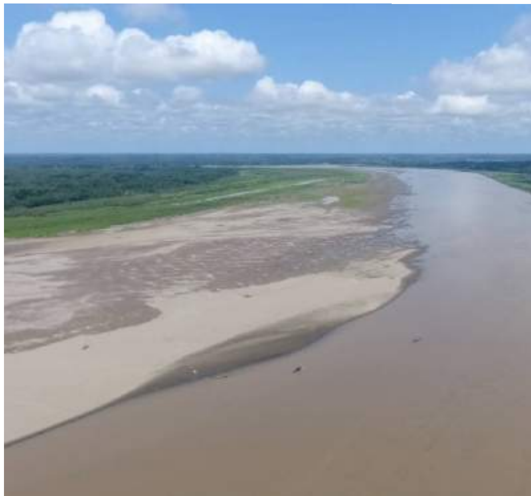
Pesquisador do Inpa destacou situação durante reunião da Superintendência de Manaus (Sureg-MA)