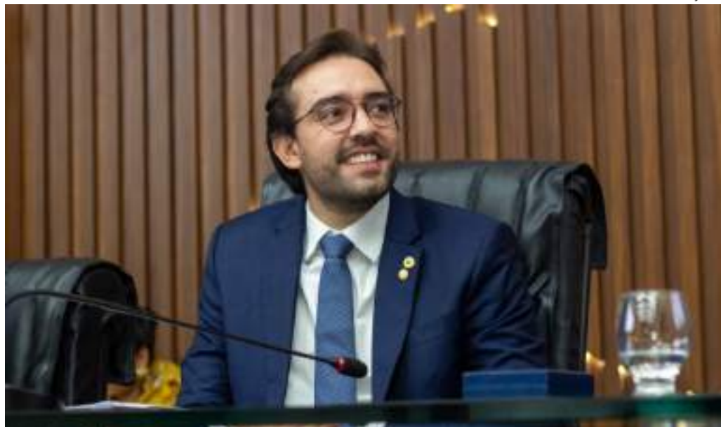
Deputado propõe ampliação na entrega de mestrado ou doutorado em caso de parto ou adoção