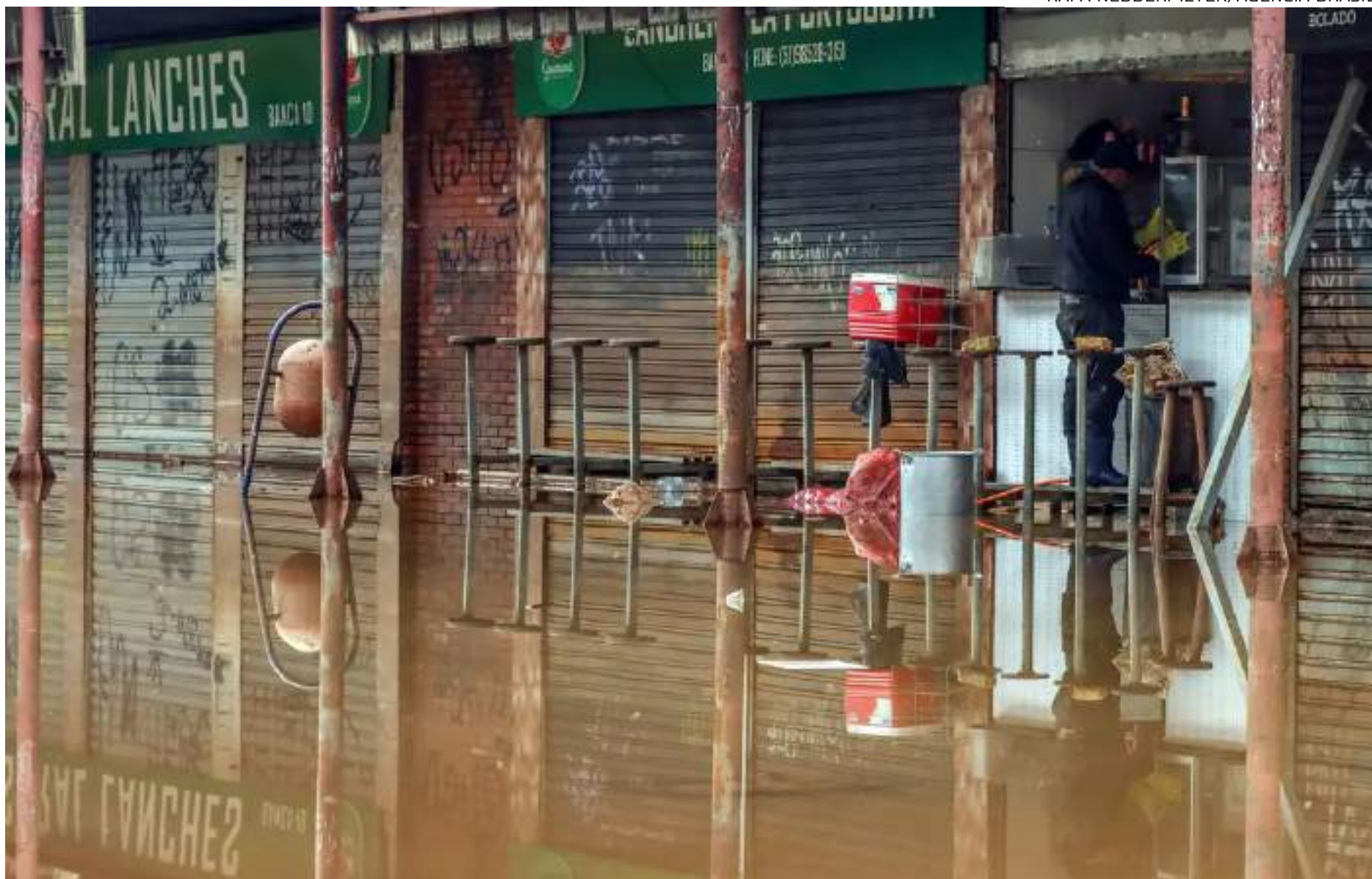
Medida abrange trabalhadores em regime de CLT, estagiários, trabalhadores domésticos e pescadores artesanais, que, juntos, somam mais de 430 mil pessoas

“Nós vamos oferecer duas parcelas de um salário mínimo a todos os trabalhadores formais do estado do Rio Grande do Sul que foram atingidos na mancha [de inundação]. Não são todos os CNPJ dos municípios em calamidade ou emergência, mas os atingidos