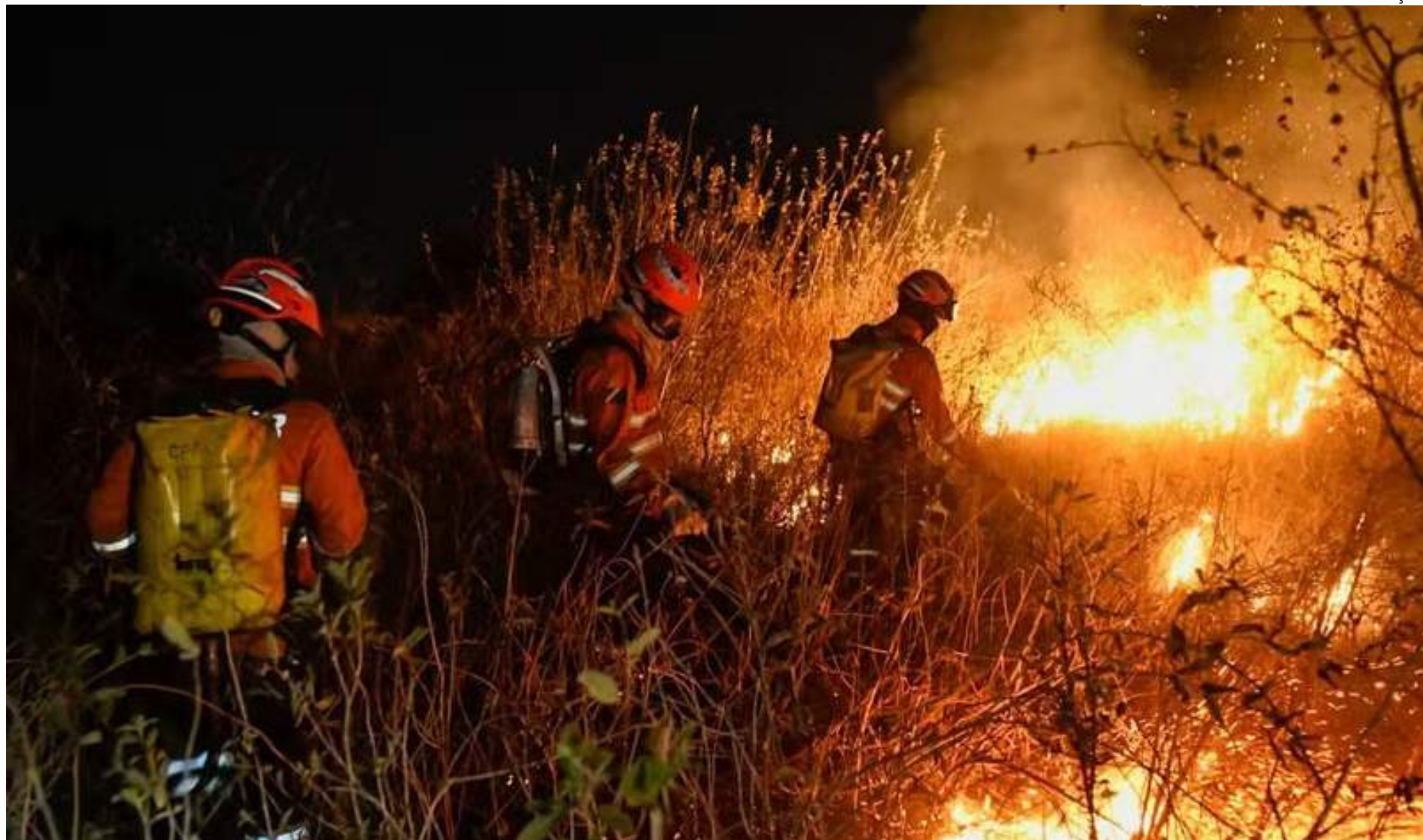
Queimadas no Pantanal avançaram cerca de 1000% no período que antecede o auge da temporada do fogo

O decreto autoriza ainda a convocação de voluntários para reforçar as ações de resposta ao desastre e a realização de campanhas de arrecadação de recursos "perante a comunidade, com o objetivo de facilitar as ações de assistência à população afetada pelo desastre, sob a coordenação da Coordenadoria Estadual de Proteção e Defesa Civil (CEPDEC/MS)".