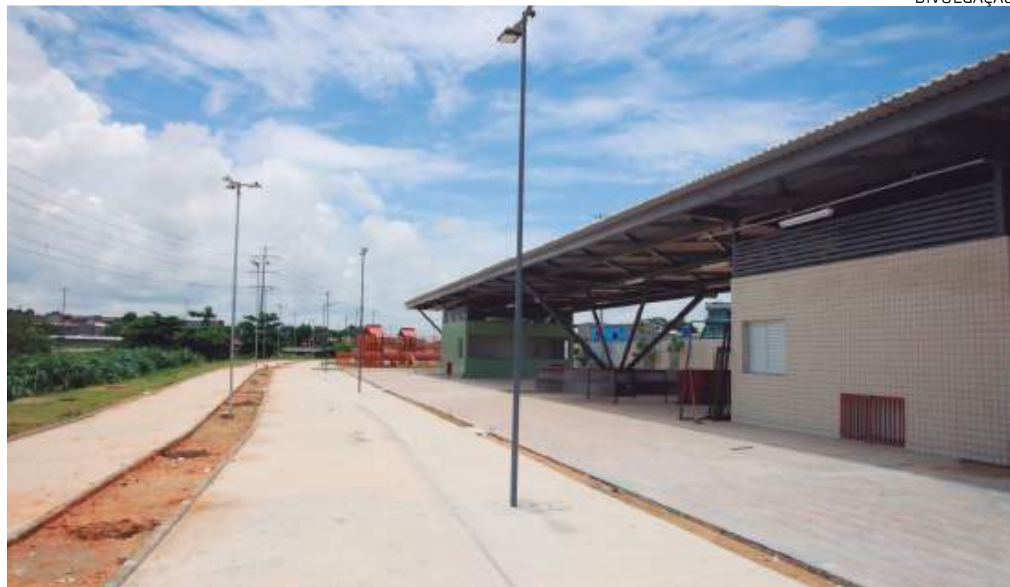
Centro de Atendimento Psicossocial (CAPs) da segunda etapa do parque Amazonino Mendes ainda durante as obras

Esse trecho fica em uma área urbana de aproximadamente 5,1 mil metros quadrados, contando com mais dois quiosques, uma quadra poliesportiva, uma quadra de areia, uma academia ao ar livre, um playground, um playground inclusivo, dois paraciclos, estacionamento e