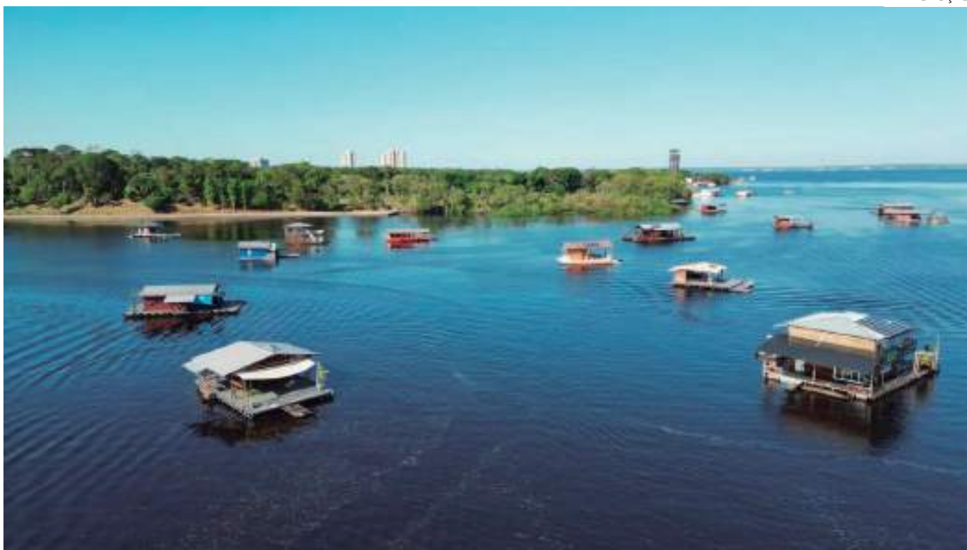
Decisão ocorreu no pedido de agravo de instrumento apresentado pela Defensoria Pública do Estado do Amazonas (DPE)