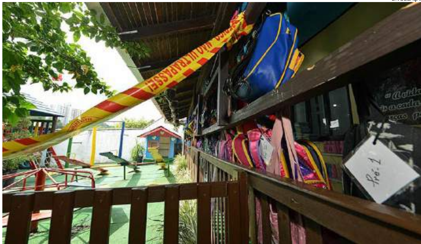
Pátio do CEI Cantinho Bom Pastor, em Blumenau (SC), após ataque em 2023

Durante o Holocausto, cerca de 6 milhões de pessoas foram mortas pelo regime nazista, na maioria judeus e opositores políticos. Segundo o relator, lembrar essas vítimas é essencial para garantir que atrocidades semelhantes nunca mais se repitam. O dia escolhido para a celebração, 16 de abril, se refere à data da