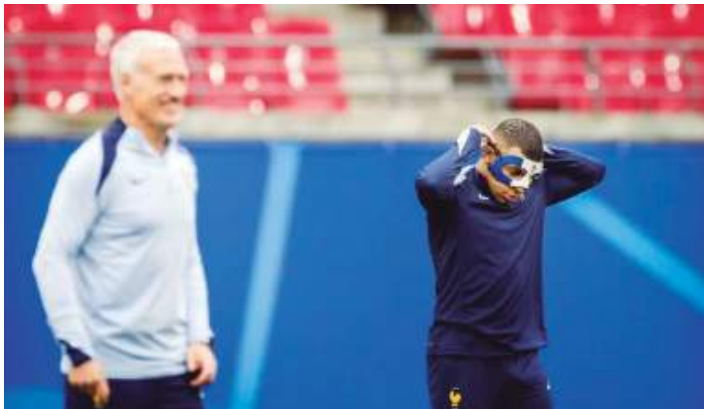
Técnico da seleção francesa, Didier Deschamps não confirmou que Mbappé vai ser relacionado

"Ele está melhorando a cada dia. Ontem estive no treino, o inchaço diminuiu. Está se acostumando com a máscara. Ele quer jogar, já queria contra a Holanda. E quer jogar amanhã", afirmou Deschamps.