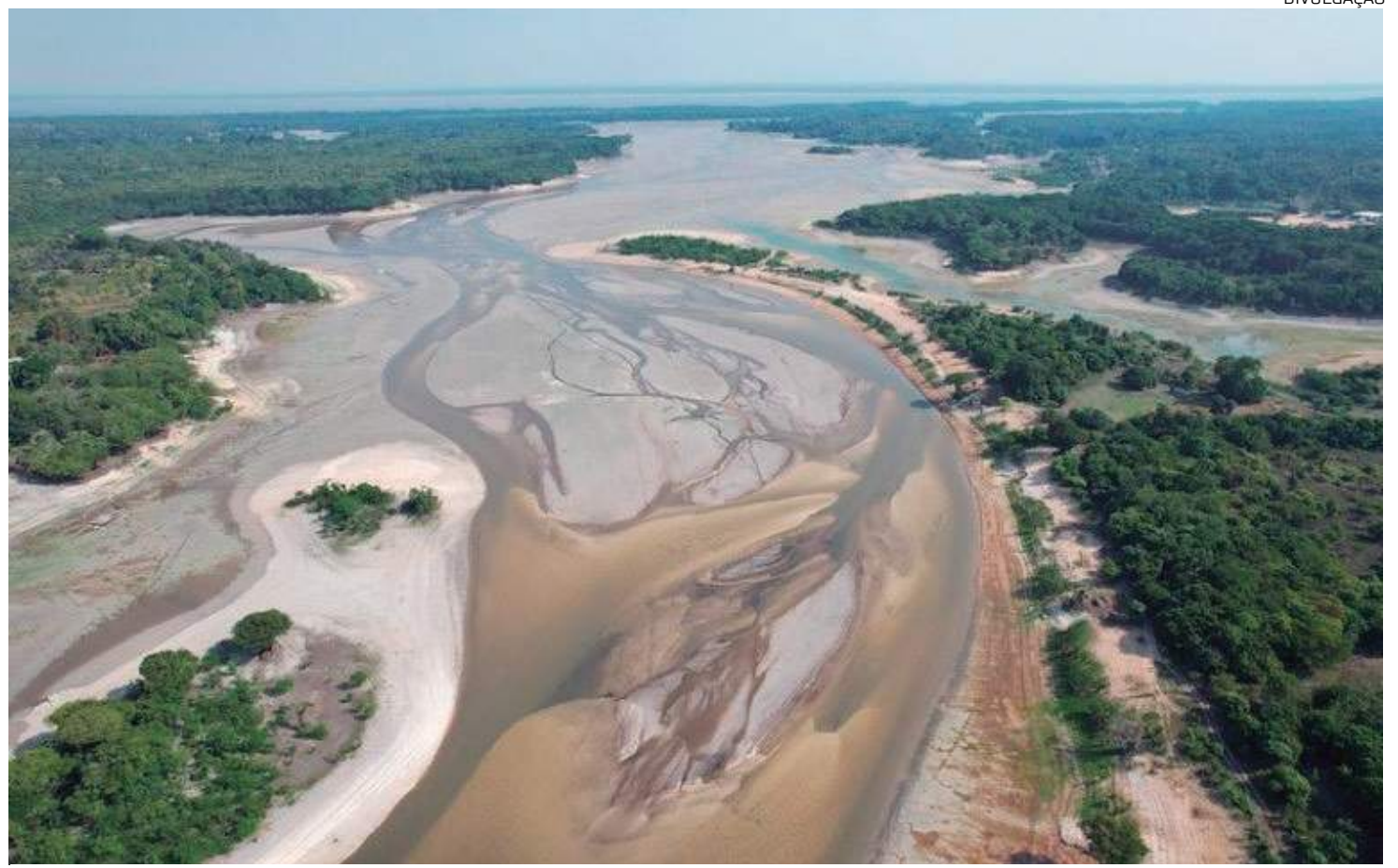
Atual situação do Rio Negro é vista com cautela pelos profissionais da área, já que a região passa por um momento de mudança

de Tabatinga (distante 1.106 quilômetros de Manaus) publicaram um vídeo nas redes sociais mostrando a atual situação do rio Solimões no porto da cidade. Dados do Serviço Geológico do Brasil (SGB), apontaram haver descidas médias diárias na ordem de 15 cm.