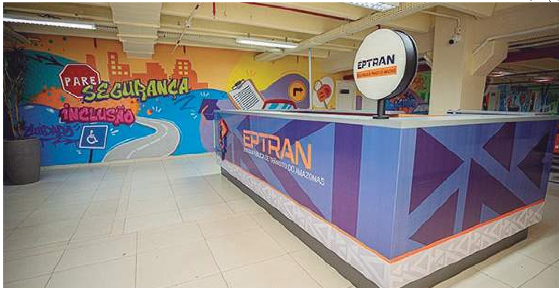
Cursos de Atualização de CNH, Atualização de Mototaxista, Atualização de Transporte Escolar e de Transporte Coletivo de Passageiros são alguns dos oferecidos

Já interessados no restante dos cursos, podem ir a qualquer posto de atendimento do Detran-AM. Para mais informações, basta entrar em