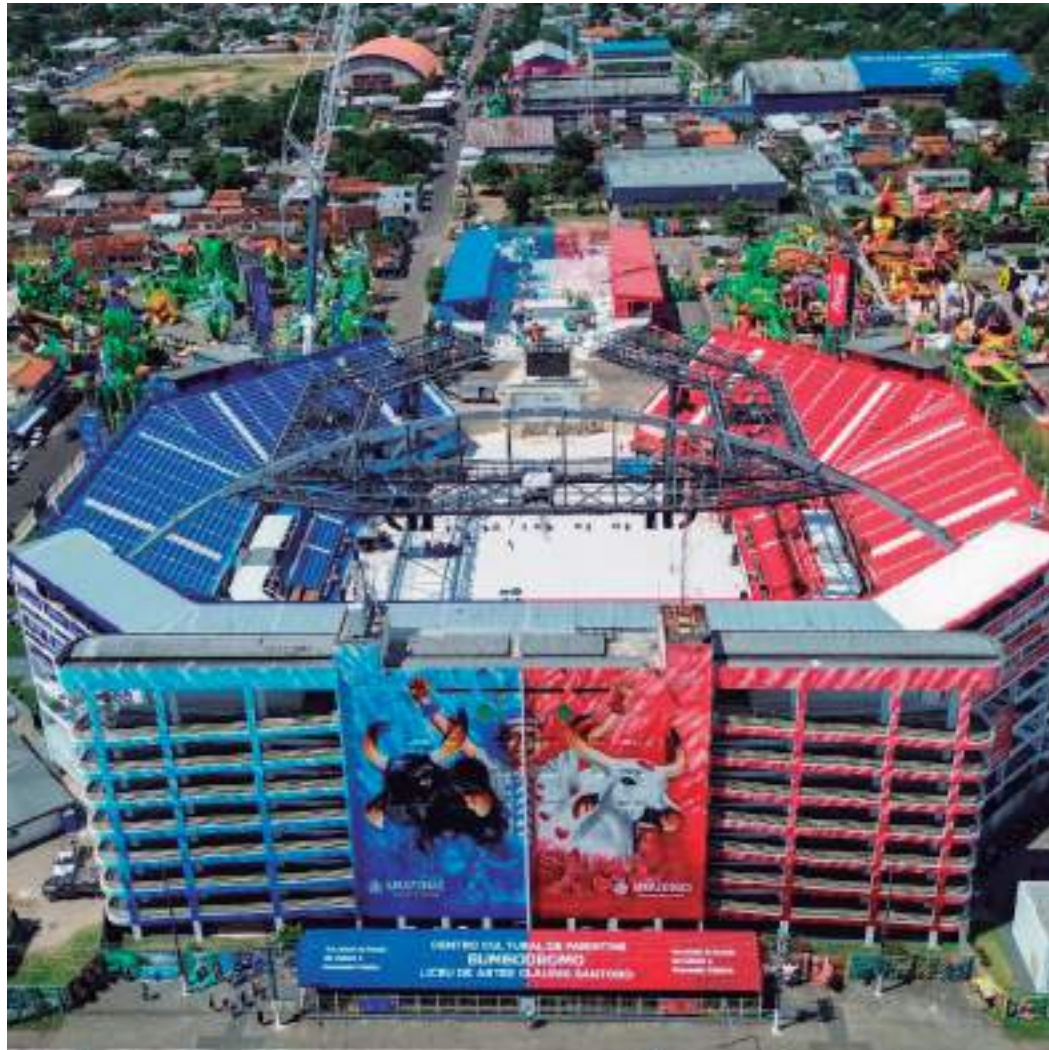
Agendamentos seguirão o mesmo formato de 2023, com reservas para visitas do dia seguinte

A visita guiada acontece de forma gratuita dentro do Bumbódromo, onde também está localizado o Liceu de Artes e Ofícios Cláudio Santoro - Unidade Parintins. Serão oferecidas cerca de 800 vagas ao longo de cinco dias. Cada dia terá um total de 160 pessoas que previamente agendaram as visitas através do portal cultura.am.gov.br.