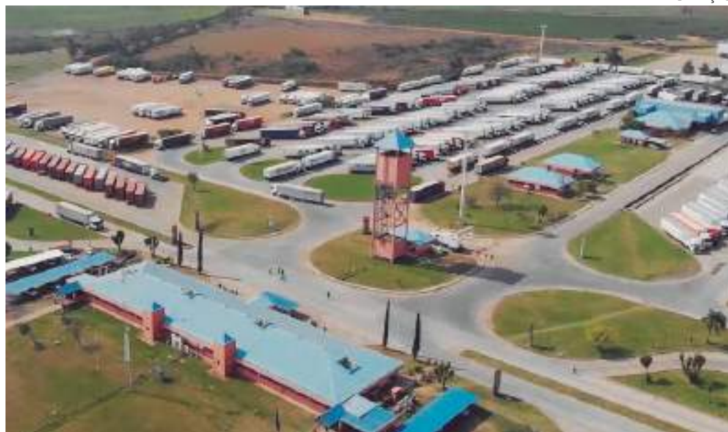
Entrepósito é uma estrutura logística que funciona como armazém

Com a instalação do entreposto e a geração de emprego e renda – o Governo do Amazonas também contribuiu para recuperação do Rio Gran-