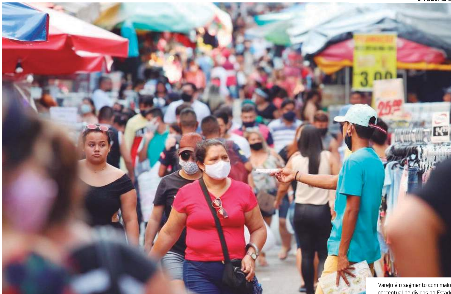
Varejo é o segmento com maior percentual de dívidas no Estado

O volume total de dívidas dos brasileiros também caiu. Comparado aos indi-