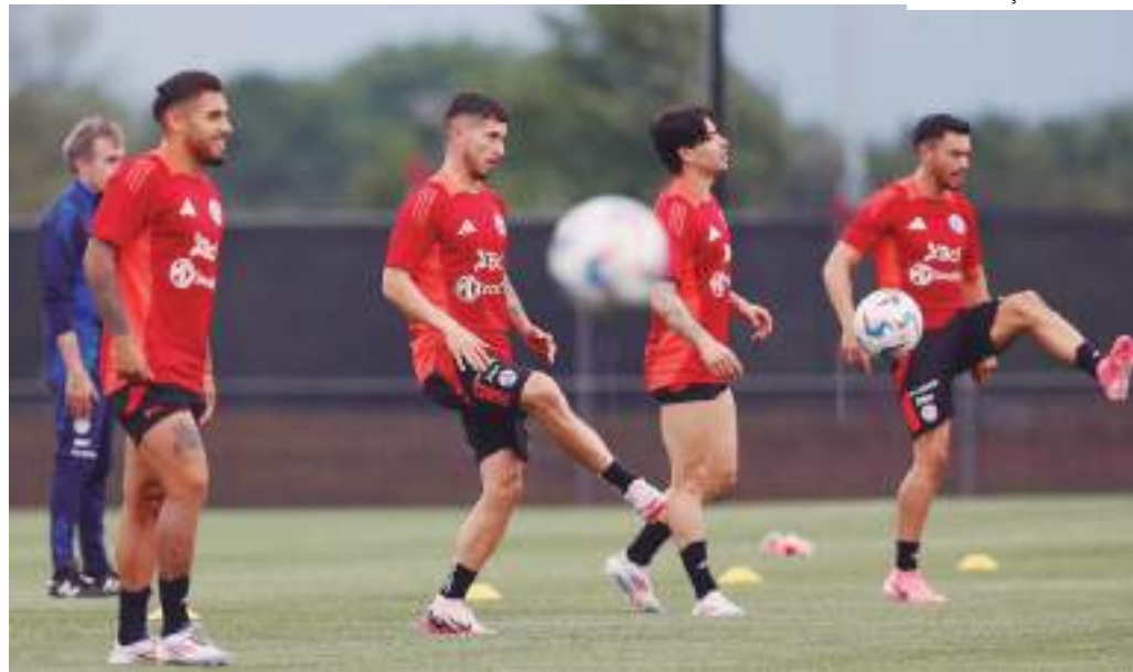
Chilenos venceram argentinos na final da Copa América de 2016, que também foi nos EUA