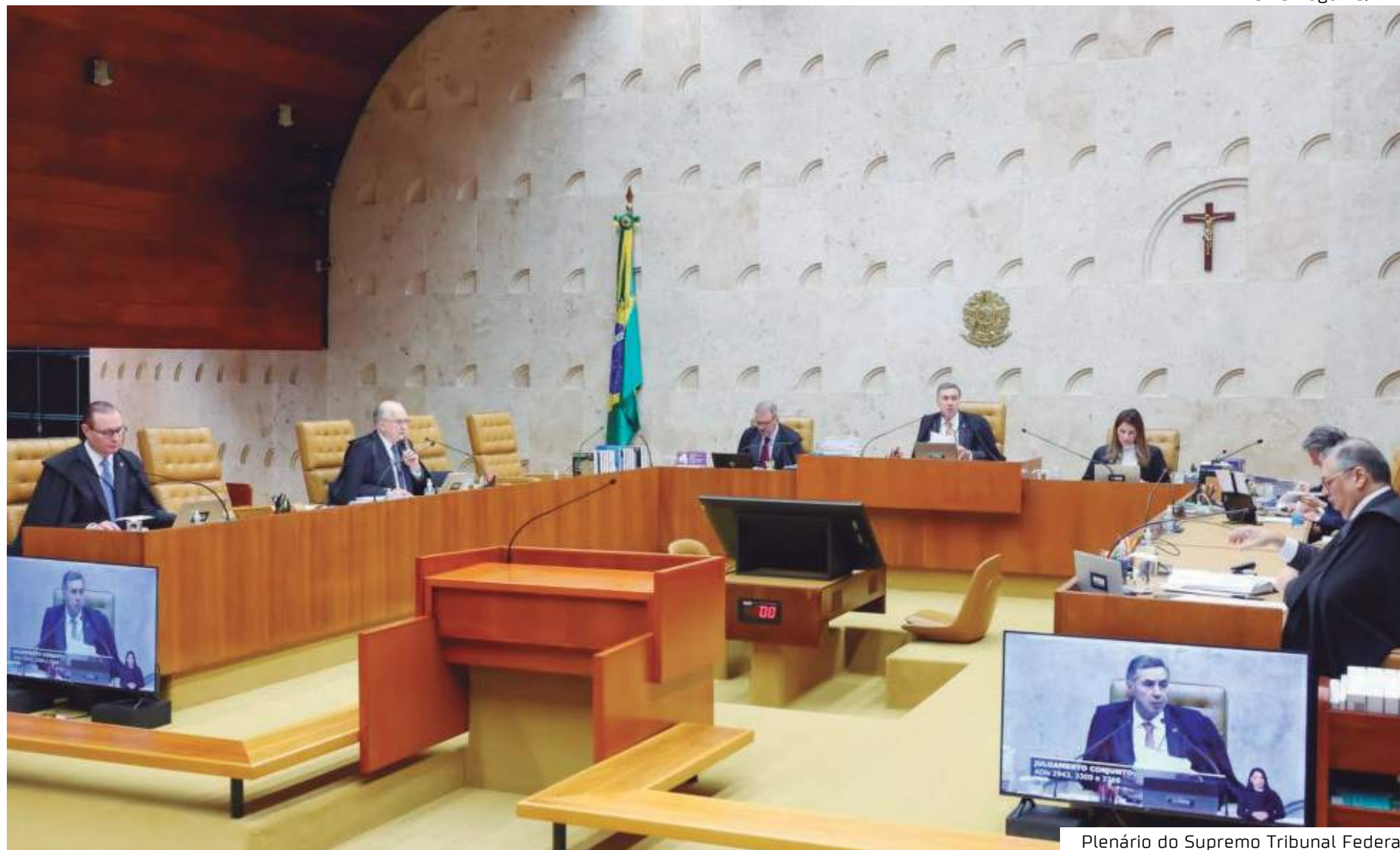
Plenário do Supremo Tribunal Federal

Um dos ministros que referendou a decisão de Dino e apresentou um voto escrito foi Cristiano Zanin. "Posto isso, referendo a decisão cautelar prolatada pelo eminente Relator, Ministro Flávio Dino, diante da impossibilidade, constatada prima facie, de que os estados inovem sobre as diretrizes e bases da educação, cuja competência é exclusiva da União, nos termos do art. 22, XXIV, da Constituição Federal. É como voto", escreveu Zanin. Outro ministro que apresentou voto escrito foi André Mendonça. "Com base em tais razões, em juízo de cognição su-