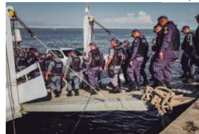
Mais de 650 policiais militares atuarão em torno do evento