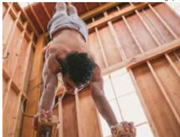
Serão três dias de programação imersiva e inclusiva

Manaus será palco de um dos eventos mais esperados do ano para artistas e amantes das Artes Circenses. Entre os dias 23 a 25 de julho, no Centro Cultural dos Povos da Amazônia (CCPA) e Teatro da Instalação, acontece a primeira edição da Convenção de Circo e Artes Performáticas (Cacirco), uma produção assinada pela Companhia Circo Caboclo, que promete movimentar a cena circense regional, através de uma programação que celebra a diversidade deste segmento artístico.