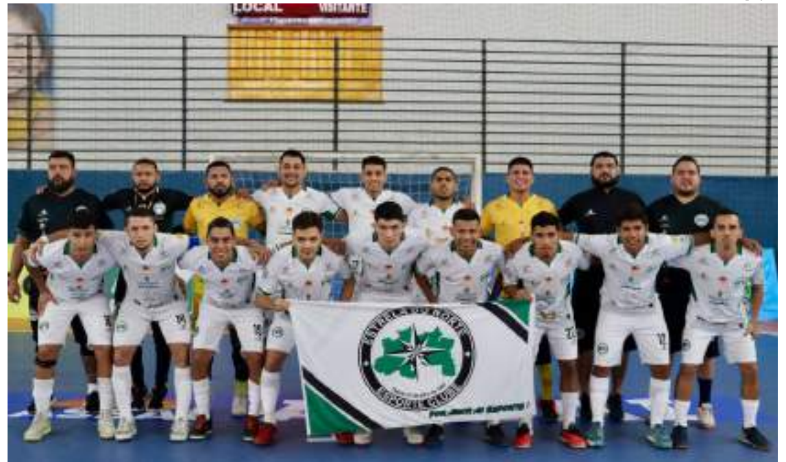
Agora, time amazonense encara o Sport-PE nas oitavas de final, que começam no dia 25 de julho

No Grupo A classifica-se, nesta ordem, as seguintes equipes: Passo