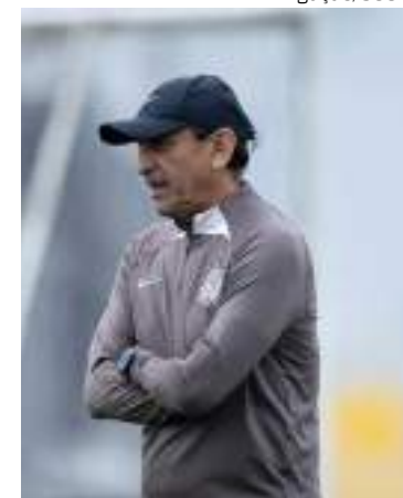
Treinador era do Vasco da Gama