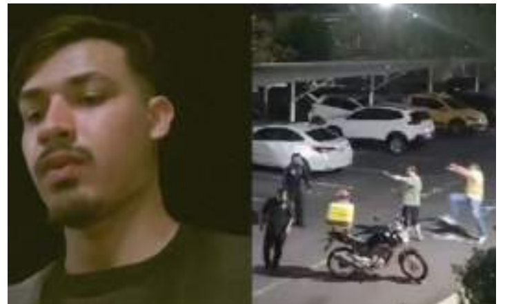
Entregador deu detalhes sobre a confusão com o morador

Os envolvidos foram encaminhados para a delegacia para prestar depoimento.