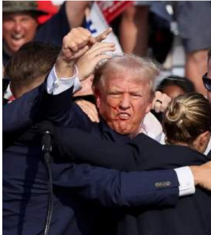
Trump ergue o punho após escapar de atentado durante um comício

verá mais cuidados ainda [com a segurança]. Mas não creio que ele vá mudar de ideia em participar da campanha. Inclusive, ele já vai para a convenção do Boulos”, afirma Costa.