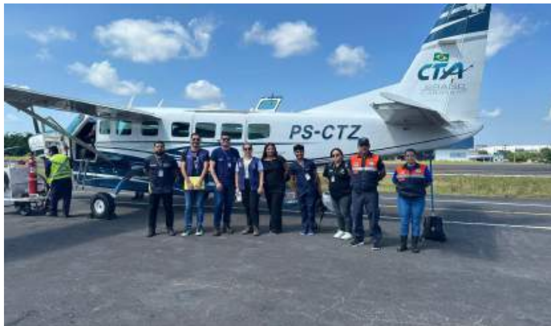
Município recebeu o apoio de 14 servidores de Defesa Civil, Sejusc e Seas

Além disso, a Secretaria de Estado de Saúde (SES-AM) também está fornecendo suporte na área da saúde. A