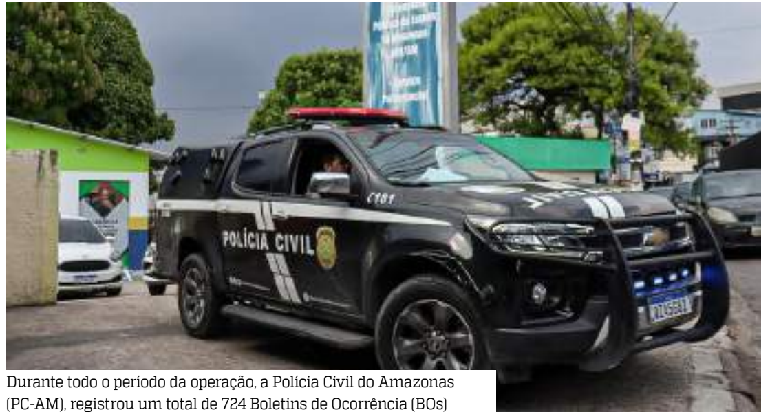
Durante todo o período da operação, a Polícia Civil do Amazonas (PC-AM), registrou um total de 724 Boletins de Ocorrência (BOs)

“Nós tivemos a participação de órgãos governamentais, não-governamentais, instituições de ensino públicas e privadas, sociedade civil organizada envolvidas nessa operação, porque além de trabalharmos na repressão desses crimes praticados contra as pessoas idosas, nós procuramos, também, trabalhar a prevenção, através de ações