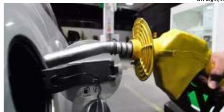
Postos de combustíveis vendem gasolina a R$ 6,89

da-feira (15), duas fiscalizações em postos distintos e, ao longo da semana, irá realizar outras com intuito de mapear o mercado e proteger o consumidor.