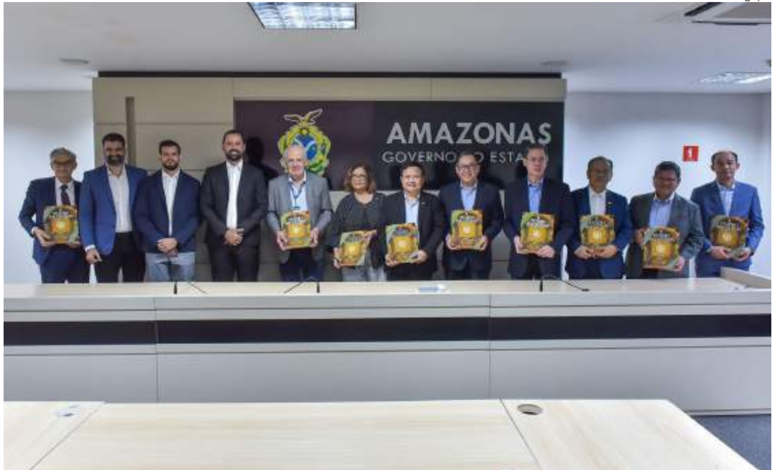
Reunião teve representantes de Camboja, Filipinas, Indonésia, Tailândia, Myanmar, Vietnã e Timor Leste

Os representantes diplomáticos receberam uma explanação sobre os principais avanços do Governo do Estado em diversos assuntos,