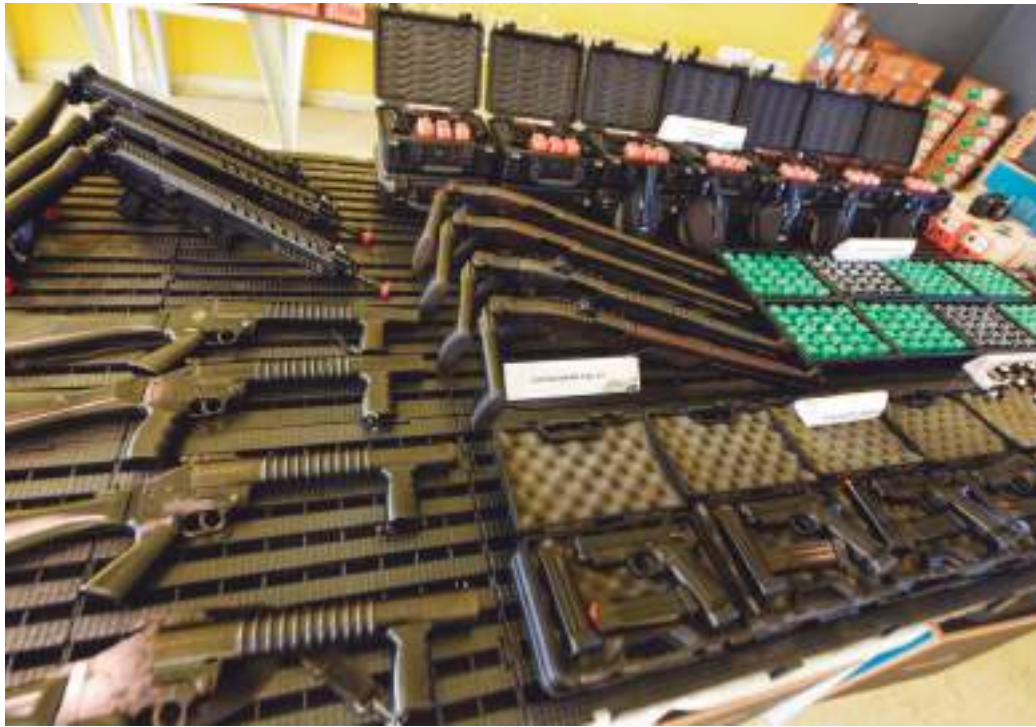
Entre as melhorias estão as metralhadoras Negev para o combate ao crime organizado nos nossos rios