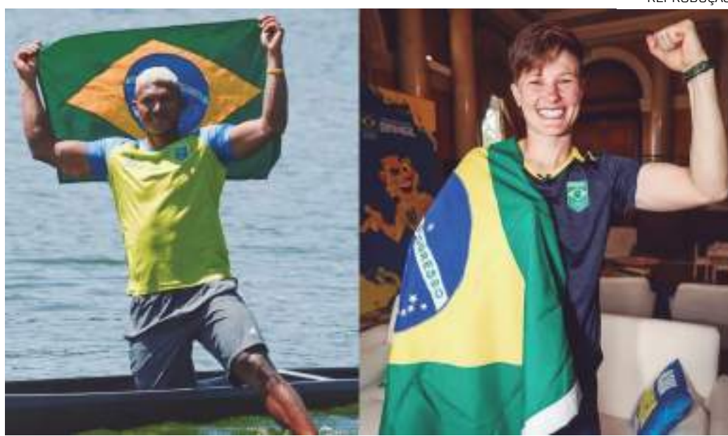
Canoísta de velocidade e jogadora de rugby vão representar a delegação brasileira na abertura