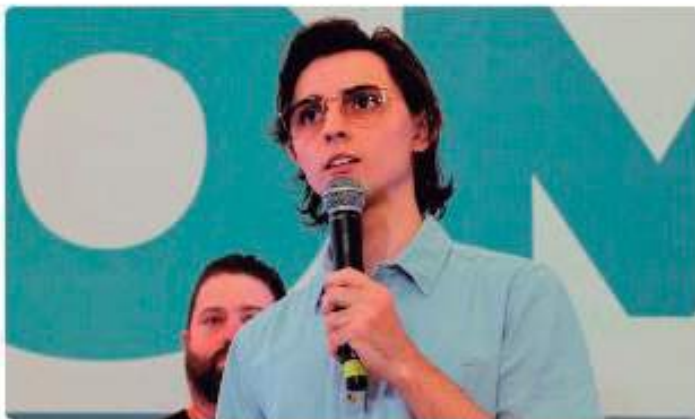
Federação PSDB-Cidadania anuncia convenção partidária no Clube do Trabalhador, em Manaus