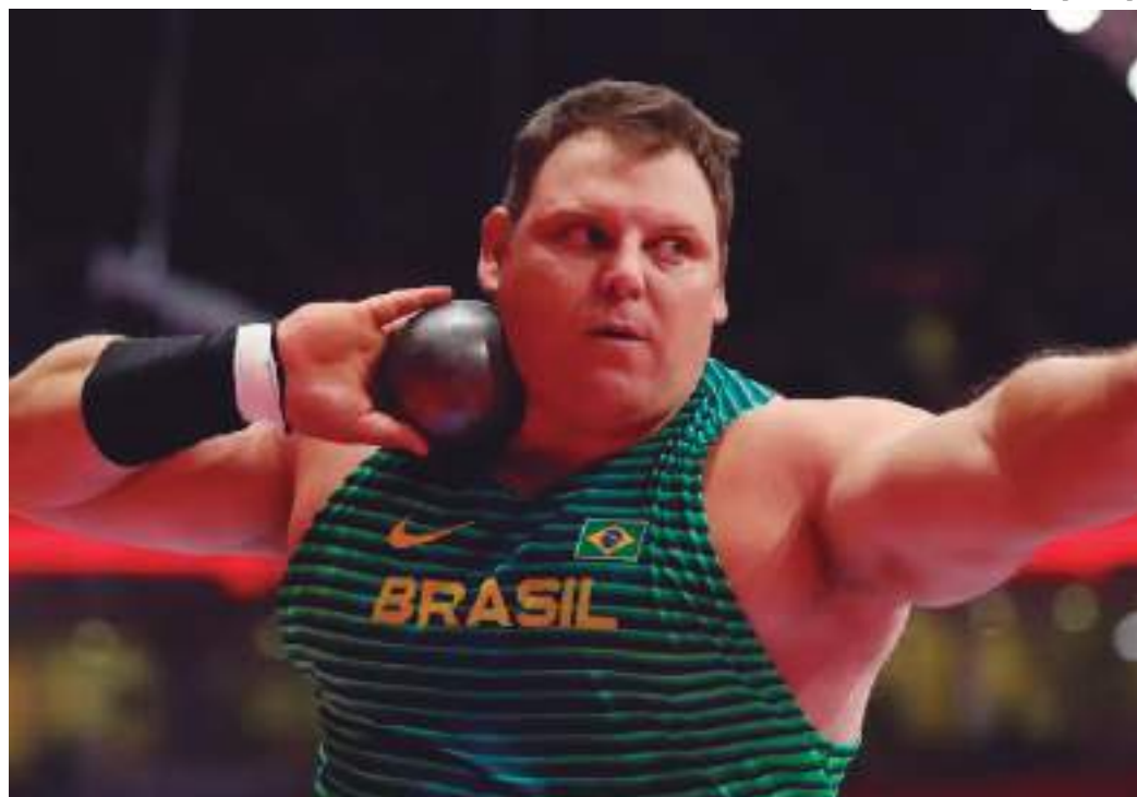
Brasileiro foi quarto colocado nos Jogos Olímpicos de Tóquio 2020 e era um dos favoritos para 2024

bém demonstrou apoio ao atleta. "Darlan Romani é um exemplo de dedicação e talento no atletismo brasileiro. Ao longo de sua carreira, ele conquistou inúmeras medalhas e quebrou recordes, sempre com muita garra e determinação. Sua performance nos Jogos Olímpicos de Tóquio foi memorável e inspirou muitos atletas e fãs. Neste momento desafiador, queremos expressar nosso profundo carinho e apoio ao nosso Senhor Incrível, um verdadeiro orgulho para o povo brasileiro. Estamos com você, Darlan!", acrescentou.