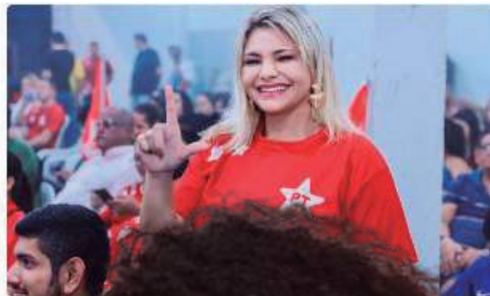
Presidente de prefeitura...