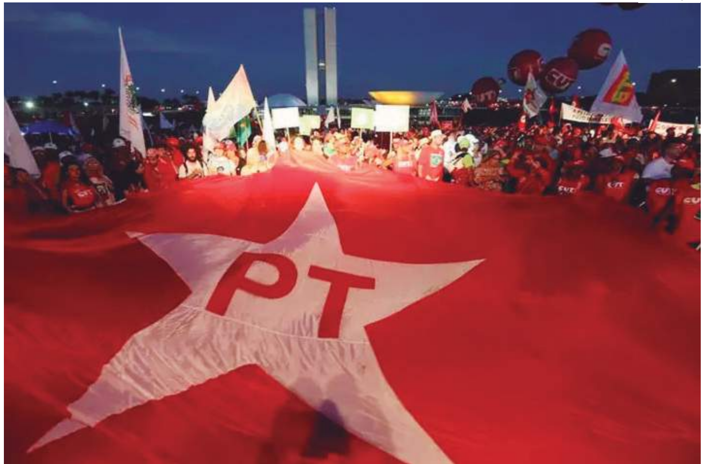
Bandeira do Partido dos Trabalhadores (PT) em frente ao Congresso Nacional em Brasília

O PT não terá candidato próprio nas principais capitais do país — uma estratégia contestada até mesmo pelos próprios petistas, cujo objetivo é garantir apoio amplo à reeleição de Lula em 2026. Em São Paulo, por exemplo, o maior colégio