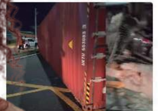
...tomba e atinge casa e carros na... de Manaus; VÍDEO