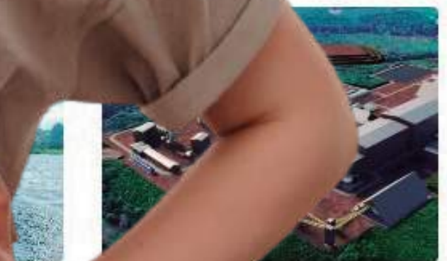
...Presidente da Potássio... entrar em terra indígena no...