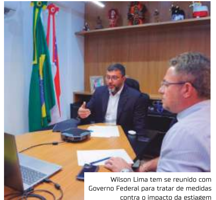
Wilson Lima tem se reunido com Governo Federal para tratar de medidas contra o impacto da estiagem

Entre os trechos que receberam as licenças estão: Manaus-Itacoatiara (rio Madeira); Codajás-Coari e Benjamin Constant-São Paulo de Olivença (rio Amazonas) e Benjamin Constant - Tabatinga (rio Solimões).