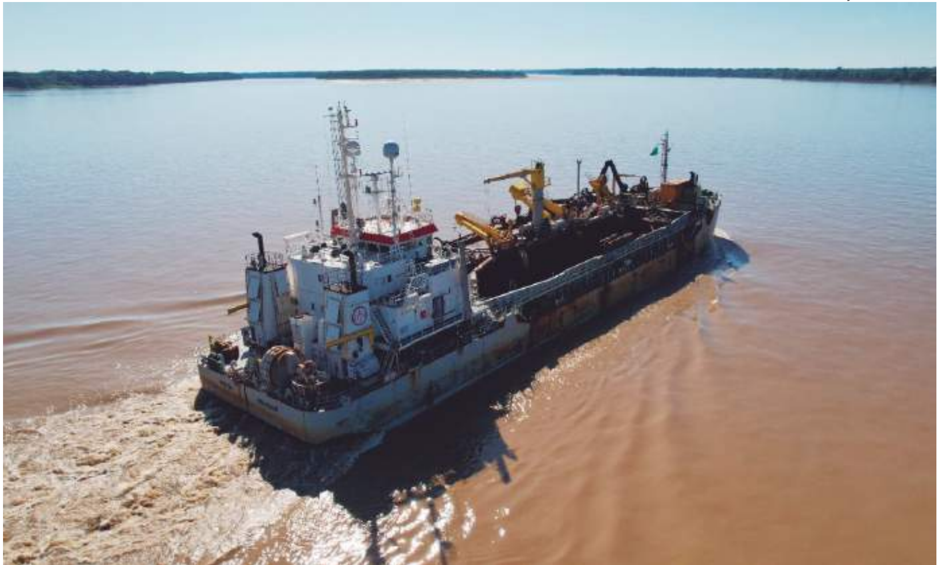
No dia 19 de junho, o Governo Federal atendeu ao pleito do governador do Amazonas e assinou a publicação de editais para contratação das dragagens

A escavação de leito do rio tem o intuito de possibilitar a navegabilidade de embarcações de grande porte durante a estiagem.