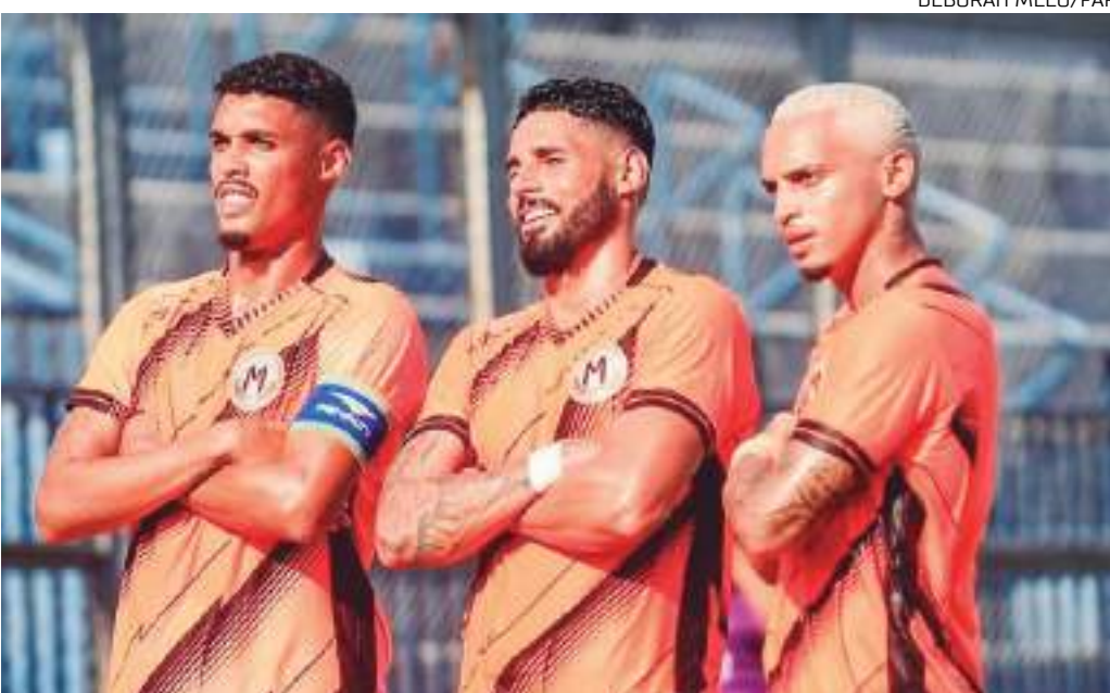
Manauara é dono da melhor campanha geral na primeira fase da Série D do Brasileiro

Maranhão (MA) x Manaus, 04/08 (domingo), 15h estádio Castelão.