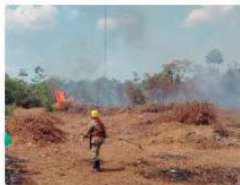
Bombeiros combatem 70 focos de incêndio em 24 horas no interior do AM