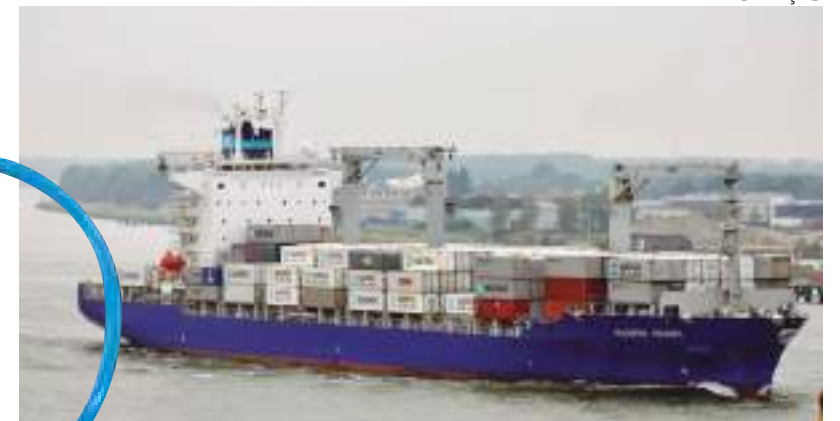
Empresa CMA CGM vai adicionar o custo de US$ 5,7 mil

Uma nova operadora de logística de Manaus anunciou, nessa semana, a cobrança da "taxa da pouca água". A empresa CMA CGM vai adicionar o custo de US$ 5,7 mil (cerca de R$ 31,7 mil) por contêiner transportado para Manaus e da capital amazonense para outros locais, a partir do dia 15 de agosto. No início do mês, três empresas já haviam informado o adicional nas operações.