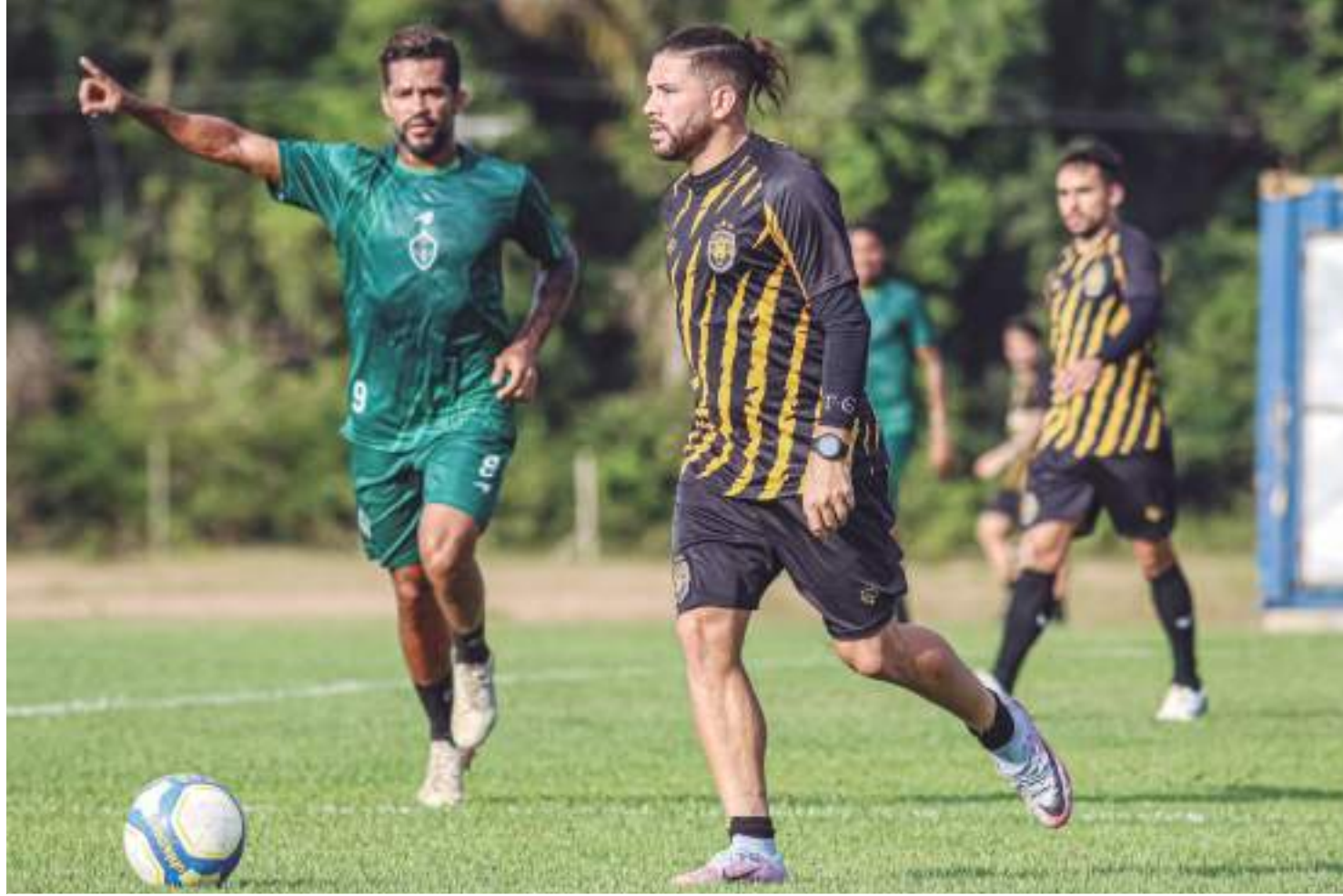
Parte do elenco aurinegro participou de jogo-treino contra a equipe do Manaus, no CT do Gavião Real, na segunda-feira (23)

O Guarani-SP, por sua vez, é o último colocado da Série B do Brasileiro. O lanterna tem sete pontos somados em 16 jogos e vem de derrota para