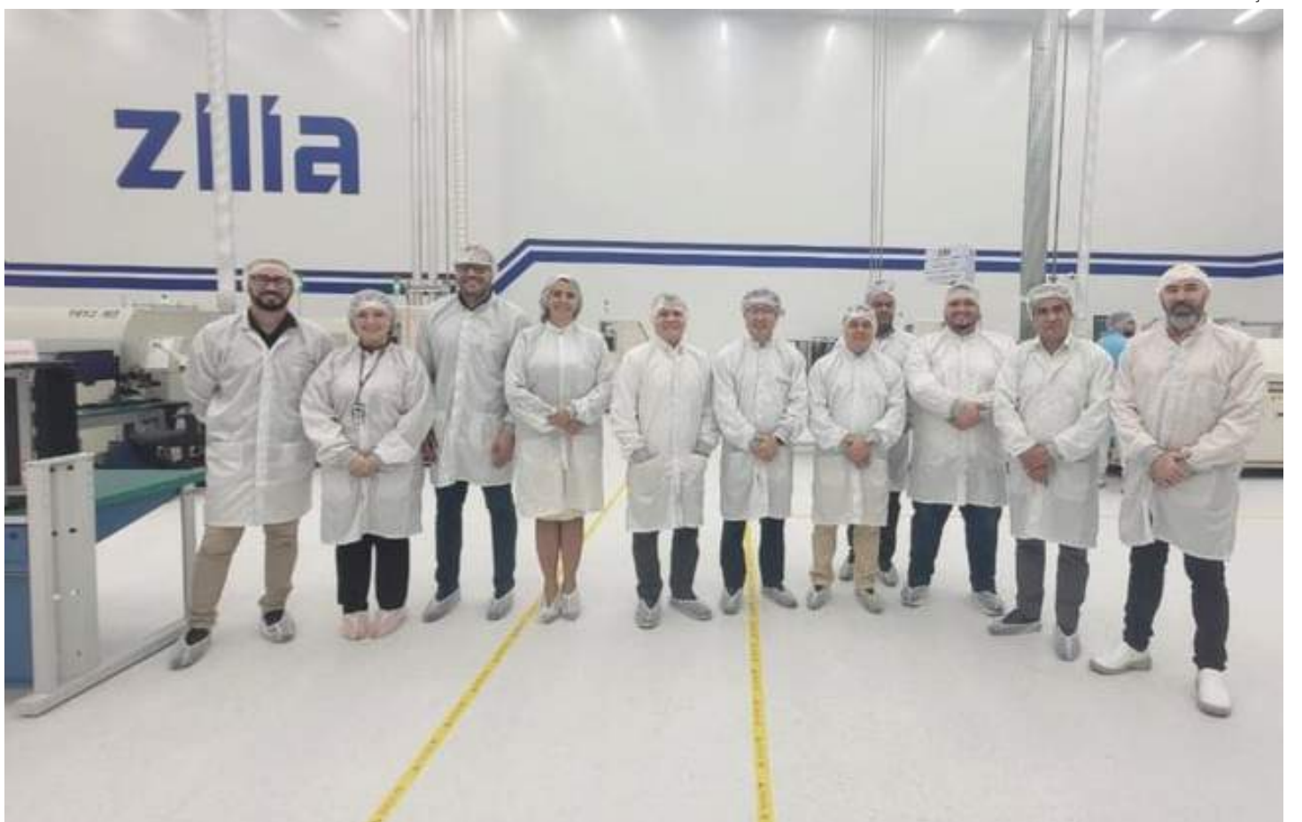
Suframa visita fábrica da Zilia da Amazônia e discute investimentos e exportação

Durante reunião com a comitiva da Suframa, na segunda-feira (29), os executivos da empresa explicam que o objetivo dos novos investimentos é atender à crescente demanda local por chips de memória para smartphones, servidores, computadores pessoais, Internet das Coisas (IoT),