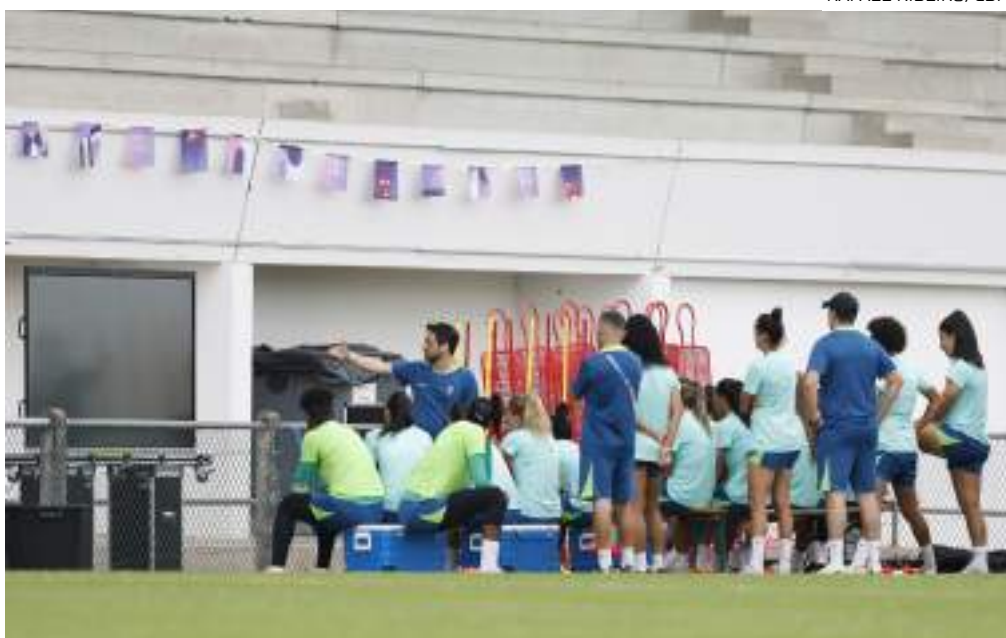
Técnico não trabalha com a ideia de que a Seleção entre em campo em busca do empate