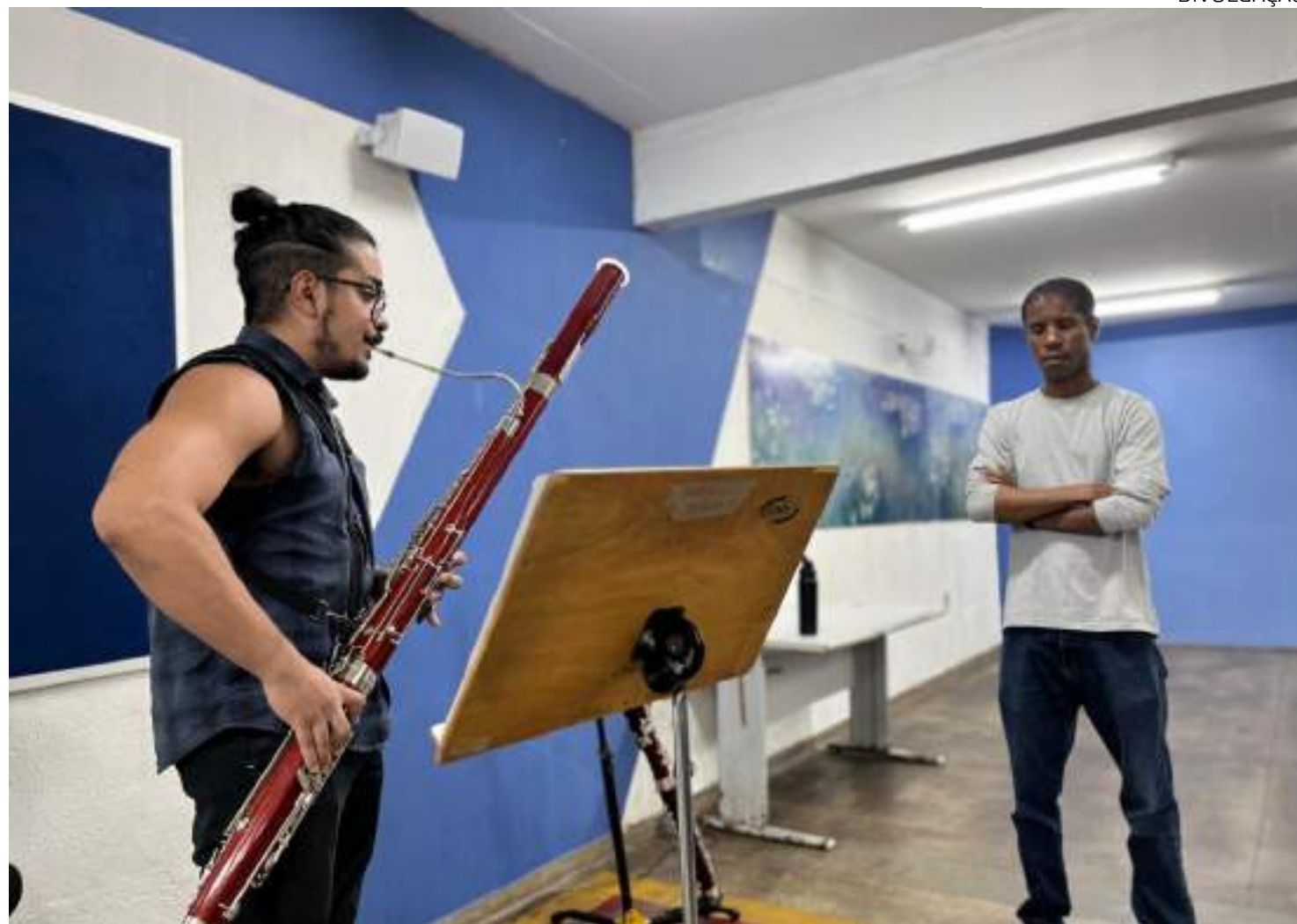
Cursos disponíveis no segundo semestre atendem às faixas etárias a partir de 5 anos, com cursos também disponíveis para 50+