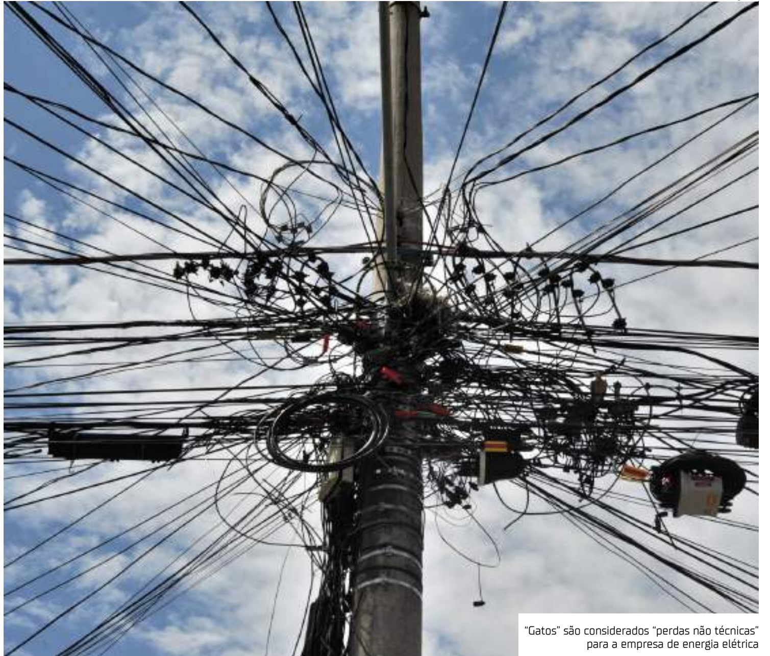
"Gatos" são considerados "perdas não técnicas" para a empresa de energia elétrica

Em primeiro lugar ficou o Rio de Janeiro, com 11,27 milhões de MWh; em segundo lugar é ocupado por São Paulo, com 6,98 milhões de MWh; e em terceiro lugar, o Amazonas,