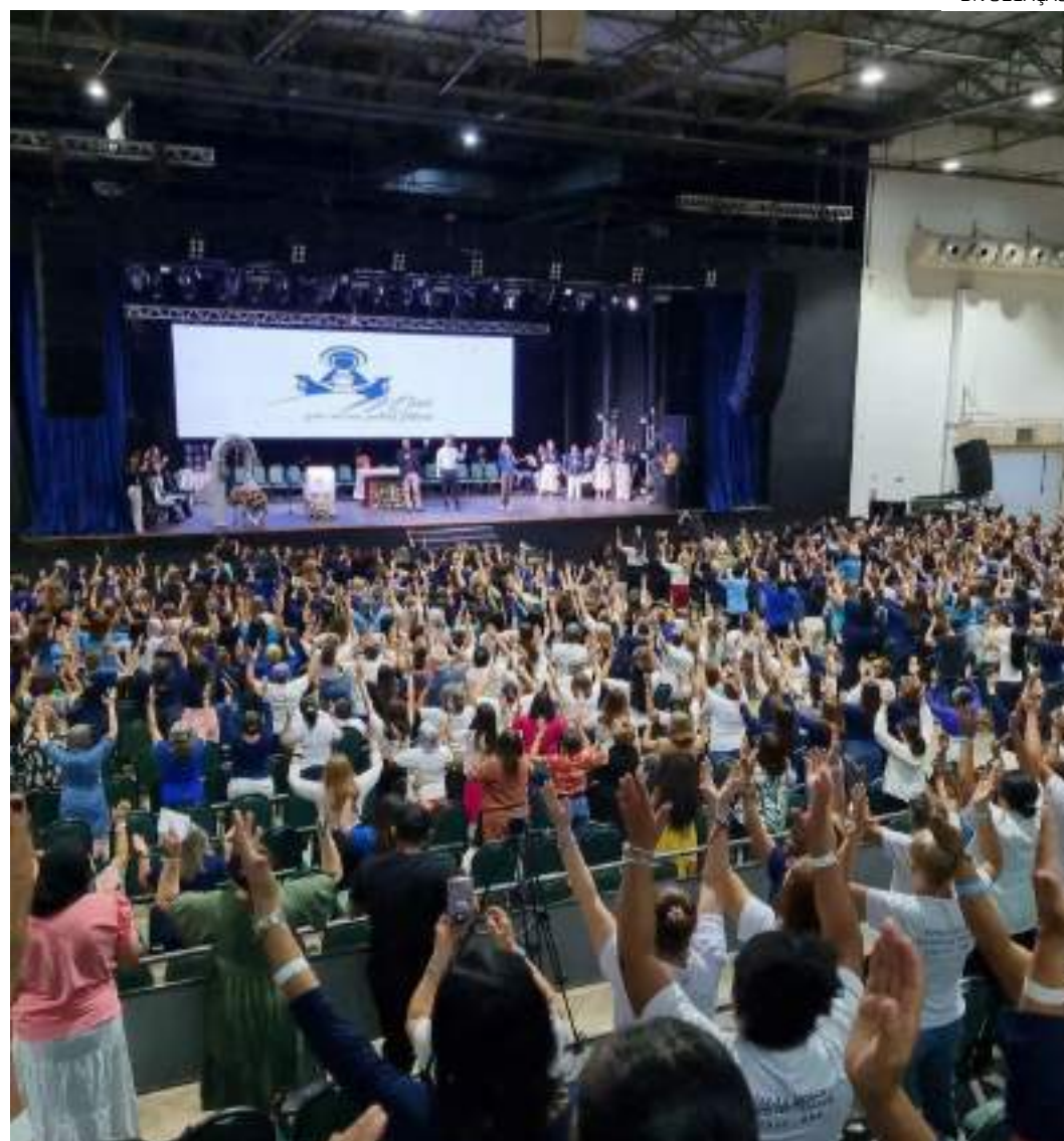
De 2011 até hoje, o grupo só cresceu, se expandindo para várias cidades do Brasil e do mundo

Em 2014, no Kairós do Dia das Mães, foi lançado pela Canção Nova o livro “Mães que oram pelos filhos – Tudo pode ser mudado pela força da oração”. Com o alcance deste canal de televisão e do livro nasceram vários grupos no Brasil.