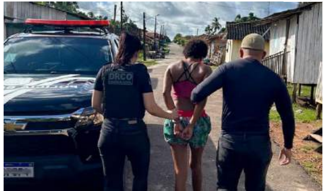
Projeto prevê pena mínima de 25 anos e máxima de 50 anos para o crime cometido pelos criminosos

O projeto de Marcos do Val prevê pena de reclusão esse tipo de homicídio (a reclusão é uma punição mais severa que admite o cumprimento em regime fechado, normalmente em estabelecimentos de segurança média ou máxima). Apesar disso, o Có-