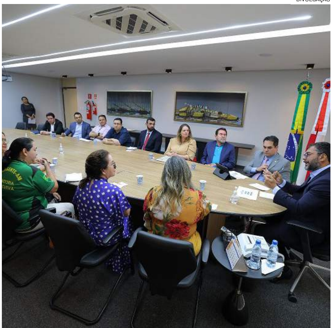
Mais de 22 mil servidores ativos, aposentados e pensionistas serão beneficiados pela concessão

O governador Wilson Lima anunciou, ainda, durante a reunião com a categoria, mudança no decreto nº 44.221, de 15 de julho de 2021, que normatiza o pagamento do vale-alimentação e que vai passar a ser pago para todos os servidores estaduais que necessitarem de afastamento de suas funções em casos de licença médica, maternidade e licença prêmio.