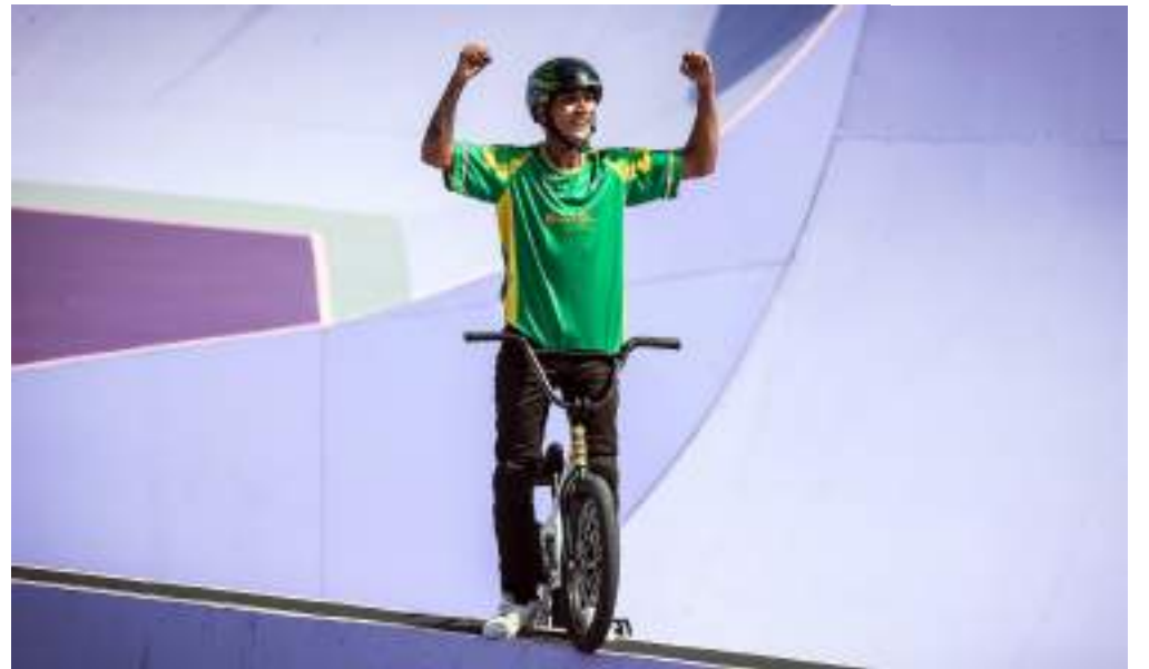
Paulista de Carapicuíba vai brigar pelo pódio às 8h44 (horário de Manaus)