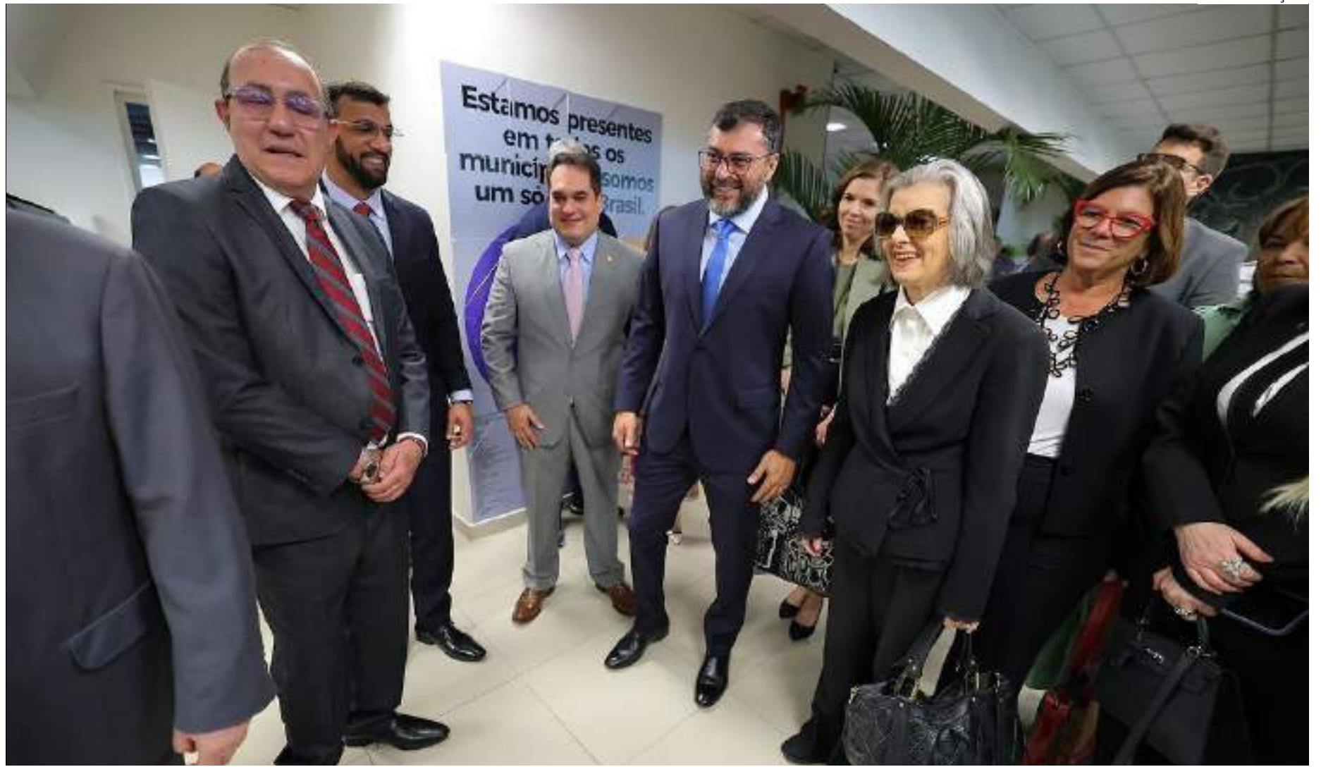
Governador Wilson Lima recebe ministra Cármen Lúcia para discutir sobre estratégia para eleições municipais no Amazonas

A seca no Amazonas preocupa a Justiça Eleitoral. Antes mesmo do período mais crítico da estiagem, 102 locais de votação em 19 municípios já estão sendo impactados pelo recuo dos rios. Segundo o TRE-AM, cerca de 43 mil eleitores de 194 seções vão ter dificuldades para votar, em outubro.