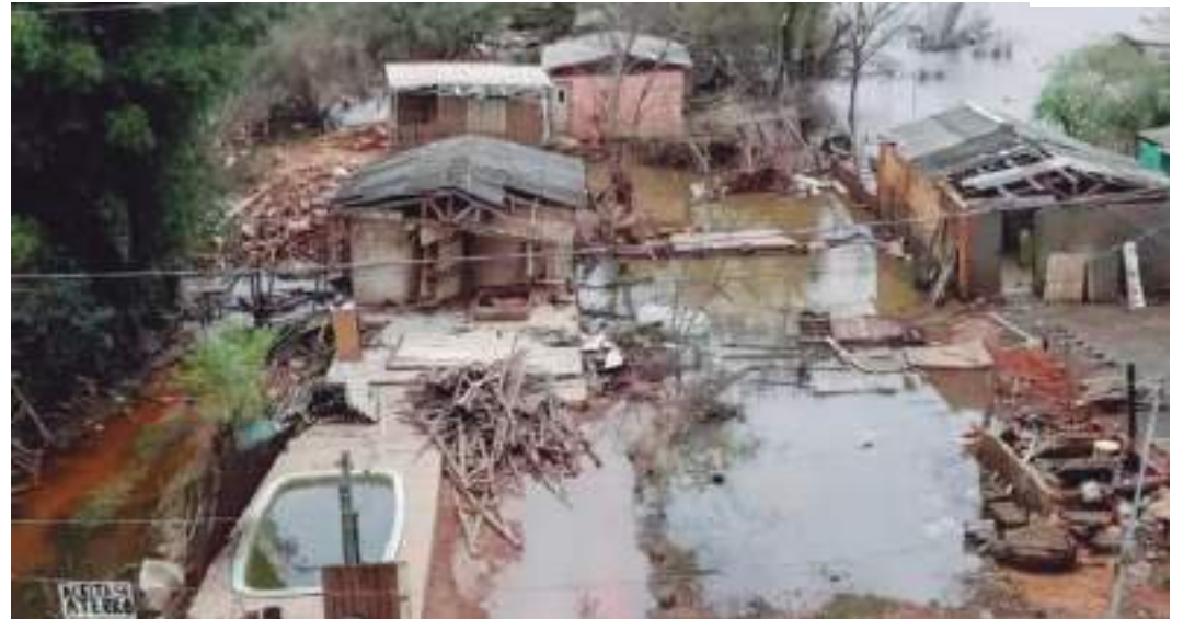
Local alagado no município de Eldorado do Sul (RS)

Na justificativa, o senador Alessandro destaca a crescente frequência e intensidade de desastres climáticos no Brasil, como enchentes, deslizamentos de terra, secas e tempestades severas, que resultam em grandes perdas humanas,