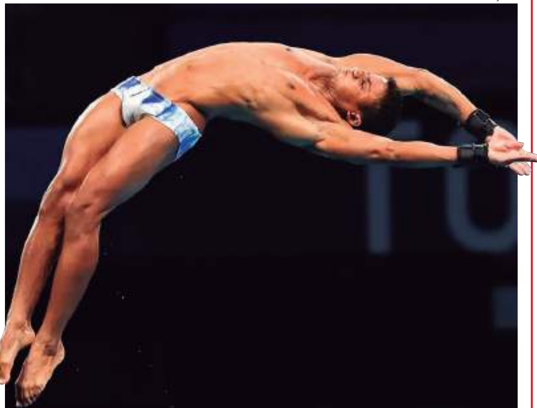
Saltador sofreu lesão durante treinamento realizado na última segunda-feira (22) no Rio de Janeiro