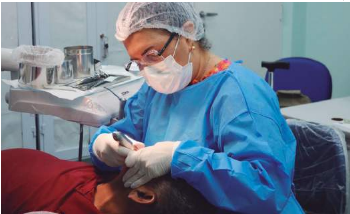
Tratamento pode incluir, a depender do estágio e tipo do tumor, a cirurgia, a quimioterapia e a radioterapia