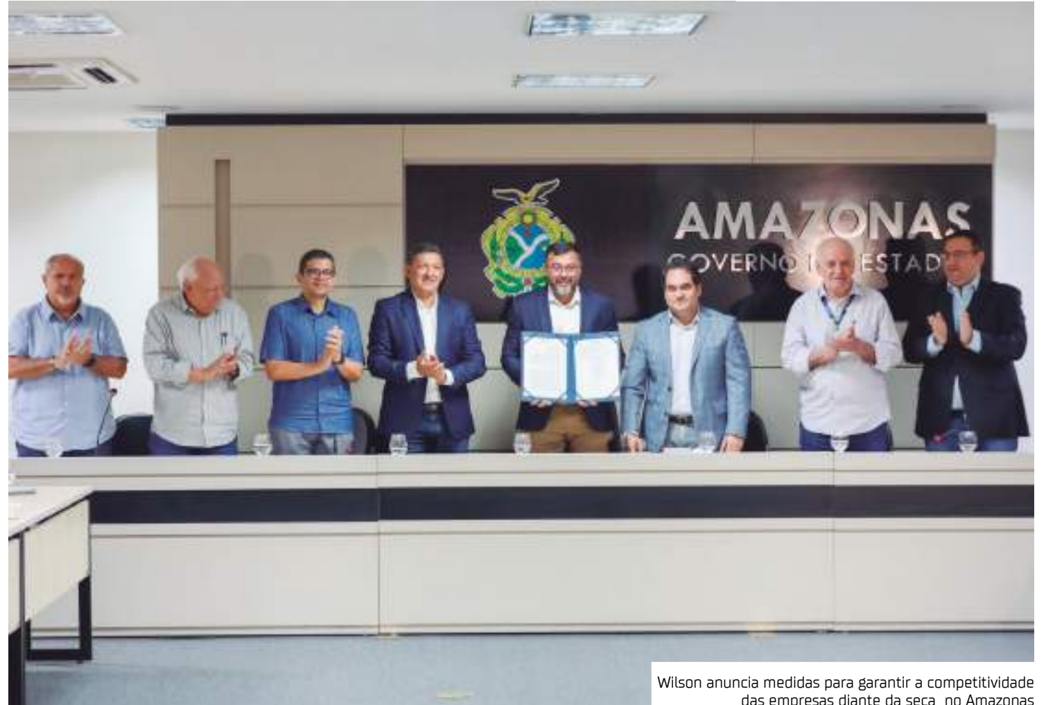
Wilson anuncia medidas para garantir a competitividade das empresas diante da seca no Amazonas

"O sistema da Sefaz está todo parametrizado, isso significa que vai ser automático, não será preciso entrar com nenhum ofício, nenhum