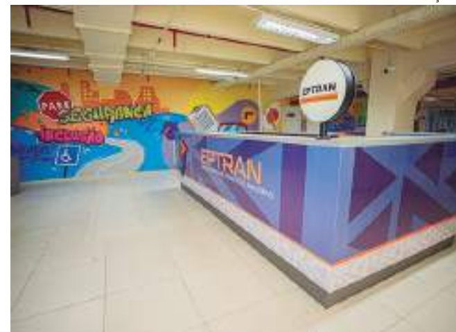
Instituição vai disponibilizar 150 vagas para avaliação psicológica