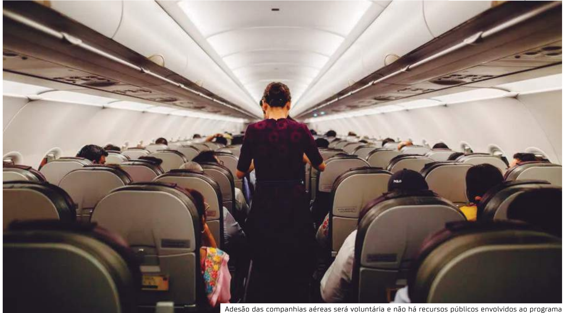
Adesão das companhias aéreas será voluntária e não há recursos públicos envolvidos ao programa

Quem não atender aos critérios não conseguirá fazer o login no site. Ao localizar a passagem desejada no site, o usuário é direcionado para a página da companhia aérea