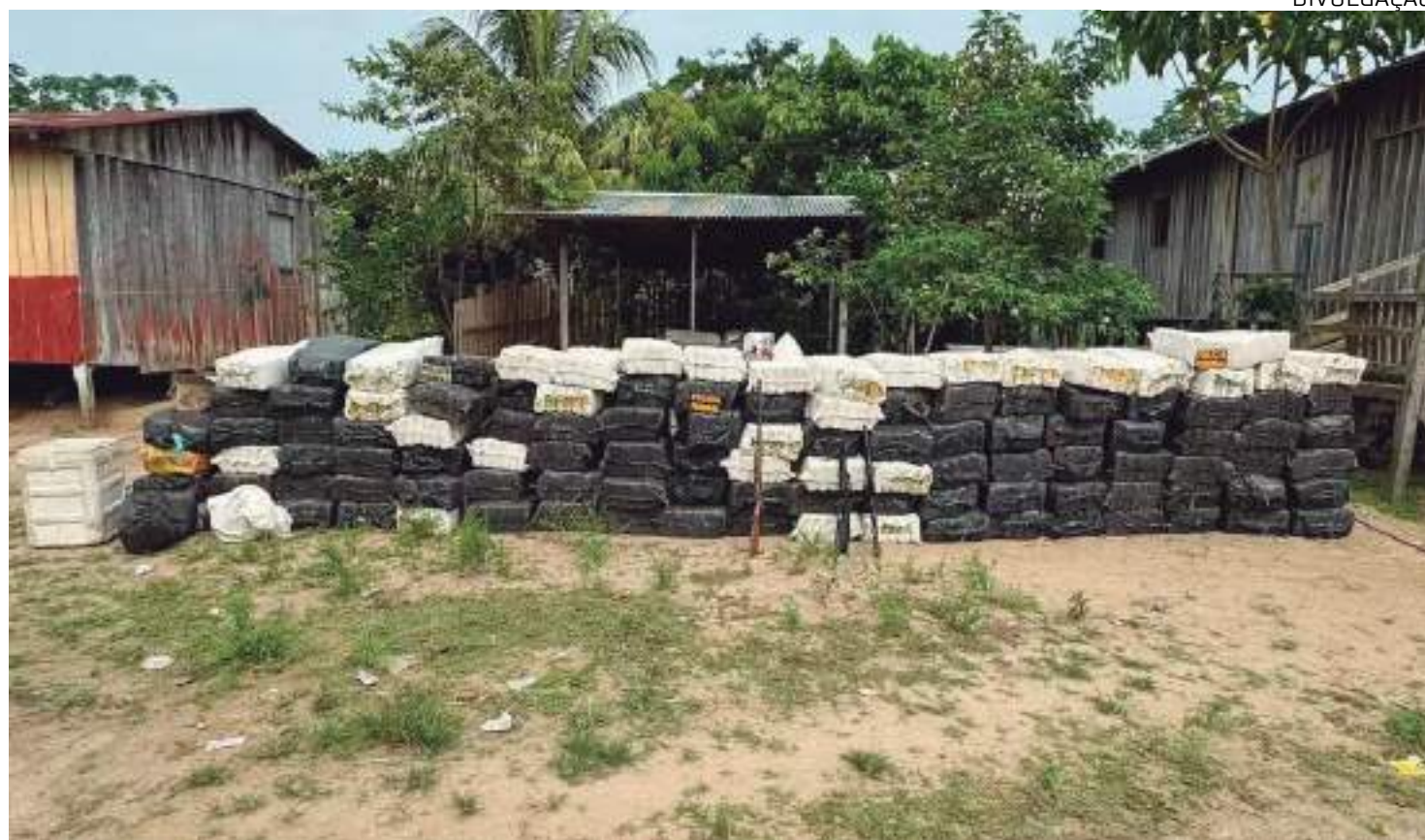
Droga vinha da Colômbia e passava em Vila Nova, onde era armazenada antes de ser transportada para Manaus

A carga foi descoberta em uma local conhecido como "Rota do Rio", por ser uma via ilegal do tráfico de drogas no país. Além da cocaína, um fuzil foi apreendido e três pessoas foram presas. Segundo a PF, parte da cocaína estava escondida em uma casa de