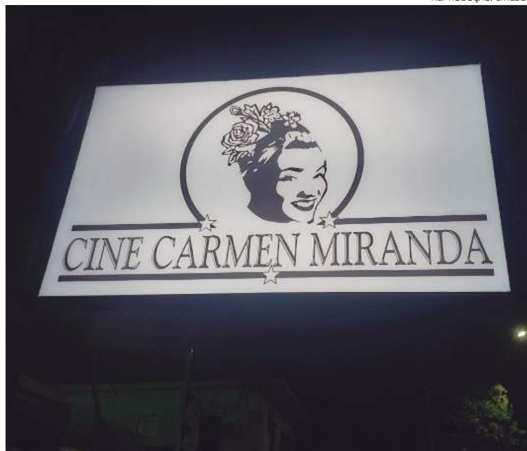
Local vai exibir filmes em alusão aos Jogos Olímpicos de Paris 2024, que começam nesta sexta-feira (26)