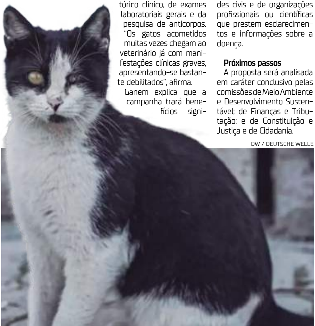
Variante do coronavírus felino tem uma série de sintomas que afetam os animais