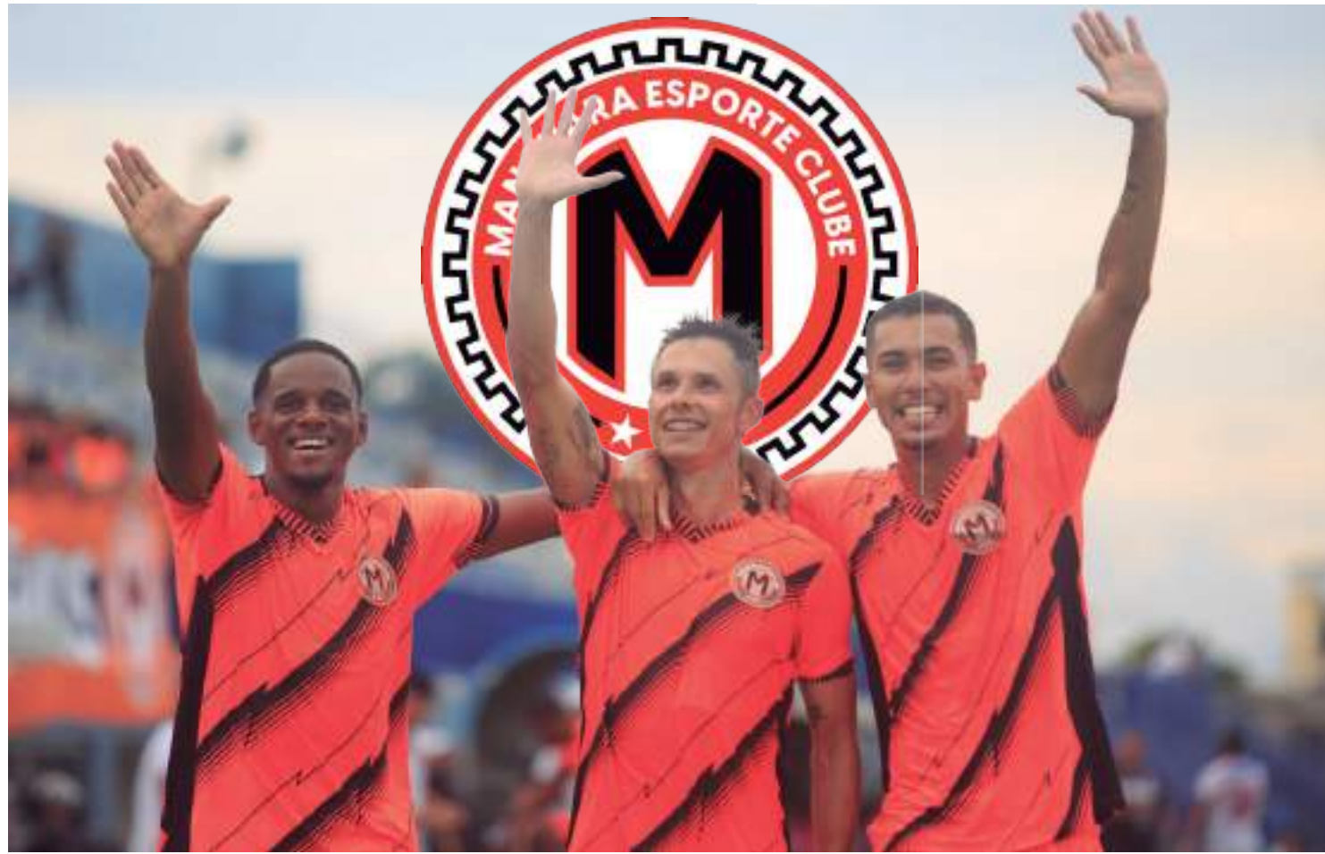
Fundada em 30 de novembro de 2020, a equipe amazonense foi dominante na primeira fase pelo Grupo A1 com 10 vitórias em 14 partidas

Líderes dos Grupos A5 e A7, respectivamente, Brasiense-DF e Maringá-PR são os outros times a alcançar dez triunfos no torneio. Ambos conseguiram 32 pontos. O Treze-PB, do Grupo A3, e Nova Iguaçu, do Grupo A6, chegaram a 31 e avançaram na liderança. No Grupo A4, o Itabaiana-SE foi o primeiro colocado com