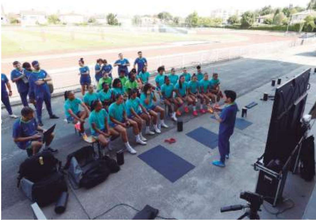
Seleção Feminina treina em Bourdeaux, local do duelo contra a Nigéria, desde sexta-feira (19)

O time brasileiro vai enfrentar uma "escola" de muita força física e velocidade e contra a qual atuou poucas vezes. Ao longo da história, só houve dois jogos entre as duas equipes. No primeiro deles, na