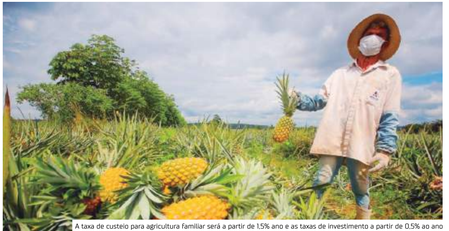
A taxa de custeio para agricultura familiar será a partir de 1,5% ano e as taxas de investimento a partir de 0,5% ao ano

No plano atual, a taxa de custeio para agricultura familiar será a partir de 1,5% ano e as taxas de investimento a partir de 0,5% ao ano. Para a agricultura empresarial a taxa de custeio começa em 6,75% ano, enquanto a taxa de investimento, em 6,48% ao ano.