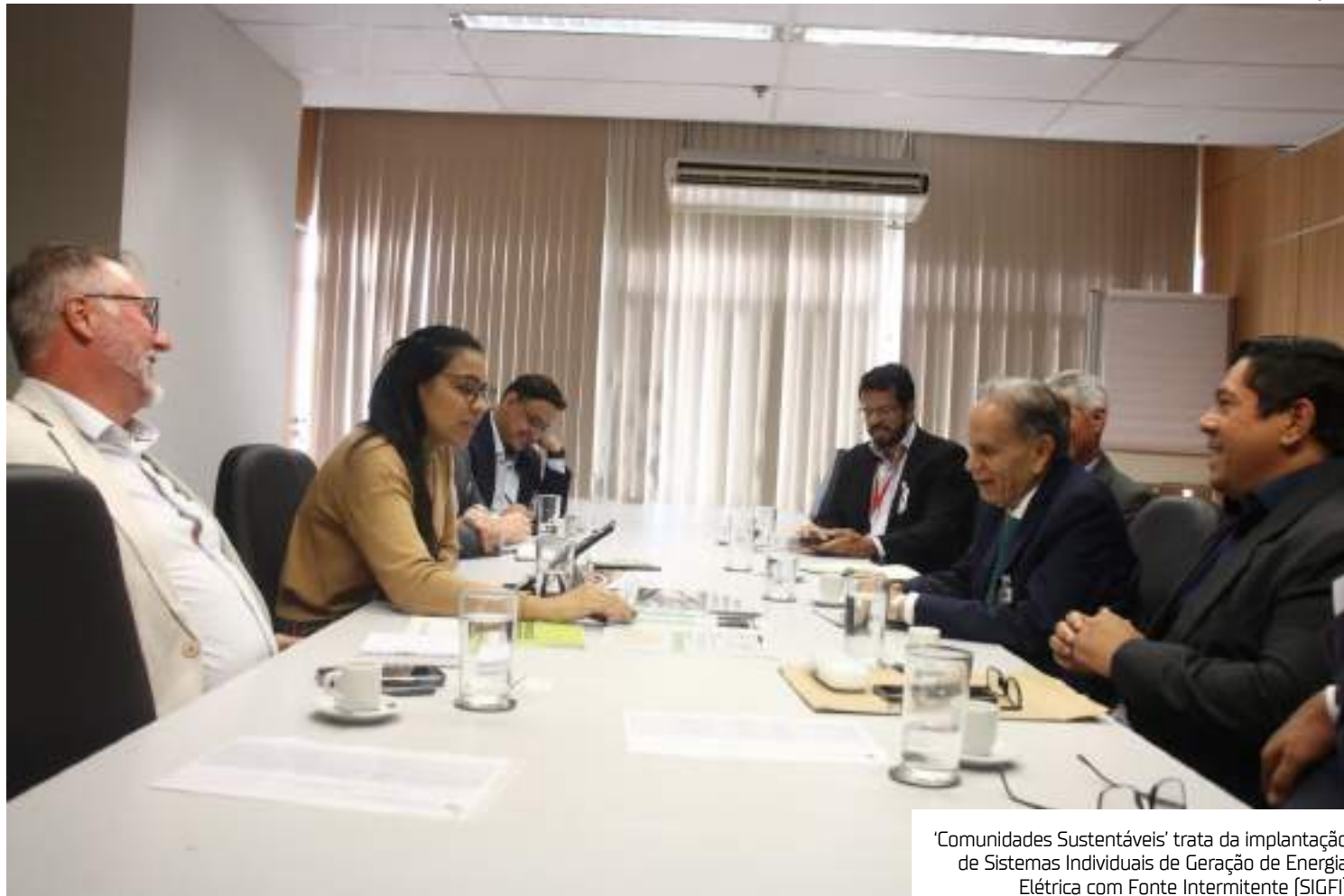
'Comunidades Sustentáveis' trata da implantação de Sistemas Individuais de Geração de Energia Elétrica com Fonte Intermitente (SIGFI)

A Ciam também apresentou o projeto Transição Energética na Mobilidade Fluvial do Ama-