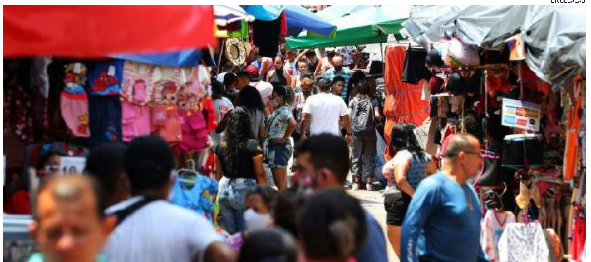
Comércio amazonense vai ter uma injeção de R$ 1 bilhão com antecipação do 13º

"Mais uma vez estamos adiantando o pagamento da primeira parcela do 13º salário. A medida, além de beneficiar diretamente nossos servidores, que ganham um acréscimo