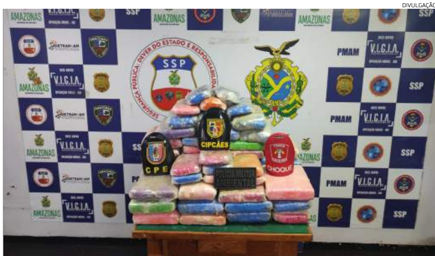
Parte da droga foi encontrada escondida em sacos com bananas e outra parte no corpo do suspeito