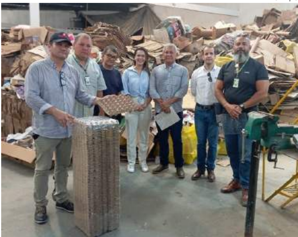
Reciclagem local é essencial para a gestão de resíduos em Tabatinga