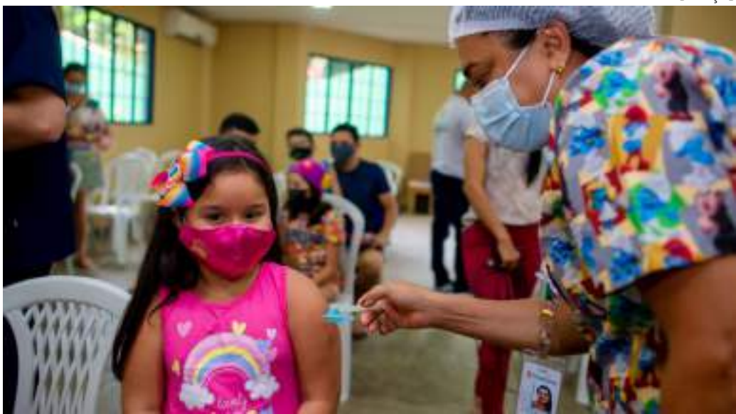
Vacina está disponível para pacientes portadores de PRR a partir de 2 anos