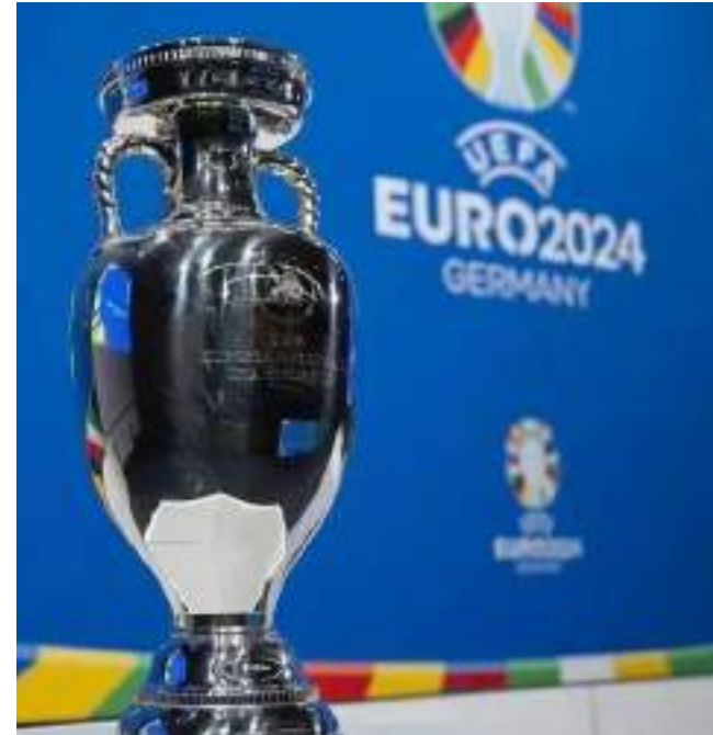
Campeão vai erguer troféu da Eurocopa em território alemão