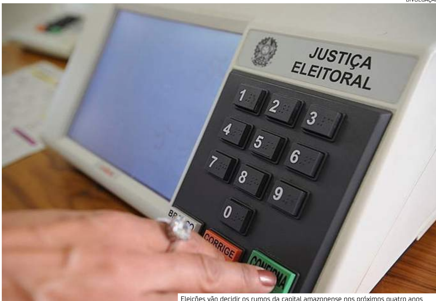
Eleições vão decidir os rumos da capital amazonense nos próximos quatro anos

Além disso, 33,3% dos entrevistados declararam ter interesse na eleição, 32,1% estão pouco interessados, 16,8% não têm interesse e 14% estão muito interessados.