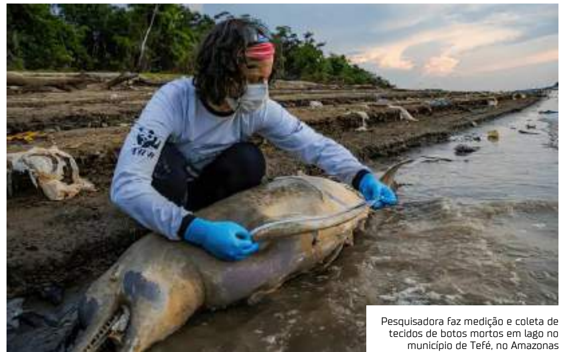
Pesquisadora faz medição e coleta de tecidos de botos mortos em lago no município de Tefé, no Amazonas

Estudos realizados pelo Mamirauá, instituição ligada ao Ministério de Ciência, Tecnologia e Inovação (MCTI), chegaram à conclusão de que os animais morreram por hipertemia, devido às al-