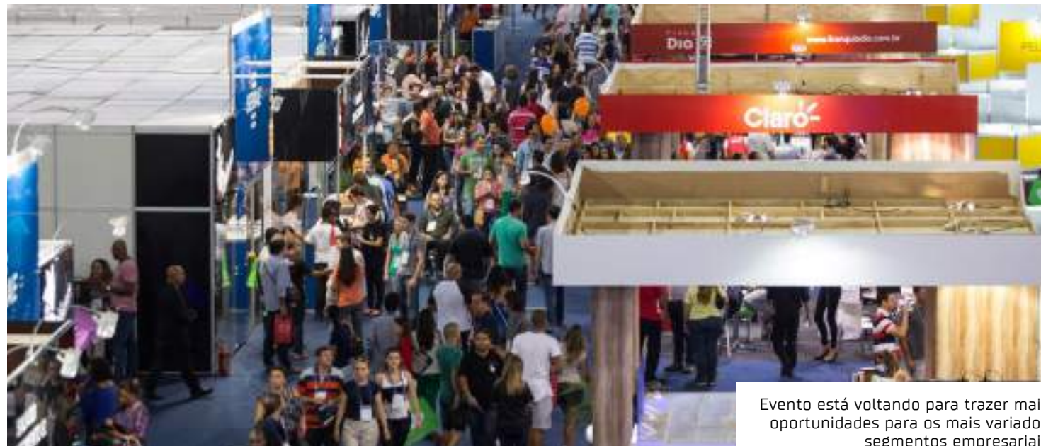
Evento está voltando para trazer mais oportunidades para os mais variados segmentos empresariais

"O Sebrae pretende trazer um evento com profundidade de abordagem dos temas voltados para o empreendedorismo e conexão por meio de atividades que estão ligadas com tudo que o mundo está discutindo e precisa discutir para que os