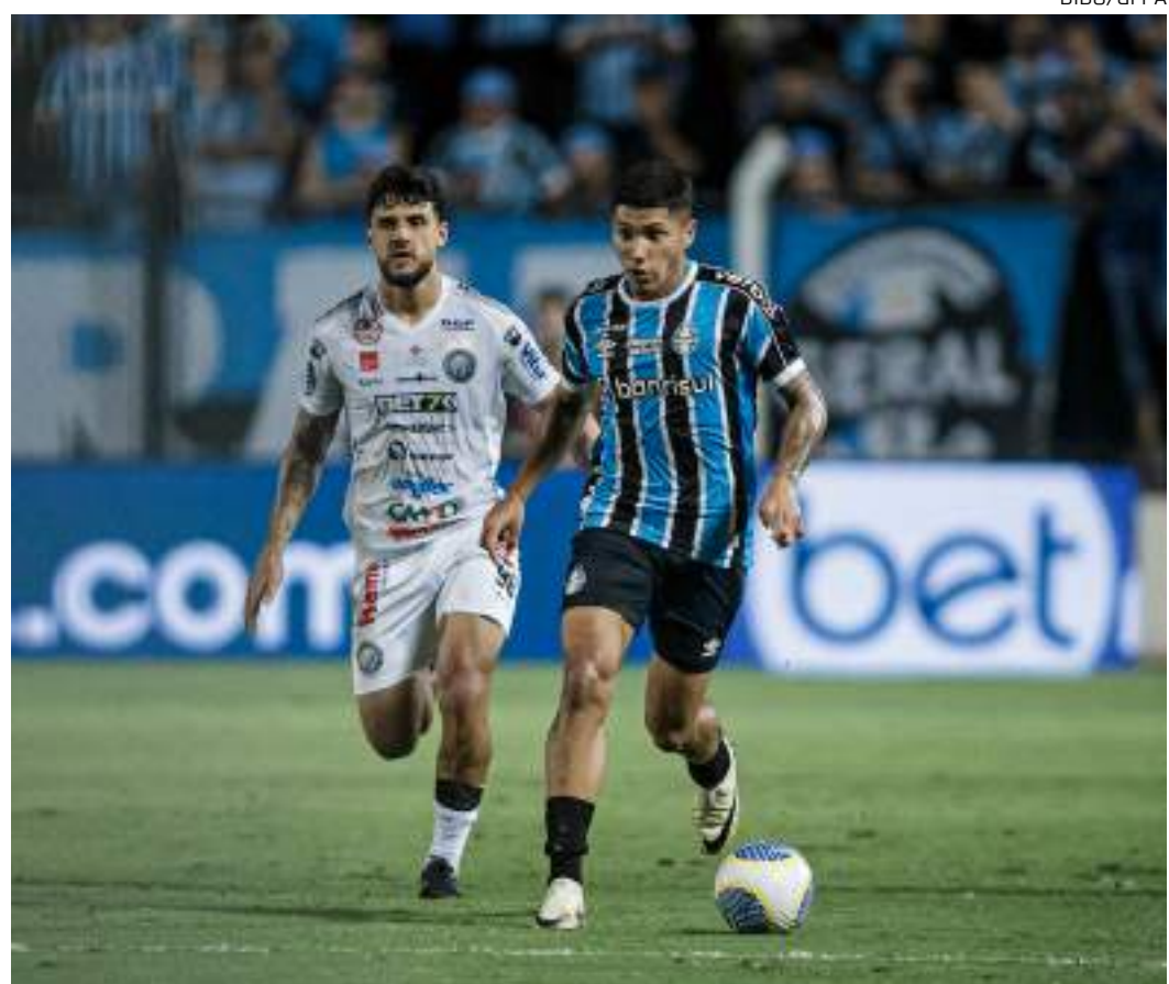
Equipes empataram sem gols no jogo de ida, disputado antes das enchentes que atingiram o RS