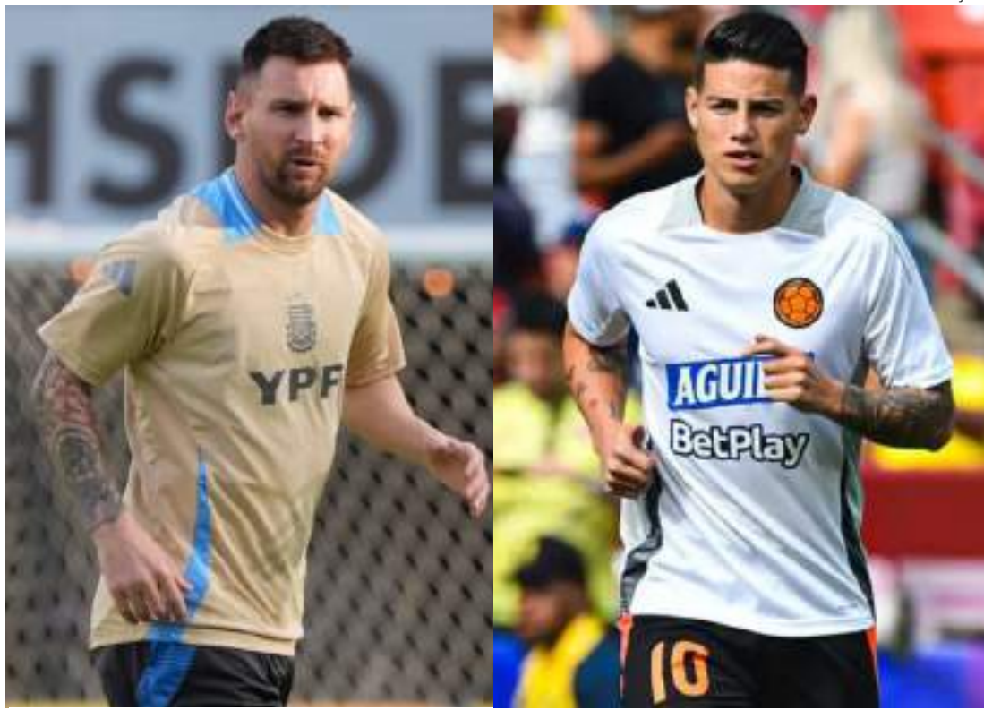
Lionel Messi e James Rodríguez, camisas 10 de Argentina e Colômbia, respectivamente, duelam pela taça

Atual campeã do mundo, Seleção Argentina pode ser bicampeã continental