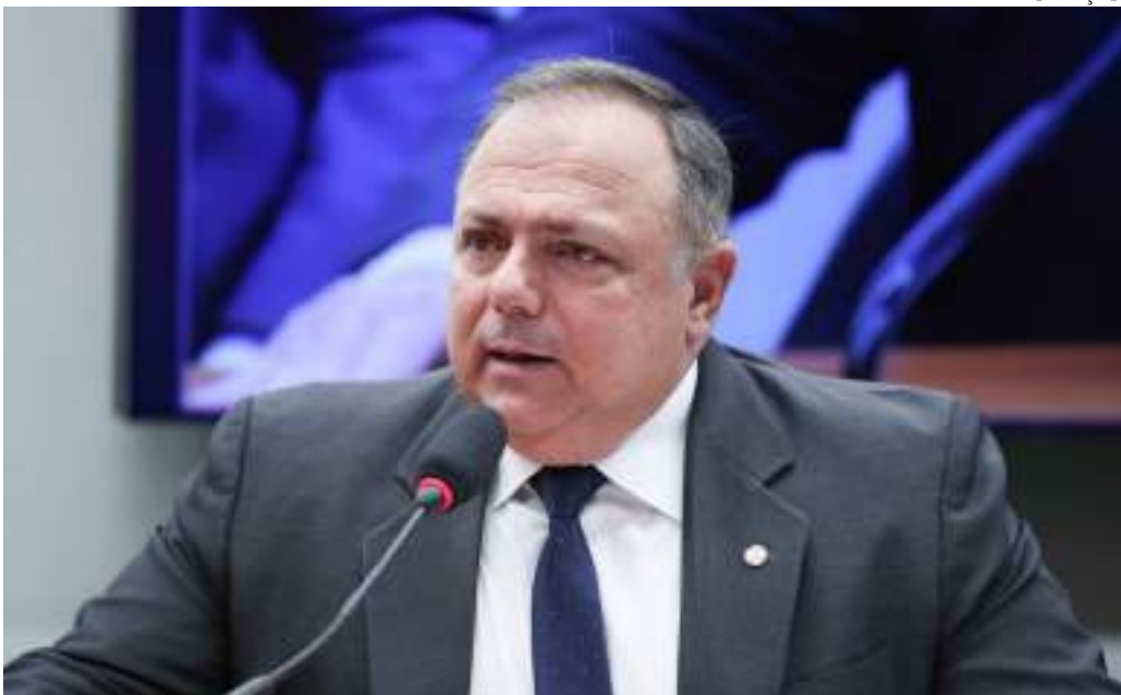
General Pazuello é o autor da proposta