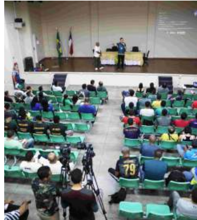
Mais de 5,4 mil alunos vão participar da 45ª edição do JEAS