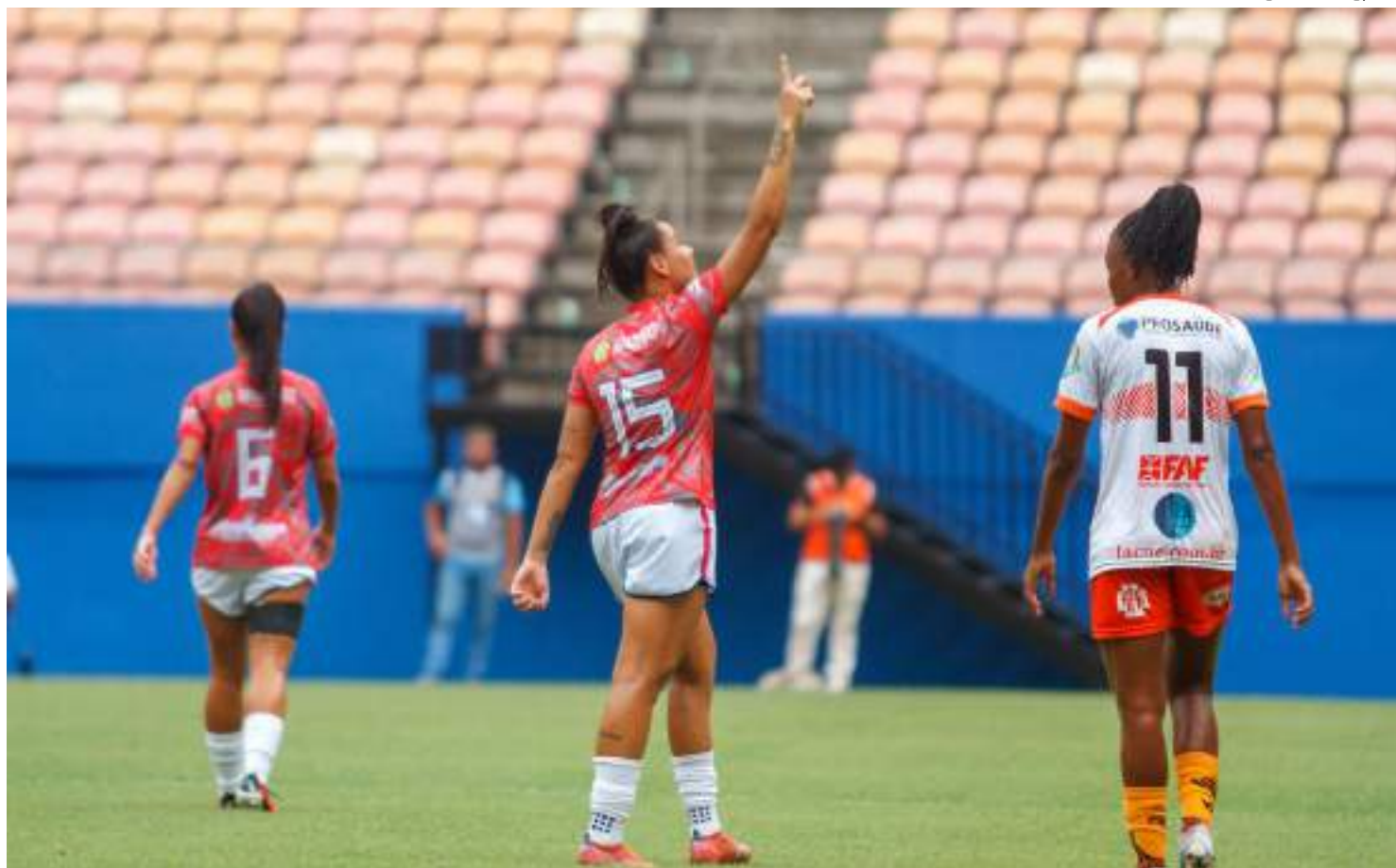
Atual campeão amazonense, o Instituto 3B - antes 3B da Amazônia - iniciou a temporada de 2024 com um novo nome e de cara nova