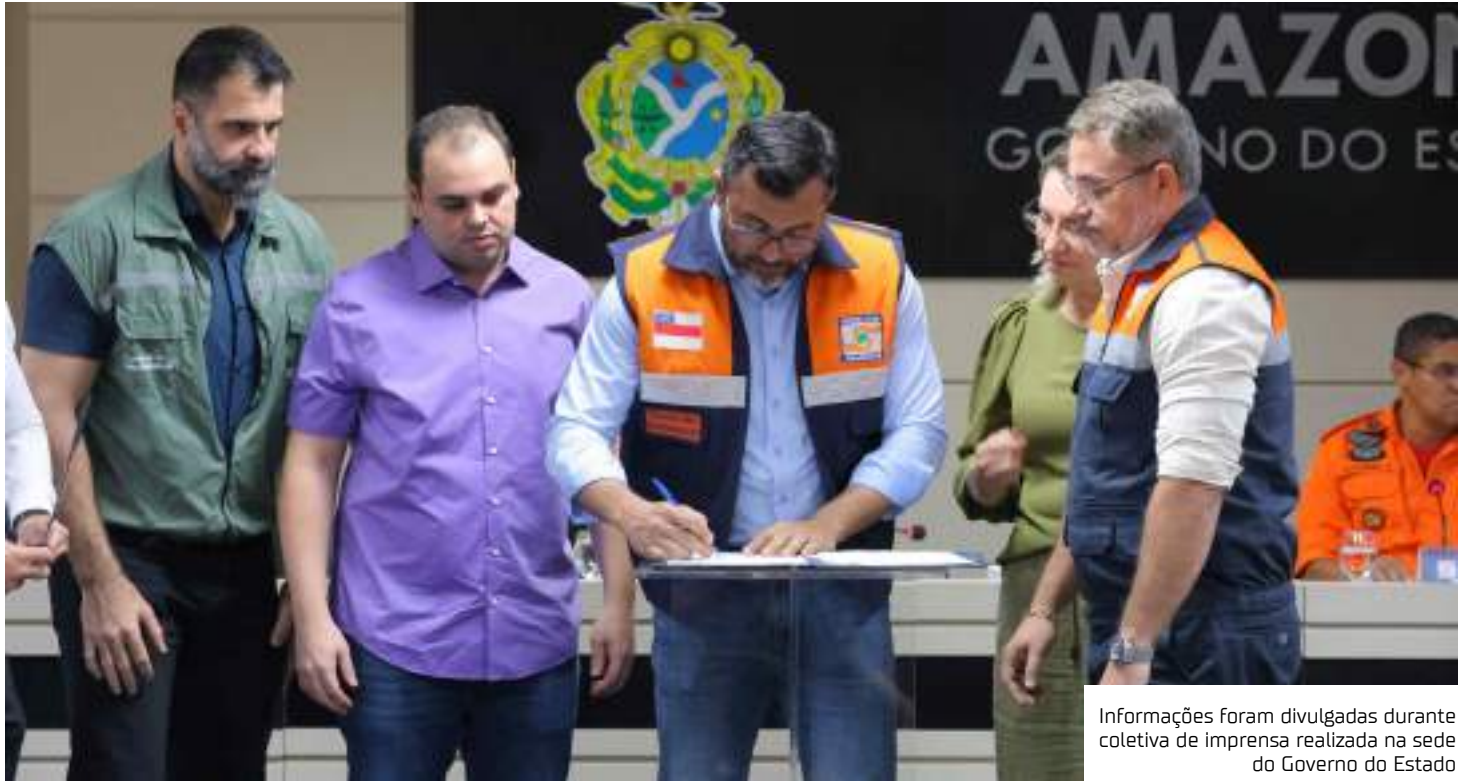
Informações foram divulgadas durante coletiva de imprensa realizada na sede do Governo do Estado

Ele destacou que o Estado tem trabalhado de forma preventiva desde o início do ano, seguindo um planejamento de medidas elaborado ainda em 2023, para que seja possível prestar assistência às populações afetadas de forma mais rápida.