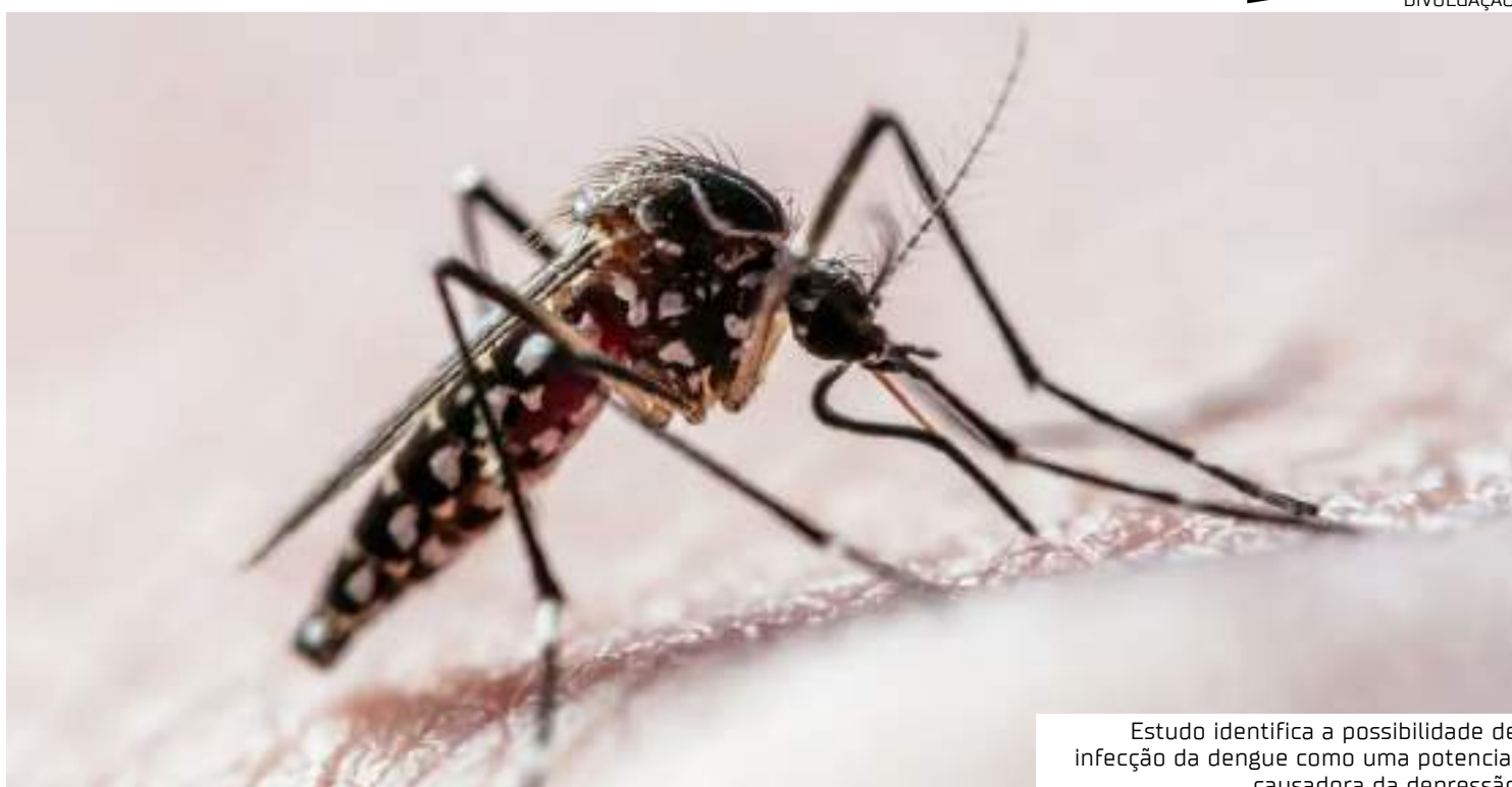
Estudo identifica a possibilidade de infecção da dengue como uma potencial causadora da depressão

Quanto aos distúrbios do sono, o risco aumentado foi observado especificamente nos três a 12 meses após a