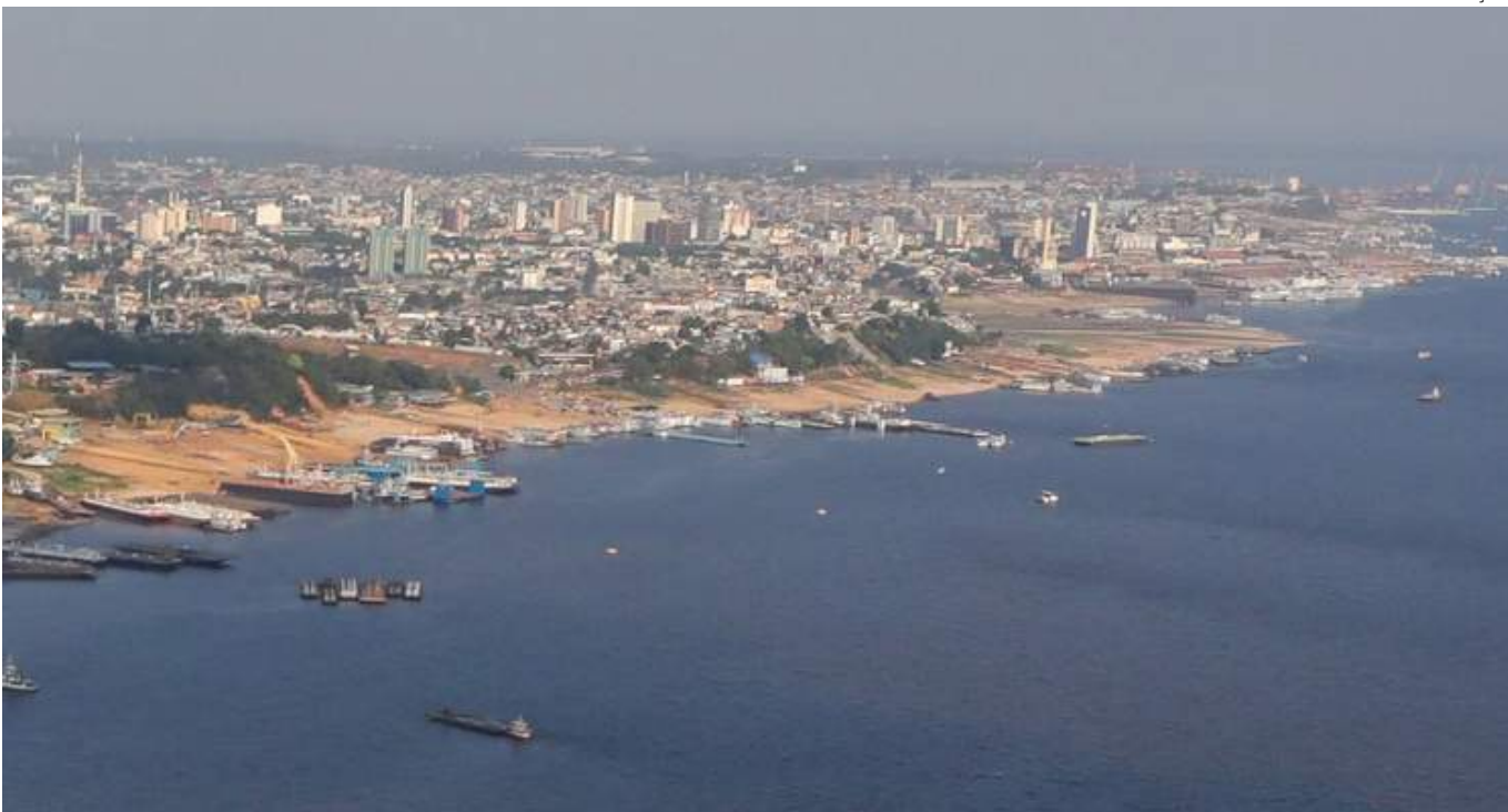
Em anos anteriores, as cotas nesse mesmo dia eram de 27,89 metros (2023); 29,59 metros (2022) e 29,87 metros (2021)