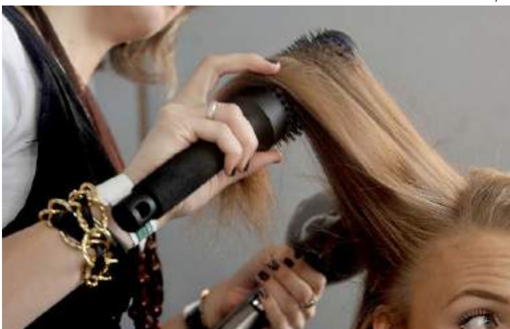
Setor de serviços foi responsável por criar vagas de emprego no Brasil