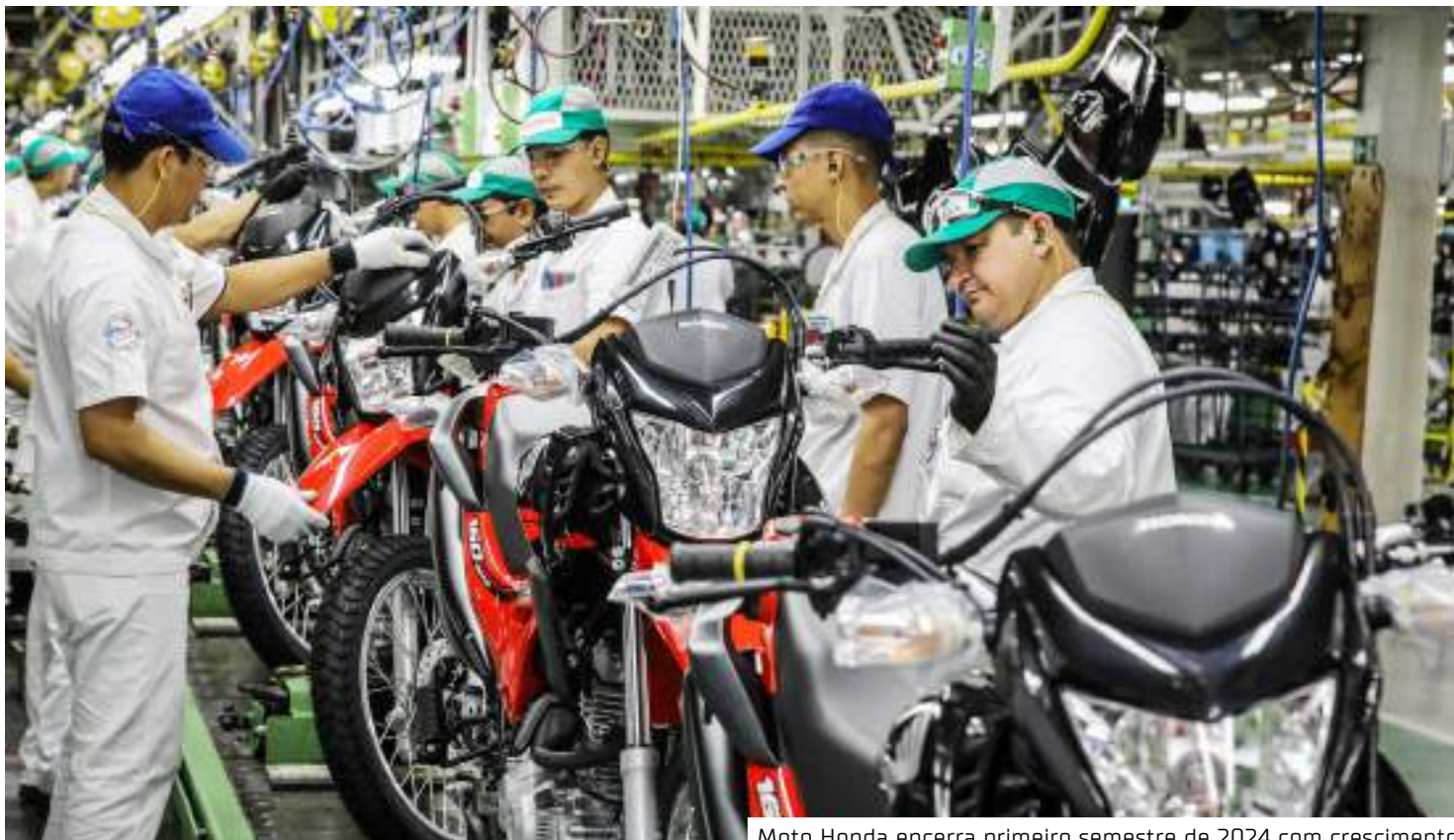
Moto Honda encerra primeiro semestre de 2024 com crescimento

Com o maior line up do mercado nacional, a Honda apresentou importantes lançamentos durante o primeiro semestre, como a nova Pop 110i ES e Elite 125, além do anúncio da nova XR 300L Tornado para continuar fortalecendo seu portfólio e atender aos