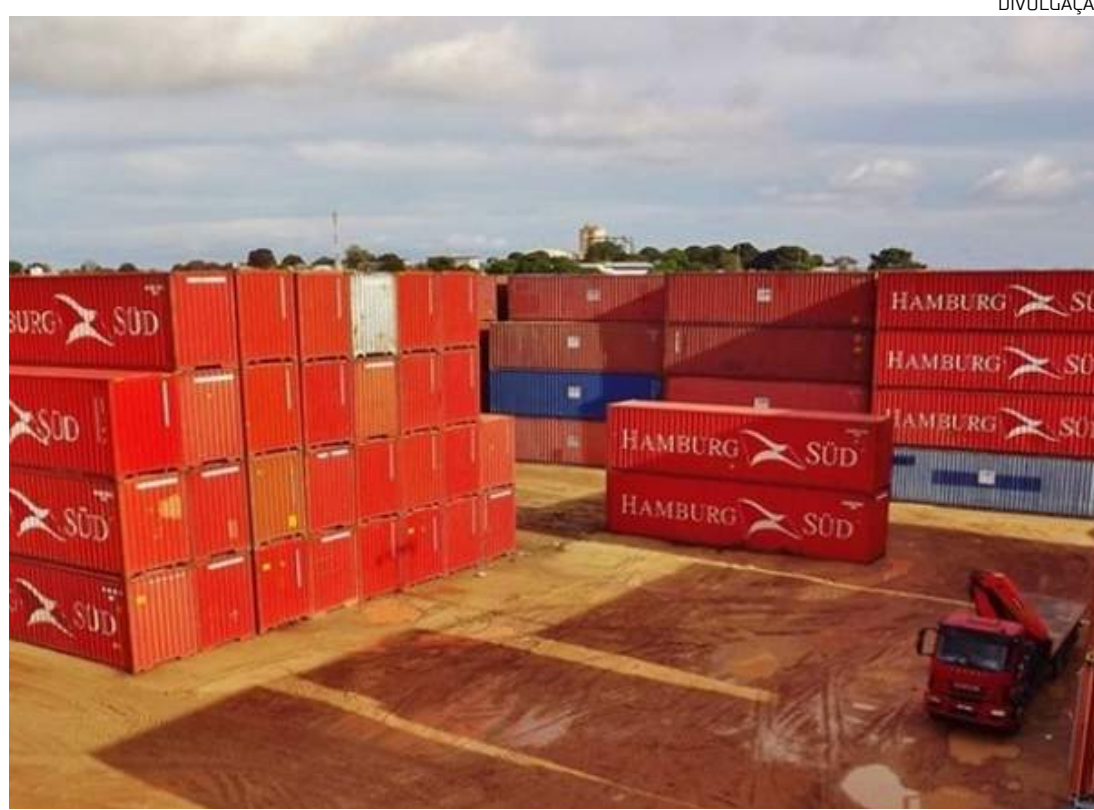
Empresas pretendem cobrar até R$ 32 mil por contêiner durante estiagem no Amazonas

Para o governador, as empresas só estão preocupadas com o lucro que garantirão no período, ignorando todo o sofrimento