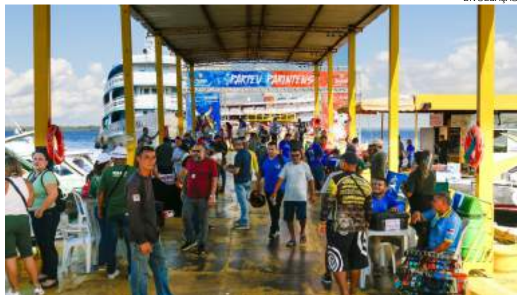
Fiscalizações aconteceram simultaneamente em Manaus e Parintins