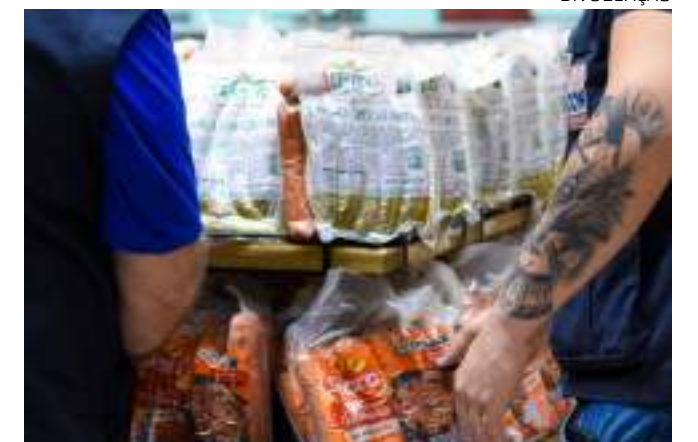
Itens foram encontrados fora da validade e mal refrigerados