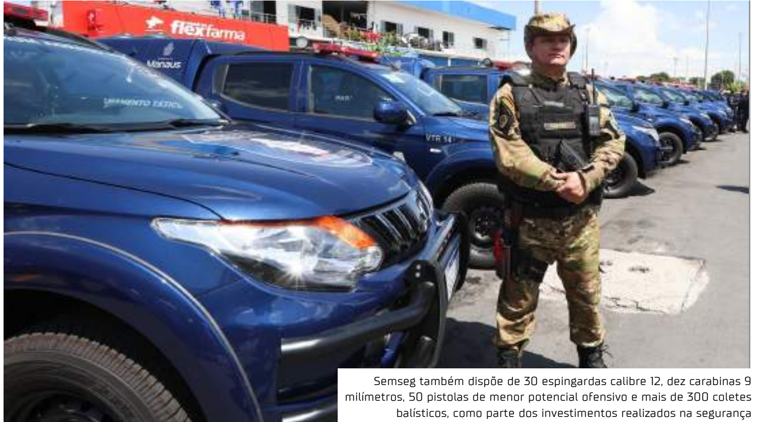
Semseg também dispõe de 30 espingardas calibre 12, dez carabinas 9 milímetros, 50 pistolas de menor potencial ofensivo e mais de 300 coletes balísticos, como parte dos investimentos realizados na segurança

Durante o evento, também foi apresentado um balanço dos investimentos realizados na área da saúde, onde os recursos disponibilizados por meio de emenda parlamentar do senador Eduardo Braga somam R$ 106,2 milhões. O