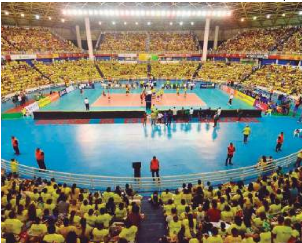
Partida entre Minas, campeão da Superliga, e Praia Clube, campeão da Copa Brasil, será em Manaus