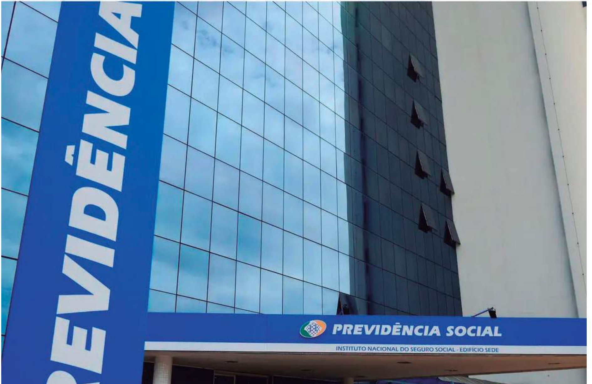
Segundo a assessoria do INSS, o "dispositivo irregular" foi detectado no fim de junho, por uma equipe da Diretoria de Tecnologia da Informação do próprio instituto

Ainda de acordo com a assessoria do INSS, a instalação irregular do dispositivo causou "um comportamento estranho à rede", mas, até o momento, não foram identificados indícios de vazamento de informações ou comprome-