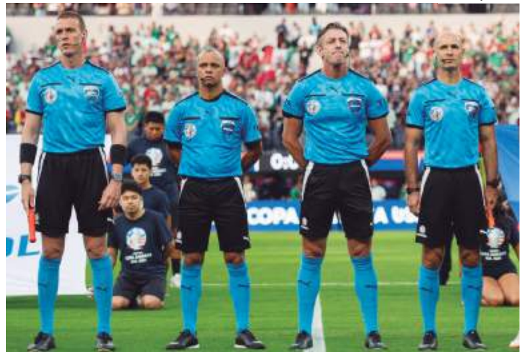
Raphael Claus será o árbitro da decisão; partida será no domingo (14), às 20h, em Miami