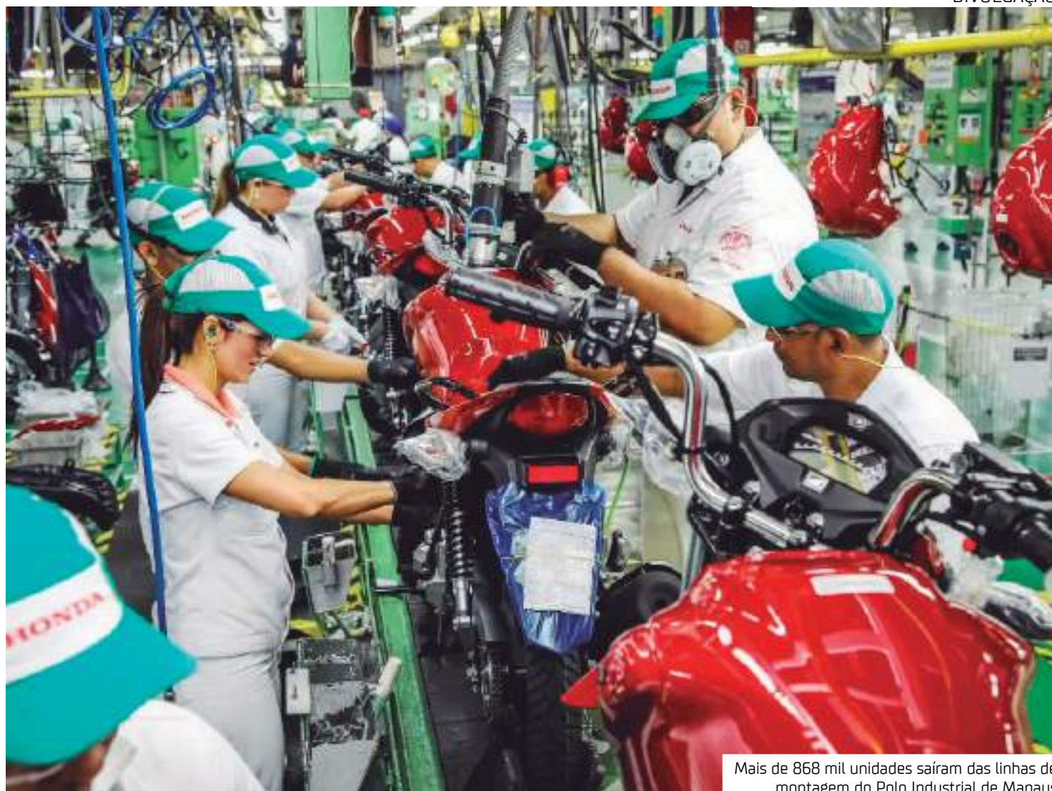
Mais de 868 mil unidades saíram das linhas de montagem do Polo Industrial de Manaus

Os modelos de baixa cilindrada lideraram o ranking de emplacamentos, com 80% do mercado. Em segundo lugar, ficaram as motocicletas de média