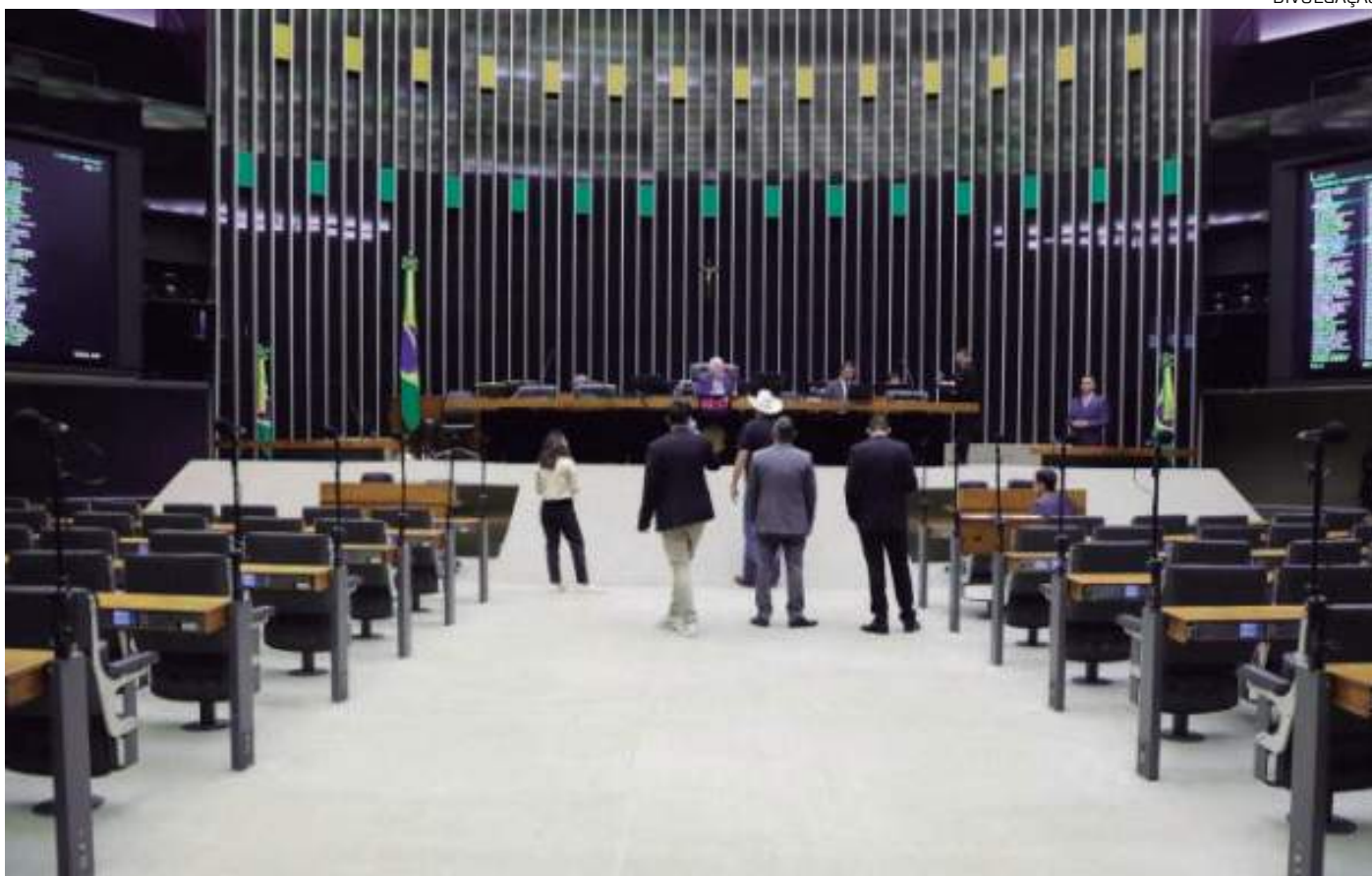
PEC aprovada segue agora para apreciação no Senado

A PEC aprovada acrescenta um parágrafo ao Artigo nº 166 da Constituição, que normatiza a tramitação de projetos de Lei relativos ao plano plurianual, às diretrizes orçamentárias, ao orçamento anual e aos créditos adicionais nas duas casas do Congresso Nacional.