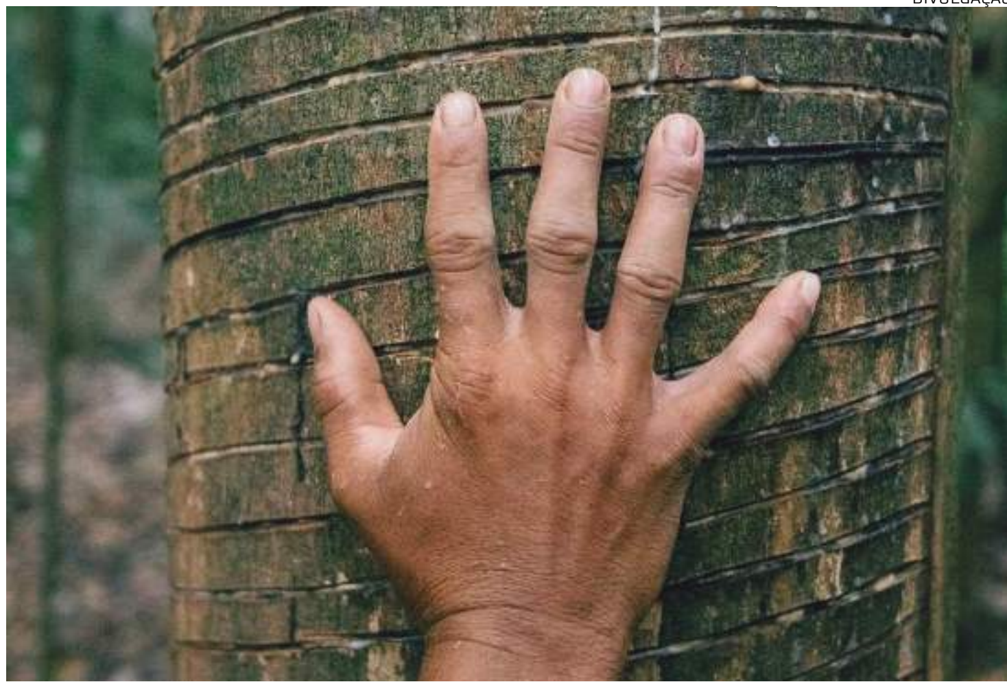
Dois conselhos se solidarizaram com reivindicações dos servidores e apelam ao Governo Federal para que reabra negociações com entidades

com os impactos dessa paralisação em relação às comunidades tradicionais extrativistas e pescadores artesanais, que dependem das ações dos órgãos ambientais.