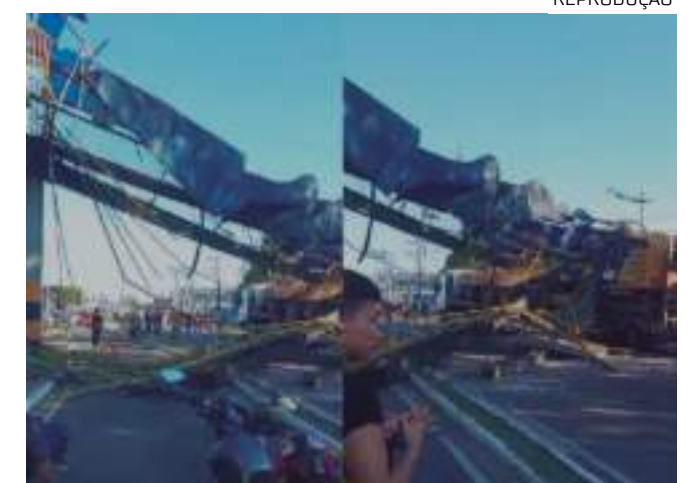
Estrutura já foi removida pela Prefeitura de Manaus