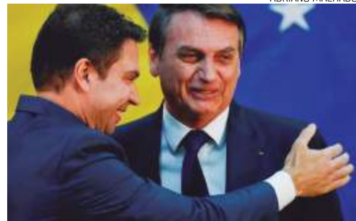
Reunião entre Ramagem e Bolsonaro teria sido registrada em áudio

Os policiais ainda afirmaram que produção e disseminação de desinformação por policiais federais, enquanto atuavam em estruturas de alta administração,