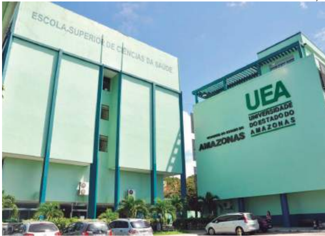
UEA informou que inseto na comida, possivelmente, foi resultado de uma contaminação mecânica

Em ocasiões recentes, os estudantes reclamaram que encontraram insetos e cabelos, além de alimentos impróprios para consumo, como pão mofado e comidas