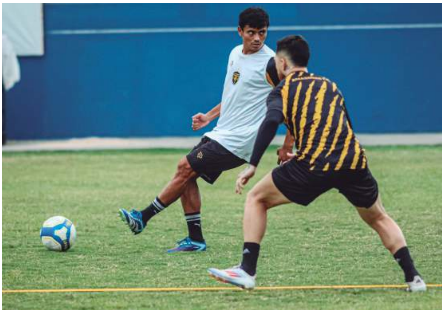
Elenco aurinegro realizou seu único treino em Manaus antes do embarque para Ribeirão Preto (SP) no Estádio Carlos Zamith