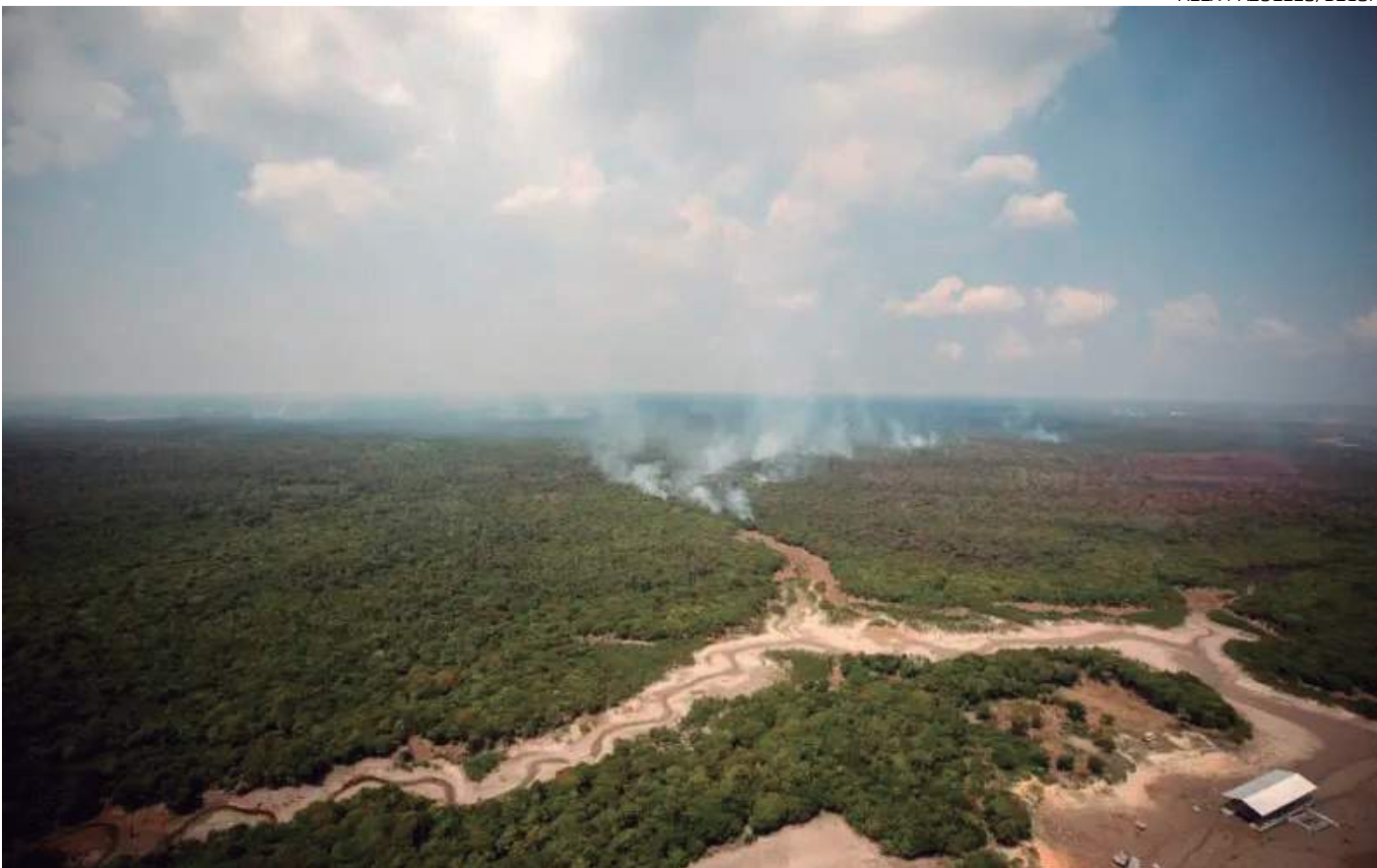
Objetivo foi debater medidas que podem ser implementadas para que segundo semestre do ano feche com menos ocorrências