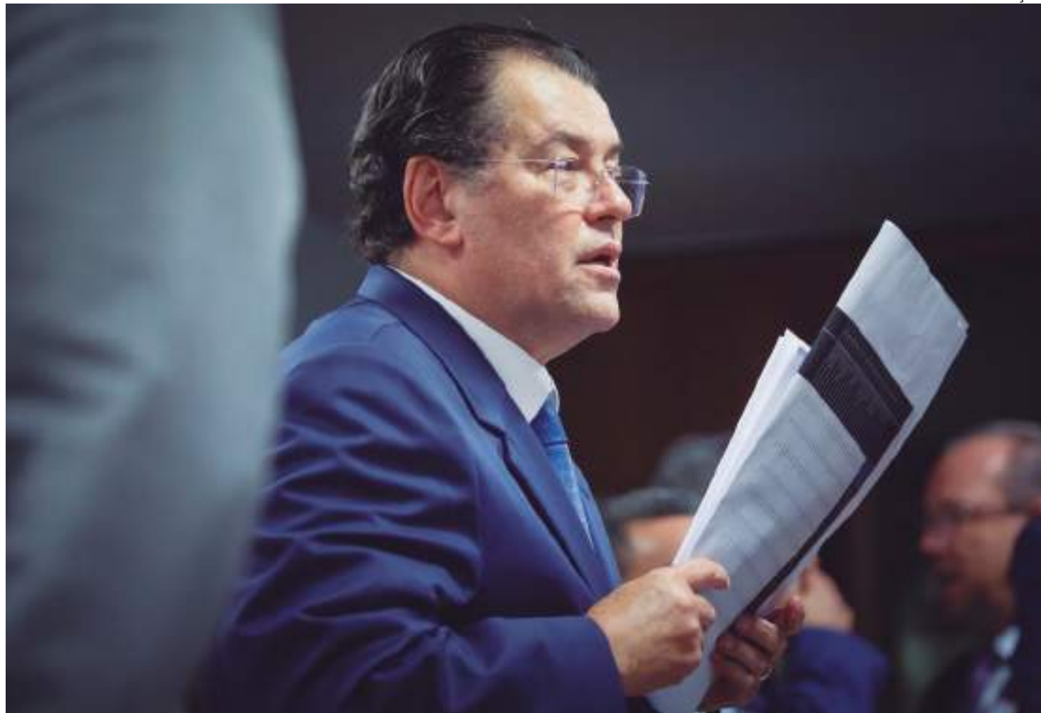
Eduardo Braga será relator da proposta de regulamentação da reforma tributária no Senado

"Como relator da regulamentação da reforma tributária, fiz um apelo ao presidente Rodrigo Pacheco para que o texto aprovado pela Câmara não tramite em regime de urgência constitucional. Para que, assim, posamos estabelecer um calendário que viabilize a realização de audiências públicas, ouvindo