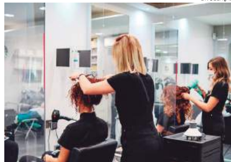
Setor de serviços foi destaque no Amazonas