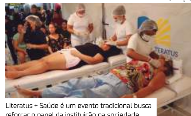
Literatus + Saúde é um evento tradicional busca reforçar o papel da instituição na sociedade