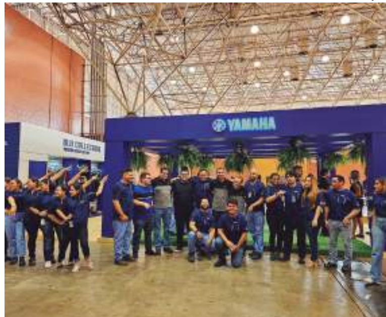
Visitantes poderão conferir os espaços das organizações participantes do PQA