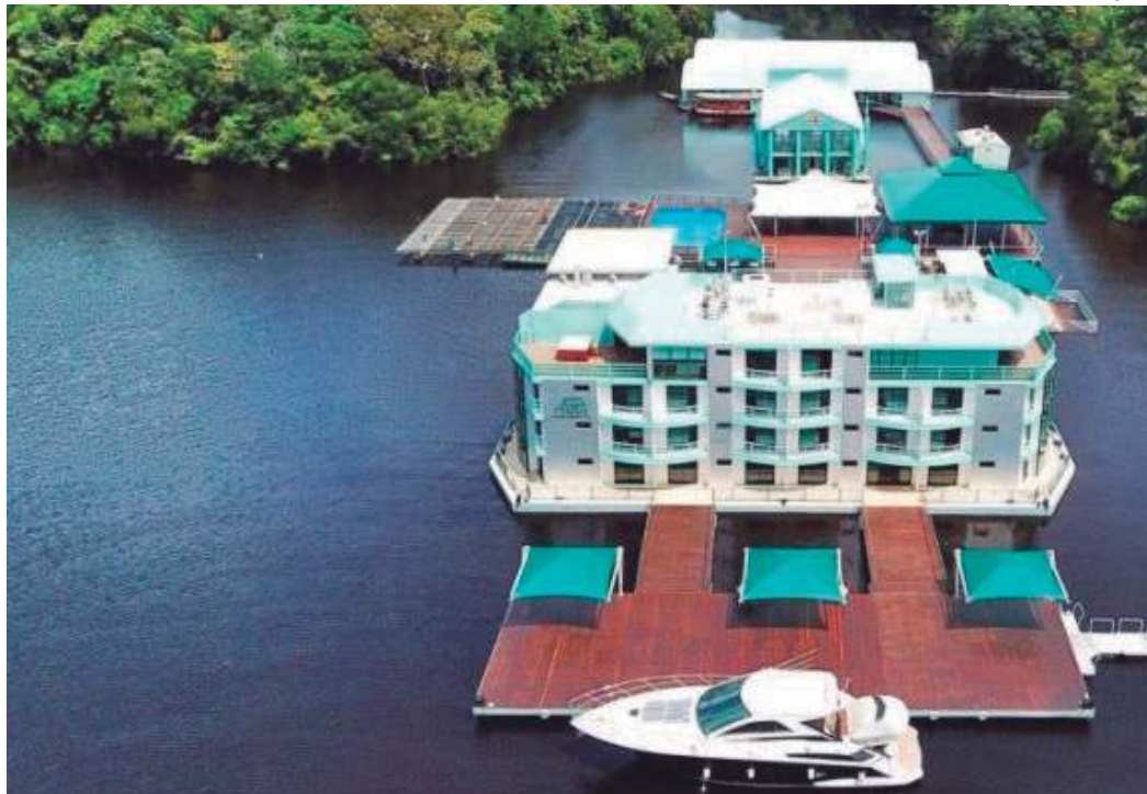
No dia 20 de julho, o resort receberá torcedores e admiradores para comemorar o tricampeonato