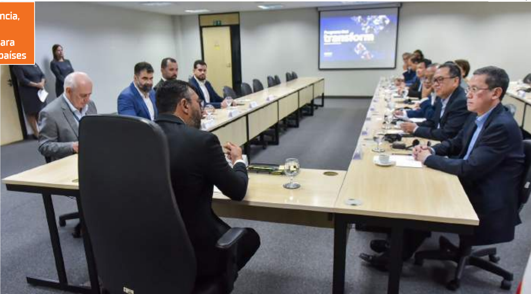
Secretários reforçaram a importância de políticas públicas voltadas para a educação e economia sustentável