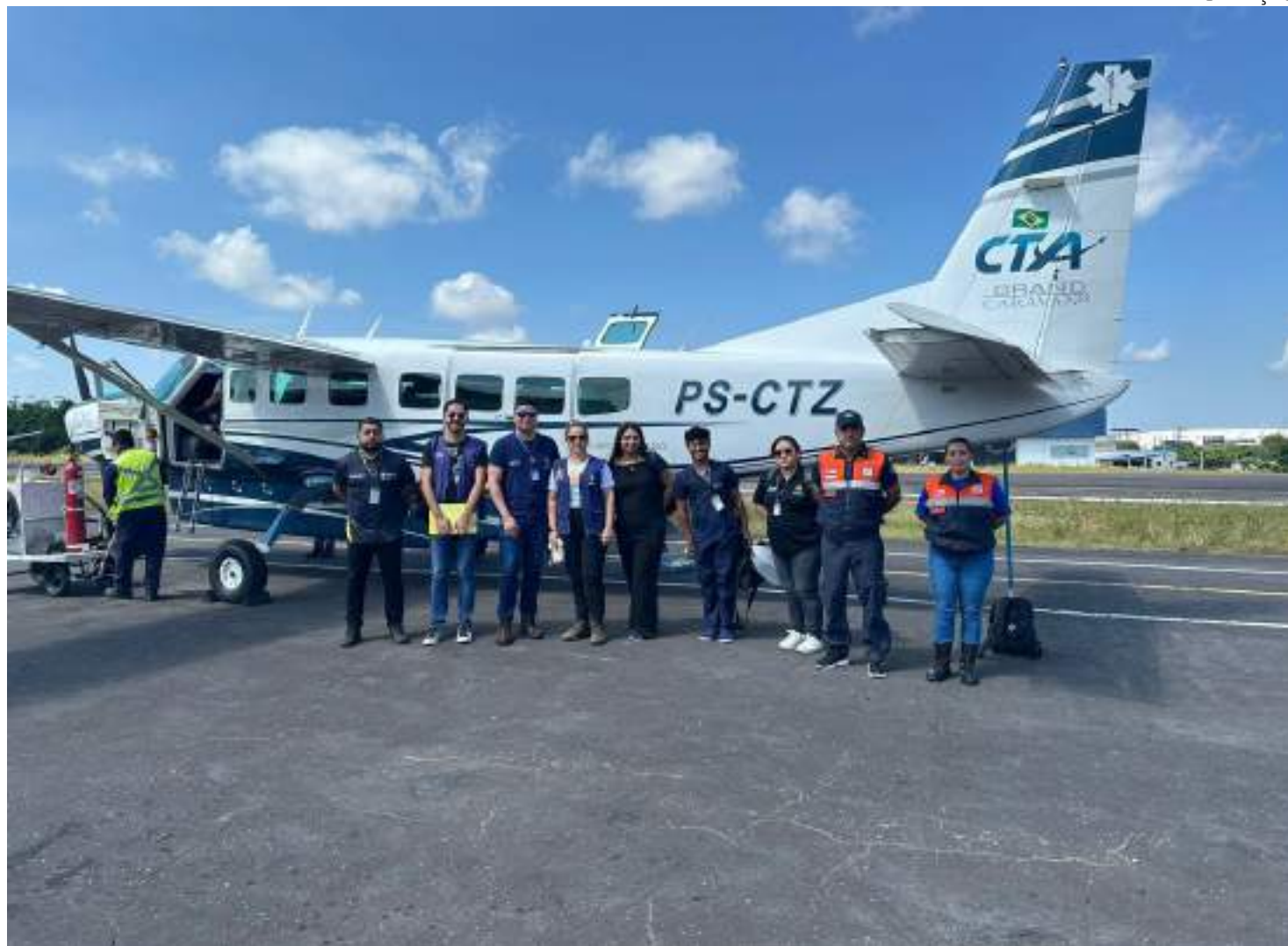
Por determinação do governador Wilson Lima, uma força tarefa foi montada para atender as vítimas do incêndio

vidores da Defesa Civil, Sejusc e Seas estão no município para colaborar com as autoridades municipais, levando suprimentos e assistência imediata, com apoio psicossocial, além de levantar as necessidades dos atingidos.