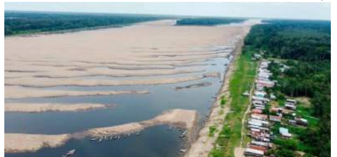
Rio Negro durante estiagem histórica em 2023