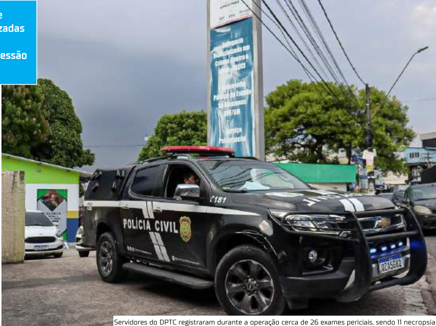
Servidores do DPTC registraram durante a operação cerca de 26 exames periciais, sendo 11 necropsia

Durante os 32 dias de operação foram realizadas