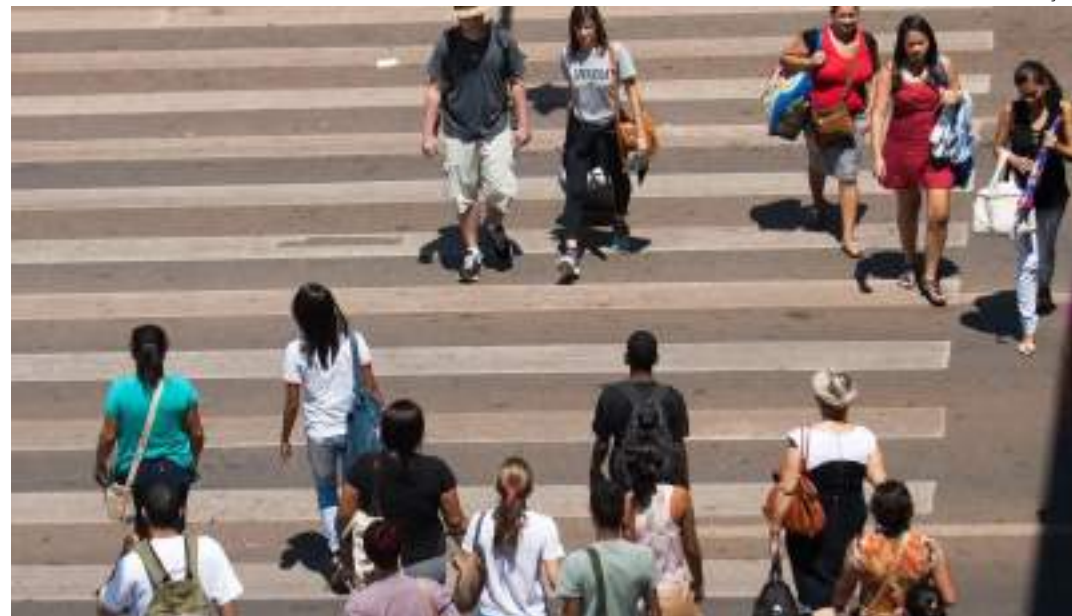
Levantamento foi feito pela Febraban com 2 mil pessoas

A pesquisa também indicou que, para 42%, a vida pessoal e familiar está igual ao ano passado, enquanto 39% avaliam que está melhor. A percepção de piora oscilou de 17% para 19% entre abril e julho. Para 67%, a vida pessoal e familiar irá melhorar no restante de 2024. Pelo menos 38% disseram que estarão menos endividados este ano do que estavam em 2023 e 36% não veem perspectiva de alteração no endividamento. Já 23% pensam que estarão mais endividados.