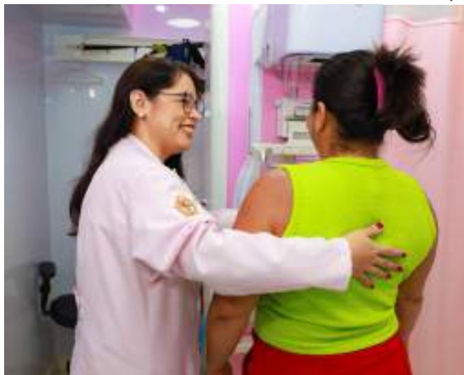
Voltadas à população feminina, estruturas móveis ofertam serviços e procedimentos da atenção primária à saúde

Campo do Teixeira - Jorge Teixeira. De 15/7 a 26/7