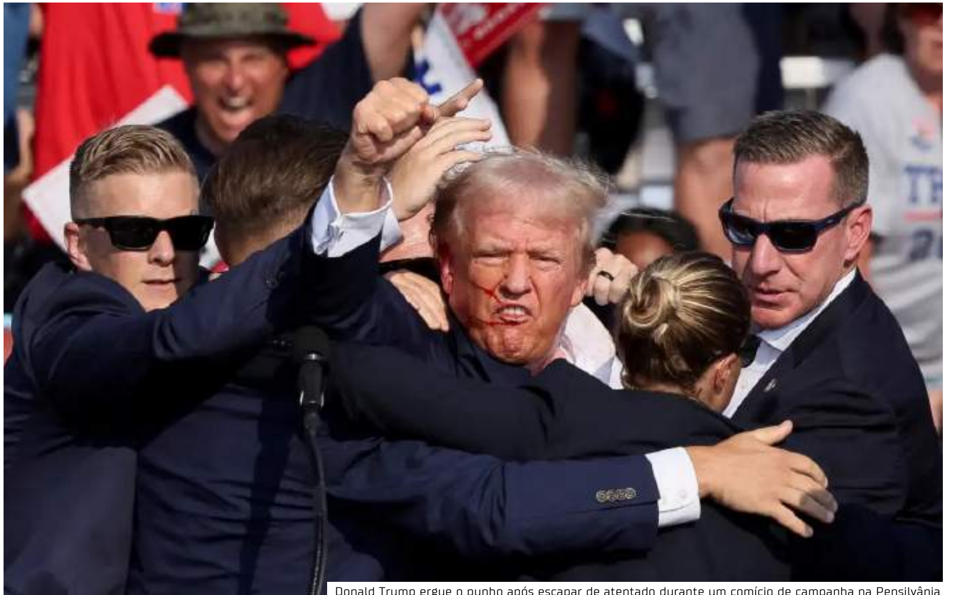
Donald Trump ergue o punho após escapar de atentado durante um comício de campanha na Pensilvânia

No sábado, logo após o crime, o ex-mandatário