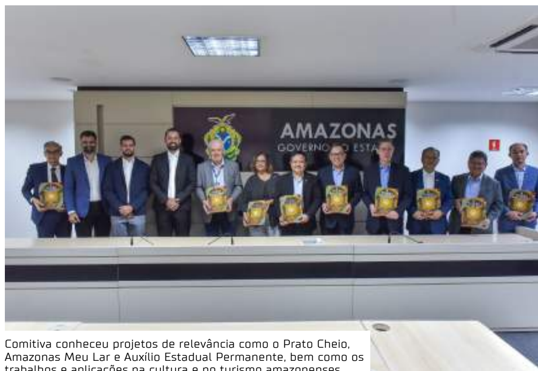
Comitiva conheceu projetos de relevância como o Prato Cheio, Amazonas Meu Lar e Auxílio Estadual Permanente, bem como os trabalhos e aplicações na cultura e no turismo amazonenses