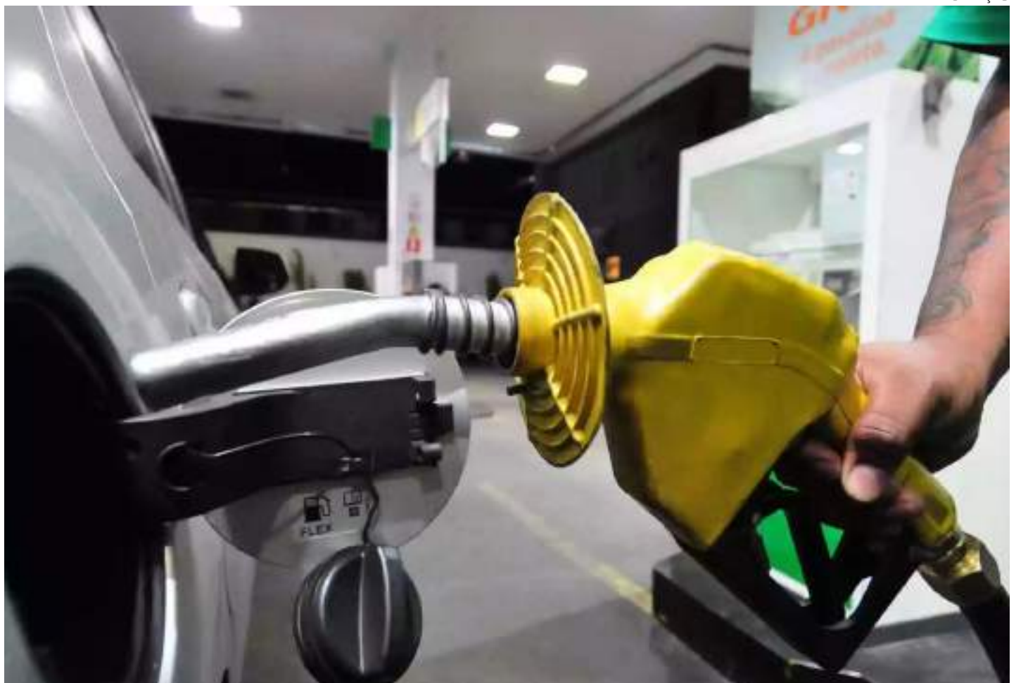
Postos de combustíveis vendem gasolina a R$ 6,89

O órgão realizou, na segunda-feira (15), duas fiscalizações em postos distintos e, ao longo da semana, irá realizar outras com intuito de mapear o mercado e proteger o consumidor.