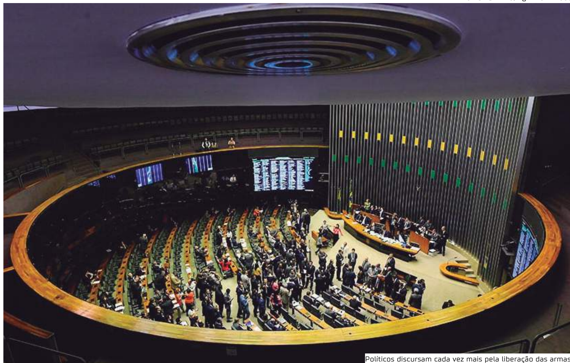
Políticos discursam cada vez mais pela liberação das armas

No período de 2015 a 2018, foram 272 discursos sobre armamento, dos quais 198 foram a favor da ampliação do acesso a armas (73%), 65 contra (24%) e nove neutros (3%). Segundo a coordenadora de Pesquisa do Instituto Fogo Cruzado,