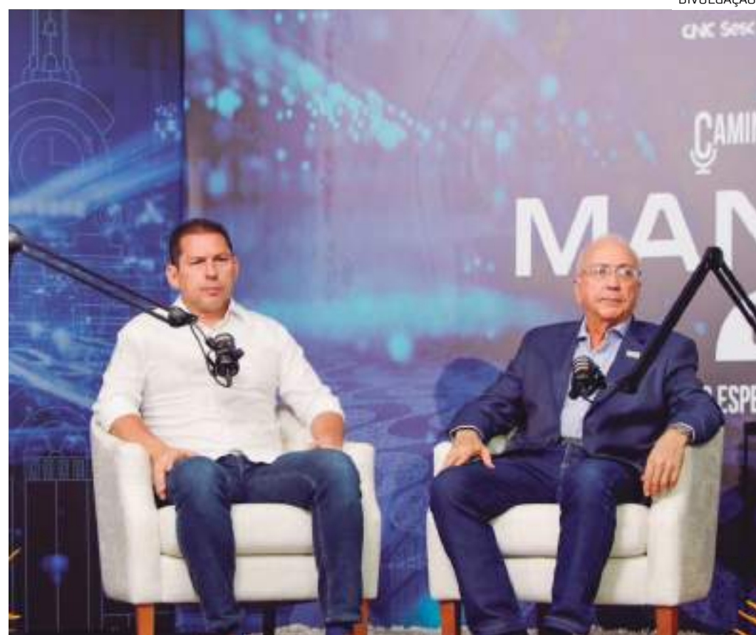
Pré-candidato foi o primeiro entrevistado da edição do podcast "Caminhos do Comércio"

"Na UBS não pode faltar remédio. Se faltar o medicamento, o hipertenso vai enfartar e precisará de tratamento em alta complexidade. O médico vai voltar a fazer visita domiciliar", disse.