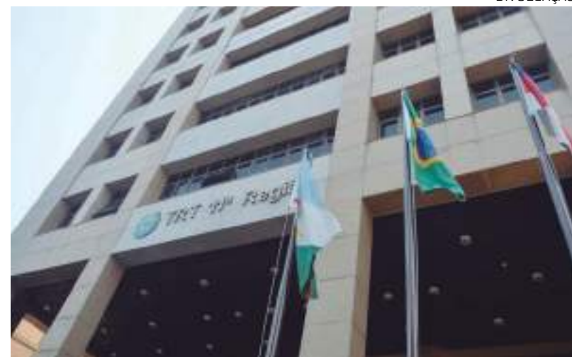
Tribunal Regional do Trabalho da 11ª Região em Manaus