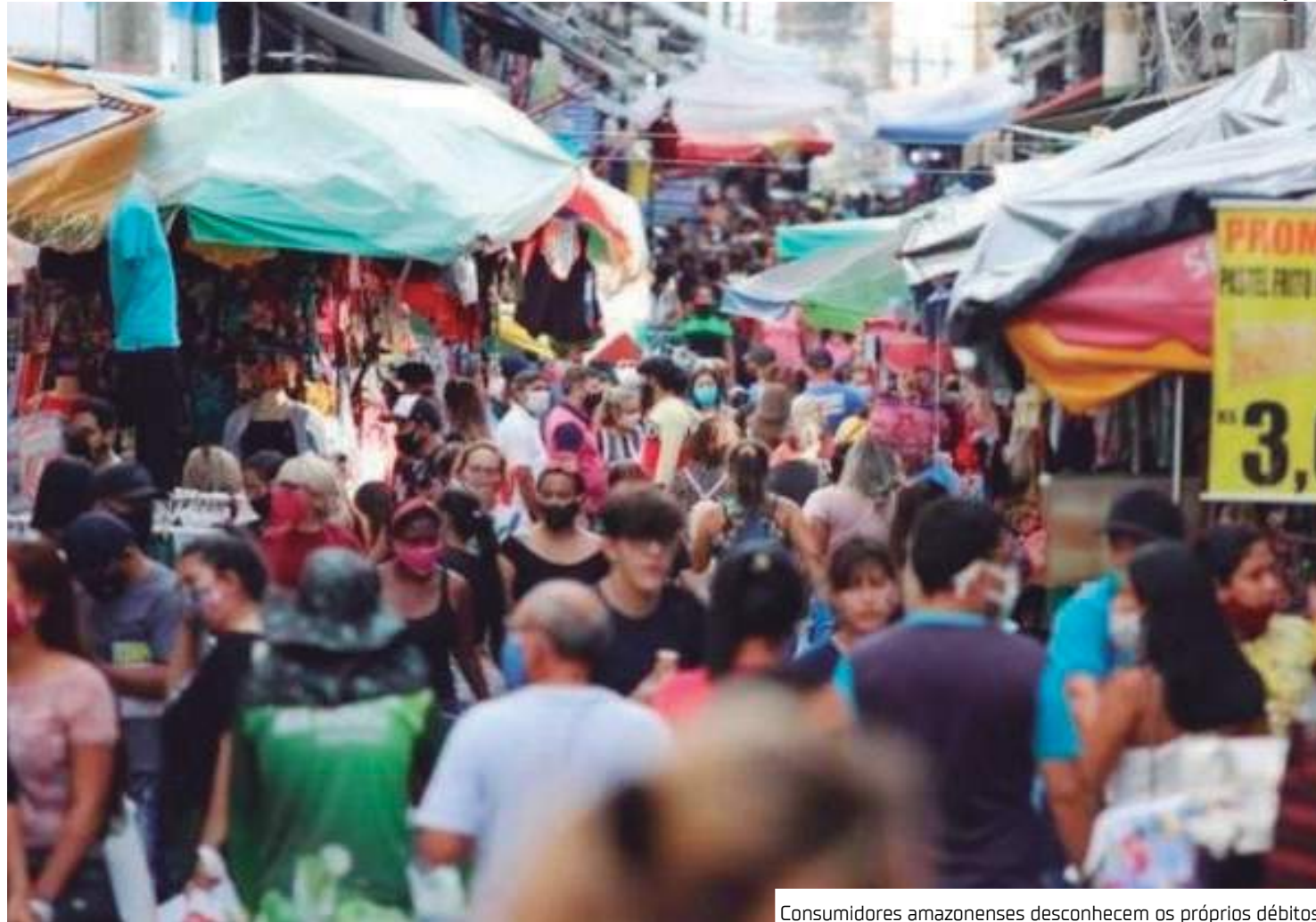
Consumidores amazonenses desconhecem os próprios débitos

Na mesma linha, o volume das dívidas também diminuiu: em comparação