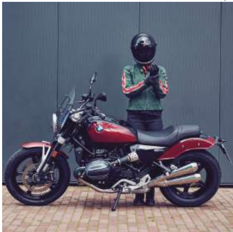
BMW R 12 começou a ser fabricada na fábrica do BMW Group em Manaus