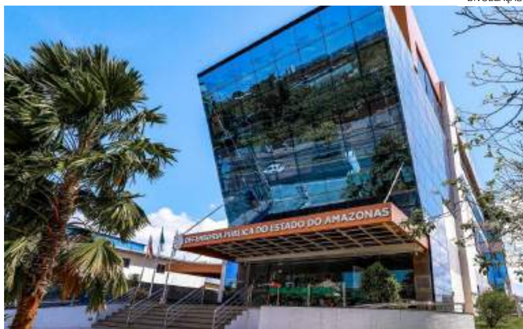
Estágio de 20h semanais na capital oferta bolsa de R$ 979 e vale-transporte de R$ 198