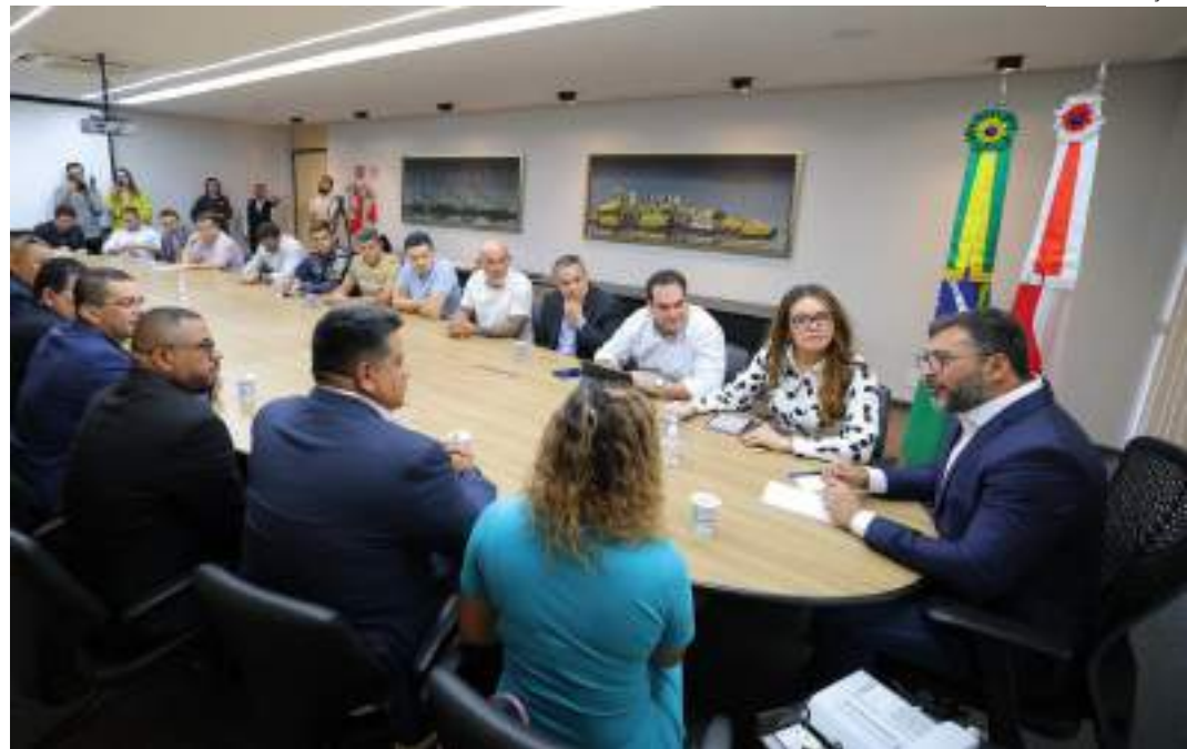
Concessões alcançam mais de 20 mil servidores ativos, aposentados e pensionistas