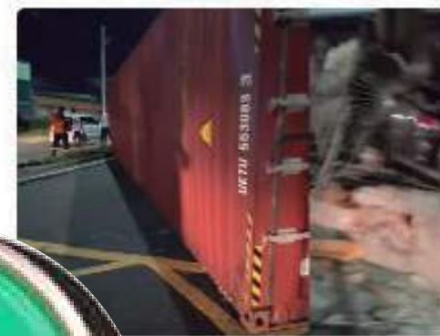
Truck tomba e atinge casa e carros na Manaus; VÍDEO