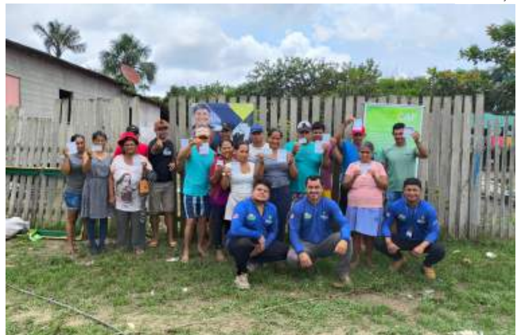
Agricultores familiares e a associação da qual eles fazem parte poderão participar de editais do FPS