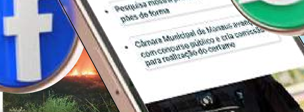
Bombeiros impedem propagação de incêndio em área de vegetação no interior do AM