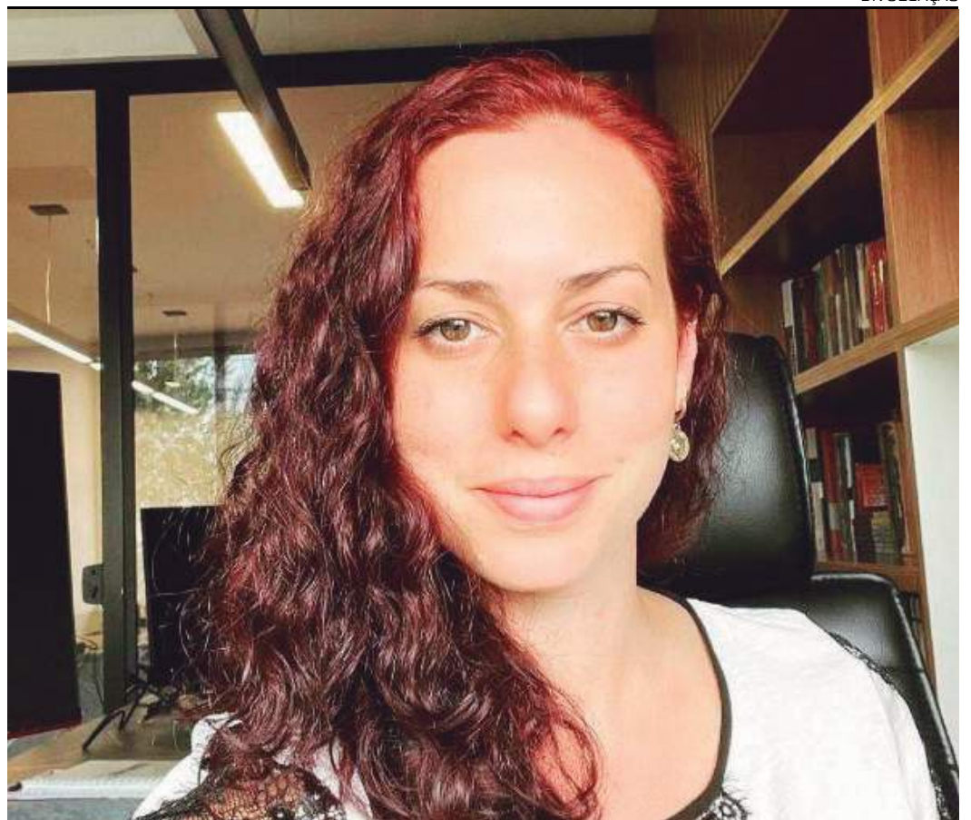
Caso oficializada, a pré-candidata será a única mulher a concorrer ao cargo de prefeita