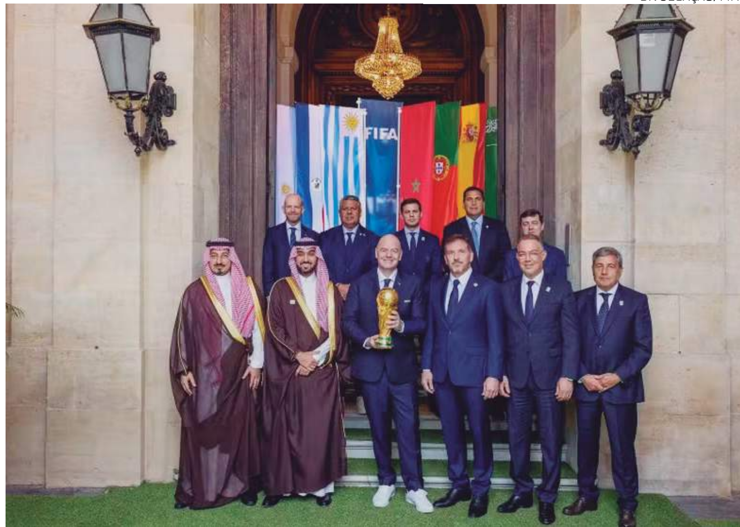
Caso as exigências sejam atendidas, a confirmação das sedes de 2030 e 2034 sairá no fim do ano

Do outro lado, os presidentes das Associações de Futebol da Argentina, Paraguai e Uruguai, jun-