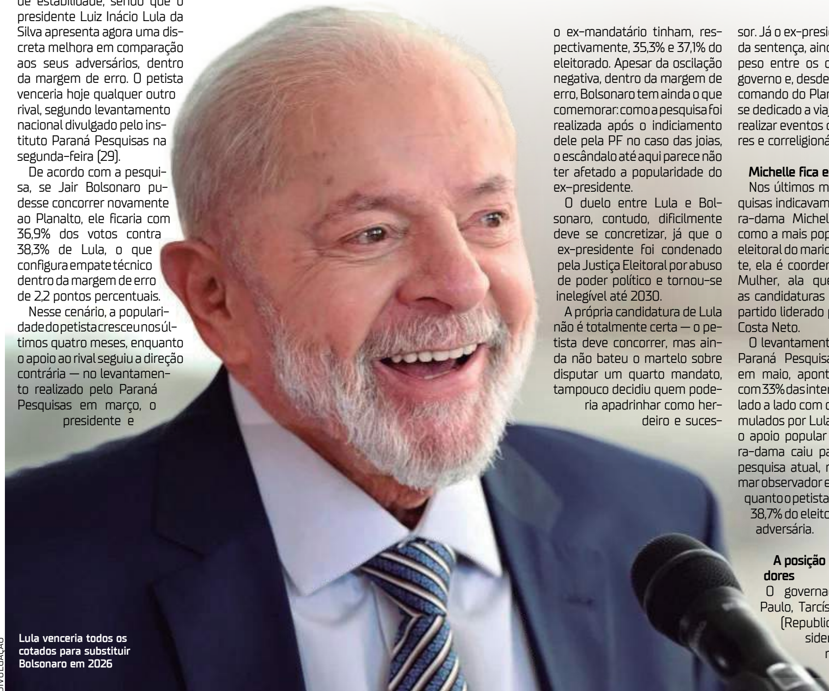
Lula venceria todos os cotados para substituir Bolsonaro em 2026

O instituto Paraná Pesquisas entrevistou 2.026 eleitores em 164 municípios, distribuídos por todos os estados e Distrito Federal, entre os dias 18 e 22 de julho de 2024. O grau de confiança do levantamento é de 95% e a margem de erro é estimada em 2,2 pontos percentuais para mais ou para menos nos resultados gerais, variando conforme a estratificação regional.