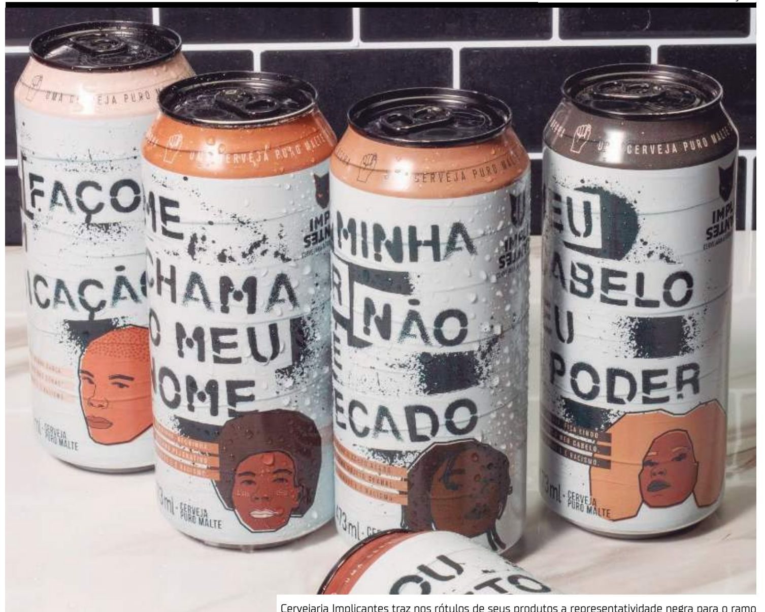
Cervejaria Implicantes traz nos rótulos de seus produtos a representatividade negra para o ramo

“Fiquei um ano fora, em um país cervejeiro e isso me abriu muito os horizontes para essa questão de trabalhar os ingredientes que estão em volta de você. E