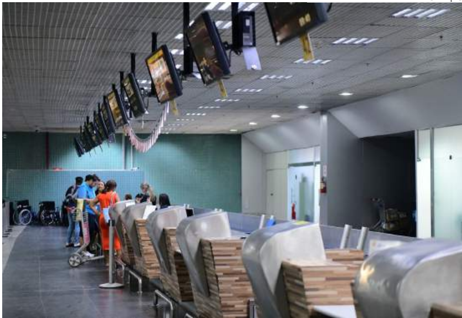
Dados da Amazonastur demonstraram que o Amazonas recebeu mais de 381 mil turistas em 2023

"A reativação desta rota atende a alta demanda por conexões rápidas e eficientes, favorecendo o fluxo e a logística turística para o Amazonas com foco na