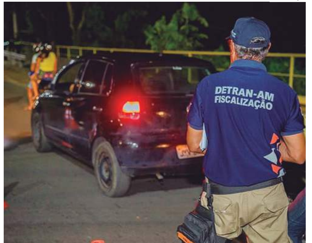
Além disso, outros 53 motoristas se recusaram a passar pelo teste de alcoolemia

Ao perceber a presença da equipe do Detran Amazonas, o indivíduo tentou fugir engatando a marcha ré no veículo. Porém, os agentes conseguiram fazer a interceptação. Em seguida, foram realizados os procedimentos administrativos pertinentes, conforme estabelecido pelo Código de Trânsito Brasileiro (CTB), além da aplicação de medidas legais relativas ao crime de trânsito tipificado no Artigo 306 do CTB.