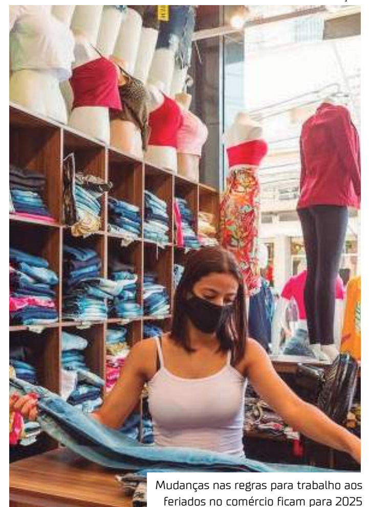
Mudanças nas regras para trabalho aos feriados no comércio ficam para 2025

Dentre as regras, a principal delas dizia respeito sobre a compensação pelo trabalho no feriado, com folgas e/ou pagamento de horas extras. Há casos, no entanto, que a convenção poderá prever outros benefícios, como adicionais, bonificações ou premiações, além de garantir que o funcionário do comércio tenha ao menos um descanso semanal que caia no domingo, uma vez ao mês.