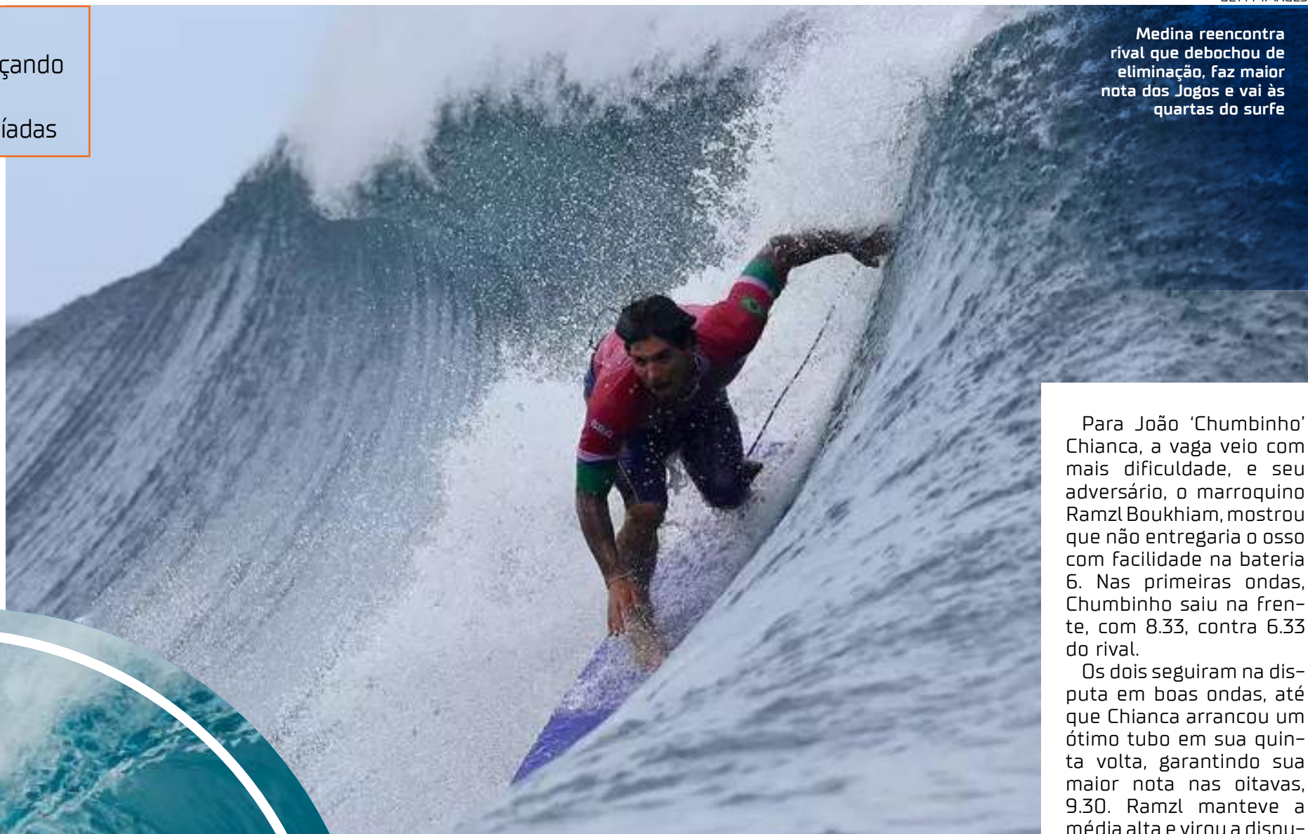
Medina reencontra rival que debochou de eliminação, faz maior nota dos Jogos e vai às quartas do surfe

nal, Gabriel Medina reencontrou o rival que debochou de sua eliminação em Tóquio-2020, o japonês Kanoa Igarashi. Com uma sequência de boas ondas em Teahupo'o, no Taiti, Medina começou modesto, com a pontuação de 2.50 em sua primeira onda.