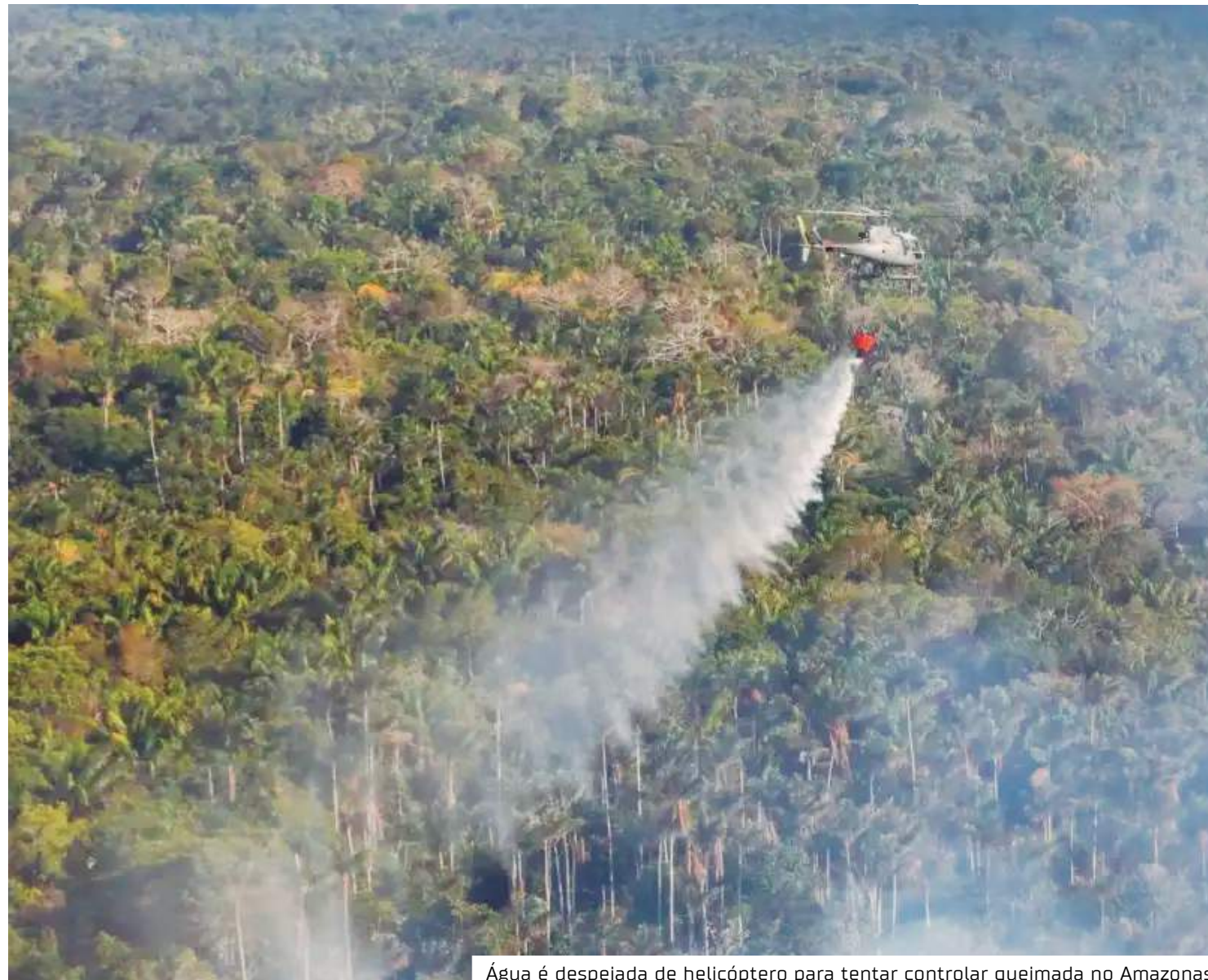
Água é despejada de helicóptero para tentar controlar queimada no Amazonas

Nas últimas semanas, alguns pontos de Manaus acordaram com resquícios de fumaça, mas de acordo com o Sistema Eletrônico de Vigilância Ambiental (Selva),