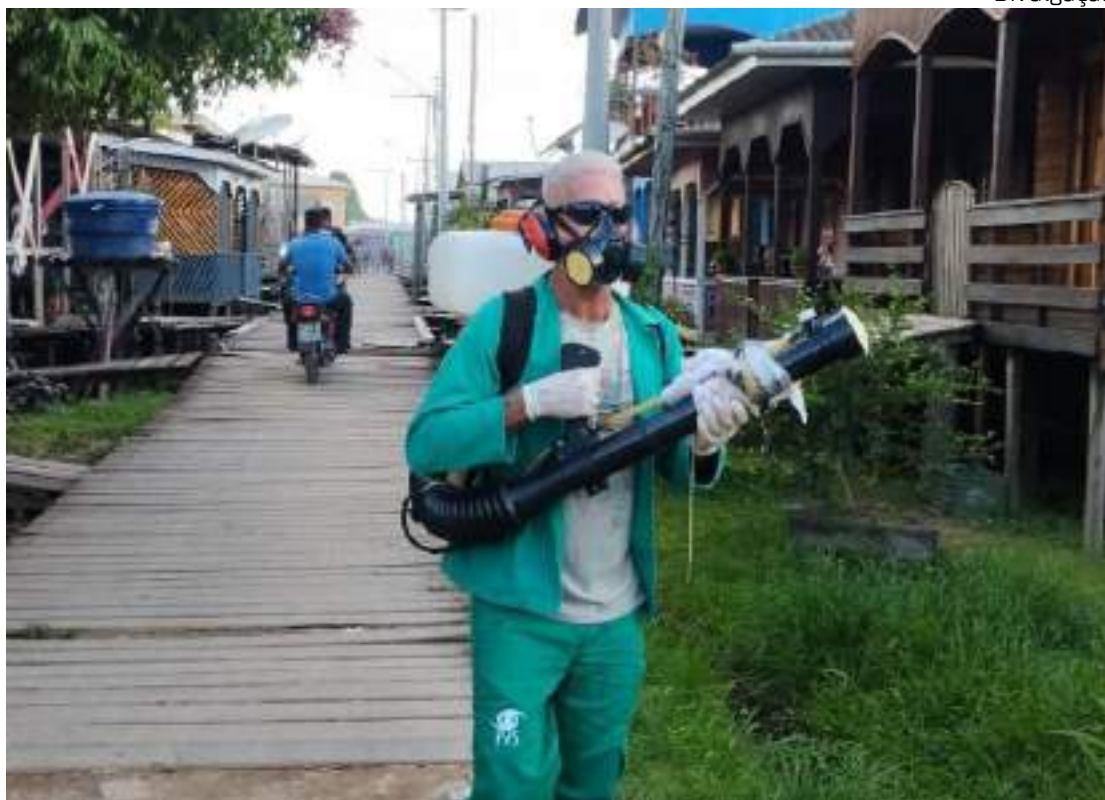
FVS-RCP também tem investido na capacitação de profissionais locais