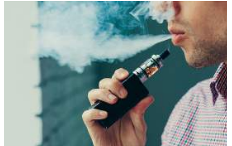
Regularização deve pressionar negativamente o Sistema Único de Saúde

No documento, as sociedades afirmam que o PL, previsto para ser votado numa comissão do Senado Federal nesta terça-feira, “é uma grave ameaça à saúde pública brasileira” e que “a administração da nicotina neste formato tem sido associada a um aumento no risco de iniciação do consumo de cigarros tradicionais