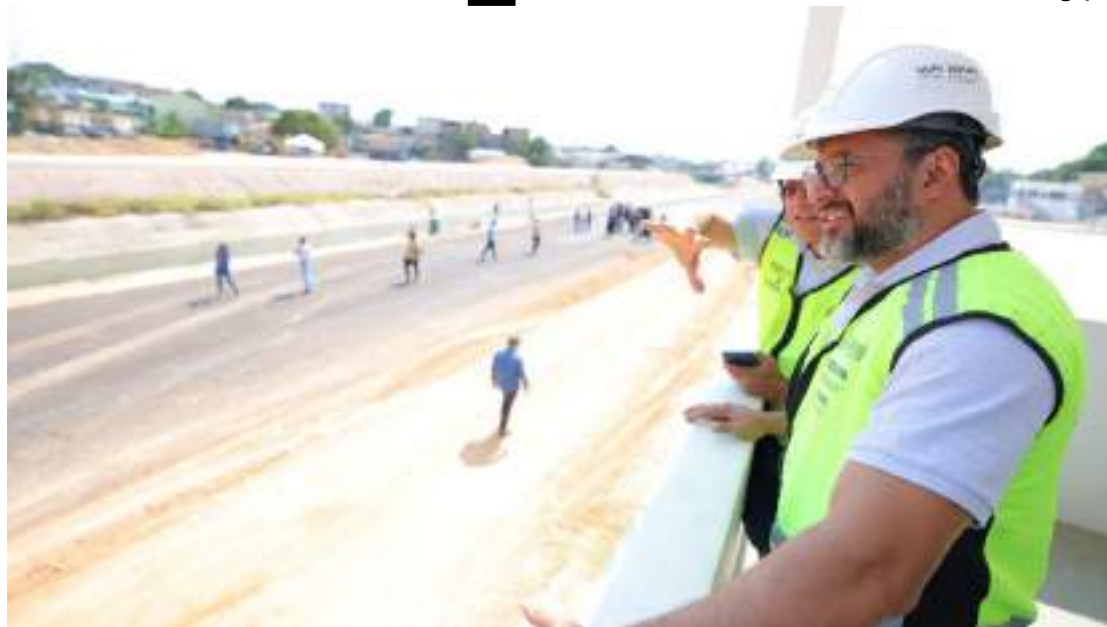
Obra faz parte de pacote de intervenções viárias que alcança mais de 40 quilômetros em Manaus

A obra recebeu toda a parte de macrodrenagem e está na fase de pavimentação