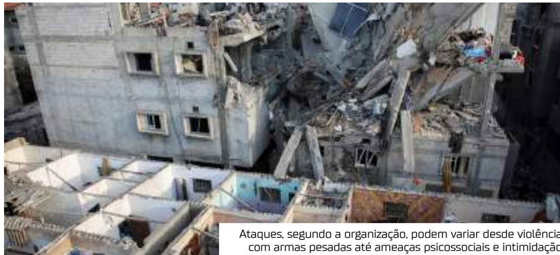
Ataques, segundo a organização, podem variar desde violência com armas pesadas até ameaças psicossociais e intimidação

Dois rodadas de campanhas de vacinação contra a poliomielite devem ocorrer no fim de agosto e no início de setembro na Faixa de Gaza no intuito de interromper a propagação do vírus na região. Para tanto, a OMS fez um apelo, na semana passa-