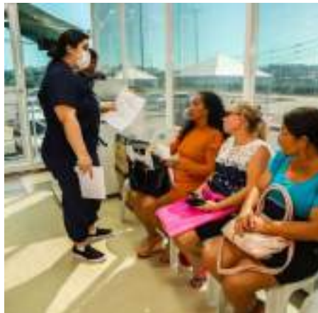
Pré-natal faz parte dos exames

Para atendimento, as usuárias podem se dirigir a qualquer uma das unidades e apresentar documento de identidade e cartão do Sistema Único de Saúde (SUS).