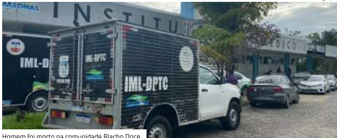
Homem foi morto na comunidade Riacho Doce

Um homem não identificado morreu após ter a cabeça esmagada ao ser agredido a pauladas na segunda-feira (19). O caso ocorreu na rua Santos Dias, na comunidade Riacho Doce, bairro Cidade Nova, Zona Norte de Manaus.