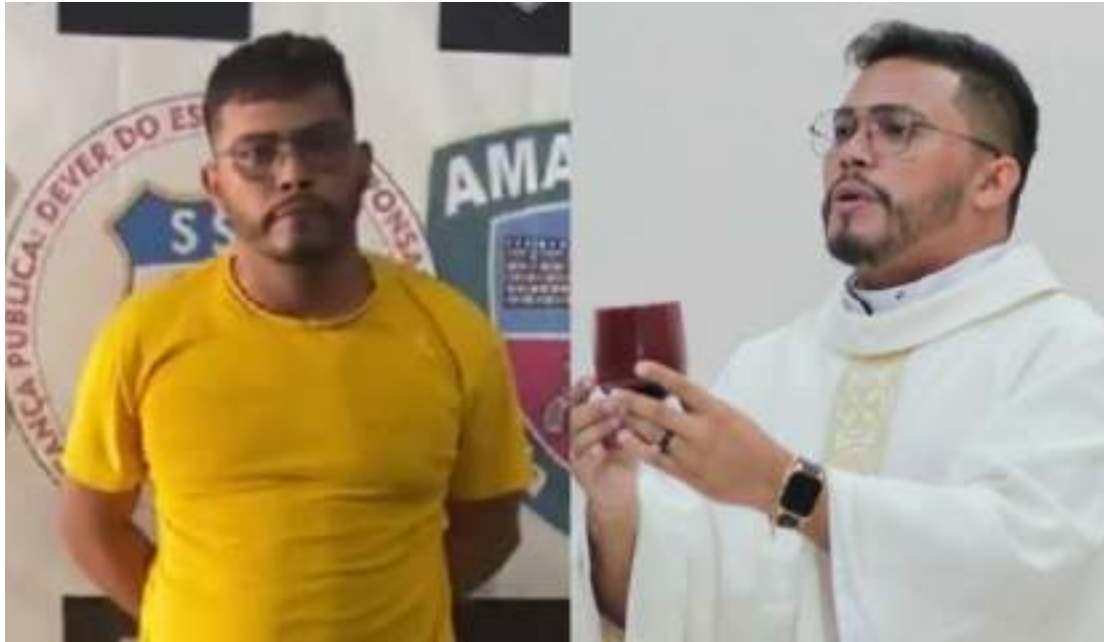
Padre é preso suspeito de manter e filmar relações sexuais com menores em Coari