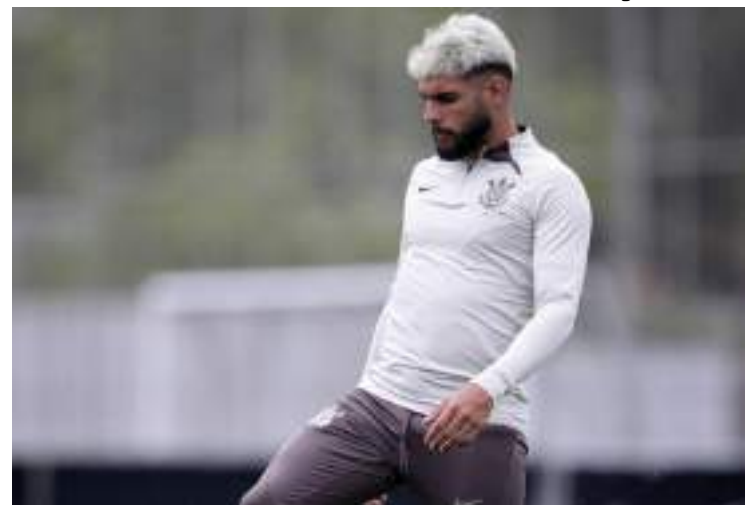
Atacante deve ficar à disposição do técnico Ramón Díaz

O protagonista do Time do Povo tem evoluído rapidamente nos treinos de reabilitação desde a cirurgia feita para a retirada da vesícula. Nesta segunda (19), completa 18 dias do procedimento. O tempo de recuperação médio é de aproximadamente um mês. Contudo, como vem trabalhando normalmente, pode aparecer no embate contra o Massa Bruta.