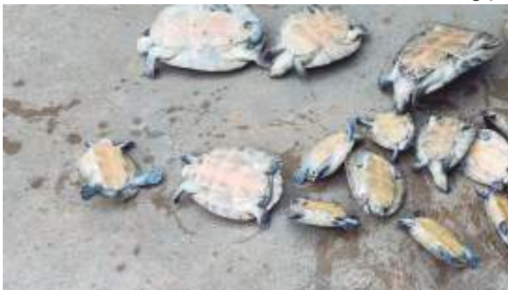
Suspeito também foi flagrantado, junto com sua companheira, por crime ambiental

Wandrey Lourenço Barbosa, de 33 anos, foi preso na segunda-feira (5), investigado por tráfico de drogas em Fonte Boa, no interior do Amazonas. Na ocasião, ele e a sua companheira foram presos em flagrantes por crime ambiental com 26 quelônios, em Juruá.