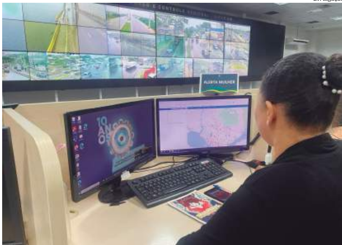
Atualmente, cerca de 110 mulheres são monitoradas pelo Aplicativo