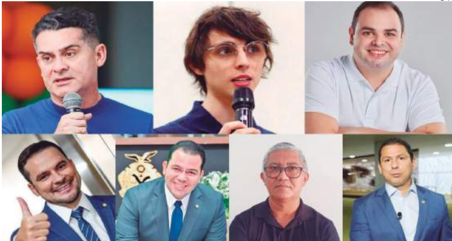
Sete homens disputarão oficialmente as eleições para prefeito de Manaus

Sete pré-candidatos disputarão oficialmente as eleições para prefeito de Manaus. Os pré-candidatos foram definidos nas convenções partidárias que tinham prazo final até segunda-feira (5), conforme o calendário eleitoral definido pelo Tribunal Superior Eleitoral (TSE).