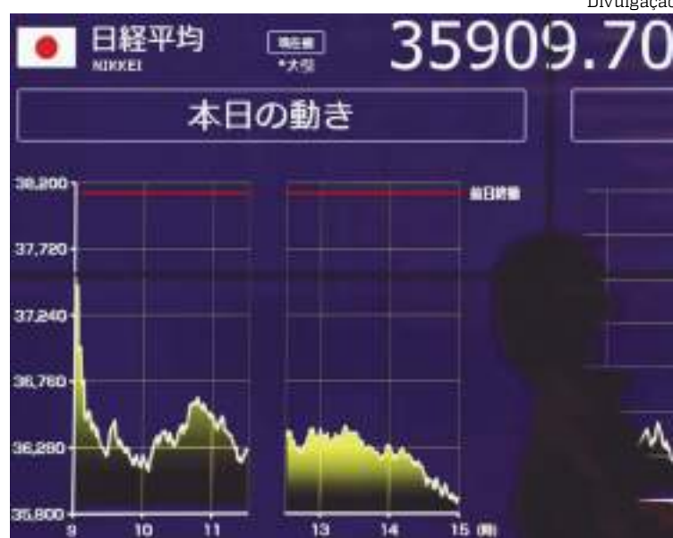
Bolsas do Japão emendaram sequência negativa que não ocorria há 10 anos

“O movimento, que já vinha levando o iene a uma forte valorização em relação ao dólar americano e às principais moedas, se juntou ao cenário internacional mais adverso e trouxe uma ‘tempestade perfeita’ para o mercado acionário japonês”, afirma Veronese.