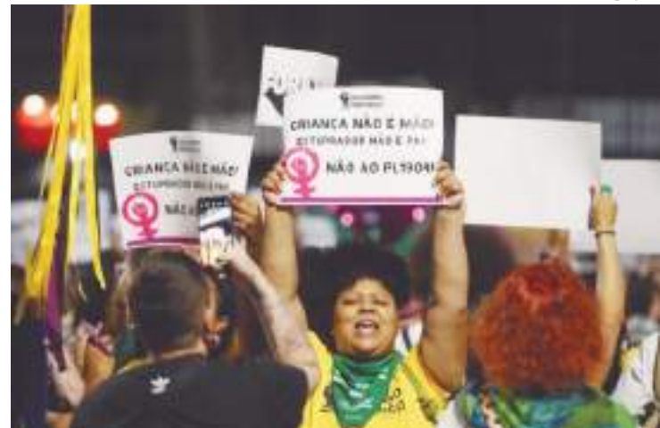
Manifestantes fazem atos contra o PL que equipara aborto ao homicídio

Segundo a pesquisa “Percepções sobre direito ao aborto em caso de estupro”, realizada pelos Institutos Patrícia Galvão e Locomotiva, em 2022, oito em cada dez mulheres não procuram nenhum tipo de serviço de atendimento, seja de saúde ou a polícia, após serem esturpadas. Os motivos incluem vergonha, medo de exposição e receio de serem denunciadas para a polícia.