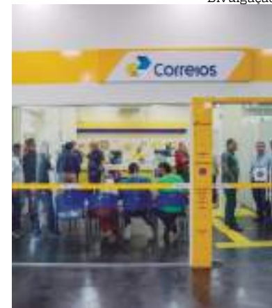
Espaço fica na Zona Centro-Oeste

“Ele é muito mais que isso. Hoje, temos seguro e um centro de logística para levar o produto do cliente para qualquer lugar do mundo, além de um armazém que cuida dessa encomenda. Os Correios estão inovando cada vez mais e buscando novos serviços. Estamos aqui para facilitar”, completa.