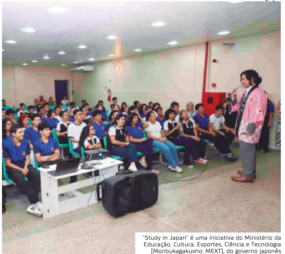
"Study in Japan" é uma iniciativa do Ministério da Educação, Cultura, Esportes, Ciência e Tecnologia (Monbukagakusho: MEXT), do governo japonês

"A NHK japonesa mostrou que existia uma escola bilíngue em Manaus e como eu trabalho com intercâmbio para as universidades do Japão eu fiquei curioso. 'Por que não visitar a escola'? Hoje, eu estou aqui conhecendo o trabalho fantástico da escola, dos professores, da equipe pedagógica e estou muito interessado em conhecer os alunos também", disse o diretor.