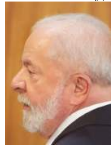
Grupo pede que Lula não reconheça vitória de Maduro

Até aqui, o presidente Lula não reconheceu a vitória de Nicolás Maduro nas eleições presidenciais, mas também não classificou o pleito como uma fraude.