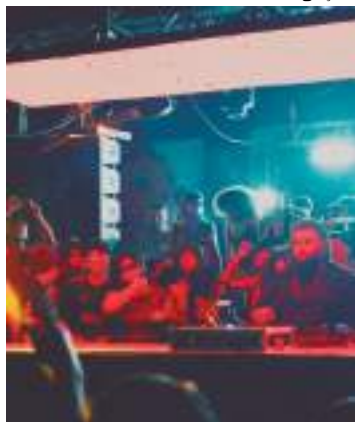
Infecta já conta com mais de 400 membros filiados

Manaus vai sediar, no sábado (10), o Festival Infecta 2024, um evento de 14 horas de música eletrônica com 12 DJs, incluindo quatro atrações nacionais e internacionais. O festival, realizado pelo coletivo Vandal Hostil, celebra o aniversário de 1 ano do projeto Infecta e contará com uma estrutura completa, incluindo praça de alimentação, lounge de descanso e feira criativa.