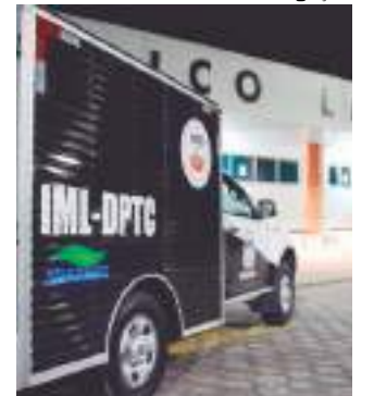
Polícia Civil do Amazonas investiga o caso