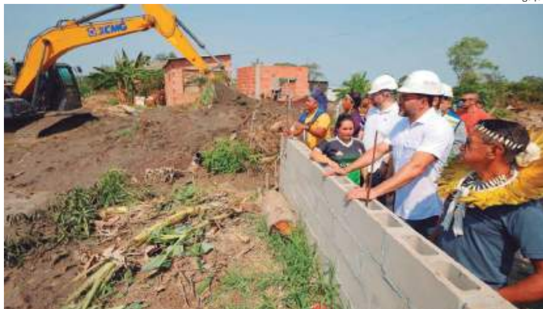
Governador Wilson Lima deu início, em julho, à nova etapa de obras e serviços do Asfalta Amazonas

A programação, conforme o secretário da UGPE, in-