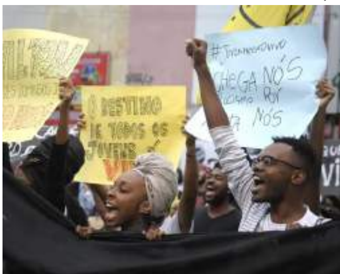
Maioria das vítimas era negra, homem e tinha de 15 a 19 anos

O levantamento traz dados de registros criminais como homicídio doloso (quando há intenção de matar), feminicídio, latrocínio (roubo seguido de morte), lesão corporal