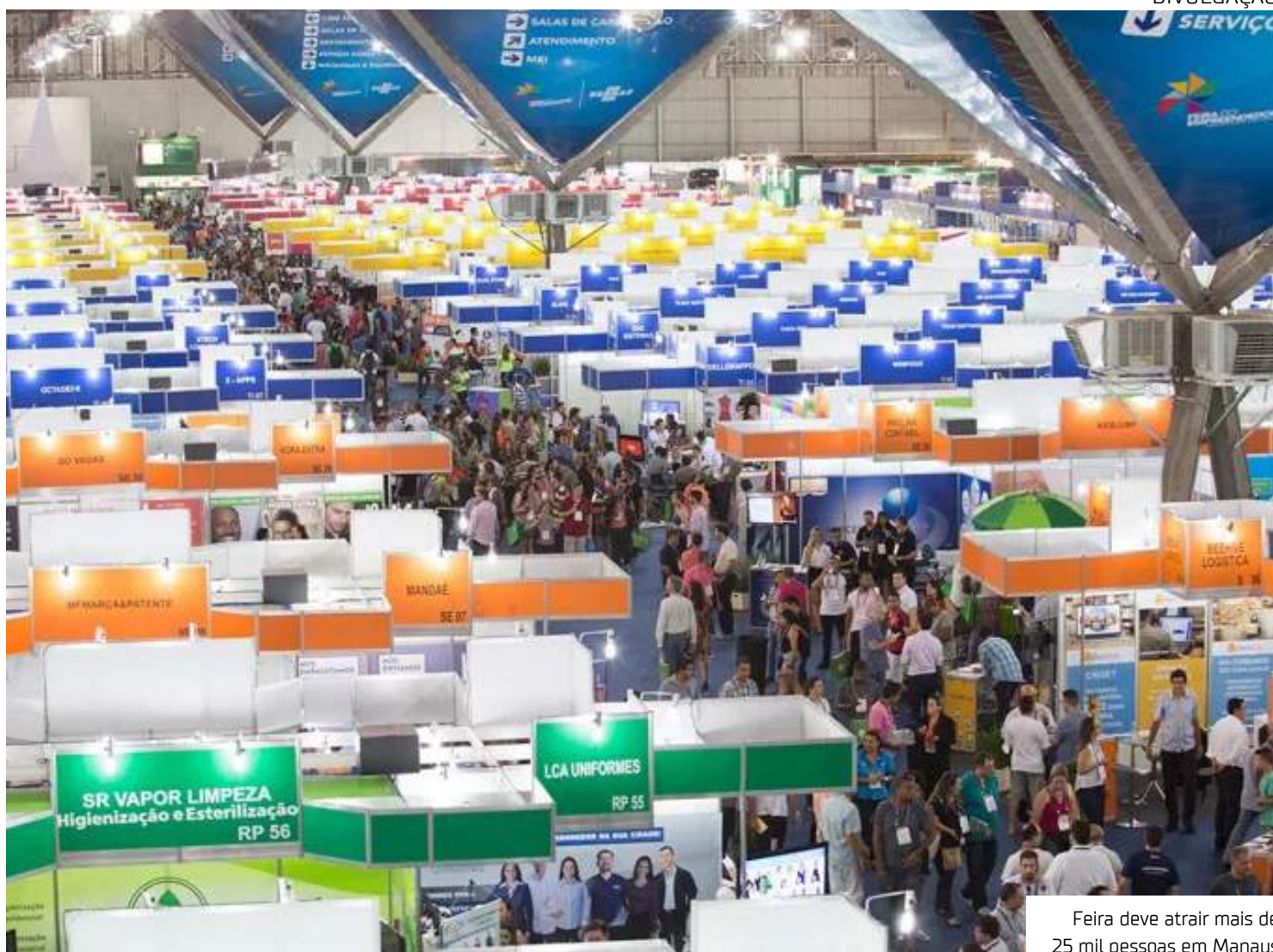
Feira deve atrair mais de 25 mil pessoas em Manaus

Todos os setores econômicos relevantes estarão presentes com representantes importantes do segmento, incluindo comércio, franchising, indústrias alimentícias, serviços de turismo, moda,