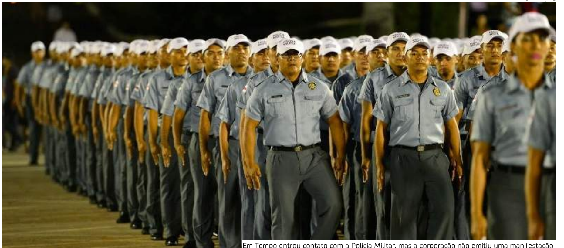
Em Tempo entrou contato com a Polícia Militar, mas a corporação não emitiu uma manifestação

Por maioria dos votos, os desembargadores da Primeira Câmara Cível do Tribunal de Justiça do Amazonas (TJAM) negaram provimento ao recurso movido pelo Governo do Amazonas. De acordo com o advogado dos aprovados, aproximadamente 2.500 pessoas integravam a ação cível. Todas foram aprova-