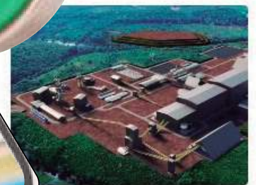
Proibição proíbe presidente da Potássio de entrar em terra indígena no Amazonas