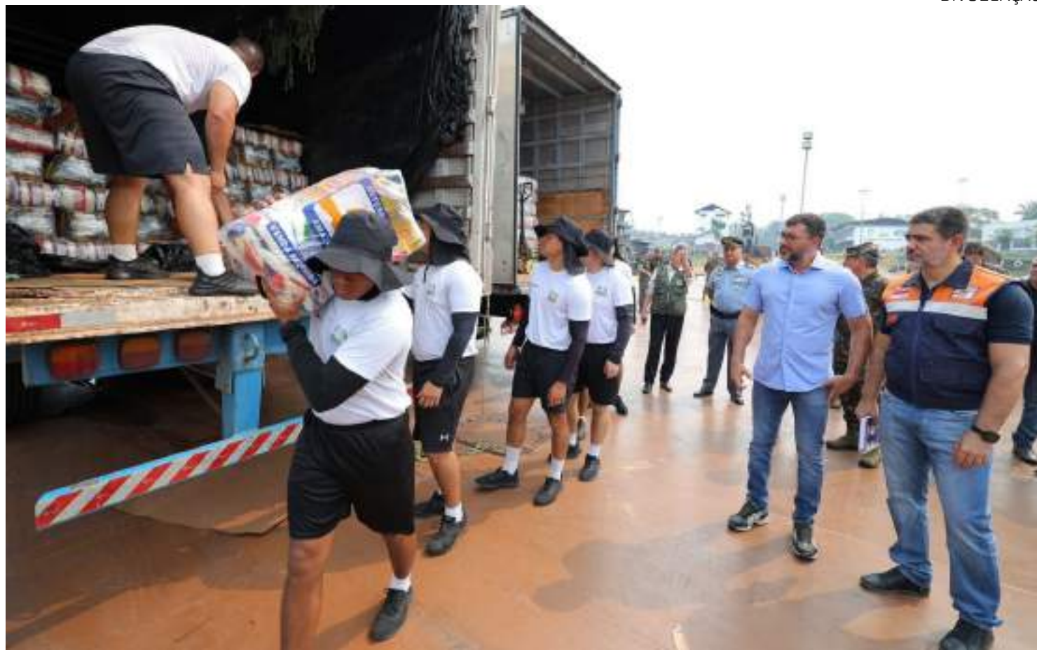
Três carregamentos serão enviados e atenderão municípios das calhas do Alto Solimões e Purus, alcançando cerca de 43 mil pessoas

De acordo com a Defesa Civil, três carregamentos serão enviados e atenderão municípios das calhas do Alto Solimões e Purus, alcançando cerca de 43 mil pessoas.