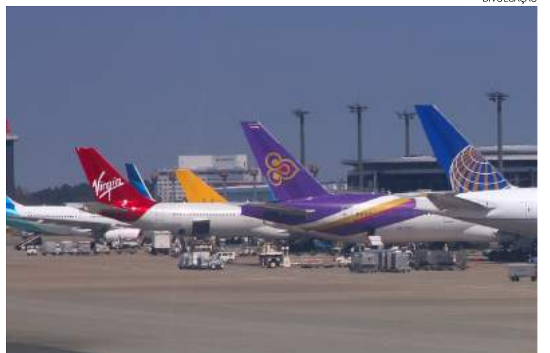
Proposta garante voos domésticos na região da Amazônia Legal

A iniciativa do projeto foi elogiada por senadores como