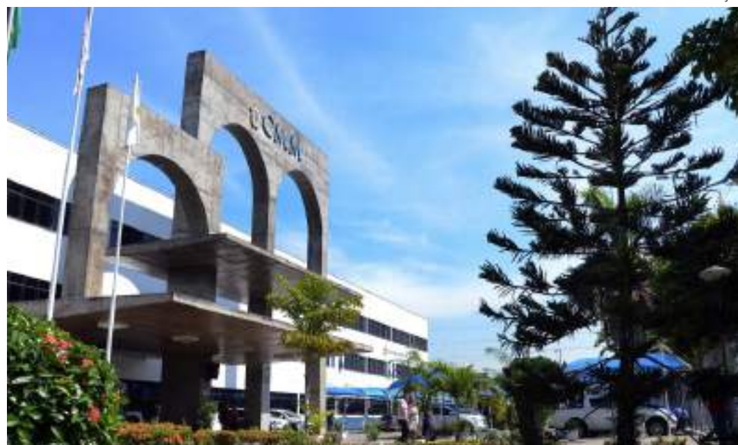
Atendimento ao público na CMM e as transmissões da TV e Rádio Câmara também foram suspensos

Os trabalhos prosseguem nesta tarde, com previsão de tudo ser religado até o final do dia e, nesta quarta-feira (14), os trabalhos serem retomados normalmente.