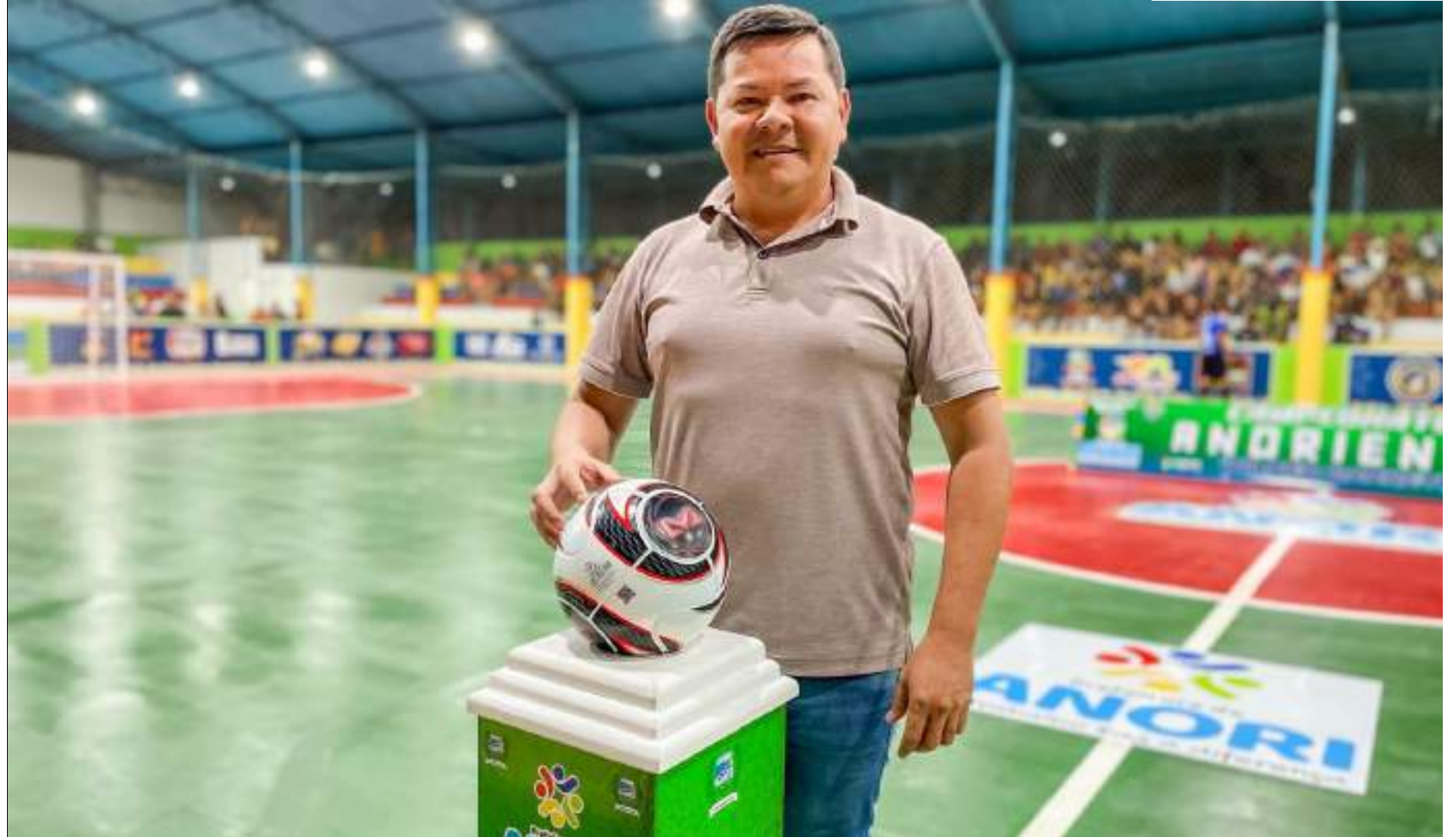
Candidato foi o único registrado para disputar as eleições municipais no município do Amazonas

Em 2020, nos 106 dos 5.568 municípios onde haverá eleição municipal neste ano apenas uma pessoa se candidatou para ocupar a prefeitura. Essas cidades