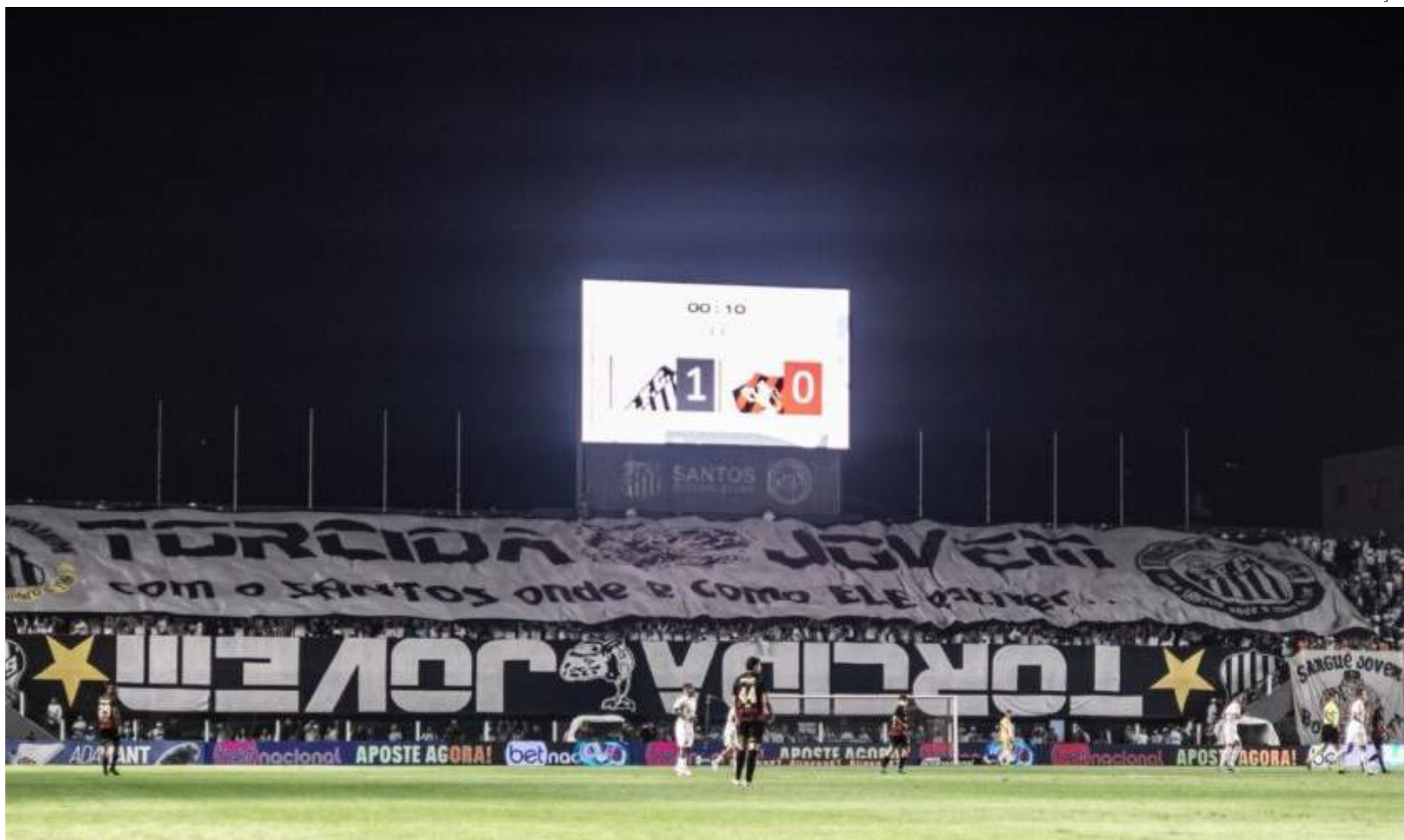
Vila Belmiro pode receber um novo nome ainda durante a disputa do Peixe na Série B

O contrato tem como tempo mínimo de dez anos e cerca de R$15 milhões por temporada. O acordo é independente a construção ou não de um novo estádio (que possui tratativas avançadas com a WTorre). Assim, a Vila Belmiro pode receber um novo nome ainda durante a disputa do Peixe na Série B.