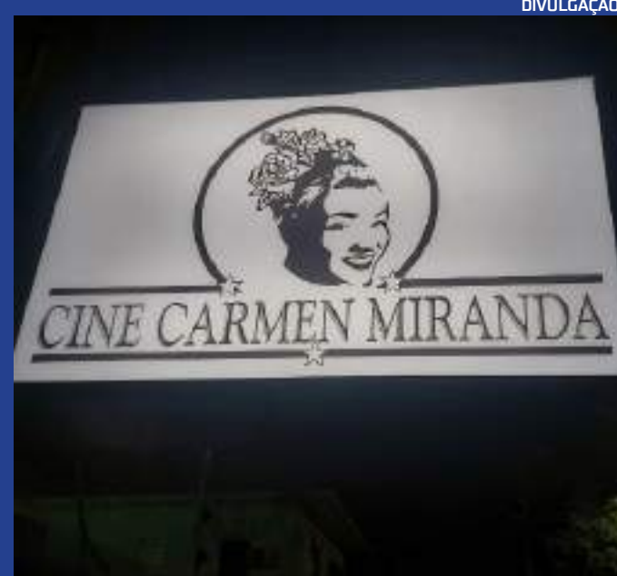
Títulos são 'Limite', de 1931, e 'Aviso aos navegantes', de 1950

Na obra prima 'Limite', em um pequeno barco à deriva, duas mulheres e um homem relembram seu passado recente. Uma das mulheres escapou da prisão, a outra estava desesperada, e o homem tinha perdido sua amante. Cansados, eles param de remar e se conformam com a morte, relembrando as situações de seu passado. Eles não têm mais força ou desejo de viver e atingiram o limite de suas existências. O longa de Mário Peixoto foi escolhido em 2015 como o melhor filme brasileiro de todos os tempos, segundo a Associação Brasileira de Críticos de Cinema (Abraccine), que divulgou, à época,