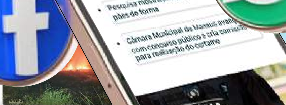
Bombeiros impedem propagação de incêndio em área de vegetação no interior do AM