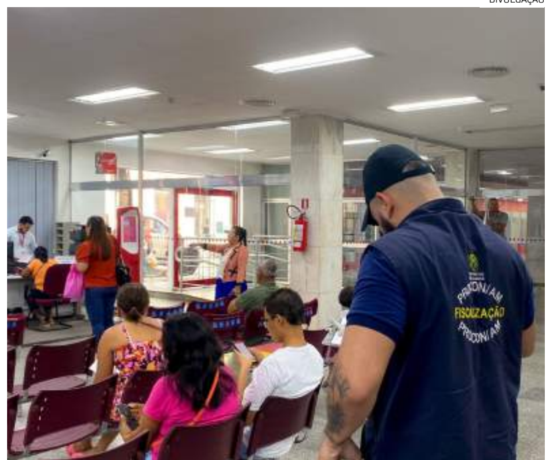
No local, havia mais de 10 pessoas esperando atendimento por mais de 40 minutos

Em caso de descumprimento da Lei das Filas, o Procon-AM orienta o consumidor a solicitar a autenticação da senha de chegada, com o horário do atendimento, e levar esse documento ao órgão para formalizar a denúncia.