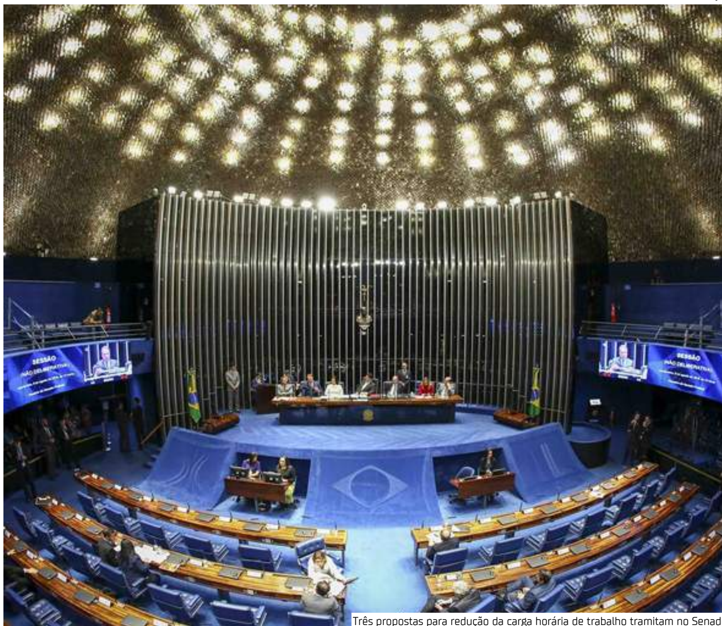
Três propostas para redução da carga horária de trabalho tramitam no Senado

Weverton explica que o projeto não obriga a redução, apenas a permite por meio de acordo, de modo que o mercado pode ir se ajustando às novas tendências.