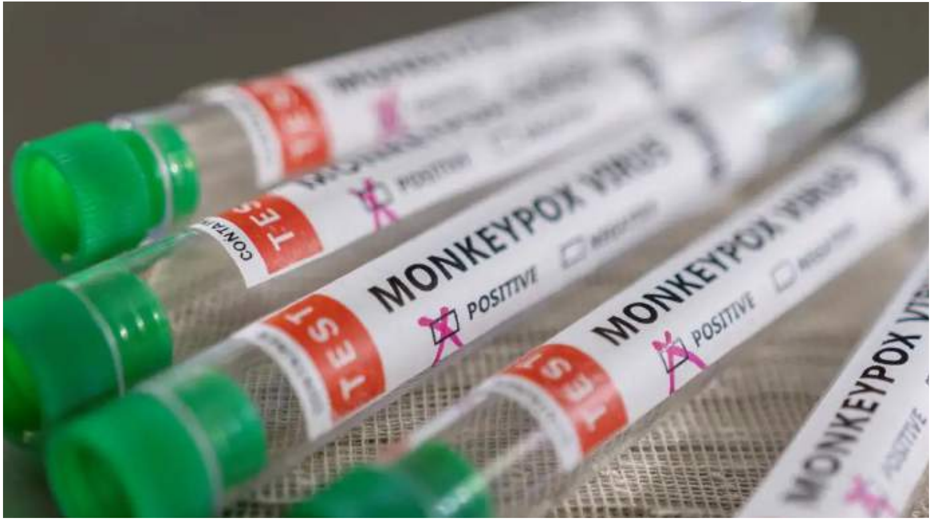
Ministério obteve da Agência Nacional de Vigilância Sanitária (Anvisa) autorização de uma licença de importação do remédio Tecovirimat

retor-geral da OMS, Tedros Ghebreyesus, uma reunião para definir a situação da mpox – se virá a ser considerada emergência em saúde pública de preocupação internacional. Ainda não temos esse cenário. Amanhã, vai haver a definição. O fato é que temos um aumento absolutamente sem precedentes na África, não só em número de casos em países que já haviam sido acometidos, como também em países vizinhos e que ainda não tinham relatado nenhum caso de mpox."