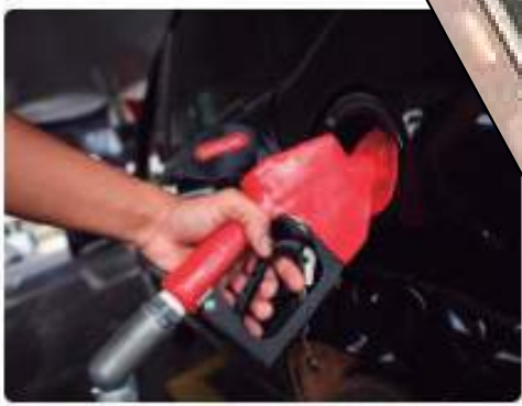
MPAM investiga reajuste injustificado no preço da gasolina em Manaus