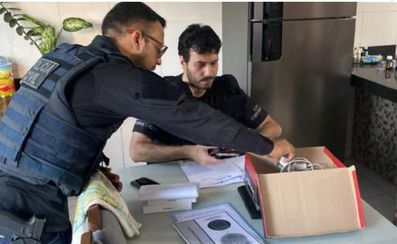
Segundo as investigações, por meio dos sites falsos, os golpistas ofereciam 30% de desconto em pagamentos do IPVA via Pix