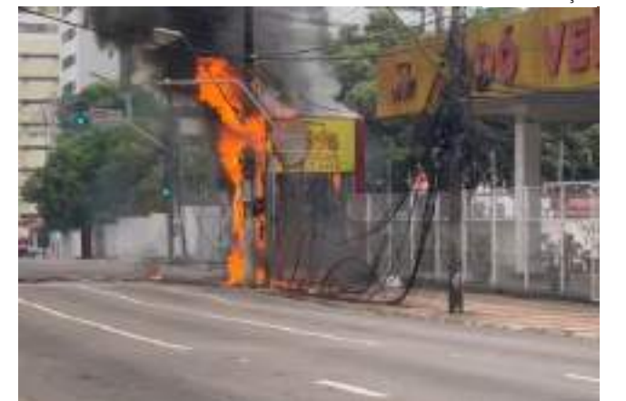
Estrutura de uma loja de carros também foi afetada