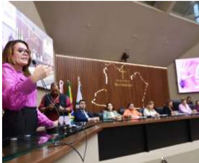
Ferramenta foi lançada durante a sessão especial na Aleam

O objetivo é monitorar, coletar, analisar dados sobre violências praticadas contra mulheres no estado do Amazonas, bem como promover a integração entre órgãos que de-