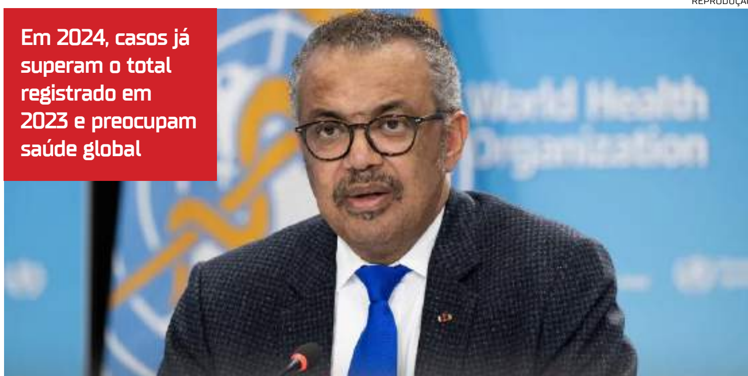
Diretor-geral da OMS, Tedros Adhanom Ghebreyesus, destacou que as infecções têm aumentado ao longo dos últimos anos

Em 2024, casos já superam o total registrado em 2023 e preocupam saúde global