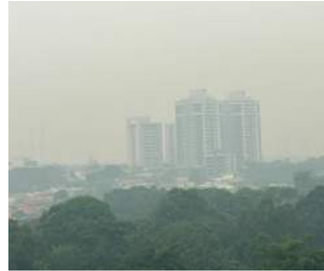
Focos de queimadas crescem no Amazonas