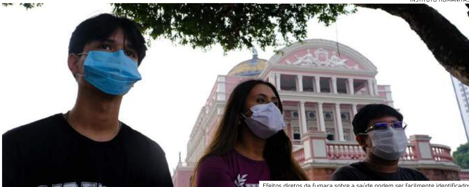
Efeitos diretos da fumaça sobre a saúde podem ser facilmente identificados

"O que mais preocupa este ano em relação aos anteriores é que não se sabe, ao certo, se o que está acontecendo é simplesmente uma antecipação do período crítico ou se, realmente, este ano, teremos