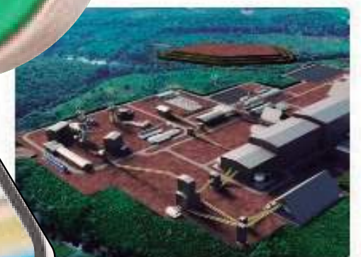
Justiça proíbe presidente da Potássio de entrar em terra indígena no Amazonas