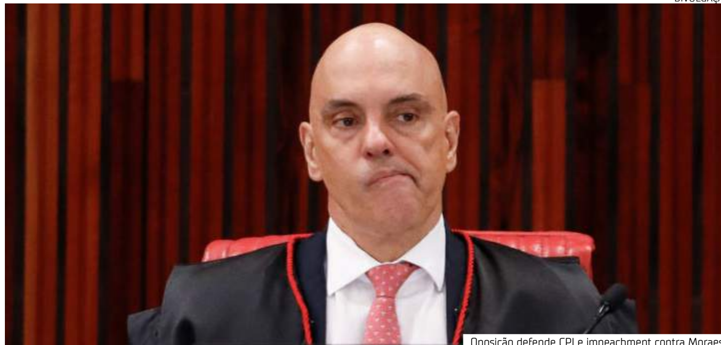
Posição defende CPI e impeachment contra Moraes

"Me reuni com senadores e deputados para apresentarmos juntos o pedido coletivo de