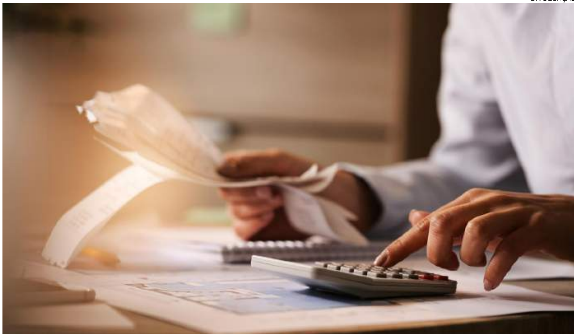
Cerca de 33% dos entrevistados afirmam que a renda é insuficiente para ultrapassar as despesas de agosto

"Com a chegada do segundo semestre, muitas