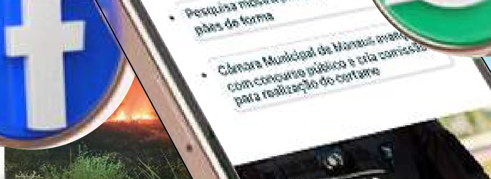
Bombeiros impedem propagação de incêndio em área de vegetação no interior do AM