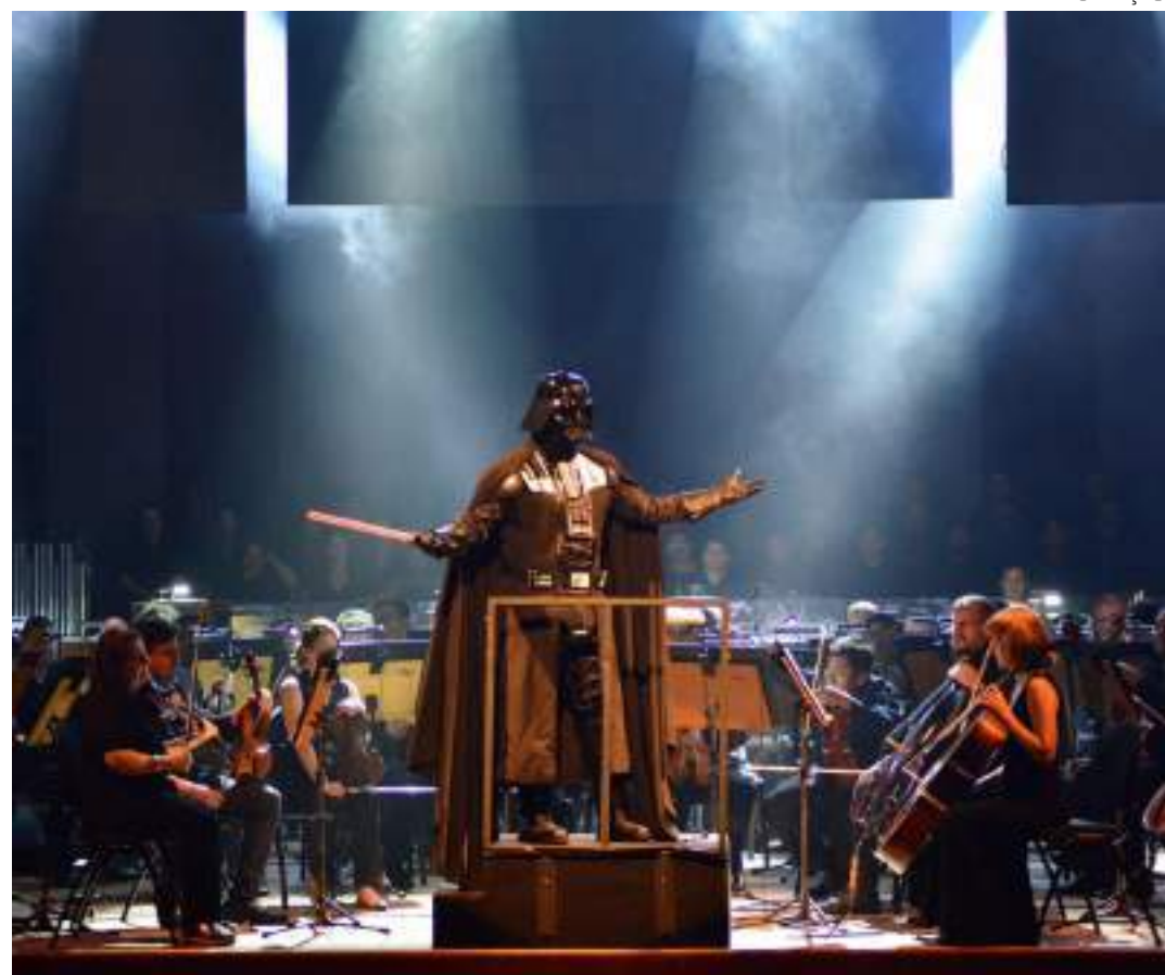
Corpos Artísticos do Amazonas se unem para apresentar o universo galáctico da cultura pop