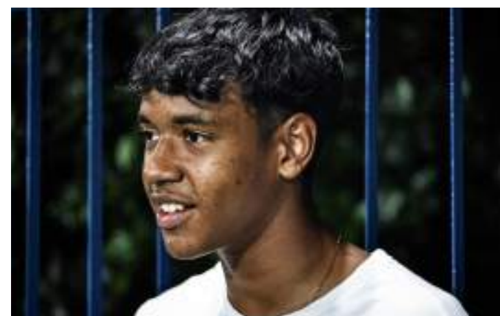
Amilca atua no futebol paulista

“Tudo que aprendi na Guerreirinhos Manaus e nos testes que fiz no Fluminense, me ajudaram muito a chegar aonde estou, mas sigo aprendendo e aproveitando para desenvolver meu futebol. Quando cheguei no Desportivo Brasil, atuava como zagueiro e agora estou jogando de atacante”, declarou.