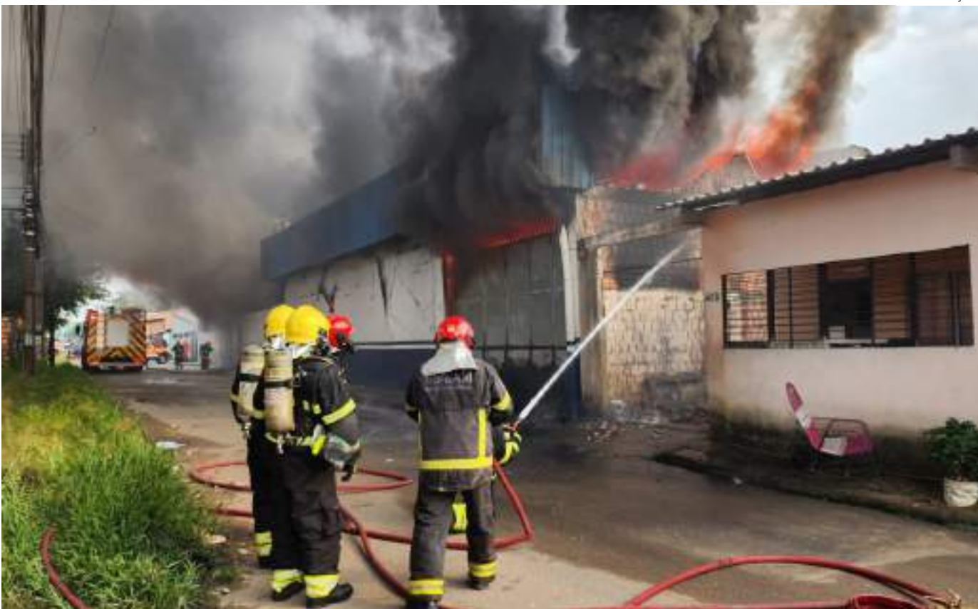
Onze viaturas e 44 militares estiveram no local para combater as chamas