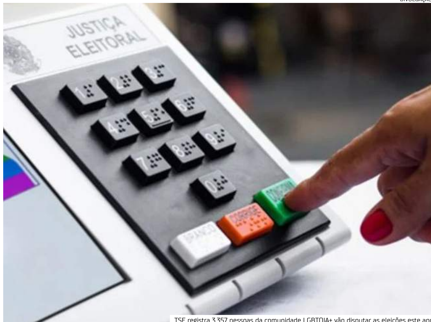
TSE registra 3.357 pessoas da comunidade LGBTQIA+ vão disputar as eleições este ano

Segundo o relatório "A Política LGBT+ Brasileira: entre