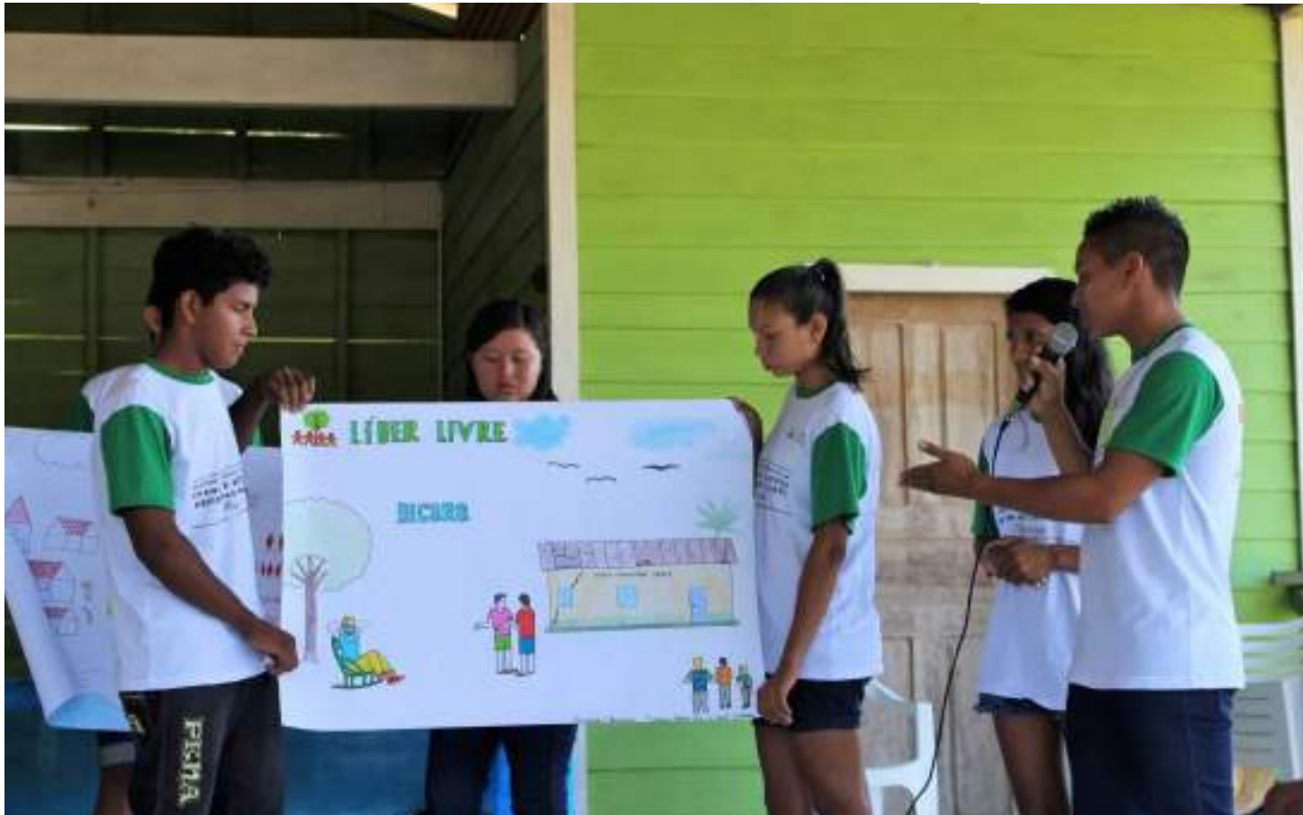
DICARA atua para fortalecer a rede de proteção de crianças e adolescentes ribeirinhos da Amazônia