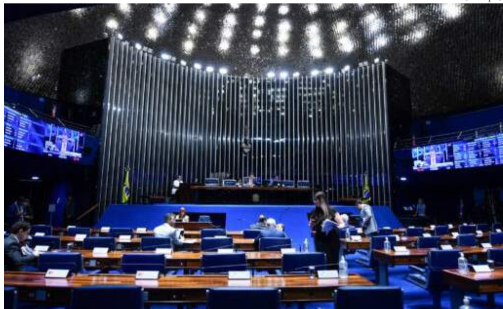
Senado aprova PEC que anistia partidos e reduz verba para candidaturas negras