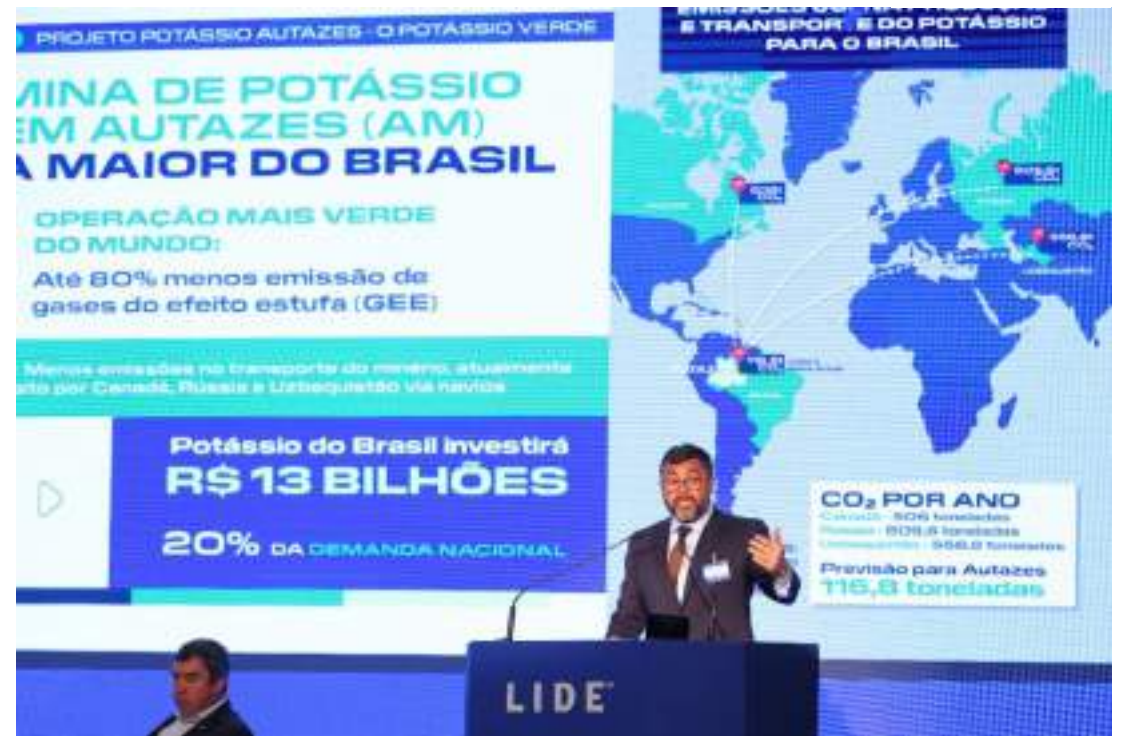
Wilson Lima também considerou o mercado de carbono como um avanço para o Amazonas

O governador também falou sobre tornar o gás natural do município de Silves (a 204 quilômetros da capital) em uma importante atividade econômica. A parceria do Governo