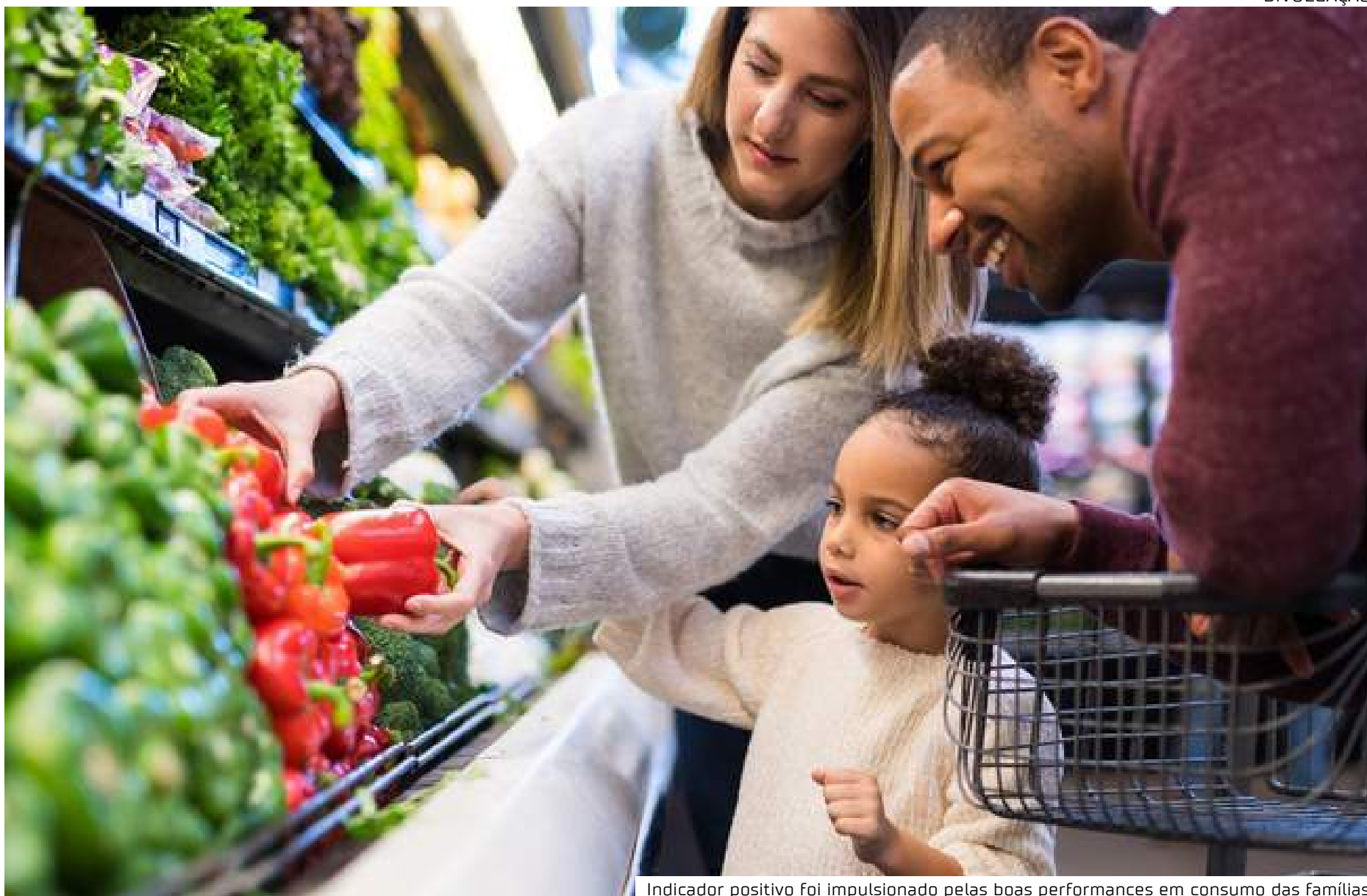
Indicador positivo foi impulsionado pelas boas performances em consumo das famílias

No caso de consumo das famílias, houve alta de 1,7%