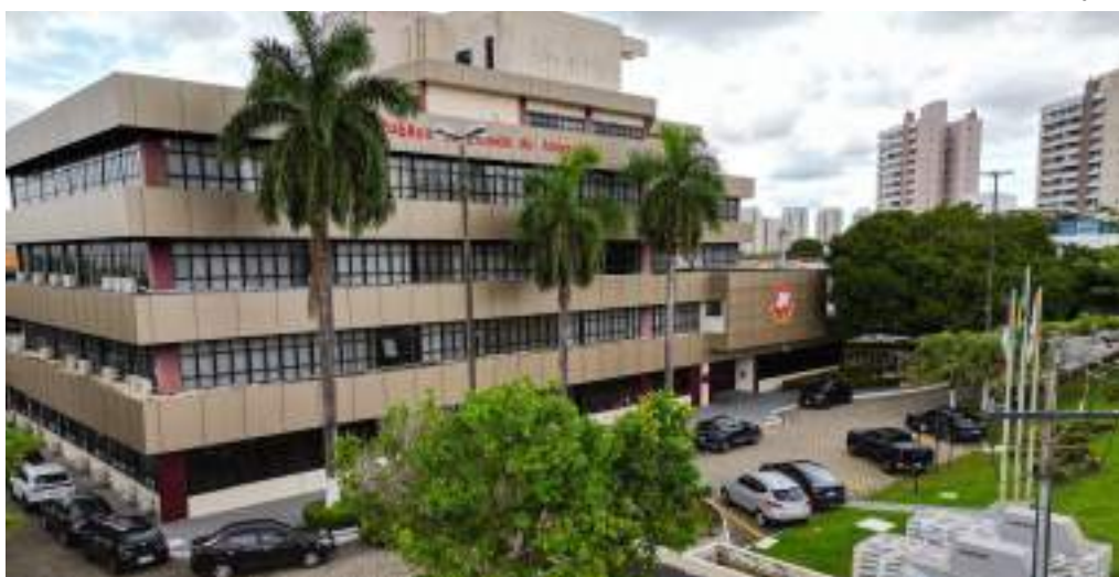
Oito candidaturas à lista tríplice para o cargo de novo procurador-geral do Amazonas