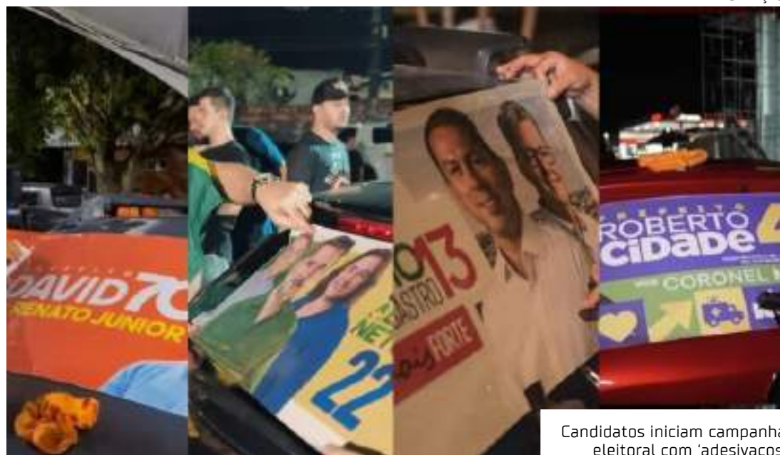
Candidatos iniciam campanha eleitoral com 'adesivações'

ganda eleitoral ocorre entre 30 de agosto e 3 de outubro. Nos municípios com segundo turno, a propaganda será entre 11 e 25 de outubro.