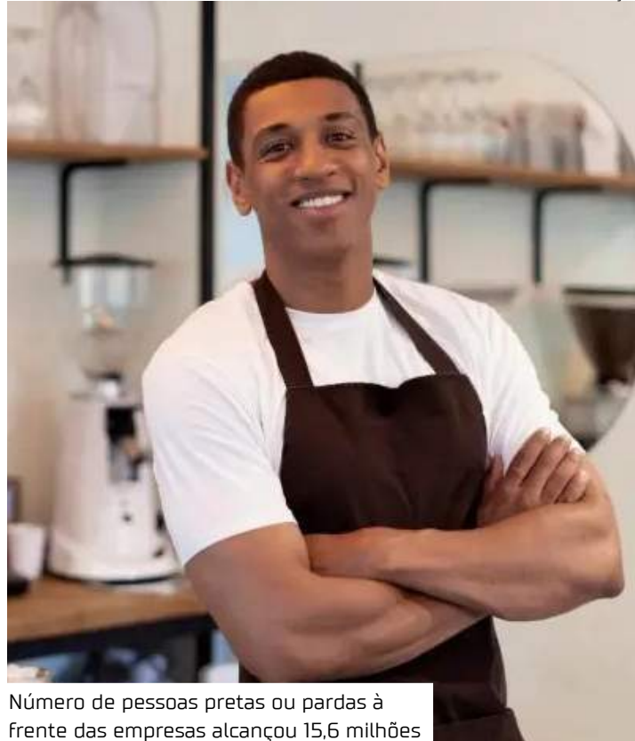
Número de pessoas pretas ou pardas à frente das empresas alcançou 15,6 milhões

Mas ainda há uma grande lacuna em relação aos empreendedores brancos. A proporção de empresários com CNPJ, por exemplo, é 18,6 pontos percentuais maior entre os empreendedores brancos, em rela-