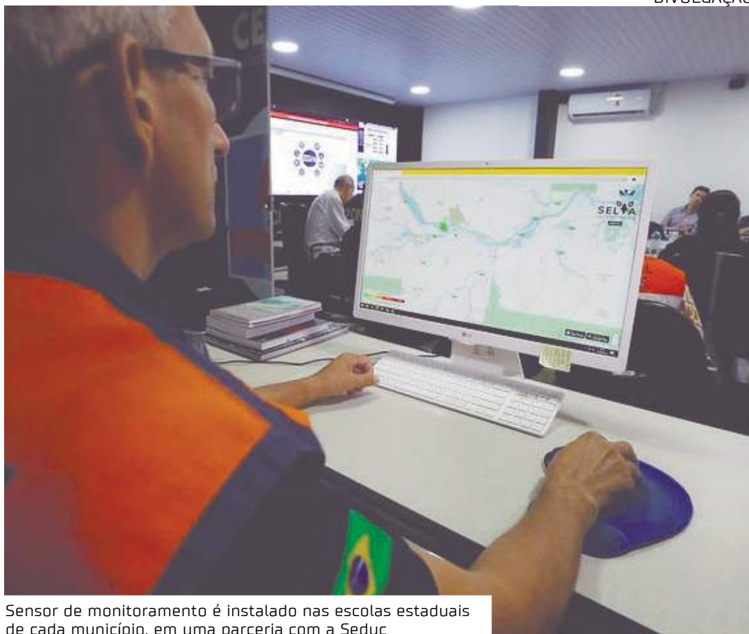
Sensor de monitoramento é instalado nas escolas estaduais de cada município, em uma parceria com a Seduc

Desde junho, os equipamentos estão sendo entregues para os municípios com o intuito de antecipar os planos de ações emergenciais. A ação é resultado de uma parceria entre a Defesa Civil, Secretaria do Meio Ambiente (Sema), Secretaria de Educação e Desporto do Amazonas (Seduc) e Universidade Estadual do Amazonas (UEA).