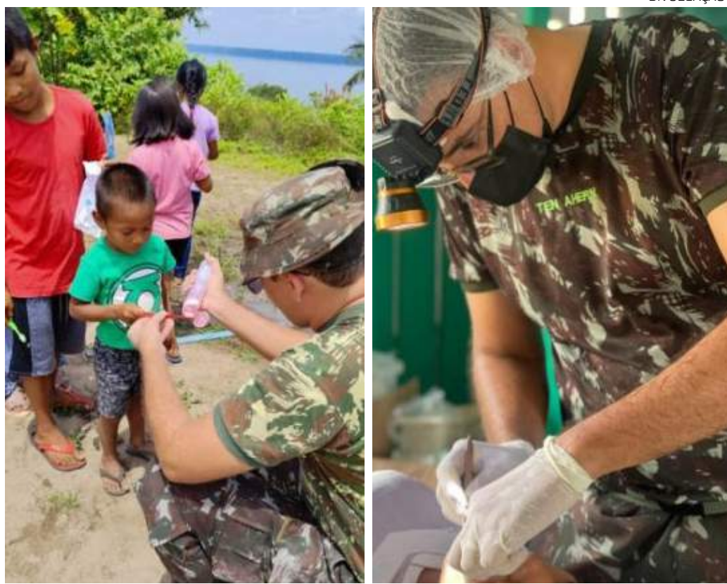
Atendimento, até o momento, alcançou dez das 23 etnias presentes na região

Utilizando embarcações e recursos adaptados às peculiaridades da região, as Forças Armadas realizam missões de apoio em áreas remotas, oferecendo assistência médica, odontológica e social, e reforça o compromisso em suprir as necessidades dessas populações isoladas, que dependem quase exclusivamente dos rios para acessar serviços e oportunidades.