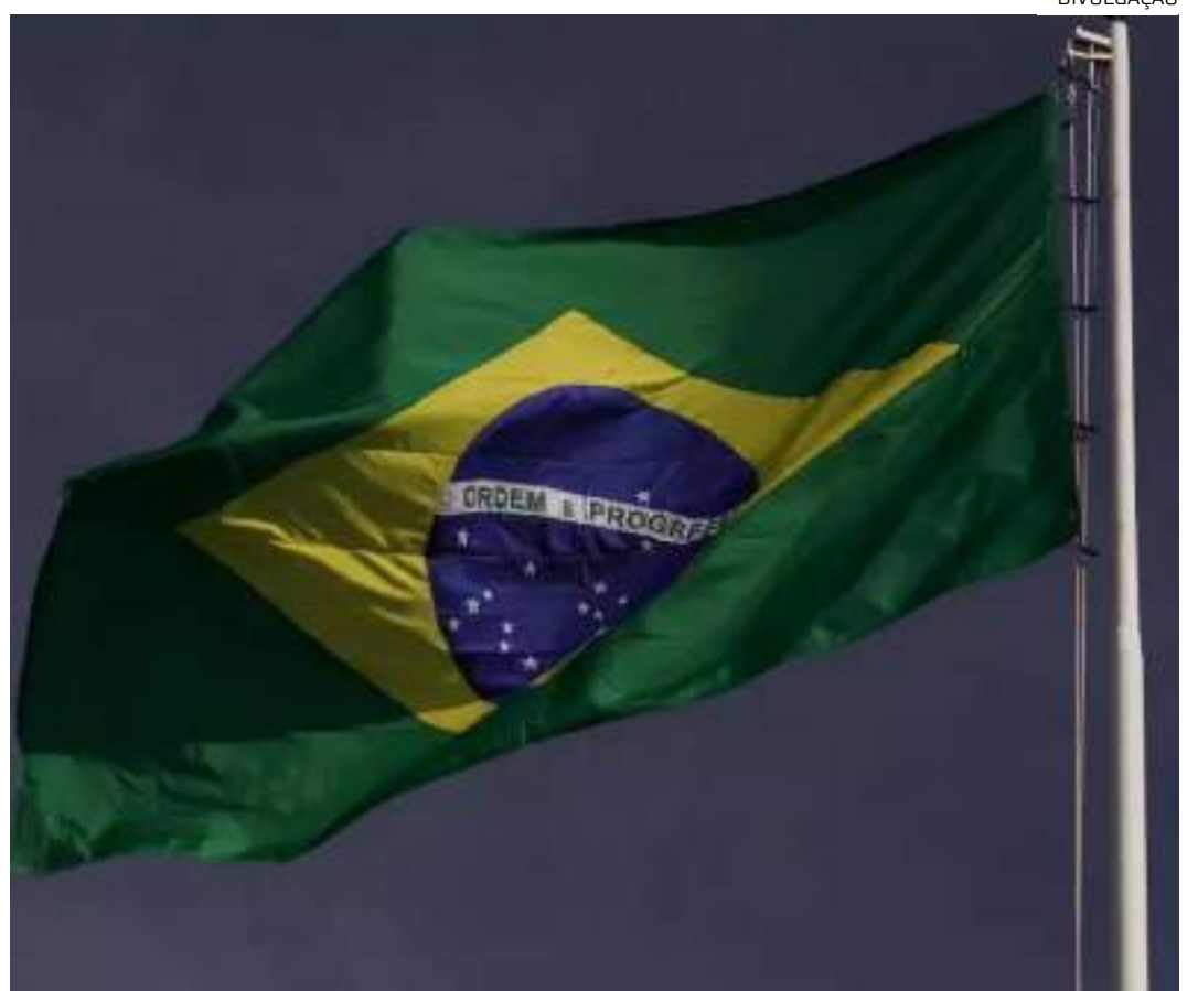
Juramento obrigatório à bandeira do Brasil em escolas avança na Câmara

Para virar Lei, também terá de ser aprovado pelo Senado.