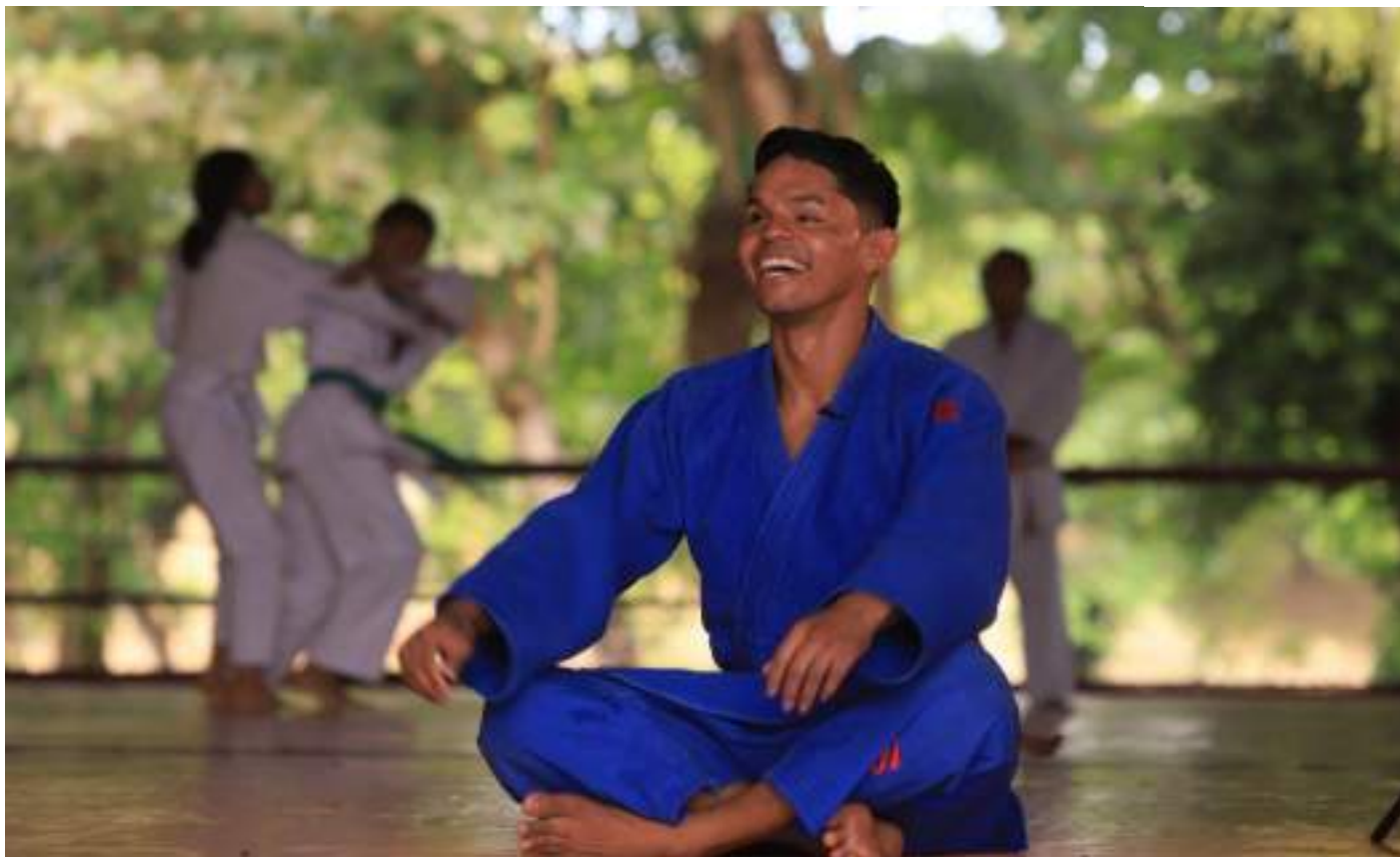
Paratleta de 30 anos de idade vai competir no judô paralímpico como número 1 do ranking nacional