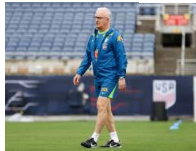
Convocação acontece às 10h30 no auditório da CBF