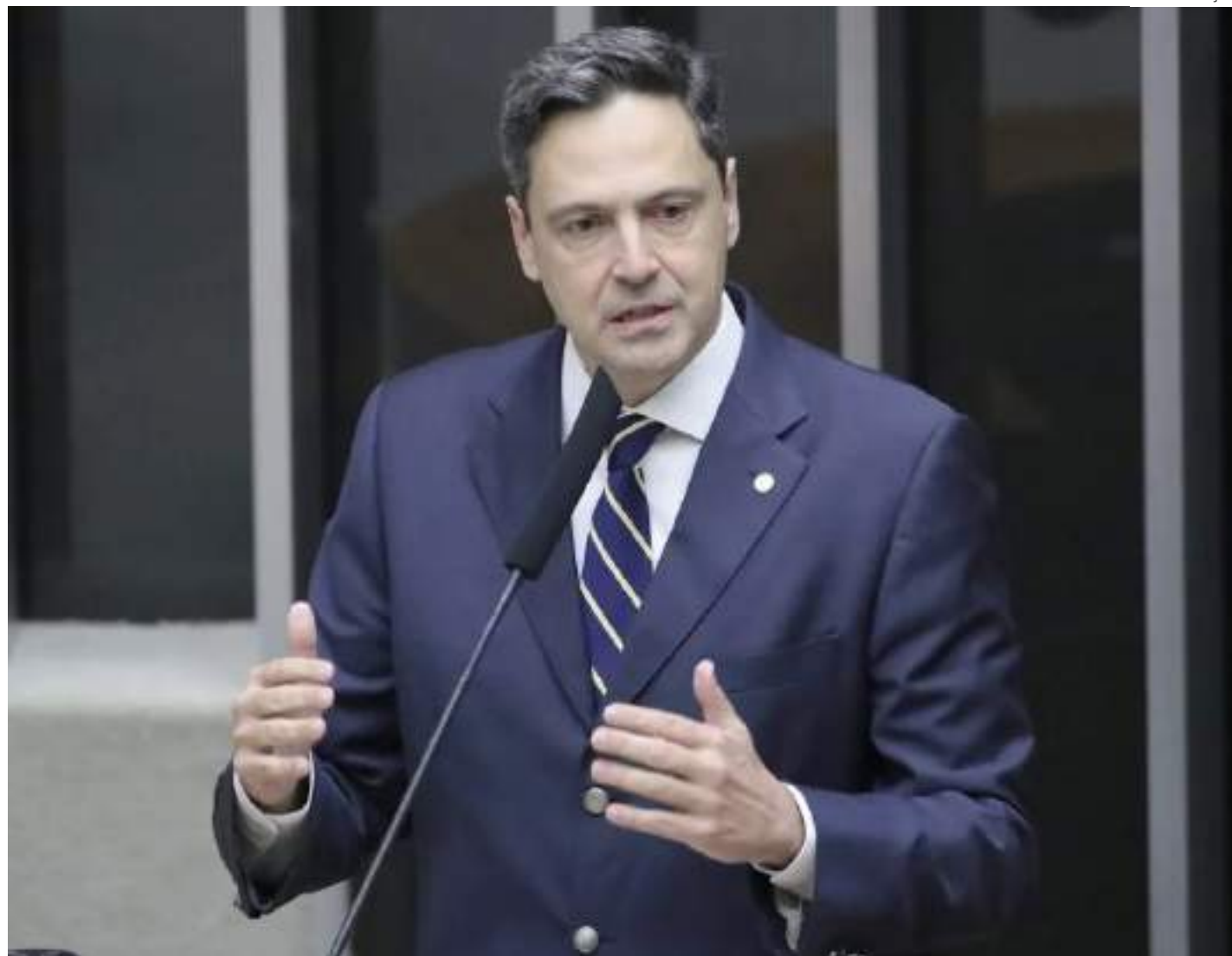
Luiz Philippe de Orleans será o relator de proposta que pode suspender ordens judiciais da Corte

A derrubada de uma decisão precisaria ser aprovada com os votos de dois terços dos membros da Câmara e do Senado. Se aprovada, a ordem ficaria suspensa por até quatro anos. Depois desse período, a Corte poderá retomar a validade da medida, desde que reúna votos de ao menos nove ministros.