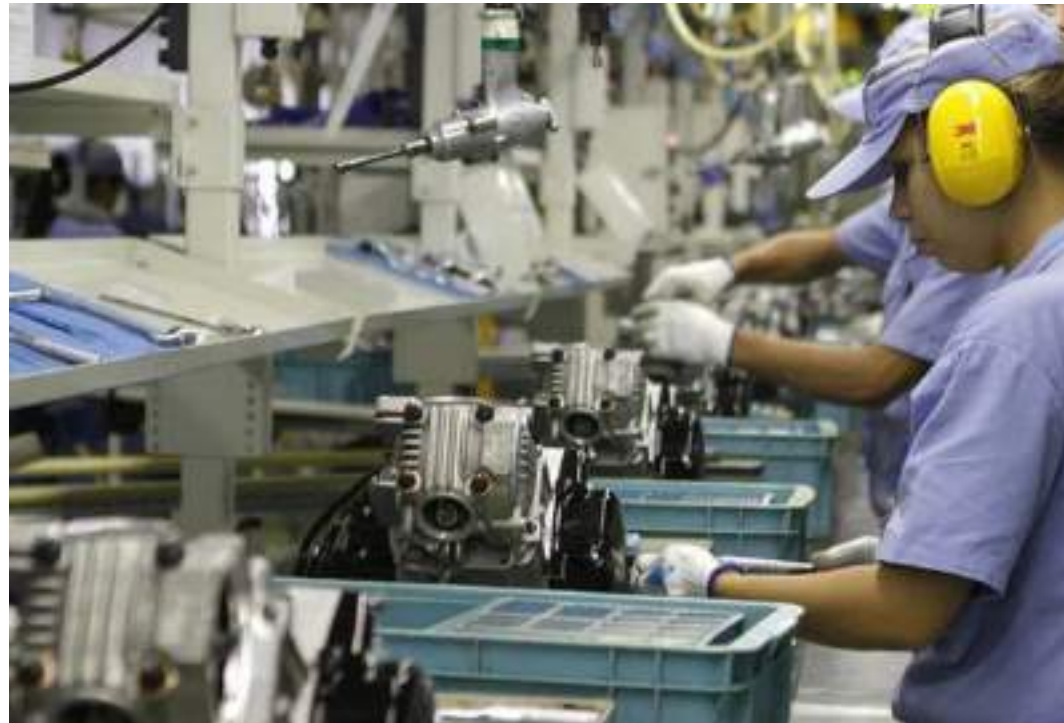
Empresas de médio e grande porte também registraram aumento no índice de confiança

Em agosto, a confiança também cresceu positivamente nas indústrias do Centro-Oeste (1,8 ponto) Sudeste (1,6 ponto), Norte (0,7 ponto) e Nordeste (0,4 ponto).