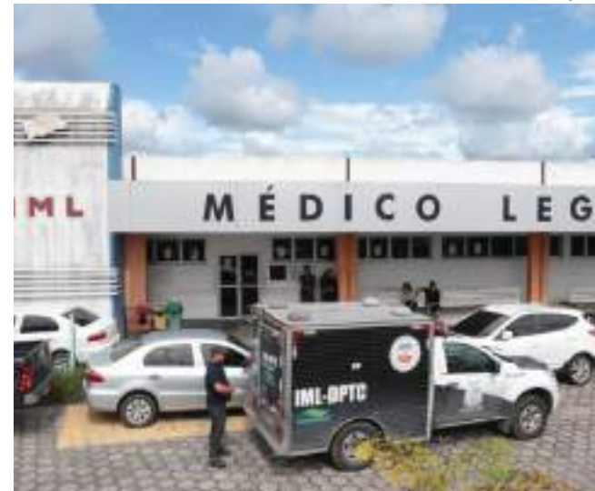
Homem estava desaparecido desde a madrugada de segunda-feira (19)