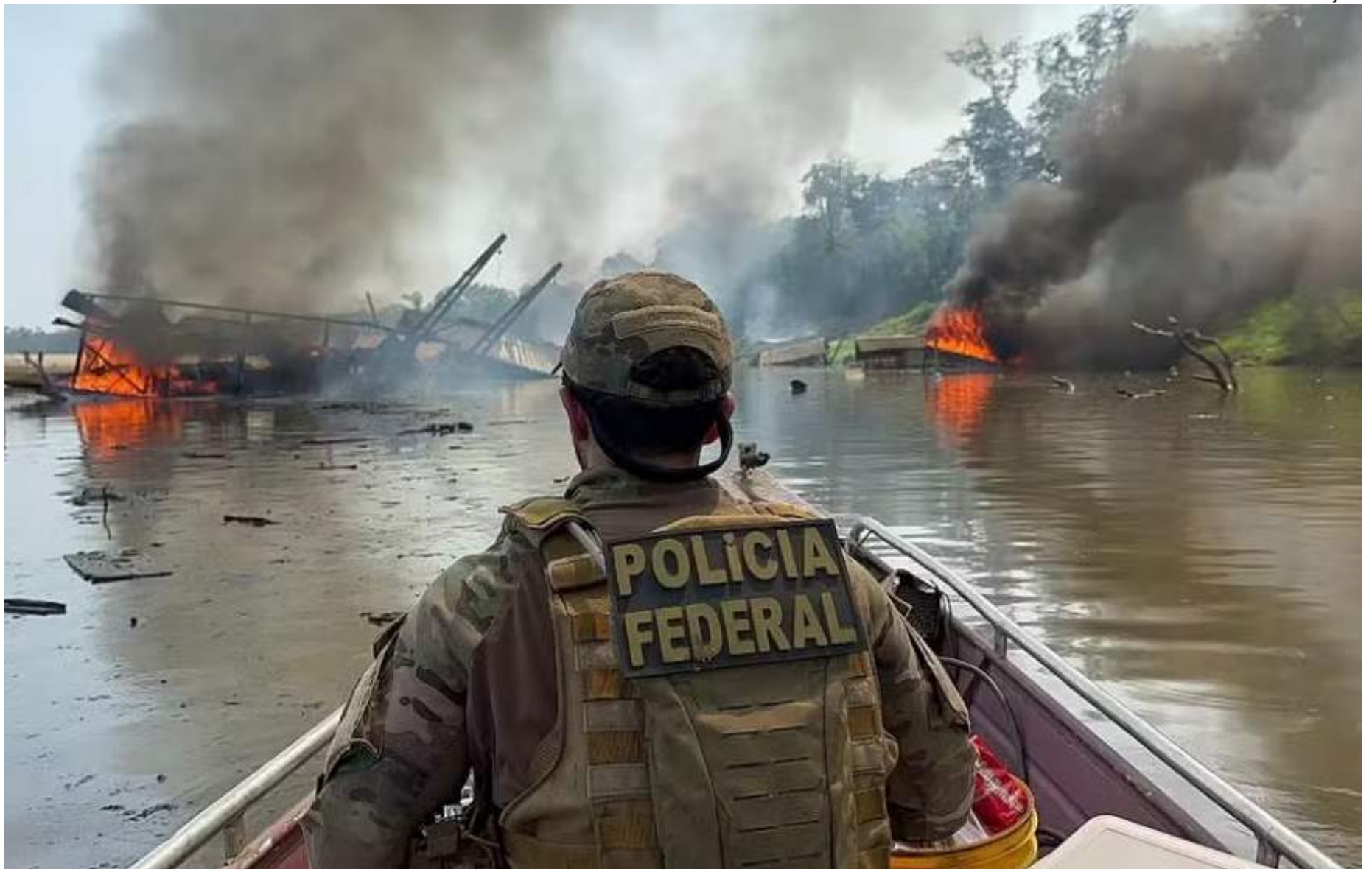
Policiais federais e servidores dos demais órgãos públicos seguirão percorrendo municípios do sul do Amazonas por prazo indeterminado

ridades, o ataque dos garimpeiros foi uma reação à deflagração, na segunda-feira (20), da chamada Operação Prensa, realizada conjuntamente pela PF, Instituto Brasileiro do Meio Ambiente e dos Recursos Naturais Renováveis (Ibama) e Fundação Nacional dos Povos Indígenas (Funai).